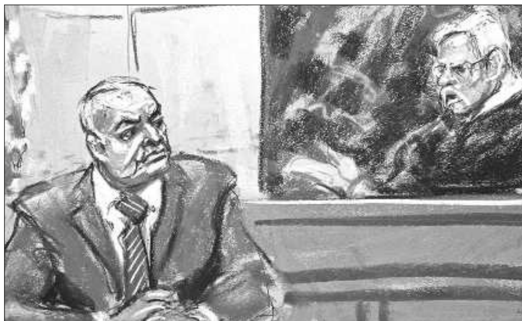
▲ Lo que estaba a juicio eran las maniobras del mexicano para introducir la cocaína y otras sustancias desde México; no en manos de quién quedaba toda esa mercancía.

En el proceso García Luna, la sentencia no es el final. Más de cuatro años de juicio, pero todavía es preciso detenerse y analizar qué se dijo, quién lo dijo, y sobre todo lo que no se dijo. Los silencios son también motivados por el interés, por algo que se intenta proteger. Habrá para quien la pena impuesta resulte insuficiente y que posiblemente en dos décadas, si es que le reducen la condena, alguien exigirá que se le juzgue en México, algo que la legislación actual permite, pero que a lo mucho conducirá a una prisión domiciliaria, por la edad que tendrá entonces el ex secretario calderonista. Faltaría ver si los intereses políticos de entonces serán proclives a promover la extradición y un nuevo juicio.