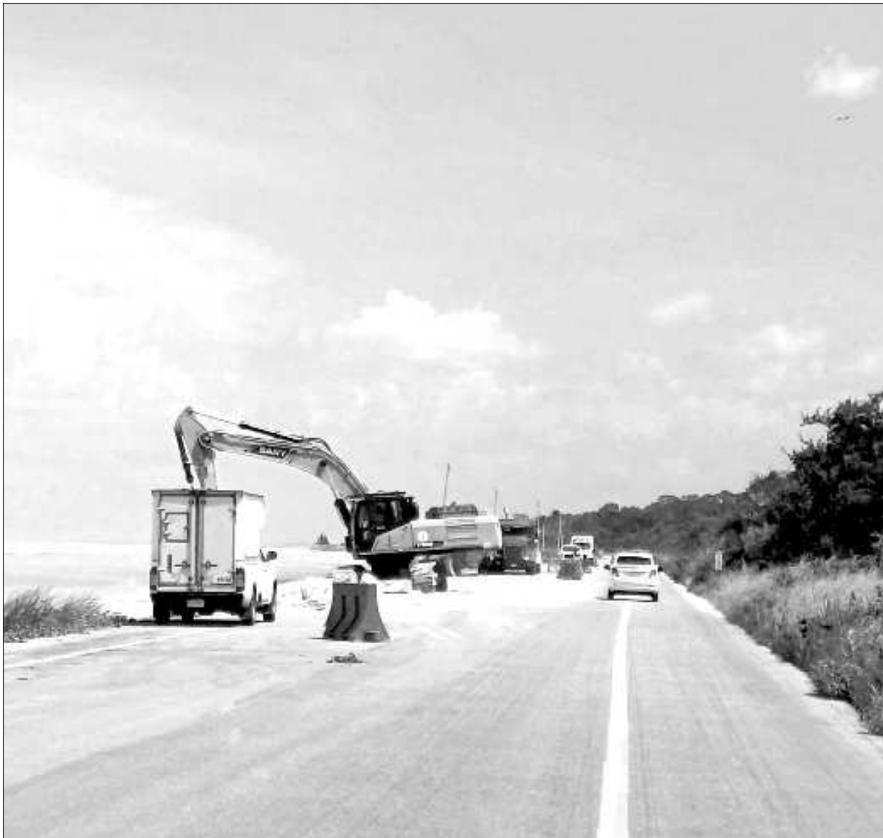
▲ Los trabajos -de carácter extraordinario- para el mantenimiento carretero dieron inicio a la altura de Nuevo Campechito, en la península de Atasta y en el kilómetro 107, en el municipio de Champotón.