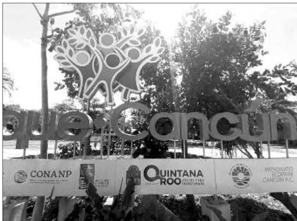
▲ Como parte de la ruta Top 5 se inauguró el Museo de los Desechos no Desechos, el paseo de México desconocido y el área de parkour, que se suma a los 15 jardines ya existentes en el Parque Cancún.

Actualmente suman 150 mil visitantes, que de mo-