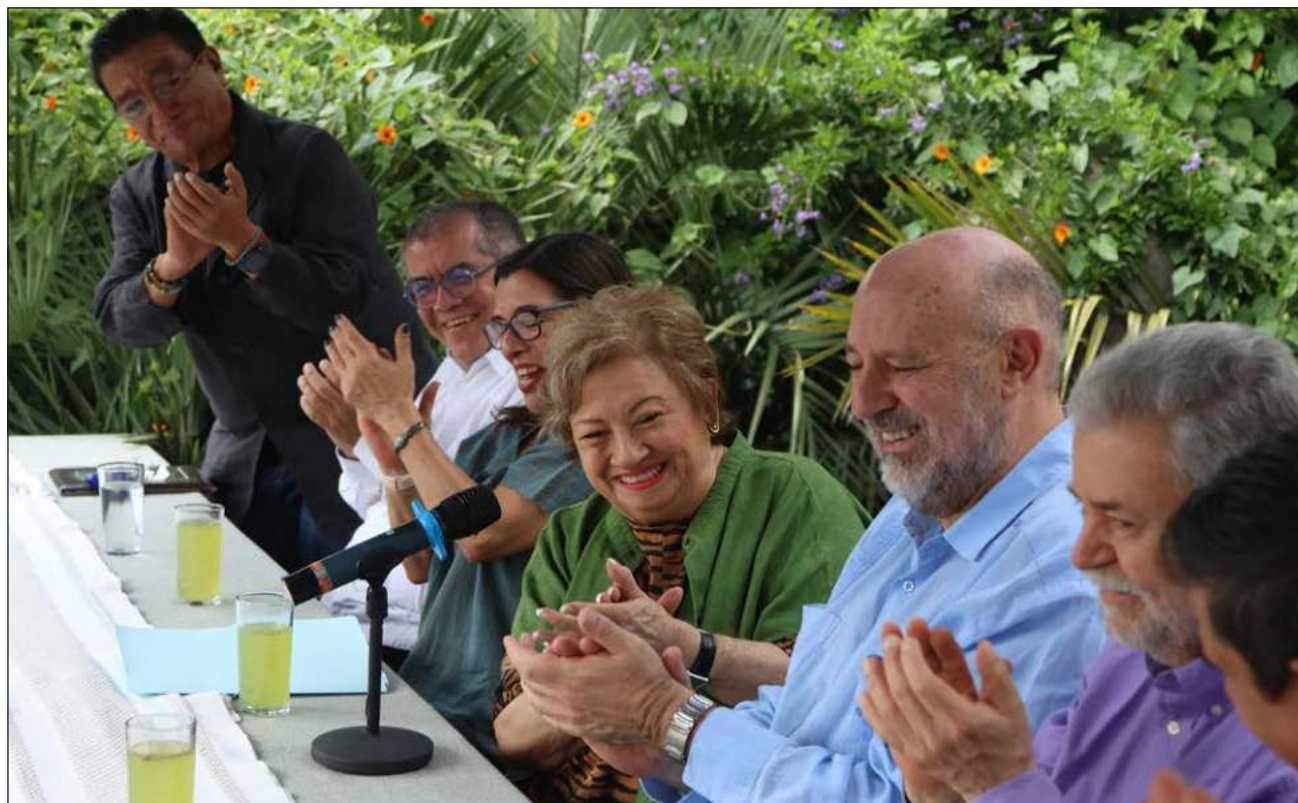
▲ El festejo por el aniversario reunió en Coyoacán a directivos, reporteros y fotógrafos, articulistas, administradores, editores, correctores y trabajadores de todas las áreas e invitados para celebrar estas cuatro décadas.

El Premio Nobel de Literatura no daba crédito al tamaño de ese temerario proyecto.