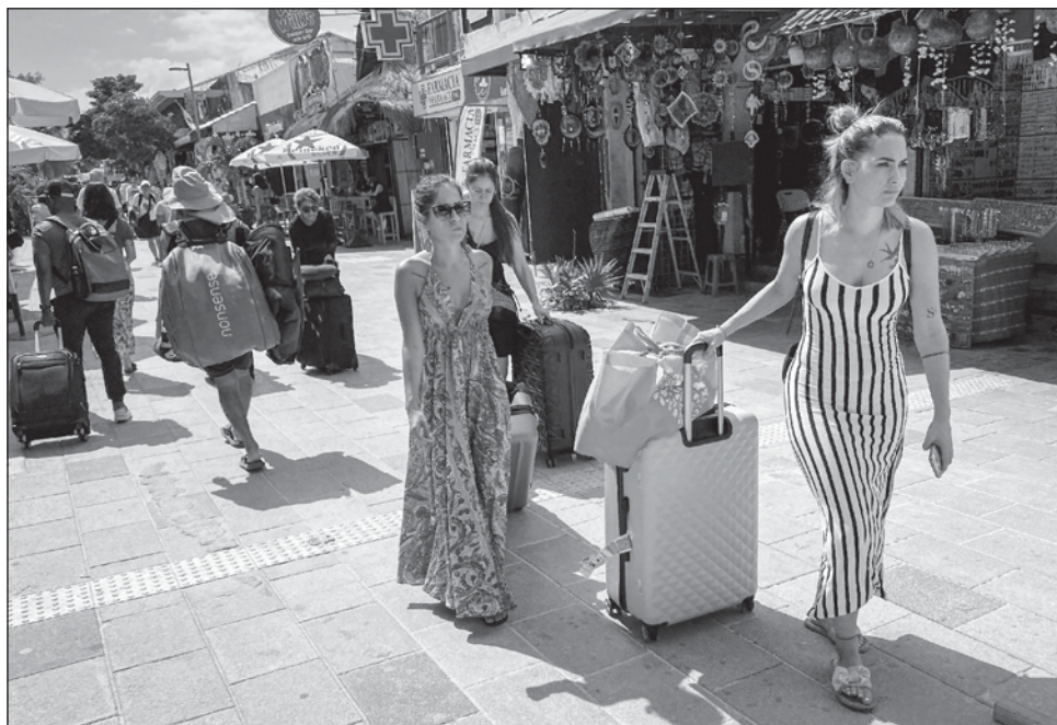
▲ De acuerdo con la dependencia, “el ingreso de divisas por concepto de turistas internacionales en los primeros siete meses del año fue de 18 mil 765 millones de dólares, lo que representó un alza de 6 por ciento comparado con el mismo periodo de 2023”.

“El ingreso de divisas por concepto de turistas internacionales en los primeros siete meses del año fue de 18 mil 765 millones de dólares, lo que representó un alza de 6 por ciento com-