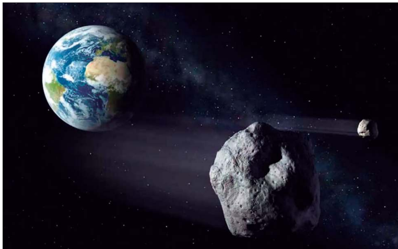
▲ Los investigadores especulan que el anillo podría haber proyectado una sombra sobre la Tierra, bloqueando la luz solar y contribuyendo a un importante evento de enfriamiento global conocido como Glaciación Andino-Sahariana.

Esta sorprendente hipótesis, publicada en Earth and Planetary Science Letters , se deriva de reconstrucciones tectónicas de placas para el período Ordovícico que señalan las posiciones de 21 cráteres de impacto de asteroides. Todos estos cráteres están ubicados a 30 grados del ecuador, a pesar de que más de 70 por ciento de la corteza continental de la Tierra está fuera de esta región, una anomalía que las teorías convencionales no pueden explicar.