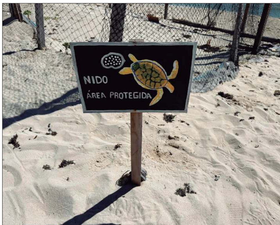
▲ El sector empresarial, principalmente hoteleros y restauranteros, tienen personal calificado sobre las acciones pertinentes en este periodo de anidación.

Indicó que las casas ubicadas a lo largo de las costas han contribuido en gran medida a la preservación.