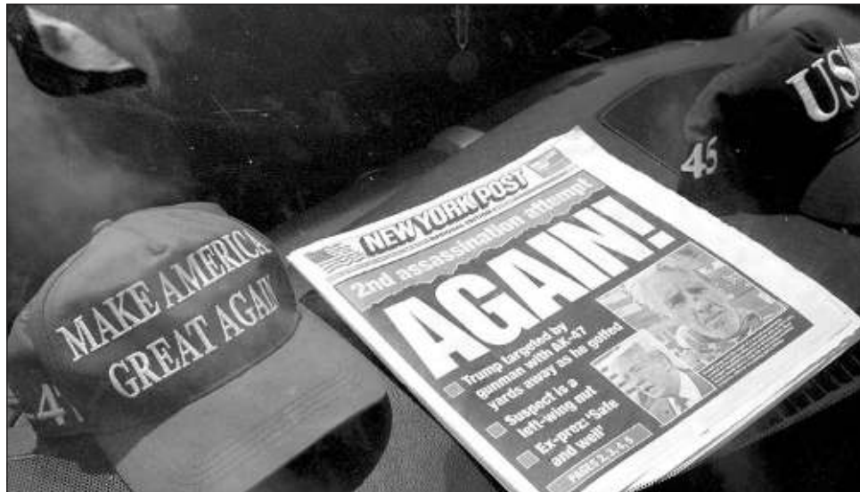
▲ El ex presidente Trump, de 78 años, se salvó de un primer intento de asesinato en julio, Joe Biden tiró la toalla y cedió la candidatura a su vicepresidenta Kamala Harris.

Los estadounidenses resuelven sus diferencias “pacíficamente en las urnas, no a punta de pistola”, recaló en Filadelfia, horas después de pedir “más ayuda” para el Servicio Secreto, la policía de élite encargada de la protección de las personalidades políticas.