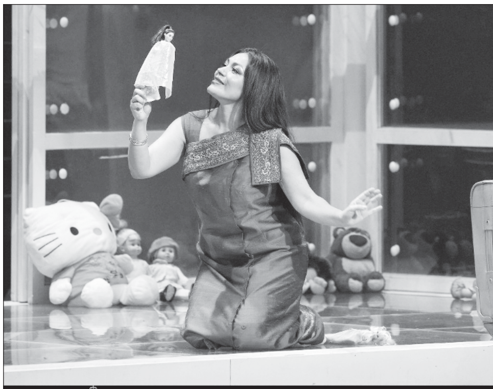
▲ Hoy día, la voz de Ailyn Pérez sorprende al mundo de la ópera por su textura, por su fuerza interpretativa, por su calidez emocional y por su virtuosismo técnico.