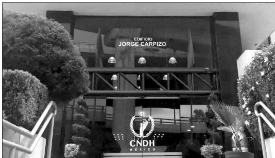
▲ La Comisión Nacional de Derechos Humanos apuntó a través de un comunicado que esas acciones “son argucias que siempre han utilizado y por eso su empeño en manipular a la CNDH y sumarla a sus cálculos”.

Ello equivaldría a dejar en manos del poder judicial el destino de la nueva legislación. “Son argucias que siempre han utilizado y por eso su empeño en manipular a la CNDH y sumarla a sus cálculos”,