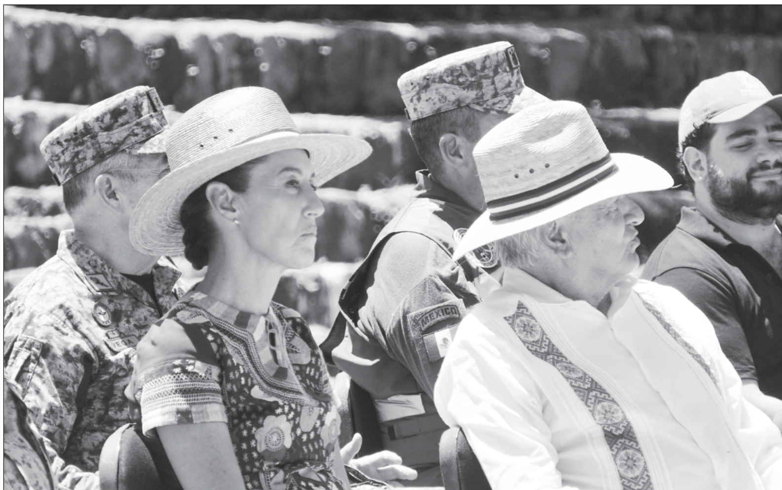
▲ “Dice la vox populi que parte del entrenamiento para llegar a altos niveles en política es saber aguantar vara y saber aplicar la vara. Así de a poco se irá escalando hasta llegar a altos niveles. Si bien este entrenamiento puede implicar corrupción e impunidad, lo importante era ‘guardar las formas’”.