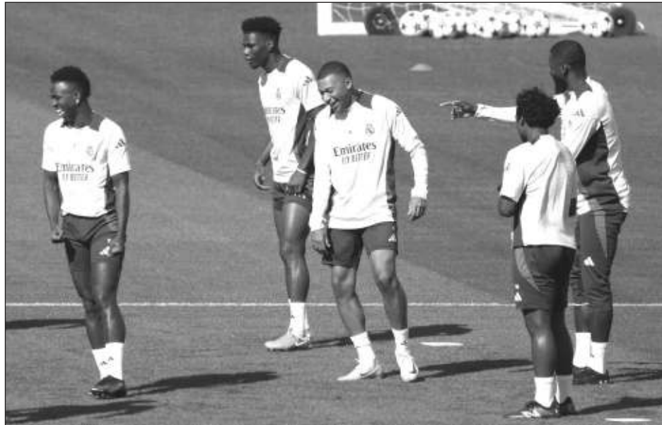
▲ Kylian Mbappé (centro), durante el entrenamiento del Real Madrid el lunes.

lendario de media semana para asegurar que su torneo más emblemático de clubes tenga tres noches seguidas de acción -seis partidos en cada una hasta el jueves.