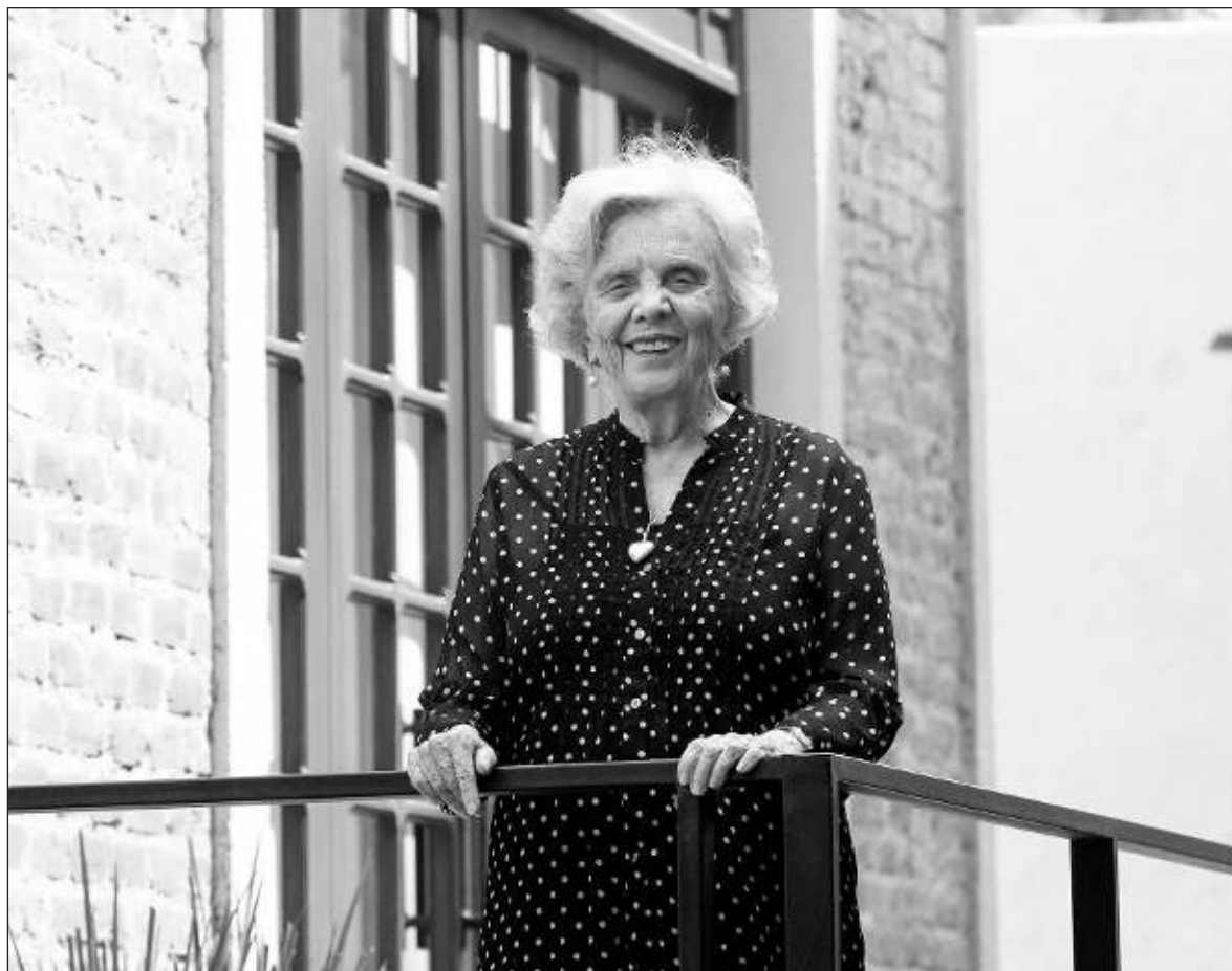
▲ “Hace tiempo, y aunque ahora esté muerta por la pandemia, los parroquianos de la capilla de San Sebastián Mártir tocaban a mi puerta y siempre les ofrecía un café en olor de santidad”.

—Sí, maestra, pero leí después que usted escribió: La emperatriz recibe el ramo de flores que le tenemos mi hermana y yo sin son-