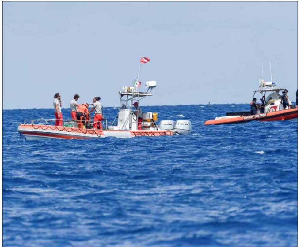
▲ El primer ministro Keir Starmer rechazó el plan del precedente gobierno británico de expulsar a migrantes al país africano de Ruanda. Por su parte, su homóloga italiana, la ultraderechista Giorgia Meloni, firmó en noviembre de 2023 un controvertido acuerdo con Albania que prevé la creación de dos centros para migrantes en esa nación.

Según el Ministerio del Interior italiano, las llegadas de migrantes por mar han disminuido considerablemente desde principios de año: 44 mil 675 entre el 1 de enero y el 13 de septiembre, frente a 125 mil 806 durante el mismo periodo de 2023.