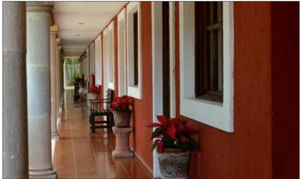
▲ Por años los empresarios hoteleros quisieron instalarse en las zonas donde operarán los Hoteles Tren Maya, cerca de las zonas arqueológicas de Edzná en la capital, y Calakmul, pero ahora la apuesta será el que se venda correctamente lo que se ofrece en las ciudades.

“Claro, teniendo esos hoteles es casi seguro que el turismo decida hospedarse directamente en ellos, quie-