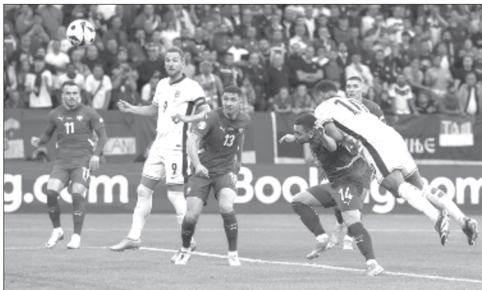
▲ Jude Bellingham anota el gol con el que Inglaterra se impuso a Serbia en Gelsenkirchen.

Con el número 10 en la camiseta que alguna vez lució Wayne Rooney, el versátil mediocampista se elevó para cabecear un centro de Bukayo Saka. Se plantó frente a la tribuna para hacer la pose firme con los brazos abiertos de par en par, una celebración que los hinchas del Madrid adoran