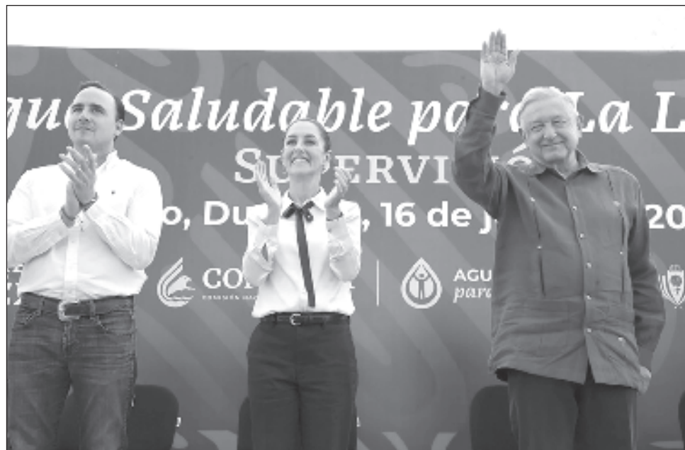
▲ En el segundo acto conjunto con López Obrador, la virtual presidenta electa consideró que este primer recorrido entre ambos es expresión del humanismo del movimiento.

Ante miles de laguneros que recibieron de manera