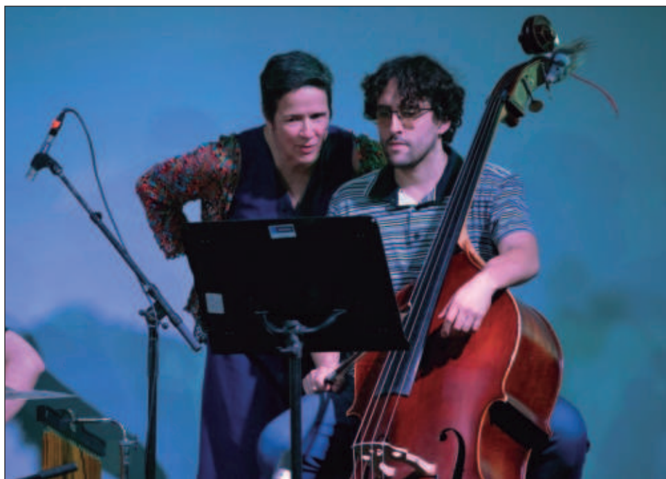
▲ El espectáculo Odonir y los ratones en concierto – basado en un cuento de Mercedes Gómez Benet– narra la historia de un director que maltrata y humilla a los músicos y cómo éstos son ayudados por un grupo de roedores que habitan en el teatro donde ensayan.

Mercedes Gómez hace estos comentarios a propósito del espectáculo Odonir y los ratones en concierto , basado en un cuento de su autoría (editorial Norma), en el que se narra la historia de un director malhumorado que maltrata y humilla a los músicos y cómo éstos son ayudados por un grupo de roedores que habitan en el teatro donde ensayan –que incluso tienen su propia orquesta, la Ratónica del Establo de México– para darle una lección al maestro.