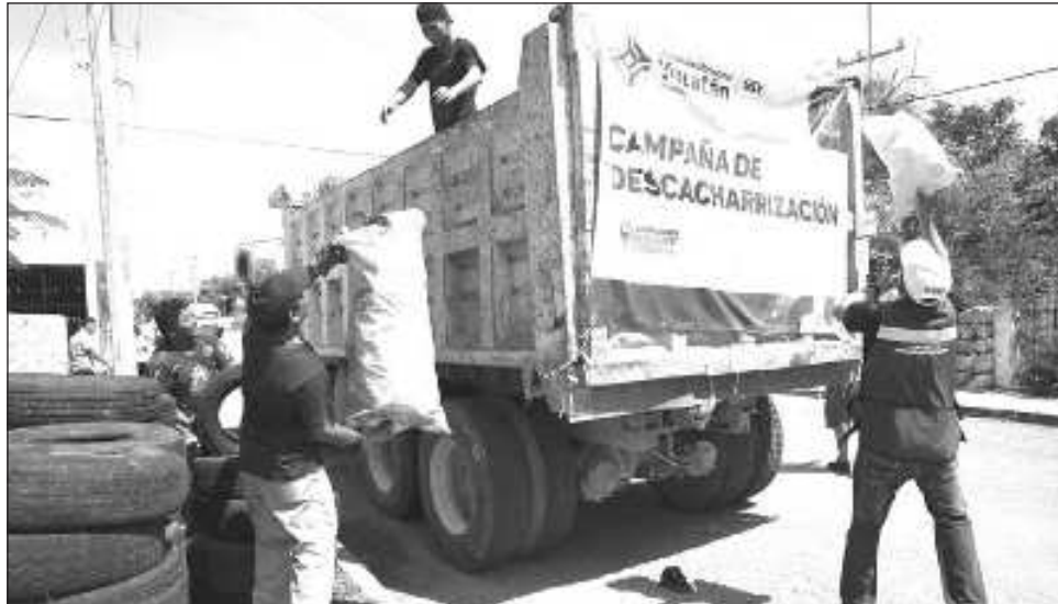
▲ La campaña comprende 263 colonias, 230 mil 720 viviendas, 44 comisarías y colonias aledañas a la periferia de la capital, con una cobertura de 11 mil 536 ha.

El titular de la Secretaría de Salud de Yucatán (SSY), Mauricio Sauri Vivas, hizo un llamado a la ciudadanía, para que eliminen los cacharros tales como: botellas, latas, llantas, cubetas, envases y diversos recipientes que son utilizados por los mos-