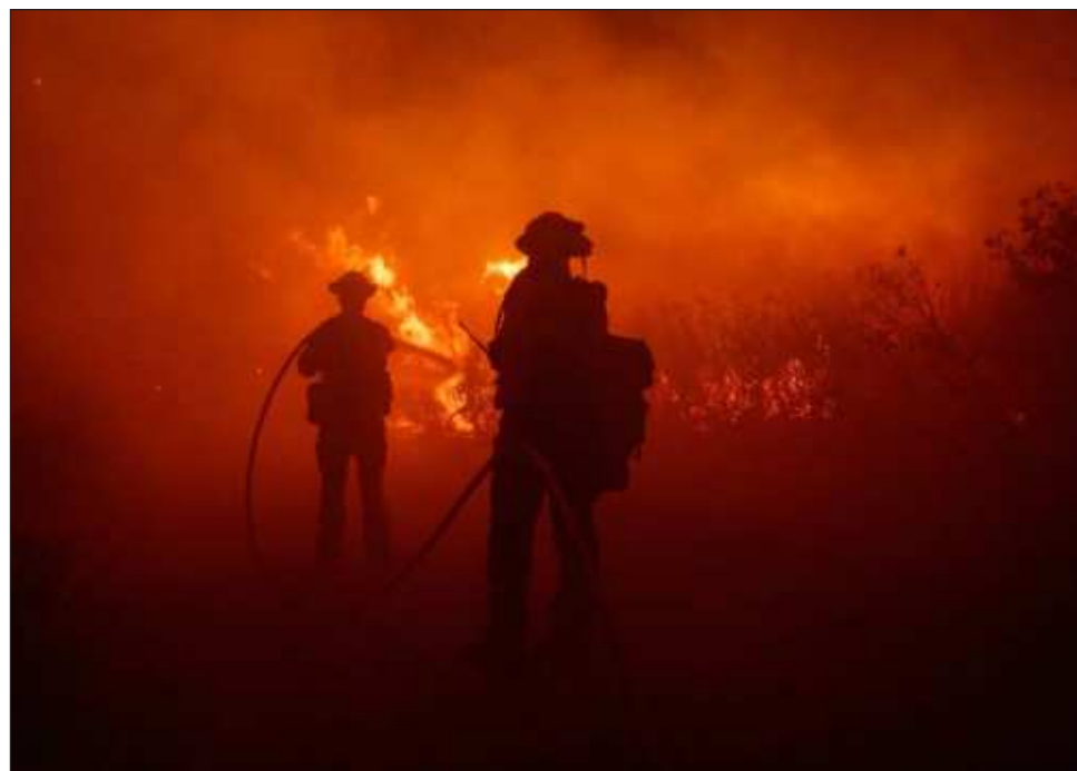
▲ El incendio, denominado Point Fire , estaba contenido apenas en un 2 por ciento. No se reportaron heridos. La causa aún estaba bajo investigación según las autoridades.

Los bomberos que trabajan en condiciones sofocantes y terreno empinado se apresuraron a apagar incendios secundarios que estallaron cuando vientos impredecibles arrojaron brasas, dijo Kenichi Haskett, jefe de sección del Departamento de Bomberos del condado Los Ángeles. Las