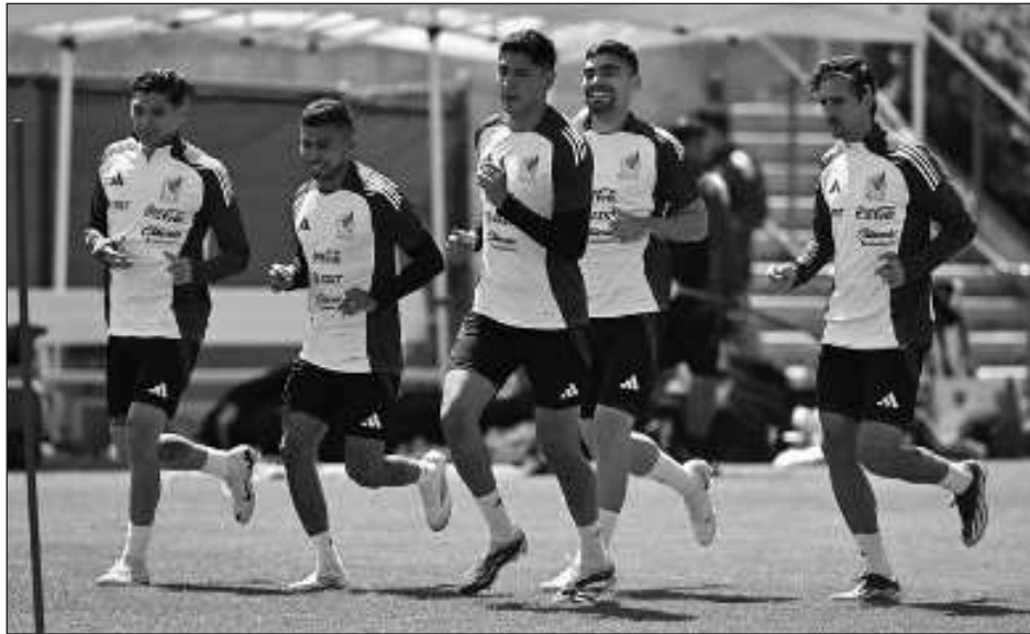
▲ El “Tri” se estrena este fin de semana en la Copa América ante Jamaica.

El ciclo que inaugura la Copa América (20 de junio-14 de julio) tuvo un inesperado preámbulo con el aterrizaje de Lionel Messi en el Inter Miami un año atrás.