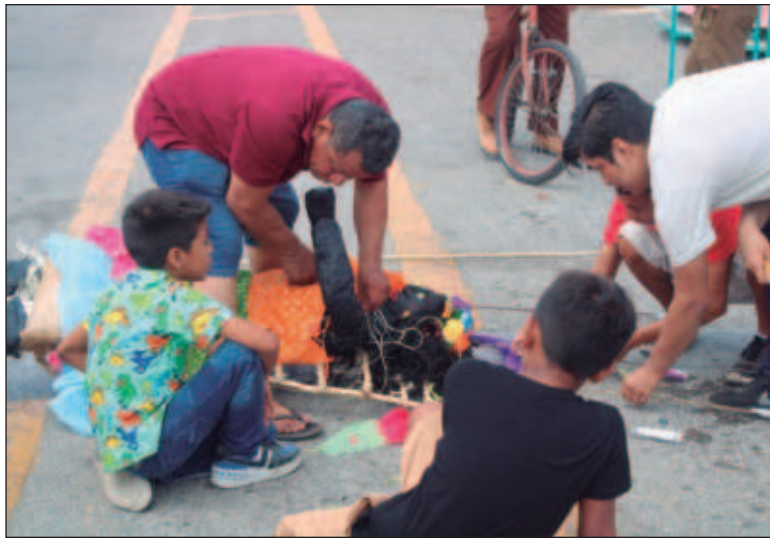
▲ La figura de la Boxita se rellena con petardos y otros explosivos para que pueda ser quemada frente a la iglesia.

Esta muñeca se quema el domingo posterior al jueves de Corpus Christi para alejar los malos aíres y las desgracias del pueblo. Para realizar su quema se lleva a cabo una serie de rituales organizados por la familia Chay, quienes por al menos cuatro generaciones han asumido la responsabilidad de seguir con la tradición. El sábado al medio día la Boxita es paseada por las calles de Hunucmá y acude a visitar a sus madrinas , mujeres que donaron los materiales para la realización de la figura y quienes la velarán todo el día antes de ser presentada en la iglesia del pueblo. Ese mismo sábado a las 8 de la noche los jaraneros o bailarines se reúnen en la casa de la última madrina que recibió a la Boxita para llevarla entre música de charanga, cohetes y baile hasta la iglesia principal. Este "paseo" de la Boxita