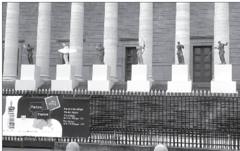
▲ La Asamblea Nacional francesa expone esculturas de la Venus de Milo practicando deportes olímpicos. La justa será inaugurada en París el 26 de julio.

La seguridad y la transportación son los asuntos que más preocupan al acercarse