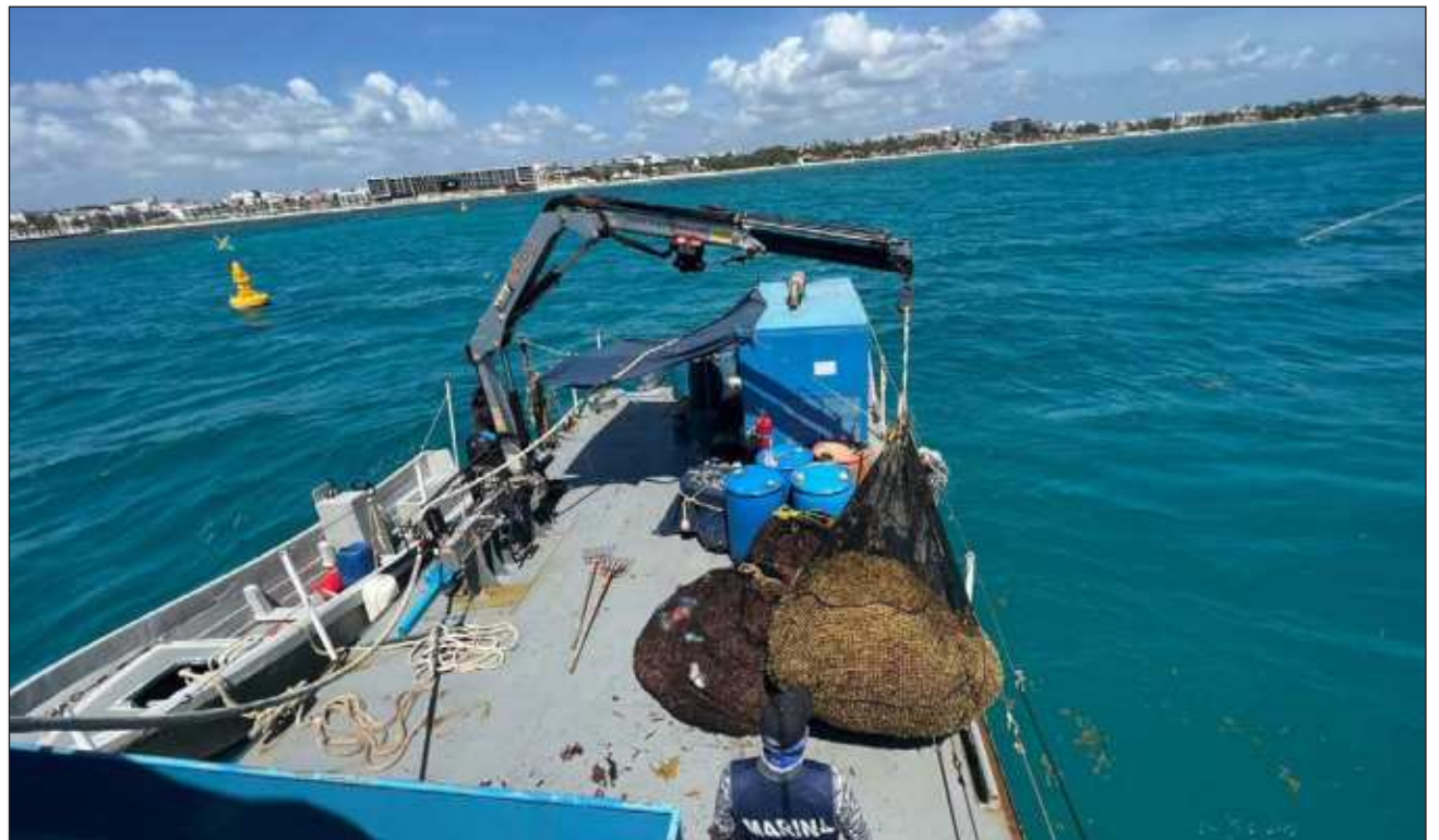
▲ Para realizar las labores de contención y recolecta se utilizan cuatro barredoras y tractores, 22 embarcaciones menores, 11 buques sargaceros costeros y un buque sargacero oceánico; los marinos colocarán ocho mil 650 metros de barrera.

Cabe destacar que el semáforo de la Red de Monito-