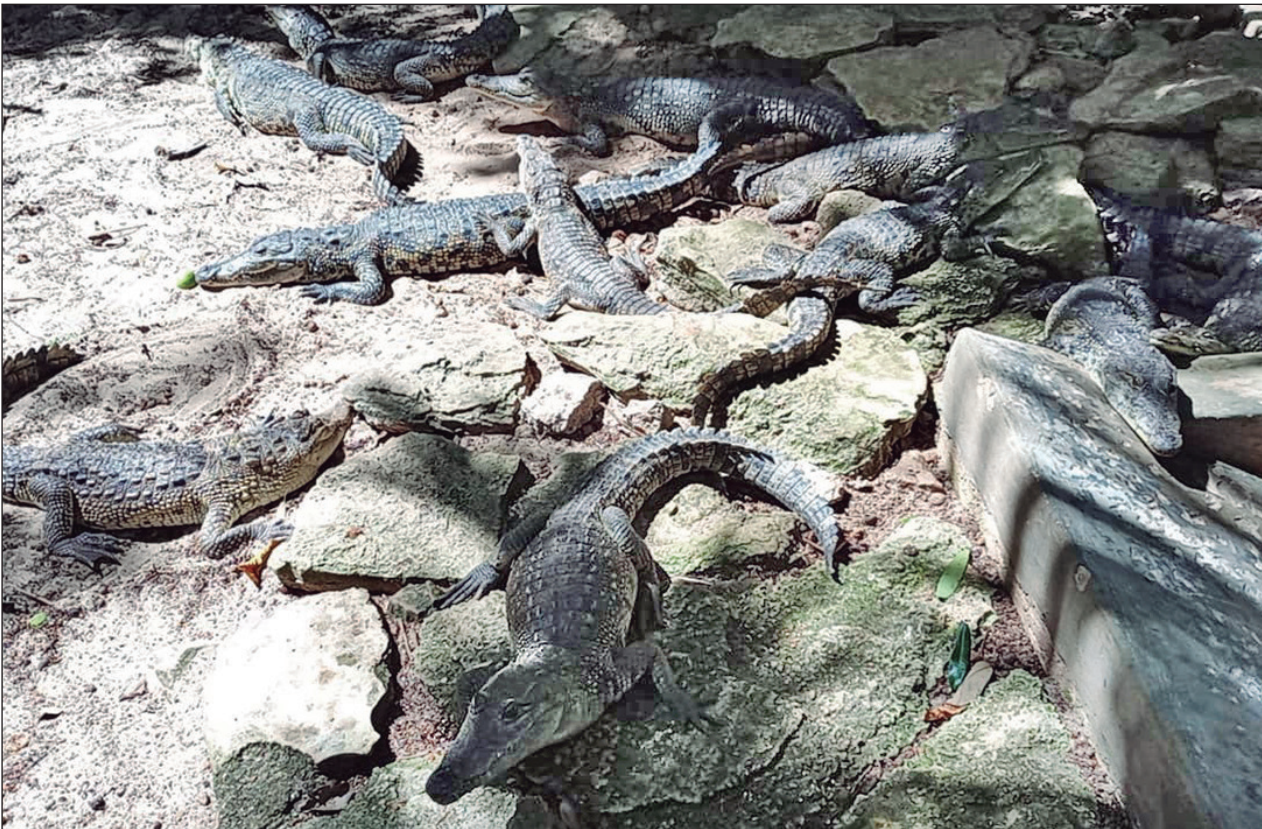
▲ Hay 256 ejemplares al interior del lugar, informó el médico veterinario, Óscar González.