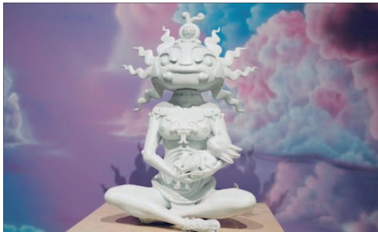
▲ En imagen, una de las esculturas del artista oaxaqueño Sabino Guisu que integran la muestra Axolotl Creation .

Sabino Guisu recordó que el proyecto empezó con una pareja de ajolotes, con la narrativa de que existe un universo paralelo donde