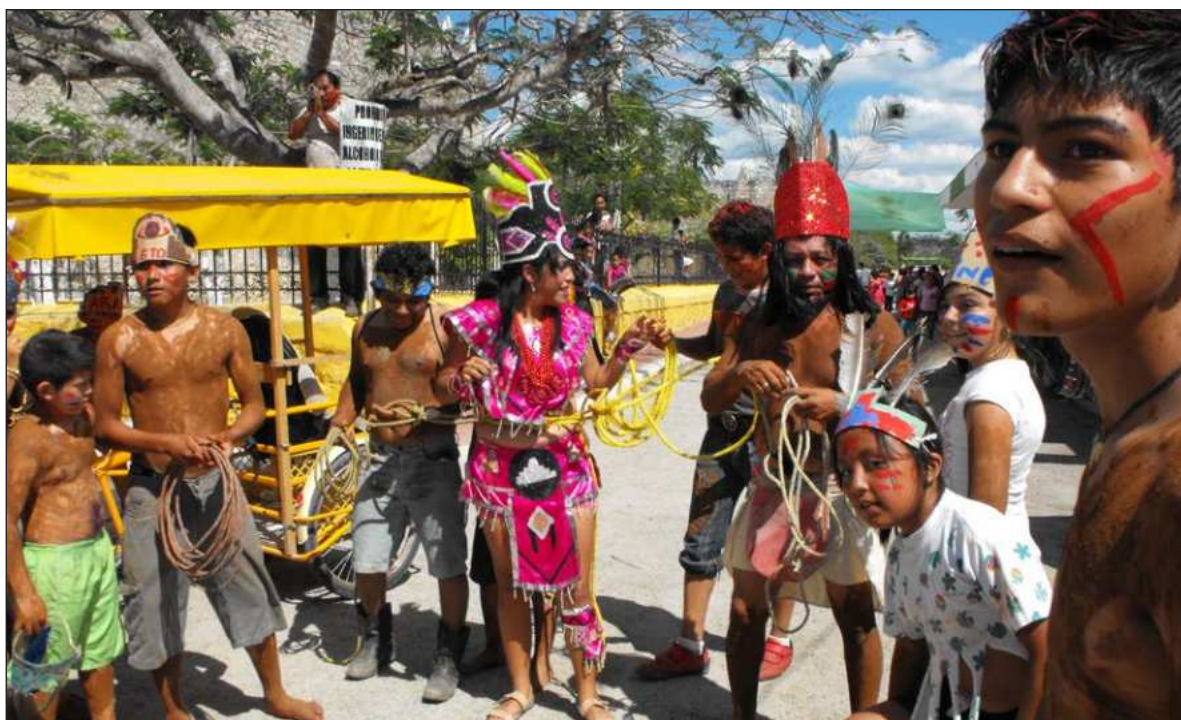
▲ “Los ‘chikes’ del pueblo de Ixil, ubicado a 28 kilómetros al noreste de la ciudad de Mérida, aparecen una vez al año, exclusivamente el martes de carnaval, y durante unas horas ‘imponen su ley’ en el pueblo”.

LOS “CHIKES” DEL pueblo de Ixil, ubicado a 28 kilómetros al noreste