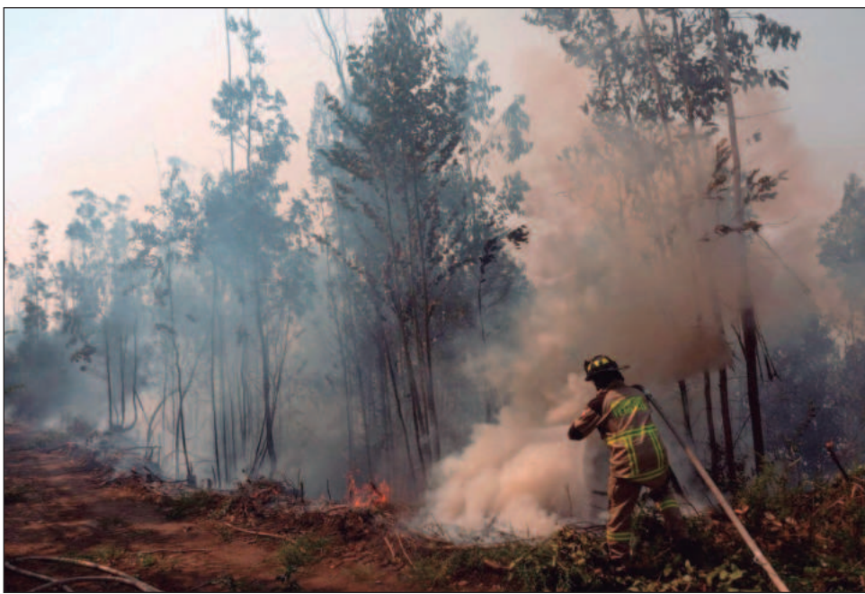
▲ El incendio Alto Llco ya consumió más de 380 hectáreas, destruido al menos tres viviendas y provocado dos heridos y evacuaciones masivas en la comuna de Vichuquén.

El Servicio Meteorológico de Chile advirtió el lunes que se prevén temperaturas extremas en las regiones de Coquimbo, Valparaíso y Metropolitana durante los próximos dos días. Ante esta situación, el presidente de Chile, Gabriel Boric, publicó un mensaje en sus redes sociales en el que llamó a la población a evitar el uso de maquinaria que genere chispas y a no encender fogatas en zonas rurales o forestales.