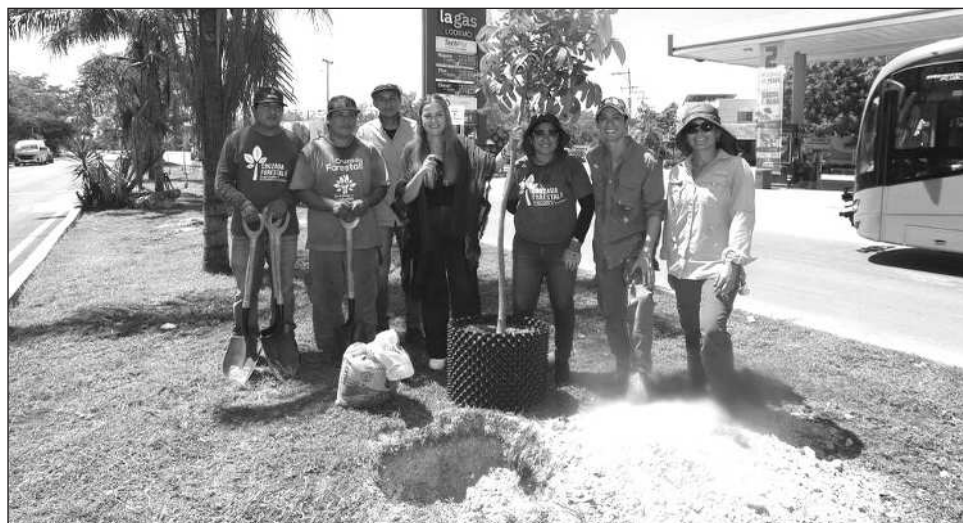
▲ La actualización del documento municipal se centra en hacer de la ciudad un entorno más biodiverso, resiliente y sostenible mediante soluciones basadas en la naturaleza.

En su acostumbrada reunión semanal con representantes de los medios de