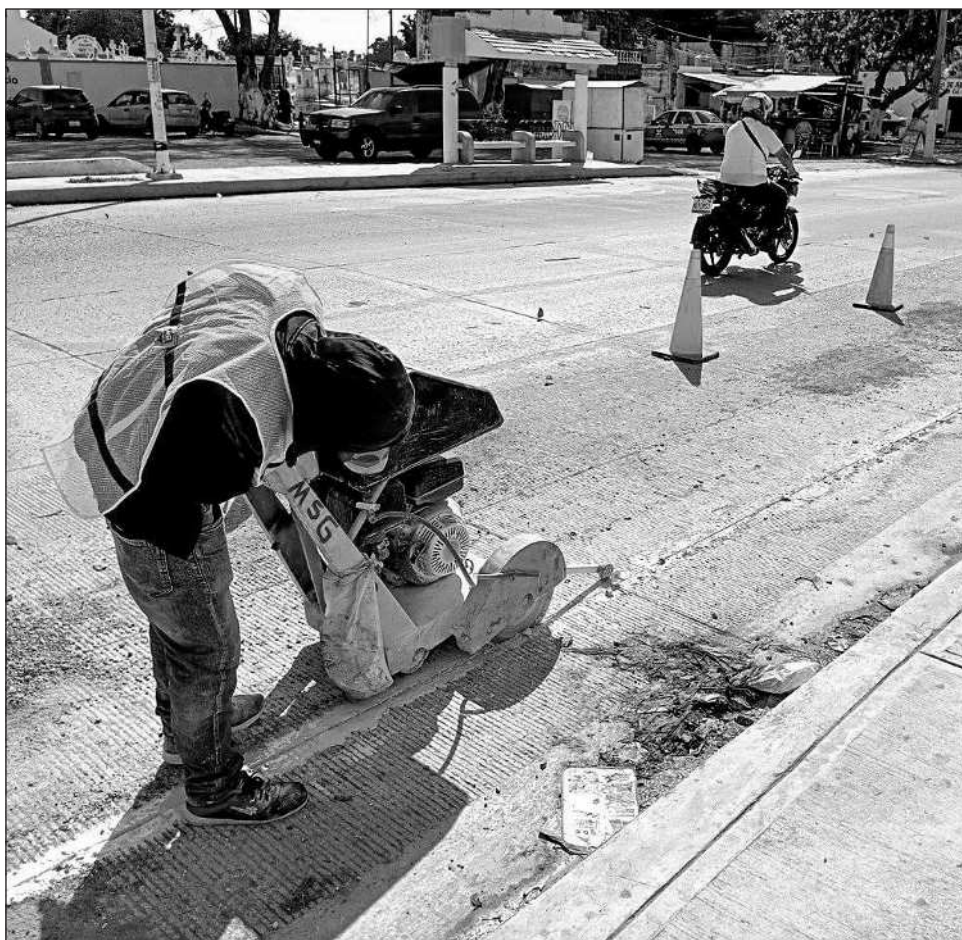
▲ De acuerdo con la OCDE, el desempleo entre los países que la integran cerró 2025 en un promedio de 5 por ciento, nivel relativamente estable desde abril de 2022.

En Estados Unidos la tasa de desempleo general fue de 4.4 por ciento y la de jóvenes de 10.45 por ciento, mientras en Canadá éstas alcanzaron 6.8 y 13.3 por ciento.