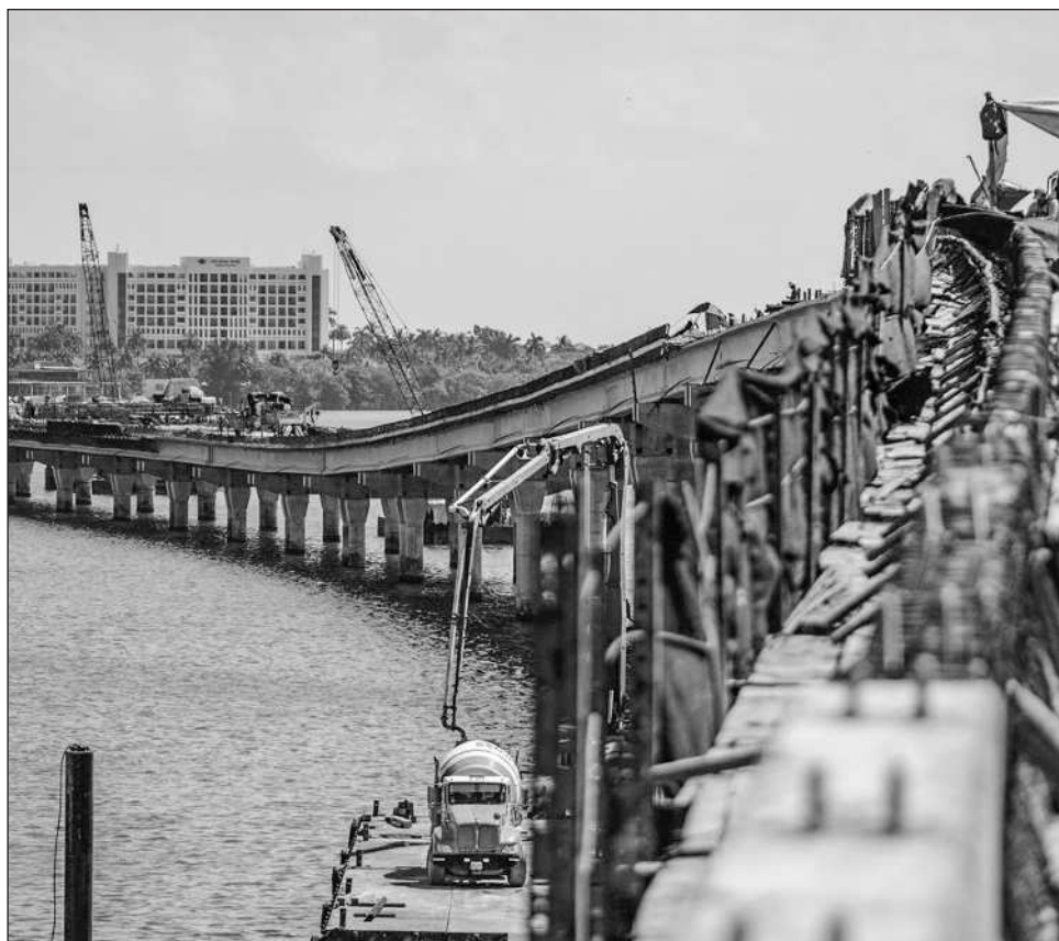
▲ Durante una visita al puente para constatar los avances, la gobernadora afirmó que la obra permitirá bajar tiempos de traslado para miles de trabajadores del sector hotelero.

El puente Nichupté conectará la ciudad con la zona hotelera a través de la laguna, convirtiéndose en una vía alterna estratégica para desahogar el tránsito y reforzar la infraestructura.