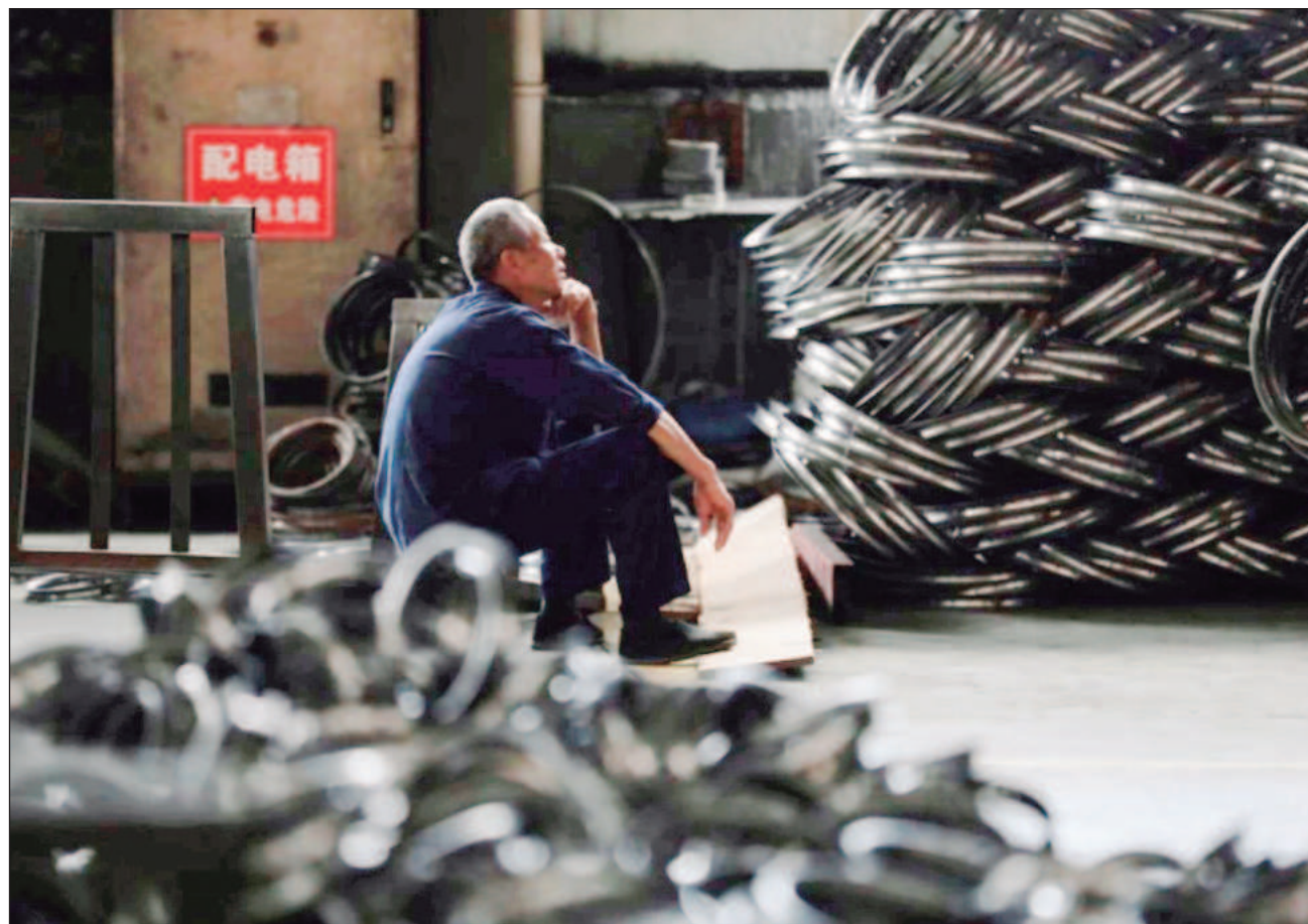
▲ La investigación de la Secretaría de Economía incluye periodos específicos de análisis de precios y daño a la industria mexicana, aunque la resolución no detalla aún las cuotas provisionales o definitivas.

A diferencia de investigaciones previas contra China, esta incluye aceros de grado herramienta, de alta resistencia y para porcelanizar. Quedan fuera los espesores igua-