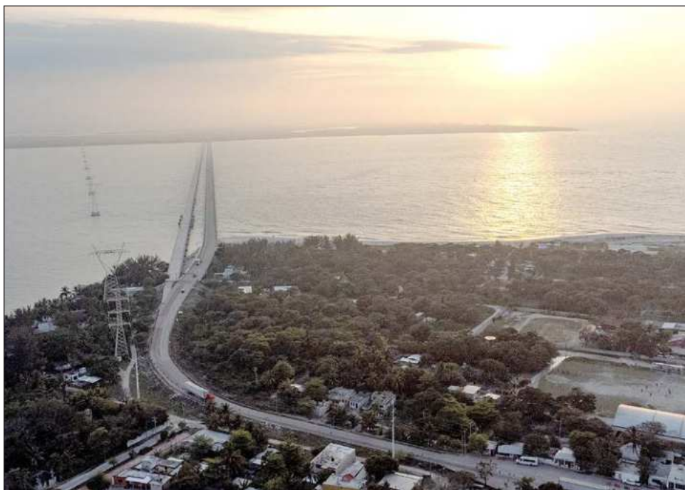
▲ En 2018, una de estas torres fue derribada por los vientos, causando daños a la economía y afectando a la población durante varios días, de allí deriva la preocupación entre los habitantes.

La corrosión y la erosión de las playas, pone en alerta la posibilidad que de una vez mas, alguna de las torres de conducción de energía eléctrica, pueda colapsar.