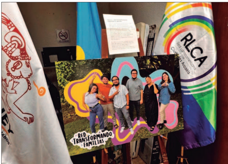
▲ El proyecto, impulsado por Kanan DDHH y el Colectivo Familias que acompañan, se desarrolló en los municipios de Mérida, Progreso y Valladolid, con acciones comunitarias.

Se estima un impacto en más de 100 personas beneficiarias indirectas, quienes recibirán acompañamiento, orientación o información a través de las redes fortalecidas.