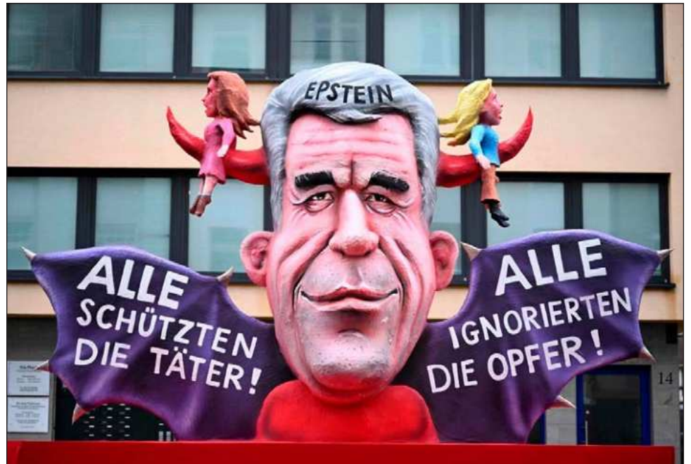
▲ Aunque la divulgación de millones de documentos fue posible tras la aprobación de una ley de transparencia en Estados Unidos, alertaron que la investigación sigue siendo limitada.

Aunque la divulgación de millones de documentos fue posible tras la aprobación de una ley de transparencia en Estados Unidos, alertaron que la investigación sigue siendo