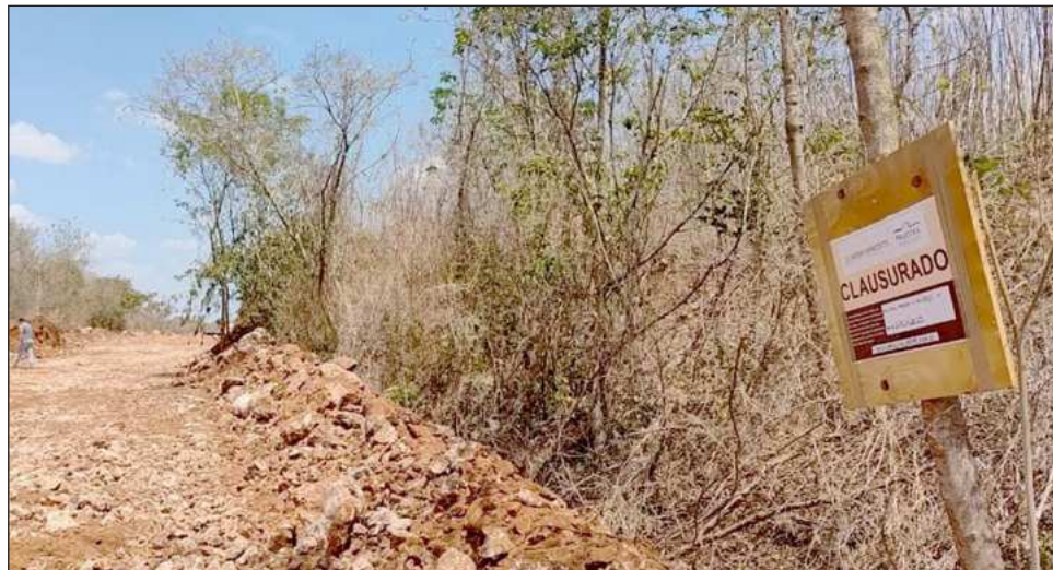
▲ Los operativos realizados por Profepa y el ayuntamiento, además de frenar el daño también son un aviso para que quienes tienen intereses dentro de la reserva cumplan con la normativa.

Desde el Centro Cultural Olimpo la alcaldesa dijo que se han realizado operativos con la Profepa para clausurar, cuando ha sido necesario, las actividades