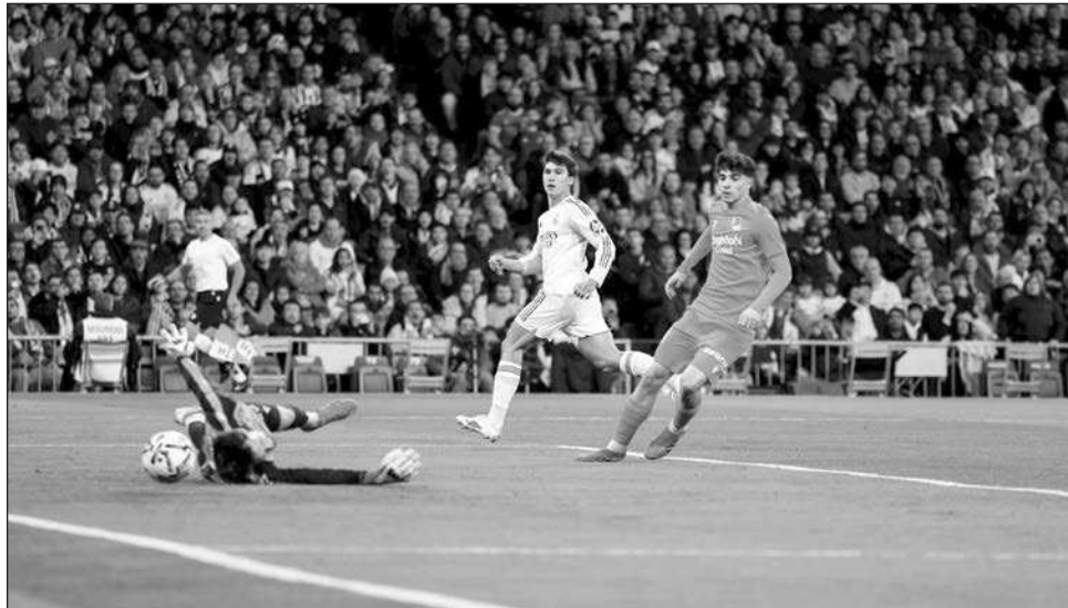
▲ El conjunto merengue se topa de nuevo con el Benfica de Mourinho.

Benfica marcó el gol que necesitaba para clasificarse gracias a un cabezazo de último minuto del portero Anatoliy Trubin ante el Madrid, lo que le permitió