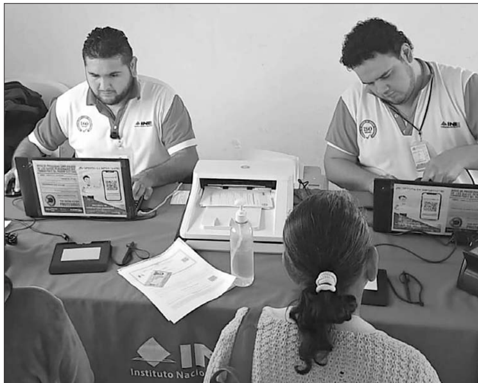
▲ Hoy martes 17 de febrero cerrarán los módulos, reanudando el servicio el miércoles.

El funcionario electoral, comentó que para el desa-