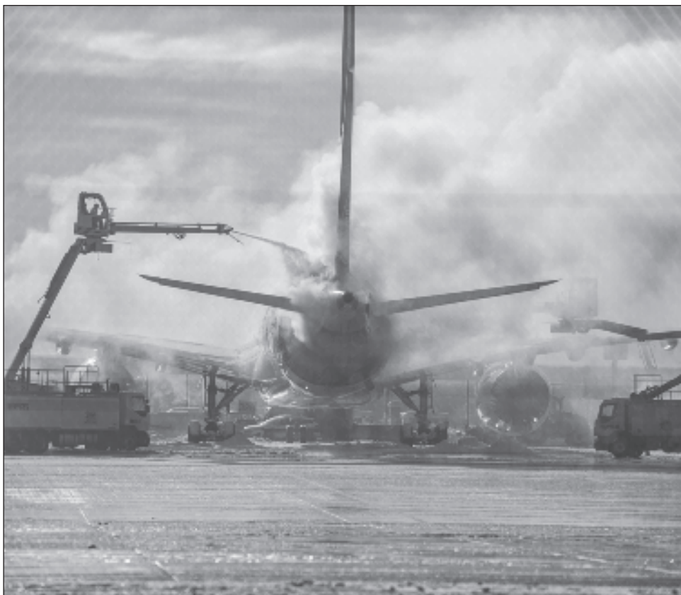
▲ La aerolínea Lufthansa, que es la mayor del país, ha comunicado la posibilidad de que se cancelen o retrasen sus vuelos en ambos aeropuertos durante las dos próximas jornadas.

La agencia estatal de meteorología alemana Deutscher Wetterdienst ha activado alertas de riesgo alto y muy alto en el centro y sur del país por la llegada de un temporal que podría dejar fuertes nevadas, con la acumulación de hasta 35 centímetros en zonas como Fráncfort, y la formación de placas de hielo durante los dos próximos días.