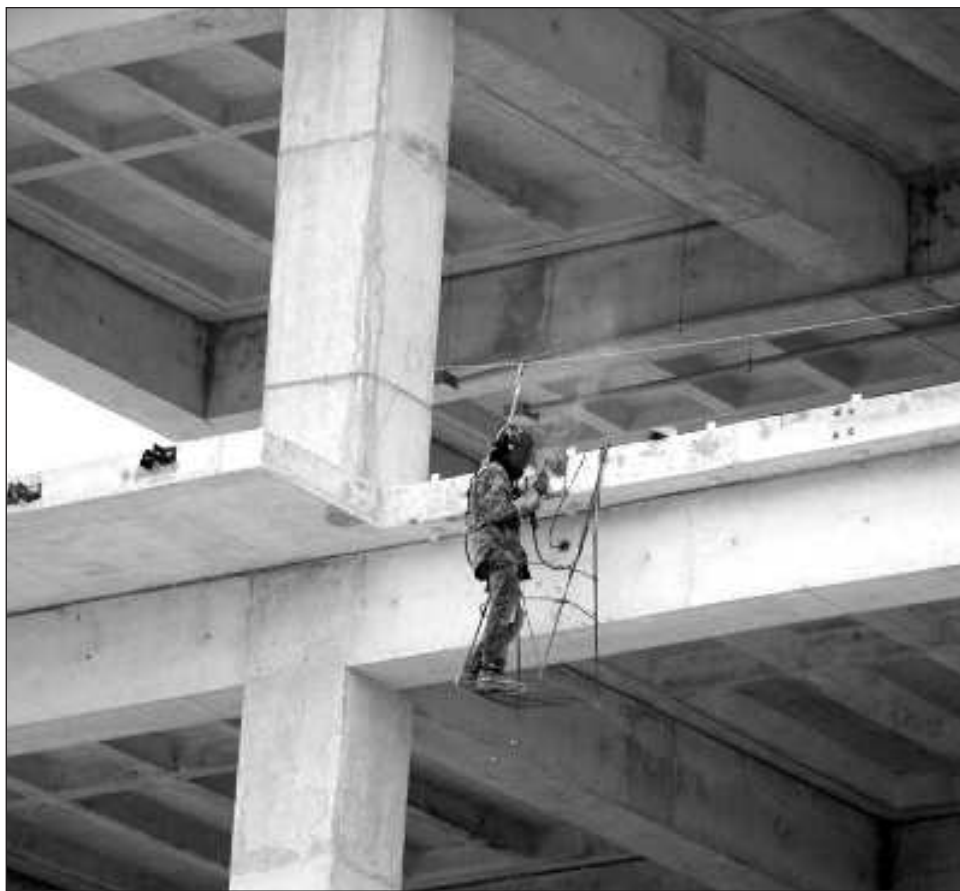
▲ La entidad recibirá de la Federación un presupuesto de más de 200 mil mdp.

En el Gasto de Inversión (principalmente infraestructura) para el 2024 Yucatán está entre las tres primeras con mayor presupuesto: 129 mil 956 millones de pesos, sólo detrás de Tabasco con 153 mil 833 millones y la Ciudad de México con 300 mil 257 millones de pesos. Dichas entidades concentran 52.5 por ciento del total en el país. Campeche alcanza el cuarto lugar con un presupuesto de 66 mil 898 mdp, mientras que Quintana Roo está en el lugar 26 con 5 mil 62 mdp.