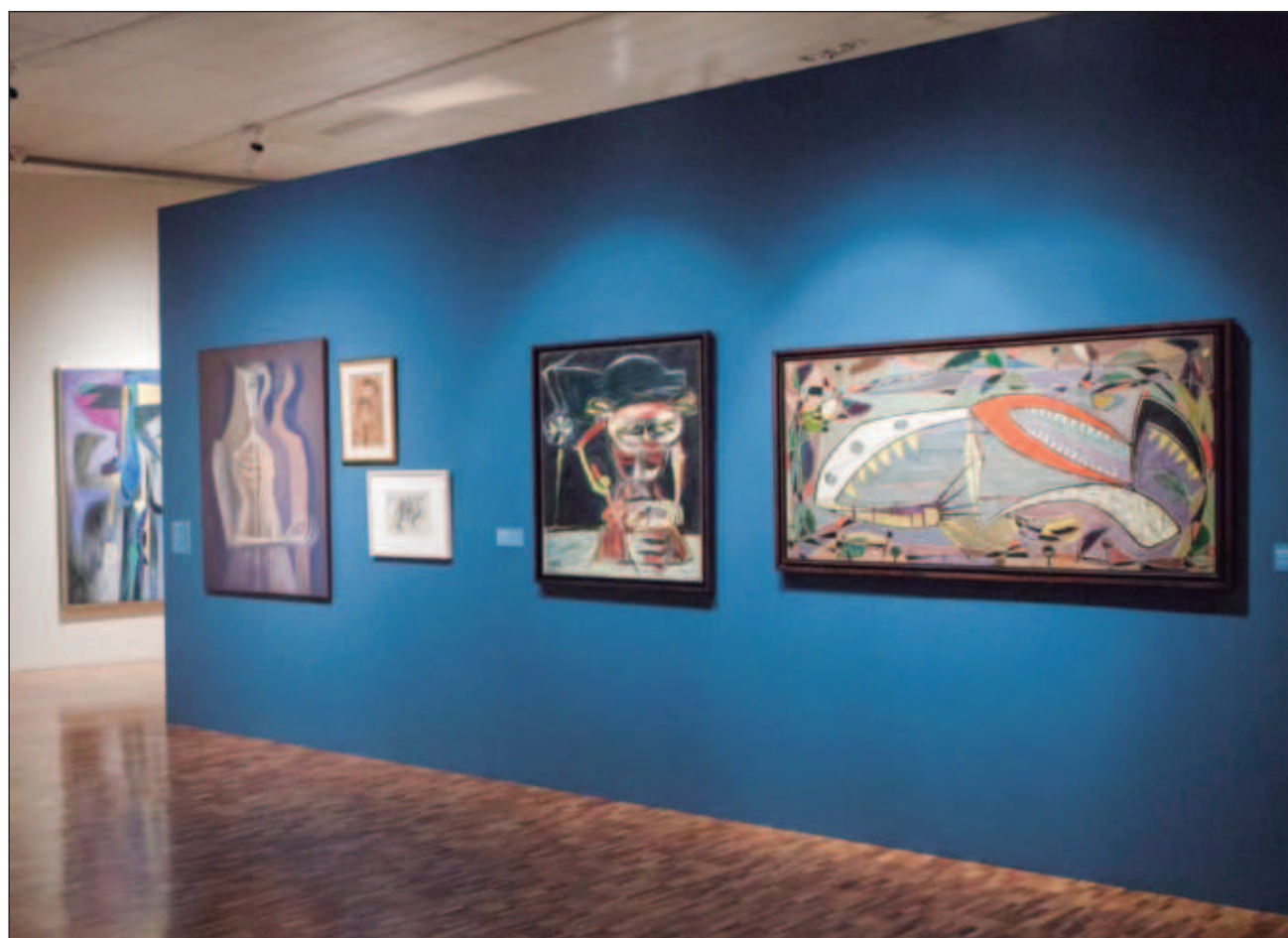
▲ La muestra Oswaldo Vigas: Mirar hacia adentro reúne obras de culturas africanas y sudamericanas, así como alrededor de 110 piezas de 27 artistas pertenecientes al acervo del MAM y de colecciones de instituciones públicas y privadas.

El Museo de Arte Moderno (MAM) alberga la primera exposición individual de Vigas en el país, que con la curaduría de Carlos Palacios explora las influencias que tuvo el artista y el diálogo que se genera con otros creadores venezolanos, latinoamericanos y europeos de su época.