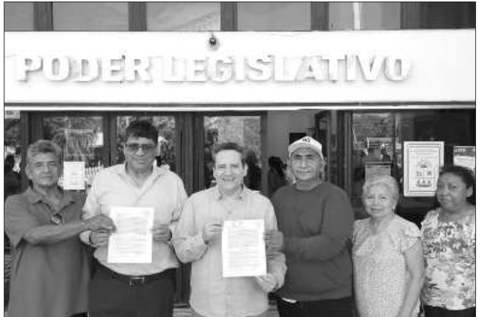
▲ La propuesta "Compromiso ciudadano por una tarifa justa de agua potable en Quintana Roo" fue presentada ayer por el Iapqroo ante el Congreso del Estado.

La iniciativa propone la reforma de los artículos 22, 25, 39, 41, 42, 44, 45, 46, 46 BIS y 47, así como la derogación del artículo 24 y el párrafo segundo del artículo 7, todos ellos de la Ley de Cuotas y Tarifas para los Servicios Públicos de Agua Potable y Alcantarillado, Tratamiento y Disposición de Aguas Residuales del Estado de Quintana Roo. Asimismo, se propone reformar el primer párrafo del ar-