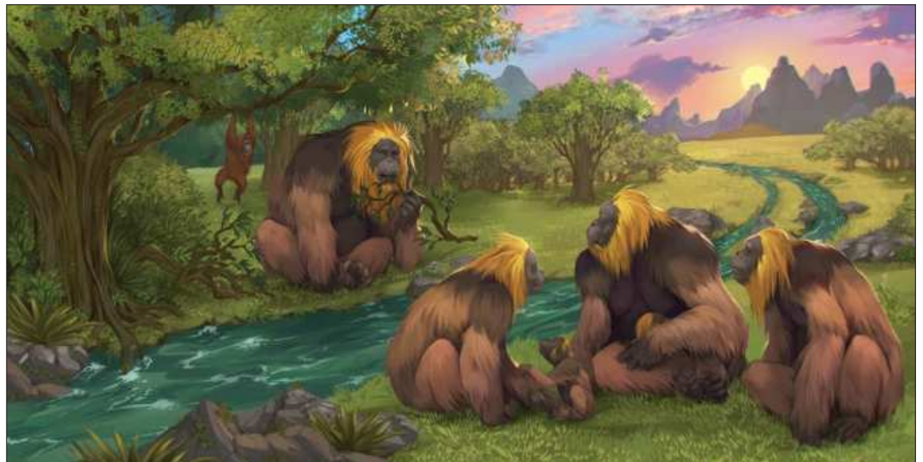
▲ Ajxaak'alo'obe' tu yilo'ob ba'alchee', ch'éej ma'ili' k'uchuk wiinik tak tu'ux kaja'an ka'achij. Boonil Ap

U k'ajla'ayil wa u yojéelta'al bix yanik u ch'i'ibalil ba'alchee', bala'an ti'al máako'ob meyajtik páaleontolojyáa, tumen ku tukulta'ale', bix úuchik u ch'éej juntúul mu'uk'a'an ba'alache' ka'alikil uláak'o'obe' jach tu beel úuchik u kaniko'ob kuxtal. Ma' ojéela'an