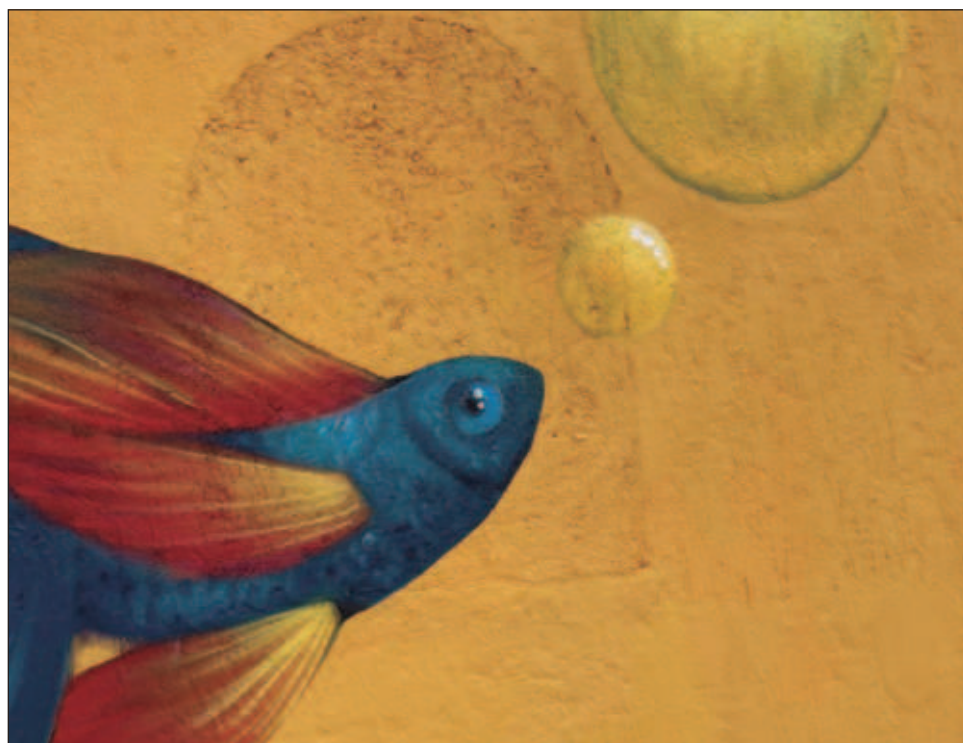
▲ Bruna Vega lleva casi un año de haber incursionado en el mundo del graffiti.

La artista recomendó a las jóvenes que quieran incursionar en el mundo del graffiti a creer en su instinto y creer siempre en tu poten-