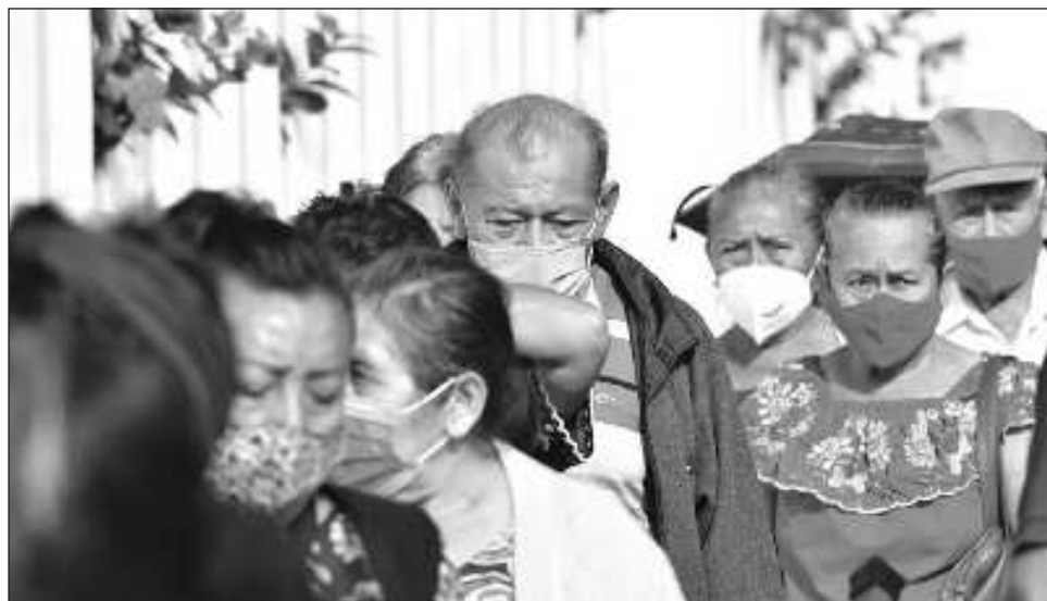
▲ AMLO defendió la estrategia de vacunación de su gobierno, que usa el biológico de Abdala, hecho en Cuba, y el de Sputnik, de Rusia, aunque no están avalados por la OMS.

Sus declaraciones se producen pese a que 12 unidades médicas están en alerta roja por tener un 70 por ciento o más de ocupación de camas generales, según el último reporte de la Red IRAG (Infección Respiratoria Aguda Grave) de