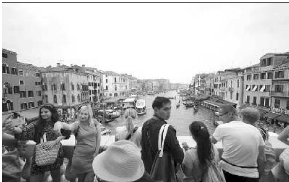
▲ Venecia es la primera ciudad del mundo en implementar este sistema, que podrá servir de ejemplo para otras ciudades frágiles, consideró el alcalde de la municipalidad.

Sin embargo, se prevén numerosas exenciones, en particular para los menores de 14 años, los estudiantes o