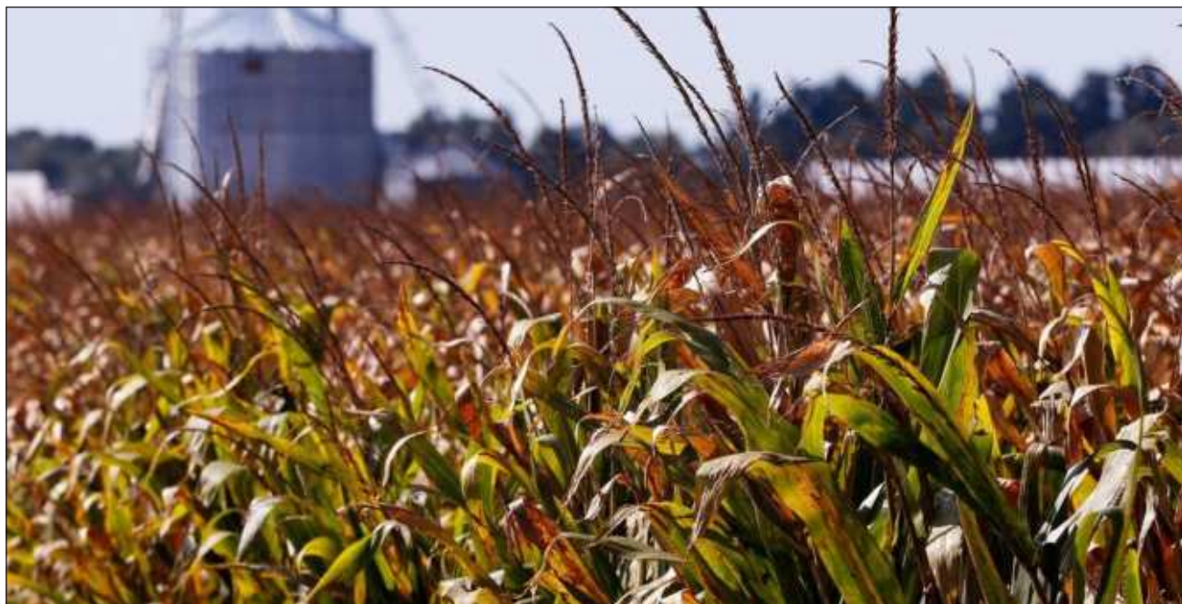
▲ La meta es conseguir la compra de al menos 40 mil toneladas de producto a corto plazo, para desahogar los silos en donde tienen almacenadas 52 mil toneladas de grano de maíz blanco, lo que permitirá trillar las hectáreas pendientes de cultivo y guardarlas.

Sin embargo, Torres Ábrego aseguró que estaban de viaje precisamente con representantes del gobierno del estado, así como funcionarios del gobierno federal,