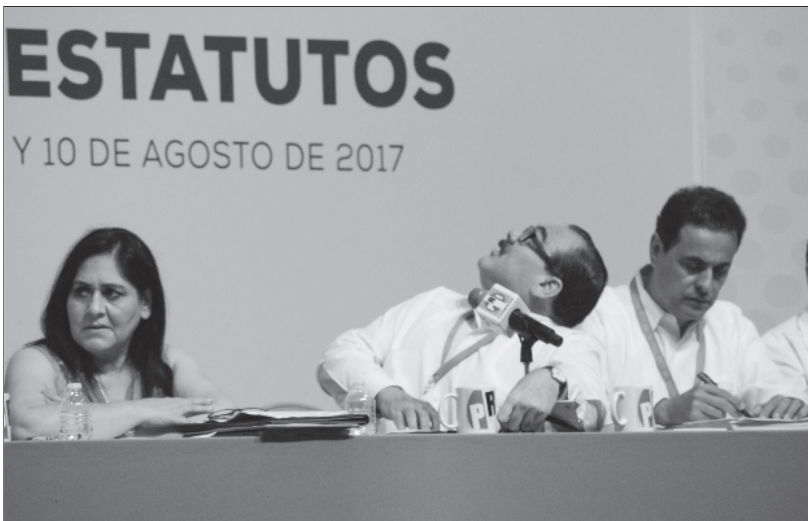
▲ “No nos escandaliza la reptiliana tendencia a mudar de piel y partido de los políticos. Lo que llama la atención es la facilidad con la que fueron aceptados en Morena”.