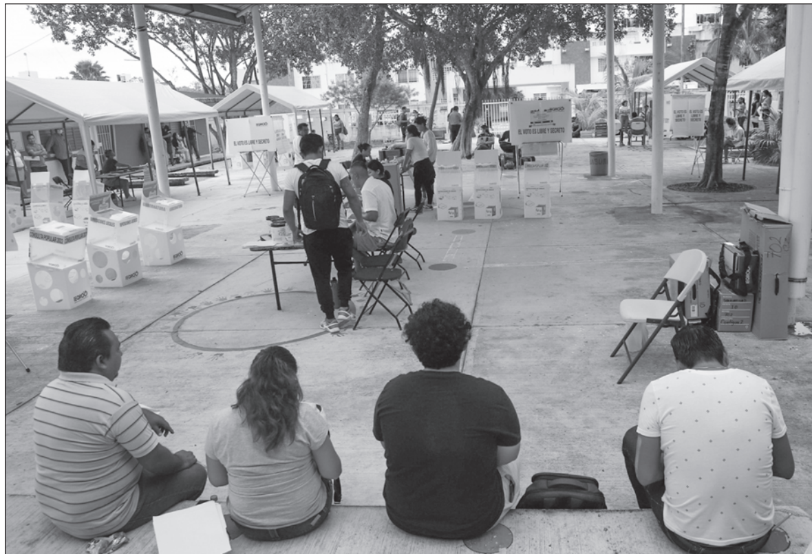
▲ “Se espera, no que votemos por un proyecto de vida o de gobernanza, o por un programa de políticas públicas capaces de generar el bien común, sino sólo como un mecanismo para demostrar que ‘somos más’”.

Parecería que en la rebelión de las masas a las que nos invita a participar la autonombraada cuarta transformación no hay cabida para el pensamiento crítico. La consigna substituye al argumento, la diatriba a la reflexión, y la repetición a la veracidad. Pero como el actual mecanismo político conduce a construir mayorías, el