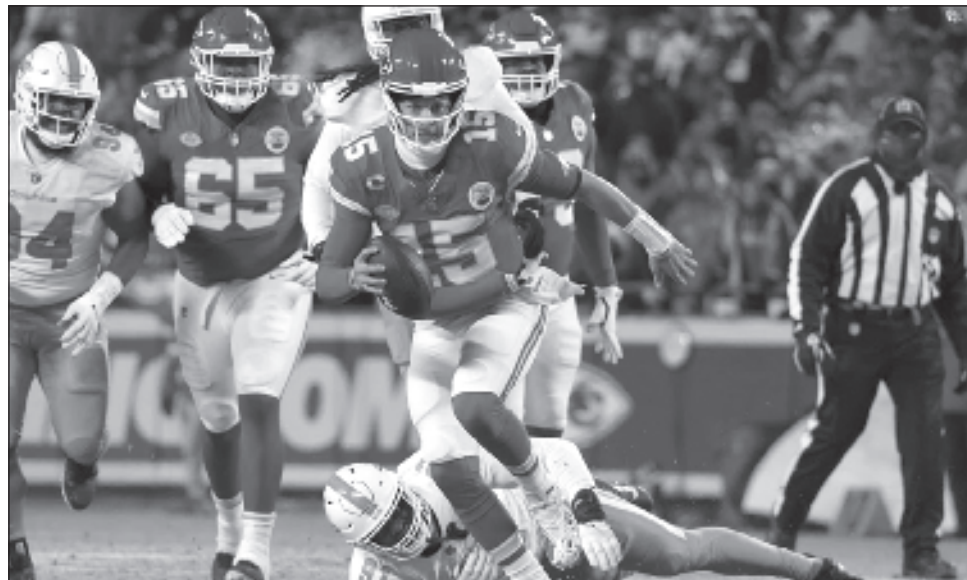
▲ Patrick Mahomes (foto) venció a Josh Allen y los Bills en sus dos choques anteriores en playoffs.

Así fue en contra de los Delfines. Los Jefes estuvieron contentos con el juego de posición de campo toda la noche, y cuando su defensiva le ofrecía el campo corto a su ofensiva, fueron capaces