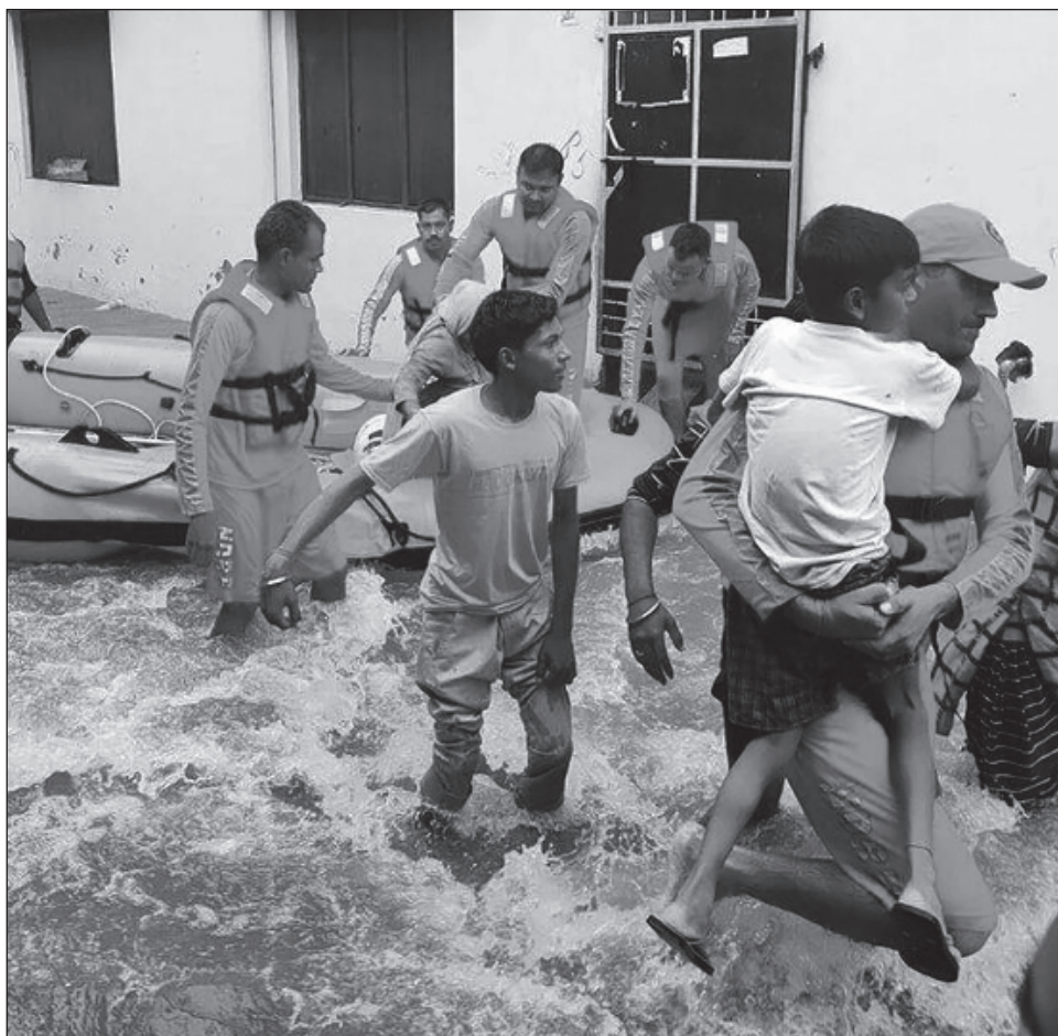
▲ Las altas temperaturas aumentarán el alcance de los mosquitos, lo cual provocará la propagación de enfermedades como la malaria, el dengue y el zika a zonas templadas.

Los analistas creen que las altas temperaturas aumentarán la actividad y el alcance de los mosquitos, lo cual provocará la propagación de enfermedades como la malaria, el dengue y el zika a zonas climáticas templadas y antes menos afectadas, poniendo a 500 millones de personas más en peligro de contraer este tipo de infecciones para 2050, según el reporte mundial.