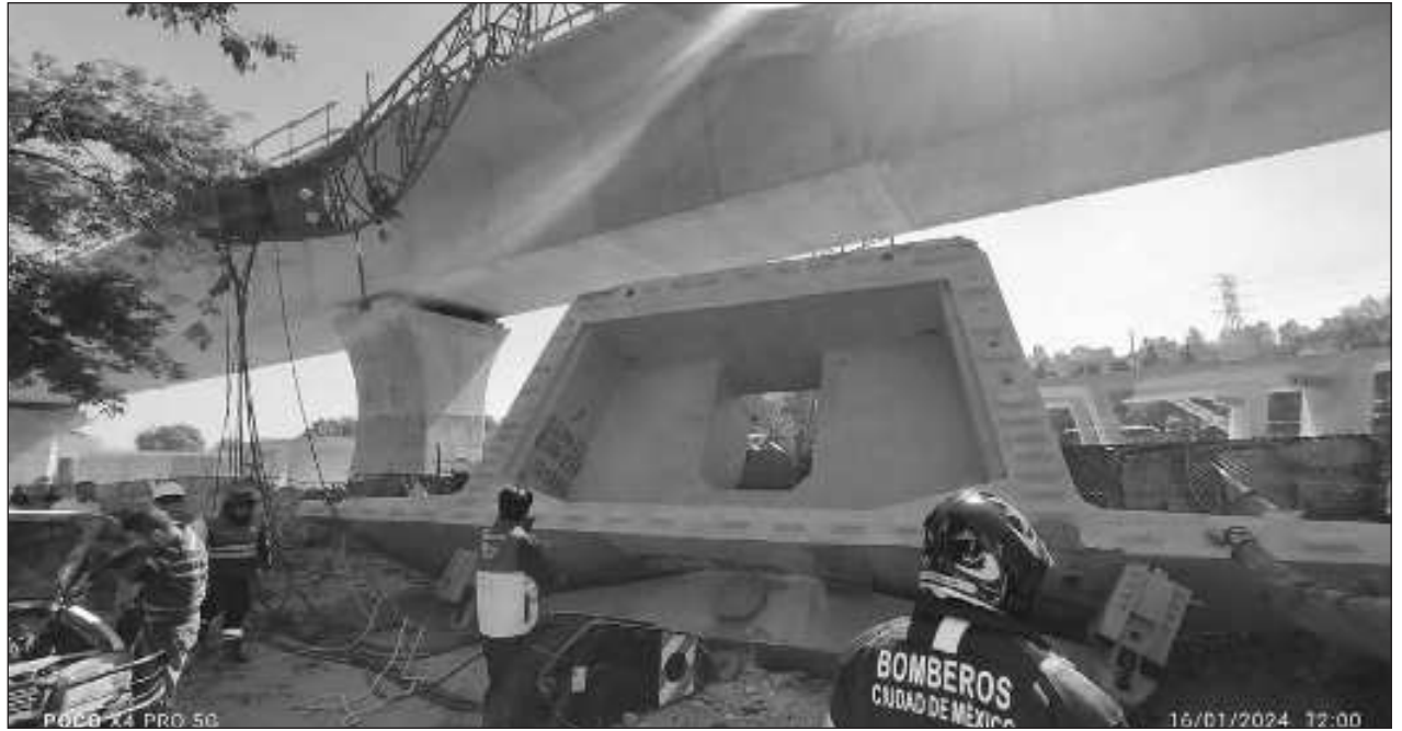
▲ El incidente ocurrió en el apoyo 18 en el frente de obra Minas de Arena cuando la dovela era transportada por una grúa sobre el Viaducto. Las autoridades dieron a conocer que no se reportaron personas heridas.

Dijo que la meta es superar el nivel de satisfacción de recetas de los pacientes que actualmente es de 86 por ciento, aunque en muchos casos es de 75 por ciento o 50 por ciento de las medicinas que se requieren en esas recetas.