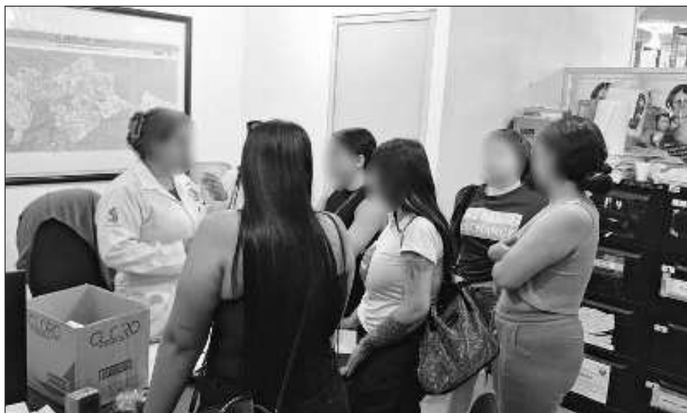
▲ "Ha iniciado el proceso de retorno asistido a su país de origen, aquí es por falsear su declaración de ingreso a México como turistas y realizar actividades remuneradas", apuntó Rodríguez Bucio.

En la presentación del informe Cero Impunidad , indicó que tras la denuncia por la desaparición, las extranjeras fueron localizadas en un mo-