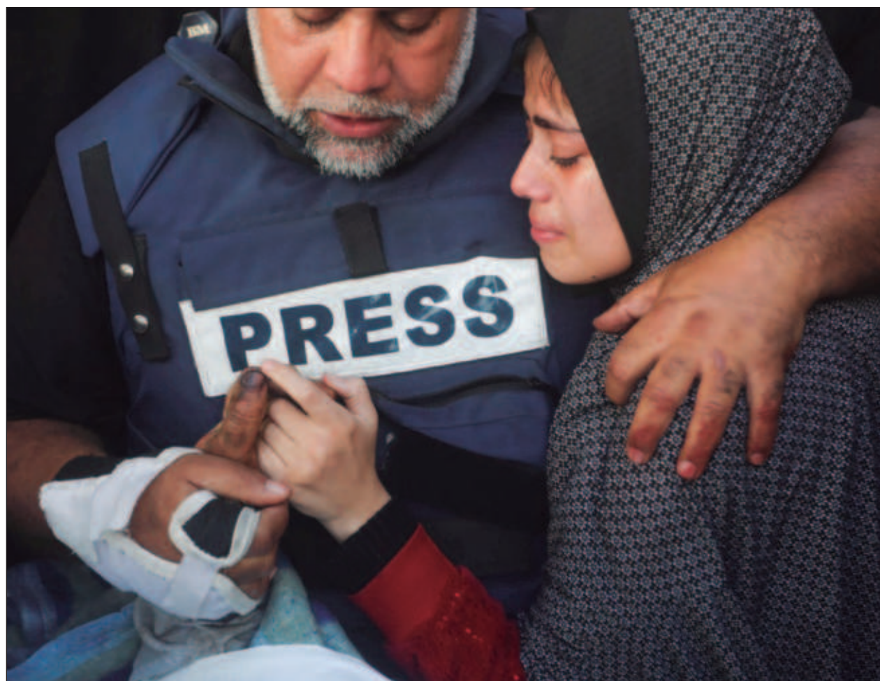
▲ El periodista, que ha seguido informando sobre la guerra de Gaza pese a resultar herido y perder a gran parte de su familia en los incesantes bombardeos israelíes, pudo entrar en Egipto por el paso fronterizo de Rafah. El Sindicato de Periodistas egipcio no especificó a qué país se dirigirá el jefe de redacción de la televisión catari Al Jazeera.