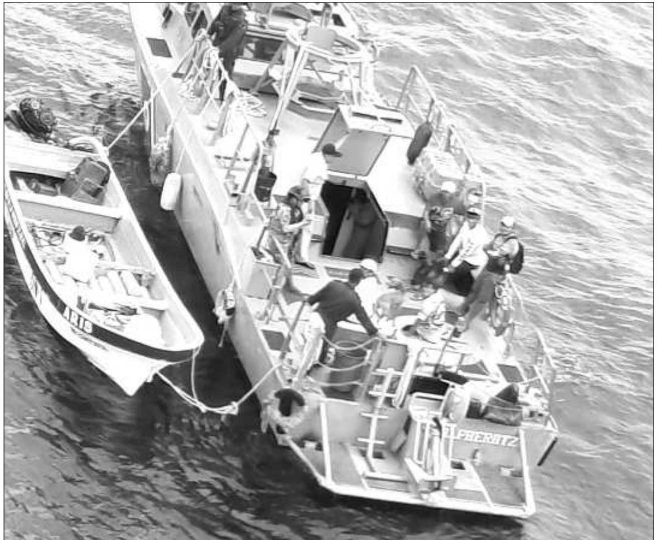
▲ Los hombres y el canino salieron de la isla de Cozumel a bordo de la embarcación Aris y ésta sufrió un desperfecto durante el trayecto. Se les encontró a aproximadamente 20 millas náuticas de Cabo Catoche, Quintana Roo.

De acuerdo a la información proporcionada por Semar, la embarcación sufrió un desperfecto en el motor, lo que produjo que los pescadores y el perro quedaran a la deriva en altamar por casi 48 horas.