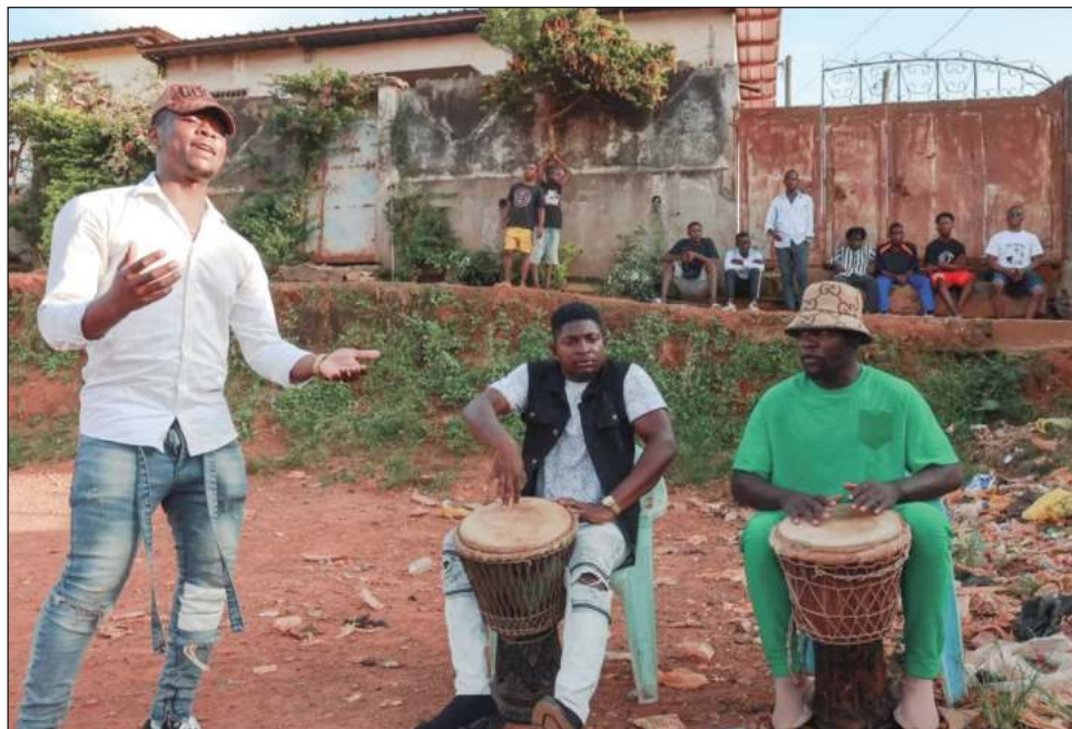
▲ El peso de la pobreza, las drogas y la inseguridad son temas recurrentes entre los intérpretes de mbole, que utiliza instrumentos como djembé, gran tambor de África occidental.