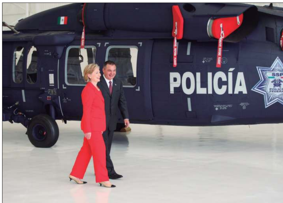
▲ En 2009, la secretaria de Estado, Hillary Clinton, en una gira a México, acompañó a García Luna a inspeccionar un helicóptero Black Hawk.

Entre otras cosas, se espera que en su juicio se conozca a través de quién, cuándo y cómo se enteraron las autoridades estadounidenses de que su héroe antinarcóticos en México es el que ahora acusan de narcotráfico y de recibir sobornos multimillonarios para proteger al cártel de Sinaloa.