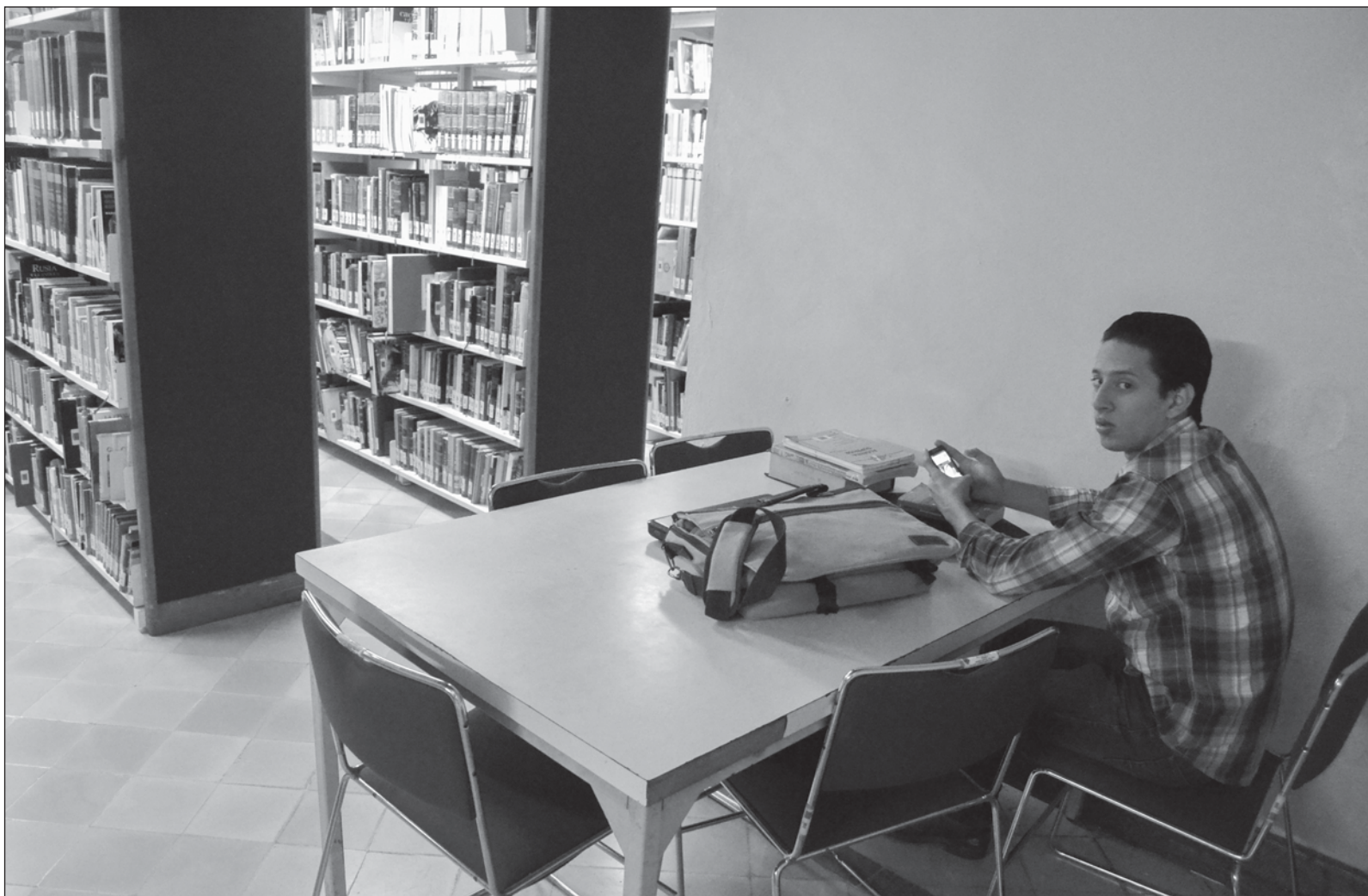
▲ “En materia de valores hay dos segmentos en nuestra sociedad que son críticos: la familia y la escuela”.