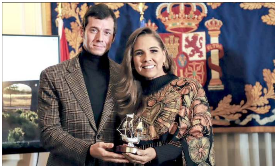
▲ La gobernadora Mara Lezama recibió el premio Travelers Awards, que otorga Periodista Digital a Quintana Roo como "Destino líder en turismo de América y el Caribe".

El área que ocupará el Caribe Mexicano estará instalada en el pabellón de México, el más grande de los países de América Latina, con un área de mil 111 metros cuadrados; contempla espacios de promoción, difusión, actividades, negocios, para mayoristas y tour operadores de las grandes cadenas de turistas.