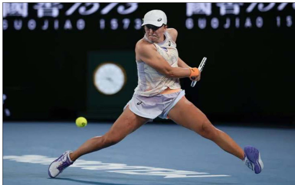
▲ Iga Swiatek devuelve frente a Jule Niemeier, durante la primera ronda del Abierto de Australia.

Nadal no estaba en su pico de forma. En general fue un partido duro. Sin embargo, intentó verlo por el lado bueno al considerar su