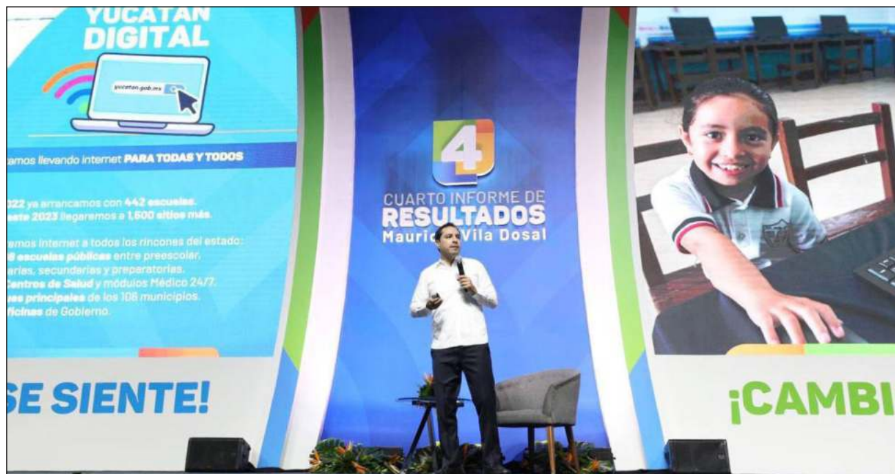
▲ En el marco del cuarto Informe de Resultados de Vila Dosal, la senadora de la República por Sonora, Lilly Téllez García, aseguró que es uno de los mejores gobernadores del país y se le conoce como un hombre que sabe trabajar en equipo.

“Si estas políticas las llevamos a nivel nacional, las