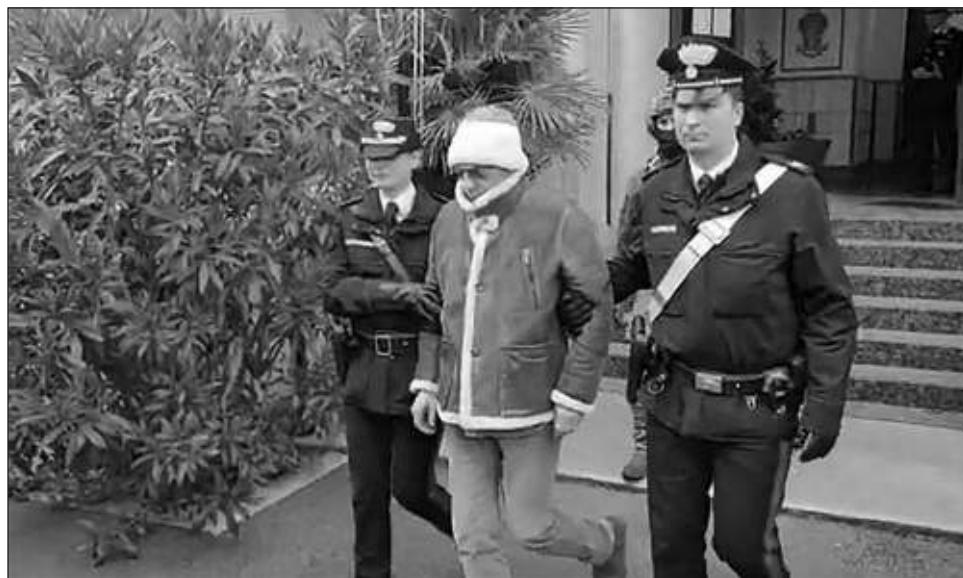
▲ Messina Denaro, que estaba prófugo desde su juventud, tiene ahora 60 años y enfrenta varias cadenas perpetuas tras ser juzgado en ausencia y condenado por docenas de asesinatos.

Era el último de los tres capos prófugos que eludie-