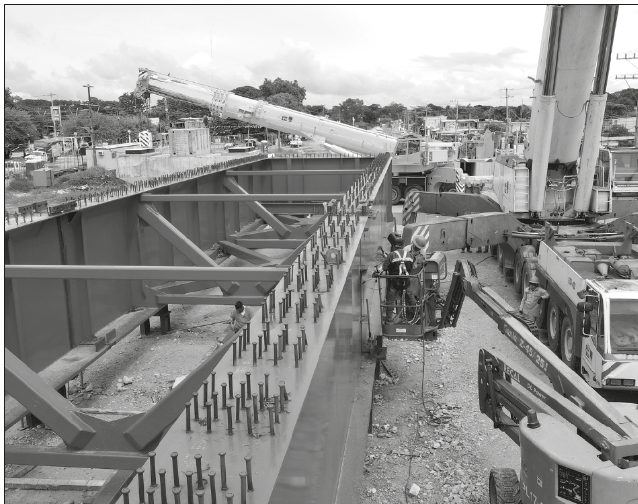
▲ En el tramo 1 hay más de 12 mil empleos ya generados, así como 250 obras sociales, reveló Fonatur.

En el tramo 1 hay más de 12 mil empleos ya generados, así como 250 obras sociales, acompañamiento del programa de mejoramiento de espacios arqueológicos en Palenque, Moral Reforma y El Tigre, agregó.