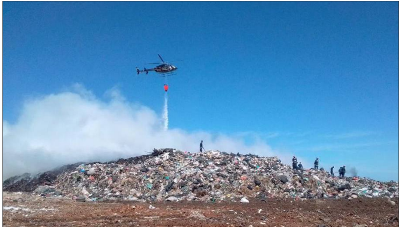
▲ Se han destinado cinco pipas de los servicios de emergencia, tres de Servicios Públicos Municipales, dos provenientes de un servicio particular y dos que envió la concesionaria Veolia, todas ellas con una capacidad de entre 10 y 20 metros cúbicos de agua.

Adicionalmente, para trabajar en controlar el in-