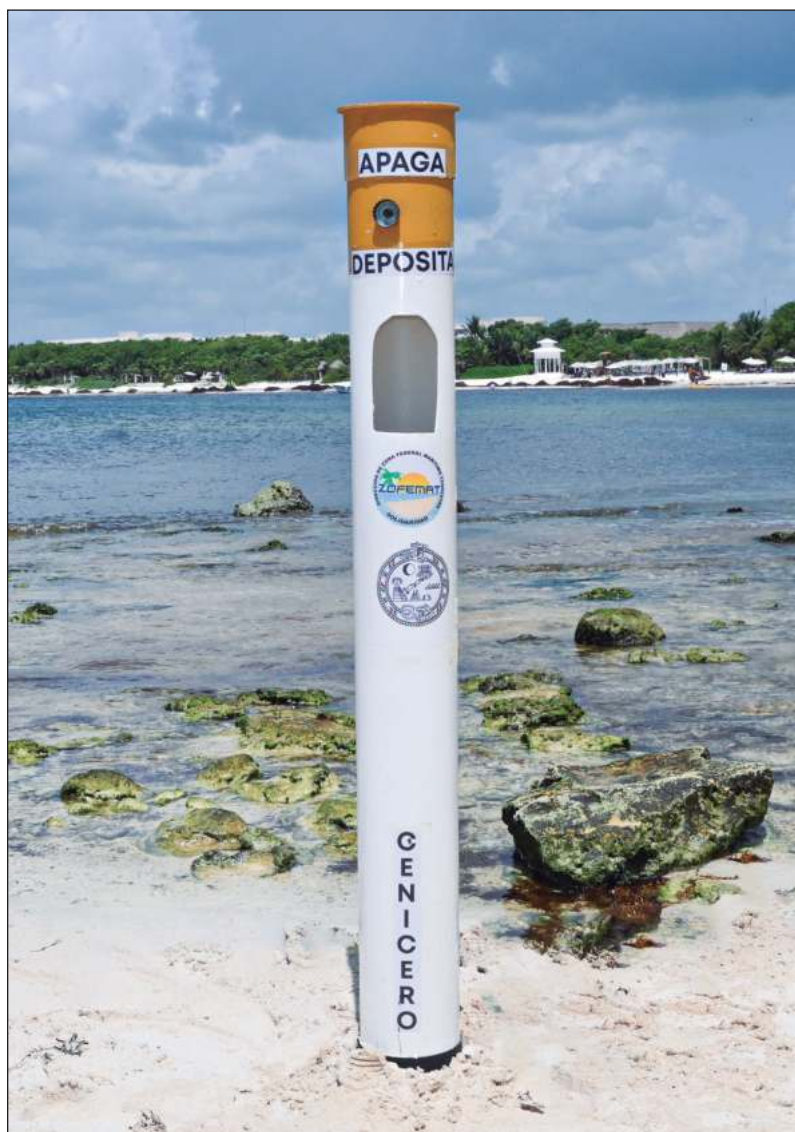
▲ Ambientalistas evaluarán la disposición de contenedores de colillas donados en playas tras la nueva normatividad.

No obstante, manifestó que como Eukariota van a impulsar otro tipo de campañas y nuevos esquemas a partir de esta normativa, las cuales estudiarán, porque tienen la duda en este momento de cómo actuar con los contenedores que han donado para las playas públicas donde acopian colillas de cigarro. Expuso