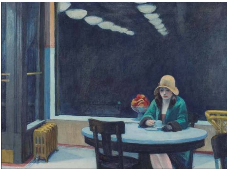
▲ Se trata de la primera exposición en abordar la relación del artista con la ciudad que le sirvió de tema, escenario e inspiración.

LA MUESTRA CONCLUYE EL PRÓXIMO 5 DE MARZO