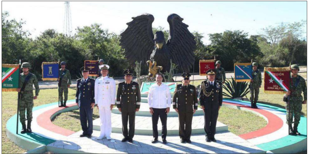
▲ Comandantes y titulares de las unidades o áreas adscritas se presentaron ante el nuevo mando militar, quien cuenta con 47 años de servicio a la nación, rindió protesta como responsable de esa comandancia con reconocida experiencia y trayectoria.

Ha acreditado cursos de Formación de Oficiales, en la referida institución; de Aplicación, en la Escuela Militar de Aplicación de las Armas y Servicios, en Puebla; de Mando y Estado Mayor General, así como Superior de Guerra, en la Escuela Superior de Guerra, de la capital, y la Maestría en Administración Pública, en la Universidad del Valle de México.