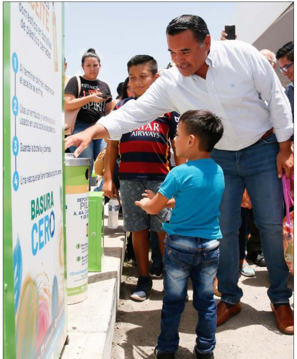
▲ La ubicación de los dos nuevos mega puntos fue elegida por los meridianos a través de la consulta ciudadana Decide Mérida por una ciudad más sustentable .

Precisó que en los demás Mega Puntos Verdes inicialmente se recibían 11 tipos de residuos, pero ahora, con la colaboración de la Cámara Nacional de la Industria de