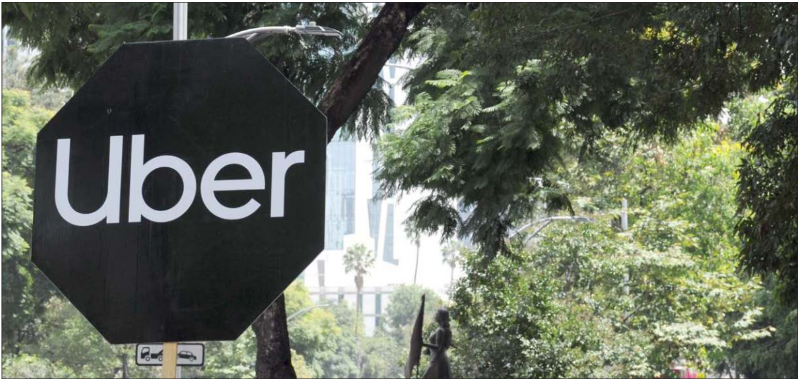
▲ Tanto el gobierno estatal como taxistas señalan que es necesario hacer adecuaciones a la Ley de Movilidad actual para permitir su operación.