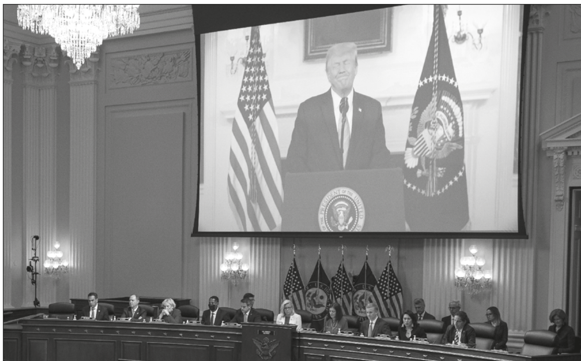
▲ "If one looks at the United States, one concludes that there are two systems of justice at play. One is for regular people, the other is for the rich and privileged; former President Donald Trump is a prime example".

HE ALSO CLAIMED to have divested himself of his Chinese bank accounts before he ran for the presidency. His income tax returns indicate that he lied.