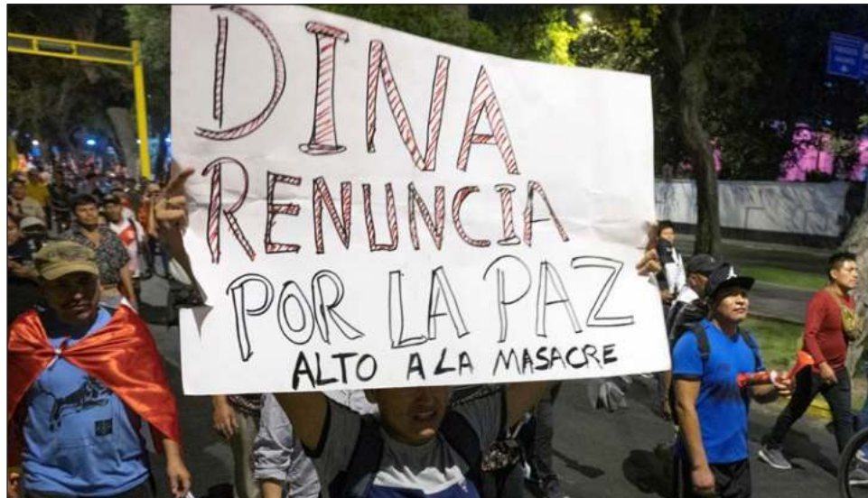
▲ La denominada marcha de los cuatro suyos , en alusión a los puntos cardinales del Imperio Inca, avanzó hasta la región de Ica, vecina a Lima, en camiones que transportan a cientos de manifestantes.

“Será como la marcha de los cuatro suyos”, explica en alu-