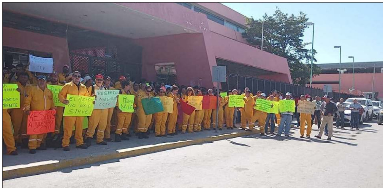
▲ En 2022 los quejosos solicitaron en reiteradas ocasiones que se les entregara equipo de protección personal, pero ante el incumplimiento tomaron decisión de no abordar las plataformas marinas, ya que se pone en riesgo su seguridad.

Los trabajadores expresaron que ante la falta del equipo de protección personal se tomó la determinación de no abordar las plataformas