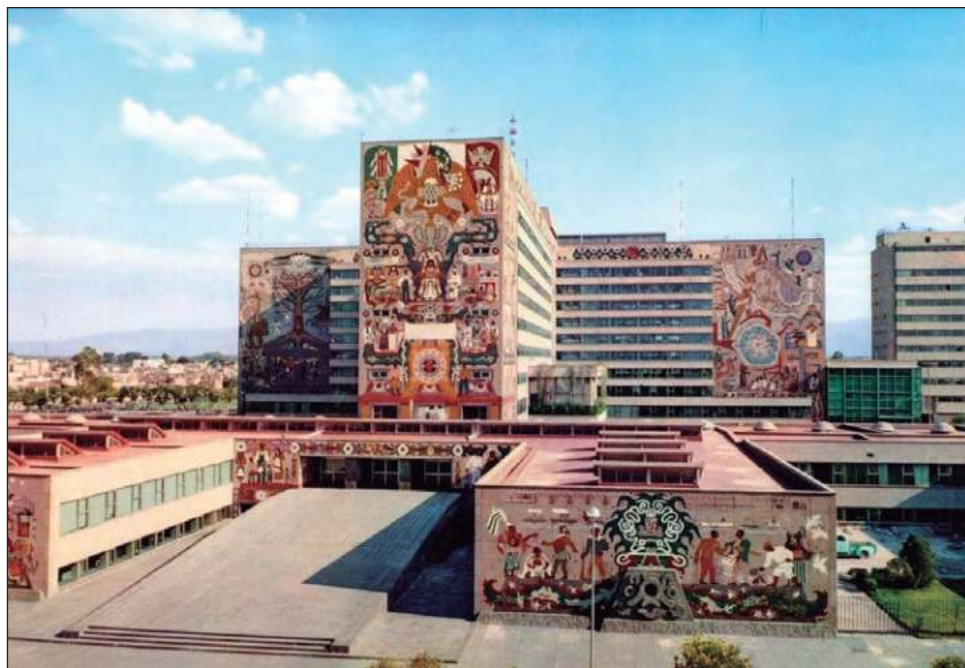
▲ Los murales del Centro SCOP resultaron dañados por el terremoto de 2017. En julio de 2020, el Inbal pidió a la SICT y a Telecomm su aprobación para que el edificio fuera declarado monumento artístico.

desde junio de 2019 –cuando se emitió el exhorto del Congreso–, el Inbal realizó recorridos dentro del conjunto y recopiló y analizó informa-