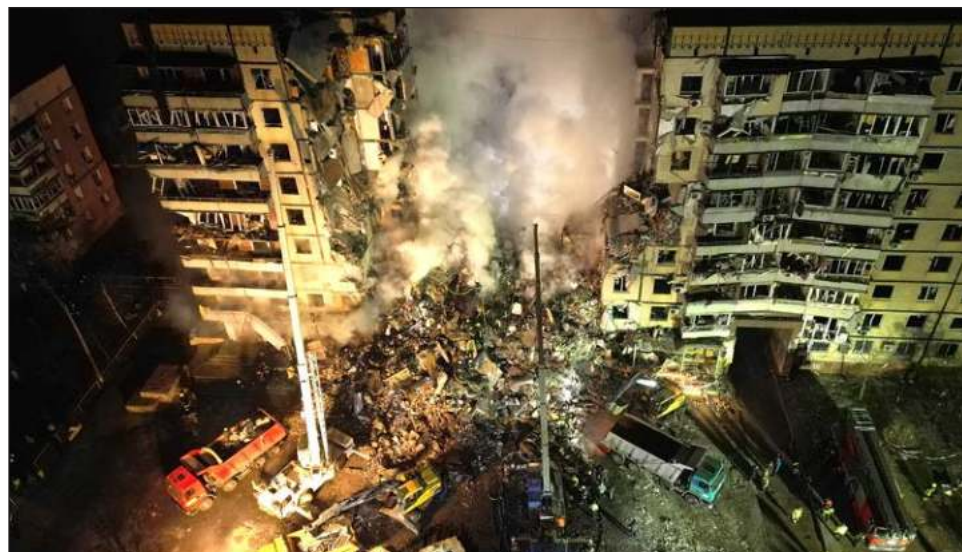
▲ Las labores de búsqueda y rescate continúan y por el momento se había sacado de entre los escombros a 39 personas, incluidos seis niños. Además, se reportan 30 desaparecidos.

Unas mil 700 personas vivían en el edificio de varias plantas, y los vecinos dijeron que no había instalaciones militares en el