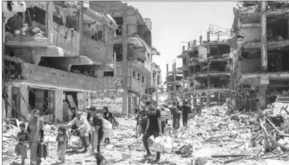
▲ Hezbollah indicó este martes que disparó cohetes contra Haifa y otras regiones del norte de Israel y reportó combates con soldados “infiltrados” en el sur de Líbano.

El objetivo es alejar a Hezbollah de las regiones fronterizas entre Líbano e