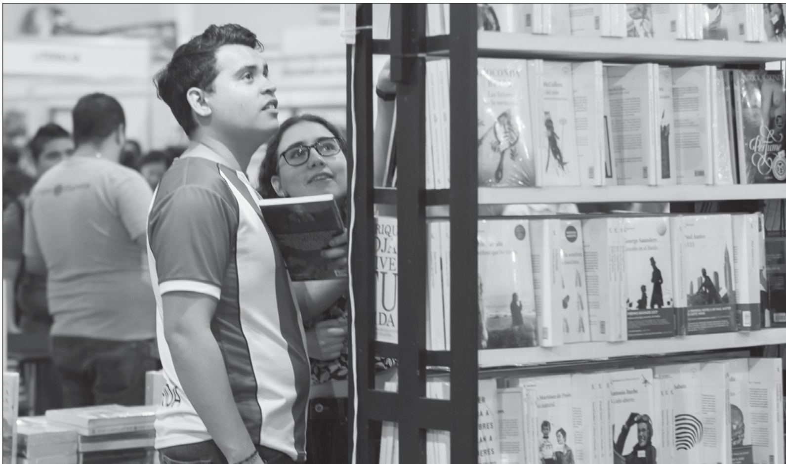
▲ “Es importante y necesario que haya nuevas propuestas que incentiven el gusto por leer. Al parecer, no han sido suficiente los círculos de la lectura”.