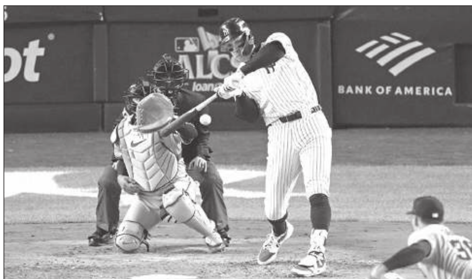
▲ Aaron Judge batea un jonrón de dos carreras en el séptimo acto del partido del martes en Nueva York.

Los dos ases se quedaron debiendo en la noche.