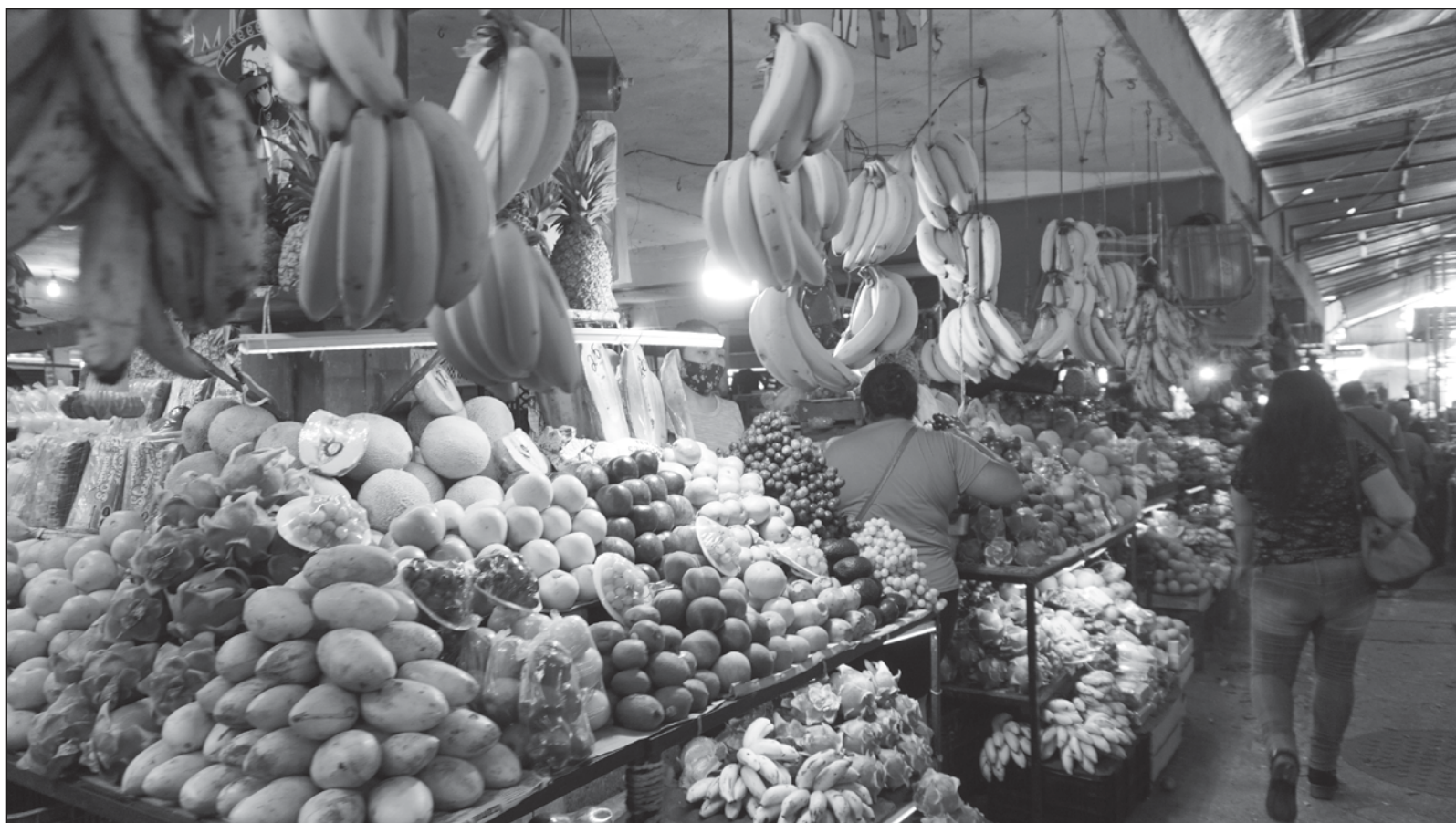
▲ “Reconoce el trabajo de agricultores, y recuerda que alimentarse bien también es buscar una alimentación sostenible”.

*Maestra en ciencias en la especialidad de ecología humana. Ingenio Colectivo