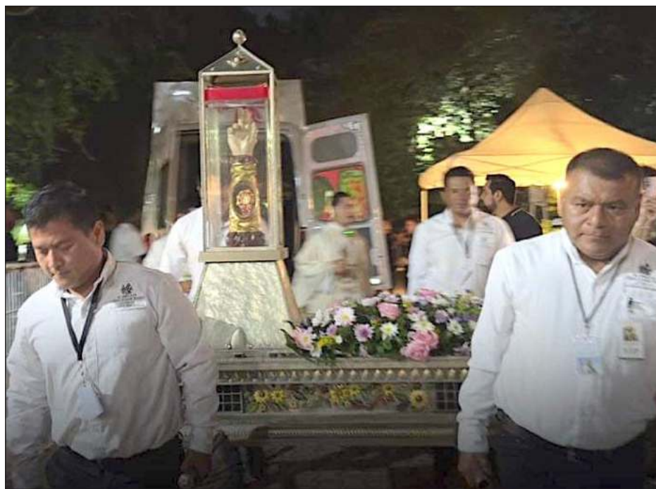
▲ Entre domingo y lunes, cientos de feligreses visitaron la Catedral de Cancún y posteriormente el Santuario María Desatadora de Nudos, para venerar la reliquia de San Judas Tadeo, antes de seguir su camino a Playa del Carmen y otras partes de Quintana Roo.

demanda, entonces eso es lo que viene, la reactivación de la demanda; habrá mucha gente desesperada por cierre de año porque necesitan liquidez, ya que se acercan los pagos más fuertes de las em-