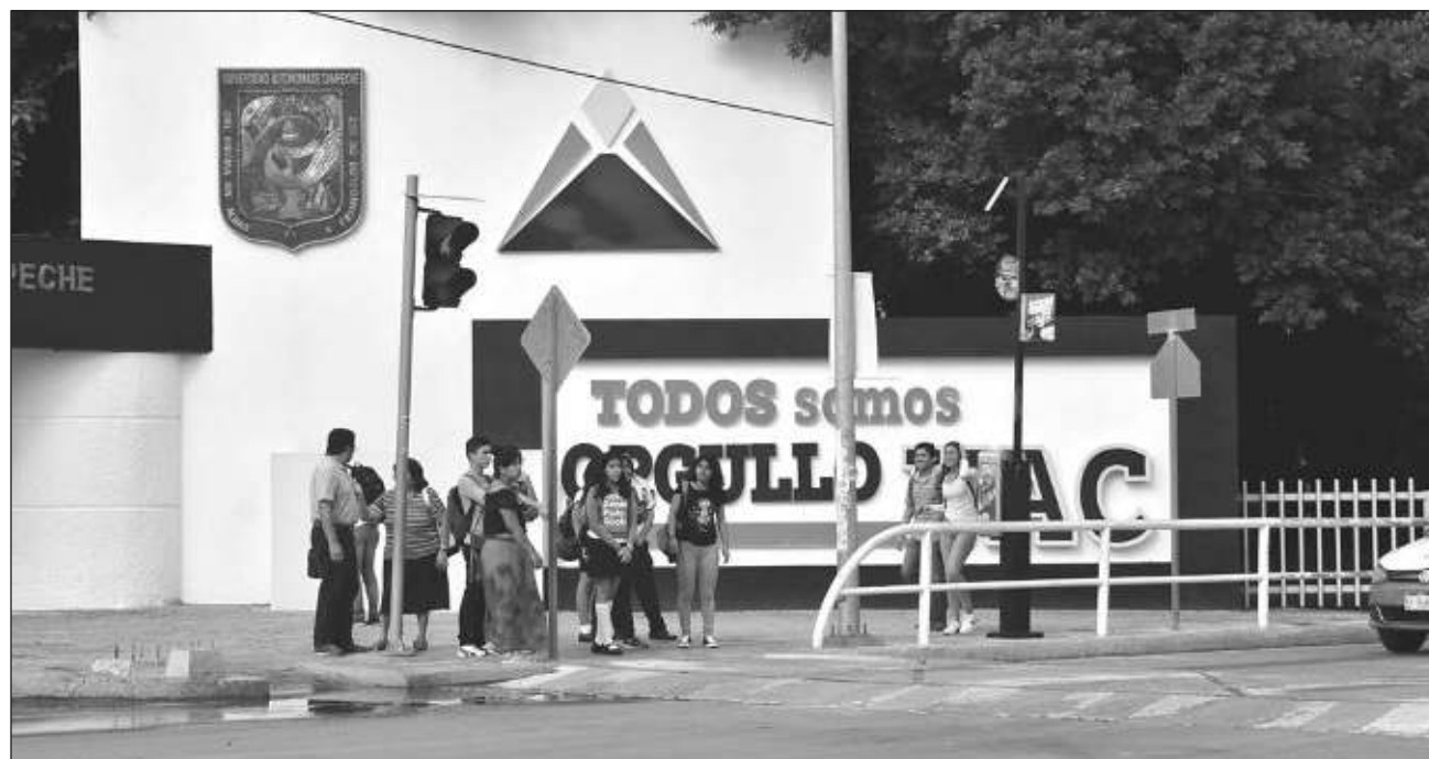
▲ El objetivo de este tipo de pláticas es aumentar la participación de los jóvenes en temas políticos y electorales competentes del estado, pues se ha buscado desde la Legislatura pasada darles voz a todos los sectores de la población.

Entrevistado previo a la sesión ordinaria de este martes, Jiménez Gutiérrez afirmó que por consenso con su grupo parlamentario, realizarán una nueva invitación pero al Consejo