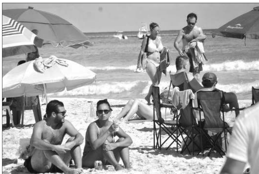
▲ El impacto del turismo, sobre todo cuando es una actividad en crecimiento, cae en varios aspectos; desde el medio ambiente hasta la economía, sin olvidar la alteración del modo de vida de las comunidades.

El impacto del turismo, sobre todo cuando es una actividad en crecimiento, cae en varios aspectos; desde el medio ambiente hasta la economía, sin olvidar la alteración del modo de vida de las comunidades cercanas a los destinos, incluso en los índices de seguridad. Hacerlo sostenible es un desafío que pasa por la prioridad que proclama la Cuarta Transformación, que es "primero los pobres", y resolver con justicia que las grandes inversiones impliquen prosperidad para quienes desempeñan los trabajos más precarios será un gran logro de esta generación, siempre y cuando se pase de las palabras a los hechos.