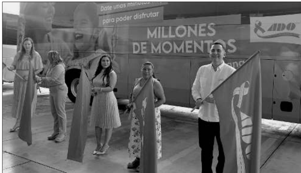
▲ Las mujeres podrán recibir mastografías gratuitas en el estadio Gral. Salvador Alvarado de Mérida en un horario de las 8 y hasta las 13 horas.