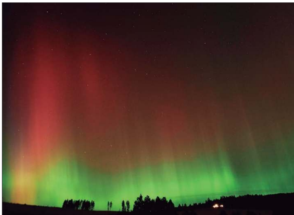
▲ El Sol se encuentra actualmente en la fase máxima de su ciclo de 11 años, lo que hace más frecuentes las erupciones solares, así como las auroras boreales. Según la NASA y la NOAA, se tiene previsto que este periodo de actividad dure al menos un año más.

En mayo, la NOAA emitió una inusual advertencia de tormenta geomagnética severa. La tormenta solar que azotó la Tierra fue la más grande en más de dos décadas, produciendo espectáculos en el hemisferio norte.