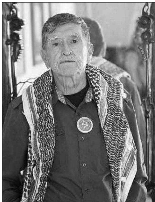
▲ "Fue un estallido de rebeldía, de salir a las calles, de vencer esa inercia opresiva que no nos dejaba respirar desde el punto de vista de las libertades políticas", narra el sociólogo y militante comunista.

En su texto publicado por Editorial Itaca consignó su educación en la Universidad de la Amistad de Los Pueblos Patricio Lumumba, en Moscú, y lo inaudito e incref-