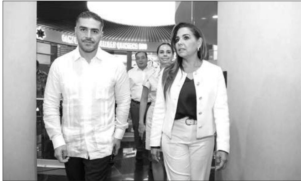
▲ Ante la mandataria estatal, el secretario García Harfuch explicó que la Estrategia Nacional de Seguridad tiene como objetivos la disminución de la incidencia de homicidios dolosos vinculados a la delincuencia organizada.

Mara Lezama dio la bienvenida a las fuerzas federales tácticas, Sedena, Semar, Guardia Nacional, Centro Nacional de Inteligencia, Secretaría de Seguridad Ciudadana