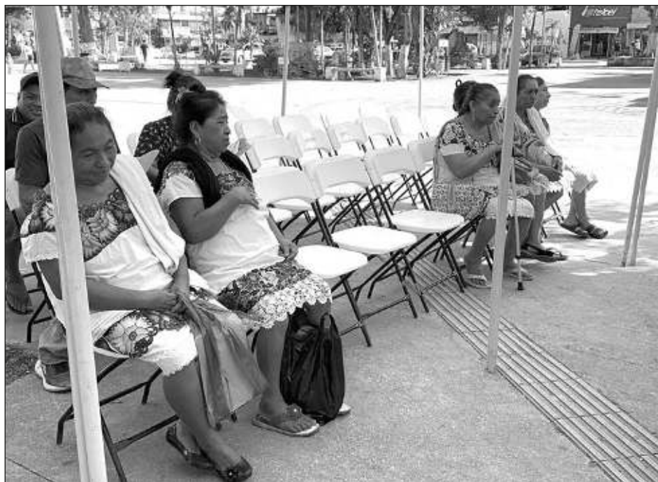
▲ Los habitantes podrán gozar de servicios gratuitos como atención médica, optometría, corte de cabello, psicología y mastografía, en el marco del mes rosa.

Declaró que en estas brigadas de salud podrán encontrar atención médica, consulta dental, optometría, corte de cabello, psicología, mastografía, ultrasonido pélvico, radiografía de tórax, farmacia y también va a haber trasladado de ambulancia en caso de emergencia que alguien requiera un traslado.