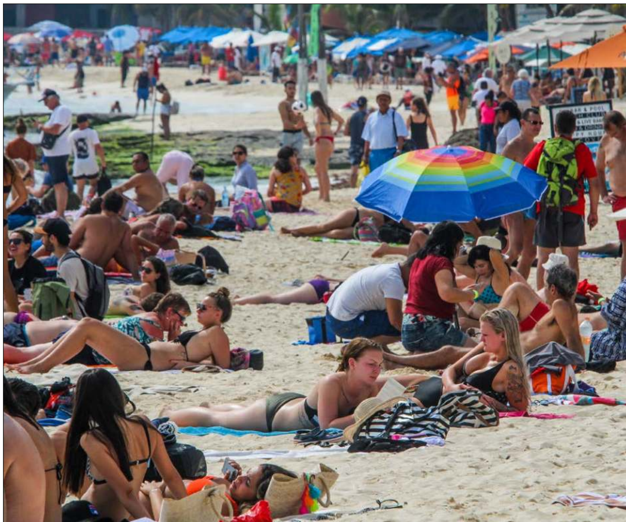
▲ Los resultados del reporte elaborado por el Sistema Nacional de Información Estadística del Sector Turismo consolida a Cancún como el destino favorito del principal mercado extranjero para México.