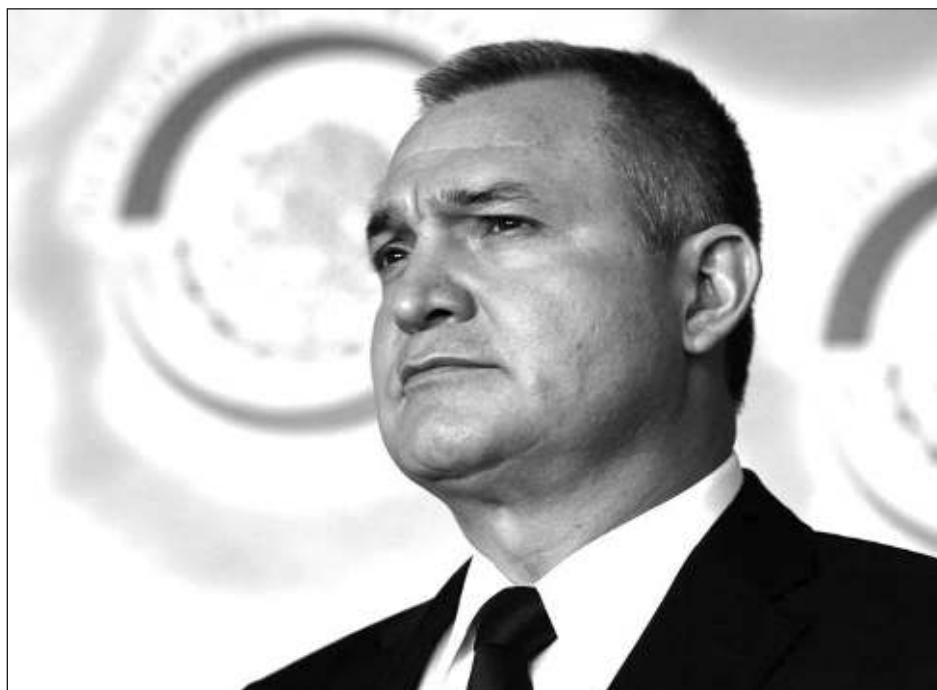
▲ En su misiva al juez Brian Cogan, quien dictará su sentencia, habla de cómo fue criado en una familia con "gran sentido ético" y "ser persona de bien" con "amor por nuestro país".

Con todo esto, concluye solicitando al juez que al emitir la sentencia considere todos estos factores en torno a este juicio, "entre otros la información falsa aportada por el gobierno actual de México y los testigos-criminales, su