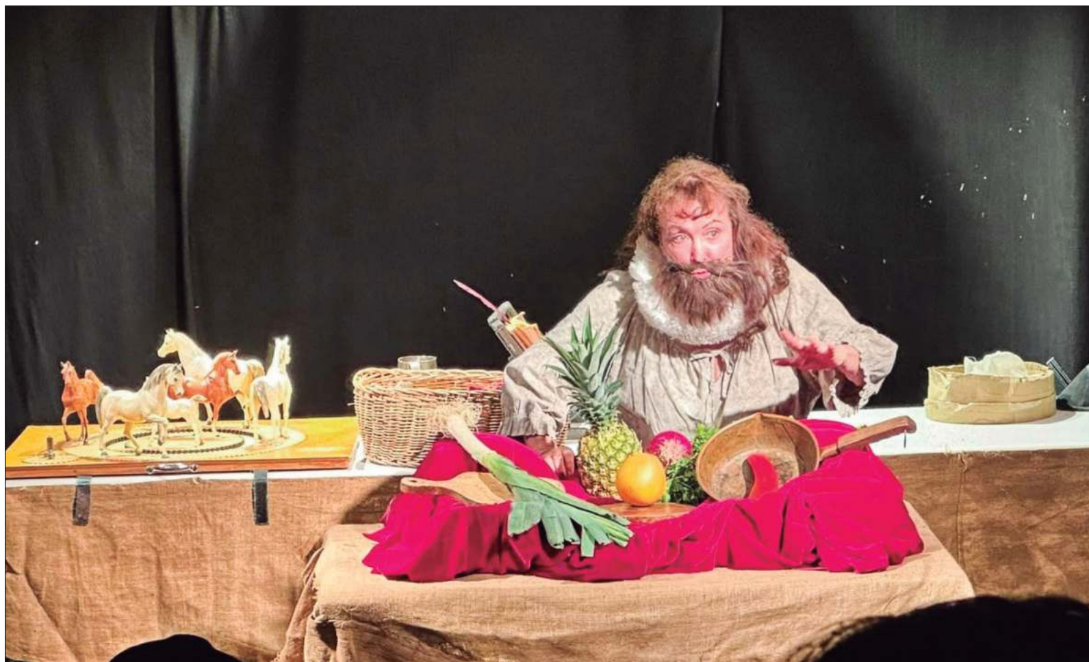
▲ “Le tocó al Teatro La Rendija presentarse en Madrid en la Sala Bululú, y un bululú es un número teatral en que un actor encarna múltiples personajes”.