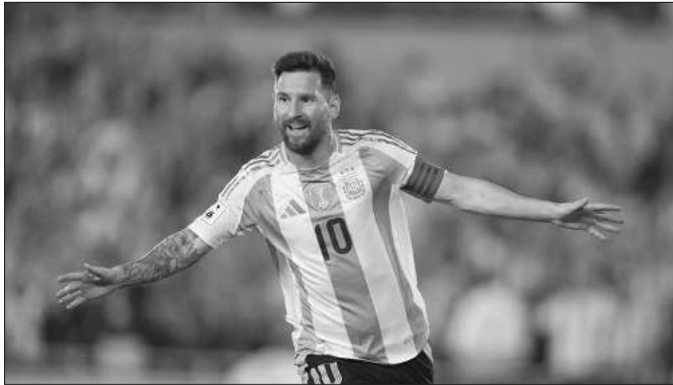
▲ El capitán de Argentina, Lionel Messi, celebra tras convertir un gol contra Bolivia.

Messi abrió la cuenta a los 19 minutos en una jugada en la que la fortuna jugó a favor del campeón