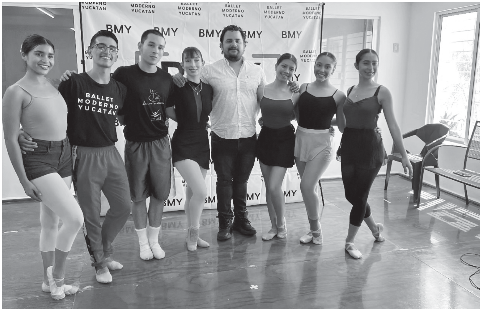
▲ La sede de esta puesta en escena será el Teatro Armando Manzanero y ambas funciones serán en el horario de 20 horas.