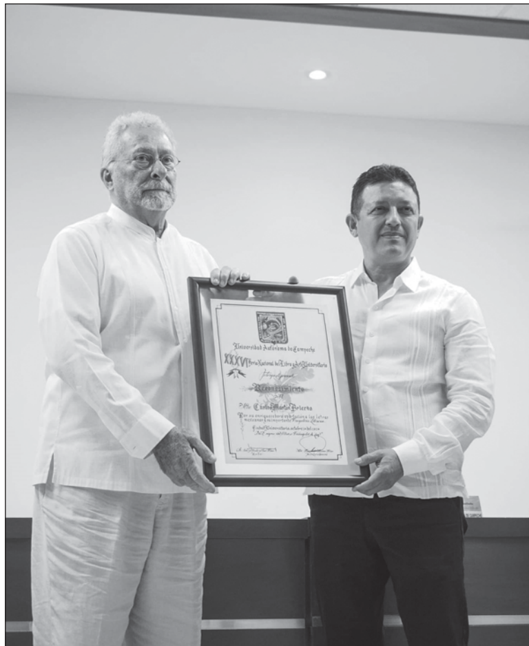
▲ "El reconocimiento que recibo lo entiendo, con toda humildad, como una prueba de que mis esfuerzos no han sido en vano. Lo comparto con mis lectores".

Por eso, ahora que recibo este reconocimiento en la tierra de mis antepasados, hago memoria y vuelvo los ojos atrás, al instante en que todo comenzó, cuando a punto