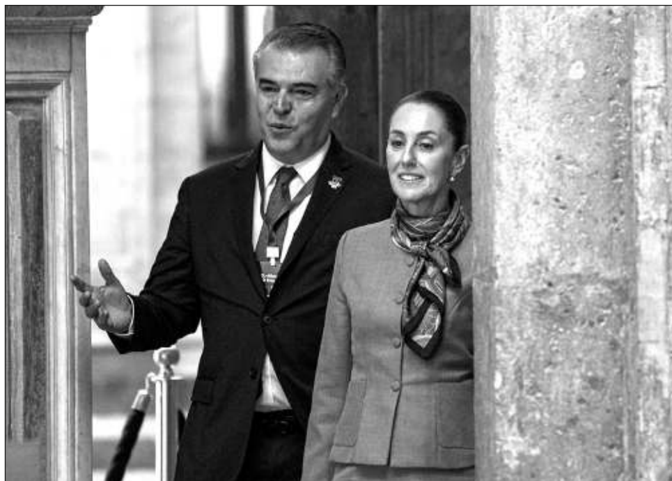
▲ La Presidenta dijo que México ya se prepara para la renegociación del tratado comercial sobre la perspectiva de que las economías no compiten entre ellas, sino que se complementan.

A pregunta expresa sobre las inversiones en el sector energético, Sheinbaum ex-