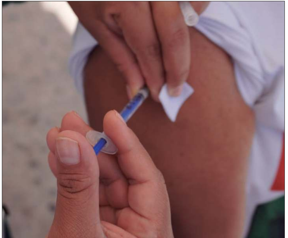
▲ Aunque el inicio oficial es el jueves, quien así lo desee ya puede asistir a las clínicas y unidades médicas del IMSS, IMSS-Bienestar, Issste y la Secretaría de Salud.

Además, informarán si habrá brigadas ambulatorias, como en la etapa inicial del Covid-19 pues hasta hace dos semanas, había cerca de 600 casos confirmados.