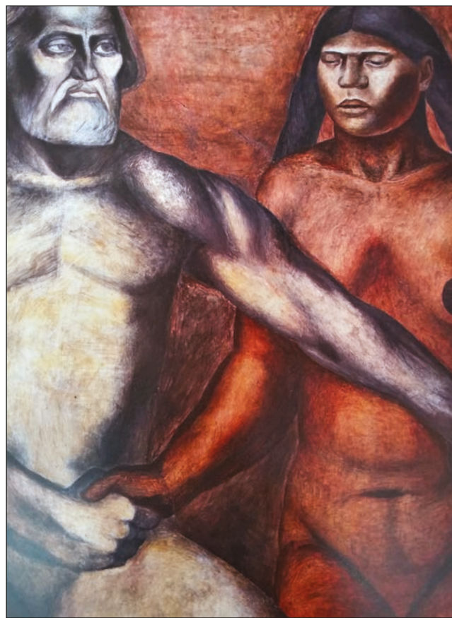
▲ Esclava, explotada, triunfadora y castigada por su éxito, son algunos de los testimonios que integraron esta narrativa sobre la indígena que compartió un momento histórico junto al conquistador Cortés.

Violencia, conquista y despojo es parte de la situación del cuerpo y territorio femenino históricamente caracterizado. Malinche encarna centenas de testimonios.