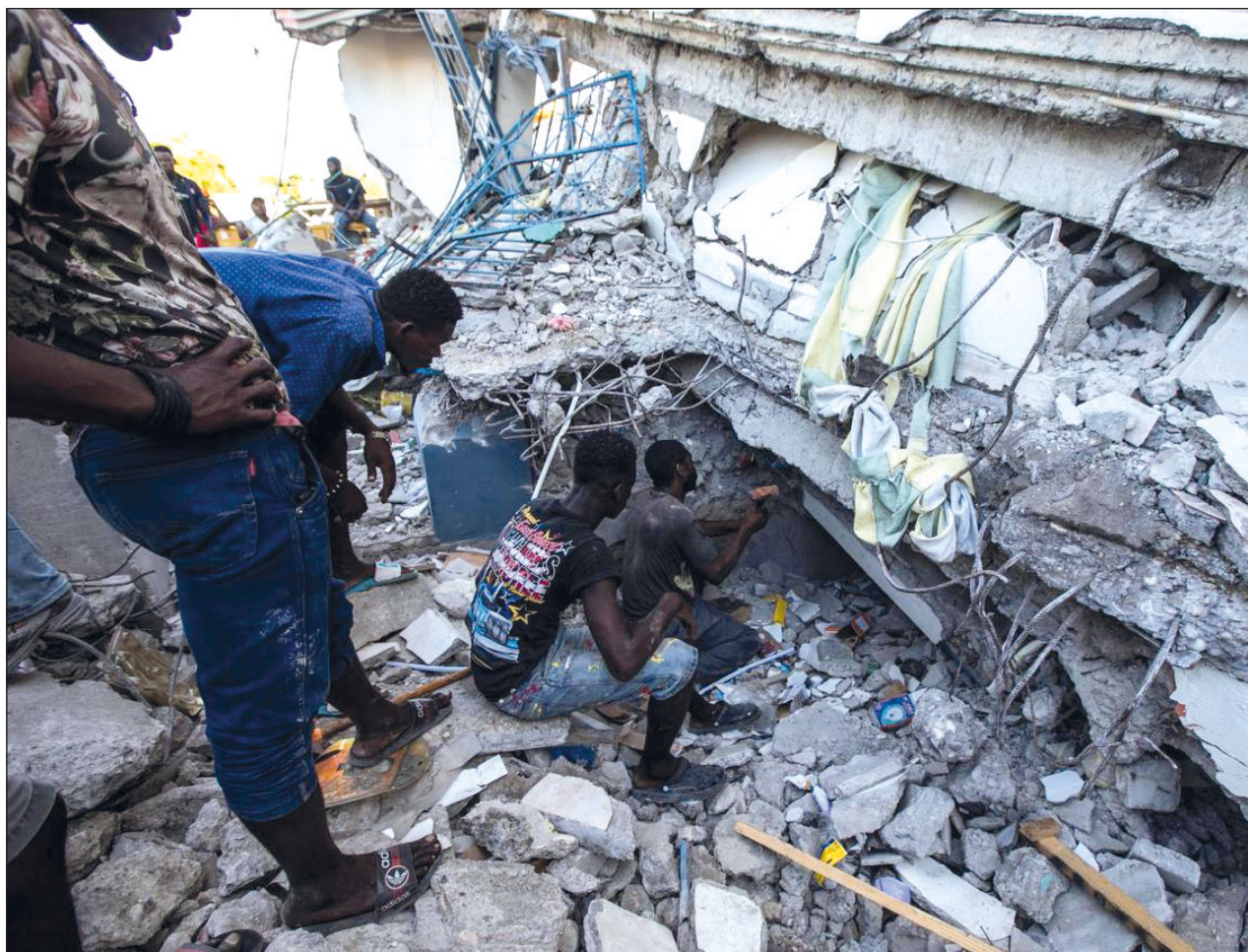
▲ Los pocos hospitales de las zonas afectadas tienen dificultades para prestar atención de urgencia.

El papa Francisco expresó el domingo su “solidaridad” con el pueblo de Haití, diciendo que esperaba que la comunidad internacional se implicara en su favor.