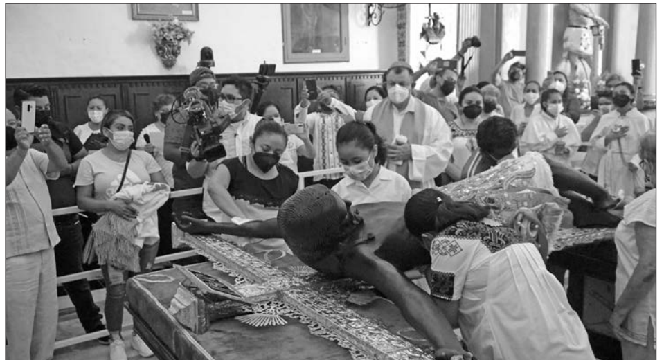
▲ Por segundo año consecutivo, el acceso a la iglesia de San Román estará restringido durante los festejos al Santo Patrono.

Al igual que el año pasado, las fiestas patronales son limitadas, al igual que el ingreso a la parroquia