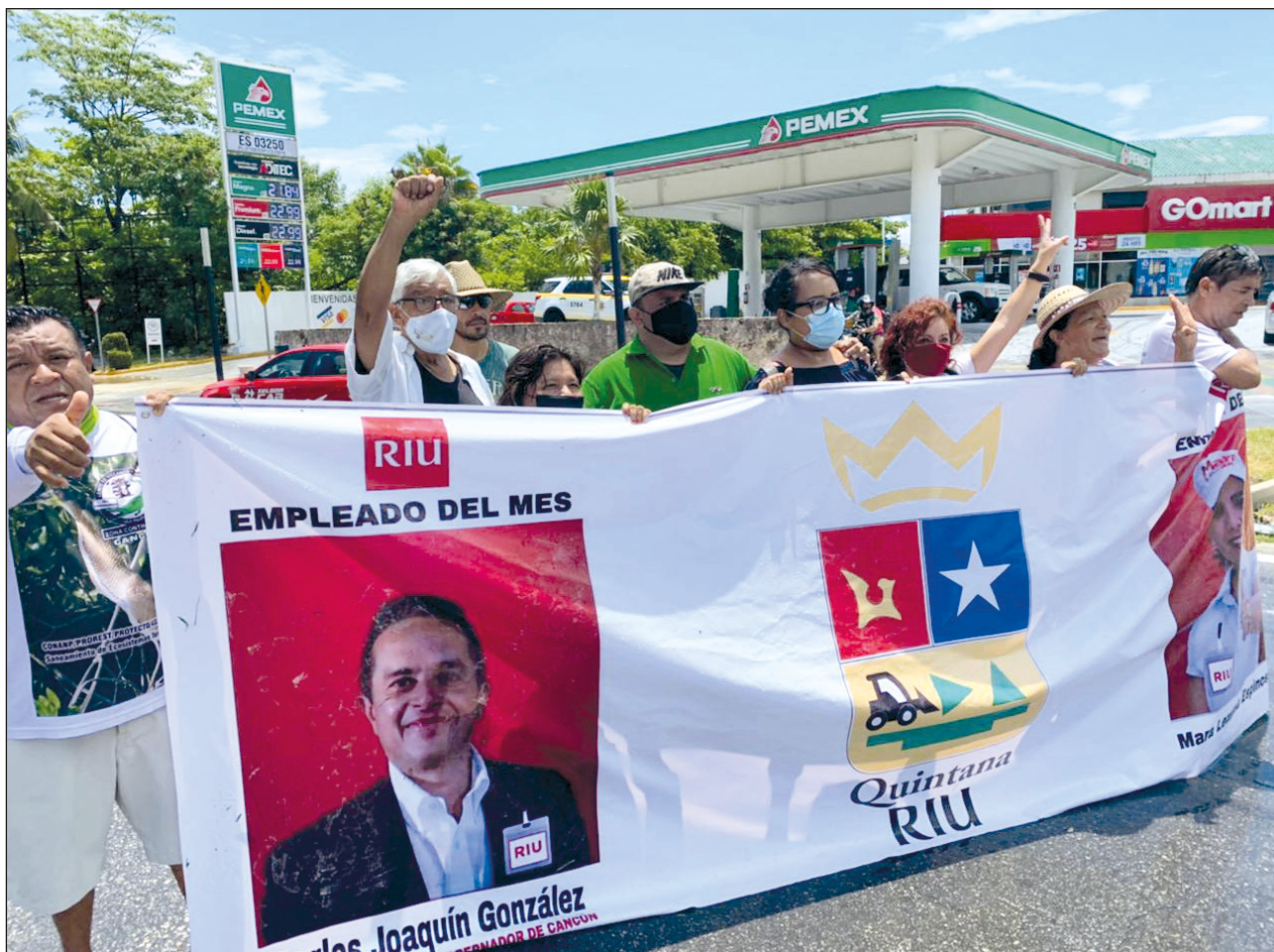
▲ Un grupo de ambientalistas protestó a la entrada de la zona hotelera de Cancún por la construcción del centro de hospedaje.