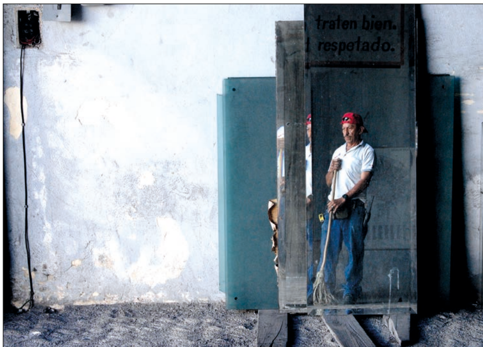
▲ La cultura hegemónica busca mostrar al hombre como si fuera frío y sin emociones.

También encuentra en ese tipo de reuniones, una salida al ejercicio de la violencia contra las parejas, pues los mismos estereotipos de qué es ser hombre,