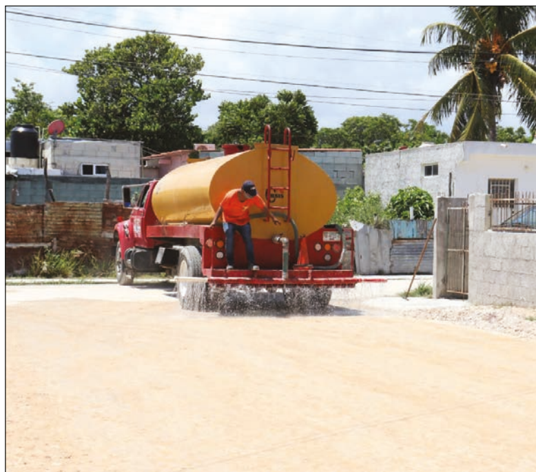
▲ Julián Zacarías Curi señaló que los trabajos buscan hacer frente a la temporada de lluvias en curso.

Finalmente, el edil externó: “continuamos trabajando en las zonas más vulnerables ante esta temporada de lluvias, para que todos podamos estar tranquilos y seguros. Reforzaremos el trabajo en los siguientes meses para intervenir en más calles, no solo de la cabecera municipal sino también de las comisarías”.