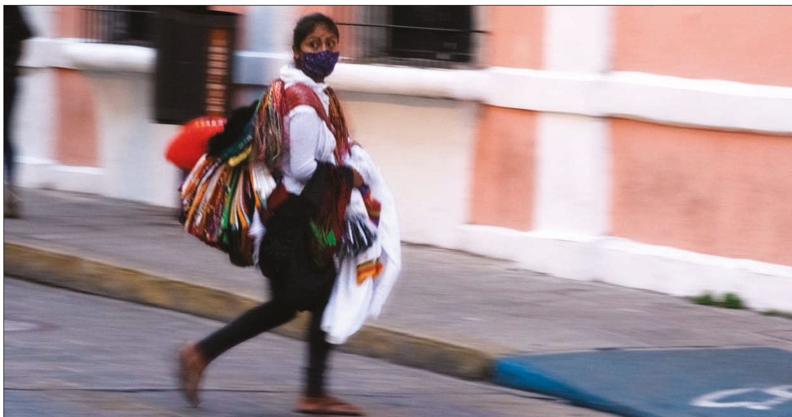
▲ Las iniciativas surgidas a raíz de la pandemia no siempre responden al ideal de la “buena gobernanza”, aunque muestran con distintos matices cómo en lo micro social se orquestan acuerdos, gestiones y alianzas fundamentales en un contexto de crisis prolongada.

Síganos en: https://www.facebook.com/ORGACovid19/ https://www.instagram.com/orgacovid19 https://twitter.com/ORGA_COVID19/