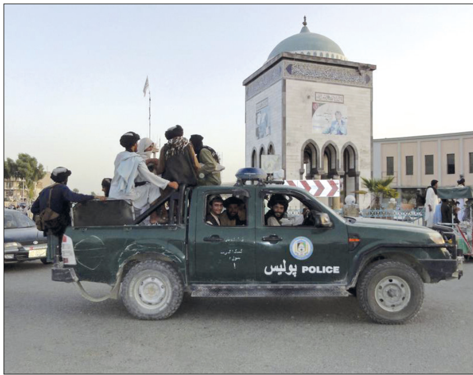
▲ En poco más de una semana los yihadistas se apoderaron de la mayor parte de Afganistán.

En una espectacular ofensiva, los talibanes capturaron casi todo Afganistán en algo más de una semana, pese a los cientos de miles de millones de dólares invertidos por Estados Unidos durante casi dos décadas para reforzar las fuerzas de seguridad afganas. Apenas unos días antes, un análisis militar estadounidense estimó que pasaría un mes antes de que la