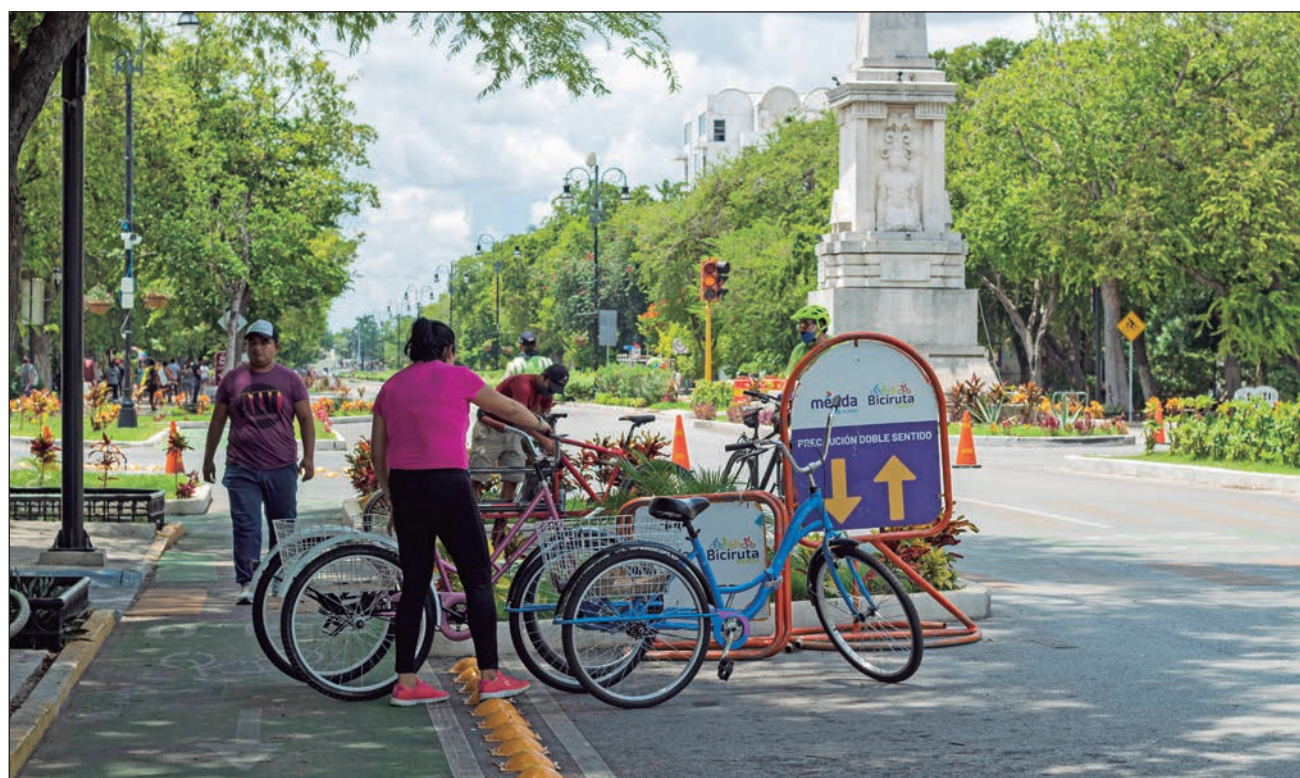
▲ La Biciruta de Mérida, pese a la contingencia por Covid-19, se mantiene como un punto de encuentro para familias y amistades.

Como uno de los nuevos espacios seguros en la ciudad, la Biciruta recibe cientos de personas cada domingo desde las 8 de la