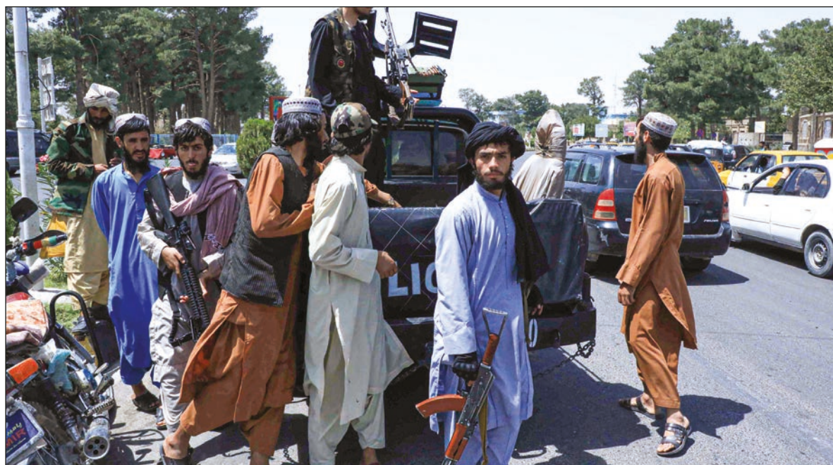
▲ The Taliban have inherited a veritable treasure trove of the U.S. military equipment and bases abandoned by NATO and Afghan soldiers.

REMOVING THE GOVERNMENT from negotiations created the perception that real leadership in Afghanistan rested with the Taliban and not with Ghani. This led to the Afghan military - by all