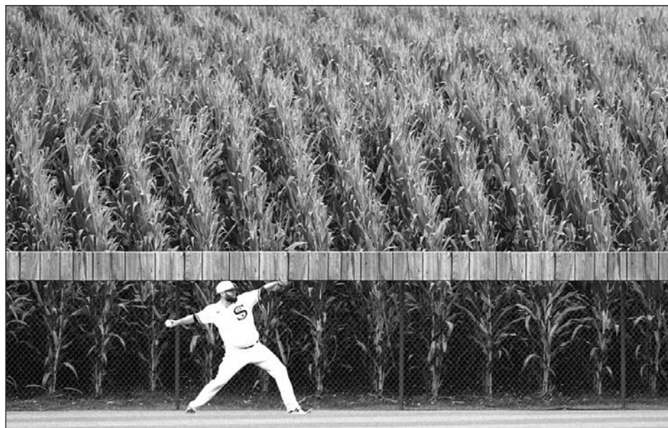
▲ Lance Lynn abrió por los Medias Blancas en el Campo de los Sueños .

Así, los 7 mil 832 espectadores abandonaron el graderío y recorrieron los maizales hasta llegar a sus automóviles. Antes, pre-