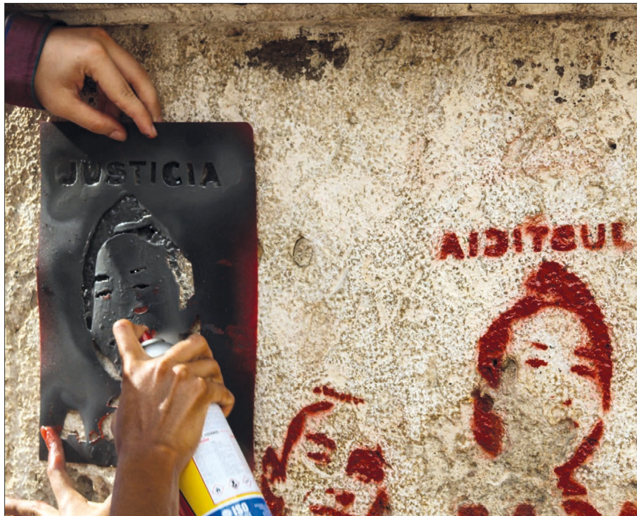
▲ El 8 de agosto se realizó la primera movilización de la ciudadanía por la muerte del joven veracruzano.

El jueves 5 de agosto, la señora María volvió a la Fiscalía a levantar una denuncia, ahora por homicidio, la