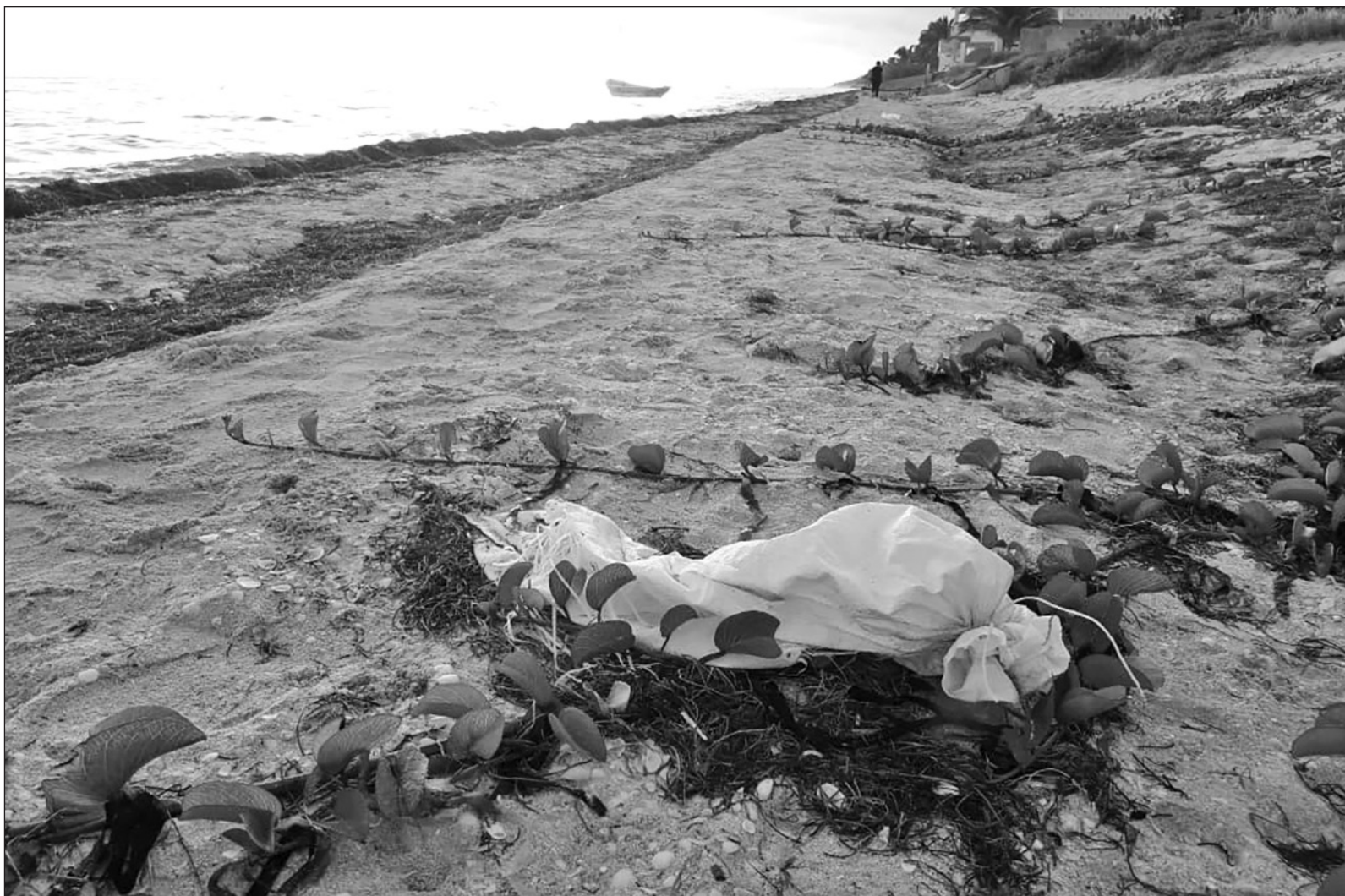
▲ La playa es de todos, es zona federal marítima. ¿Por qué la tenemos que dejar como basurero?.