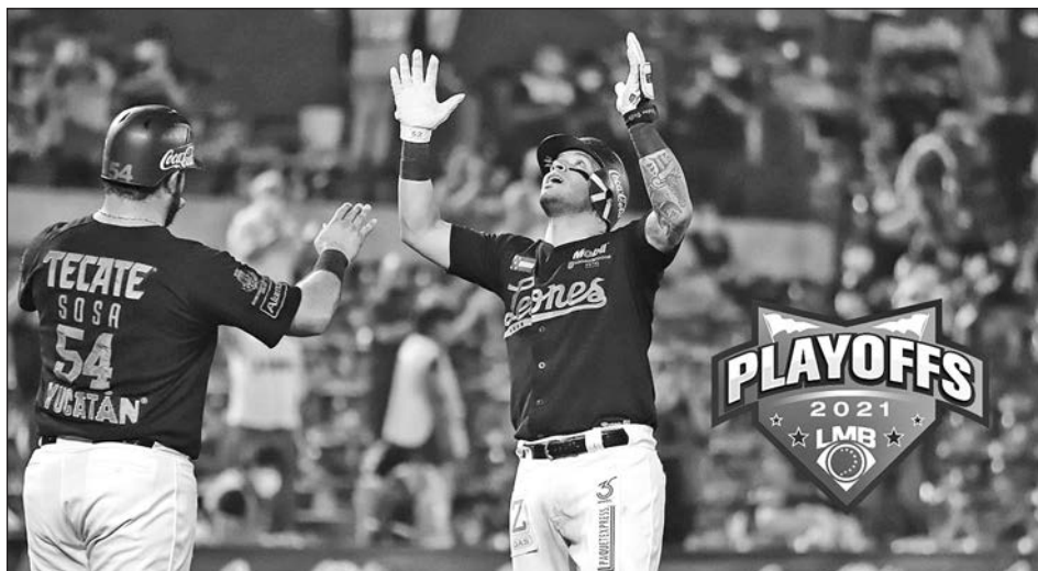
▲ Los melenudos eran líderes de slugging (.537) y OPS (.928) y se ubicaban en el subliderato de bases por bolas recibidas (33) en la postemporada.

Los "reyes de la selva" ganaron al menos una serie de playoffs por sexta vez en las últimas siete tempo-