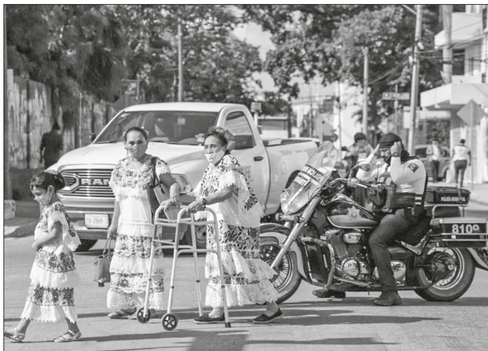
▲ El municipio de Benito Juárez concentra 54.61% de los 49 mil 262 casos confirmados en Quintana Roo.

México sumó este fin de semana tres millones 298 mil 196 casos positivos confirmados y 260 mil 881 defunciones por coronavirus; Quintana Roo alcanzó el 14 de agosto 49 mil 262 casos (1.49% del país) y tres mil 495 defunciones (1.33% respecto a la cifra nacional).