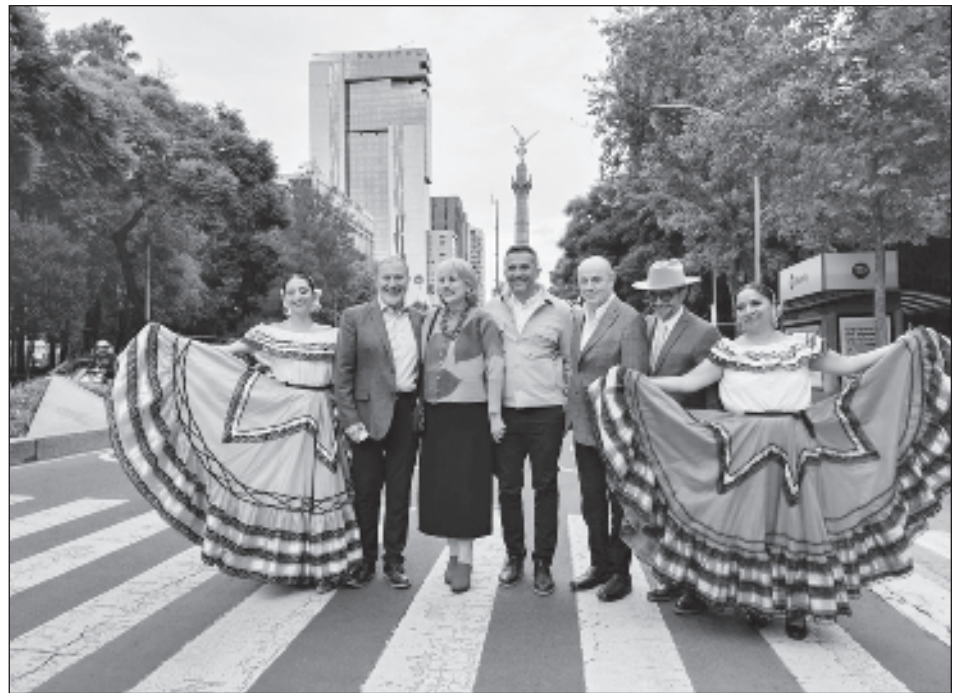
▲ En el marco de este festival, el stand de Campeche ofreció una exhibición representativa de las artesanías locales y una guía detallada de la oferta turística disponible.

El stand de Campeche en este festival ofreció una exhibición representativa de las artesanías locales y una guía detallada de la oferta