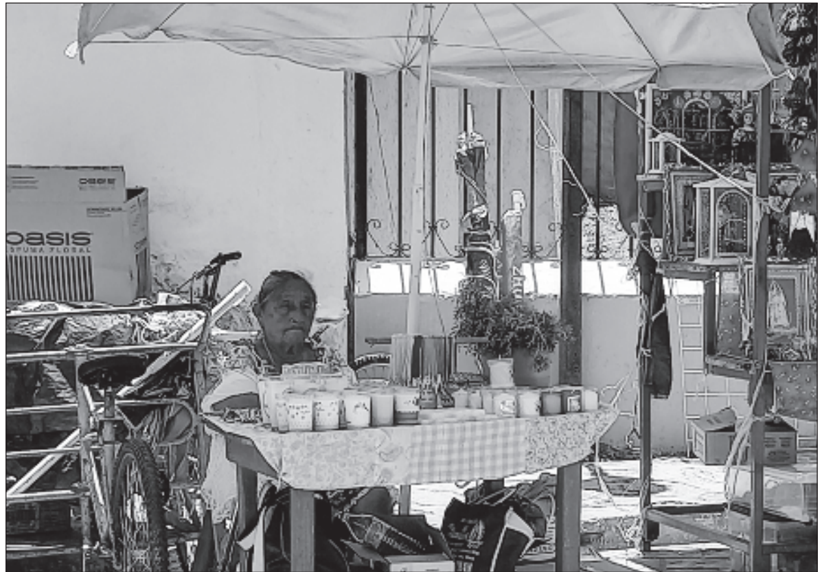
▲ Que estas líneas sirvan para visibilizar a las personas que se dedican a vender “k’exitos”. Su trabajo es crucial para la religiosidad popular en la península, ya que sirven para agradecer los favores recibidos.

LA PALABRA “K’EXITOS” , viene de la voz k’eex, que en lengua maya quiere decir trueque, cambio, permuta, canje o exvoto de acuerdo a lo que nos dice el Diccionario Maya Cordemex. Estos “k’exitos” son ofrecidos a las entidades sagradas, ya sean santos, vírgenes o cruces, en virtud del prestigio de que gozan como hacedores de milagros. En otras palabras, las personas creyentes se sirven de los “k’exitos” para solicitar un favor, protección o milagro. De tal manera que al ofrecer a la imagen venerada un k’eex con forma de pierna, la persona está pidiendo se le conceda recuperar la salud de esa parte del cuerpo; si el objeto de intercambio tiene la figura de un animal, el creyente pide la bendición para los animales del solar o de su propiedad.