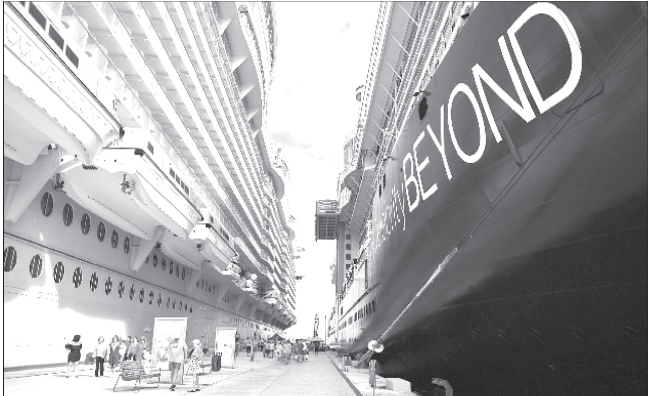
▲ La Sedetur destacó el incremento de 16.9 por ciento en la llegada de cruceristas durante abril de 2024.