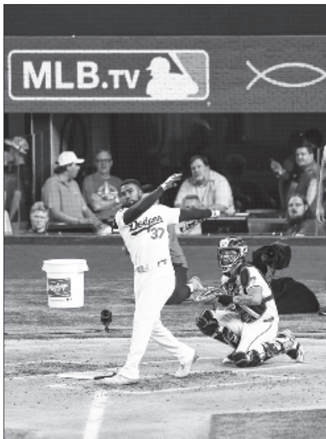
▲ Teoscar Hernández, histórico rey del jonrón. Teoscar Hernández se convirtió en el primer jugador de los Dodgers de Los Ángeles en ganar el Derby de Jonrones al vencer 14-13 a Bobby Witt Jr. en una vibrante final en Arlington.

Burnes tiene marca de 9-4, con efectividad de 2.93 en su primera campaña con los oropéndolas, líderes de la División Este de la Americana. Ganador del Cy Young de la Liga Nacional en 2021, es convocado al Juego de Estrellas por cuarta temporada consecutiva. Se convertirá en el quinto lanzador de los Orioles en abrir un clásico de verano, el primero desde Steve Stone en 1980.