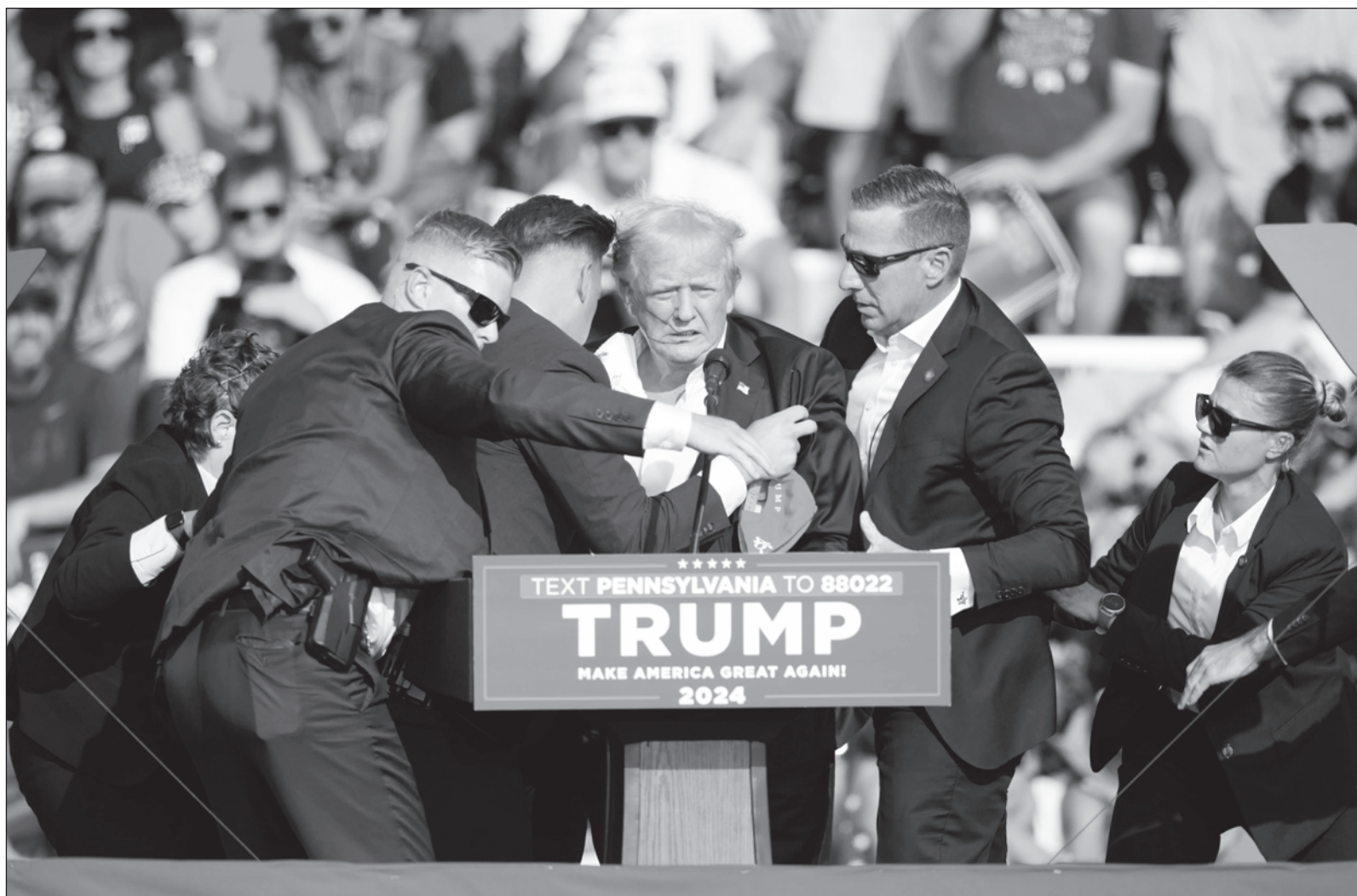
▲ "La forma no es fondo, pero sí puede ser un reflejo de cómo está el interior de un Imperio que vive su etapa final de dominio capitalista global".