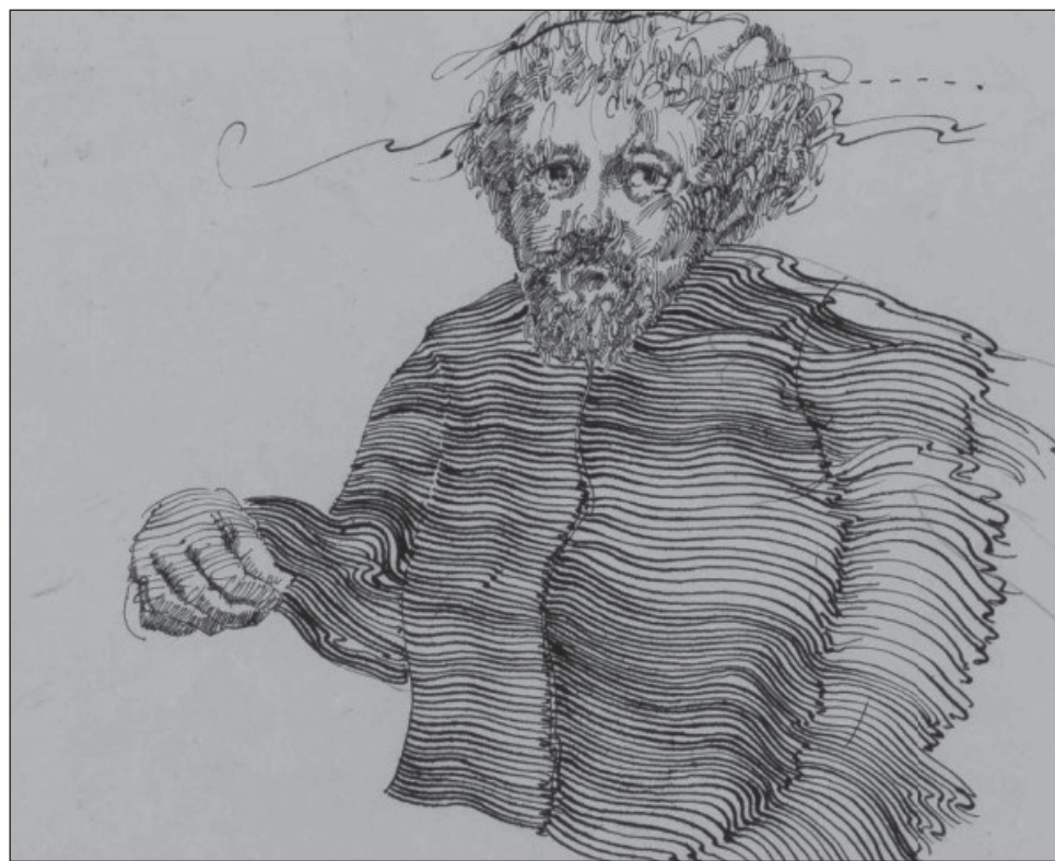
▲ Los 46 dibujos realizados entre finales de la década de 1960 y principios de los 70.