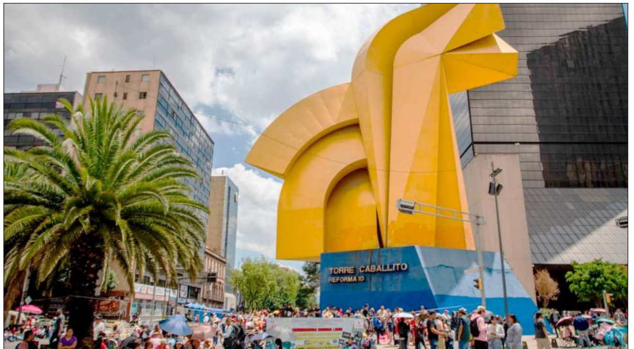
▲ Consultada en su conferencia de prensa matutina si la Secretaría de Gobernación y la Secretaría de Educación Pública buscará una nueva reunión con la CNTE, la presidenta Claudia Sheinbaum indicó que “por lo pronto no”.

“El gobierno ya dio sus propuestas, incluso se propuso en su momento, en la última reunión que se tuvo, una mesa técnica permanente. Ahí están las propuestas y vamos en agosto a la consulta escuela por escuelas para acordar qué cambios debe tener el Usicamm, directamente con los maestros de todo el país”, señaló la mandataria.