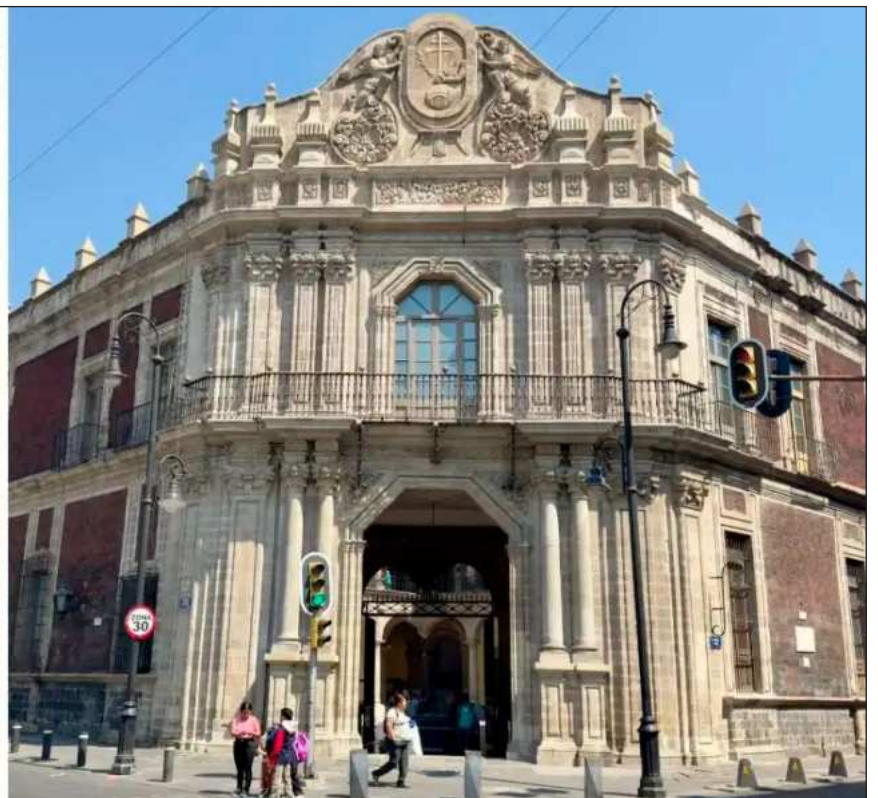
▲ De lunes a domingo, cualquiera puede acceder, asombrarse con las exposiciones de herbolaria, botánica y anatomía. En la fotografía, un aspecto del Patio de Columnas, parte de las Antiguas Cárceles de la Perpetua, y la fachada del Palacio de la Escuela de Medicina.

cules, símbolo del triunfo de la corona española sobre los océanos, y, en la parte superior, dos ángeles custodian el escudo del Tribunal del Santo Oficio: emblema de la fuerza y el poder de la religión sobre el mundo, enmarcado por la leyenda Exurge Domine Iudica Causam Tuam (Levántate, Señor, y juzga tu causa).