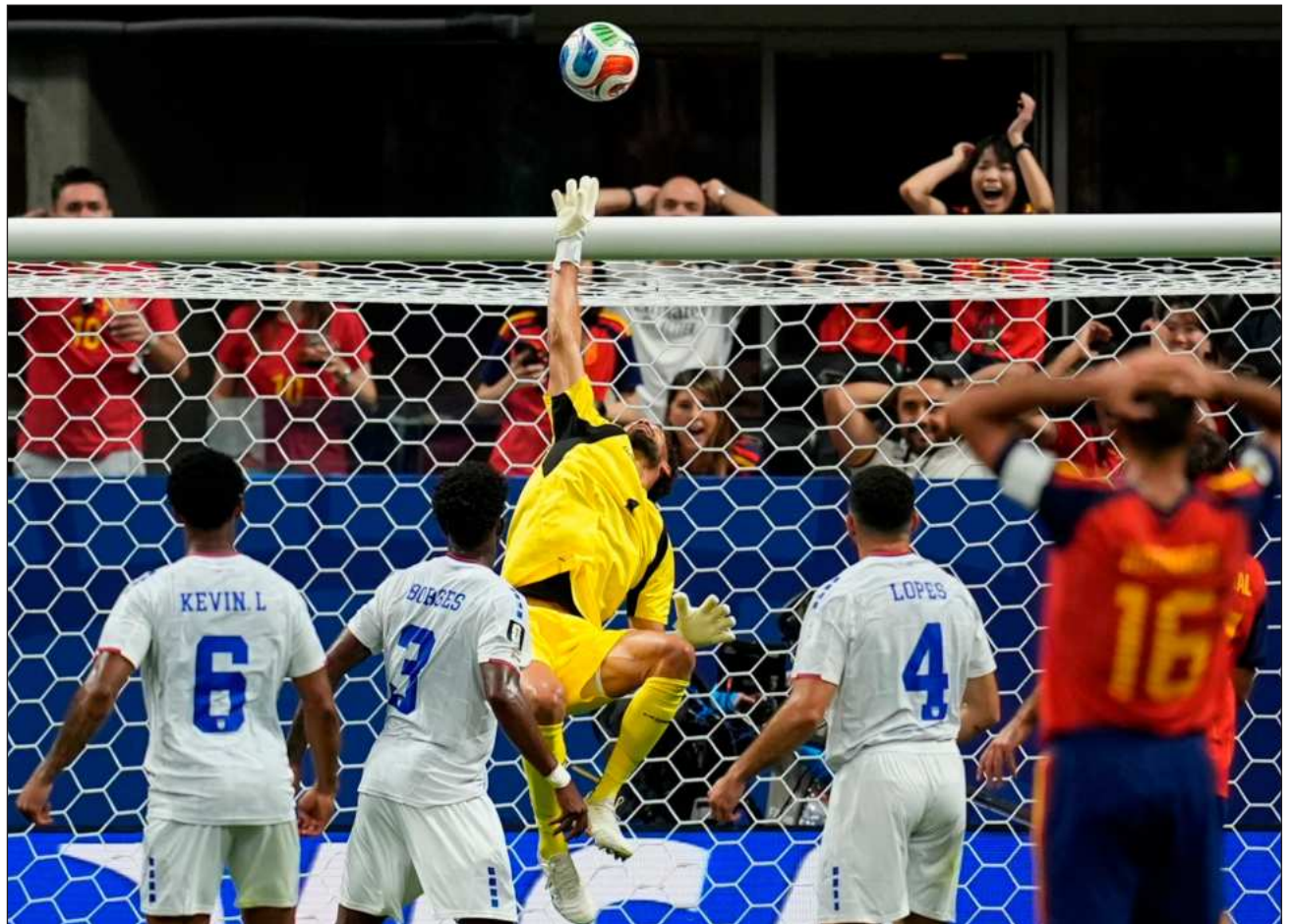
▲ Las ocasiones en que los dirigidos por Luis de la Fuente lograron superar el muro defensivo del conjunto africano, el guardameta Vozinha evitó la caída de su marco con increíbles atajadas, permitiendo a Cabo Verde llevarse un punto.

España tuvo que recurrir a su principal estrella, Lamine