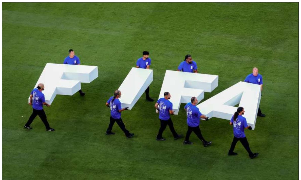
▲ "La FIFA ha convertido todo en mercancía, desde la dignidad de los jugadores como Messi, entregado al poder yanqui-sionista, como los propios tiempos del juego, entrecortados para la oferta de mercancías".