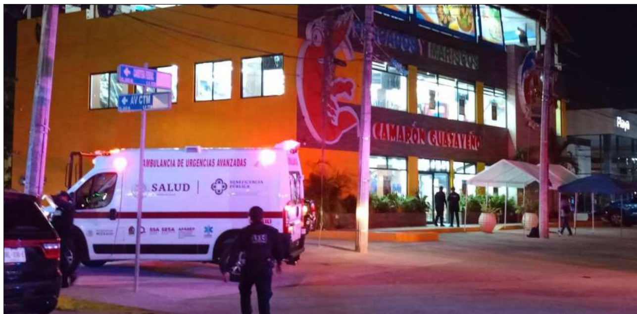
▲ La administración del restaurante afectado anunció en sus redes sociales que cerrará sus puertas hasta nuevo aviso y que ya colabora con las autoridades para esclarecer lo ocurrido, "por respeto a las personas afectadas".

La presidenta municipal de Playa del Carmen, Estefanía Mercado, lamentó los hechos violentos