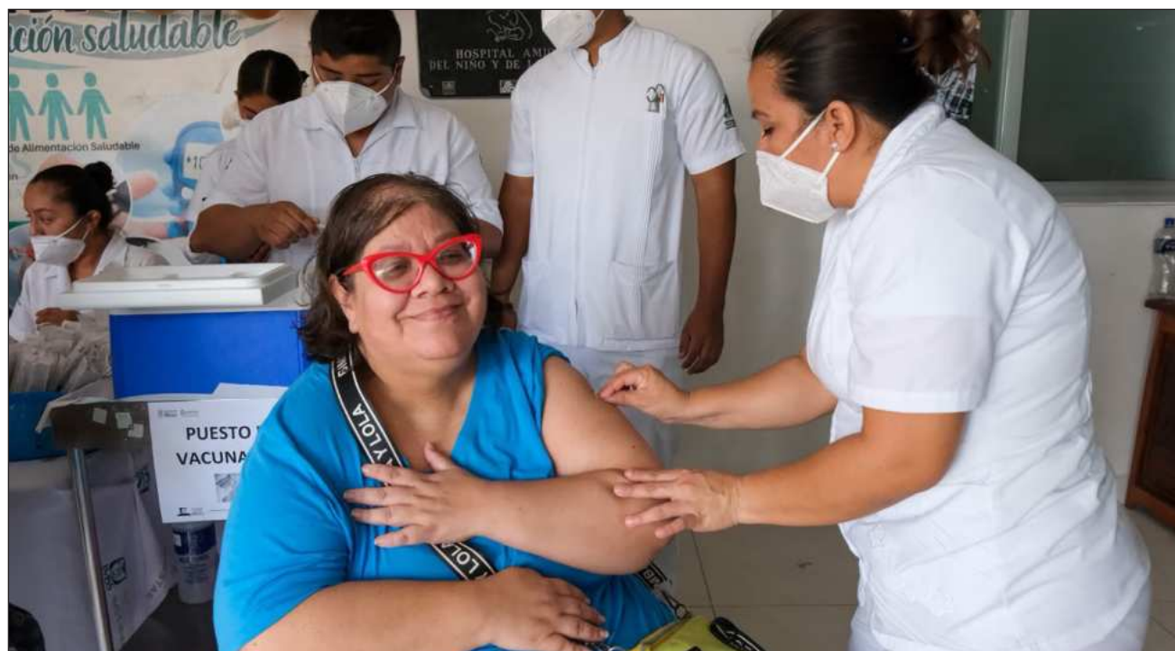
▲ La vacunación continúa siendo una de las herramientas más efectivas para prevenir enfermedades y proteger a la población, por lo que la Secretaría Estatal de Salud mantiene acciones permanentes para acercar los servicios preventivos a la población.

Para lograr su distribución, la Secretaría Estatal