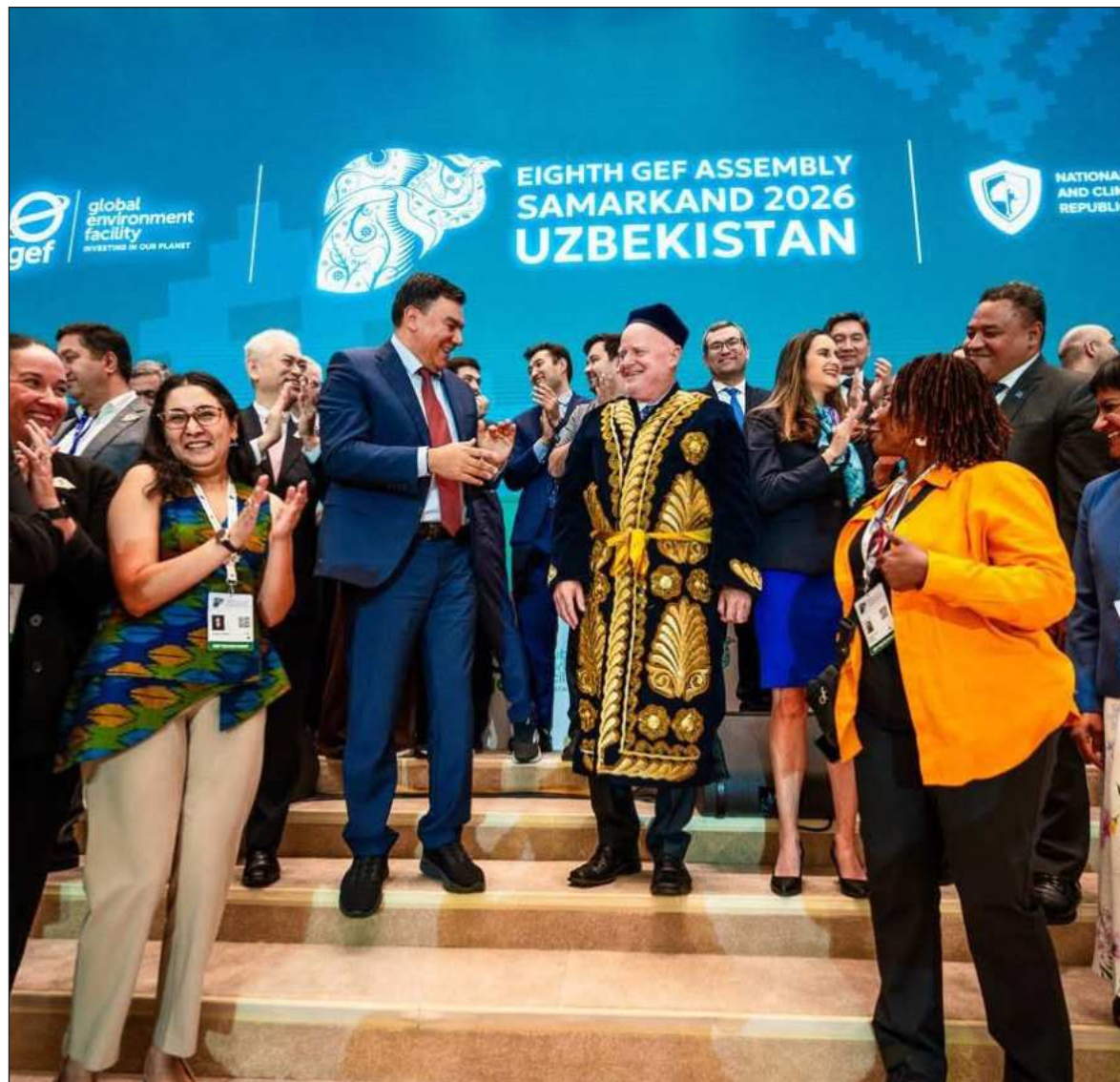
▲ "El FMAM es una organización formada por la ONU, concentra aportaciones de 186 países. Actualmente opera alrededor de 5 mil millones de dólares y para la próxima etapa ya cuenta con casi 4 mil millones".