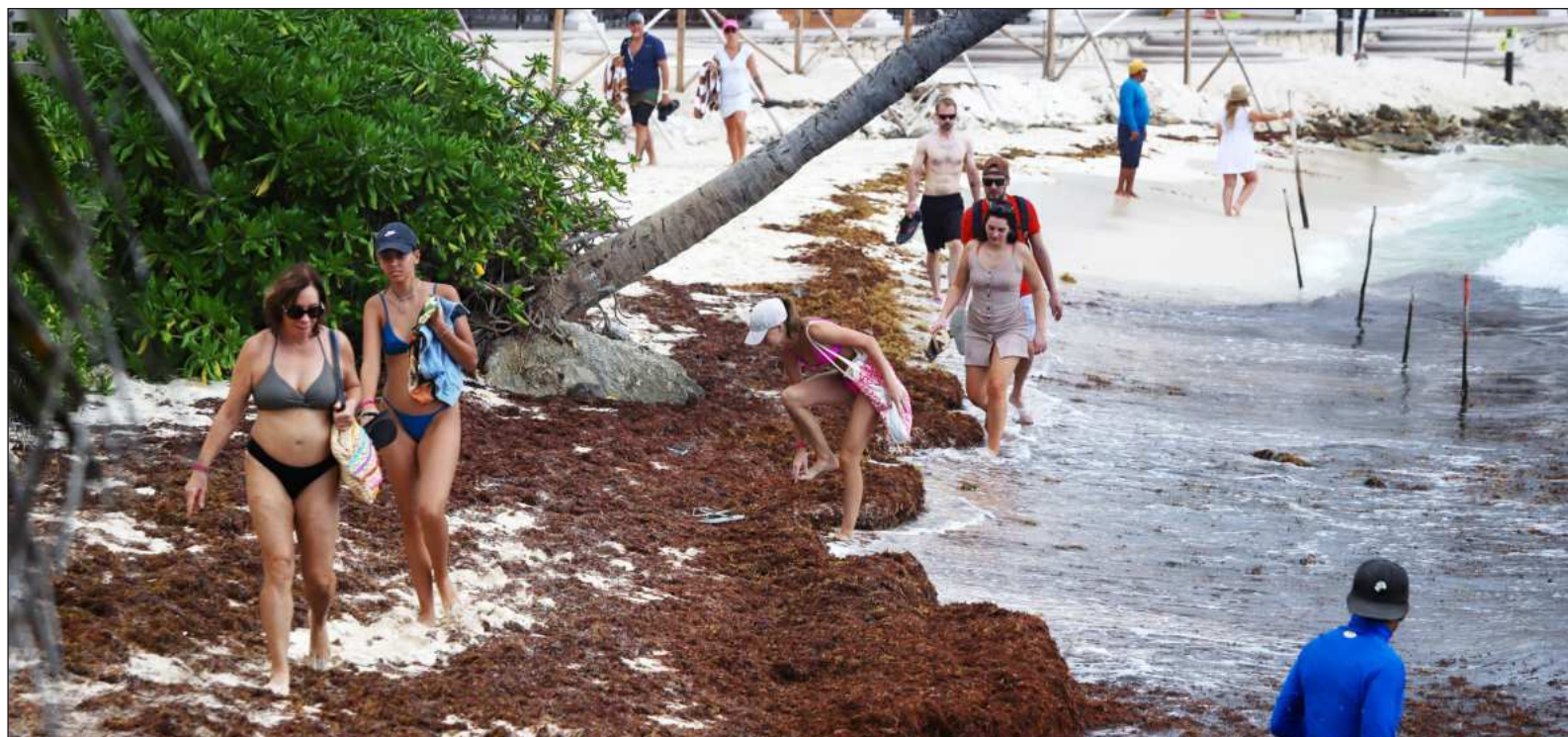
▲ "El crecimiento desmedido del sargazo es la manifestación directa del calentamiento de los océanos y del modelo extractivista global".

*Secretario de Ecología y Medio Ambiente de Quintana Roo