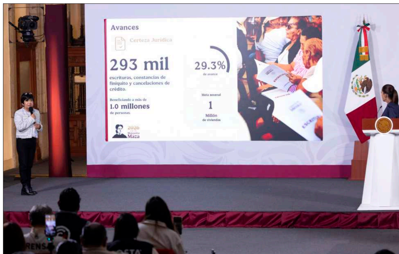
▲ La presidenta Claudia Sheinbaum Pardo destacó que actualmente la vivienda es también accesible para el trabajador de la construcción, así como para mujeres que ganan un salario mínimo y pagan rentas muy altas.

Durante la conferencia de prensa matutina en Palacio Nacional, la presidenta Claudia Sheinbaum Pardo destacó que nunca se había realizado un programa enfocado a quienes ganan entre 1 y 2 salarios mínimos, que son los trabajadores de menores ingresos en el país. Hoy la vivienda es accesible también para el trabajador de la construcción, para mujeres que ganan un sa-