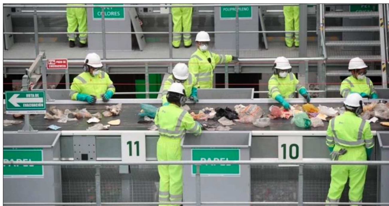
▲ La Profepa lanzó la campaña Gol por el ambiente , y del 19 de marzo al 8 de junio recibió proyectos con el fin de observar qué capacidades y obstáculos presenta el país en materia de circularidad.

Debe “haber un cambio de chip” en la industria y también socialmente