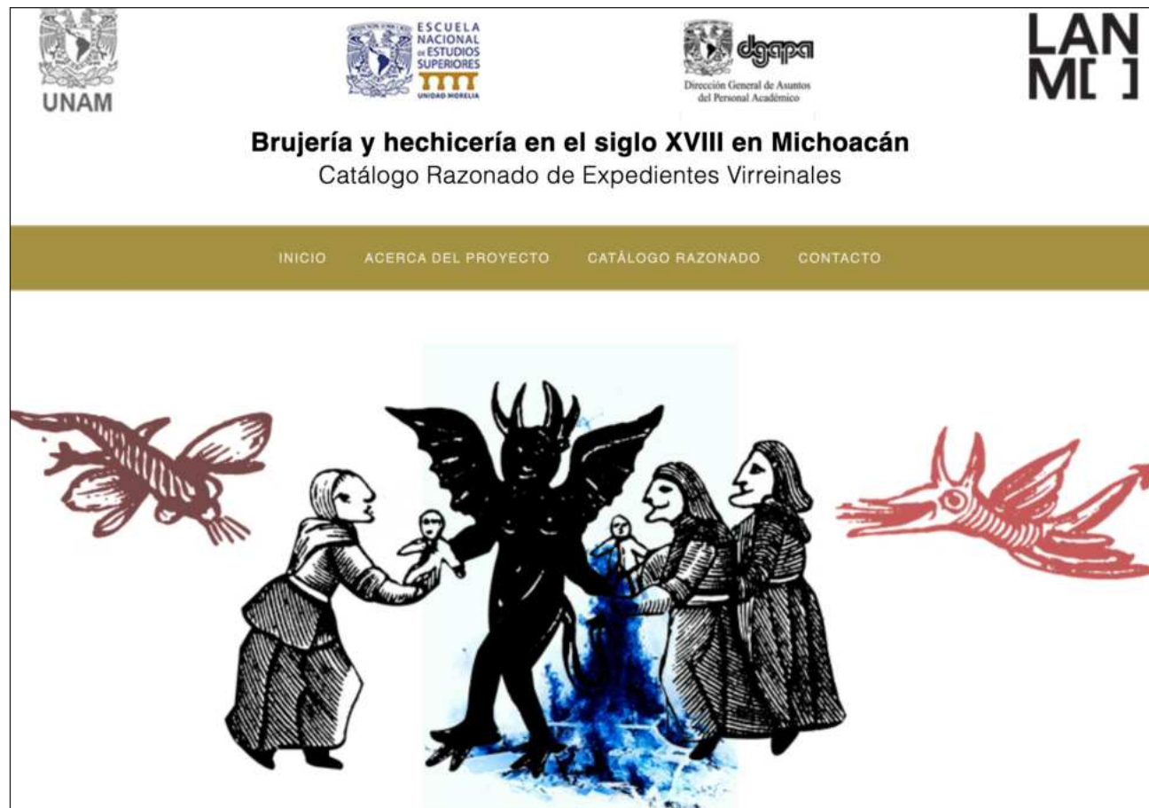
▲ El proyecto se enfocó en 59 de esos oficios, los cuales se relacionan con brujería o hechicería. La investigadora agregó 34 documentos de la serie Procesos criminales , en los que se observa el funcionamiento de la justicia eclesiástica en delitos contra la fe.

Sin embargo, el proyecto aún no está culminado, apuntó. “Por eso, si se revisa con cuidado, se verá que hay unas cosas que están casi en borradores”. Explicó que ante la falta de personal se apoya en sus alumnos de la materia de paleografía, de la licenciatura en literatura intercultural, con quienes transcribe “cada quien un cachito de un expediente”.