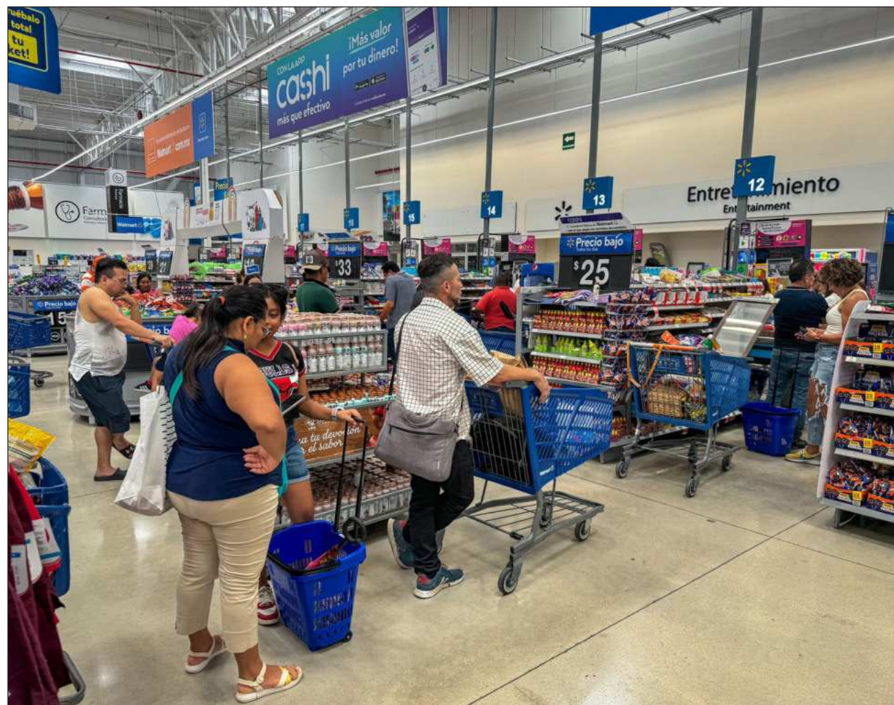
▲ Las ventas en cadenas de autoservicio que llevan por lo menos un año de operación se estancaron.

Entre sus agremiados destacan cadenas como La Comer, Soriana, Chedraui,