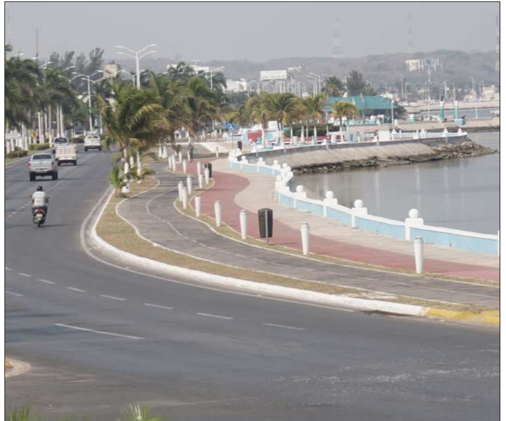
▲ Contemplan 5 mil 400 metros lineales de señalamiento vial, 50 metros cúbicos de nivelación de carpeta asfáltica e instalación de 543 bolardos con base de concreto.

Con respecto al parque, señaló que el inmueble no ha sido entregado al Ayuntamiento desde el término de su construcción, desconociendo el motivo, pues se realizó en la pasada administración estatal; y ahora le darán mantenimiento y buscarán que ya forme parte de los