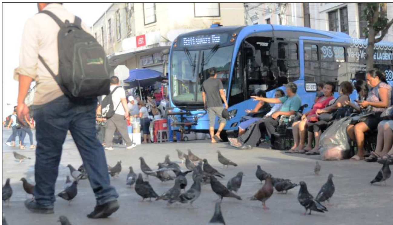
▲ El Centro de Estudios de las Finanzas Públicas define que la deuda subnacional per cápita permite aproximar la carga financiera que correspondería a cada habitante de una entidad federativa para cubrir la amortización total de su endeudamiento.

La deuda per cápita en Yucatán era de mil 974 en 2016 y para el primer trimestre de 2026 llegó a 3 mil 784 pesos; en contraste está Quintana Roo que pasó de 21 mil 242