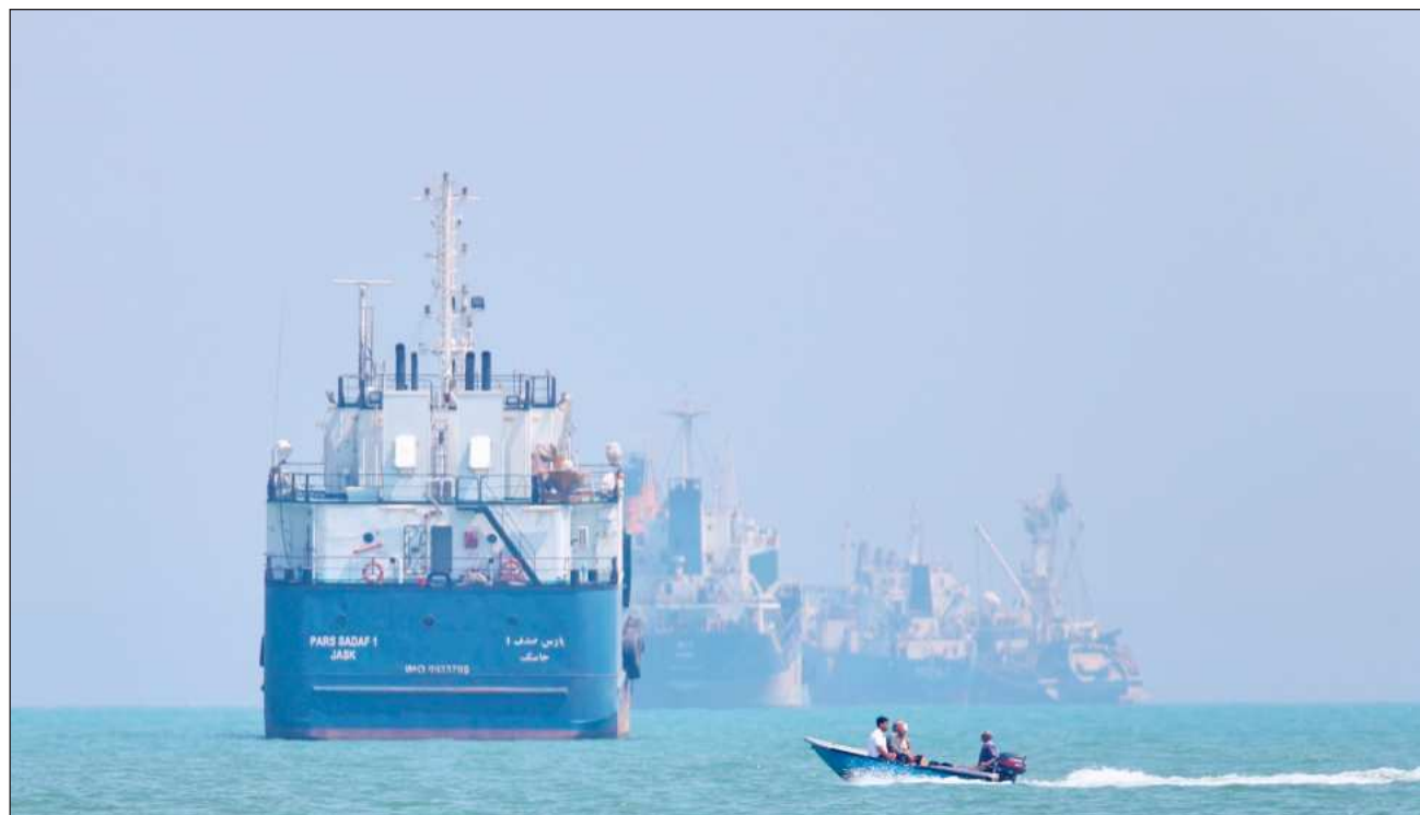
▲ El mandatario norteamericano aseguró además que no necesitan “muchísima ayuda” para reabrir Ormuz, ante la iniciativa liderada por Francia y el Reino Unido para lanzar una coalición que garantice la seguridad en este paso clave para el comercio.

El mandatario norteamericano aseguró además que no necesitan “muchísima ayuda” para reabrir Ormuz, ante la iniciativa liderada por Francia y el Reino Unido para