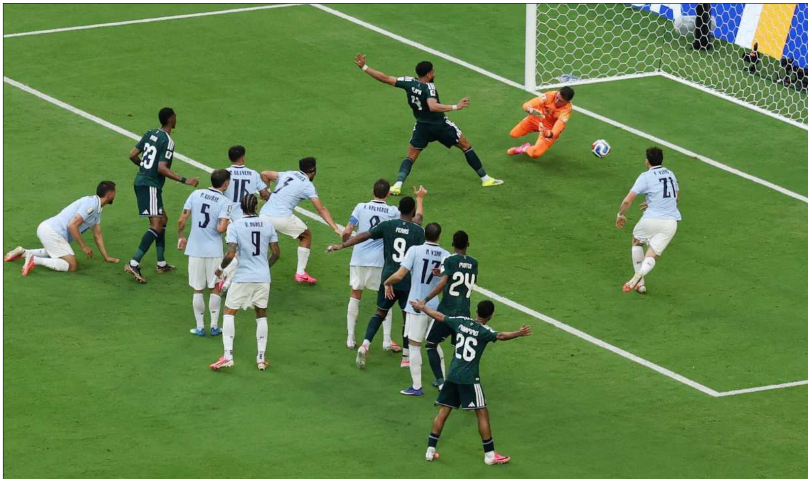
▲ En una noche en que marcó un hito, el arquero uruguayo Fernando Muslera había abierto la opción para otro triunfo no presupuestado de los Halcones Verdes .