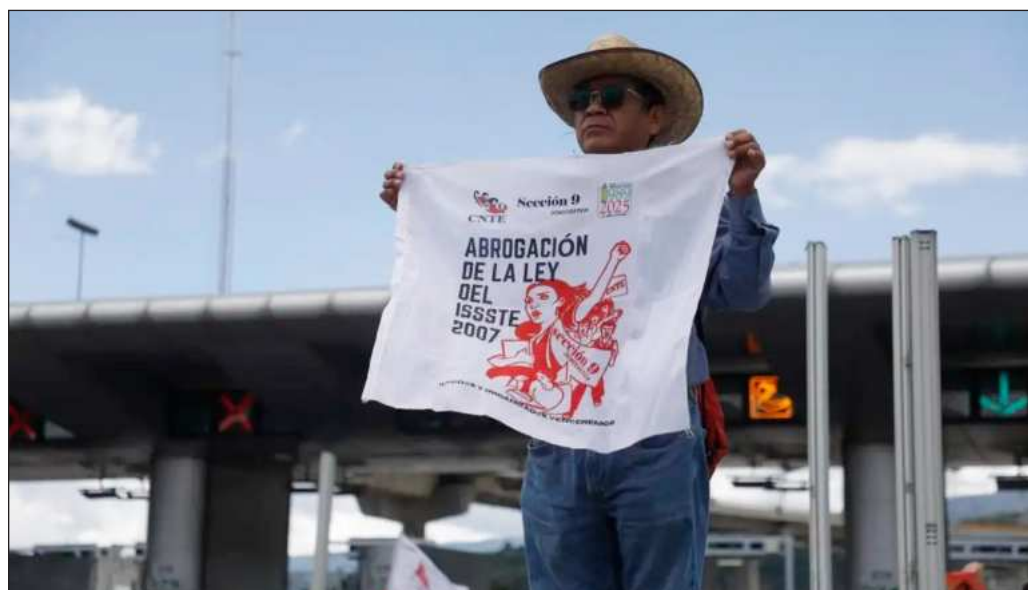
▲ El diálogo se ha cerrado, pero únicamente para la dirigencia de la CNTE, que desde un principio debió entender que es imposible regresar el tiempo hasta 2006.

El diálogo se ha cerrado, pero únicamente para la dirigencia de la CNTE, que desde un principio debió entender que es imposible regresar el tiempo hasta 2006. Para los docentes viene una oportunidad de hacer llegar de viva voz sus planteamientos para mejorar sus condiciones laborales, movilidad en el escalafón y eventual retiro.