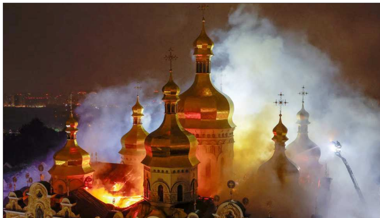
▲ Uno de los incendios afectó la cubierta de la catedral ortodoxa de la Dormición, ubicada en el complejo del Monasterio de las Cuevas de Kiev, inscrito en el Patrimonio Mundial de la Unesco, indicó el alcalde de la capital, Vitali Klitschko.

En Kiev, los bombardeos rusos alcanzaron en esta ocasión numerosos barrios de la ciudad y causaron al menos cinco muertos y 34 heridos, según las autoridades locales. Otras cinco personas -cuatro rescatistas y un funcionario municipal- murieron en la