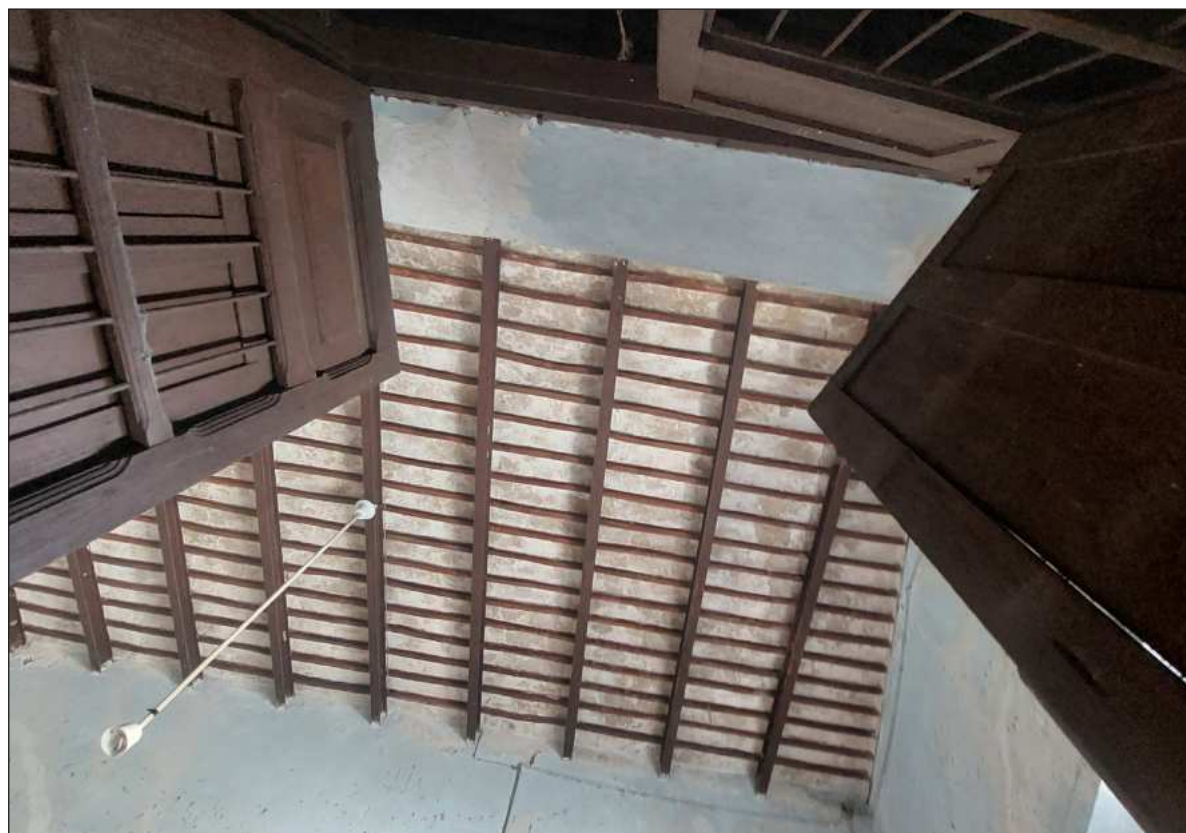
▲ “La tecnología arquitectónica de una sociedad, como parte de su arquitectura, constituye una manifestación de su cultura y una evidencia de su devenir histórico; por ello, es un objeto de conservación en sí mismo.”.

DE ESTA MANERA la conservación de la tecnología constructiva