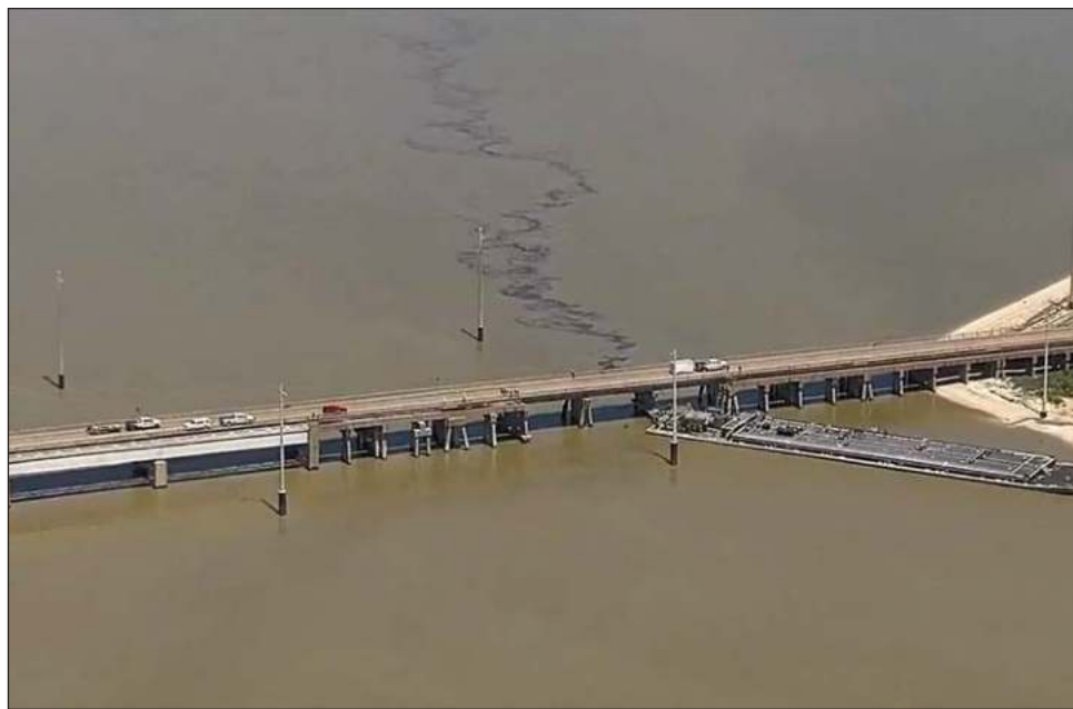
▲ El accidente del miércoles arrojó a un hombre fuera del barco y al agua, pero se recuperó rápidamente y no resultó herido, dijo la Oficina del Sheriff del condado de Galveston.