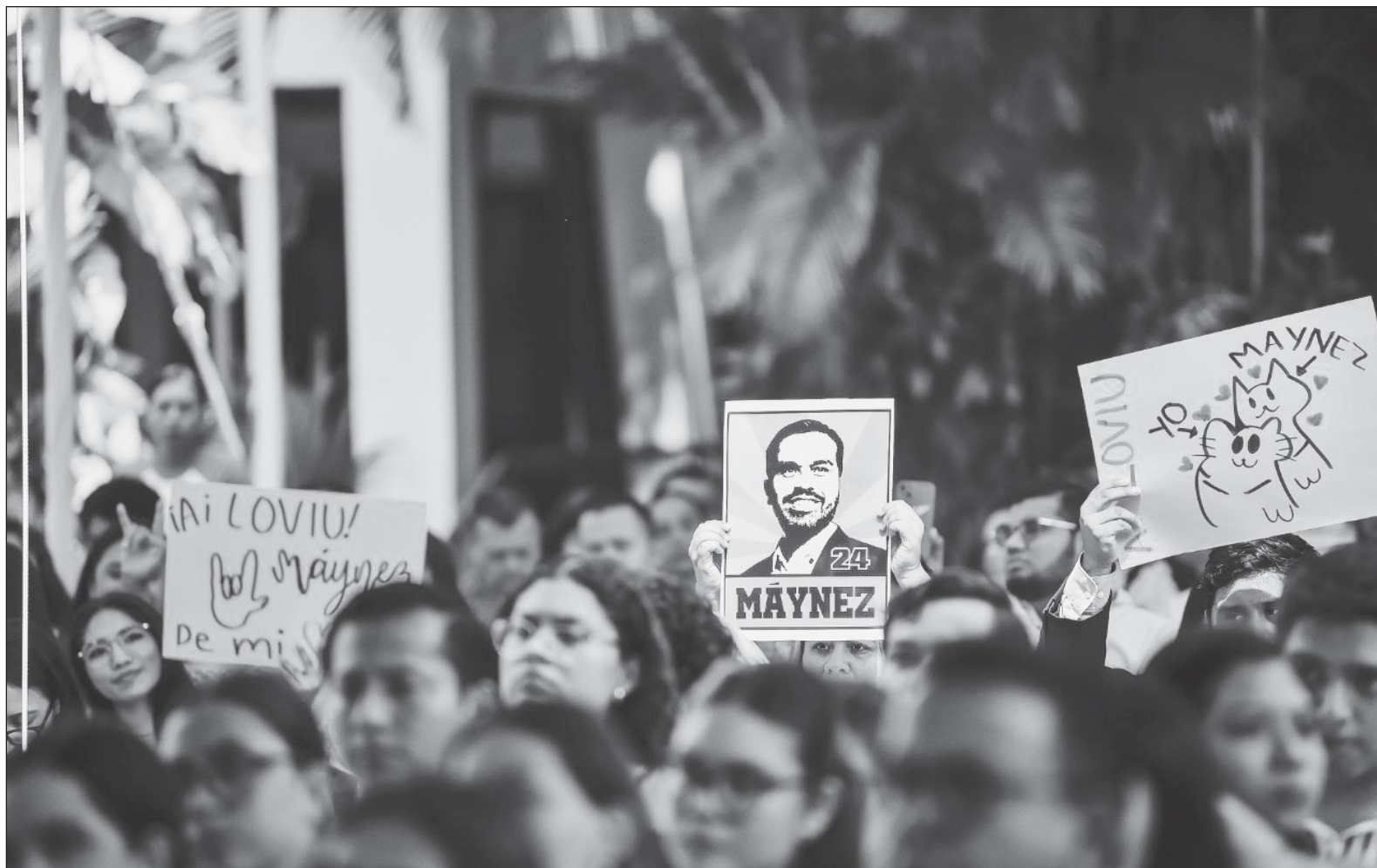
▲ "El mérito de Álvarez Máynez ha sido mantener la mesura por encima de los aspavientos y el estruendo".