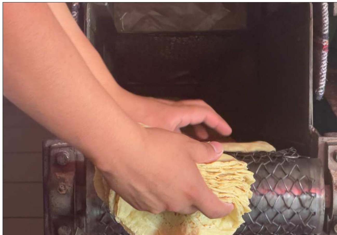
▲ El Consejo Nacional de la Tortilla (CNT) amagó con subir entre dos y cuatro pesos el precio del kilo de la tortilla en los próximos días; luego, la UNIMT negó el incremento y señaló que no corresponde a la realidad del mercado.

La mayoría de las asociaciones nacionales de la industria de la masa y la tortilla y las principales empresas harineras participan en el Acuerdo Nacional Maíz-Tortilla, en el que han asumido