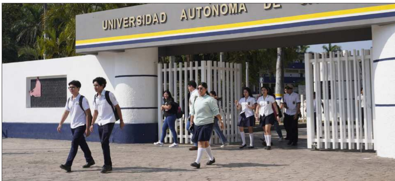
▲ El diagnóstico del Sistema Nacional de Educación Superior en México reconoce una expansión acelerada en su matrícula, pues en menos de dos décadas se duplicó de 2.5 a 5.5 millones de estudiantes entre 2005 y 2025.

Desde 2017, la cifra de alumnas inscritas superó de manera sostenida al de los varones