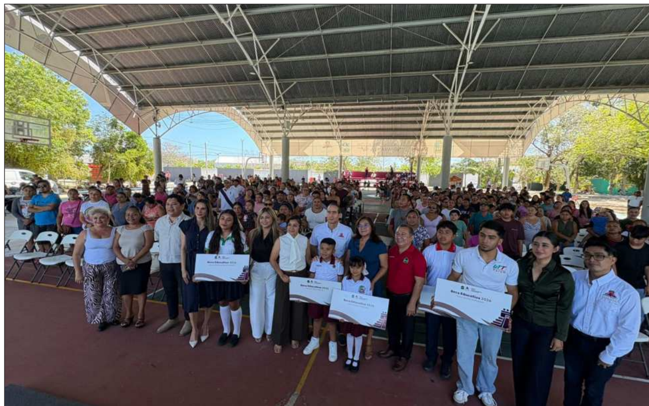
▲ De acuerdo con las autoridades educativas, en nivel primaria se asignaron 440 becas, mientras que 430 se dirigieron a estudiantes de secundaria y personas con discapacidad. Además, se otorgaron 80 apoyos para nivel medio superior y 50 para nivel superior.

Además, se otorgaron 80 apoyos para nivel medio superior y 50 para nivel superior. Autoridades educativas señalaron que la entrega corresponde a los meses de enero a marzo, y forma parte del programa municipal de apoyos escolares. También se indicó que el número de becas ha aumentado en comparación con