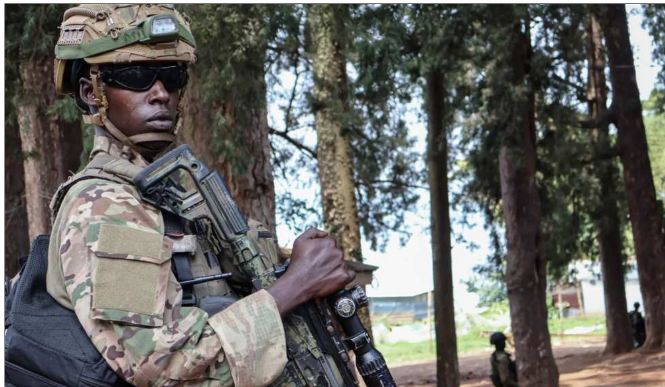
▲ Desde el lunes, las agrupaciones rebeldes congoleñas han mantenido reuniones con el gobierno de Kinshasa.

El mecanismo, que opera en colaboración con la fuerza de paz de Naciones Unidas (MONUSCO) tiene una naturaleza técnico-militar y al crearse fue constituido por oficiales de los países de la Región de los Grandes Lagos, en particu-