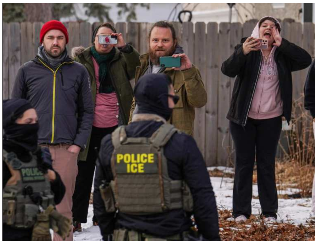
▲ Es apremiante la obligación del Estado mexicano de presionar a sus pares en Washington con el fin de que efectúen investigaciones reales, creíbles y orientadas por la búsqueda de la verdad.

En suma, cabe esperar que se cumpla el propósito de la cancillería de “utilizar todas las vías legales y diplomáticas disponibles para esta situación”, así como de mantener un “inequívoco compromiso de velar por la protección y la dignidad de todas las personas mexicanas en el exterior, sin importar su situación migratoria”. Es cierto que México no puede obligar al gobierno estadounidense a respetar la legalidad internacional y las propias normas internas que le son de cumplimiento formalmente ineludible, pero la dignidad humana y la enorme deuda que nuestro país tiene con su población migrante imponen al Estado un deber moral de agotar todos los recursos a su alcance en defensa de los connacionales perseguidos por el trumpismo.