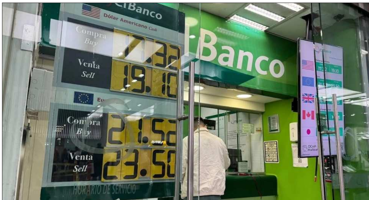
▲ La FinCEN acusó a CIBanco Intercam y Vector de facilitar lavado de dinero a organizaciones criminales.

La modificación permite ciertas transferencias de fondos para permitir los pagos