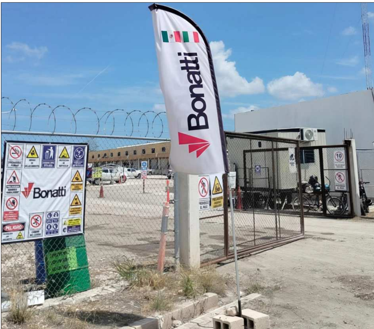
▲ Informes de los volqueteros de la CNOP, tras reunirse el lunes con los representantes de la empresa en Campeche, sería durante el transcurso de lunes y martes cuando se realizaría el pago.

Jiménez Hernández, subrayó que uno de los principios de la restauración es que las intervenciones sean perceptibles a corta distancia, de modo que se pueda distinguir entre el original y los añadidos, mientras que a simple vista la pieza conserva una apariencia homogénea.