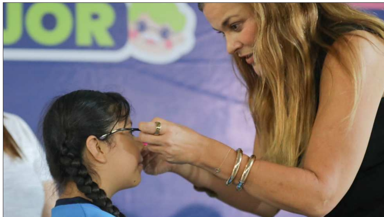
▲ El programa ha beneficiado a 8 mil 639 personas en situación de vulnerabilidad.

En lo que va de la actual administración, el