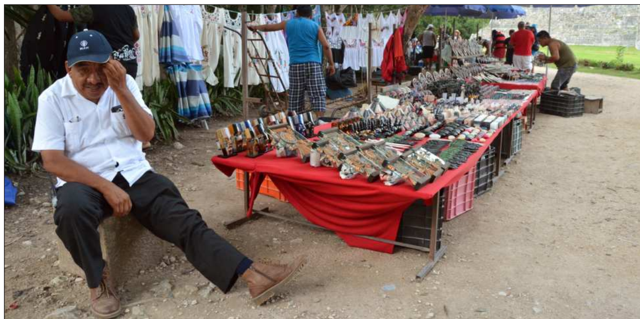
▲ Integrantes del Comité acusan que la inauguración del Centro de Atención a Visitantes de Chichén Itzá, ocurrida el pasado 27 de marzo, se pretende desplazar a las y los artesanos dos kilómetros de su zona habitual de venta.

“Este racismo histórico es lo que nos trae el día de hoy, pues a nosotros como pueblos mayas, nos quieren sacar de nuestro sitio sagrado, el lugar que ha sido nuestra fuente