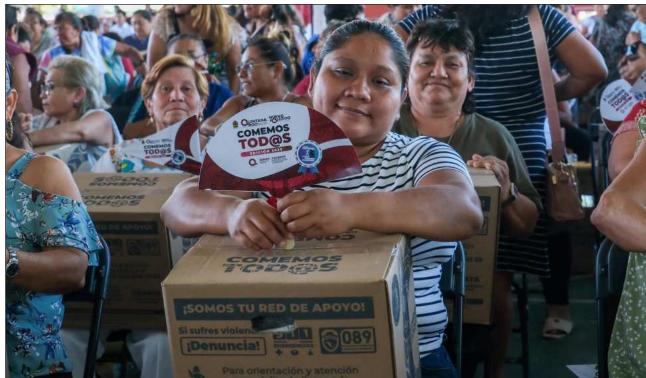
▲ Además de la alimentación, la conectividad se ha convertido en una prioridad para el desarrollo de las familias quintana-roenses; el programa de Bienestar ha distribuido 40 mil tarjetas SIM en el estado.

El proyecto incluye la atención de 26 canchas de fútbol -23 de fútbol 5, dos de fútbol 7 y una de fútbol 11-, así como la rehabilitación de 20 multicanchas. Las obras abarcan desde la construcción hasta la dignificación de espacios, con instalación de pasto sintético, iluminación, drenaje, porterías y cercado peri-