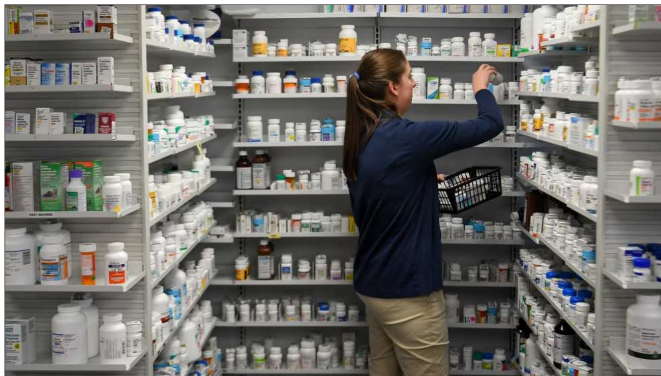
▲ El Sistema Nacional de Trazabilidad de los Medicamentos permitiría conocer los procesos de compra, almacenamiento, licitación y aplicación de fármacos distribuidos en las instituciones públicas de salud del país.

El dirigente panista reclamó que la aplicación de este fármaco pirata causó secuelas en el paciente, lo que calificó como un descuido “criminal” y propuso que establezca un Sistema Nacional de Trazabilidad de los Medicamentos para conocer quién compra, quién