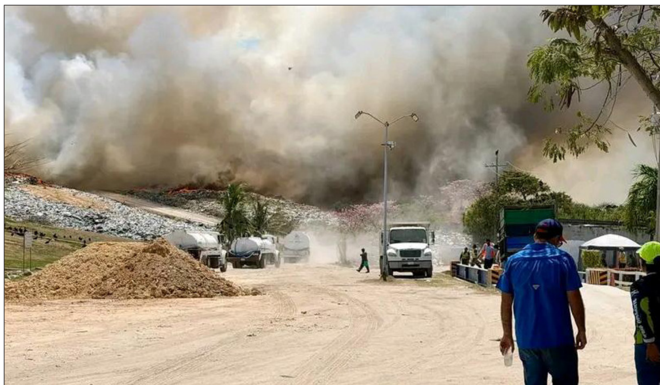
▲La Dirección de Protección Civil Municipal considera que ha logrado contener el incendio, sin embargo, reconoce que con un cambio en las corrientes de aire el fuego puede reanimarse.

Con el apoyo de personal de Protección Civil Municipal y de la Secretaría de Marina, las llamas fueron contraladas, pero se estima