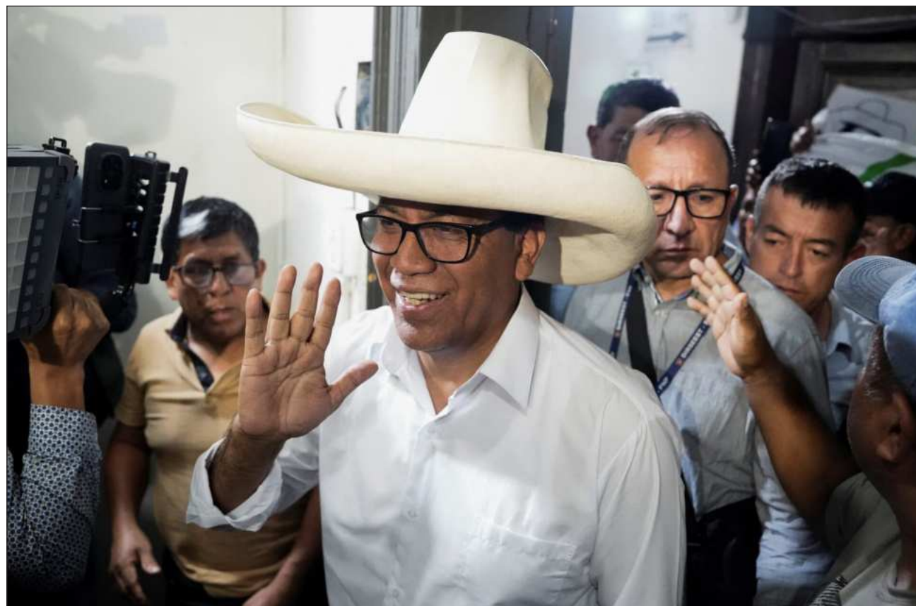
▲ Roberto Sánchez, de Juntos por el Perú, fue ministro de Comercio Exterior y de Turismo bajo Pedro Castillo.

Sánchez, psicólogo de 57 años y heredero político del ex presidente Pedro Castillo (2021-2022), creció en particular el martes en el cómputo que lleva la Oficina Nacional de Procesos Electorales (ONPE),