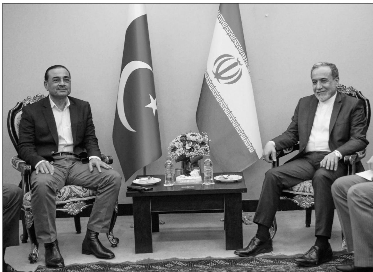
▲ Pakistán se ha convertido en un mediador clave en el conflicto tras acoger raras conversaciones directas entre EU e Irán.

La delegación paquistaní incluye al ministro del Interior y a otros altos funcionarios de seguridad de Pakistán. Asimismo, este país se ha convertido en un mediador clave en el conflicto después de que acogió raras conversaciones directas entre EU e Irán en Islamabad, una medida que, según las autoridades, ayudó a reducir las diferencias.