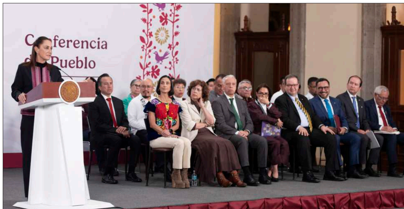
▲ No hay una decisión tomada, “la vamos a tomar en términos del conocimiento científico” dijo Sheinbaum.

No hay una decisión tomada, “la vamos a tomar en términos del conocimiento científico, no como una decisión de la presidenta, sino incorporando a científicos de tratamiento de agua, geólogos, ingenieros, ingenieras petroleras, especialistas en trata-