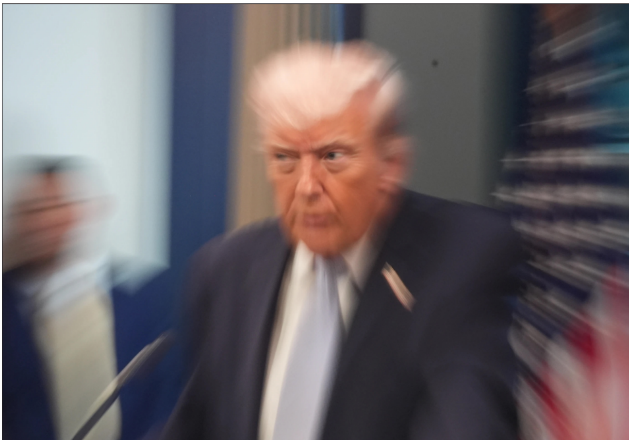
▲ Aunque Trump no podrá tener un tercer mandato, buscará mantener el control del partido Republicano.

Bajo la Constitución, el presidente tiene prohibido buscar un tercer periodo (aunque juega a que lo contempla), pero desea mantener control del Partido Republicano y de MAGA, y si no se lanza por lo menos buscará coronar a su sucesor.