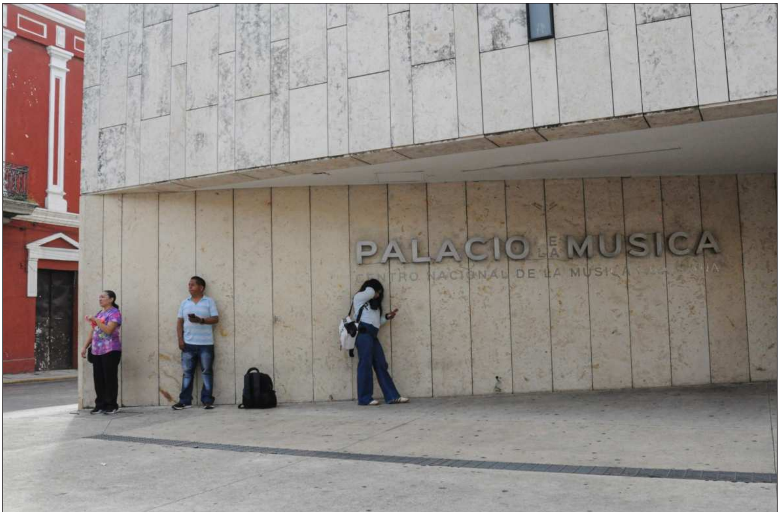
▲ "Siempre estamos esperando algo: algo diferente, algo que deseamos o que no deseáramos que pasara, algo que aún no sabemos nombrar".