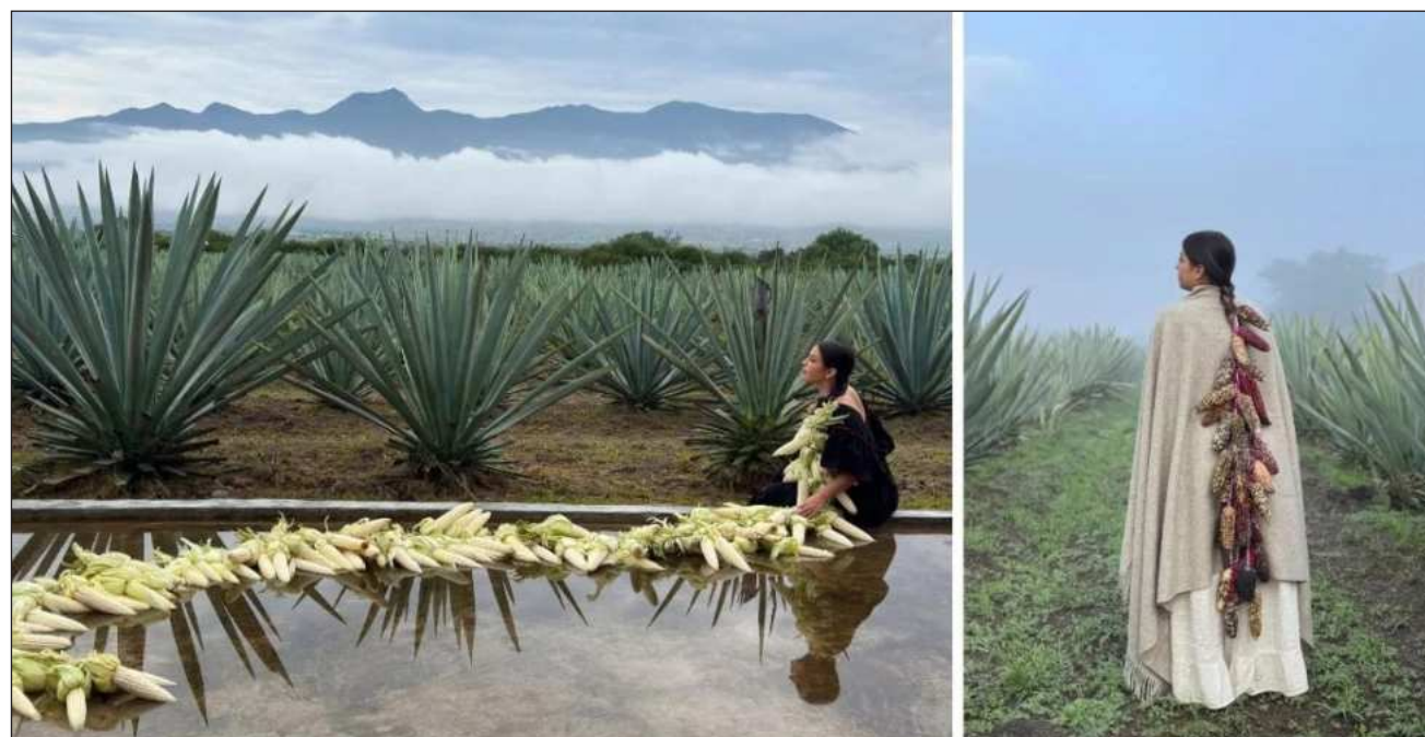
▲ La trenza y el mezcal se presenta en el foro Dahlia del Jardín Botánico ubicado en la UNAM.

La elaboración de trenza de maíz es muy común en-