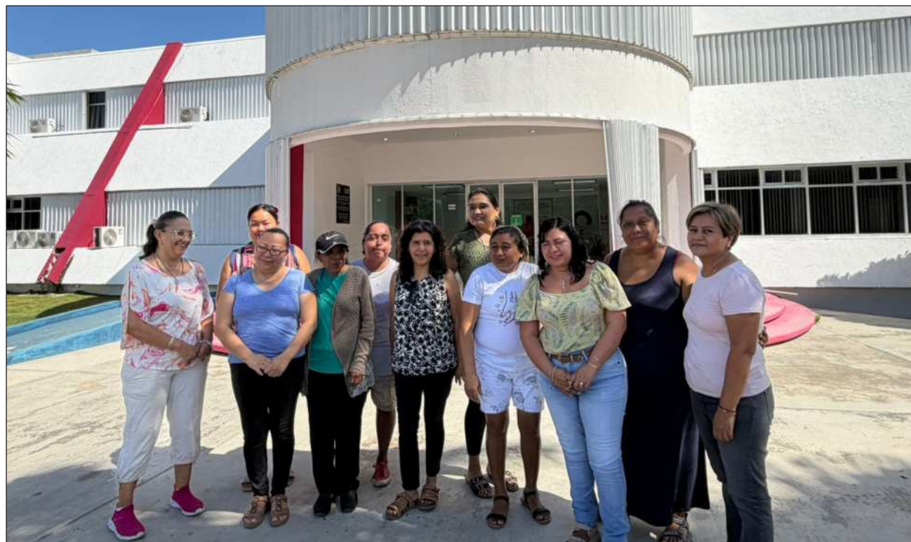
▲ Las madres de familia del CAM acudieron a las instalaciones de la Secretaría de Educación para demandar un sistema que funcione diariamente en horarios regulares a fin de fortalecer el aprendizaje en lectura y escritura.

La preocupación crece conforme se acerca el cierre del ciclo escolar, en julio, pues no existen espacios públicos adecuados que garanticen la continuidad académica y el desarrollo integral de estos alumnos.