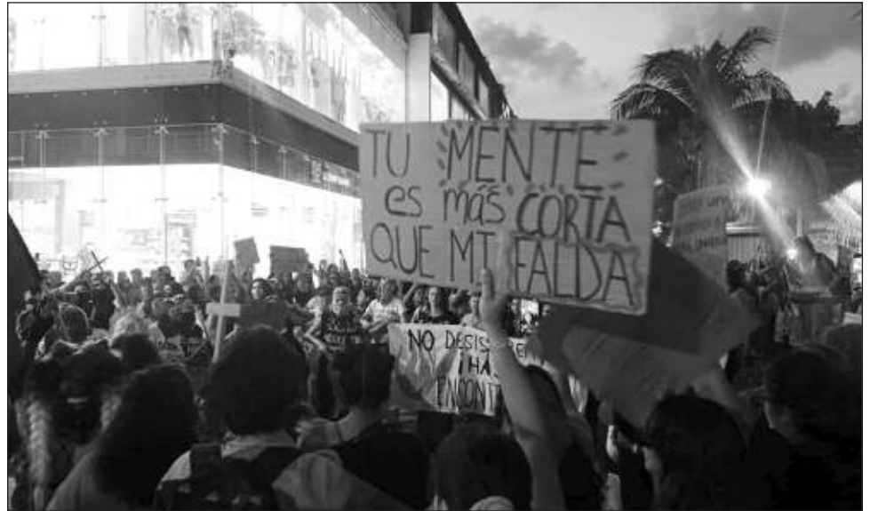
▲ La violación es un delito que va en aumento en Quintana Roo: en 2021 se reportaron 2 mil 553 delitos sexuales (794 violaciones) y para 2022 fueron 2 mil 832.

Salvador Guerrero destacó la importancia de fomentar una cultura de prevención de delitos de alto impacto en Quintana Roo a través de la tecnología y presentó la aplicación llamada No