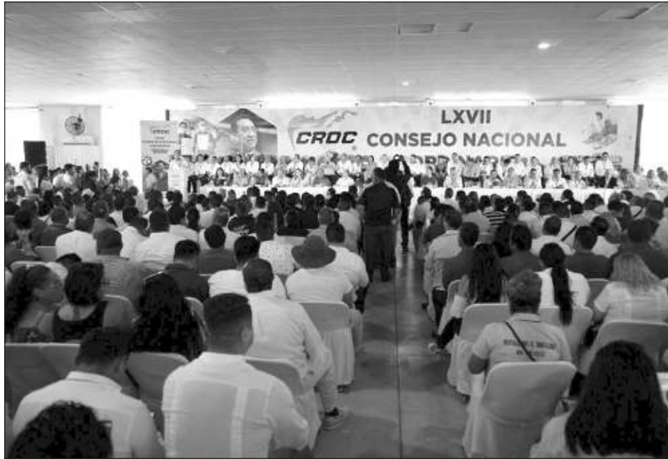
▲ En el LXVII Consejo Nacional Ordinario de la CROC, celebrado en Cancún, la secretaria federal de Trabajo afirmó que la prioridad es el respeto a los derechos laborales.

“Se han generado muchos empleos y la verdad es que eso nos ha permitido recuperar y va aumentando el salario promedio, todavía hay que seguir empujando más el salario en esta región, pero hemos avanzado”, compartió la funcionaria federal en entrevista luego de su participación en el LXVII Consejo Nacional Ordinario de la Confederación Revolucionaria de Obreros y Campesinos (CROC), celebrado este miércoles en Cancún.