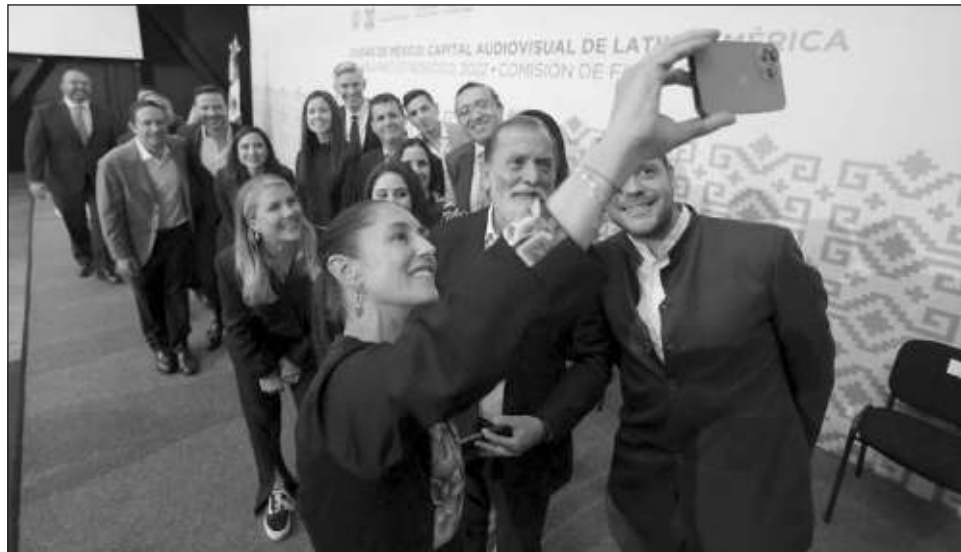
▲ “Los sentimos muy orgullosos de que estén aquí, son los principales estudios a nivel internacional y particularmente de Estados Unidos”, destacó la jefa de gobierno.

“Hoy la Comisión de Filmaciones de la Ciudad de México, a diferencia de muchas otras en el país, da un permiso prácticamente en 24 horas; lo que antes representaba meses. Pero no sólo eso, sino que se acompaña a las industrias