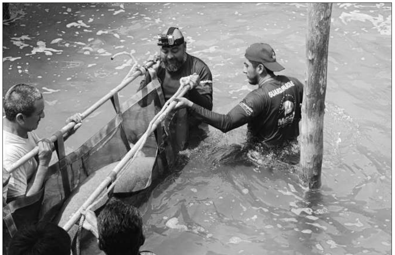
▲ El manatí fue rescatado en 2021, tiempo desde el cual se mantiene bajo cuidado humano.