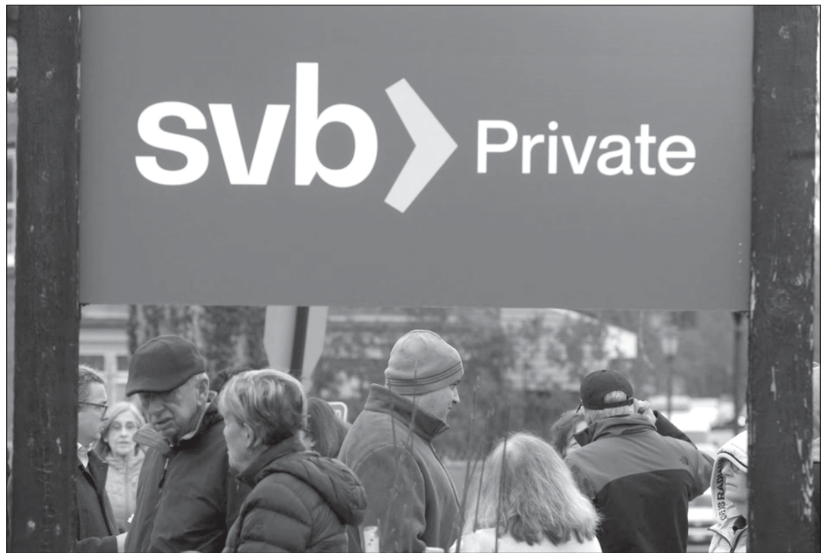
▲ "SVB could not meet the demand for cash since it was locked into bonds which due to rising interest rates had lost value. They now needed to raise funds to cover their losses".

SVB WAS THE 16th largest U.S. bank, and this is the worst banking collapse since the great recession of 2008.