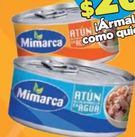
Atún desmenuzado en agua o aceite MIMARCA lata de 130 gr.