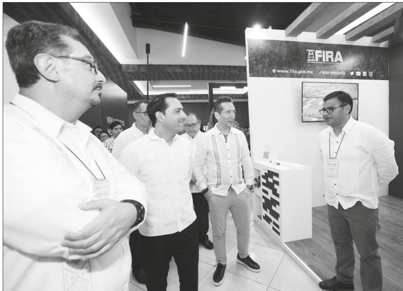
▲ La Asociación de Bancos de México eligió a Yucatán para organizar la Expo Mundo PYME ABM, que se llevó a cabo en la capital hasta este jueves 16 de marzo, y la 86 Convención Bancaria del conglomerado.