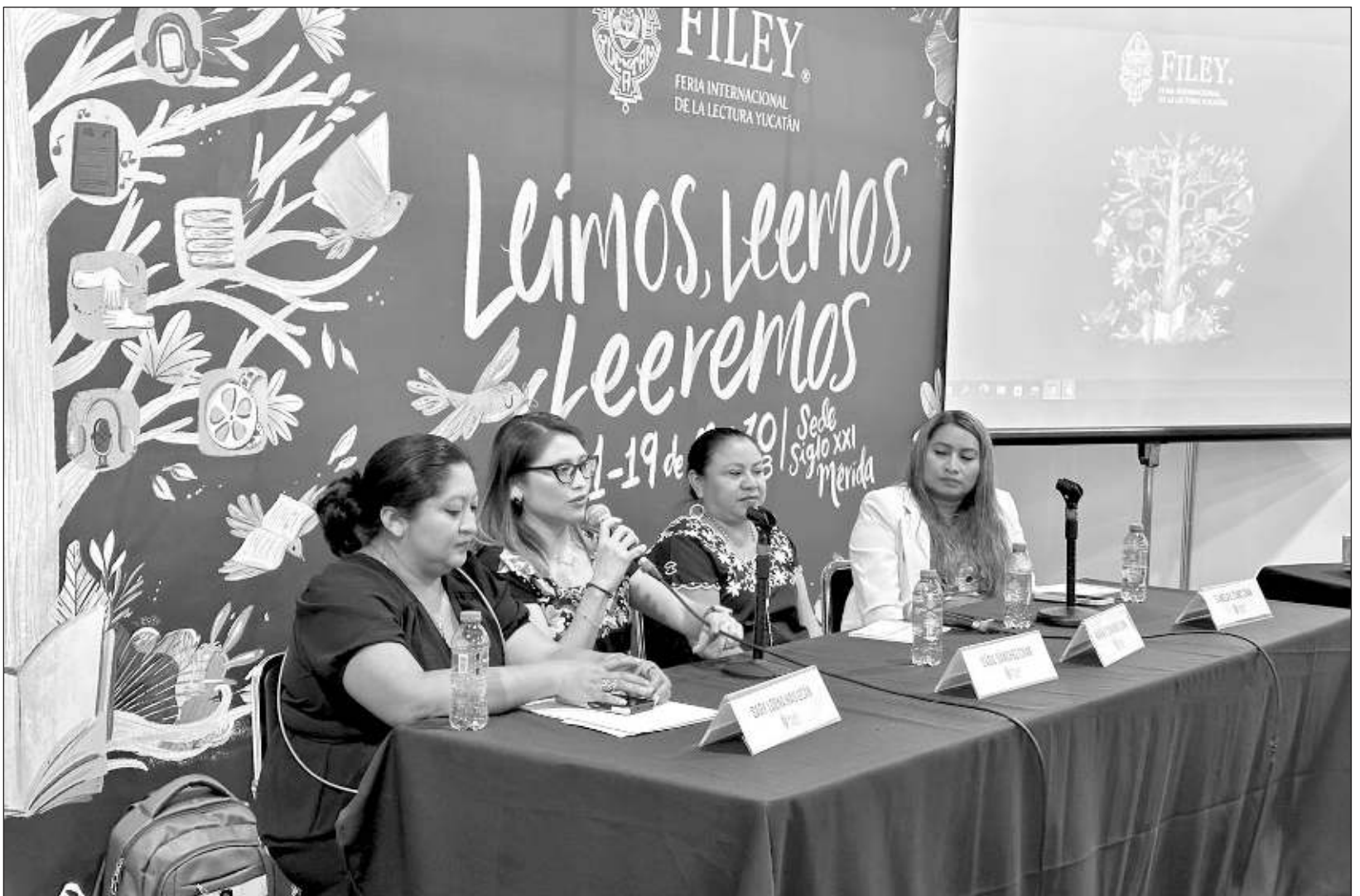
▲ La lingüista reflexionó que no solamente se trata de la escritura y los textos en lengua maya, sino también en cómo éstos son presentados al público; destacó que realizar este tipo de producción literaria es un esfuerzo y también hay que procurar la creación de lectores.

“Si uno lee en español, ya lo puede hacer en maya”, dijo. Sin embargo, reconoció que “si no llegamos y les decimos está en maya automáticamente nosotros que siempre aprendimos a través del español, siempre decimos, no es que está difícil, no puedo leerlo”.