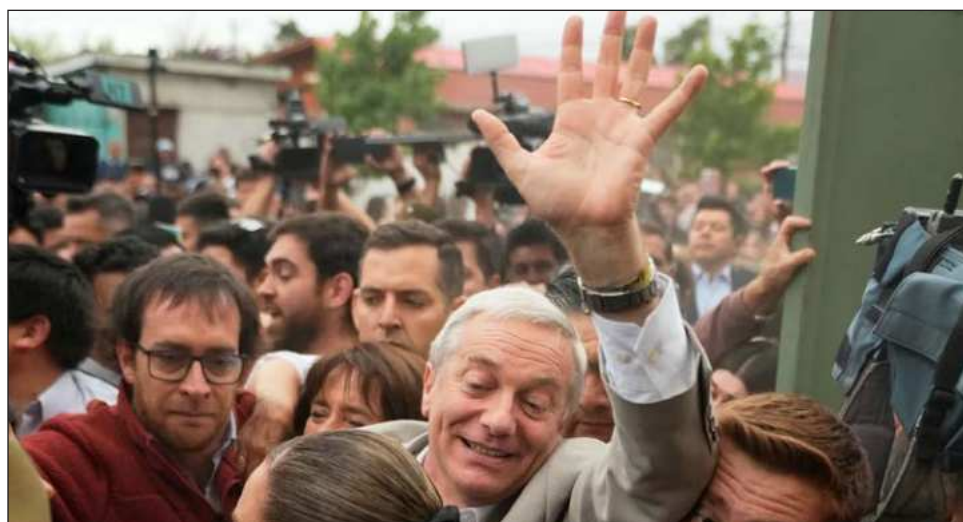
▲ José Antonio Kast agradeció las palabras de felicitación de Gabriel Boric y adelantó confiar en que "esta sea una transición muy ordenada, respetuosa".

"Usted ha sido electo presidente de la República de Chile y, por lo tanto, de todos los chilenos y chilenas", dijo Boric, quien reconoció que Kast obtuvo "un triunfo claro" respecto a su contendiente. "Y eso usted sabe, es una gran responsabilidad que hay que abordar con