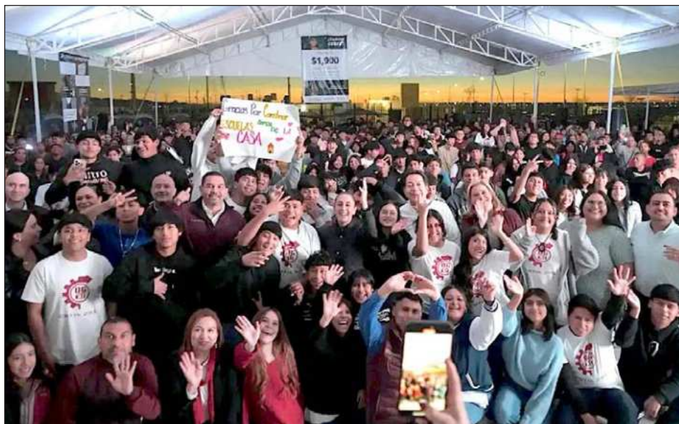
▲ Durante su gira por esa entidad, la jefa del Ejecutivo visitó ese plantel de bachillerato, como parte del proyecto de su administración para ampliar la matrícula en ese nivel de estudios.

En la ciudad fronteriza también inauguró, en un emotivo encuentro se dijo en un comunicado emitido anoche, el segundo Centro LIBRE, donde ante niñas, jóvenes y mujeres de to-