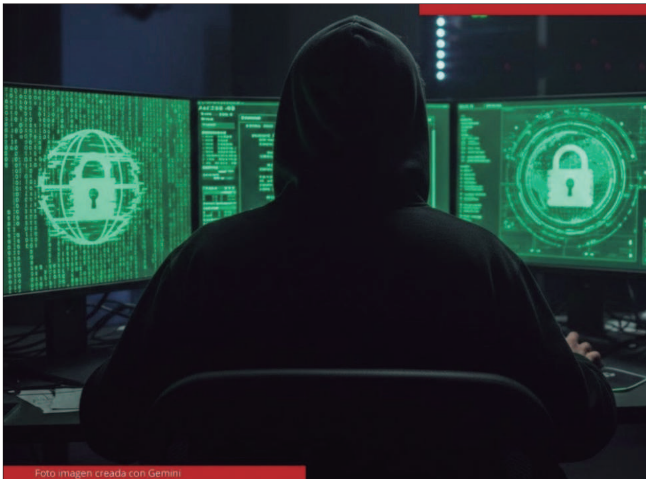
Foto imagen creada con Gemini

Estos ataques, agregó, tienen el objetivo de sustraer información de sus clientes, misma que puede utilizarse para cometer fraudes, por lo que las firmas del sector en el país “han desarrollado mecanismos de respuesta a este tipo de ataques que les han permitido, a la fecha, evitar afectaciones directas a las instituciones”.