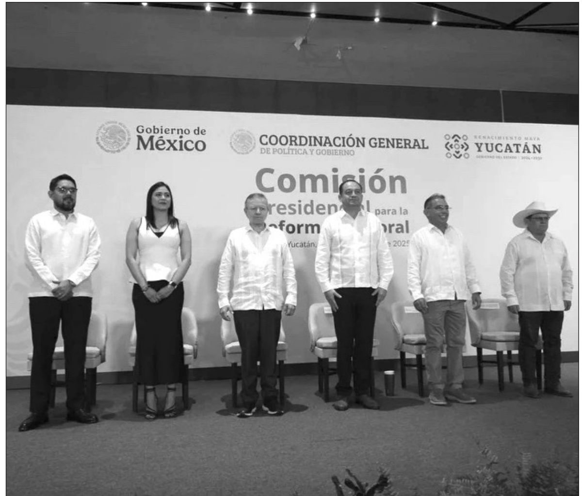
▲ "La ciudadanía tiene el deber de velar porque la reforma conduzca a un sistema más justo y democrático".

ESTE CONTEXTO ES relevante porque los cambios en el sistema de partidos mexicano suelen ir acompañados de reformas electorales profundas. Por ejemplo, la reforma de 1946 nacionalizó los procesos electorales al asignar a la Comisión Federal de Vigilancia Electoral la organización y vigilancia de las elecciones. Además, en 1946 se refundó el partido del régimen (el PRM) para integrar a las principales fuerzas revolucionarias del país en un nuevo partido nacional: el PRI. La combinación de la centralización de la organización electoral y la consolidación de un partido oficial de alcance nacional dio pie a un sistema de partido hegemónico, en el