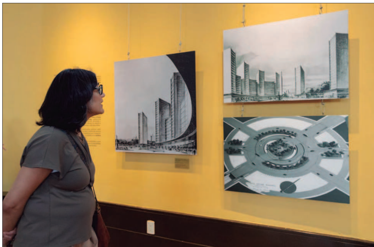
▲ La exposición en el Museo Nacional de Arquitectura ofrece una mirada profunda al proyecto de modernidad que reconfiguró al país tras la Revolución Mexicana, “un sueño colectivo” expresado en concreto y capturado en nitrato de plata.

Quimeras modernistas es posible gracias al Tec de Monterrey, a partir de su Archivo Mario Pani, inscrito en 2016 en el Registro de Memoria del Mundo de la Organización de Naciones Unidas para la Educación, la Ciencia y la Cultura.