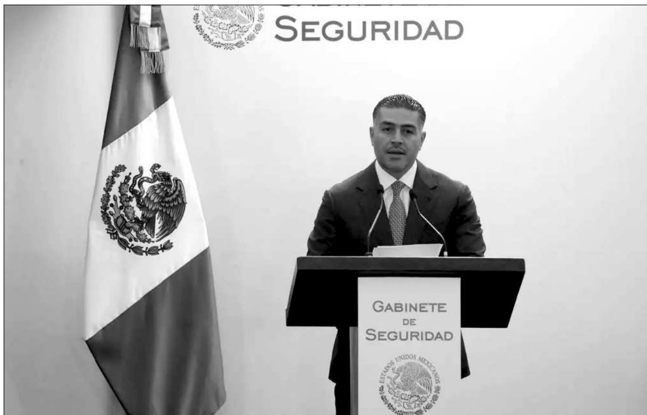
▲ García Harfuch recalcó que dicho sujeto ha mencionado “que tiene un vínculo y que trabaja directamente para un líder delincuencia”.

“La investigación inició por denuncias específicas por extorsión que no están vinculadas a ningún sindicato, es una denuncia directa, es una extorsión directa desde cobrarle a empresarios, agricultores, pozos de agua, hay varios delitos que se están investigando, pero ninguno está relacionado como tal con un sindicato, o con un vínculo político”, contestó García Harfuch.