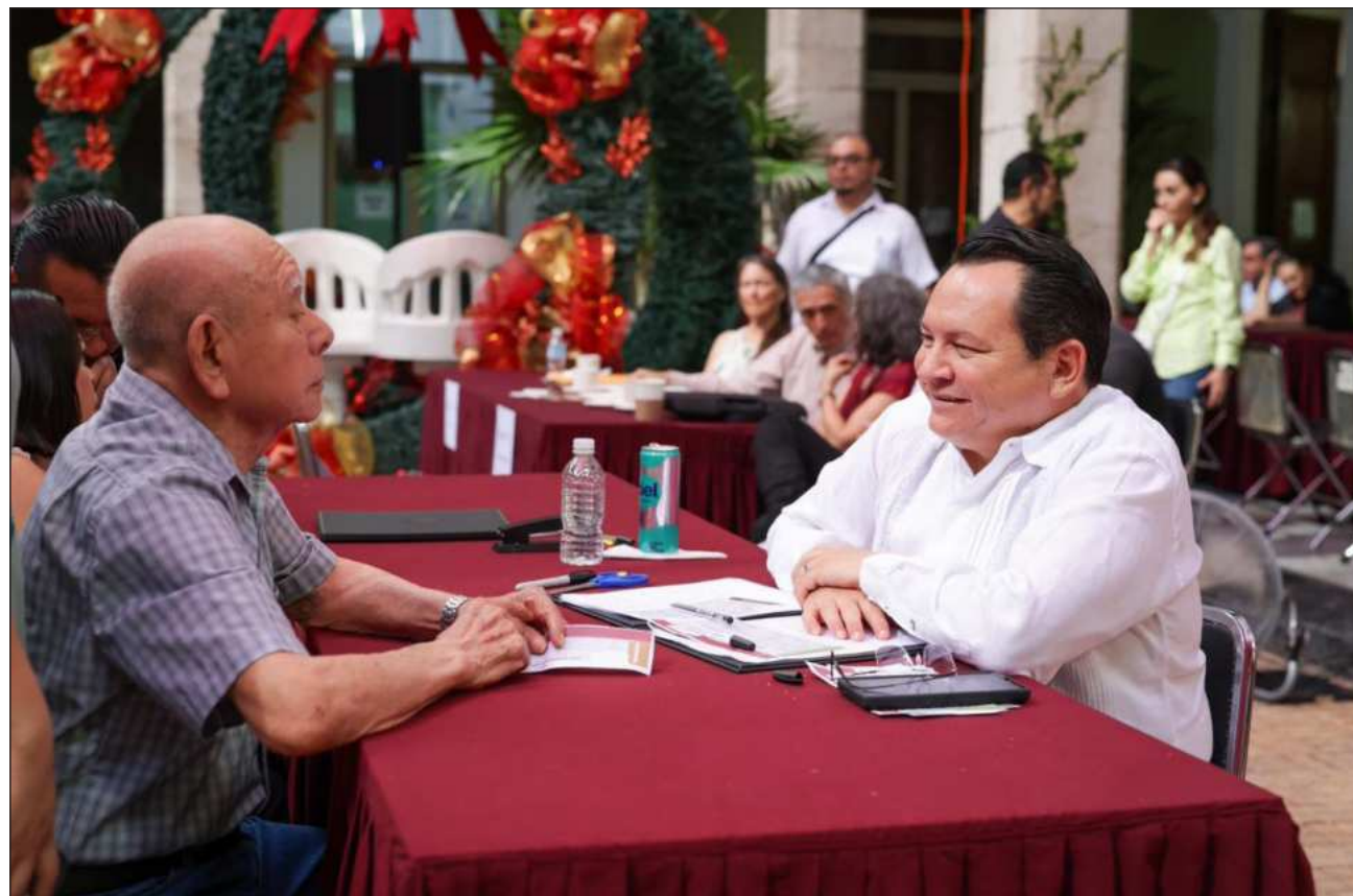
▲ El gobernador sostuvo que “este gobierno pone en el centro de las decisiones lo que la gente nos plantea; muchas acciones que hoy están en proceso de construcción o ya en marcha han salido de estas audiencias ciudadanas.

Asimismo, señaló que su gobierno trabaja en obras de gran magnitud para el desarrollo de Yucatán, con el objetivo de generar empleos bien pagados, y también impulsa iniciativas como Mujeres Renacimiento, que respalda a las madres autónomas, así como Juventudes Renacimiento, con la cual se busca reducir la desigualdad y, al mismo tiempo, apoyar que las y los jóvenes con-