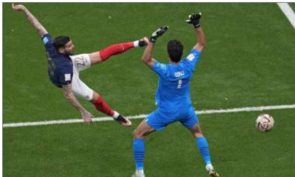
▲ Theo Hernández anota el primer gol de Francia, ante Marruecos.

Mbappé tendrá así el escenario ideal para consolidarse como el nuevo gran "crack" del fútbol frente a Messi, quien lleva una década y media como la estrella máxima junto a Cristiano Ronaldo.