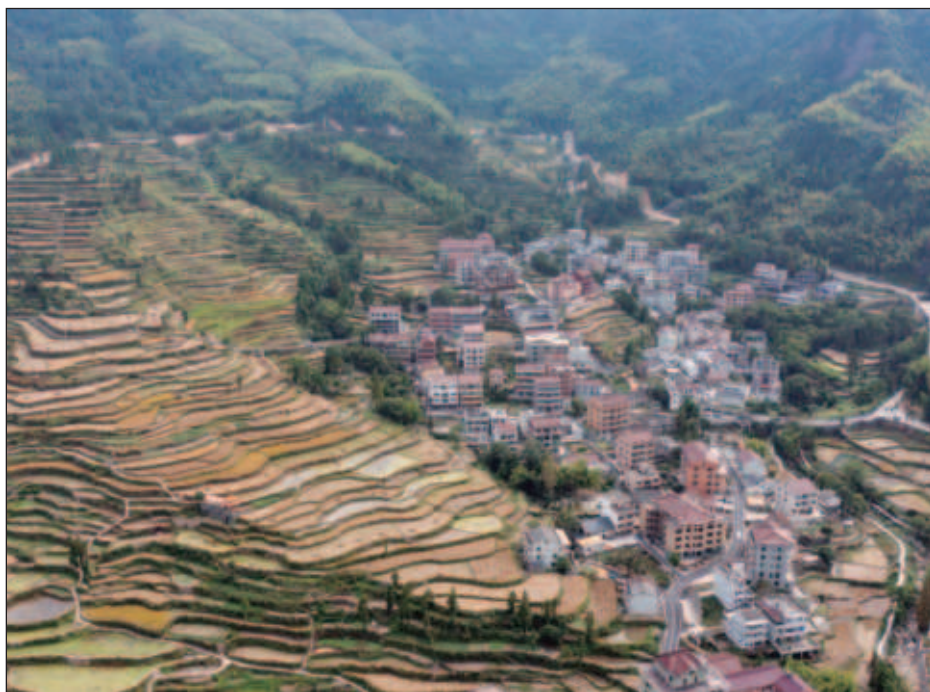
▲ La "movilización de recursos" está omnipresente en las conversaciones que buscan un acuerdo para detener la destrucción de recursos naturales y especies para 2030.