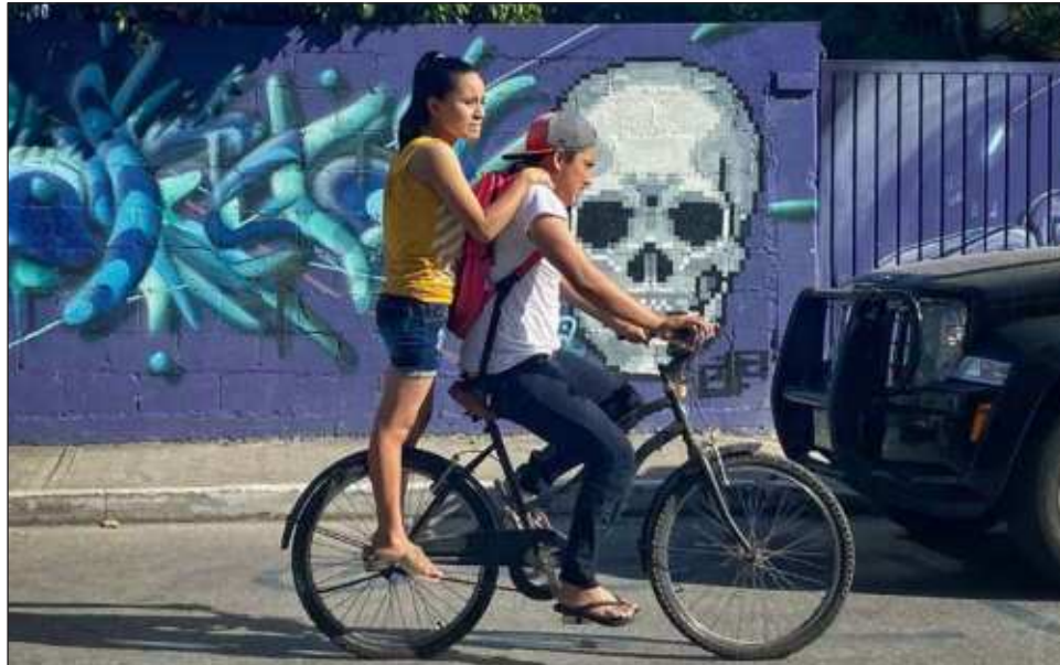
▲ Quintana Roo es una de las entidades federativas con una alta prevalencia de violencia en contra de las mujeres, de acuerdo con cifras del Inegi.

De acuerdo con cifras del Instituto Nacional de Estadística y Geografía (Inegi), en su estudio denominado Estadís-