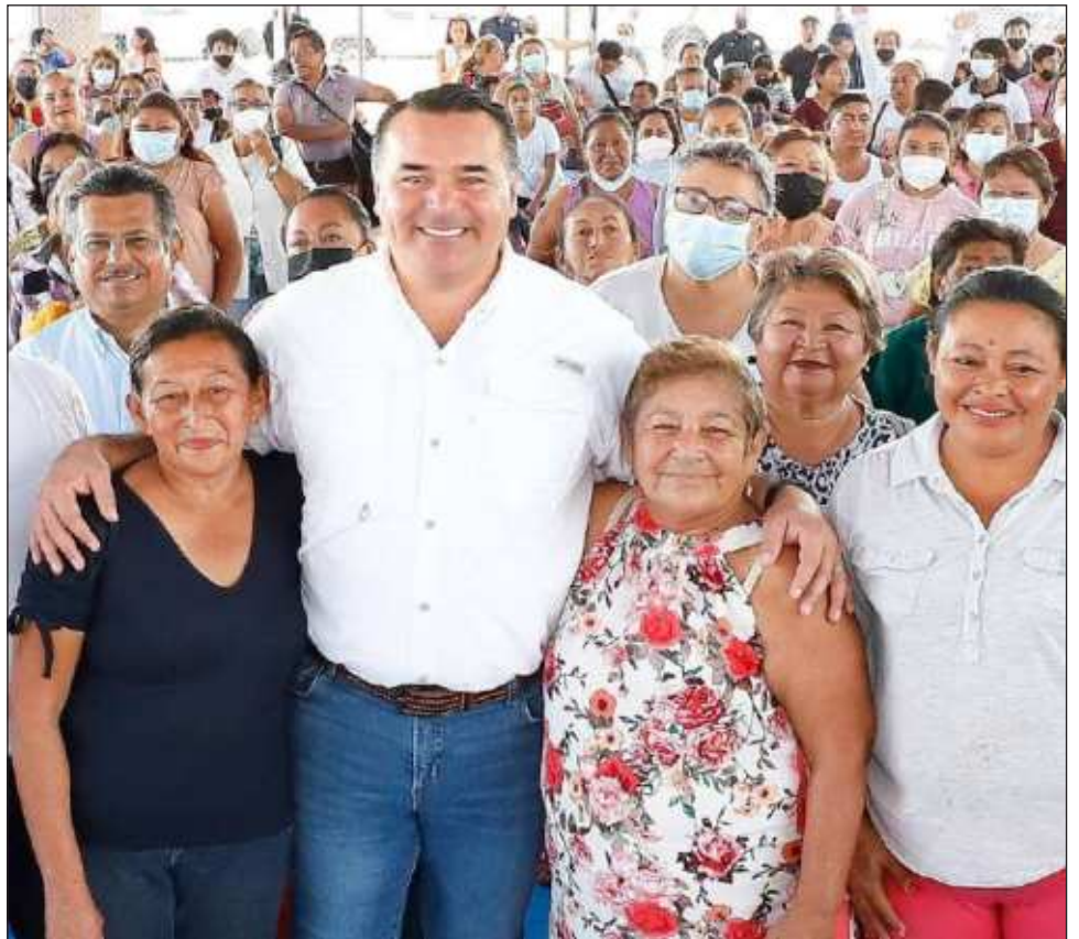
▲ El ayuntamiento de Mérida invirtió 140 mil pesos en los 44 apoyos directos que fueron entregados este miércoles, a familias con un emprendimiento como fuente de ingresos.