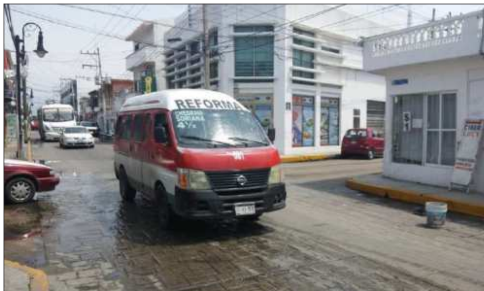
▲ Los transportistas alegan que una mejoría en sus ingresos redundaría en mantenimiento y cambio de los vehículos con los que se presta el servicio, además de la imagen del mismo.

“Desde hace más de siete meses hemos entregado al Instituto Estatal del Transporte (IET) y al Consejo Estatal de Transporte (CET) la solicitud del incremento a la tarifa del pasaje del trans-