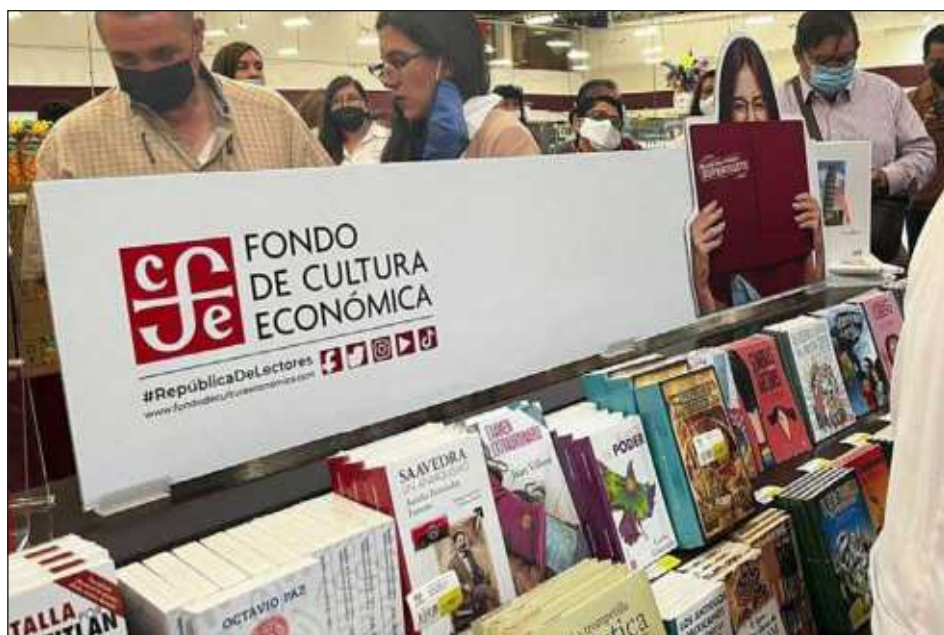
▲ Programas del FCE como el Librobús o los clubes de lectura contribuyen a la formación de lectores; este último ha beneficiado a casi 500 mil personas.

Taibo II sostuvo que las librerías de Educal registraron 40 por ciento de aumento en sus ventas y con Librobús visitaron 559 municipios del país.