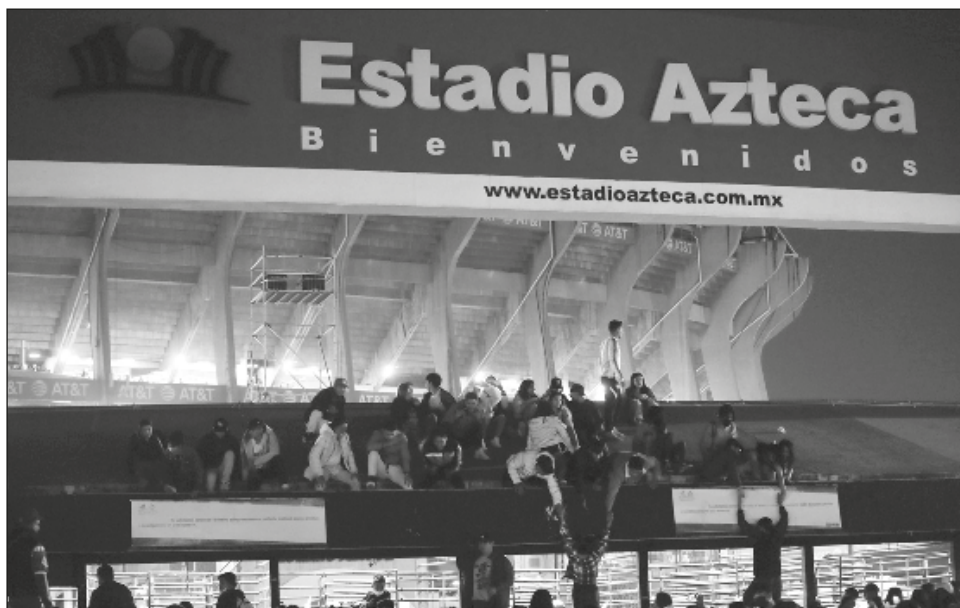
▲ El Instituto Federal de Defensoría Pública indicó que procede la demanda colectiva contra Ticketmaster porque la empresa realizó la transacción, ofreció el servicio y no cumplió a quienes compraron boletos para el concierto de Bad Bunny.

Aparte del reembolso, la empresa deberá pagar 20