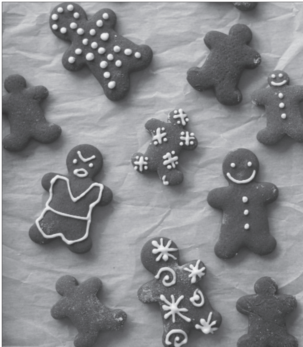
▲ Sobrevivir al marketing navideño y a la presión de pasar los días en esa casa familiar en ocasiones es verdaderamente doloroso. Porque por si fuera poco, existe también una especie de culpa por elegir no participar del ritual.

Sobrevivir al marketing navideño y a la presión de pasar los días en esa casa familiar en ocasiones es verdaderamente doloroso. Porque por si fuera poco, existe también una especie de culpa o