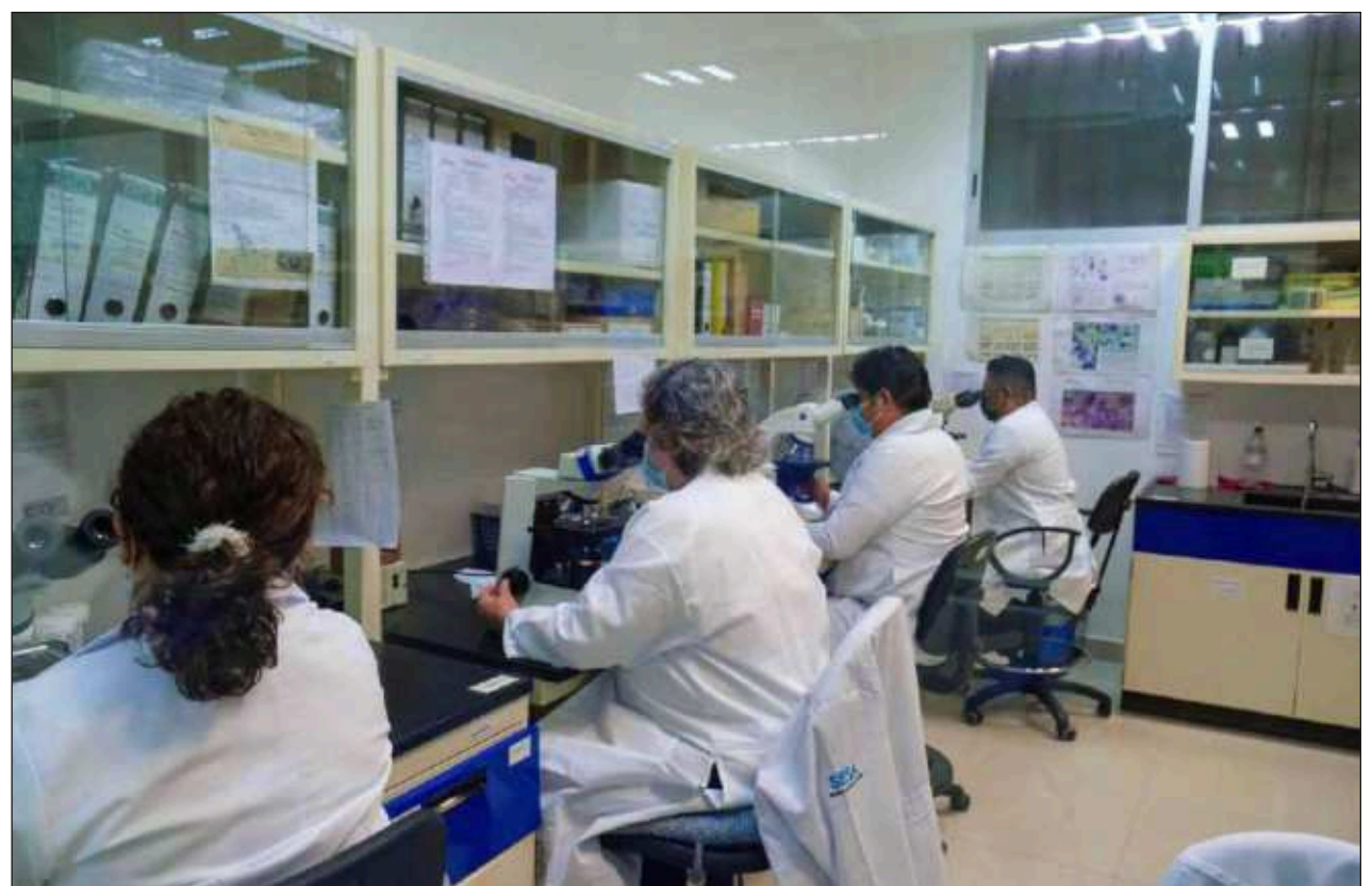
▲ Anteriormente todas las muestras de casos probables eran enviadas al InDRE en la CDMX.

Actualmente el estado participa en la vigilancia epidemiológica regional del virus de la mpox y es integrante de la Red Nacional de Laboratorios Estatales de Salud Pública.