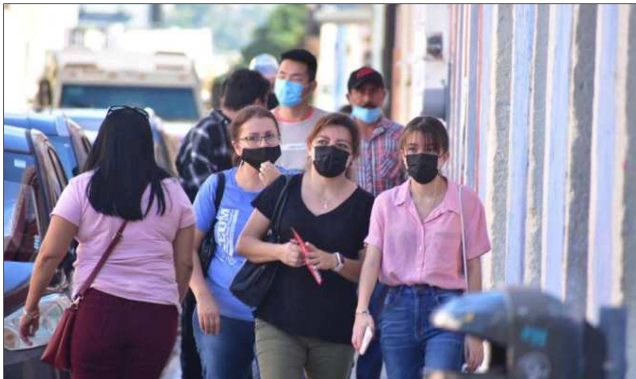
▲ Con corte al 2 de diciembre, según Servicios de Salud, hay 10 personas hospitalizadas, mil 630 contagiadas y tres fallecidas por Covid-19; hasta este lunes, contaban con nueve módulos de atención respiratoria abiertos.

“No es para tirarnos en nuestra hamaca, como decimos aquí en Yucatán, pero tampoco es una situación de alarmismo”