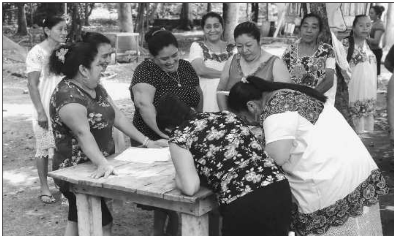
▲ Las 75 mujeres de Yaxhachén, en el municipio de Oxkutzcab, con impulso y financiamiento del PPD y Kanan Kab, ofrecerán a la población agua purificada para beber y también agua limpia para realizar labores domésticas.

Este panorama es lo que se vive en Yaxhachén, sin embargo, cuando se va la luz el panorama empeora.