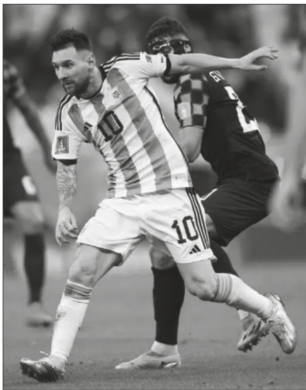
▲ Lionel Messi disputa el balón con el croata Josko Gvardiol, durante la semifinal en Lusail.

Motivado por el que será probablemente su último mundial, Messi se despojó de