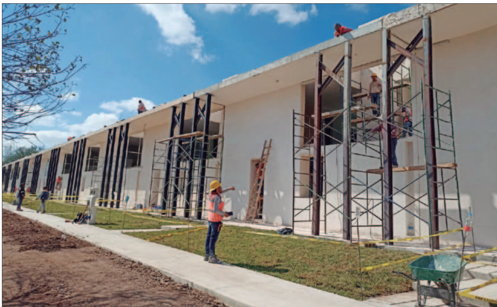
▲ Las familias aceptaron la oferta de ser reubicados a otros espacios. Sus nuevas viviendas están a pocos metros y se están construyendo sobre la calle 46 con 49, pero los vecinos no saben cómo lucen por dentro, el valor de éstas, ni cuándo podrán mudarse.