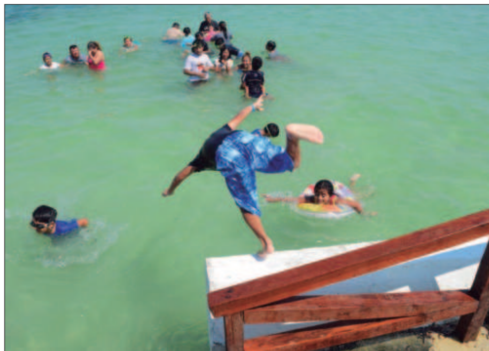
▲ La reforma a la Ley Federal del Trabajo garantiza 12 días continuos de vacaciones, aunque el periodo puede distribuirse conforme al interés del trabajador.

Mientras que el artículo 76, que ya contaba con la aprobación de ambas Cámaras, precisa que “las perso-