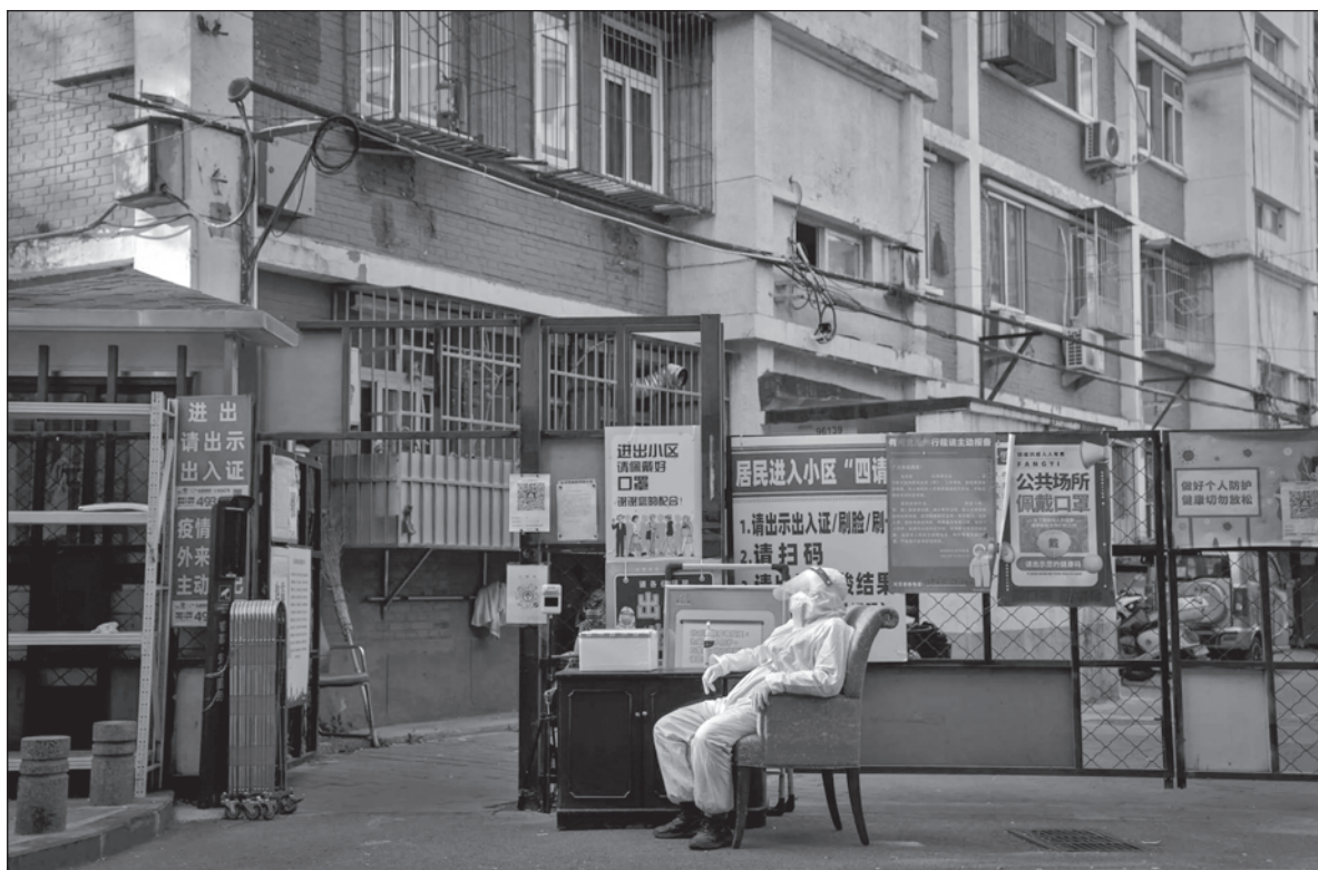
▲ "Xi is no longer connecting with the average Chinese citizen, and even if he reduces the ferocity of his repressive vision, the stage is set for a showdown for the limited liberalism of the past forty years".

CHINA WAS PULLED out of extreme poverty and thrust into global pre-eminence not by the founding Marxist ideology of Mao Zedong but by the pragmatic approach of Deng Xiaoping in the 1980's. Famous for his observation that "it doesn't matter if a cat is black or white, as long as it catches mice", he opened China up to a certain degree of capitalism and freedom, allowing the people