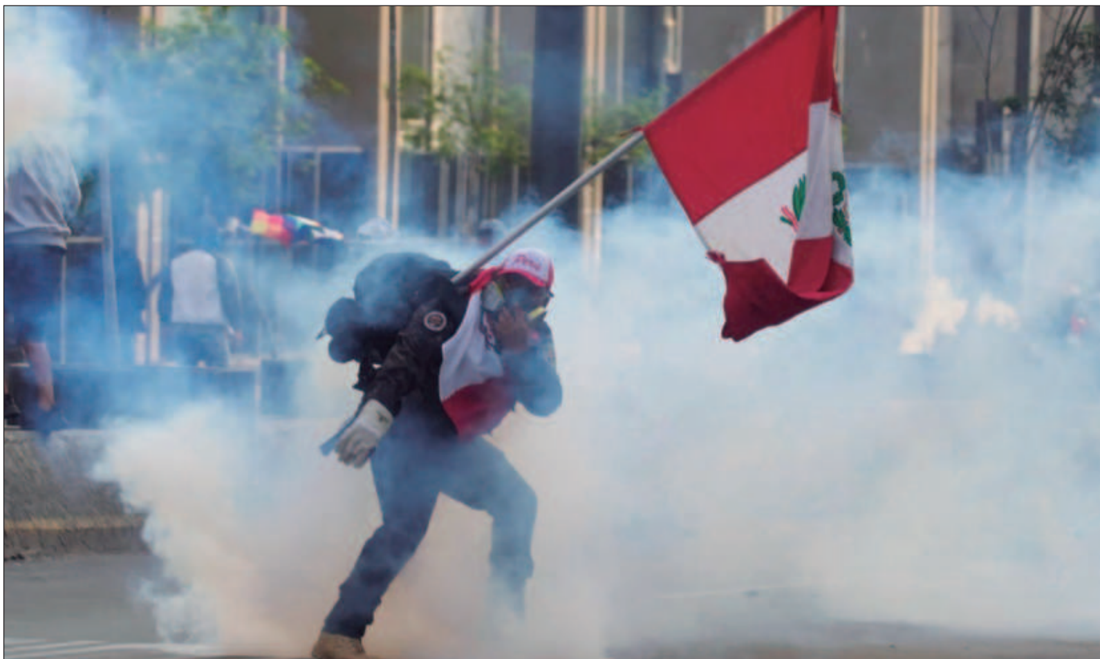
▲ “Los partidarios de Castillo iniciaron marchas que han sido reprimidas en comunidades rurales, donde han perdido la vida seis personas”.