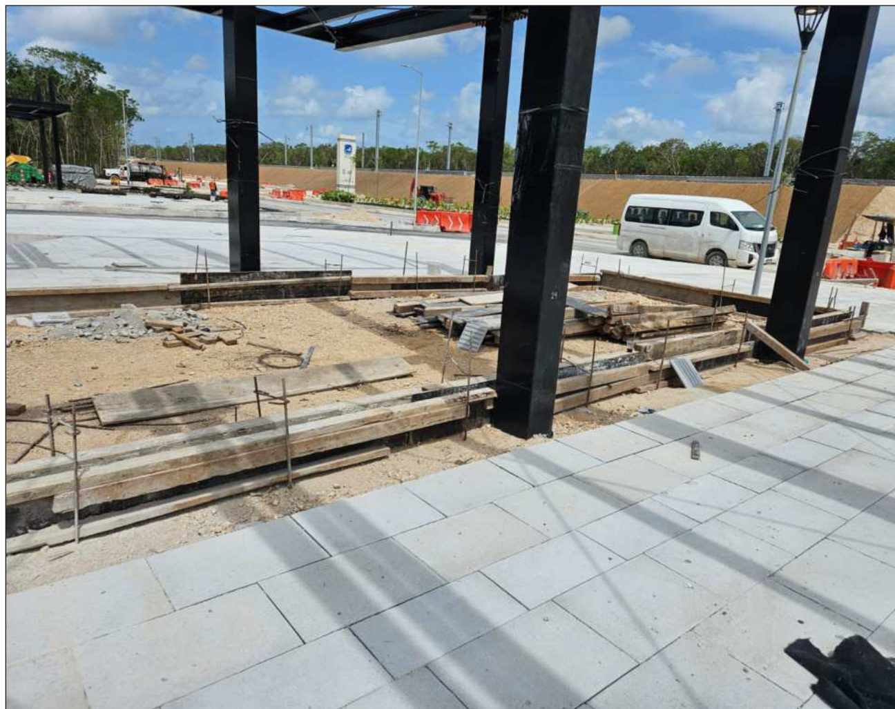
▲ David Jáuregui destacó que hace dos años utilizaron más de 15 mil toneladas de sargazo para fabricar mil 800 metros cúbicos de concreto, empleados en la construcción de aproximadamente 17 mil metros cuadrados de piso del Tren Maya de Tulum.

Ochoa Rodríguez detalló que el perfil de los visitantes es diverso, aunque durante los días hábiles predominan los turistas internacionales que recorren el sitio arqueológico atraídos por su riqueza histórica y su privilegiada ubicación frente al mar Caribe.