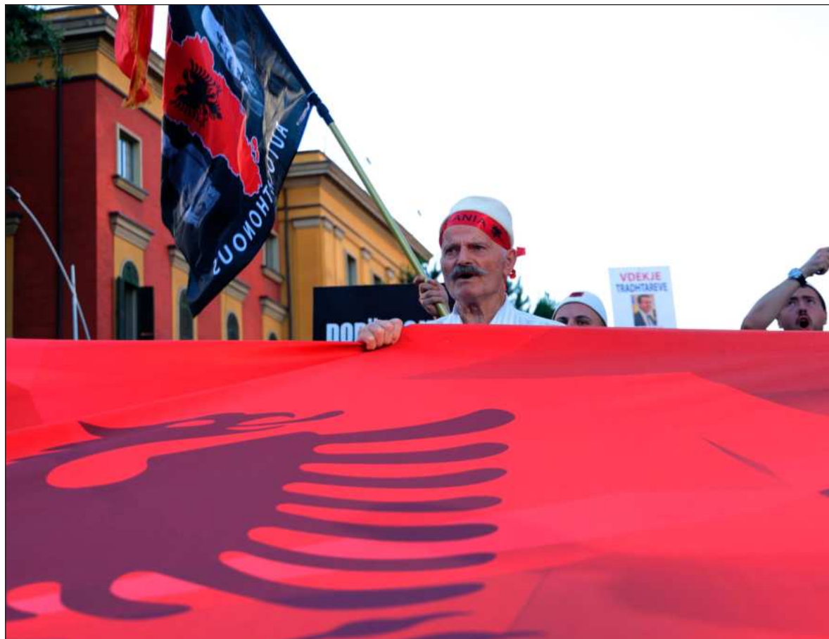
▲ "Los llamados a boicotear el mundial distópico de los ladrones multimillonarios de la Federación Internacional de Fútbol, fueron escuchados por una minoría. Los demás, a gozar del espectáculo dantesco".