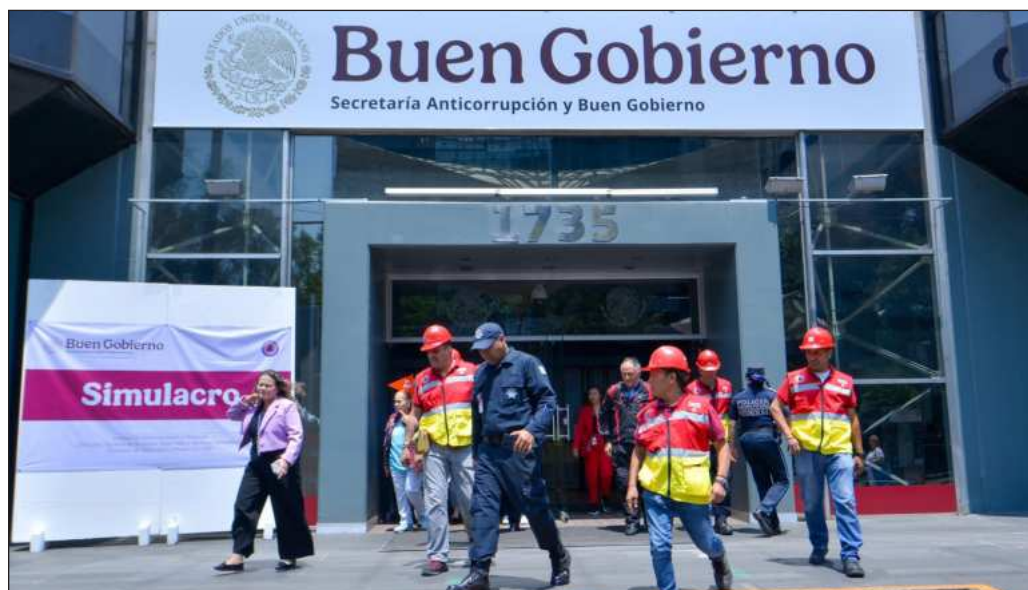
▲ El ruido en estos momentos está centrado en Rocha Moya. Independientemente de lo que resulte de la investigación, debe reconocerse que sí hay frutos en el combate a la corrupción.

El ruido en estos momentos está centrado en una figura: el morenista Rubén Rocha Moya, gobernador con licencia de Sinaloa. Independientemente de lo que resulte de la investigación, debe reconocerse que sí hay frutos en el combate a la corrupción. Tal vez hoy no resulten el caso ejemplar del sexenio, pero sí es posible tomarlo como signo de que podemos esperar una cosecha mayor en el gobierno de Claudia Sheinbaum.