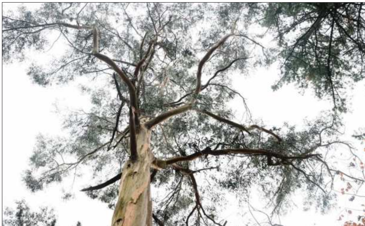
▲ “Hay que plantar millones de árboles para poder aspirar a una vida de calidad, pero también es cierto que no se trata de plantar cualquier especie de árbol en cualquier lugar. Hay que tener bien claro para qué se plantan”.

Lo irónico del asunto es que ahora, cuando se anuncia la construcción de una planta de celulosa