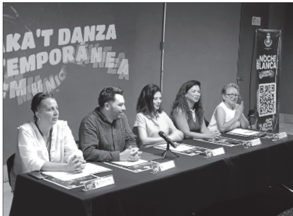
▲ Habrá conciertos, exposiciones y muestras de teatro gratis viernes y sábado.

Entre los eventos en el Museo de la Luz, estará el concierto de quienes aman,