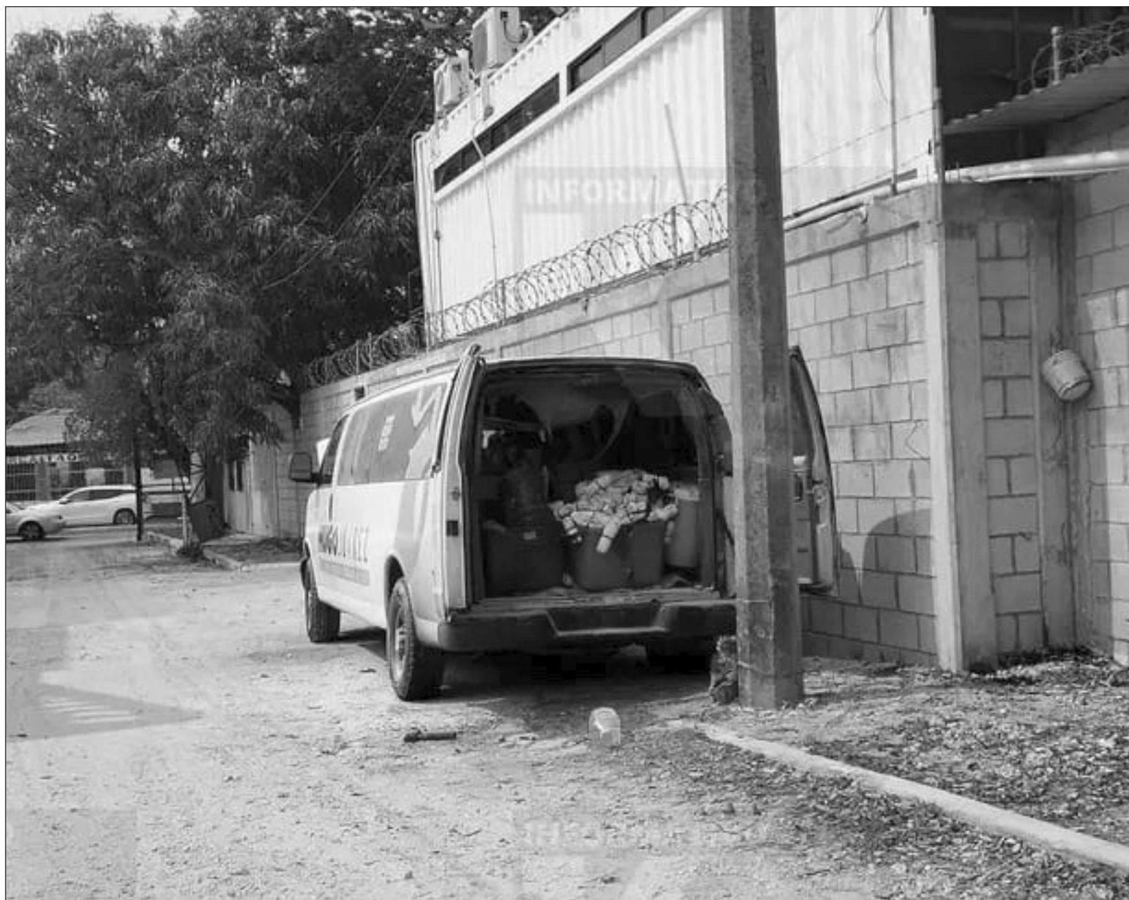
▲ Estos hechos ponen en alerta a la población ante el clima de violencia que pudiera registrarse en la jornada electoral del 2 de junio.