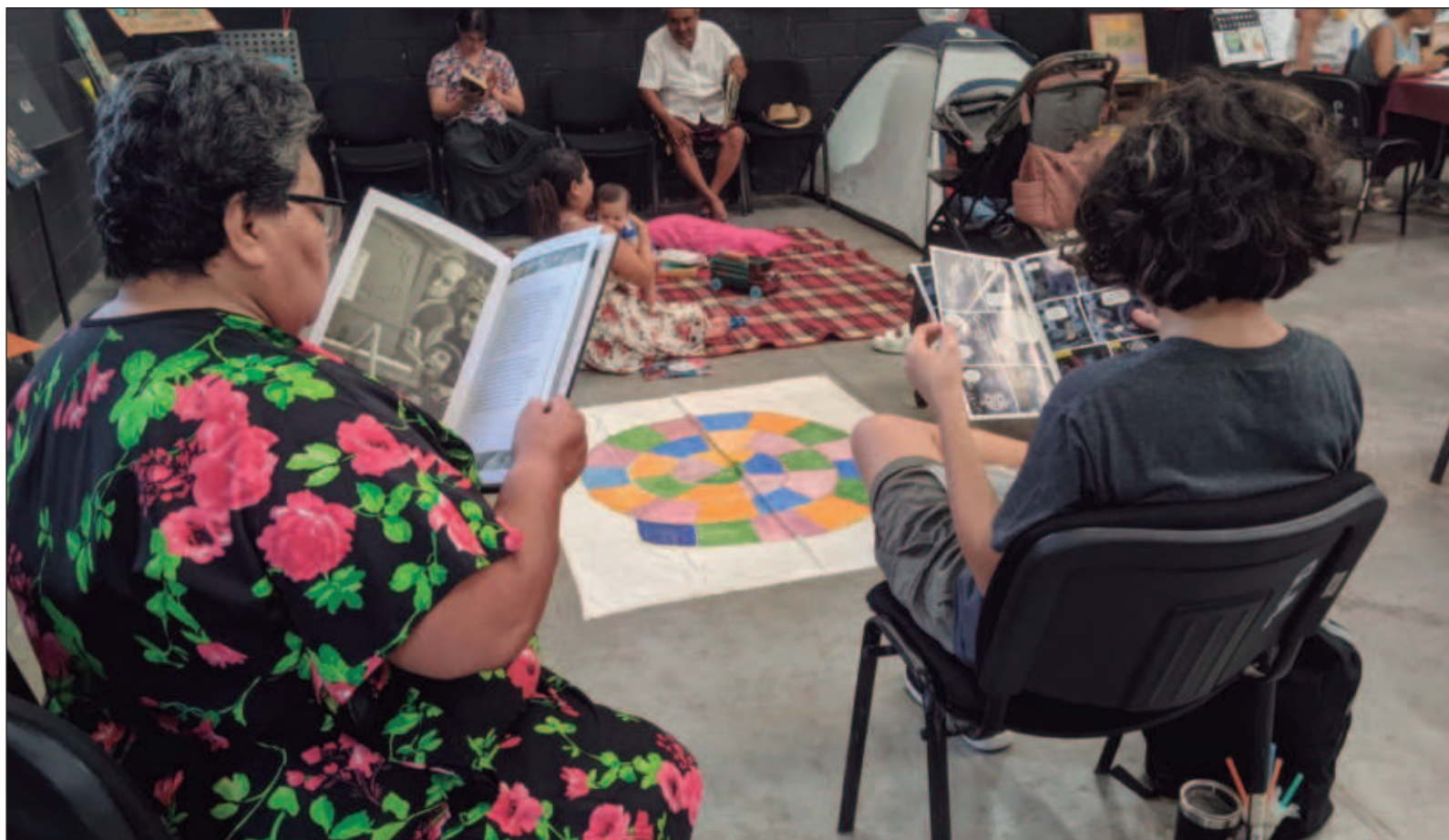
▲ “Miranfú es una palabra que inventa la protagonista de Capercucita en Manhattan de Carmen Martín Gaité y tiene dos significados: va a pasar algo diferente o me voy a llevar una sorpresa (...) quienes asistimos al evento pudimos identificar ambos significados con premura”.