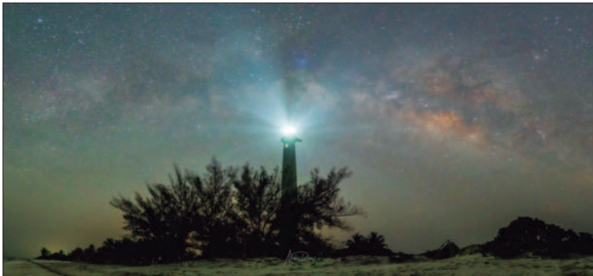
▲ “La noche de ese sábado recorrió de nuevo ese sinuoso sendero al Valhalla, con rumbo a Celestún. A pesar de que la tormenta solar que había sembrado con protones y electrones las nubes continuaba, la aurora no se apareció”.

La que se observó en Yucatán estuvo cargada de electrones, e igualó las tonalidades de la que se observó en Roma en la víspera de los idus de marzo, o la