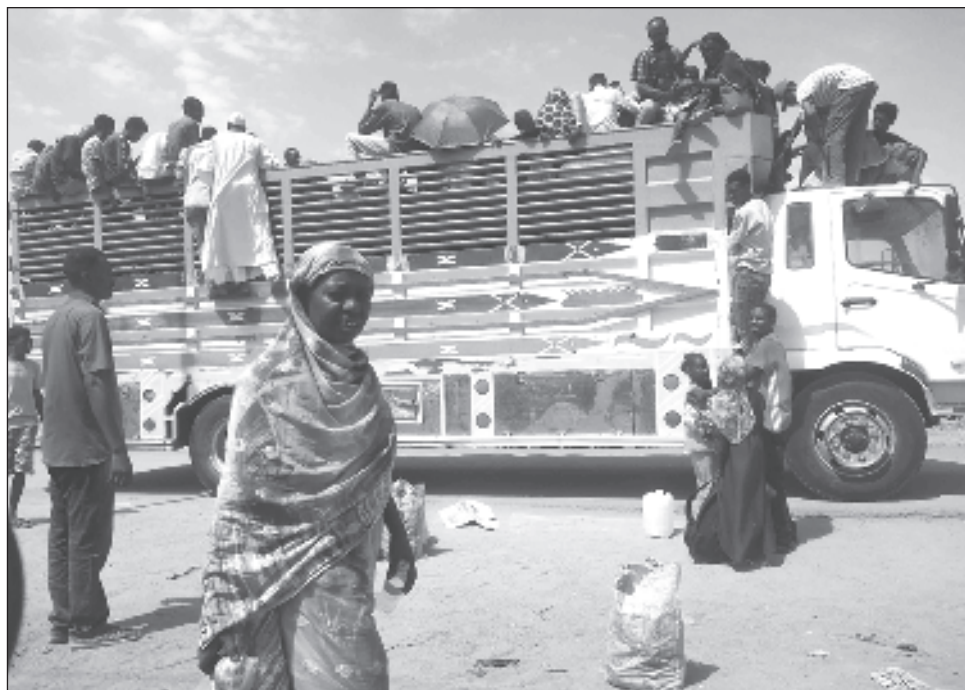
▲ Con 9,1 millones de desplazados, Sudán cuenta con la cifra más alta de personas en esta situación desde que la oenegé IDMC inició su recuento en 2008.

En el último lustro, el número de personas desplazadas