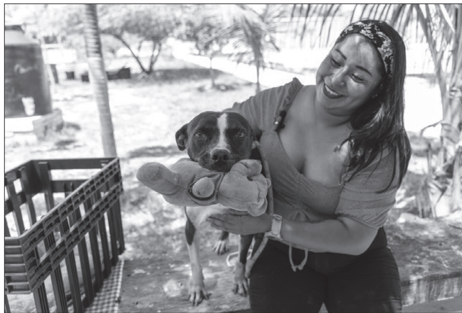
▲ Los animales de compañía también pueden sufrir golpes de calor, por lo que las autoridades recomiendan prestarle especial atención a su hidratación.

Las recomendaciones son: hidratarlos poco a poco,