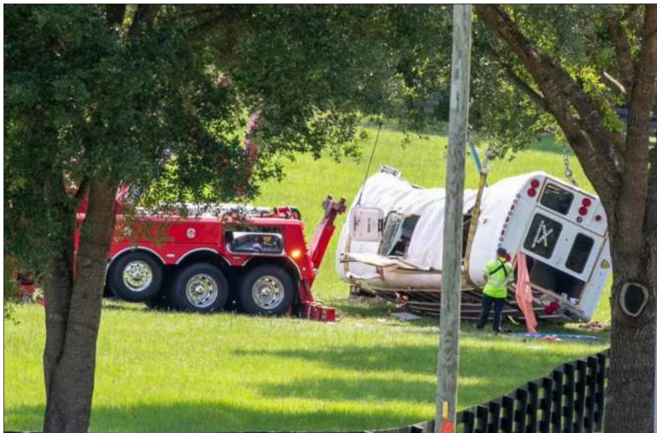
▲ El autobús transportaba a 53 trabajadores agrícolas -algunos de nacionalidad mexicana-, cuando alrededor de las 6:40 de la mañana del martes colisionó con una camioneta en el condado Marion, al norte de Orlando.

Un autobús que transportaba trabajadores inmigrantes en el centro de Florida volcó el martes, matando a ocho personas y lesionando a unos 40 pasajeros más, informaron las autoridades.