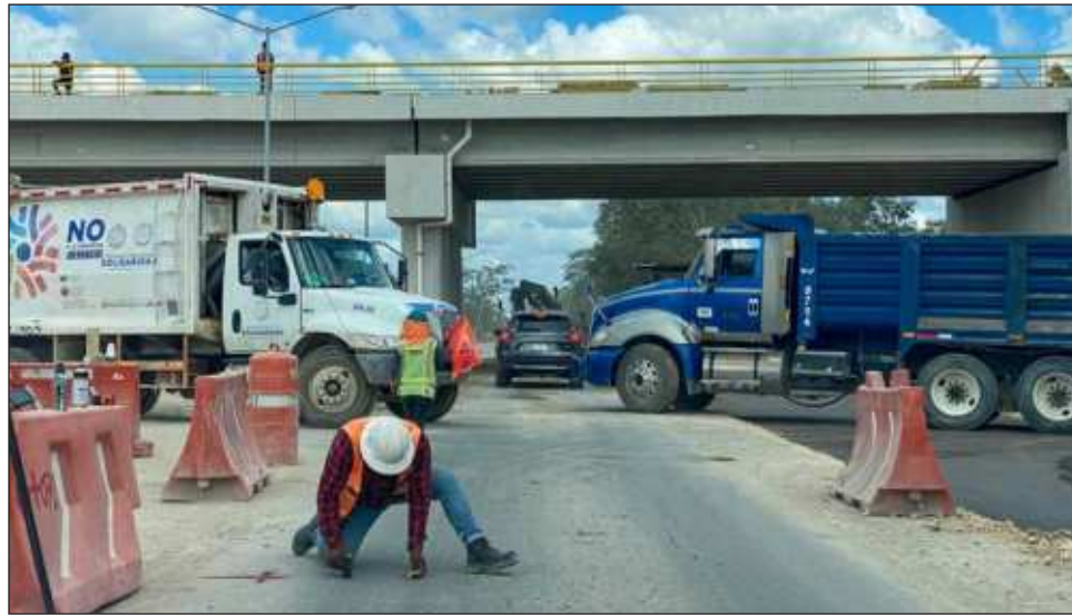
▲ Actualmente, los volqueteros se ven afectados por la escasez de obra privada por el periodo electoral: muchas empresas prefieren esperar hasta saber quién ganará la presidencia.

Ahora lo que les está afectando, dijo, es que la obra