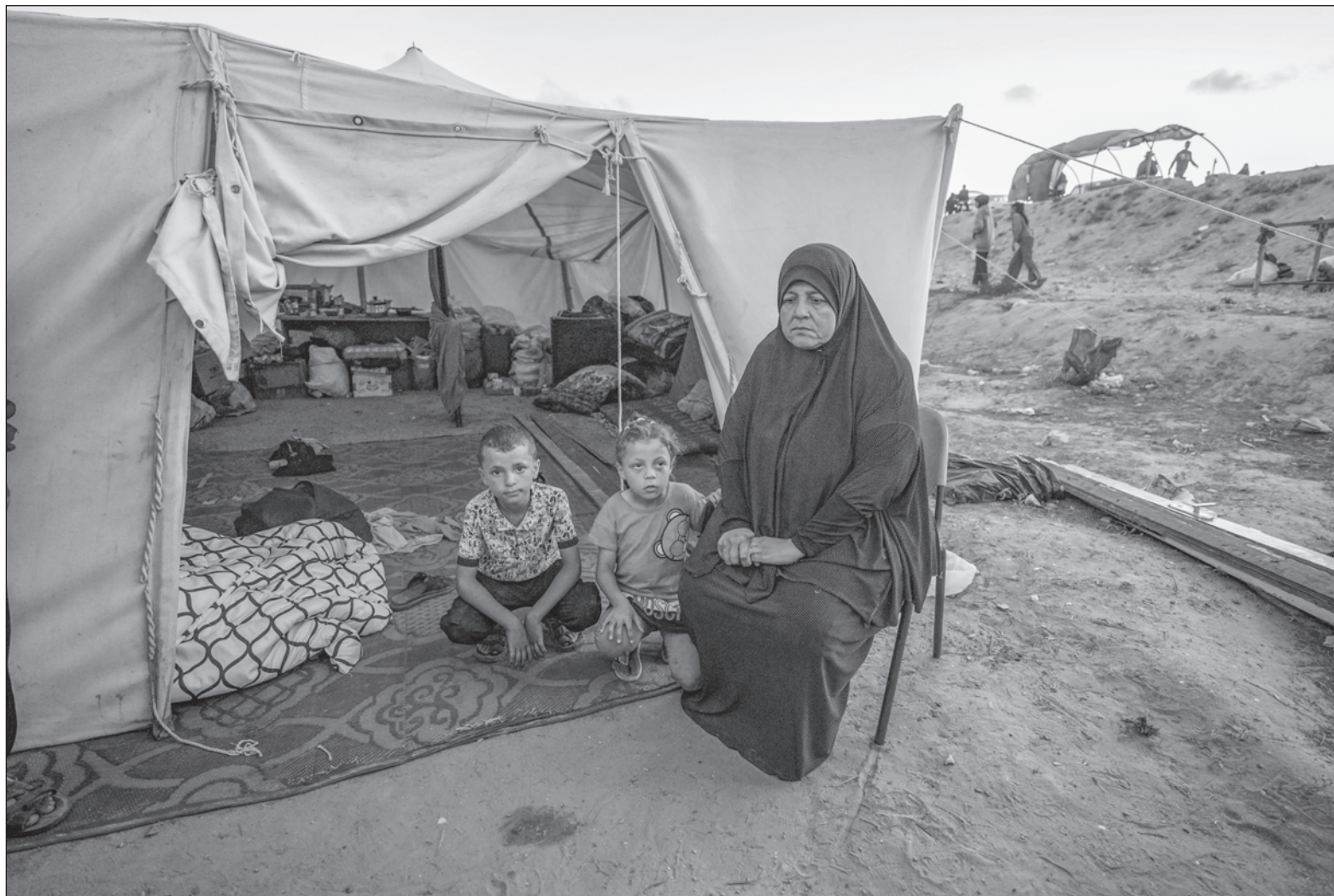
▲ “Genera eco a nivel internacional, pero por encima de todo, Palestina será libre por su propia resistencia y por el clamor de los pueblos del mundo”.