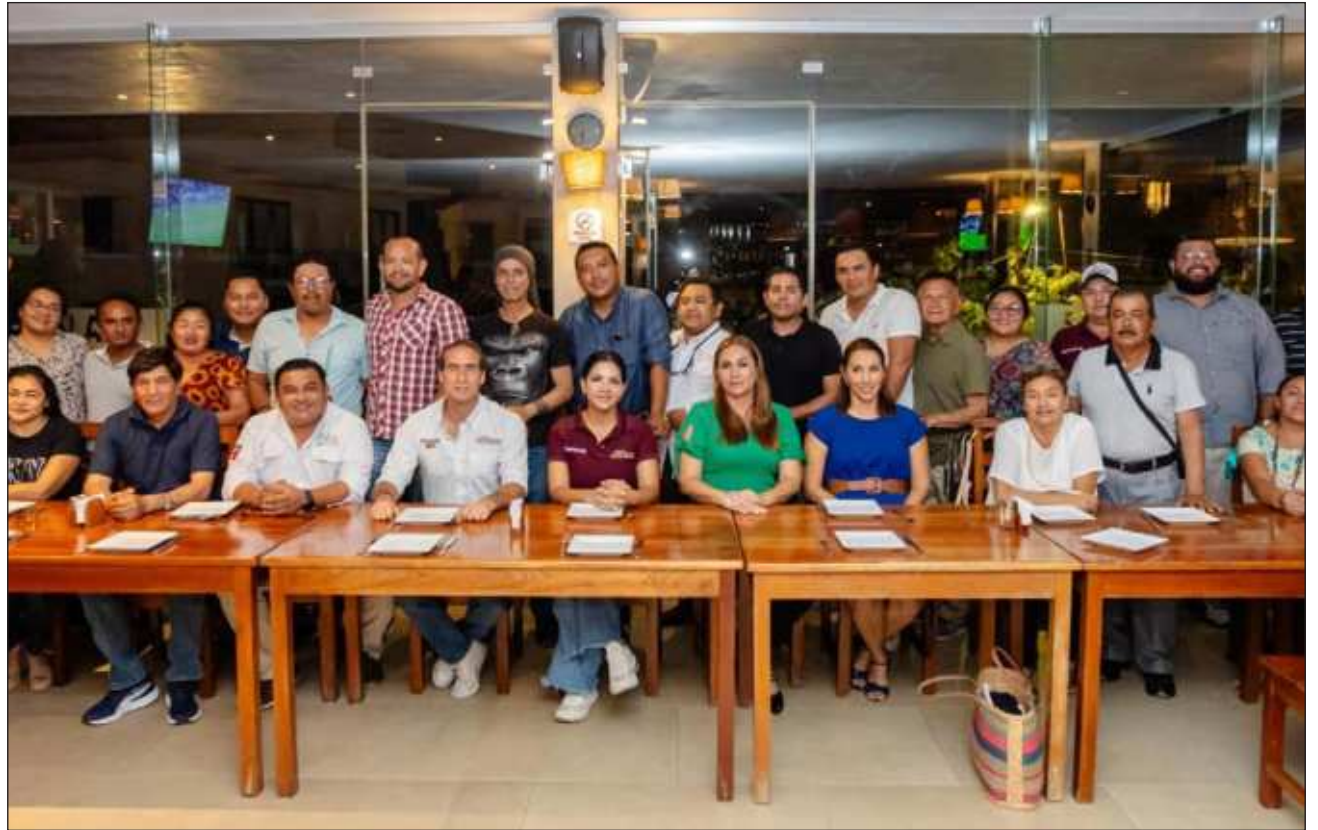
▲ Los guías turísticos también pidieron la construcción de un espacio digno para el gremio, mayores facilidades en tramitología y la apertura de un programa educativo en el que promuevan la riqueza histórica de la zona arqueológica.

En este encuentro, también pidió que los contemplen con la construcción de un espacio digno para el gremio, mayores facilidades en tramitología y la apertura de un programa educativo en el que promuevan la riqueza histórica de la zona arqueológica.