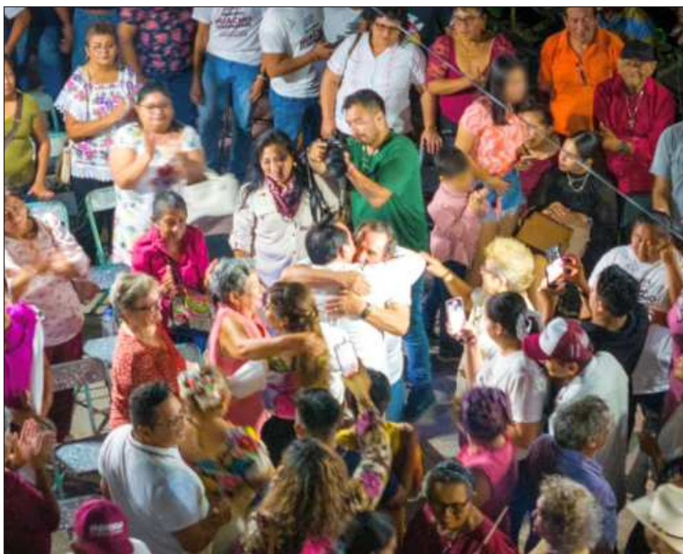
▲ En la calle Punta Morena, la gente de San Felipe recibió al candidato del partido guinda con numerosas muestras de cariño y respaldo.

Por ello dijo que no hay que bajar la guardia, hay que acudir a las urnas y cuidar los votos para las y los candidatos de Morena, PT y PVEM, quienes harán equipo con la candidata presidencial Claudia Sheinbaum, y comenzar a escribir una nueva historia para Yucatán.