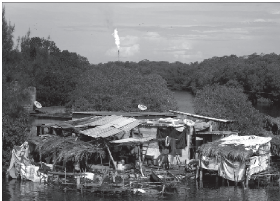
▲ Un estudio del IMCO revela los contrastes en la península de Yucatán: la región cuenta con las reservas y producción de gas natural, pero aún vive carencias de uso de combustibles.

Pero el organismo apunta que "el gas natural puede con-