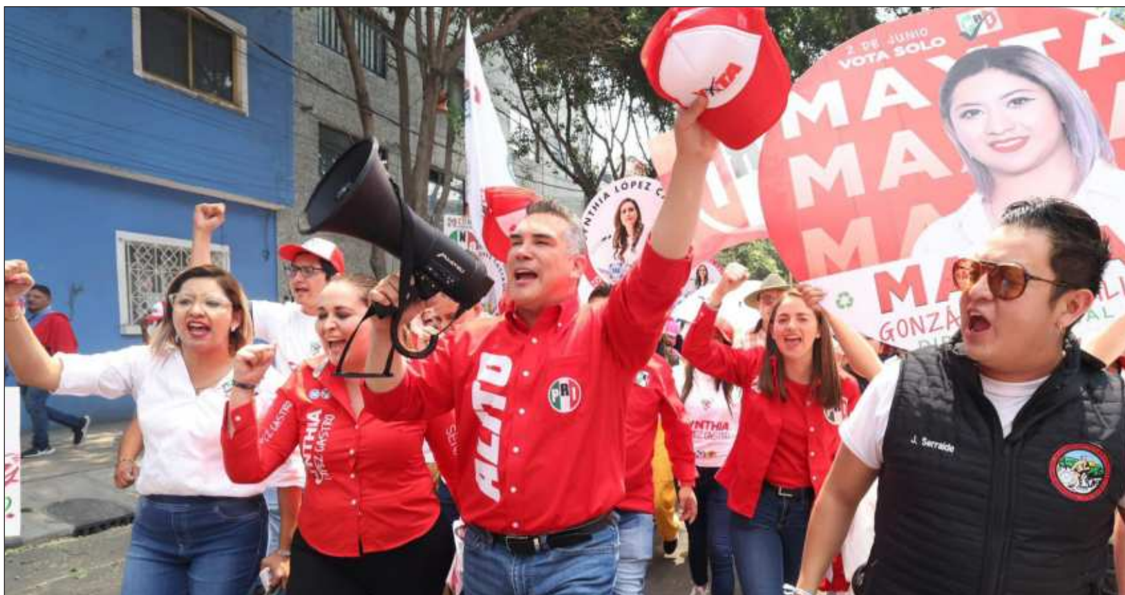
▲ Moreno explicó que Gálvez ya rebasó a la abanderada presidencial morenista Claudia Sheinbaum y el propósito de su propuesta es ganar con mayor contundencia.