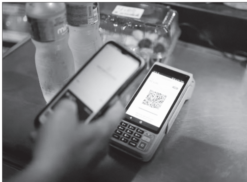
▲ De acuerdo con João Manoel Pinho de Mello, ex director del Banco Central de Brasil, dicha plataforma tomó 13 años en elaborarse y desde el momento en que se puso a disposición del público en general fue obligatorio para las instituciones bancarias, más no para los clientes.

En México han existido una serie de iniciativas para fomentar el uso de los pagos digitales, tales como CoDi, un código QR para enviar y recibir dinero por hasta 8 mil pesos diarios, y DiMo, la plataforma para realizar transacciones solamente con un número de un teléfono celular, ambas implementadas por el Banco de México (BdeM).