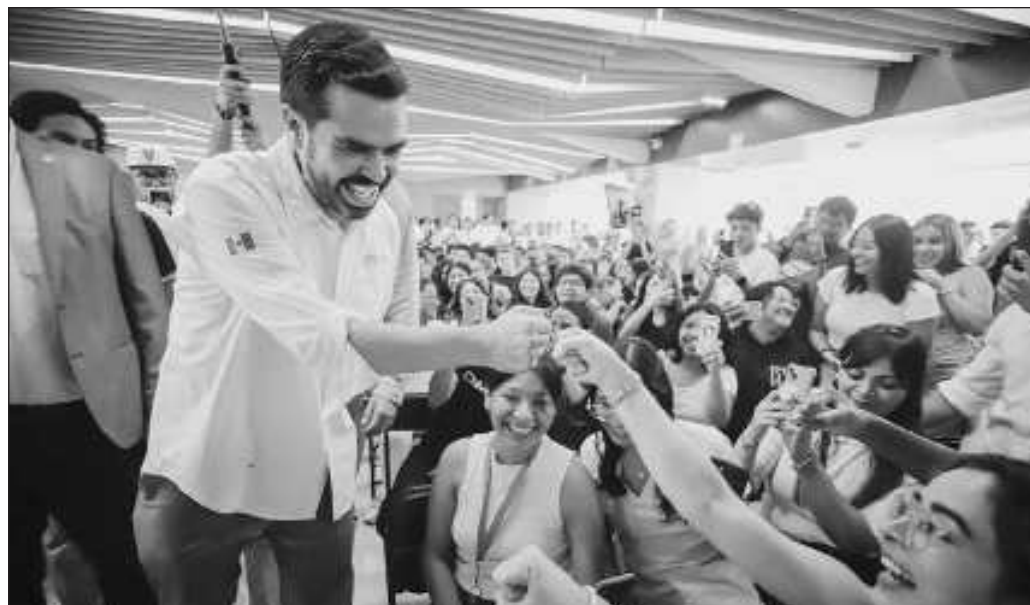
▲ Responder con un "¿Y tu nieve de qué la quieres, Alito?" resuelve la situación en el terreno de la comedia. La "oferta" no puede ni debe ser tomada en serio.

Hay ofertas que suelen escucharse muy buenas para ser reales, porque hay "letras chiquitas" que si se revisan con detenimiento terminan por convencer de que aceptar sería una pérdida para el comprador. Y lo mejor es alejarse entre risas.