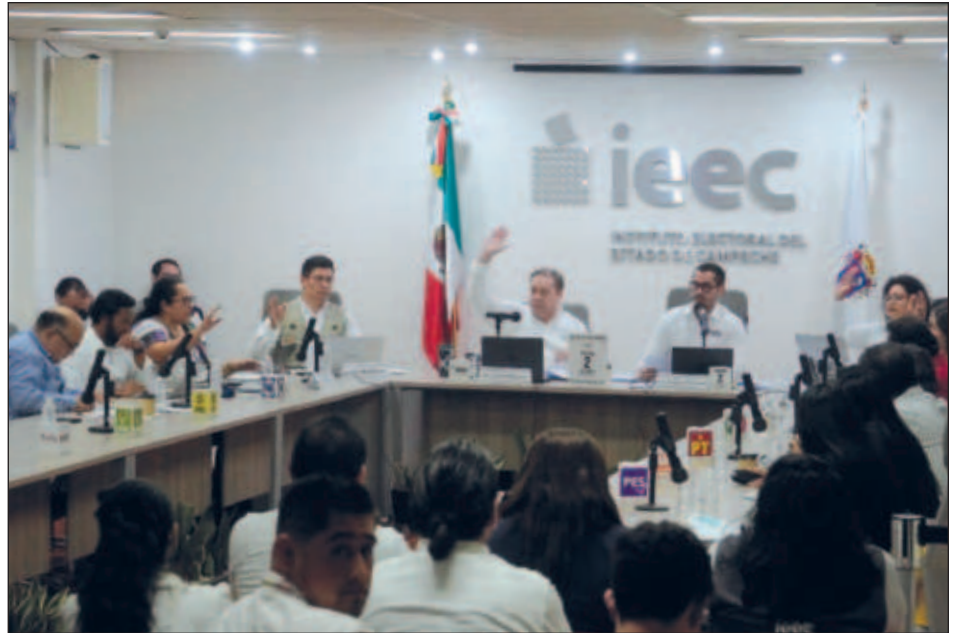
▲ El encuentro entre los aspirantes a la alcaldía de Campeche será el próximo 26 de mayo a las 20 horas; la asistencia no es obligatoria.