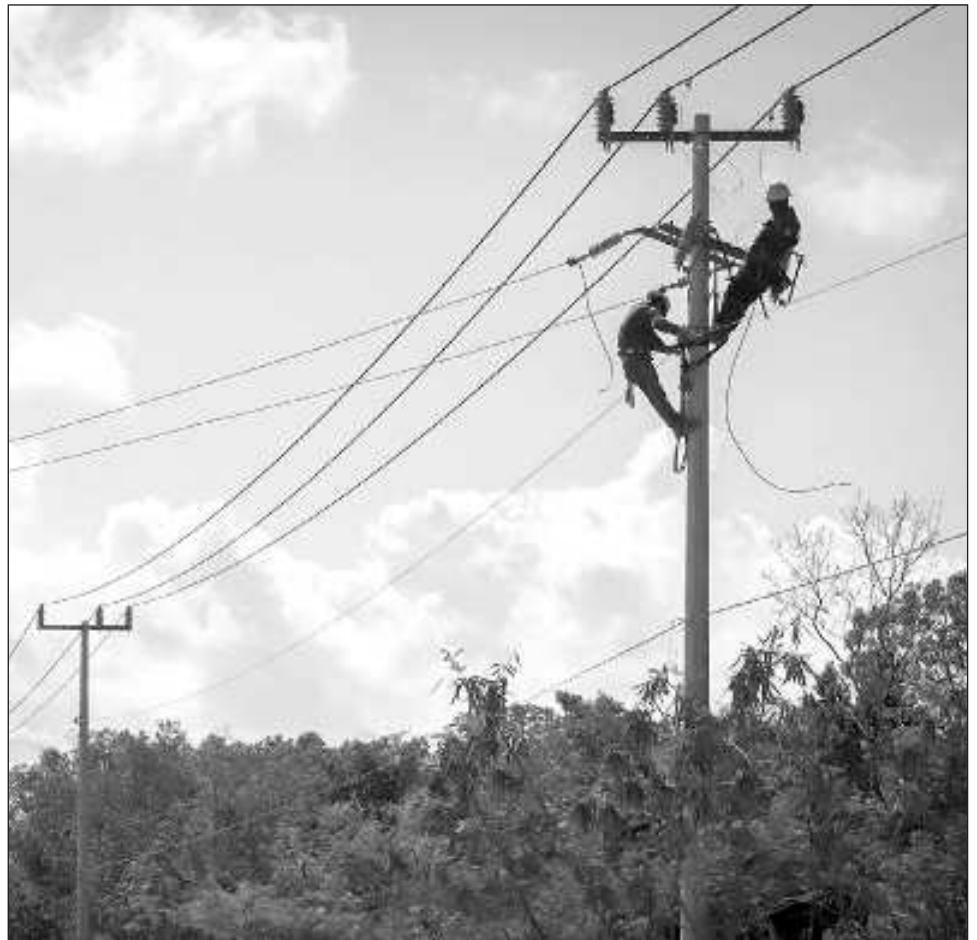
▲ En Sabancuy, un camión cargado con maquinaria, arrastró cables y golpeó motocicletas, dejando sin energía parte de la villa y a por lo menos 50 familias de diferentes colonias.

La unidad y su conductor fueron asegurados por la Guardia Nacional, en el entronque con la carretera 180, siendo puesto a disposición de la Vicefiscalía General Regional de Justicia.