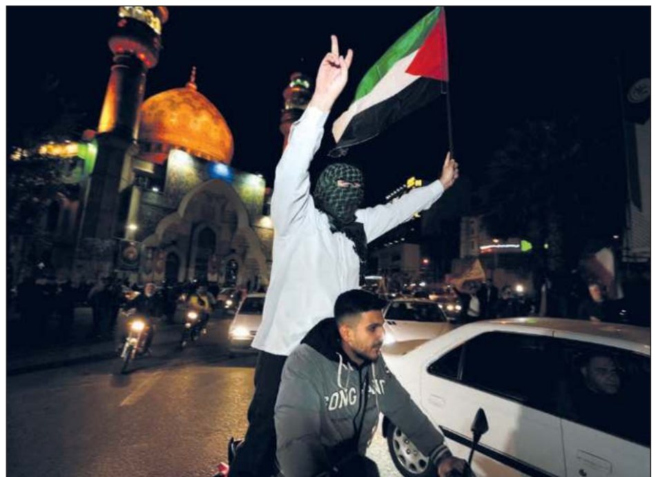
▲ En el transcurso de las dos últimas semanas, las autoridades iraníes afirmaron su voluntad de “castigar” a Israel tras la muerte de siete Guardianes de la Revolución.

Pocas horas antes del ataque contra Israel, Irán capturo en el estrecho de Ormuz un portacontenedores “vinculado” a Israel con 25 tripulantes a bordo, hecho calificado por Estados Unidos como un “acto de piratería”.