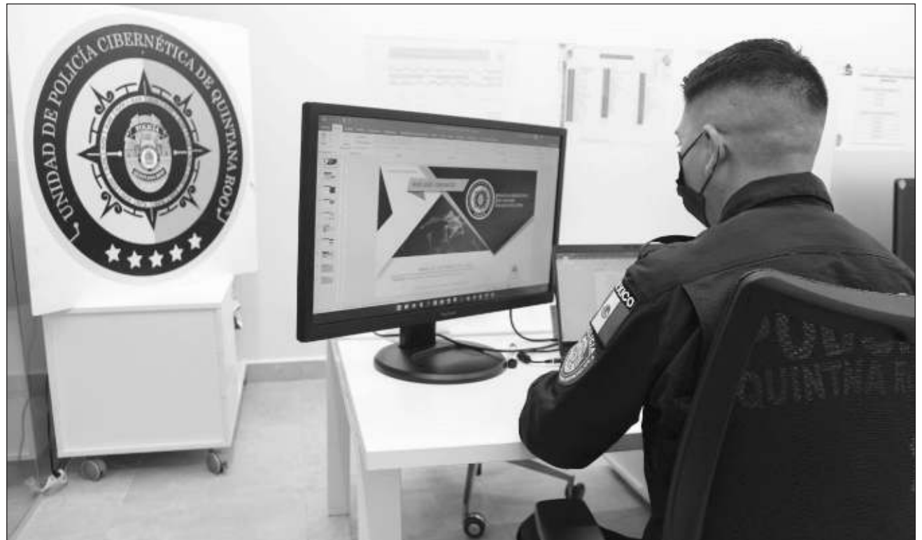
▲ La Policía Cibernética trabaja en campañas que llevan de manera directa a planteles educativos de todos los niveles, donde recomiendan a jóvenes buenas prácticas de cómo cuidar su vida digital en el Internet.

"Ahí les damos a los alumnos las recomendaciones y buenas prácticas de