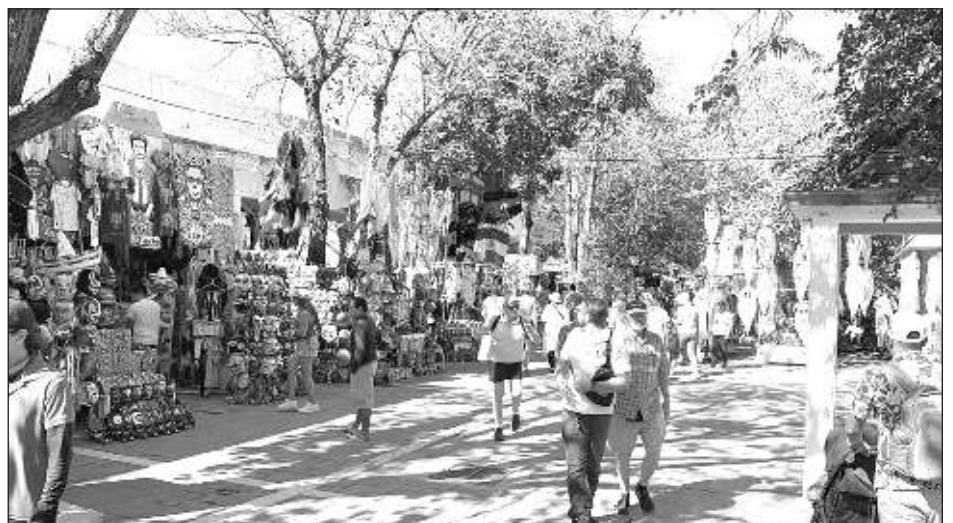
▲ En esta temporada vacacional destacó la preferencia de turistas por artículos que les permitan disfrutar de actividades al aire libre de manera más cómoda y segura.