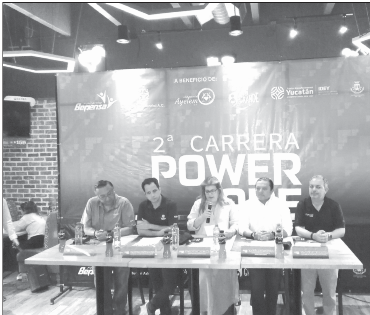
▲ La carrera con causa, que se llevará a cabo a lo largo de la Avenida 128, apoyará a las asociaciones civiles Club Especial Ayelem, Institución Asistencial A.C. y al programa Ser Grande de Fundación Bepensa.