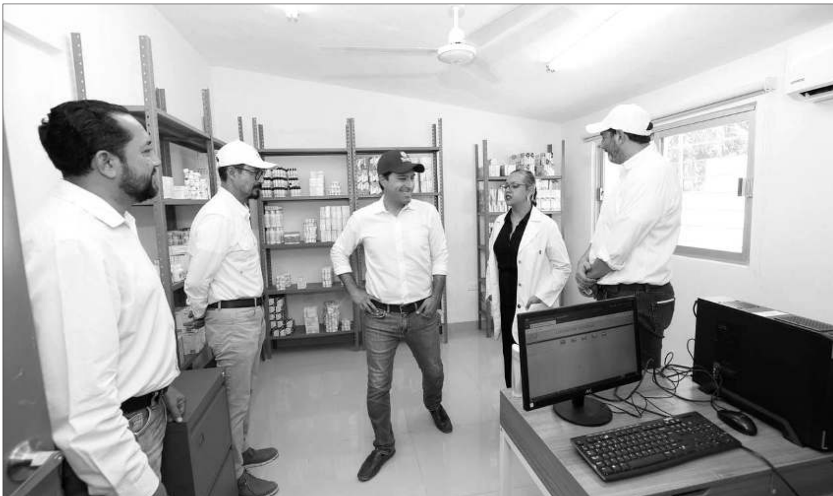
▲ Los trabajos de remodelación incluyeron la intervención de todas las áreas del centro de salud, como las salas de espera, vacunación, medicina general y curaciones; también incrementaron los baños públicos para mayor comodidad y atendieron los sistemas hidráulico y eléctrico.