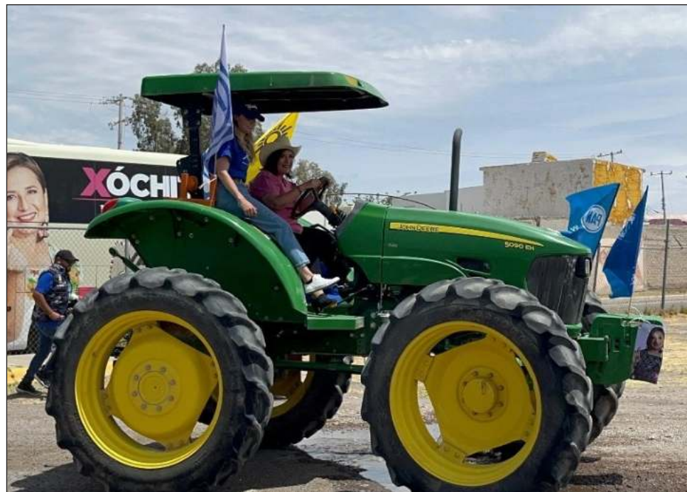
▲ “Esta es la realidad, a este gobierno no le importaron los campesinos, no le importaron los agricultores”, subrayó Gálvez durante su visita a Camargo, Chihuahua.

“Esta sequía ha dejado a muchas familias con muchos problemas, por eso ustedes