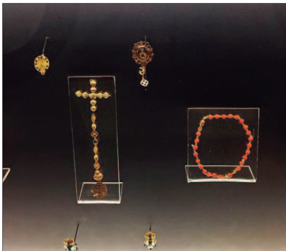
▲ La colección se compone de 420 piezas que forman parte de una investigación interdisciplinar: arqueólogos, estudiosos de la joyería, gemas, metales e ingenieros.

La colección está ahora en la muestra permanente El tesoro de Alacranes , en el Museo de Arqueología Subacuática El Fuerte de San José El Alto, en Campeche, estado del sureste mexicano.