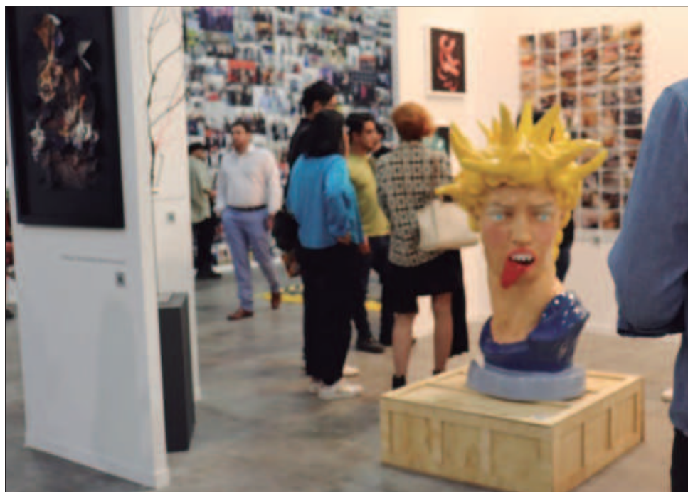
▲ La edición 20 de Zona Maco llegó a su fin el domingo pasado y fue visitada por 81 mil personas, quienes admiraron obras de los artistas más afamados hasta los menos conocidos.