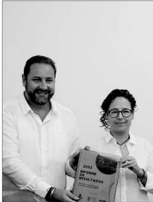
▲ Al inicio de la administración municipal, el porcentaje de turismo nacional y extranjero que llegaba al estado era de 8%, cifra que ahora en día asciende al 19%.

“Aunque estos datos indican que estamos dando resultados, con la información del estudio podremos