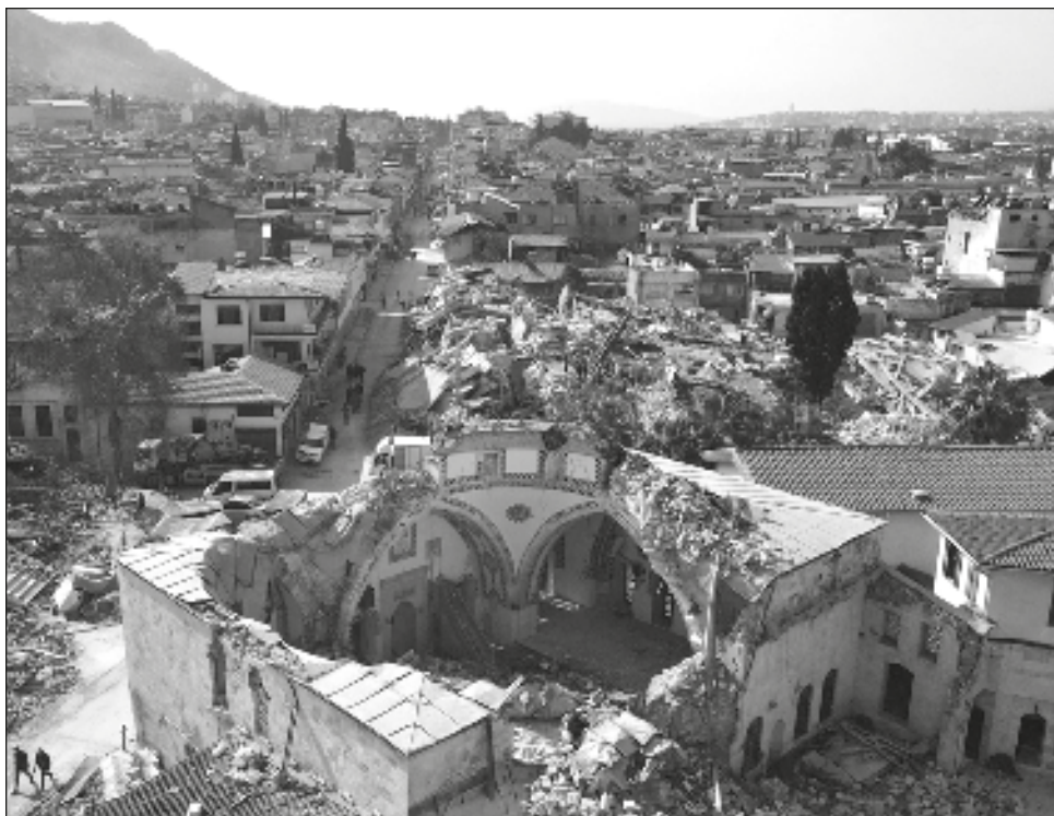
▲ La aguja de la cúpula de Habib-i Neccar, la mezquita más antigua de Turquía, yace ahora en el suelo, encima de los cascotes que recubren la sala de oración.