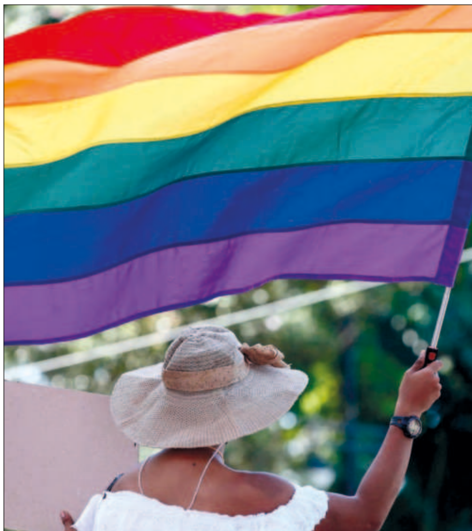
▲ En un informe, la organización con sede en Nueva York analiza la situación del colectivo en 26 países, incluidos varios latinoamericanos como México, Argentina y El Salvador.

“Cuando la policía allanaba burdeles y hogares, las lesbianas de aspecto masculino eran tratadas ‘como hombres’ (...) se las hacía arrodillar y se las obligaba a quitarse las camisetas”.