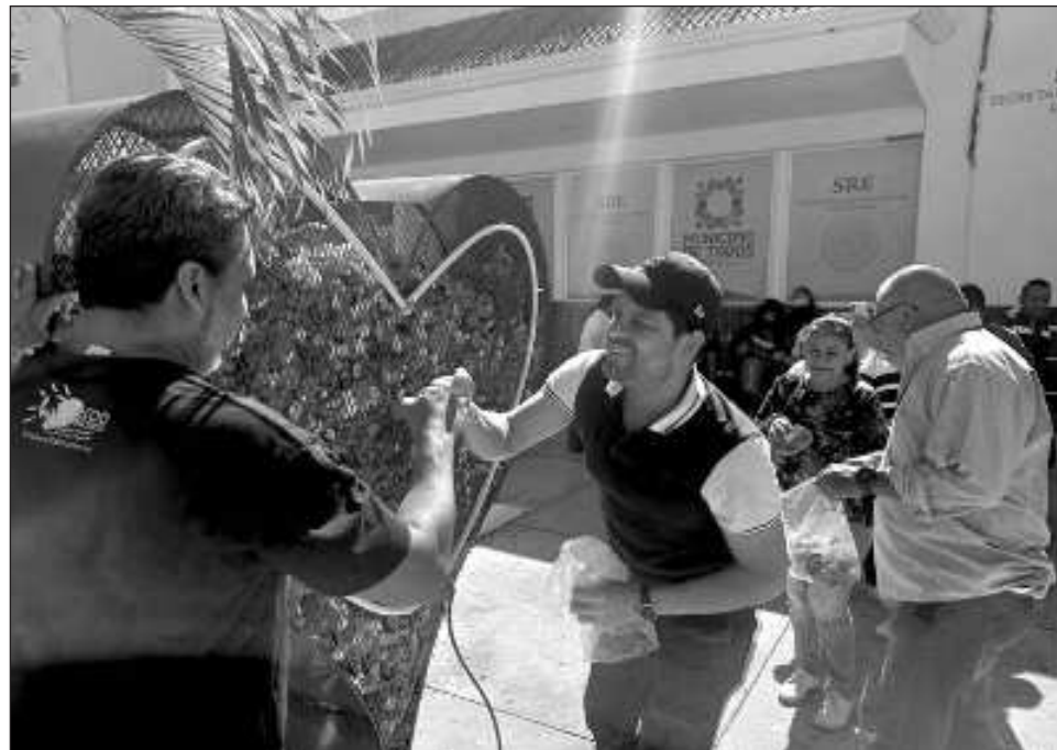
▲ En el marco del Día del Amor y la Amistad, así como en la víspera del Día Internacional del Cáncer Infantil, el director de esta dependencia hizo entrega del segundo Corazón del amor .

En el marco de la celebración del Día del Amor y la Amistad, así como en