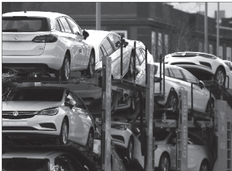
▲ Una de las metas de la Comisión Europea es que para 2030 todos los autobuses urbanos sean modelos de emisión cero, con motores que funcionen con electricidad o hidrógeno.

Al mismo tiempo, se propone recortar las emisiones de camiones pesados a partir de enero de 2030 en al