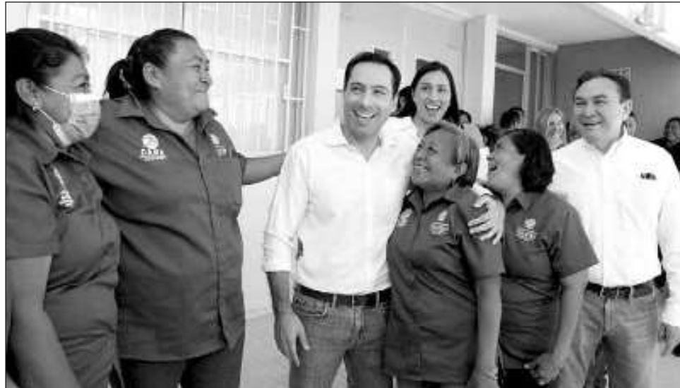
▲ El gobernador Mauricio Vila recorrió las renovadas instalaciones que contemplan áreas de dormitorios, sanitarios, comedor, auditorio, salones de primaria y secundaria, cómputo y usos múltiples, con capacidad para recibir a más de 110 atletas.

“Tiene 8 campos de béisbol; tiene un área de boxeo, que está también totalmente en mal estado; le queremos hacer un carril, para que la gente pueda correr y hacer