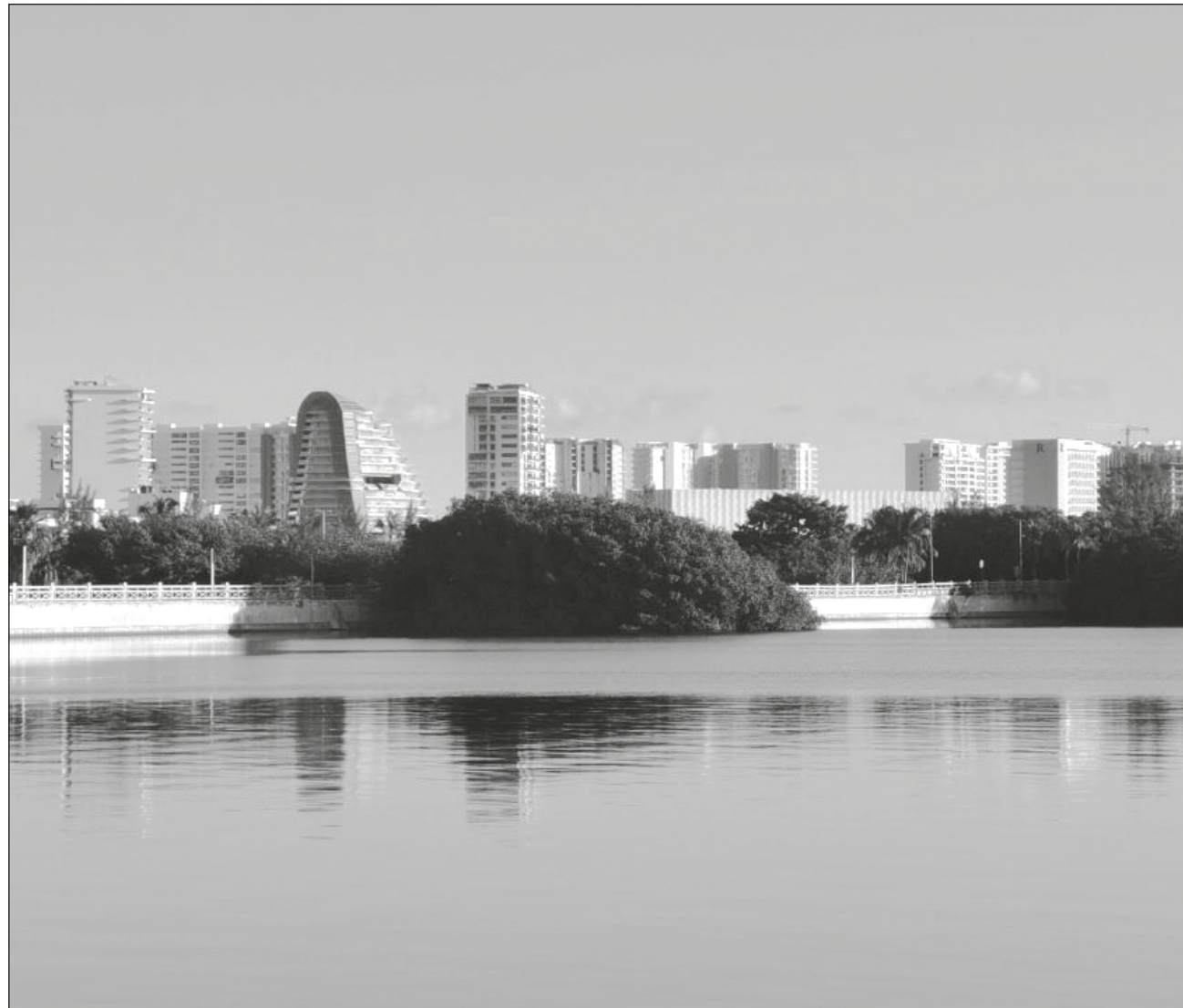
▲ Actualmente toda la zona de Tajamar está dividida entre propiedad privada, propiedad de Fonatur e incluso hay lotes del ayuntamiento Benito Juárez, pero jurídicamente ya no se puede construir en ellos absolutamente nada.

Actualmente toda la zona de Tajamar está dividida entre propiedad privada, propiedad de Fonatur e incluso hay lotes del ayuntamiento Benito Juárez, pero jurídicamente ya no se puede construir en ellos absolutamente nada, lo anterior a raíz de una sentencia judicial de 2017, cuando diversos grupos ambientalistas conformaron el movimiento Salvemos Manglar Tajamar ,