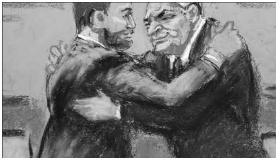
▲ Abogados de García Luna adelantaron que presentarán un testigo a favor de su cliente, tras lo cual ambas partes deberán presentar sus alegatos finales antes de que el jurado se retire a deliberar.