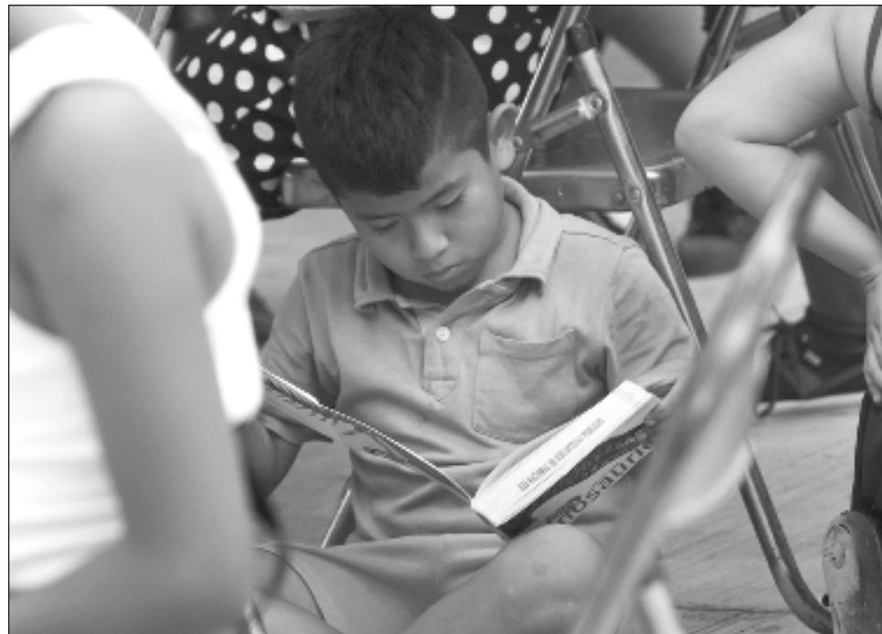
▲ Lo que busca Matific es que las niñas y niños puedan integrar la materia de las matemáticas al contexto diario, con ejemplos que van desde la preparación de un sándwich para interactuar con las fracciones, hasta la creación de un helado.

Con las matemáticas, refirió, pareciera que son solamente para quienes van a estudiar algún tipo de ingeniería y lo que Matific busca es que puedan integrar la materia al contexto diario, con ejemplos que van desde la preparación de un sándwich para interactuar con las fracciones, hasta la crea-