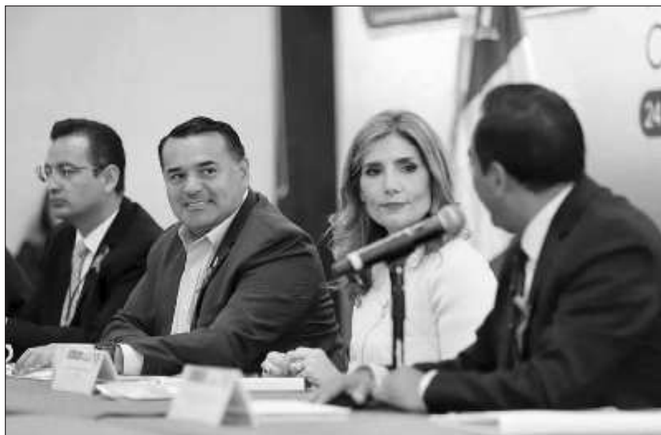
▲ El presidente municipal de Mérida señaló que uno de los objetivos de los trabajos que comienzan este jueves estriba en contribuir y fortalecer las labores de las embajadas y consulados.