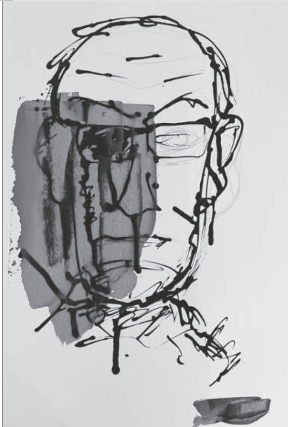
▲ “La herida del alma, sin embargo, tardará en cerrarse, y aún así, en las noches de lluvia le recordará siempre el filo de aquellos quince relámpagos”.

Perdió el ojo derecho y su mejilla luce ahora como