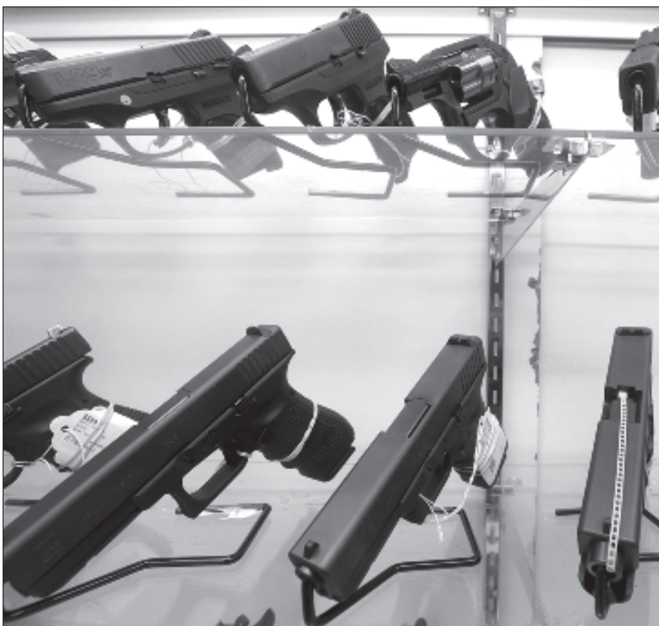
▲ Los fondos fueron aprobados por el Congreso en junio del año pasado, cuando demócratas y republicanos accedieron a aumentar el control sobre las armas de fuego.

Además de afectar a las personas, ambos expertos señalaron que el medioambiente también corre peligro pues el fuego, las cenizas y la toxicidad afecta a la vegetación, la tierra y a los recursos hídricos cercanos.