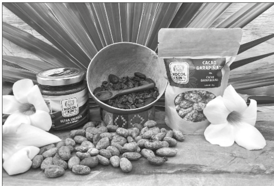
▲ La empresa local Equilibrio Maya ofrece en la exposición Punto México sus líneas artesanales de barras de chocolate, así como cacaos garapiñados, enteros y nips.

"Estaremos todo el mes de febrero en Punto México, en el cual vamos a destacar las líneas artesanales en diferentes porcentajes de nuestras barras de chocolate, tenemos una variedad muy rica elabo-