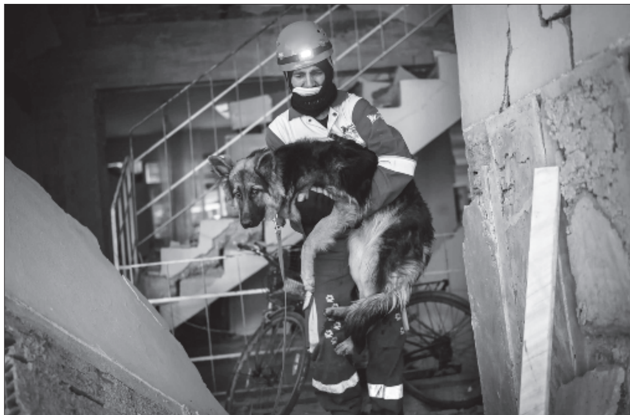
▲ Tras recibir un aviso sobre un perro aparentemente abandonado en el cuarto piso de un edificio, trabajadores de HAYTAP se pusieron los cascos y se abrieron paso hasta el apartamento para rescatar a un gran y peludo pastor alemán.