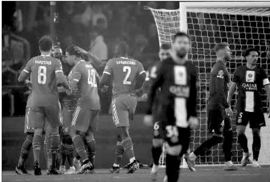
▲ El PSG de Messi y Mbappé está cerca de quedar fuera en la Liga de Campeones.

Inesperadamente, el astro mundialista Mbappé logró recuperarse rápidamente de una lesión. Sin embargo, le anularon dos goles por posición adelantada luego de ingresar en el