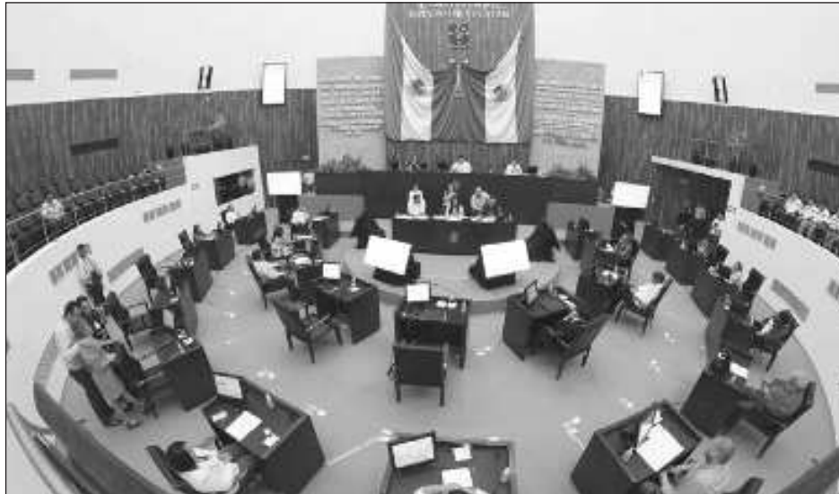
▲ La diputación local realizó este martes el análisis del informe, donde hubo discrepancia de opiniones entre apoyo a la información recibida y exhortos a la transparencia.