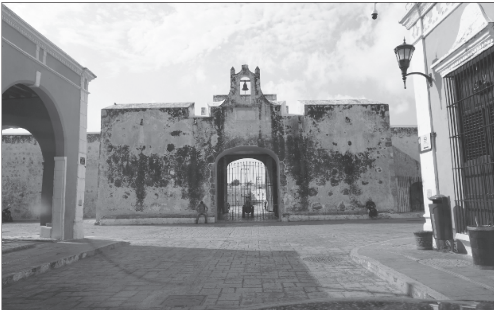
▲ "Los patronímicos se aplicaban para designar a los hijos, en este caso, a los de Álvaro, pero no todos los Álvarez eran parientes".