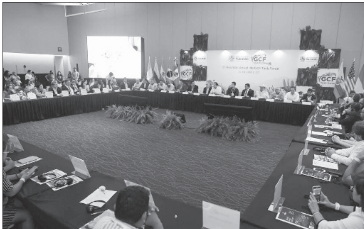
▲ “Siempre resulta alentador ver a tantas personas y organizaciones juntas alrededor de un propósito común tan valiosos como la conservación de los ecosistemas y la biodiversidad”.

No obstante, no puedo dejar de lado la sensación de que no todo es miel sobre hojuelas en el GCF, especialmente entre los estados mexicanos que se han incorporado hasta ahora a este colectivo. Parecen no entender que se trata de un grupo de trabajo de gobernadores; es decir, un grupo donde se reúnen los gobernadores de los estados o provincias participantes a trabajar, con el propósito de generar estrategias y propuestas de acción comunes, dirigidos a la implementación de programas dirigidos a proteger, conservar y res-