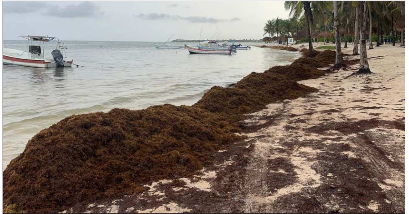
▲ “Es demasiado pronto, pero justamente por eso el gobierno y los hoteleros deben ponerse las pilas y reaccionar rápido; de lo contrario, podríamos enfrentar un año muy complejo”, detalló el especialista en manejo costero integrado y colaborador de Océanos International.

El especialista en esta área de conocimiento aclaró que, aunque existen herra-