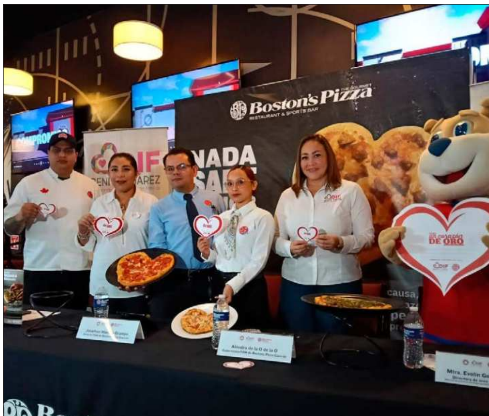
▲ La venta solidaria de corazones en 25 pesos iniciará a partir del 19 de enero y pizzas de corazón los días 12, 13 y 14 de febrero; por cada venta se donarán entre 25 y 30 pesos.