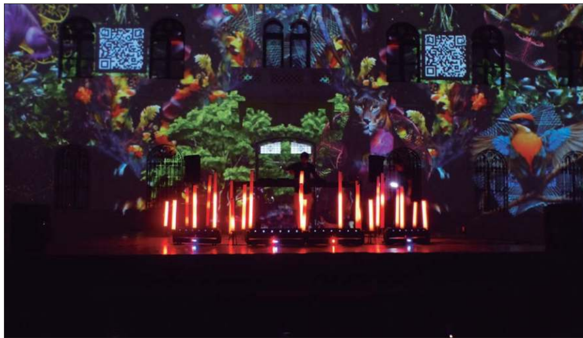
▲ “Este nuevo movimiento blinda la seguridad en la zona, y promueve nuevos emprendimientos, generando así más y mejores empleos, el comienzo de un círculo virtuoso”.

El espacio público de La Peni y el Parque de La Paz no se rescató de manera rápida: fue un trabajo constante, que implicó esfuerzo, imagi-