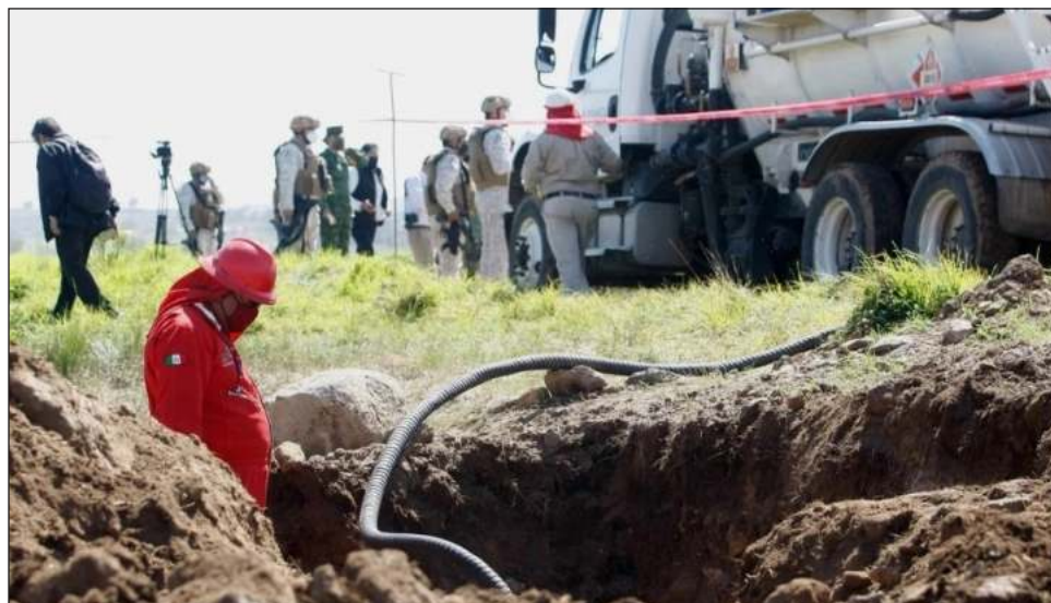
▲ Entre el primer año de la actual administración federal y septiembre de 2023, Petróleos Mexicanos reportó en su informe 31 mil 93 tomas clandestinas en el país.

El monto es superior a los 864 millones 69 mil pesos reportados por la propia petrolera en los primeros cinco años del sexenio de Enrique Peña Nieto. El dato proporcionado por Pemex respecto