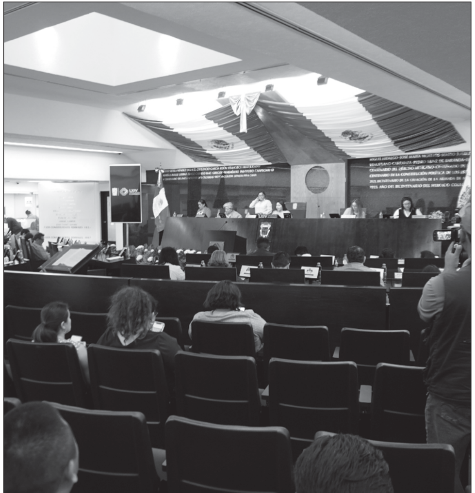
▲ El diputado priista explicó que el secretario general debe de tener probada experiencia en el ámbito legislativo, administración y además dominar el marco jurídico.