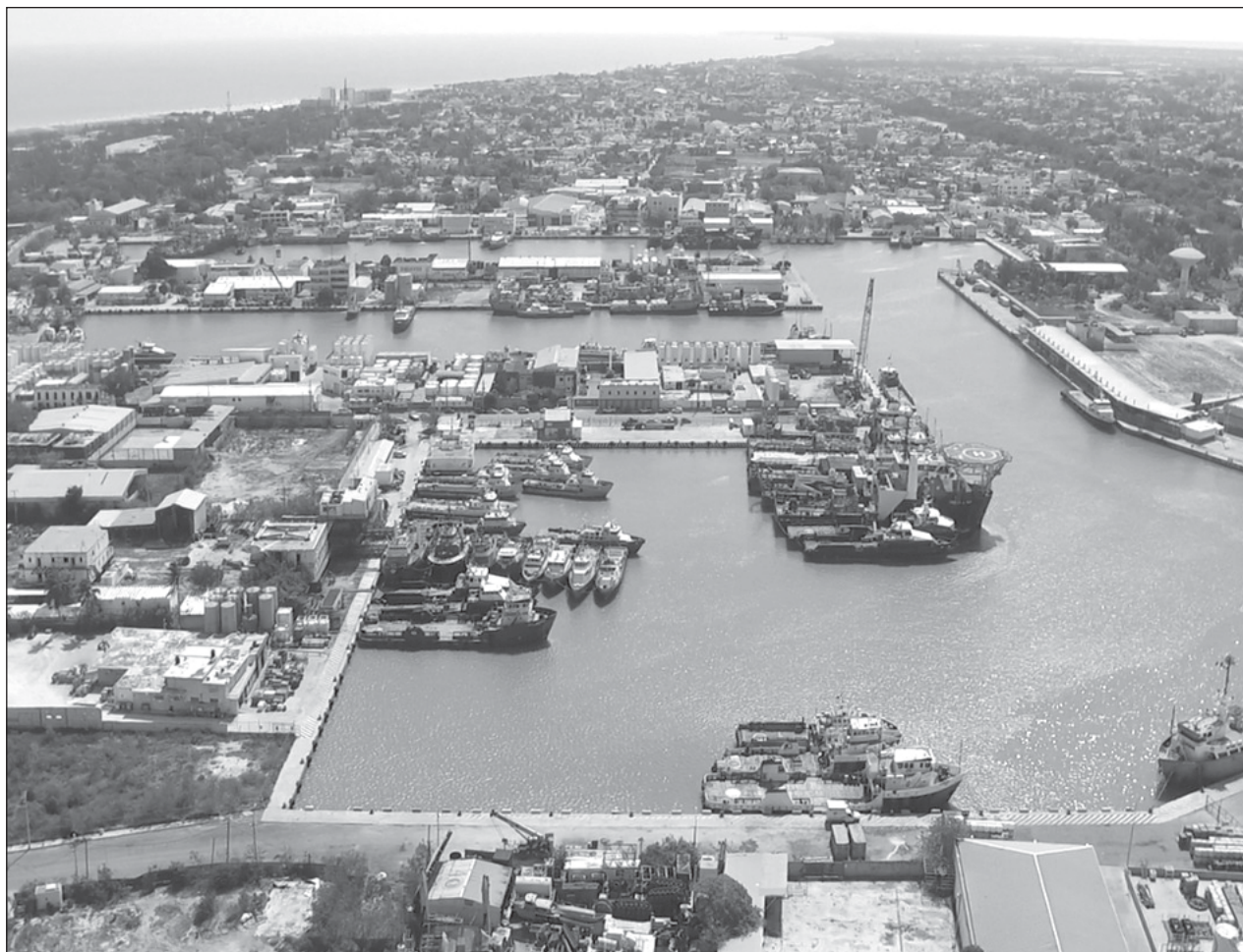
▲ Al registrar más de 615 mil embarques y desembarques durante 2023, que representa un incremento aproximado de 40%, comparado con el período anterior, Puerto Isla se consolida como la principal terminal petrolera del país.

Sostuvo que gracias a ese respaldo en el presente año iniciarán los trabajos de dragado de la Dársena 4 y posteriormente de las bocas de los ríos, lagunas y esteros de la Laguna de Términos para impulsar su rescate y recuperación.