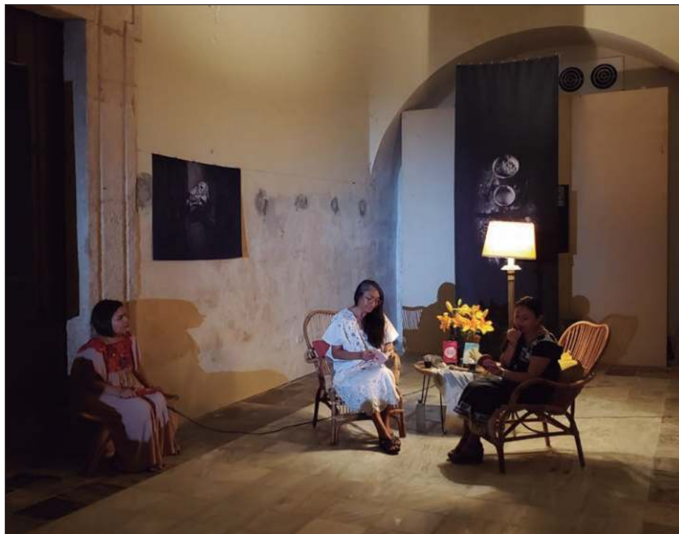
▲ En su compilación de poemas, la autora evoca el sentir de la mujer maya ante los procesos de discriminación a los que se ha enfrentado a lo largo de la historia.

“Aquí el invierno no sólo es una estación, sino tam-