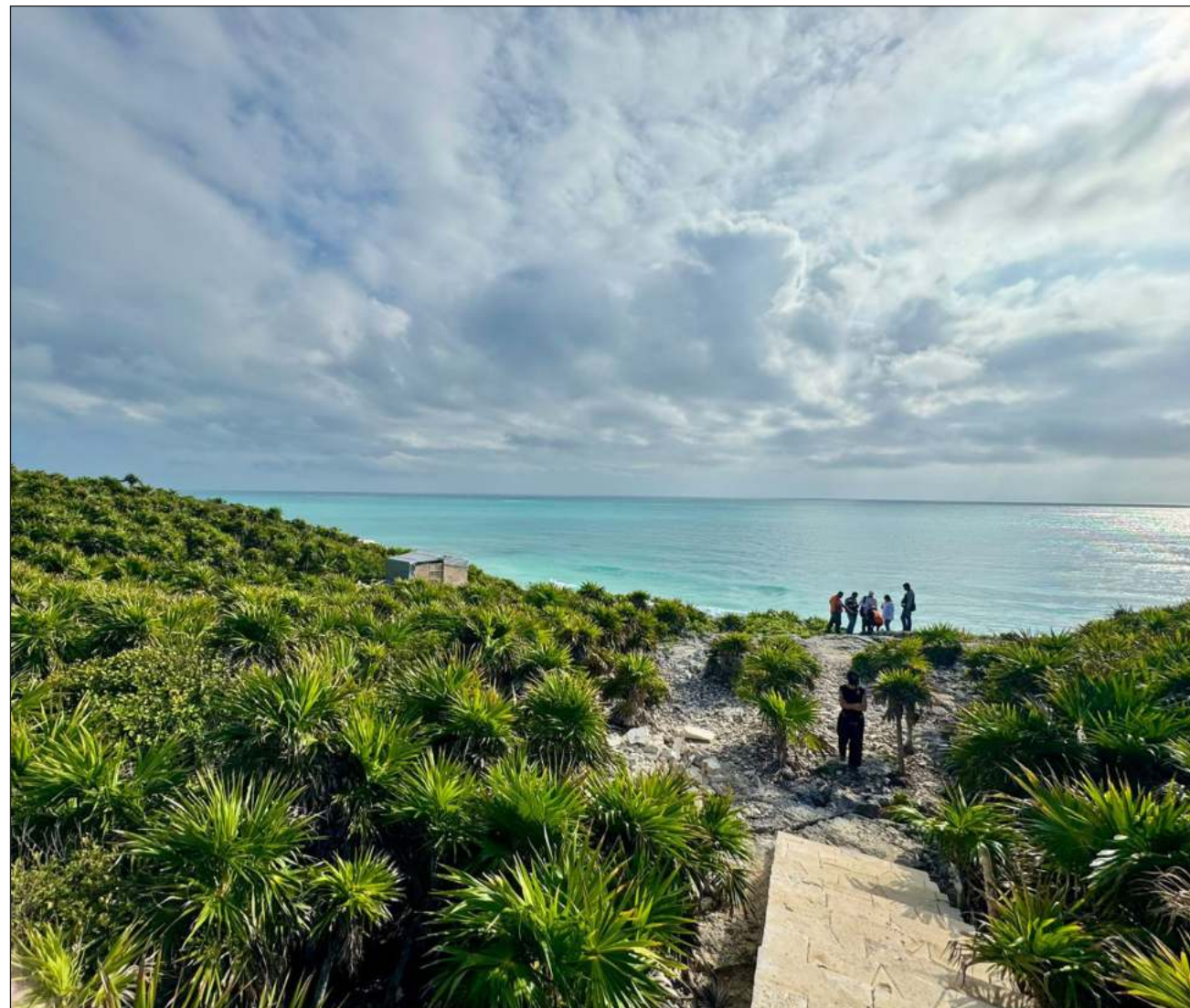
▲ El Parque Nacional Tulum tiene una superficie de 664 hectáreas y fue decretado como tal en abril de 1981.

También se definió la subzonificación del polígono, tomando en cuenta los siguientes aspectos: tipos de