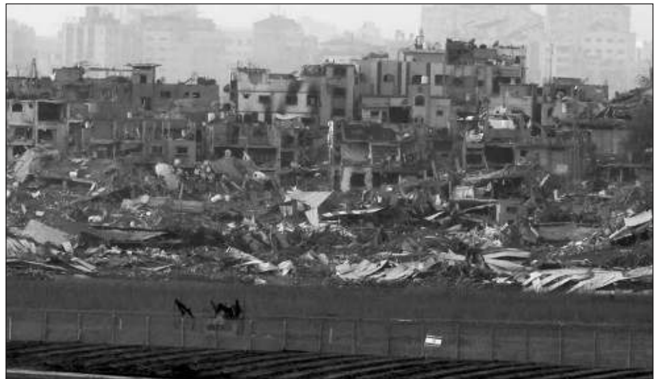
▲ "Nadie nos detendrá, ni La Haya, ni el Eje del Mal ni nadie más", declaró este sábado el primer ministro israelí, Benjamin Netanyahu, en referencia a la acusación presentada por Sudáfrica contra el Estado judío ante la Corte Internacional de Justicia.

Israel también se enfrenta en su frontera norte a ataques del movimiento