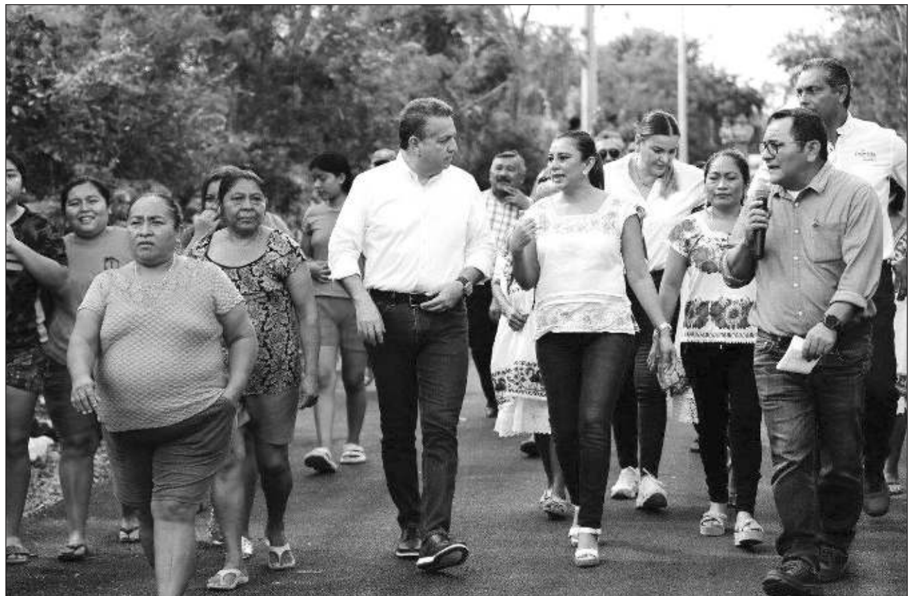
▲ Desde la comisaría de Hunxectamán, el alcalde de Mérida, Alejandro Ruz Castro, subrayó que “estas obras representan un trabajo en equipo en el que los propios ciudadanos asumen las decisiones para mejorar su entorno”.

Señaló que aún están en proceso la instalación de 19 sistemas pluviales y la construcción de 222 metros cuadrados de