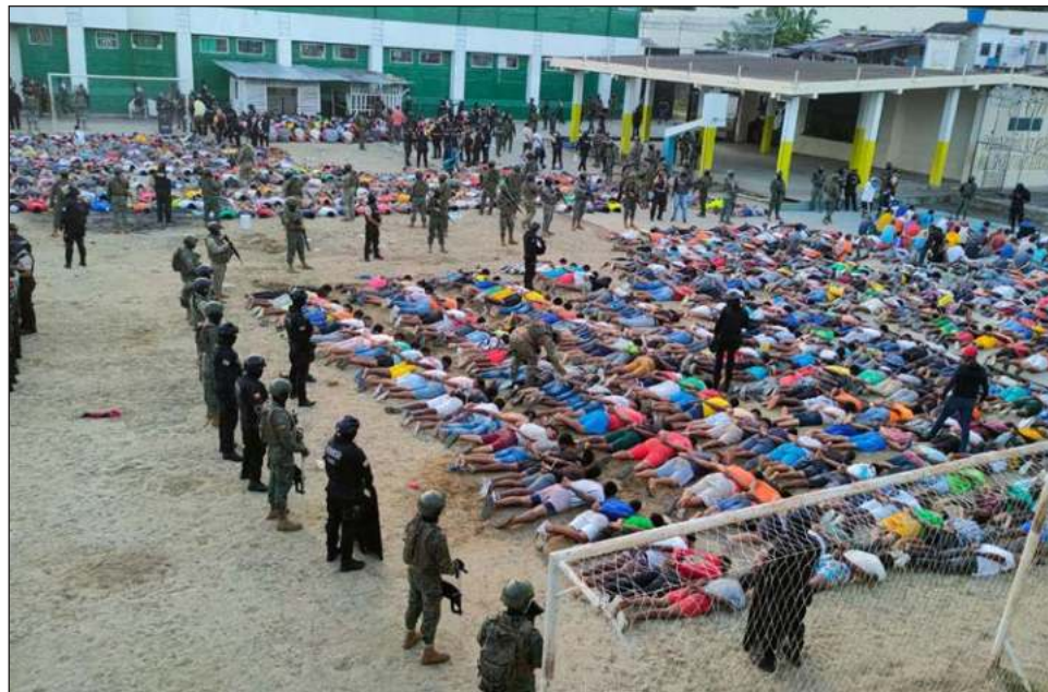
▲ A lo largo de una semana violenta a través de las medidas del gobierno de Daniel Noboa para doblegar al narco, lograron liberar a un total de 201 rehenes.

En medio de la ola de violencia que deja 19 muertos, circulan imágenes de crueles asesinatos de guardias, su-