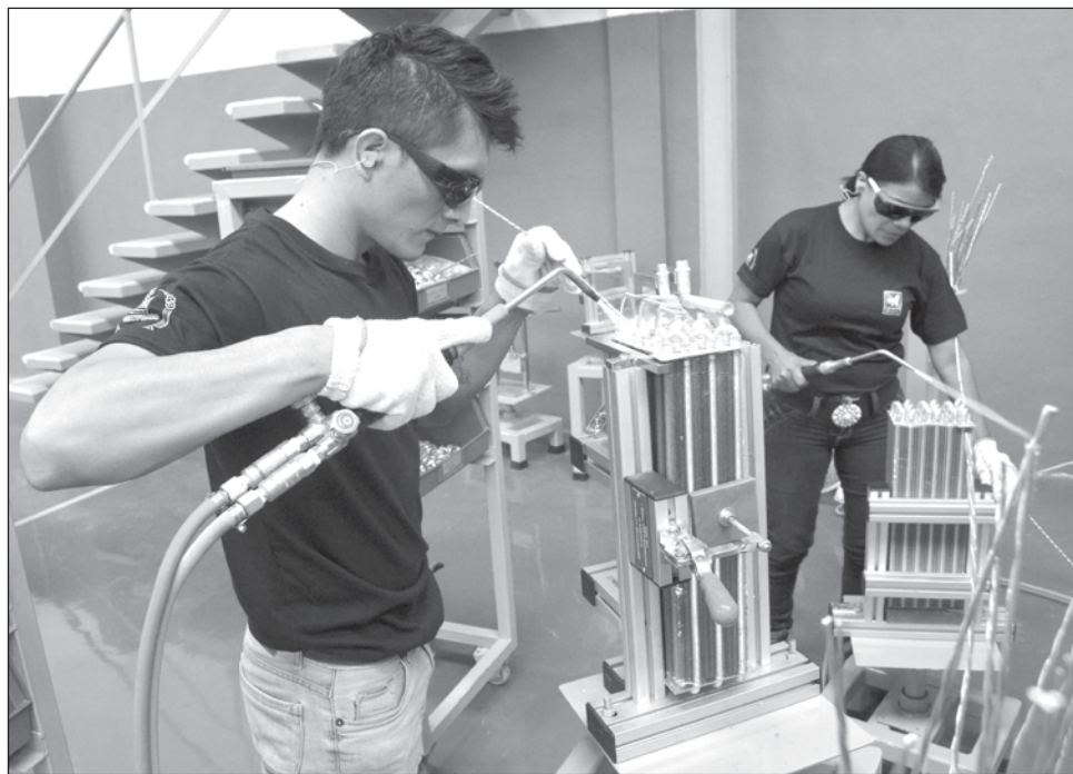
▲ El presidente de la Coparmex explicó que el Estado debe proveer de las herramientas necesarias para sentir seguridad para invertir, "porque las empresas deben ver redituable la instalación de sus oficinas a donde lleguen, si bien no se llega con la intención de hacerse millonarios de inmediato".

Mora Icaza afirmó que Campeche tiene un inmenso potencial para la generación