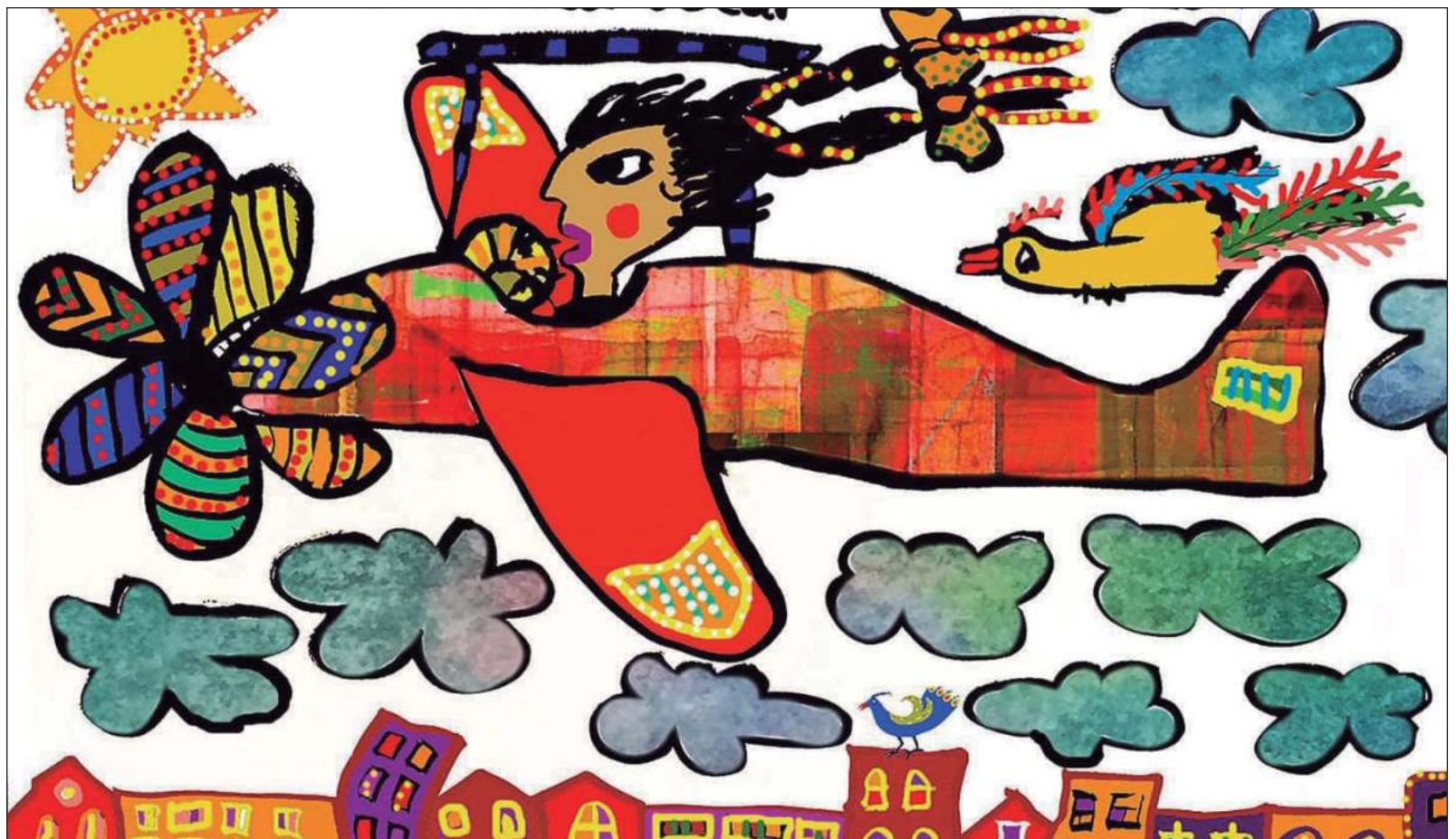
▲ "Los años transcurrieron y hoy, Kikí, tiene en una de las calles más importantes de San Cristóbal, su KikiMundo en el que los visitantes se asoman a disfrutar esa magia que ella percibió y ha traducido y forjado entre el dolor de ir perdiendo la vista".