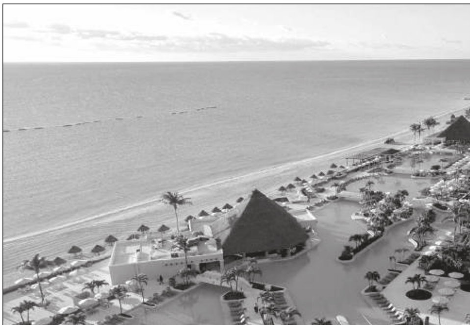
▲ En 2010, la recuperación de playas tuvo un costo de 800 mdp.

“Desde esa época estamos pagando 25 por ciento más de lo que era, no lo hemos dejado de pagar, pues que se genere un fondo previendo