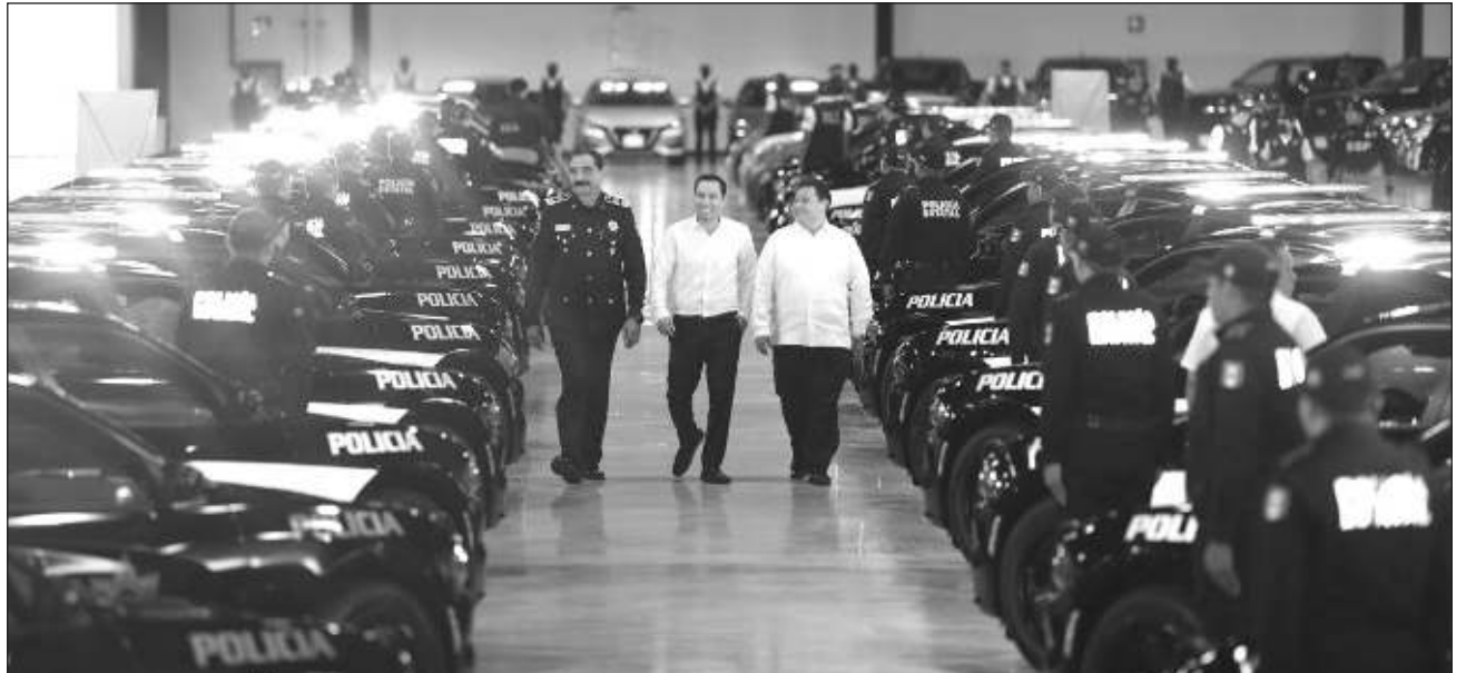
▲ El gobierno de Mauricio Vila ha incrementado la capacidad de respuesta de los elementos de la Secretaría de Seguridad Pública, quienes son los únicos que reciben un salario por encima del promedio nacional.

La policía de Yucatán es la única de todo el país