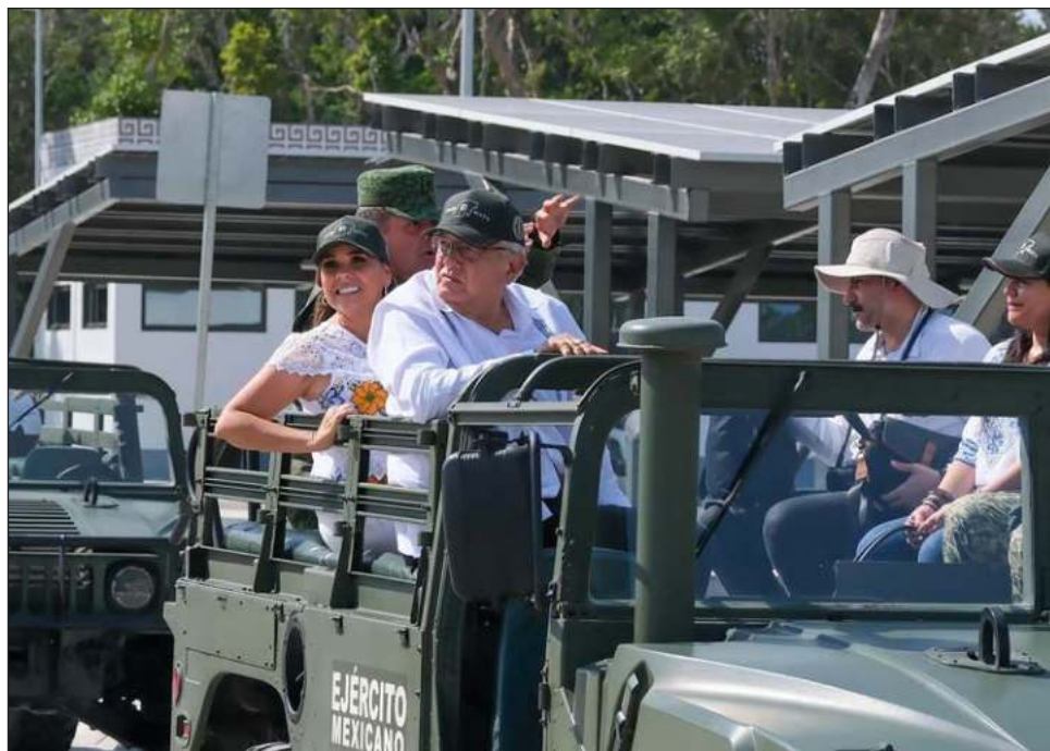
▲ El presidente Andrés Manuel López Obrador visitó la península de Yucatán el fin de semana para supervisar los tramos faltantes del Tren Maya.

El pasado 12 de enero adelantó en su conferencia