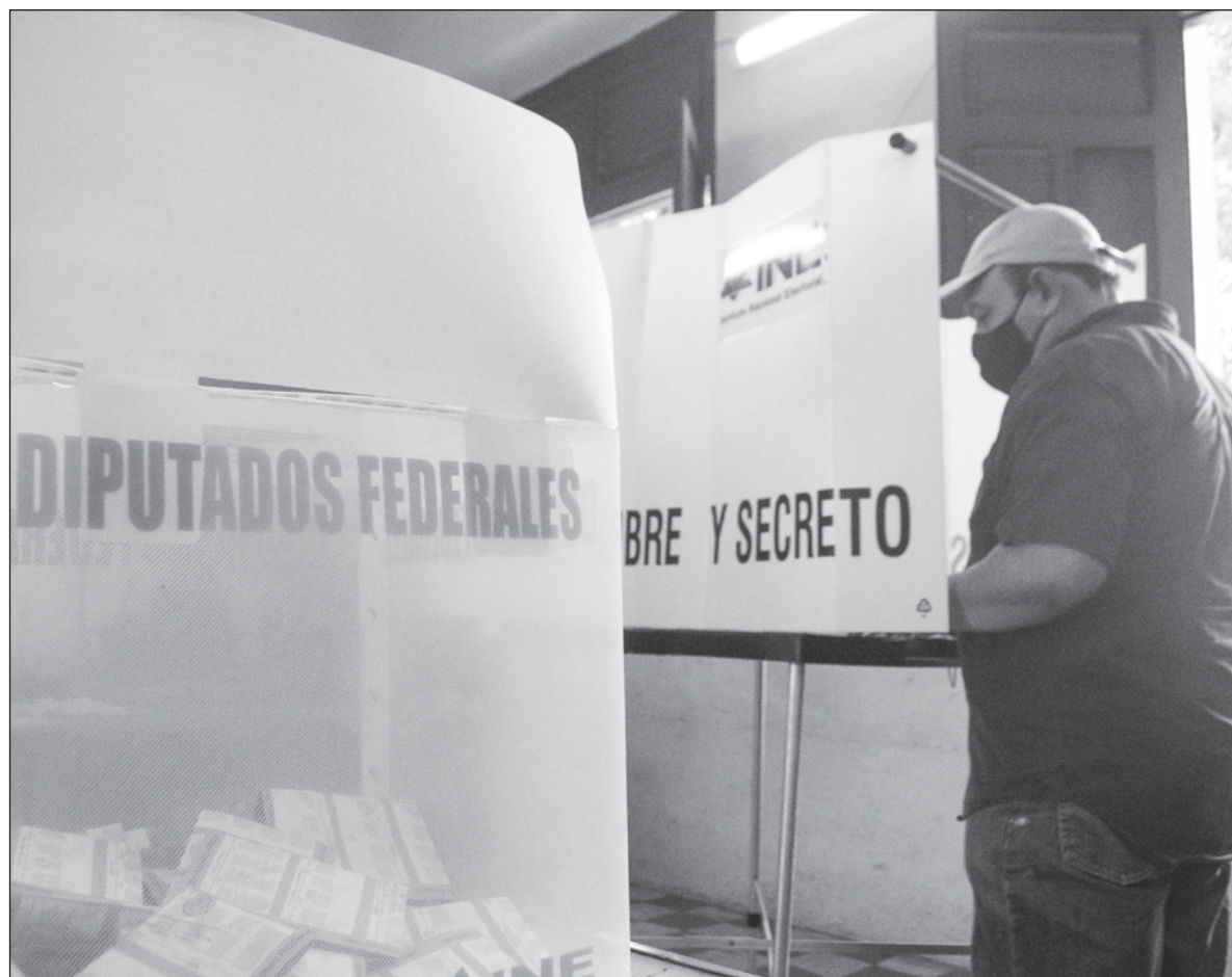
▲ “Es importante que la ciudadanía se involucre en los procesos electorales con el objetivo de dar certeza y legalidad de contar con instituciones electorales fortalecidas y justas”.

AHORA BIEN, EL Instituto Nacional Electoral (INE) uno de los