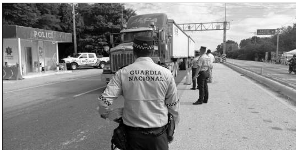
▲ Es imposible exigir al gobierno que proporcione una escolta de la GN a cada remolque, pero sí es lógico demandar la creación de condiciones que impidan la operación de células de la delincuencia organizada.

En la península de Yucatán, la incidencia de asaltos carreteros es baja a comparación de entidades del Bajío, Tamaulipas o zonas de Veracruz. Sin embargo, en los tres estados encontramos sucursales de las principales empresas de transporte de carga, y las locales también buscan ofrecer sus servicios fuera de la región, por lo que la seguridad para los cargamentos es un asunto que nos interesa a todos, aunque parezca que ocurre más allá del río Palizada.