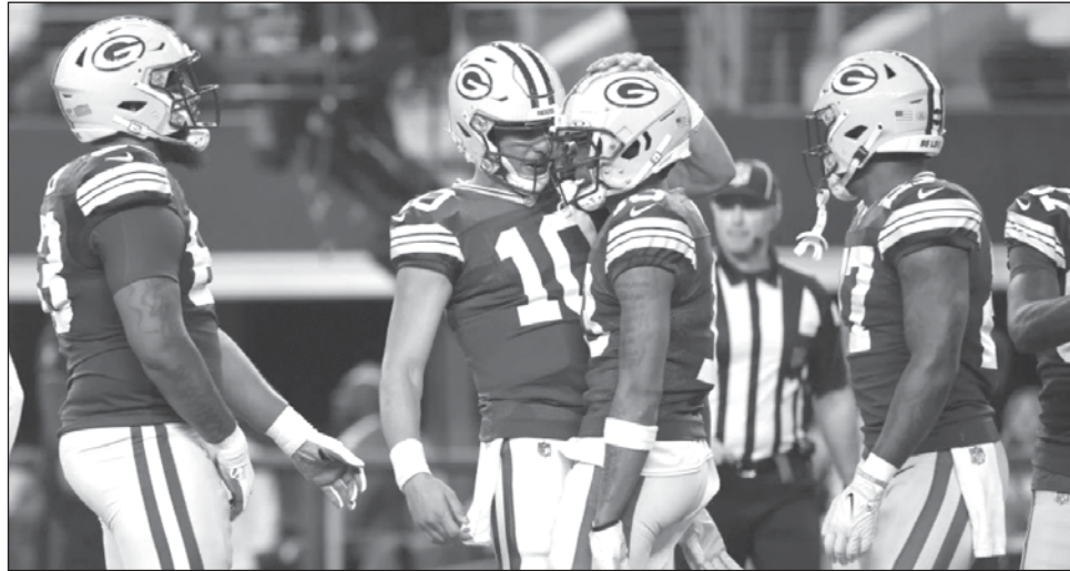
▲ El quarterback de Green Bay, Jordan Love (10), celebra junto al receptor Dontayvion Wicks (13) luego de combinarse para un pase de touchdown, ayer en Arlington.

Green Bay (10-8) visitará al número uno de la clasificación en la NFC, San Francisco, en choque de ronda divisional la próxima semana.