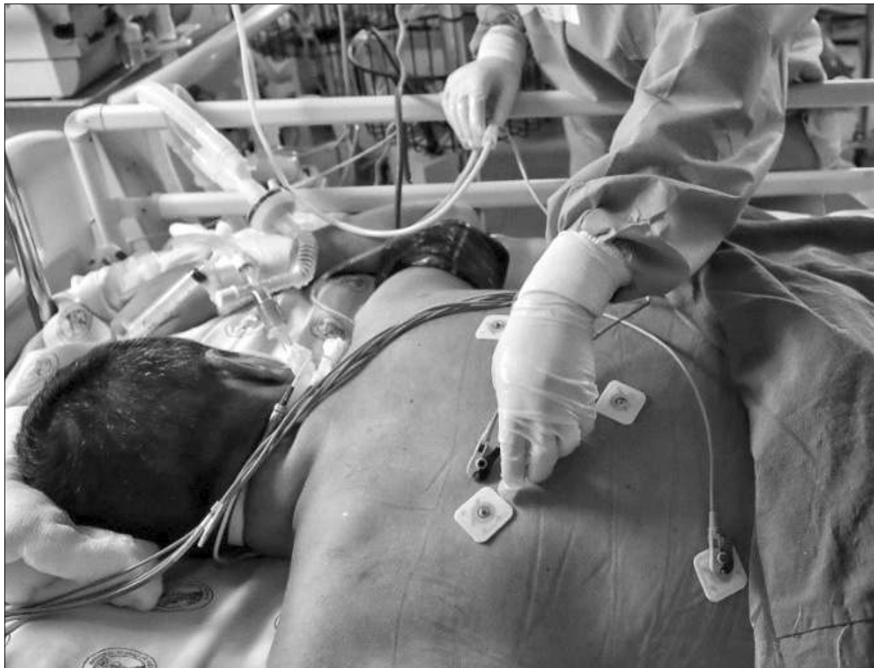
▲ Al comparar la curva epidémica de 2024 con los pasados cuatro años "se observa carga de enfermedad menor".

Actualmente los países del hemisferio norte están experimentando una actividad epidémica de enfermedad respiratoria aguda asociada a la circulación del virus de Covid-19, influenza, así como de virus sincicial, detalló.