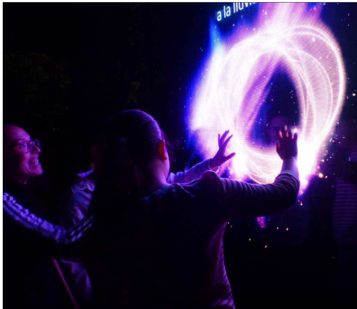
▲ "Con la luz de sus celulares, nuevas extensiones de los cuerpos, los asistentes pueden ir formando constelaciones en la fachada, escenario del videomapping de este espacio público".

En la frontera entre el parque y la explanada de entrada de la ex peni hay dos pantallas táctiles,