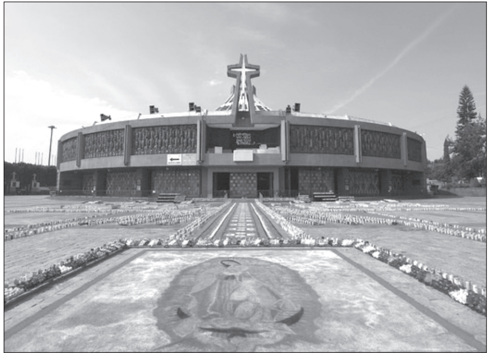
▲ Aspectos de la Basílica de Guadalupe, el Día de la Virgen.