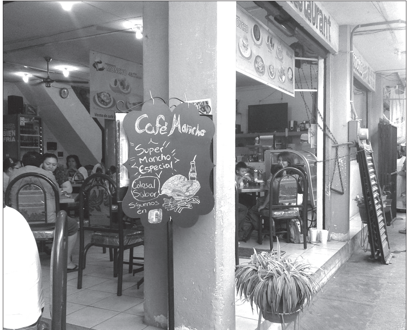
▲ La pandemia del COVID-19 se ha llevado muchas cosas, como uno de los corazones y almas del Bazar García Rejón y del Centro de Mérida.

Las personas de la tercera edad que a diario visitaban el lugar, para platicar y tomar café, se han quedado sin su espacio de convivencia. La pandemia del COVID-19 se ha llevado muchas cosas, como uno de los corazones y almas del García Rejón y del Centro de Mérida.