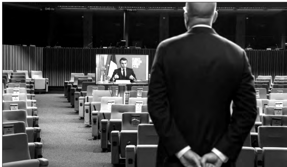
▲ Si no cambiamos de rumbo, nos podríamos dirigir hacia un aumento catastrófico de la temperatura media este siglo, señaló António Guterres, secretario general de la ONU.

Guterres hizo hincapié, en plena crisis por el COVID-19, en que el mundo ahora es 1.2 grados más caliente que durante la época preindustrial, y que si no cambia de rumbo, podríamos alcanzar un aumento