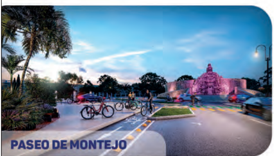
PASEO DE MONTEJO