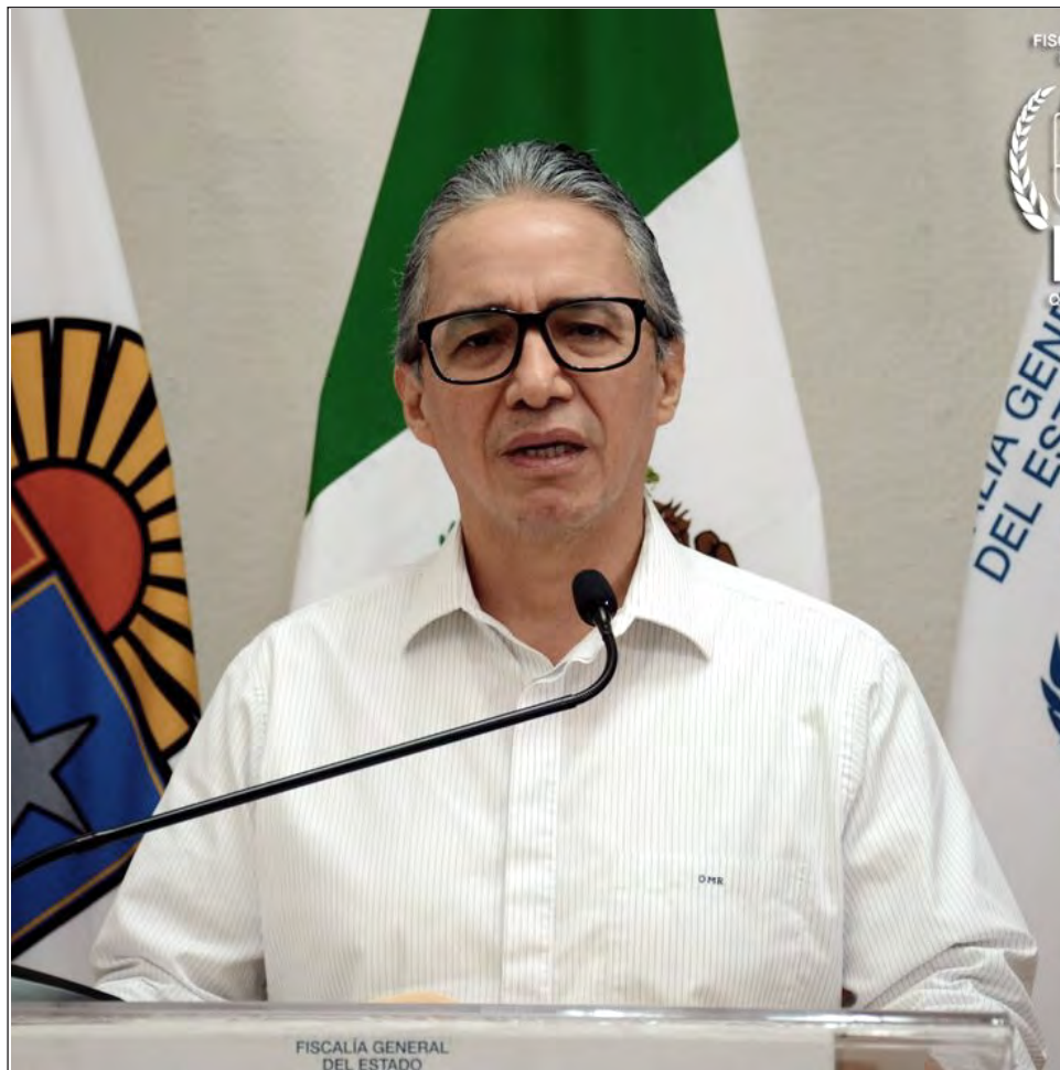
▲ La fiscalía señaló que nueve mandos de la policía municipal incumplieron con su deber.

“Se envió un desglose a la Fiscalía Especial para la Atención de Delitos Cometidos contra la Libertad de