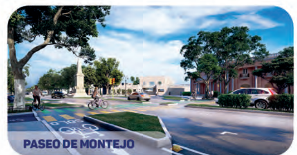
PASEO DE MONTEJO