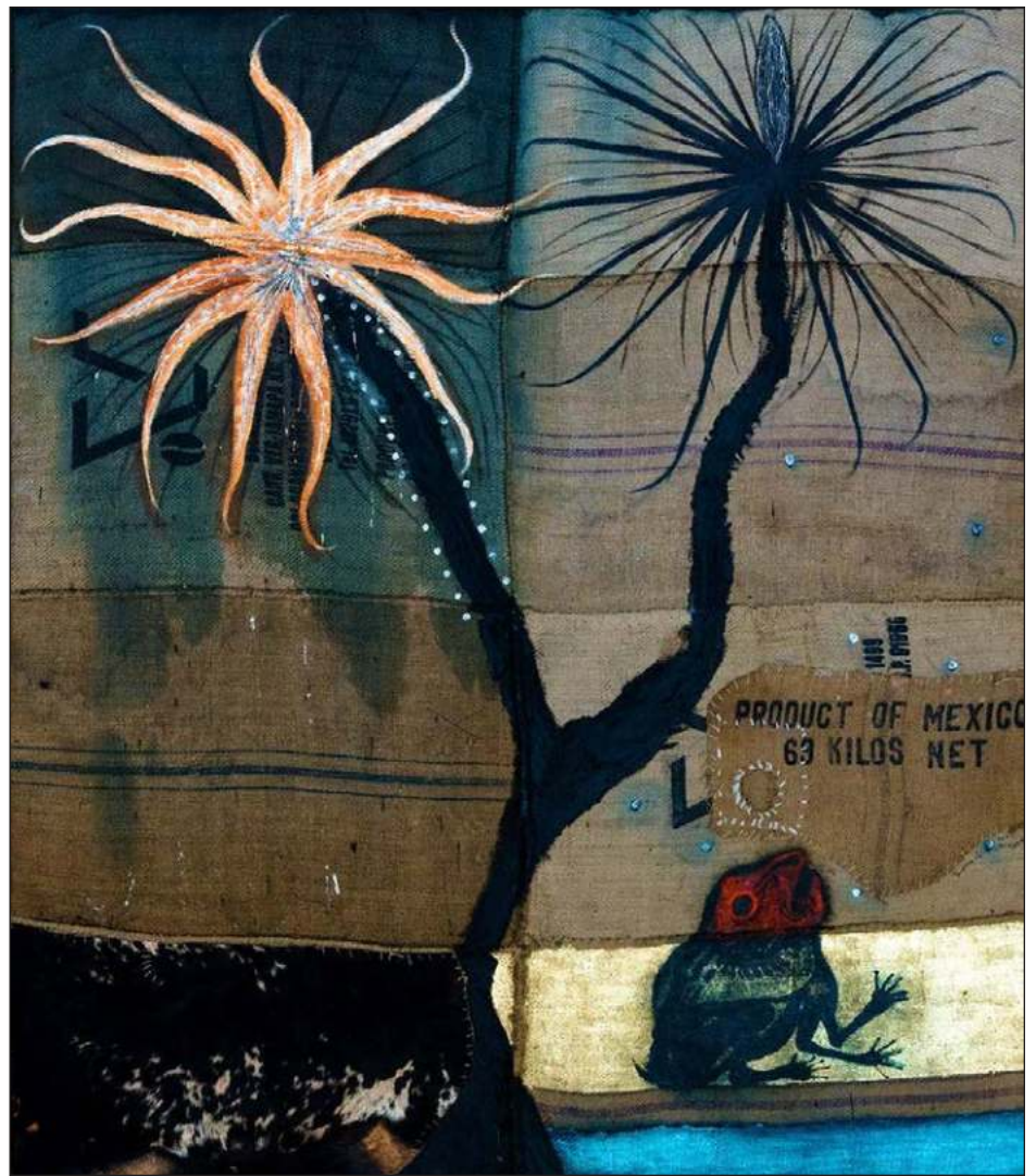
▲ Óleo sobre yute preparado con técnica mixta, 230x3195cm, 2023.