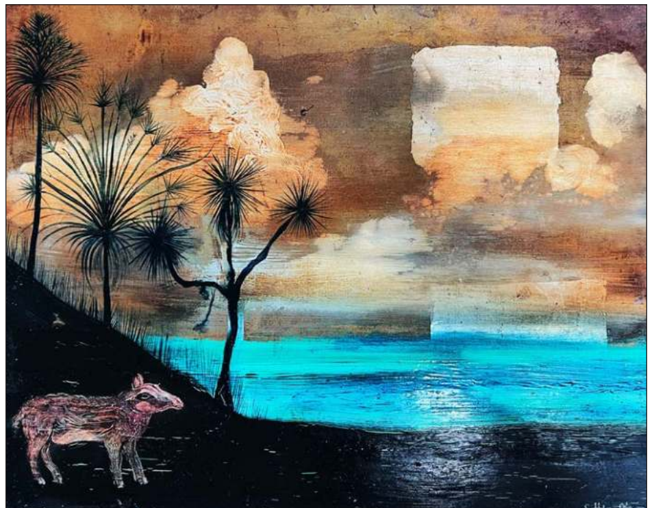
▲ Óleo sobre madera, 30x40cm, 2024.