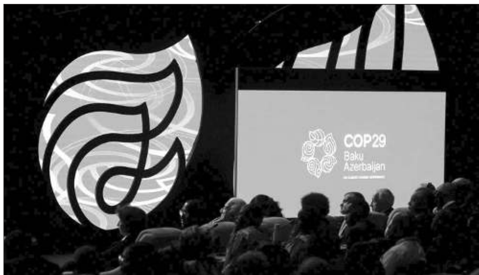
▲ El objetivo principal es lograr un acuerdo que aumente sustancialmente el dinero para combatir el cambio climático en los próximos años, detallando una cifra, quién paga y bajo qué condiciones.

El objetivo principal de la COP29 es concretar un aumento de las ayudas ac-