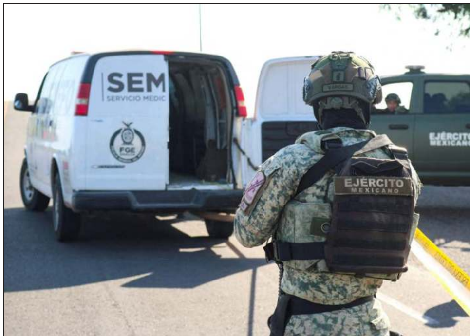
▲ El diplomático enfatizó que “la seguridad es un pilar fundamental de cualquier democracia” y expresó que por ello confía en que los planes del gobierno de Sheinbaum funcionen.

Luego de que por varios meses había asegurado que no hubo ninguna pausa en las relaciones con su gobierno, como lo decretó en junio el presidente López Obrador tras declaraciones de Salazar en contra de la reforma judi-