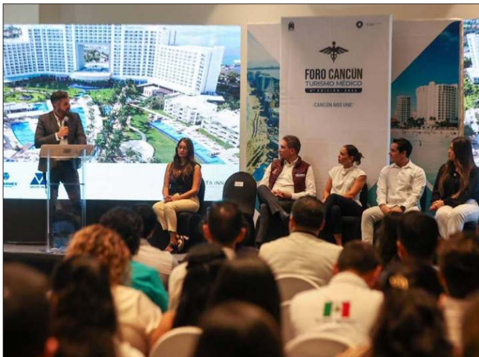
▲ La Segunda Edición del Foro Cancún Turismo Médico se llevó a cabo el miércoles y expertos y autoridades intercambiaron estrategias en torno al segmento.

En el foro estuvo presente el secretario estatal de Salud, Flavio Carlos Rosado, quien aseguró que al tener Quintana Roo un altísimo flujo de turismo y una población en constante crecimiento, la vigilancia epidemiológica y la sanidad internacional son pilares para disminuir riesgos de enfermedades infecciosas en la población y los turistas, por lo que las estrategias conjuntas enfocadas al bienestar de la población han permitido que actualmente se posicione la entidad en el lugar número 24 a nivel nacional por casos de dengue.