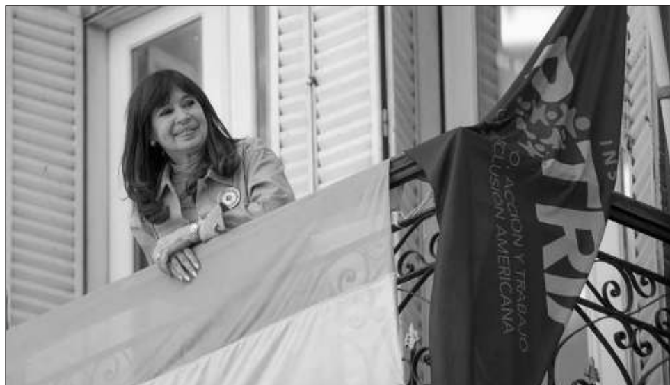
▲ En caso de que se apele el fallo, será la Corte Suprema de Justicia la que dé una resolución definitiva; si la condena resultase ratificada, Fernández podría cumplir la pena bajo prisión domiciliaria.

Los jueces rechazaron tanto los recursos de la fiscalía como los de las defensas, por lo que quedaron confir-