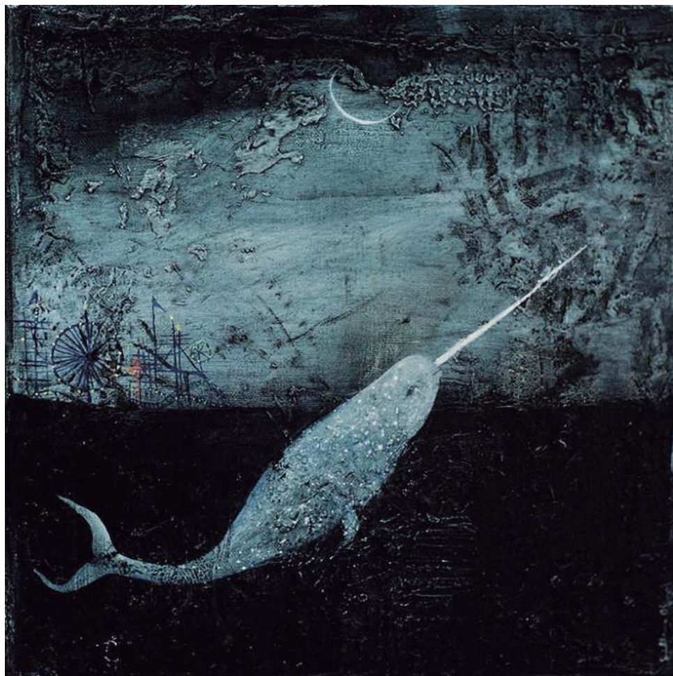
▲ Óleo sobre lienzo, 30x30cm, 2024. Reprografía Julio Carrillo