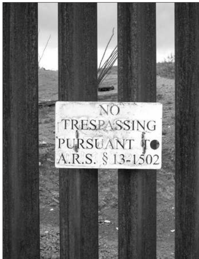
▲ La Presidenta indicó que "lo más importante es demostrar, con información, los beneficios para Estados Unidos del trabajo de nuestras y nuestros paisanos allá".

Ya hace 20 años, el director Sergio Arau intentó dar un mensaje sobre el tema con la película/documental Un día sin mexicanos , que aunque restringido al espacio de California, bien puede aplicar a todo Estados Unidos. Sin embargo, dos décadas después, el ambiente en ese país resulta adverso a la migración, especialmente a la que llega de países donde impera