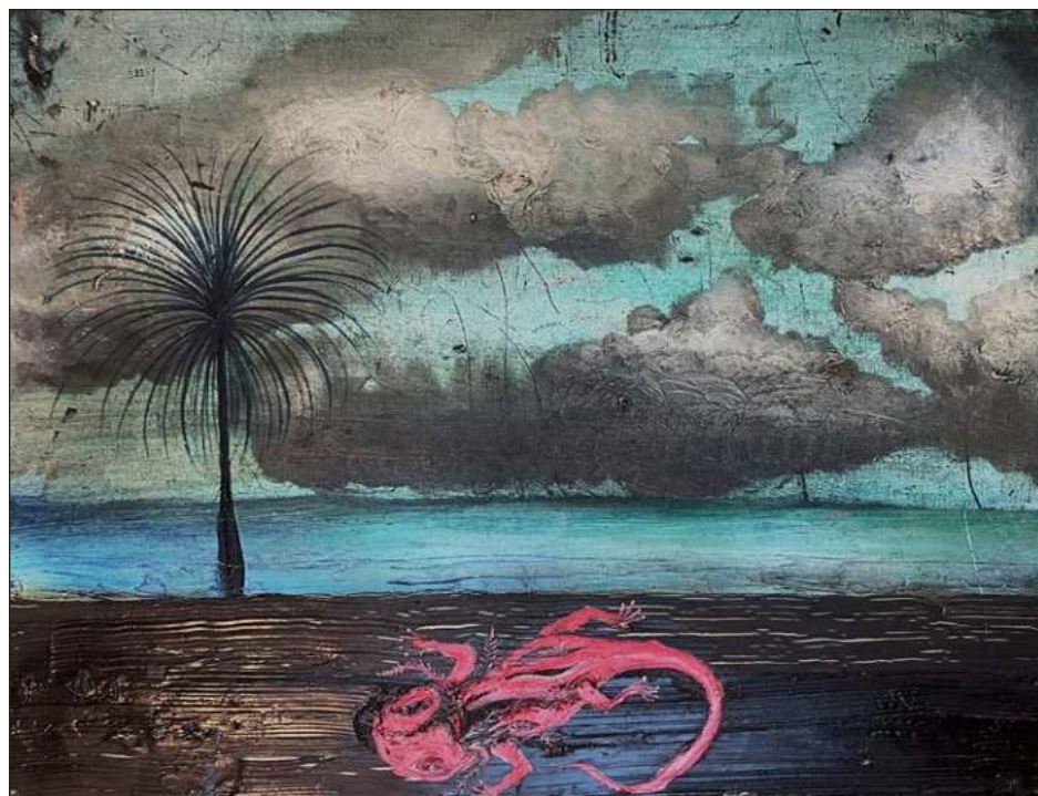
▲ Óleo sobre madera, 30x40cm, 2024.