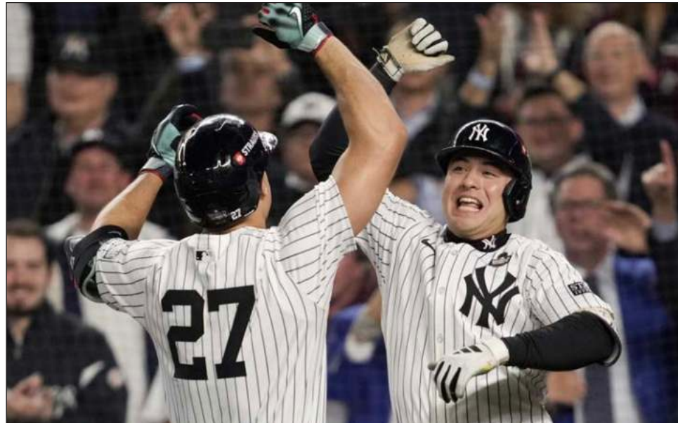
▲ Los Yanquis de Nueva York llegaron a la Serie Mundial por primera vez desde 2009.

La preocupación de los Cardenales por su futuro financiero debería ser bastante alarmante. Esta ha sido una de las franquicias más consistentes en las últimas décadas y se coronó en 2006 y 2011. Puede que no gaste como Dodgers, Yanquis o