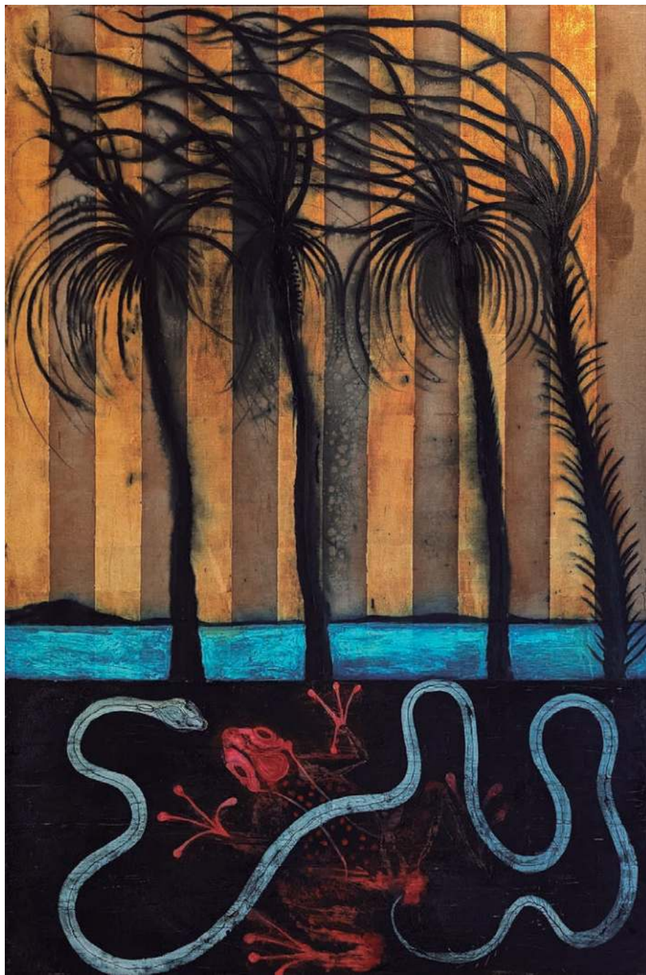
▲ Óleo y hoja de cobre sobre lino, 300x200cm, 2024.

recuperar el municipio que considera que les robaron: Progreso. Y otros bastiones como Motul y Kanasín que en estas elecciones no se concretaron.