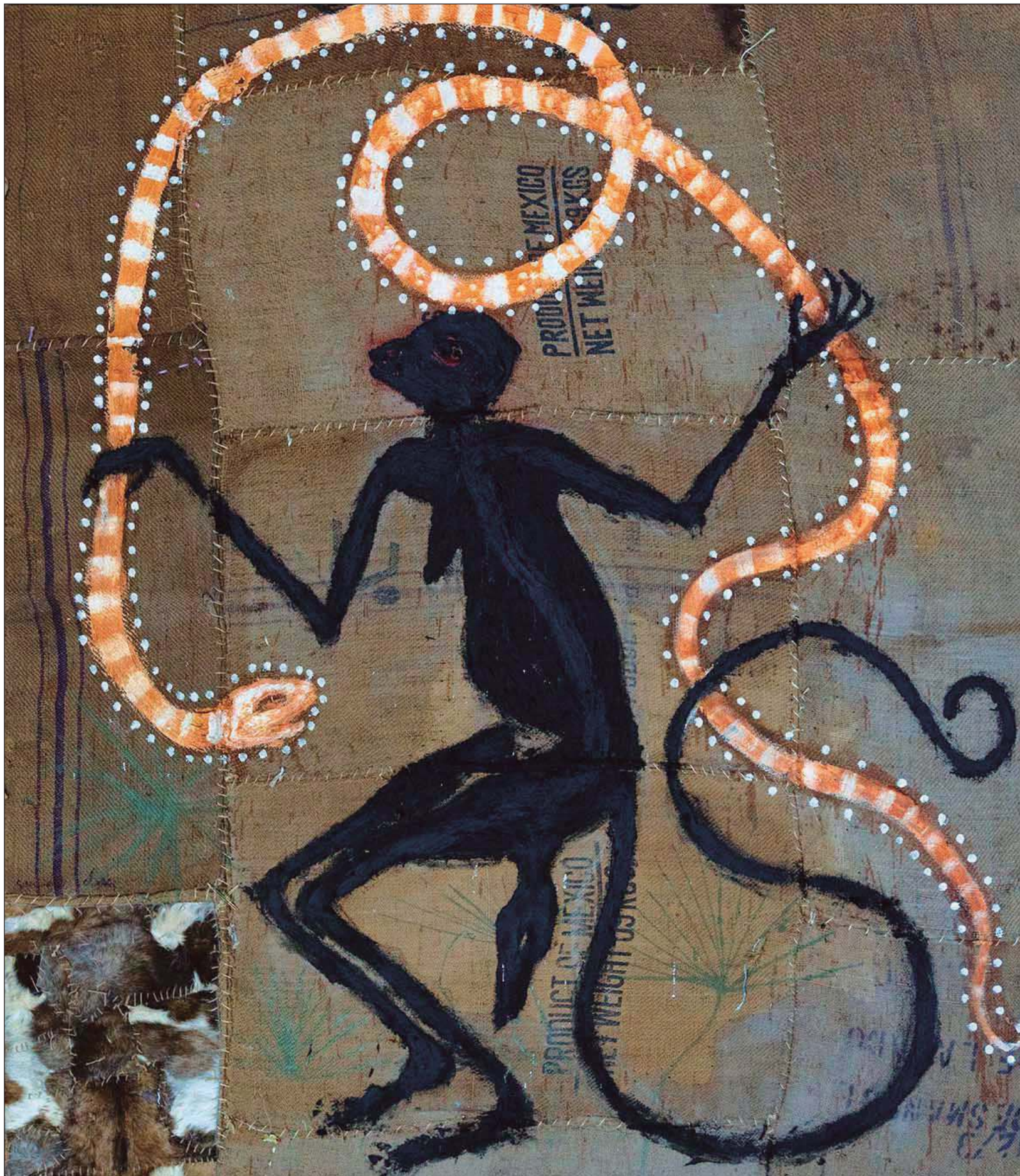
▲ Óleo sobre yute preparado con técnica mixta, 200x300cm, 2023.