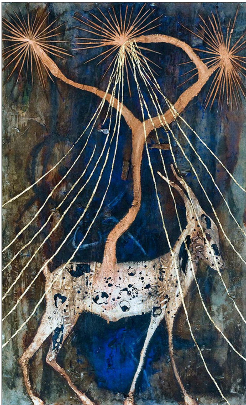
▲ Óleo sobre lienzo, 150x100cm, 2023.

especial al sentido del “viaje” como distancia-profundidad y como ejercicio de conocimiento que une la experiencia con la obra, estimulando la labor crítico-reflexiva. Ciencia y arte, arte y política, se abrazan en una relación unívoca que es, finalmente, el soporte de todo el hacer del cien-