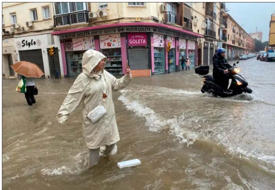
▲ Las condiciones meteorológicas obligaron a interrumpir el tren entre Barcelona y Valencia, así como también a aplazar al menos hasta el mediodía la reactivación de la línea de alta velocidad que une la tercera ciudad de España con Madrid.

El temporal llevó a posponer al viernes una eliminatoria entre España y Polonia de la Copa Billie Jean King de tenis femenino que debía jugarse la tarde del miércoles en Málaga.