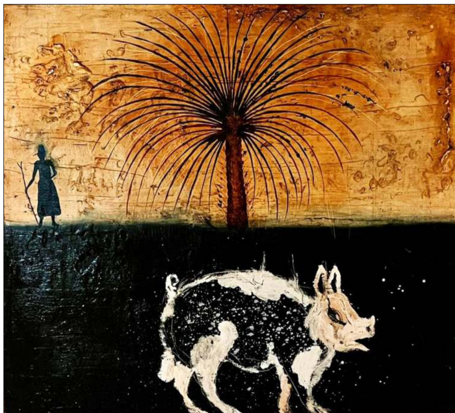
▲ Óleo sobre lienzo, 100x120cm, 2024.