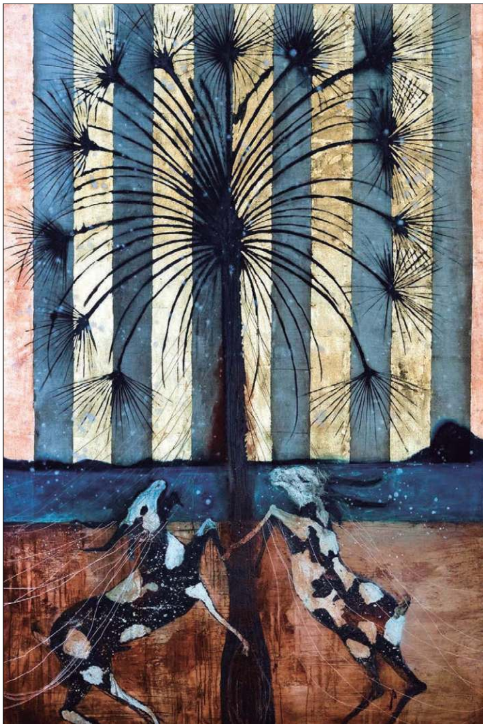
▲ Óleo y hoja de oro sobre lino, 300x200cm, 2024.

mencionar que lo más complicado para esta intervención es lograr hacer conciencia que la diabetes es un padecimiento silencioso. Entender que el sentirse bien, no es sinónimo de estar bien, que muchas veces el deterioro del bienestar es tan lento y gradual que no logra percibirse hasta que el daño está muy avanzado.