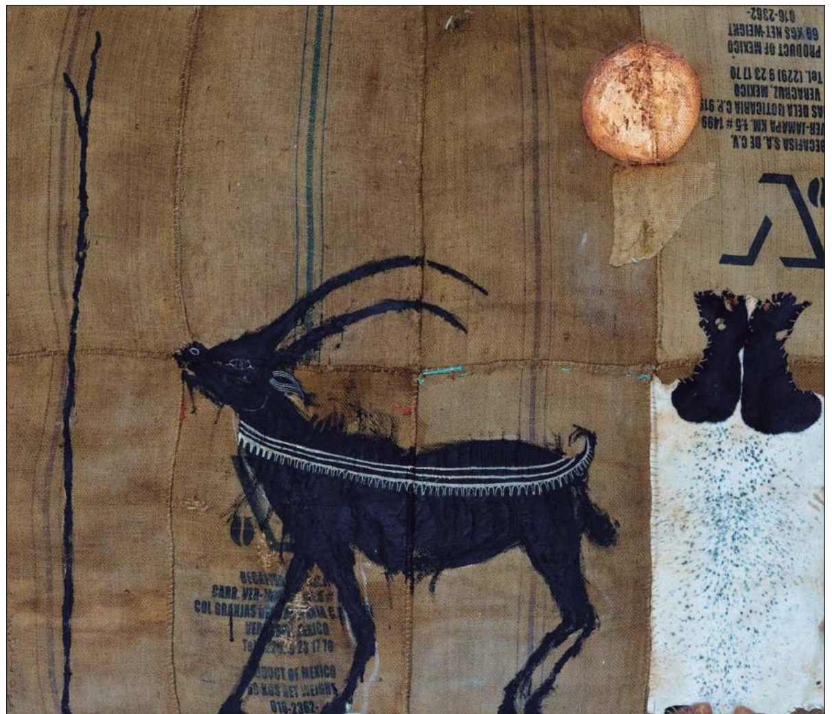
▲ Óleo sobre yute preparado con técnica mixta, 200x300cm, 2023.