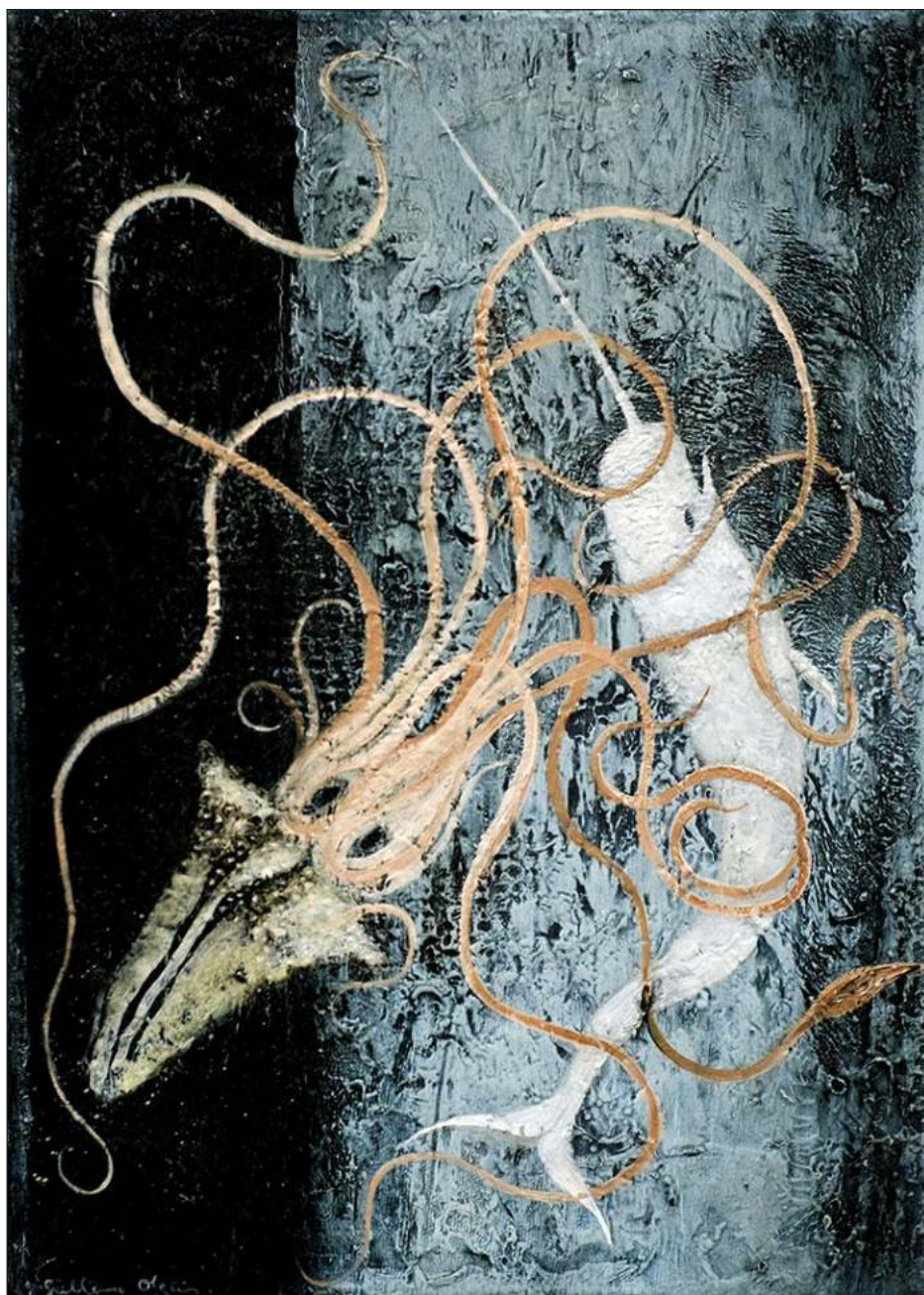
▲ Óleo sobre lienzo, 35x25cm, 2024.