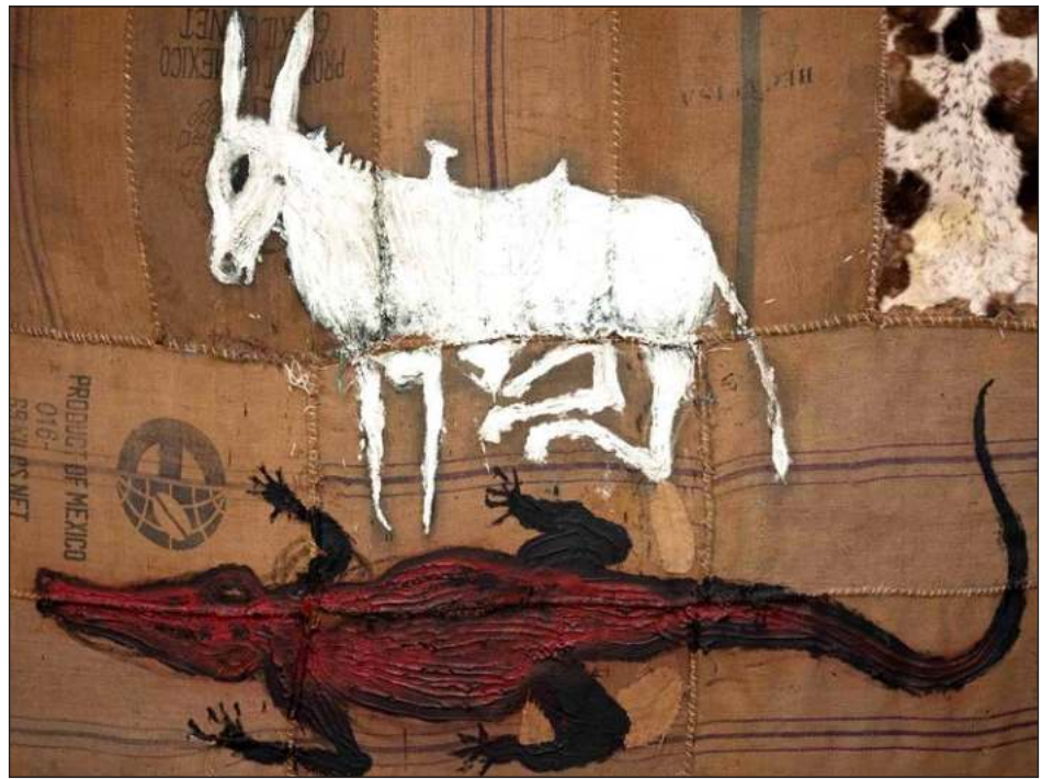
▲ Óleo sobre yute preparado con técnica mixta, 200x300cm, 2023.