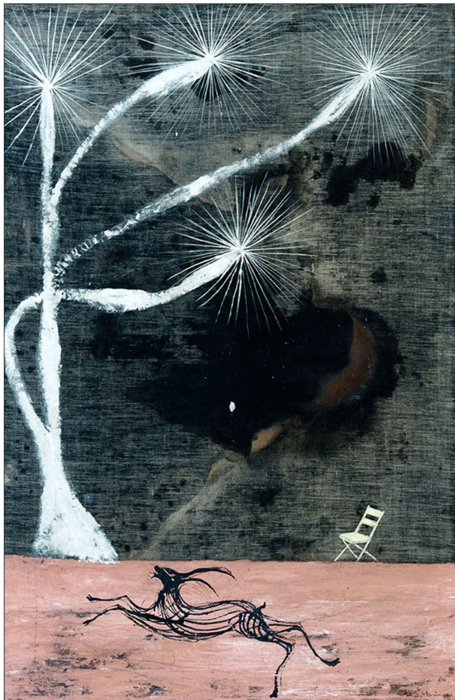
▲ Óleo sobre lino con técnica mixta, 150x100cm, 2024.

las cuales se encuentran definidas, en términos de los artículos 3, fracción II y 44, párrafo primero, del mismo ordenamiento, como las zonas del territorio nacional