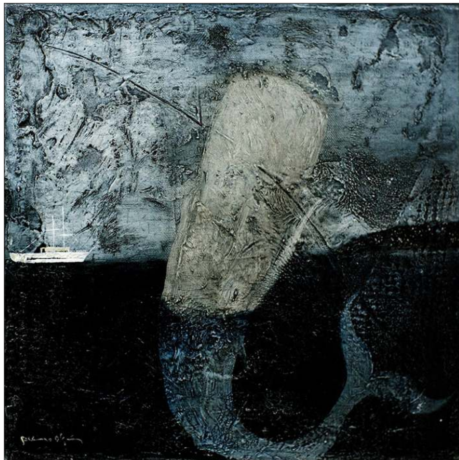
▲ Óleo sobre lienzo, 30x30cm, 2024.