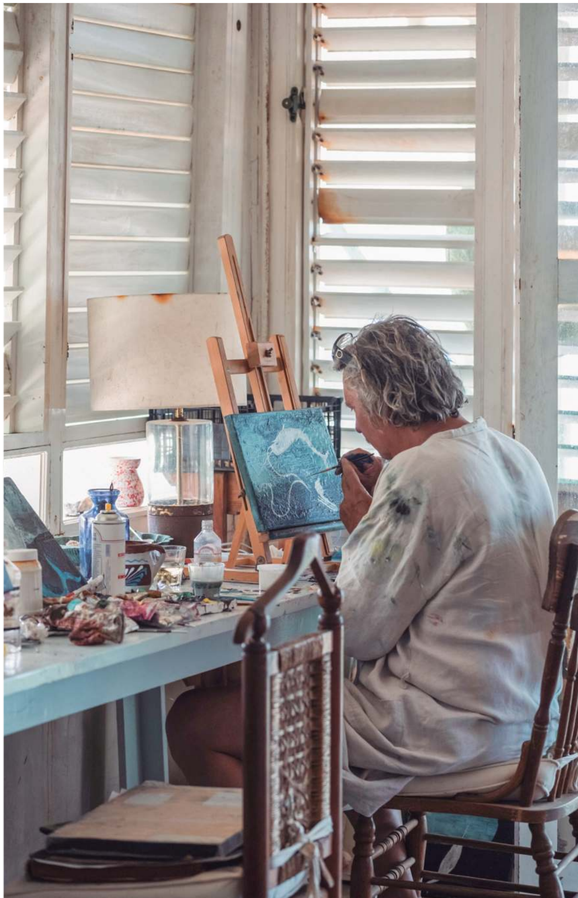
▲ “ Presagios nos invita a observar un mundo habitado por seres vivientes que habitan escenarios de fantasía”. En la imagen, el artista, en plena creación en su residencia de playa Mermejita en la costa de Oaxaca.

Un presagio es el anuncio de un suceso futuro. Se obtiene a partir de señales, presentimientos, sensaciones. Es algo fugaz, como un narval en un océano oscuro, o un árbol luminoso. A través de los óleos, la tela, la madera y el yute, Presagios nos muestra un universo vivo, algo que el arte puede aprender de la naturaleza.