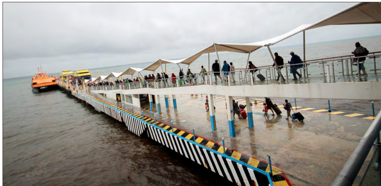
▲ La intención de esta ley es hacer más equitativa la situación de aquellos que viven en las islas, dado que actualmente sus costos de vida son más elevados en comparación a quienes viven en la parte continental.