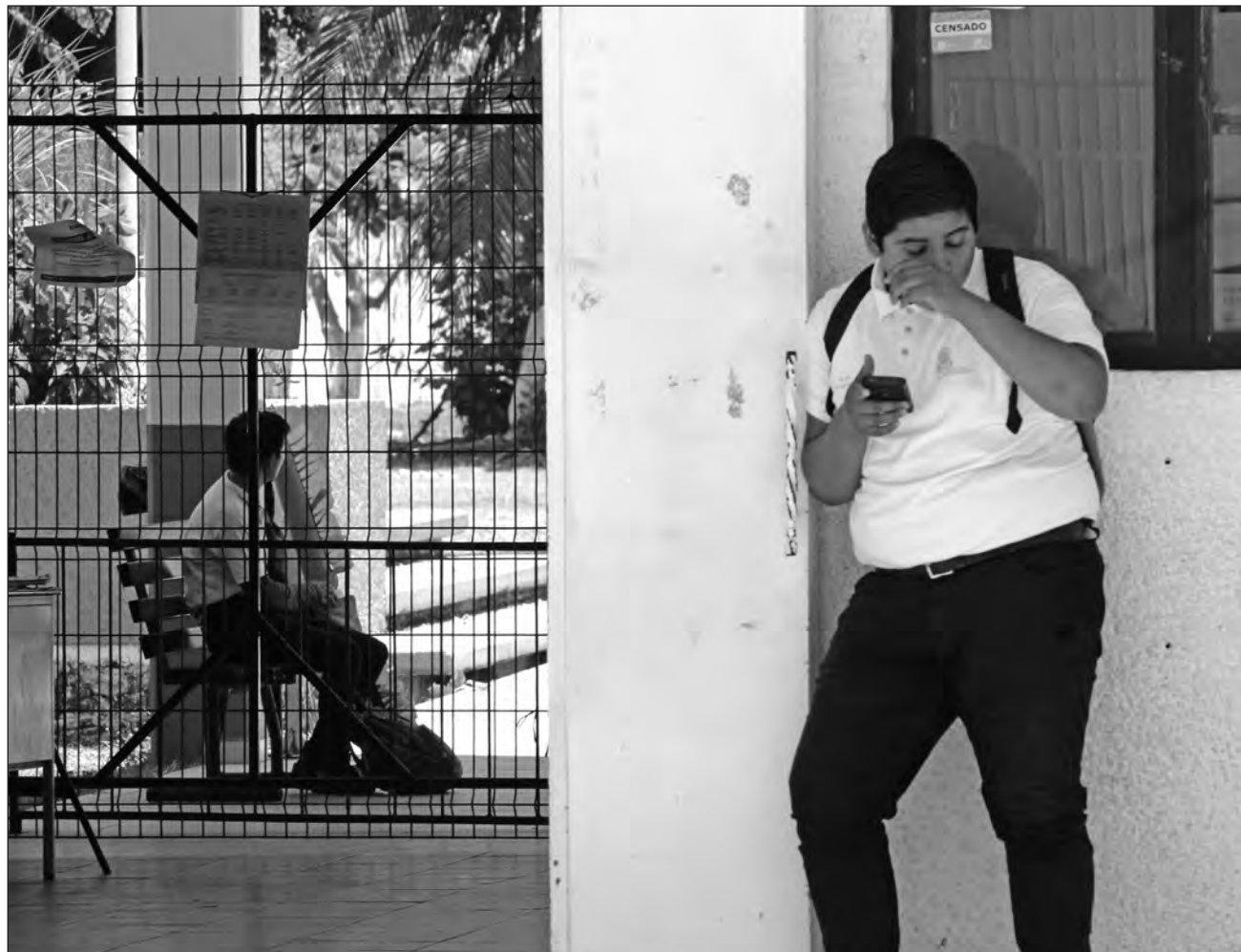
▲ Durante el foro de consulta sobre la nueva Ley de Educación estatal, señalaron la importancia de temas específicos como educación especial para personas con discapacidad, enseñanza de la lengua maya e impartición de inglés.

De acuerdo con las activistas, esto vulnera el propósito de las escuelas de construir un espacio seguro para que las y los niños hablen de todos los temas y obtengan herramientas para tomar decisiones sobre