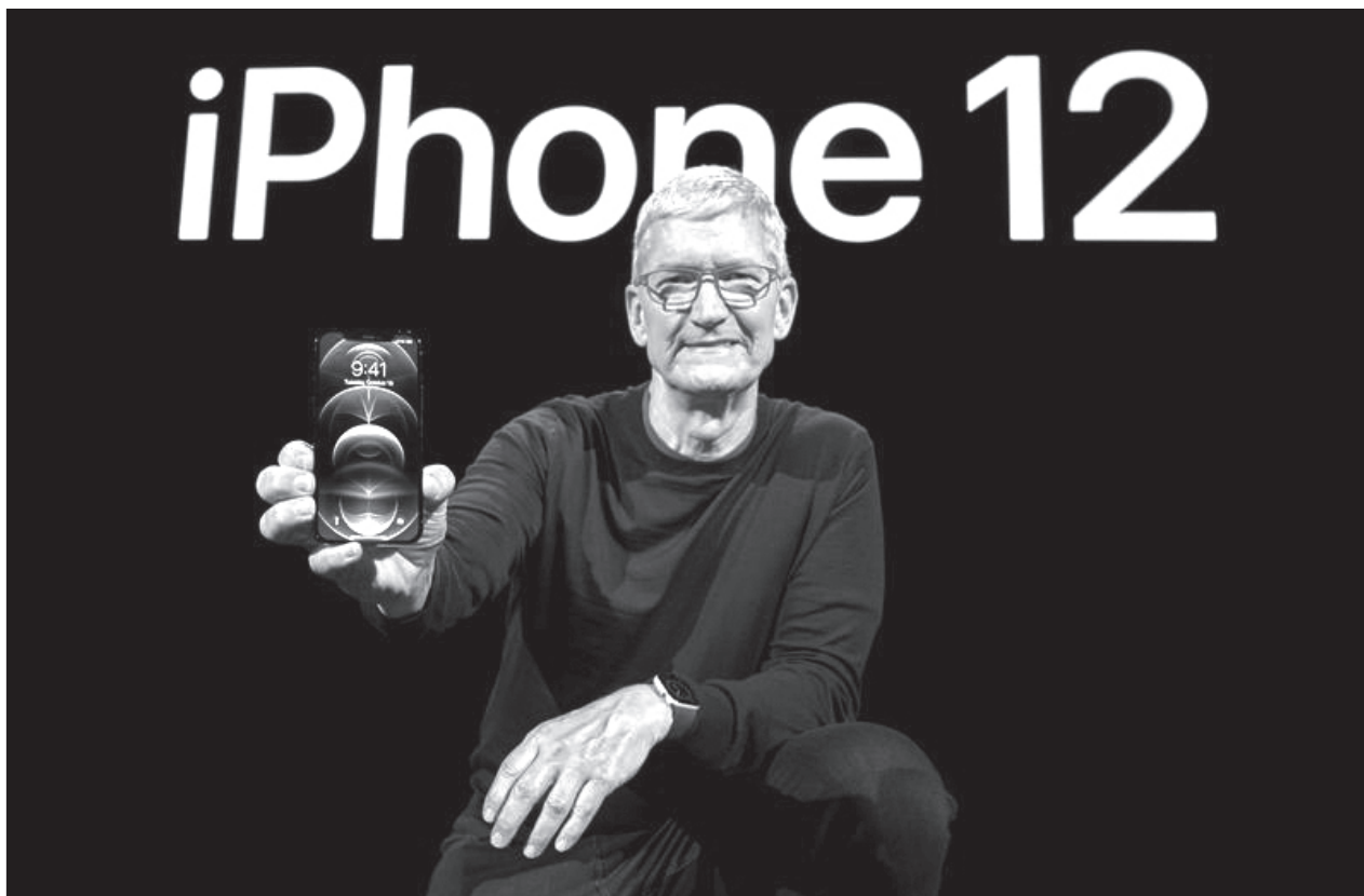
▲ Algunos analistas temen que los clientes del nuevo iPhone no puedan sacar provecho del dispositivo al no contar con la tecnología 5G.

La UE y Estados Unidos se acusan mutuamente de haber proporcionado ayuda estatal ilegal a sus respectivos fabricantes de aeronaves, y ambos presentaron reclamaciones ante el Órgano de Solución de Diferencias (OSD) de la OMC.