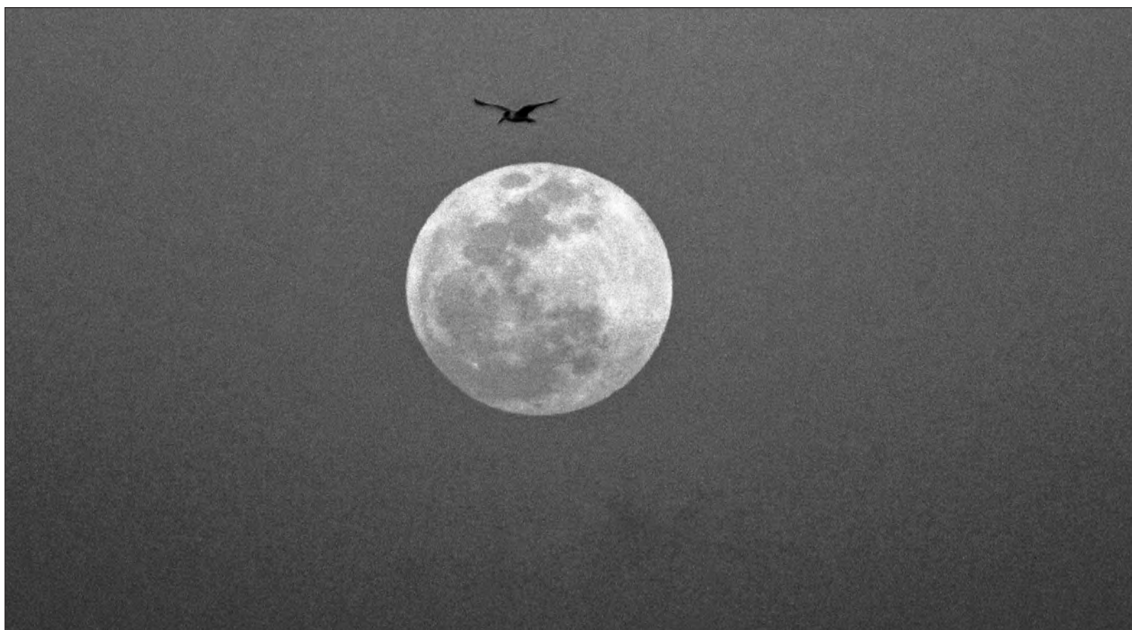
▲ La Danza de la Luna, tiene fundamentos en códices antiguos, y se hace con el mas sublime y firme propósito de converger y co-crear.