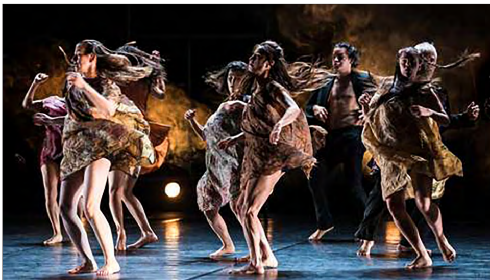
▲ Además de Teatro Línea de Sombra, Neurodrama y Lux Boreal, el encuentro contará con la participación de la compañía Lola Lince, en la imagen, el sábado a las 18 horas.

Los directivos de Teatro Línea de Sombra también se cuestionaron cómo montar su obra Danzantes del alba , que se presentará el 14 y 15 próximos a las 19 horas, cuando el festival se volvió virtual. Fue cuando esta coproducción del FIC y