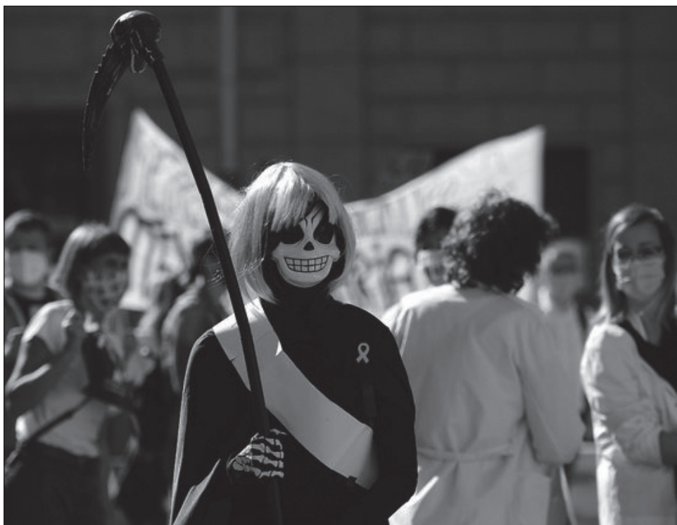
▲ El personal de salud exige mejores condiciones laborales y nuevas contrataciones en Barcelona.

Casi 20 por ciento de los médicos apoyaron la huelga, dijo a los medios de comunicación la portavoz del gobierno catalán, Meritxell Budó.