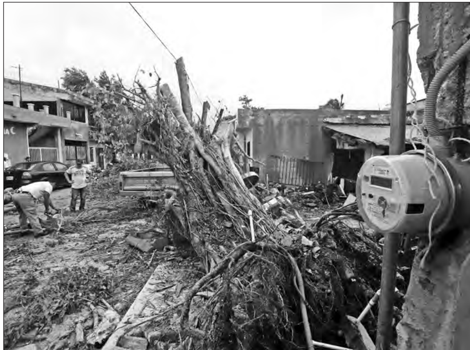
▲ El paso del huracán Delta por Quintana Roo dejó cientos de árboles caídos, lo que ocasionó fallas en el suministro de energía y agua.

“Acá nunca llegó Protección Civil, sólo algunas brigadas de la CFE. En la calle cayó un arbolote, por eso se fue la luz. Mi vecina buscó quien le ayudara a quitarlo, porque no vino na-