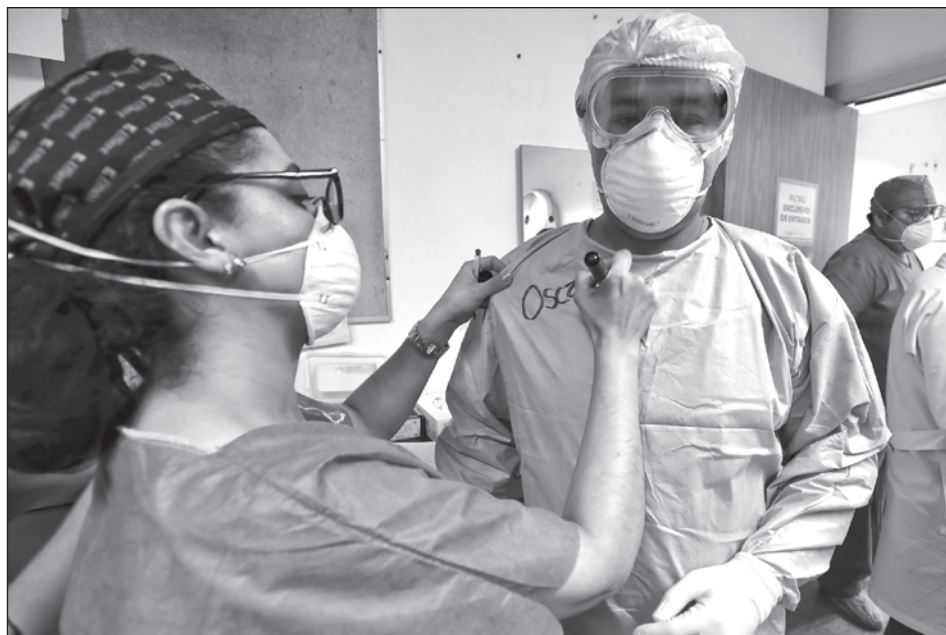
▲ Las primeras dosis serán destinadas a los trabajadores de salud y los grupos más vulnerables.

En Palacio Nacional, ante el presidente López Obrador, integrantes del