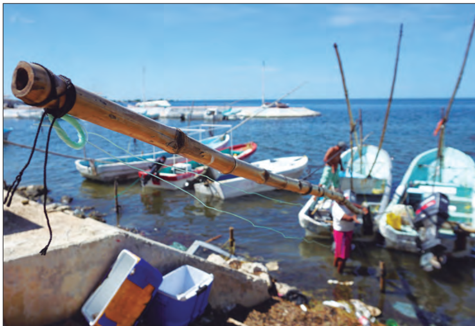
▲ Para salir al mar es necesario invertir aproximadamente mil pesos entre gasolina, aceite y carnada.

Los ribereños señalaron que ahora con la vuelta a las salidas, continúan observando embarcaciones disfrazadas