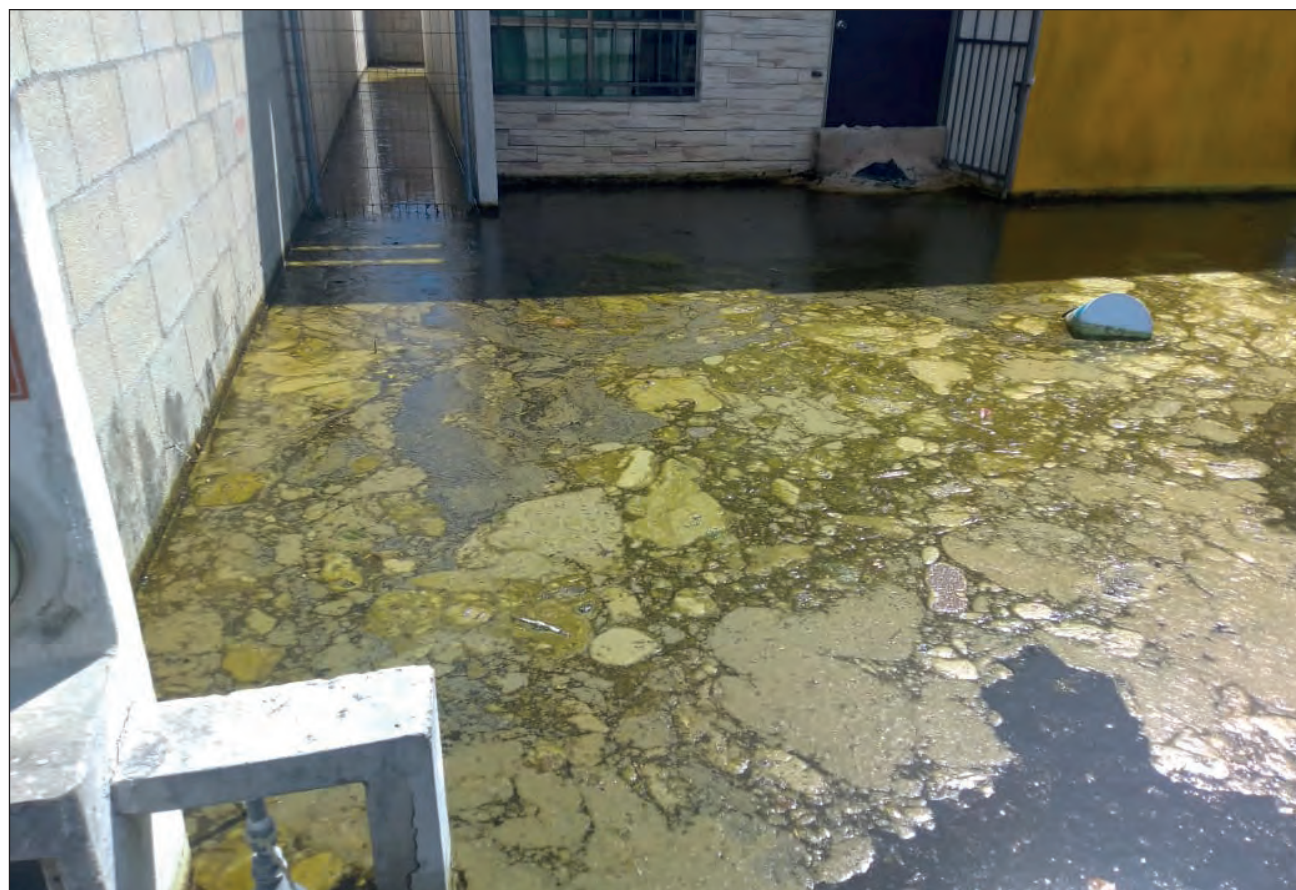
▲ Algunos de los afectados de Las Américas alcanzaron a salir con lo básico, cuando el agua ya les llegaba a las rodillas.

“Estaba estresadísimo, así que decidí irme a lo de mi ma-