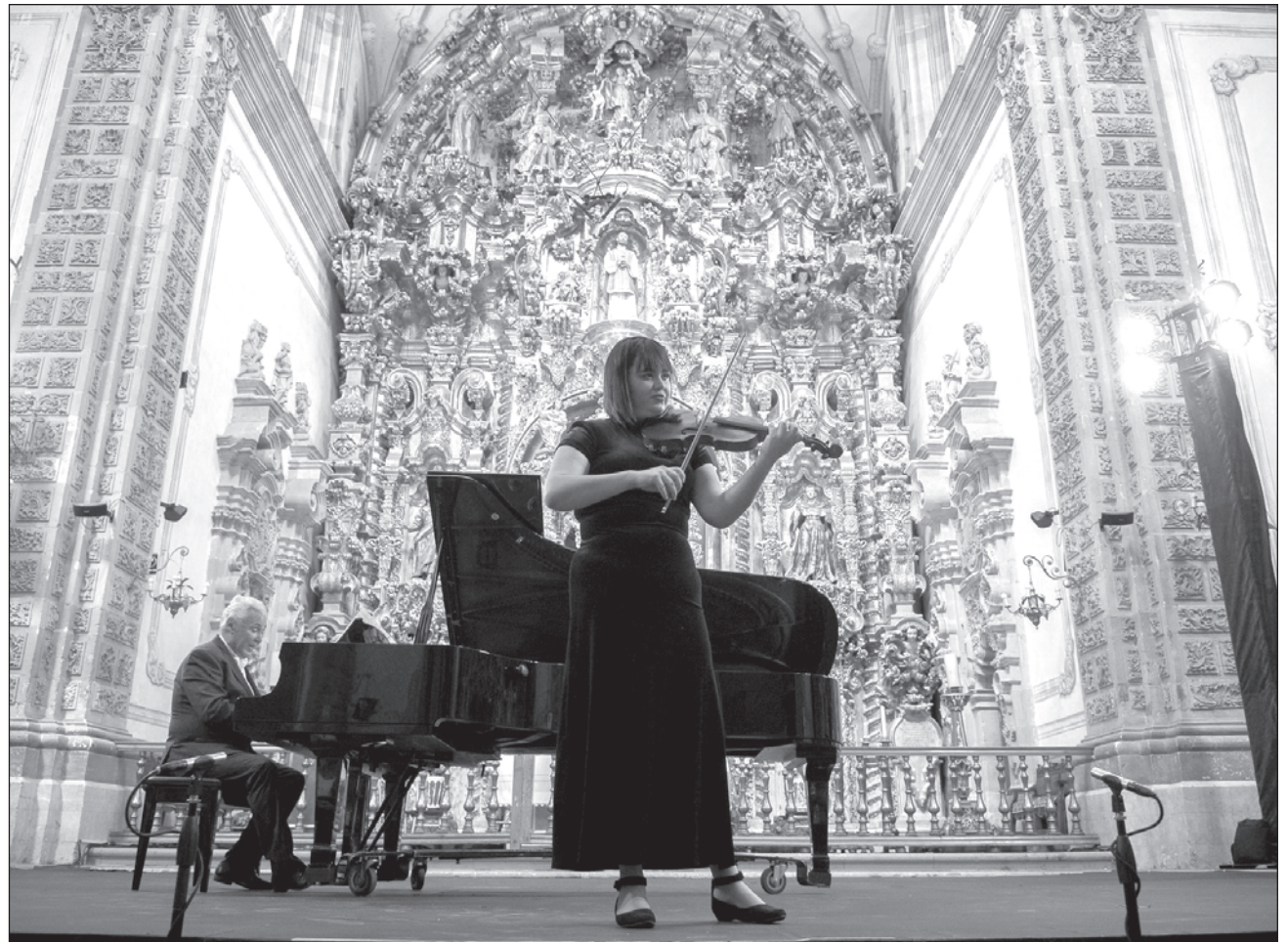
▲ El público podrá presenciar por televisión abierta, redes sociales y plataformas digitales de los medios públicos federales y locales las presentaciones artísticas del 14 al 18 de octubre.