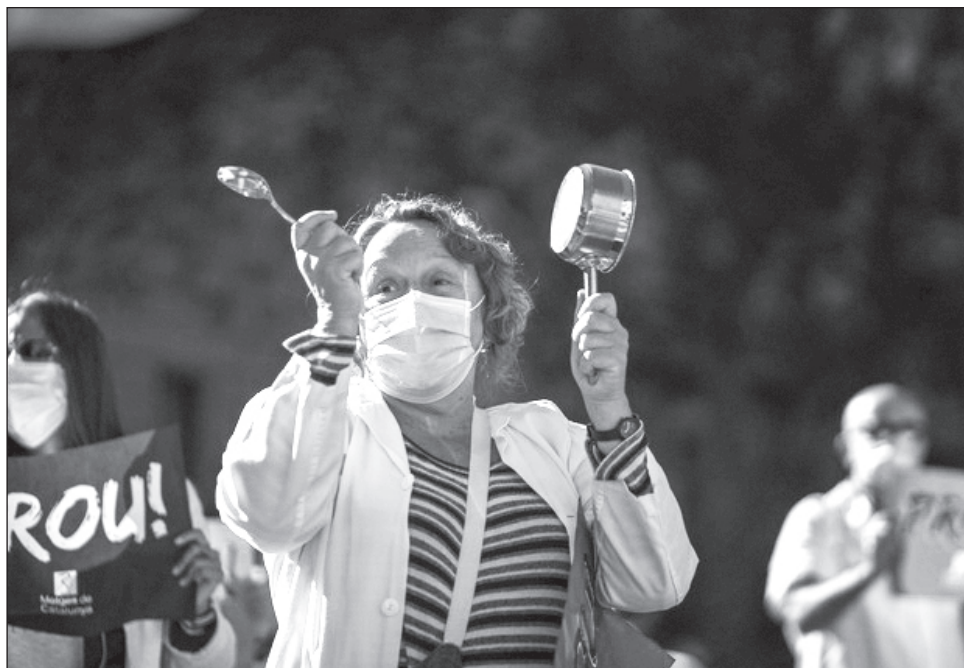
▲ La lucha de feministas rinde frutos con las nuevas normas que eliminan la disparidad salarial por cuestiones de género.

La disparidad salarial es una aberración democrática que excluye, diferencia y viola los derechos de las mujeres, dijo la ministra.