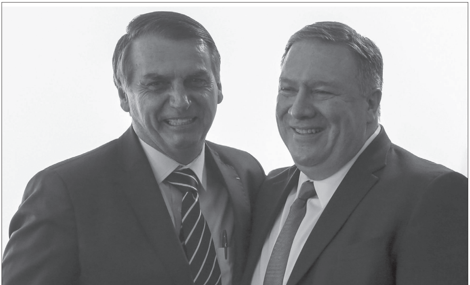
▲ La gira de Mike Pompeo por Brasil y Colombia ha servido para la preparación de nuevas acciones injerencistas y agresiones violentas hacia Venezuela.