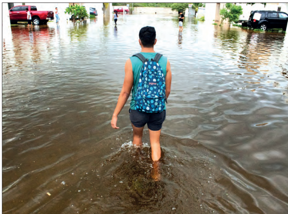
▲ Por la cantidad de agua en el fraccionamiento, los vecinos aún no pueden colocar su basura a las puertas de sus casas para la recolección.

Afirmaron que el número de pipas y perforadoras que trabajan incrementó con el