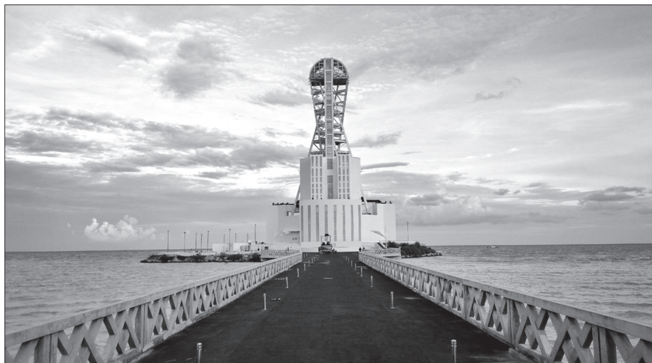
▲ La Semarnat podría retirar el permiso en caso de que el gobierno quintanarroense diera un aprovechamiento distinto al previsto en el acuerdo.

El documento explica que “dentro de los bienes de dominio público de la federación se encuentran las superficies de 2 mil 758.746 metros cuadrados de zona federal marítimo-terrestre del continente, ubicada en la intersección Primo de Verdad-Bulevar Bahía de Chetumal sin número, colonia Centro”.