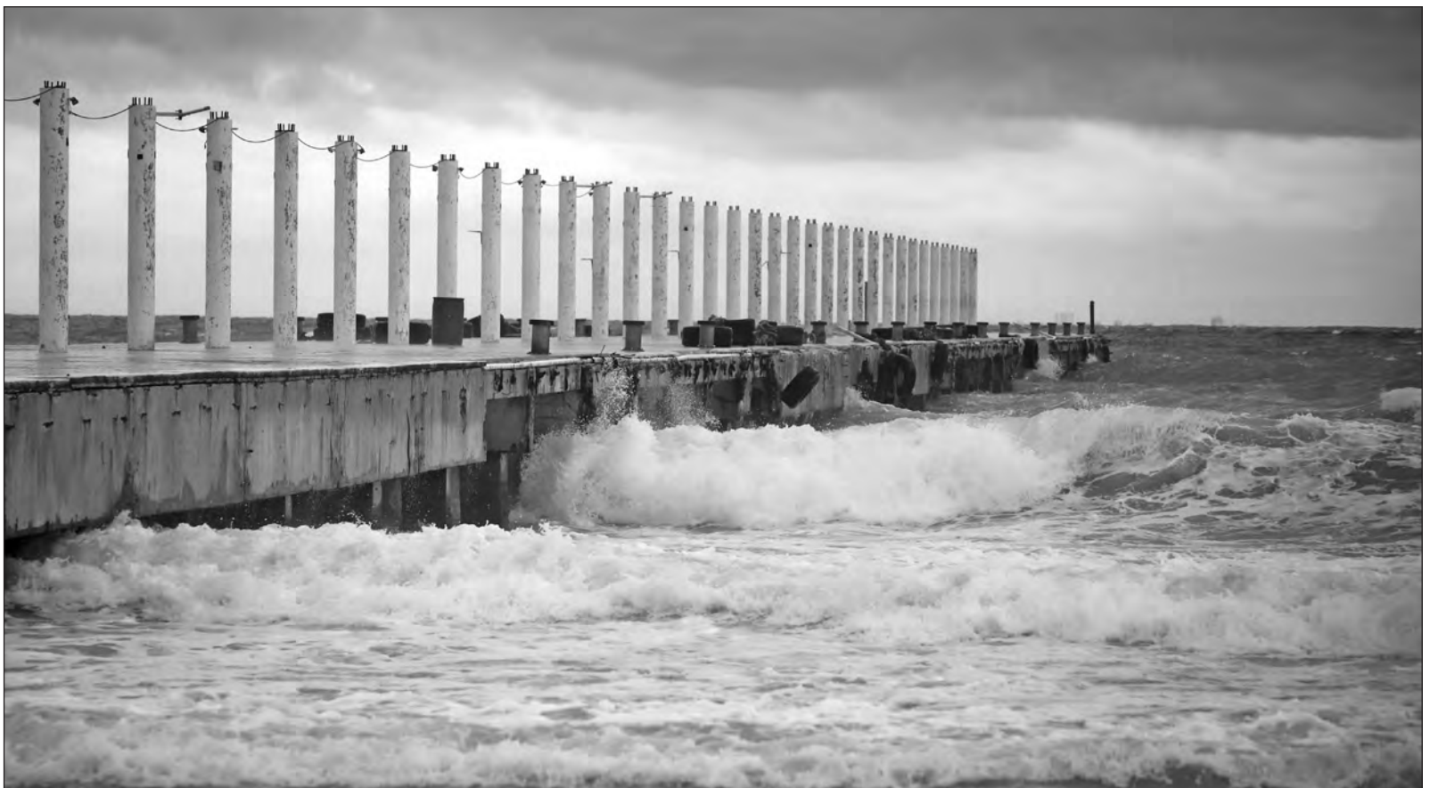
▲ El huracán Xaver es un personaje fundamental en la novela Doggerland , de Élisabeth Filhol.