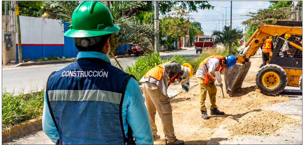
▲ Aguakan tiene programado concluir las obras en febrero del 2021.

Para la ejecución de las mismas se utilizará tecnología de vanguardia, conocida como "Pipe bursting"