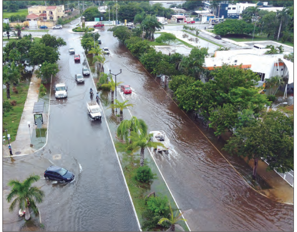
Lo esencial para los constructores es vender, sin importarles el usuario ni las características de las viviendas, carentes de espacios verdes.

Con esto inicia el boom expansivo: el crecimiento de grandes desarrollos inmobiliarios, plazas comerciales, residencias privadas y nuevos fraccionamientos como Las Américas. Sin embargo, todos estos terrenos eran una selva baja caducifolia que fue desmontada, talada para colocar enormes planchas de concreto.