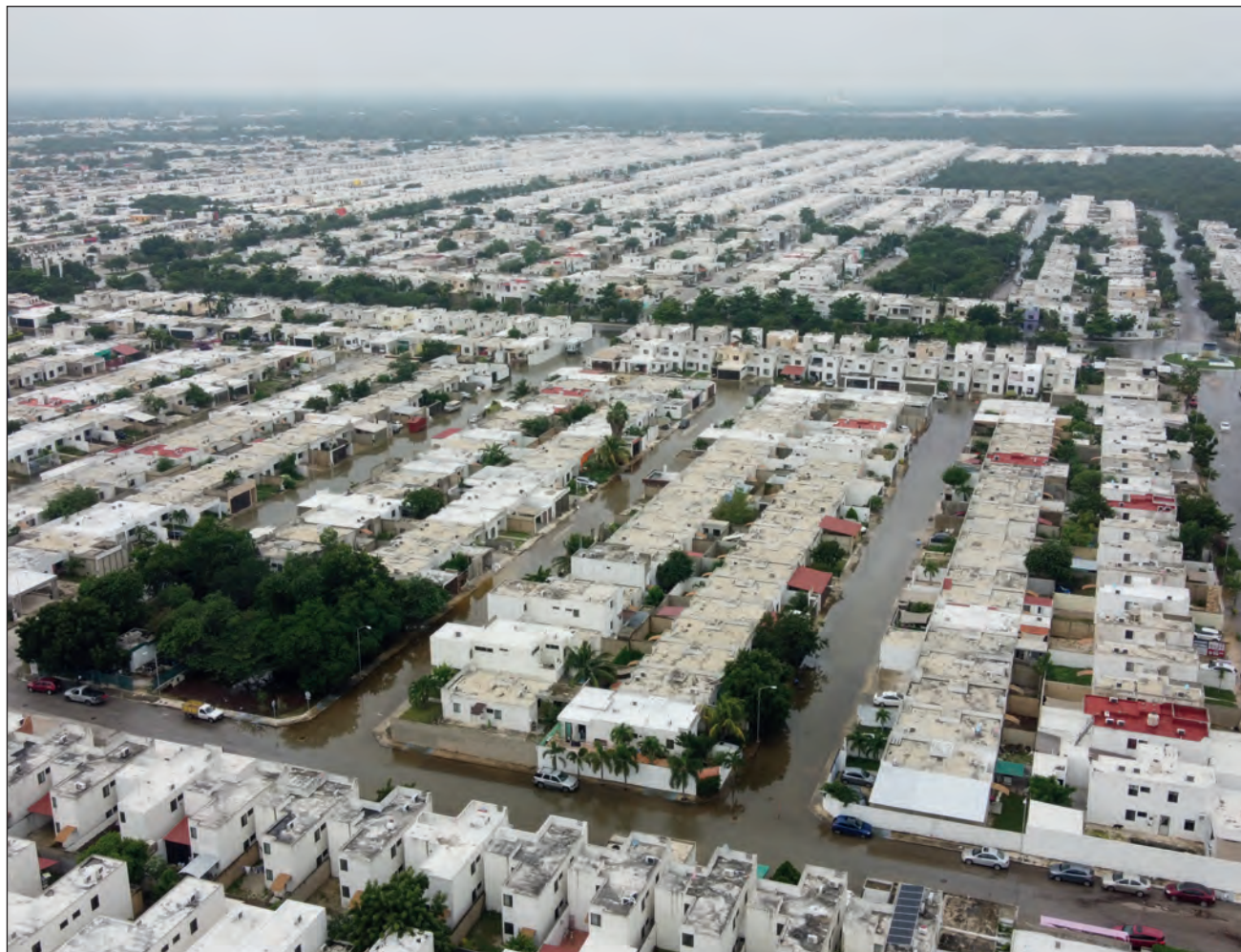
Las comisarías del norte de Mérida experimentaron un cambio considerable en cuanto al uso del suelo y el crecimiento urbano.