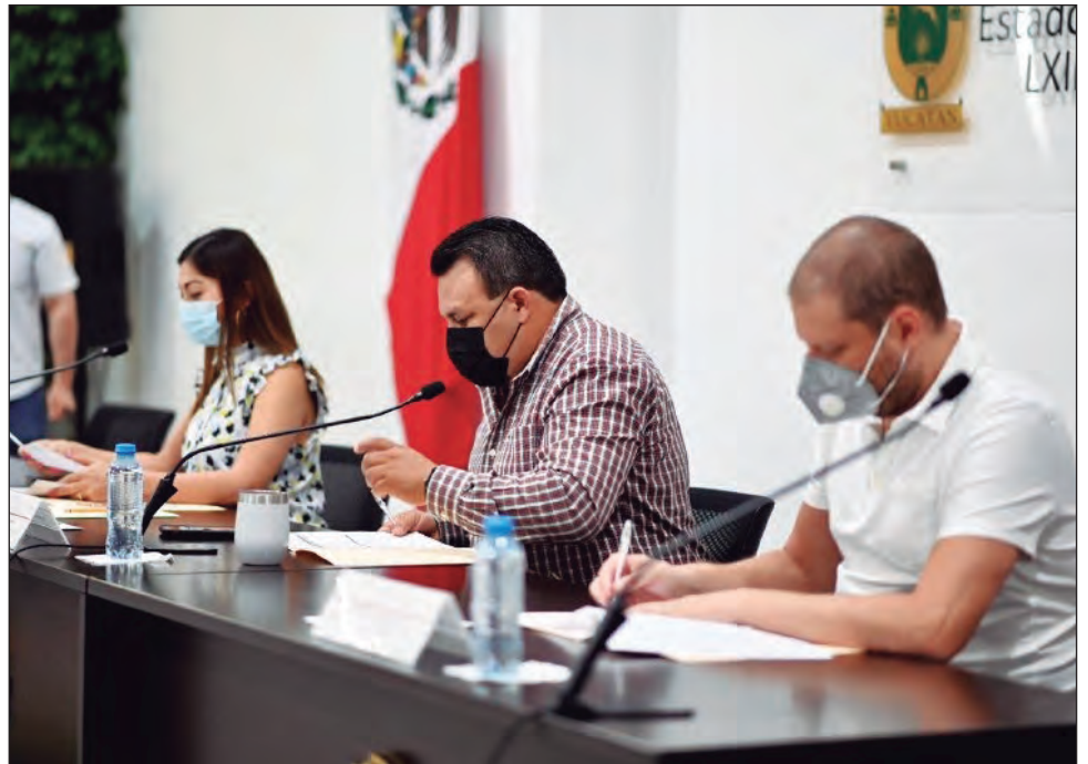
▲ Mediante la propuesta, los diputados pretenden darle el debido reconocimiento a los artesanos yucatecos.

La también presidenta de la Comisión de Puntos Constitucionales y Gobernación, consideró también incluir un "Catálogo único" de bienes y productos artesanales exclusivos de Yucatán, en el que se incluya el nombre de los artesanos que la elaboran y lugar de origen. Actualizado anualmente, por parte de la Casa de las Artesanías.