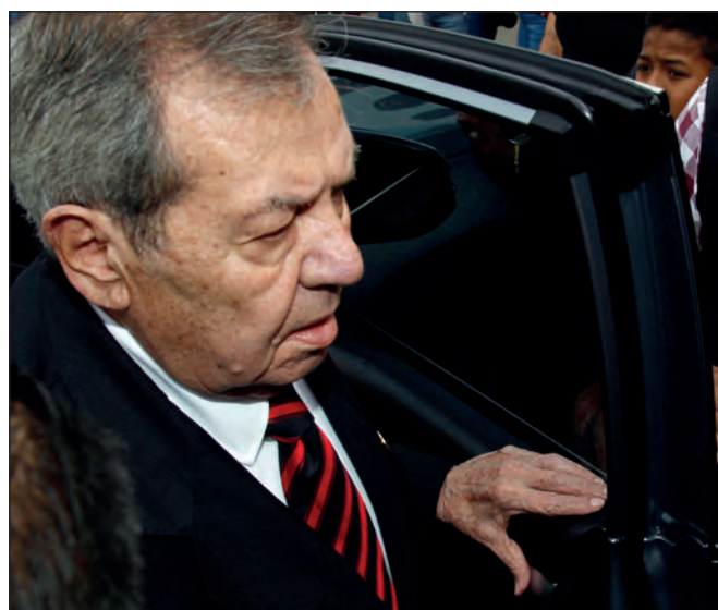
▲ Con el pleito por la dirigencia de Morena, este instituto está lejos de contribuir al programa de gobierno que prometió Andrés Manuel López Obrador.

En esta situación, la sociedad debe poner sobre la mesa la necesidad de una reforma política que permita avanzar hacia una democracia participativa, que es uno de los puntos programáticos fundamentales de la Cuarta Transformación.