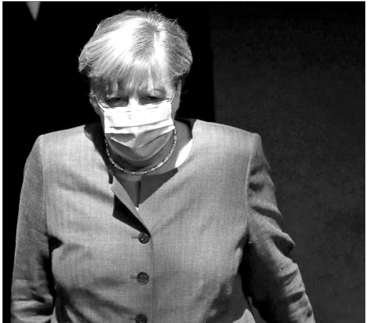
▲ Angela Merkel has demonstrated personal and professional probity, is a highly educated and intelligent leader, and has consistently done the right thing as well as doing the things well.

TRUDEAU HAS SUFFERED from a number of ethical challenges throughout his political life and, although he has managed the coronavirus crisis well to date, his government was reduced to minority status in the last election,