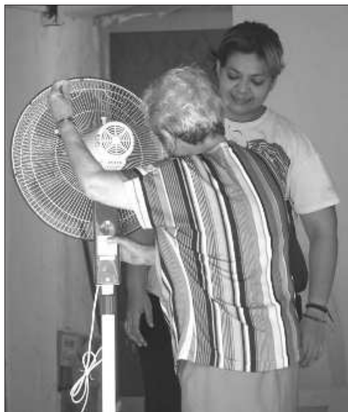
▲ El Servicio Meteorológico Nacional pronosticó que prácticamente la mitad del país tendrá temperaturas arriba de 40 grados.

Cuando el impacto de la ola de calor se expresa en el reporte de 10 muertes en el estado de San Luis Potosí, y 20 en todo el país, es momento de cuestionar si la pérdida de vidas humanas se solucionará incrementando la demanda de sistemas de control ambiental y de energía, con la consiguiente presión sobre las áreas forestales donde deberán establecerse plantas generadoras de ciclo combinado, parques eólicos o fotovoltaicos. Cuando el paisaje que hasta hace unos meses era de verdor, se ha convertido en uno en el que imperan la hojarasca y las ramas secas; cuando se vuelve noticia