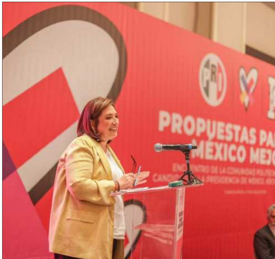
▲ “Les dijimos a los magistrados que no hay piso parejo y nos sugieren que propongamos una reforma electoral después de este proceso, pero ya para qué”, subrayó la candidata del PAN, PRI y PRD.

Gálvez comentó que fue una reunión interesante, en la que presentaron una impugnación por el incumplimiento del Instituto Nacional Electoral (INE) en materia de violencia porque no actuó en 2021 en Michoacán y Tamaulipas, cuando se lo ordenó el TEPJF y “no se han tomado medidas”.