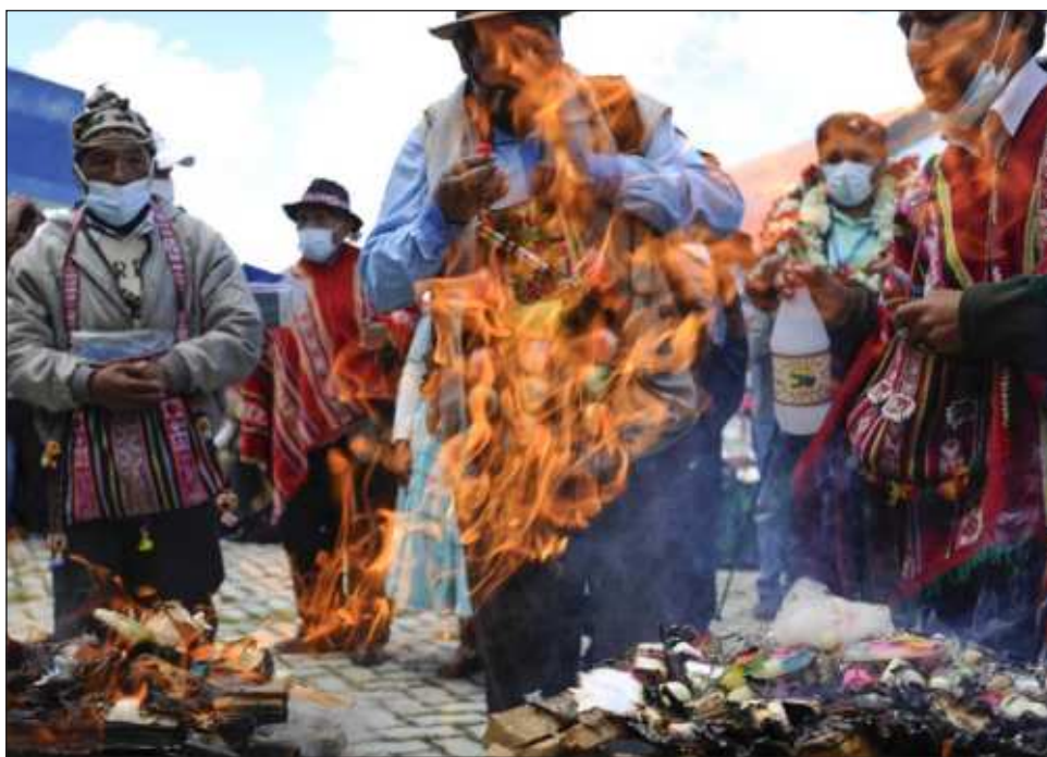
▲ Los también llamados recursos genéticos son cada vez más utilizados en inventos para la investigación y las industrias cosméticas y de medicamentos.

Estos recursos --como las plantas medicinales, las variedades vegetales y las especies animales-- son cada vez más utilizados en numerosos in-