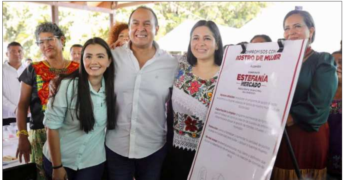
▲ El acuerdo Con rostro de mujer compromete apoyos directos, capacitación y empleo, y fomentará el emprendimiento, empoderamiento y la protección de los derechos de las mujeres solidarenses.

"El compromiso de mi gobierno tiene rostro de mujer y cuando digo que tiene rostro de mujer me refiero a las acciones que vamos a emprender para protegerlas de la violencia y el acoso laboral; apoyo al empleo, capacitación y