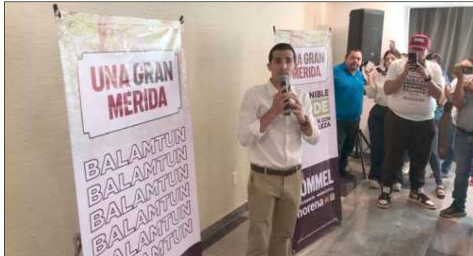
▲ Dichos espacios en el sur de la capital yucateca tendrán talleres deportivos, culturales y artísticos y ofrecerán servicio de lavandería y de comedor comunitario.

Los Pilares (Puntos de Innovación, Libertad, Arte, Educación y Saberes) fueron creados por la ahora candidata presidencial para disminuir la desigualdad social, cultural y económica en todas las alcaldías de la capital del país, por ello Rommel Pacheco pretende traer