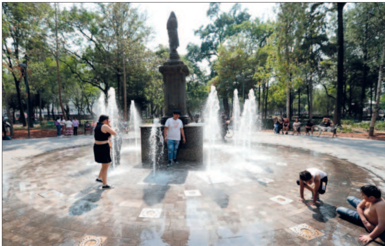
▲ La cifra podría superar las 20 al sumar otras defunciones que han sido documentadas por la prensa.

Para este lunes, el SMN aún pronosticó temperaturas a los 40 grados en casi la mitad de los 32 estados del país, incluyendo superiores a los 45 grados en Campeche, San Luis Potosí, Tabasco, Tamaulipas y Veracruz. Mientras que habrá máximas de 40 a 45 grados en Chiapas, Guerrero, Hidalgo, Michoacán, Morelos, Nuevo León.