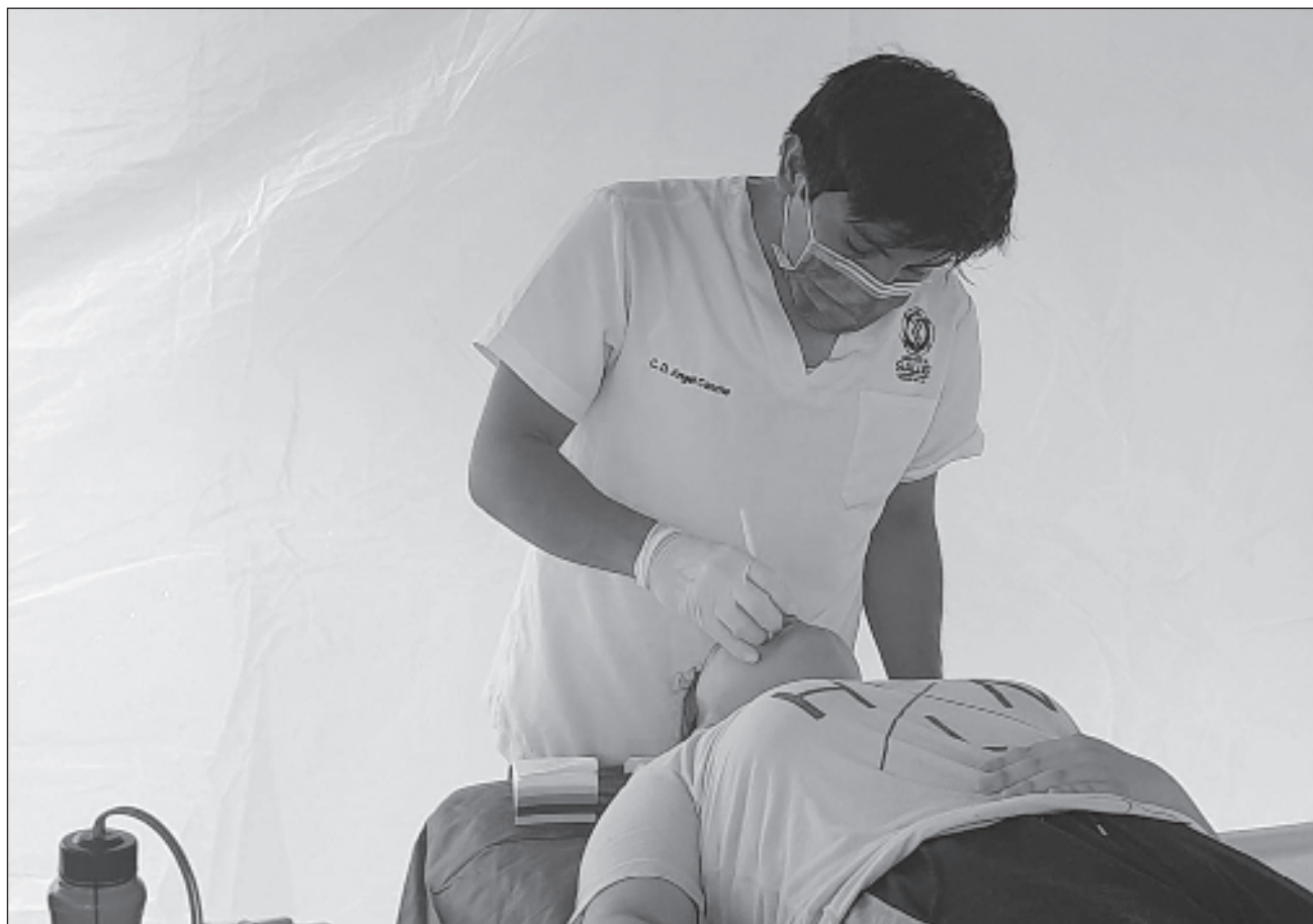
▲ La brigada de la Dirección de Salud de Tulum atenderá problemas dentales de adultos y niños, y ofrecerá servicios de enfermería con toma de presión, glucosa, peso y talla, consulta médica y electrocardiograma.

Habrà atención de enfermería con toma de presión, glucosa, peso y talla, consulta médica y electrocardiograma a pacientes con riesgo de enfermedades cardiovasculares. Todos los servicios que se darán son gratis, aunado a que esta brigada de salud permite el seguimiento adecuado de los pacientes que lo requieran.