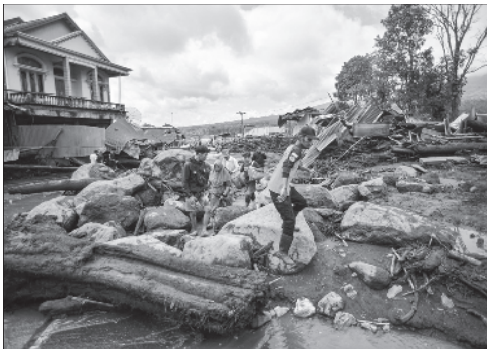
▲ Las fuertes lluvias en los distritos de Agam y Tanah Datar, hicieron caer grandes rocas volcánicas por la ladera del Marapi, uno de los volcanes más activos de Indonesia.

Los habitantes aseguran haber oído como las piedras caían sobre las carreteras alrededor de sus casas.