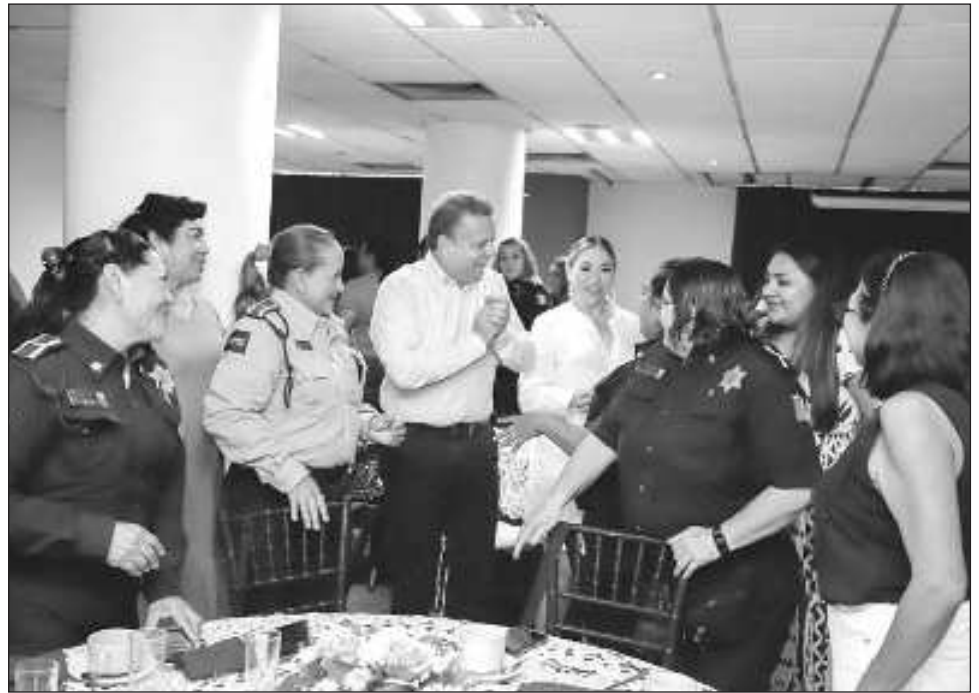
▲ El alcalde Alejandro Ruz puntualizó que “tenemos muy claro que contar con mujeres policías es esencial en una corporación policial, ya que, al tratarse de una condición de género, Mérida fomenta mecanismos de inclusión, igualdad laboral y transversalidad”.

“Mérida se siente orgullosa de todas ustedes. Tenemos muy claro que contar con mujeres policías es esencial en una corporación policial, ya que, al tratarse de una condición de género, Mérida fomenta mecanismos de inclusión,