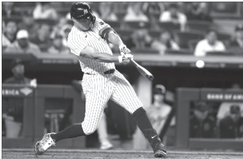
▲ El yanqui Giancarlo Stanton conecta un doble productor ante los Tigres de Detroit el pasado viernes 3.

En general, hay seis nuevas categorías, de las cuales cinco están enfocadas en bateadores, incluyendo la velocidad promedio del bate, la tasa de "swing" rápido, la tasa de "squa-