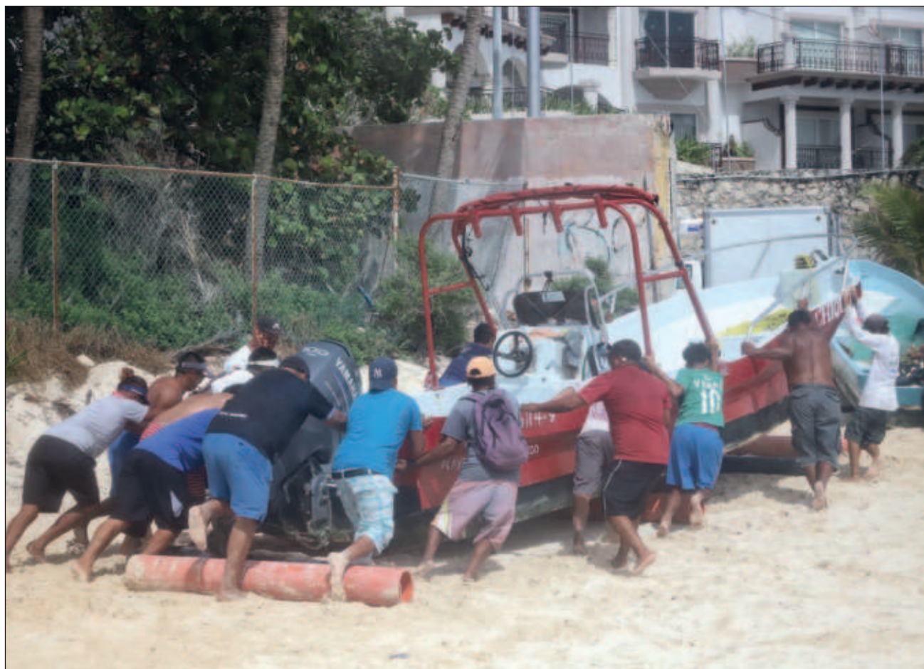
▲ Los marinos también piden integrar una estrategia con aseguradoras para sus embarcaciones.

Asimismo, dio a conocer que están gestionando