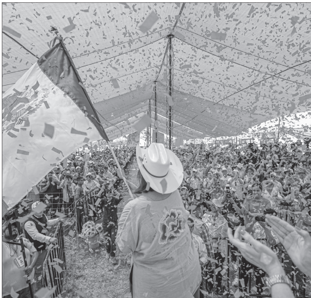
▲ "El discurso de la marcha de la marea rosa correrá a cargo de Xóchitl (...) Fuera caretas, pues, el próximo domingo PAN, PRI, PRD y sociedad civil versión claudiana, mostrarán que son lo mismo".

DOS MUJERES TENDRÁN el rol principal de la jornada del 2 de junio, las presidentes del Instituto Nacional Electoral, Guadalupe Taddei y del Tribunal Electoral, Mónica Soto. Es una buena noticia que están trabajando en forma coordinada. A Taddei le tocará dar a conocer el resultado de la elección y a Soto su calificación y confirmación. Firmaron un convenio para la entrega física y digital de los expedientes de los cómputos distritales de la elección. El nombre de la próxima presidente se conocerá la noche del 2 de junio, con la reserva de la calificación por el tribunal. Dos ex presidentes del instituto andan haciendo correr la versión de que podría anularse la elección porque el presidente López Obrador no se ha ajustado estrictamente a lo que ordena la