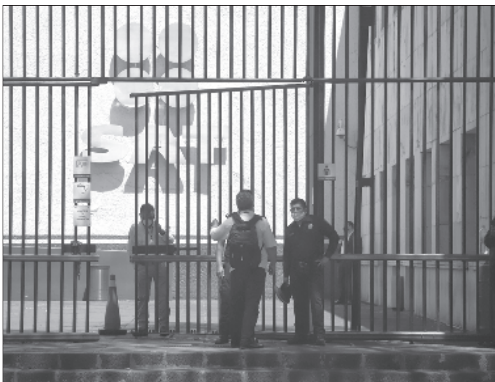
▲ Los ingresos tributarios han incrementado un 5.5% en el primer cuatrimestre de este año, encabezados por el impulso del ISR, cuya colecta estuvo por debajo de lo esperado.

La ruta Shenzhen-Ciudad de México recorre 14 mil 147 kilómetros en sólo 16 horas, por lo que es el vuelo internacional directo más largo desde el país asiático y el séptimo más extenso del mundo.