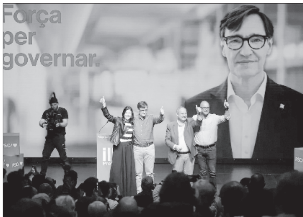
▲ “Podemos agrupar una mayoría coherente, no absoluta, pero sí una mayoría coherente, más amplia que la que puede sumar el candidato del Partido Socialista”, aseguró.

Pero, a pesar de su aumento de votos (nueve diputados más que en 2021), su líder en Cataluña, Salvador Illa, tendrá