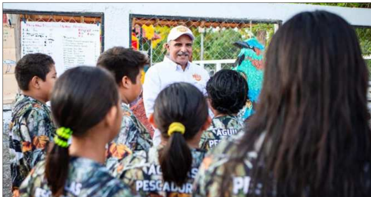
▲ En materia cultural y deportiva, el candidato de MC dijo que apoyará la iniciativa de un grupo de jóvenes que crearon un centro deportivo y cultural en un edificio que estaba abandonado.

Denunciaron que en la Reserva de la Biosfera de Sian Ka'an por norma no se pueden aplicar pavimentos, pero inexplicablemente más de 48 extranjeros sí han podido construir centros de hospedaje y mansiones pese a todo tipo de restricciones legales.