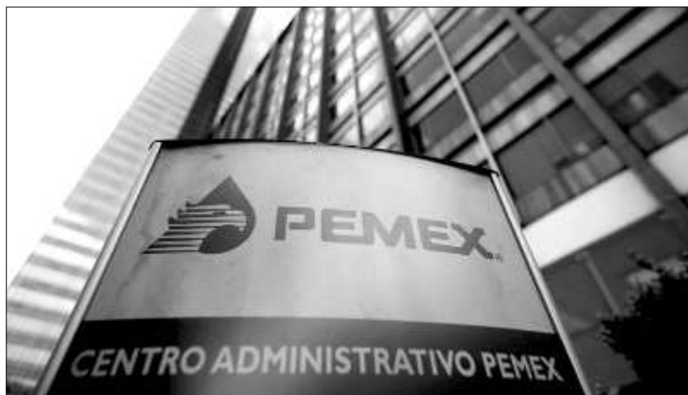
▲ María Amparo Casar habría recibido de la petrolera un monto de 31 millones de pesos al haber cobrado 125 mil pesos mensuales y un seguro de vida por 17 millones de pesos.

“Agréguense a los autos el oficio de cuenta... por el cual informa las gestiones que se encuentra realizando para dar cumplimiento a la suspensión de plano concedida... se requiere a... Para que, en el término de veinticuatro horas, bajo su responsabilidad, informen el cumplimiento a la suspensión de plano dictada en auto de 9 del presente mes y año.” señala el resolutivo de la juez que se publicó este lunes en estrados judiciales.