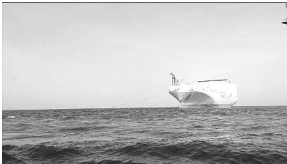
▲ Los pescadores se lamentaron de que el gobierno federal haya cancelado los programas sociales, como el subsidio a combustibles y las ayudas para la adquisición de motores fuera de borda.

Ahora, dicen, hay denuncias penales y órdenes de arresto contra varios de sus dirigentes, por lo que durante un encuentro con el candidato, Renán Barrera Concha, en dicha población perteneciente al municipio de Hunucmá -gobernado