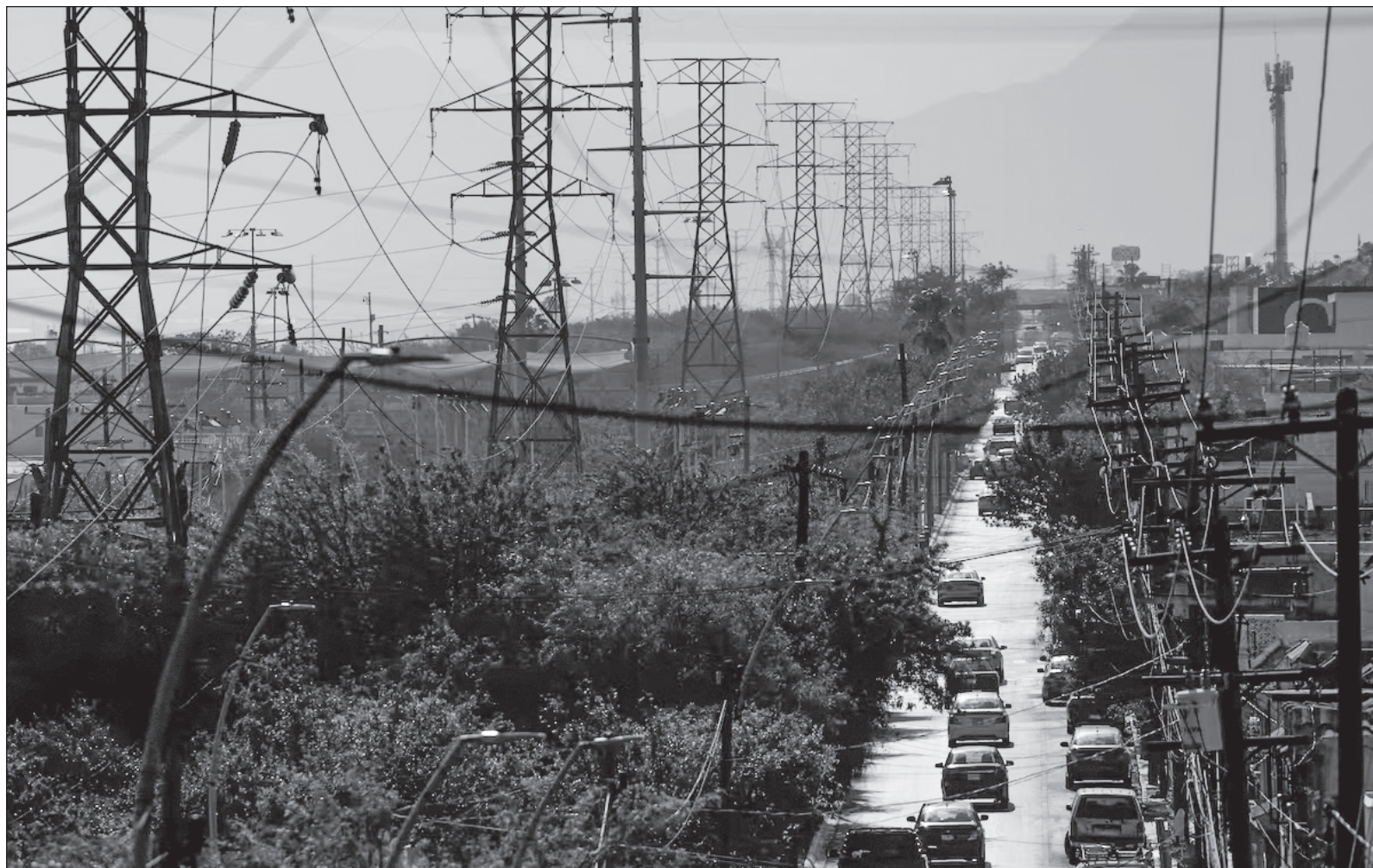
▲ "Formamos parte del grupo de países con tasa de mortalidad más alta debido a la contaminación atmosférica por partículas suspendidas, generadas por el transporte (19.1%), hogares (12.3%), industria y centrales eléctricas (11.6%) y agricultura (11%)".