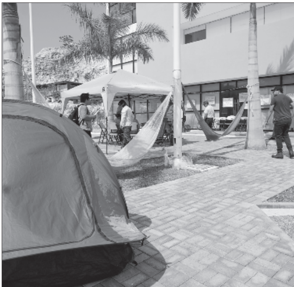
▲ Este lunes, personal de la Sedena ha comenzado a sacar documentación en lo que parece ser del proceso de entrega-recepción y aún no han terminado de pagarles.

Añadió además que les han hecho tres citas aproximadamente con los administrativos de Fonatur nacional, así como con la Secretaría de Desarrollo Agrario, Territorial y Urbano (Sedatu) para destrabar el tema y antes de finalizar la administración federal de Andrés Manuel López Obrador estos cheques lleguen a sus portadores