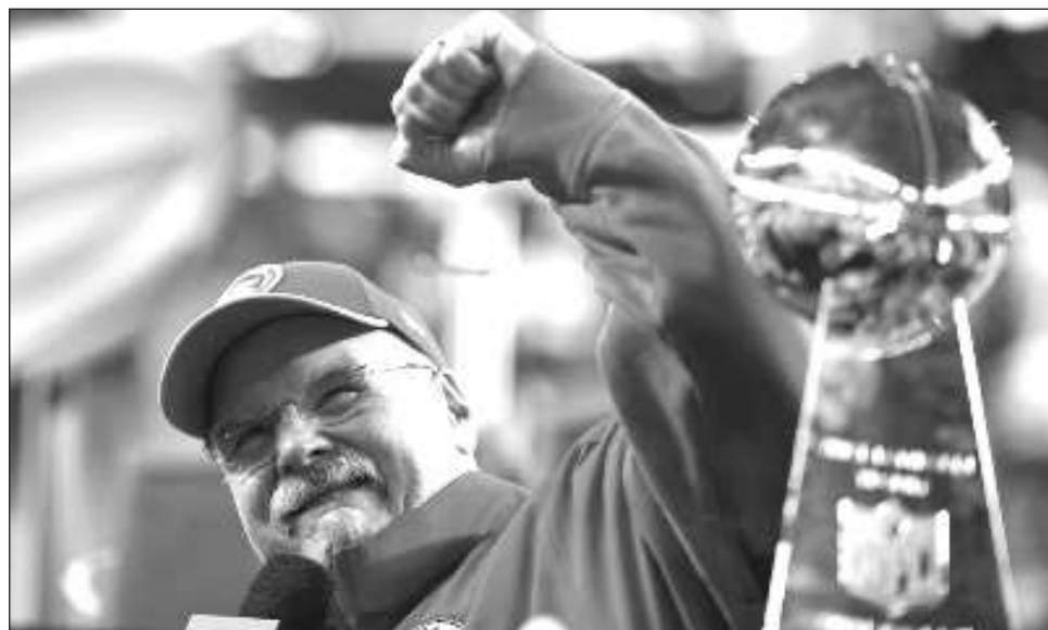
▲ Andy Reid, entrenador de los Jefes, celebra tras conquistar el título del Súper Tazón 58.

pensar en 2024 después de que el primer "Super Bowl" en Las Vegas ya es parte de la historia.