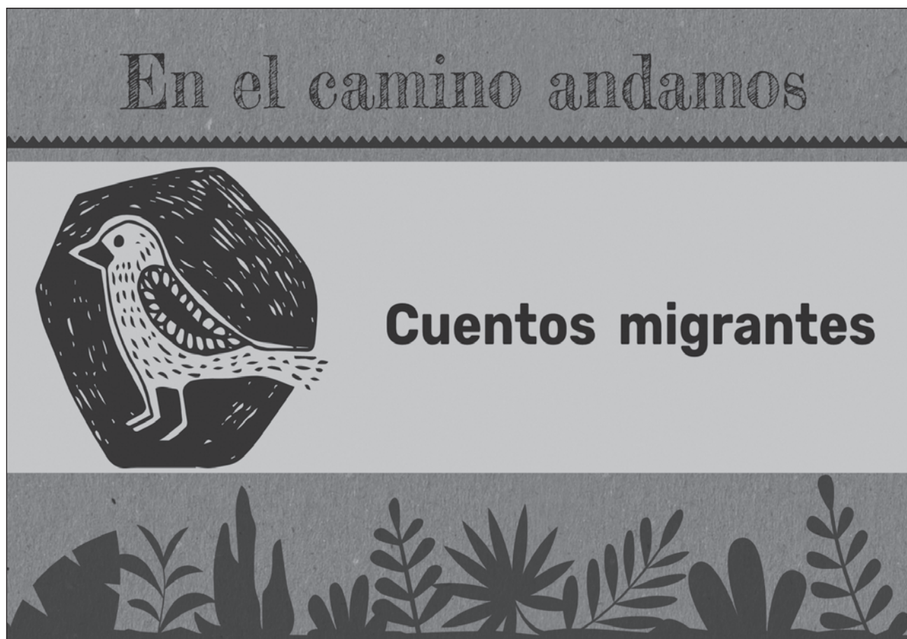
▲ El objetivo de la propuesta, que mezcla narración oral y actividades, es abordar el fenómeno de la migración.