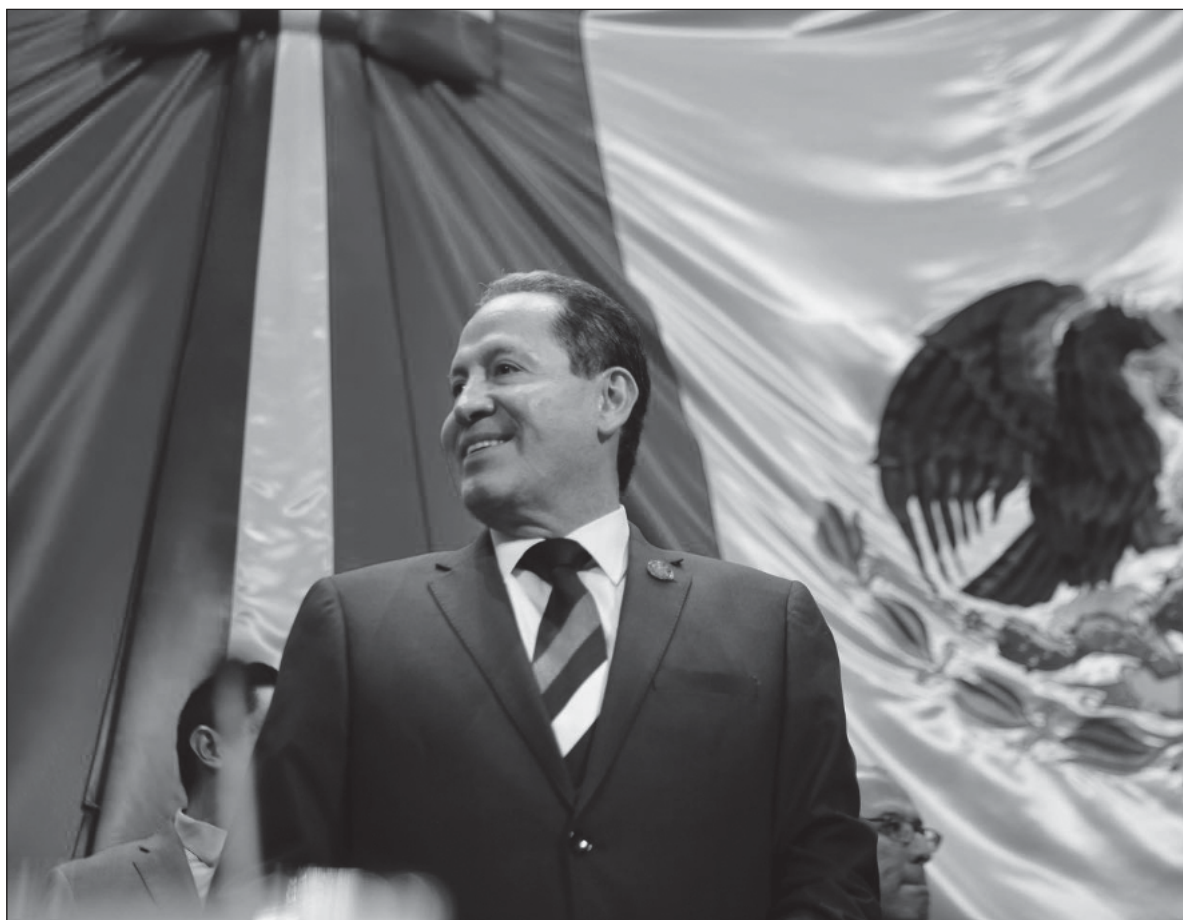
▲ “Ávila fue ocupante de múltiples cargos públicos y partidistas a nombre del PRI y se mantuvo en este partido hasta 2023, año en cuyo diciembre anunció, con otros recientes ex priistas (Alejandro Murat y Jorge Carlos Ramírez Marín, entre ellos) que formaría una corriente de apoyo a Sheinbaum”.

Y, DESDE LUEGO, los Del Mazo, que en tres periodos distintos