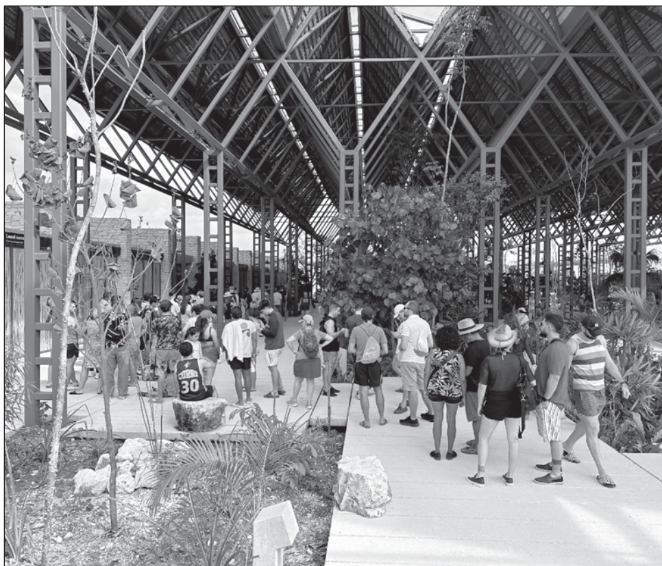
▲ Conforme a la ley federal están exentos del pago los menores de 12 años, las personas con discapacidad, adultos mayores, los pensionados y los jubilados.

El costo es de 60 pesos; estudiantes tendrán descuento y locales entrarán gratis