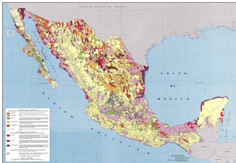
▲ De los datos obtenidos, al menos la mitad de la biodiversidad de los ecosistemas terrestres cuentan con un alto número de bacterias, hongos y animales del suelo que cumplen muchas funciones.

La investigación estuvo a cargo de 77 expertos de 40 instituciones nacionales como la Facultad de Ciencias, la FES Iztacala y los institutos de Biología y Ecología; este