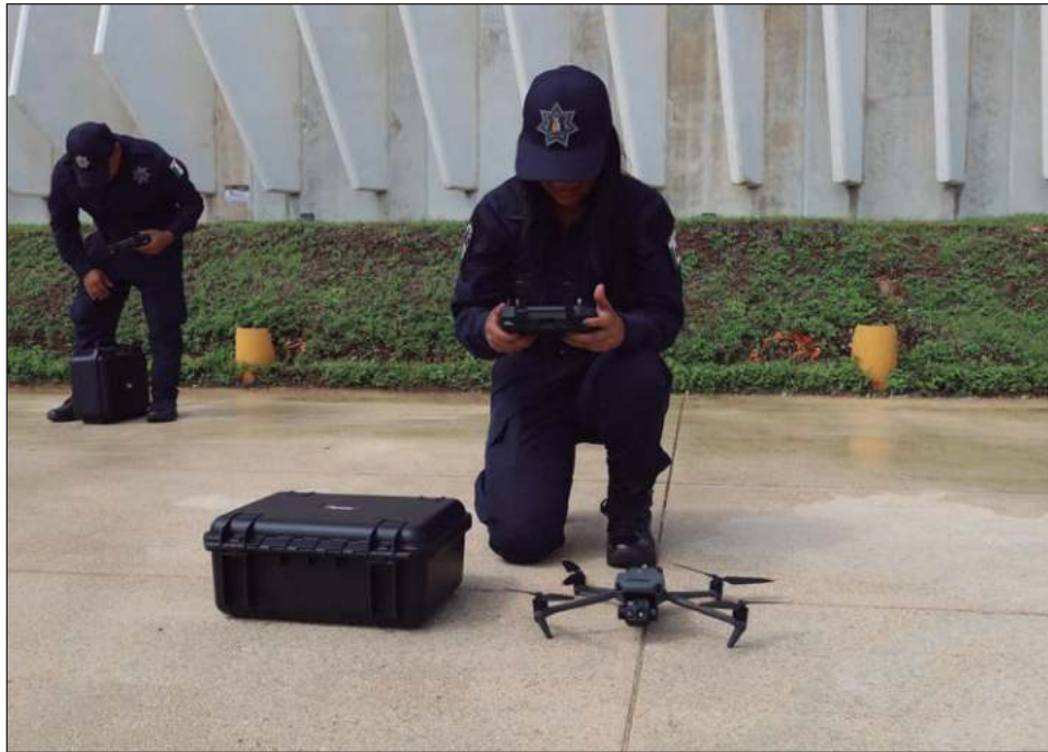
▲ El grupo de drones Itzamná participó en filtros de inspección coordinados con los tres órdenes de gobierno en los límites de los municipios de Solidaridad y Tulum.

de Tulum también se participó en el filtro de revisión en conjunto con las diversas autoridades con la finalidad