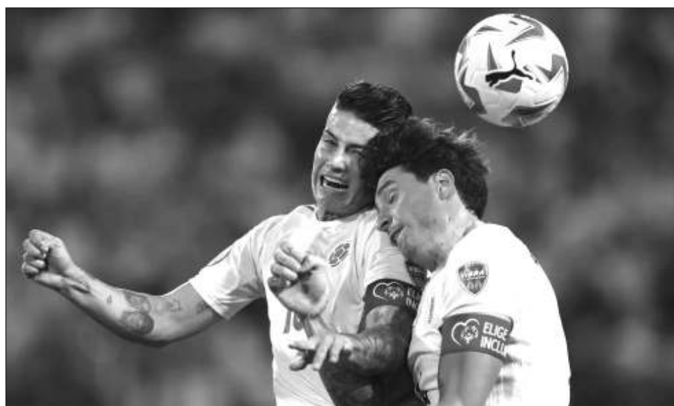
▲ James Rodríguez, líder de la selección de Colombia, es un refuerzo de lujo para el León.

Además de León, Monterrey y Pachuca representarán a México en ese torneo.