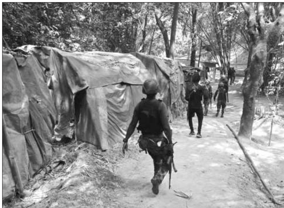
▲ "Aprovecho esta oportunidad para hacer un llamado a las fuerzas armadas para que rastreen y traten de manera decisiva con los perpetradores de este acto atroz de violencia contra nuestros ciudadanos inocentes", señaló el gobernador.

"Permítanme asegurar a los ciudadanos de Borno que este asunto será investigado a fondo para tomar las medidas necesarias. Aprovecho esta oportunidad para hacer un llamado a las fuerzas armadas para que rastreen y traten de manera decisiva con los perpetradores de este acto atroz de