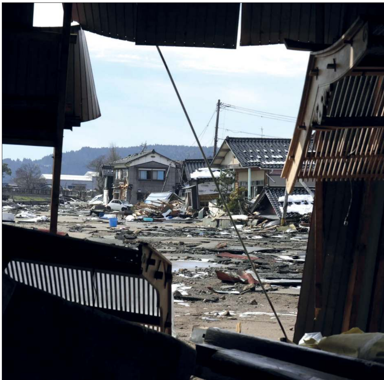
▲ La Agencia Meteorológica, que confirmó varias réplicas, informó que el primero fue a 30 km de profundidad.

Japón se asienta sobre el llamado Anillo de Fuego, una de las zonas sísmicas más activas del mundo y sufre terremotos con relativa frecuencia, por lo que sus infraestructuras están especialmente diseñadas para aguantar los temblores.