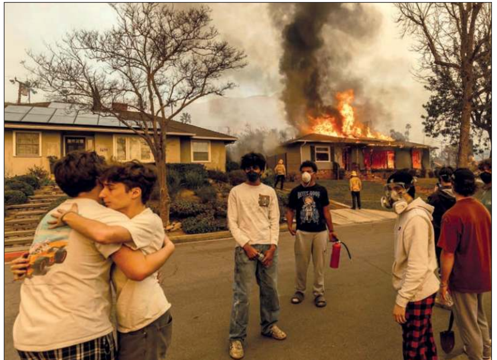
▲ Al menos 24 personas han muerto en los incendios que comenzaron el martes pasado. Las llamas han reducido barrios enteros a ruinas humeantes. De acuerdo con las autoridades, alrededor de 12 mil 300 estructuras han resultado dañadas o destruidas.

El toque de queda en las zonas evacuadas se ha extendido y se requirió mayor presencia de la Guardia Nacional.