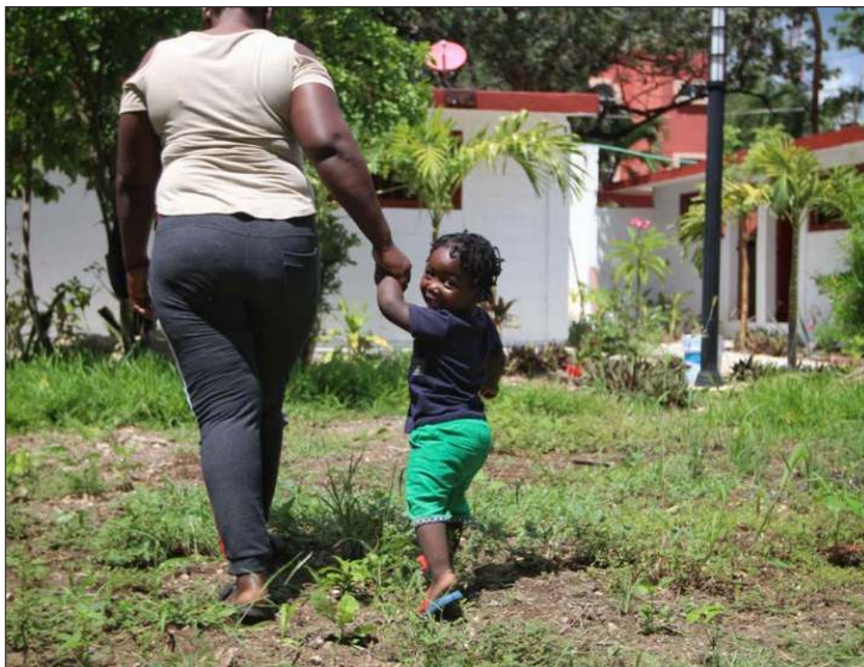
▲ En la mesa de trabajo se acordó que el Sistema DIF, en coordinación con diversas áreas, se encargará de garantizar la educación y el sano desarrollo de las niñeces.