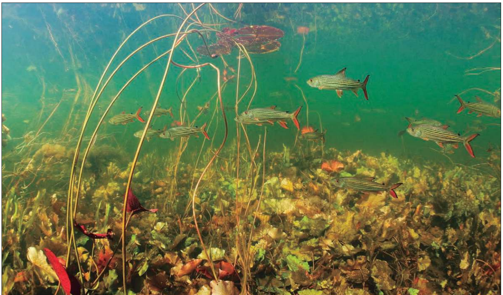
▲ "El valor anual de las industrias altamente dependientes de la naturaleza es de 13 billones de dólares, que representan 15% del PIB global".