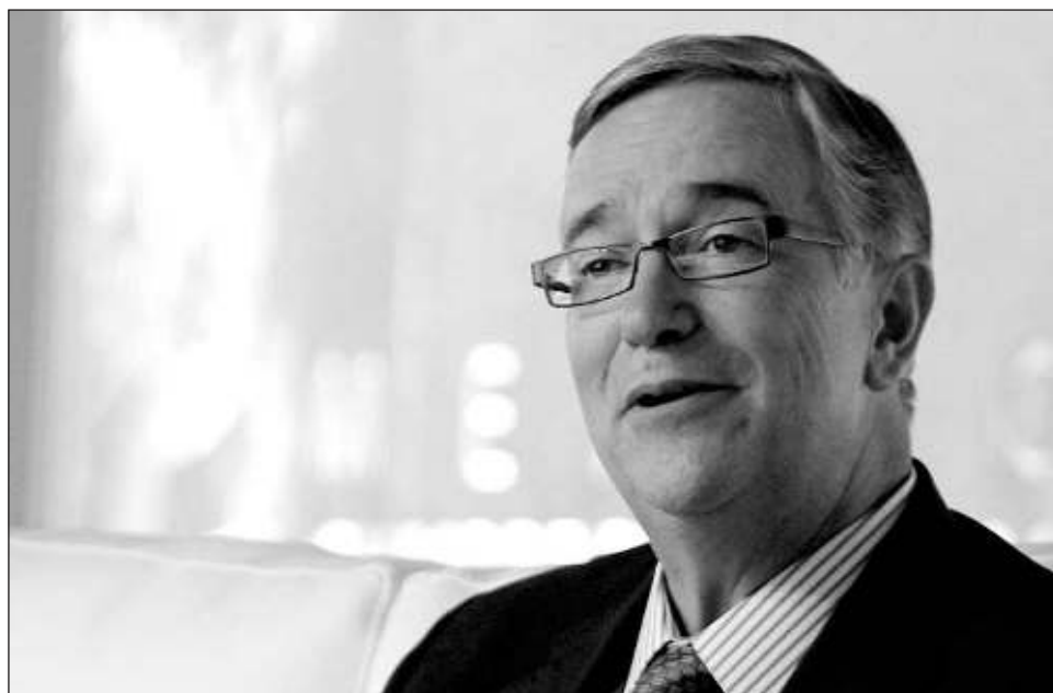
▲ La sentencia se dio en enero del 2024 y, un año más tarde, es desechada por el TEEC, aunque pide al IEEC reponer la diligencia, pues se debe priorizar que se fundó por violencia política de género.

El representante legal del promovente de la con-