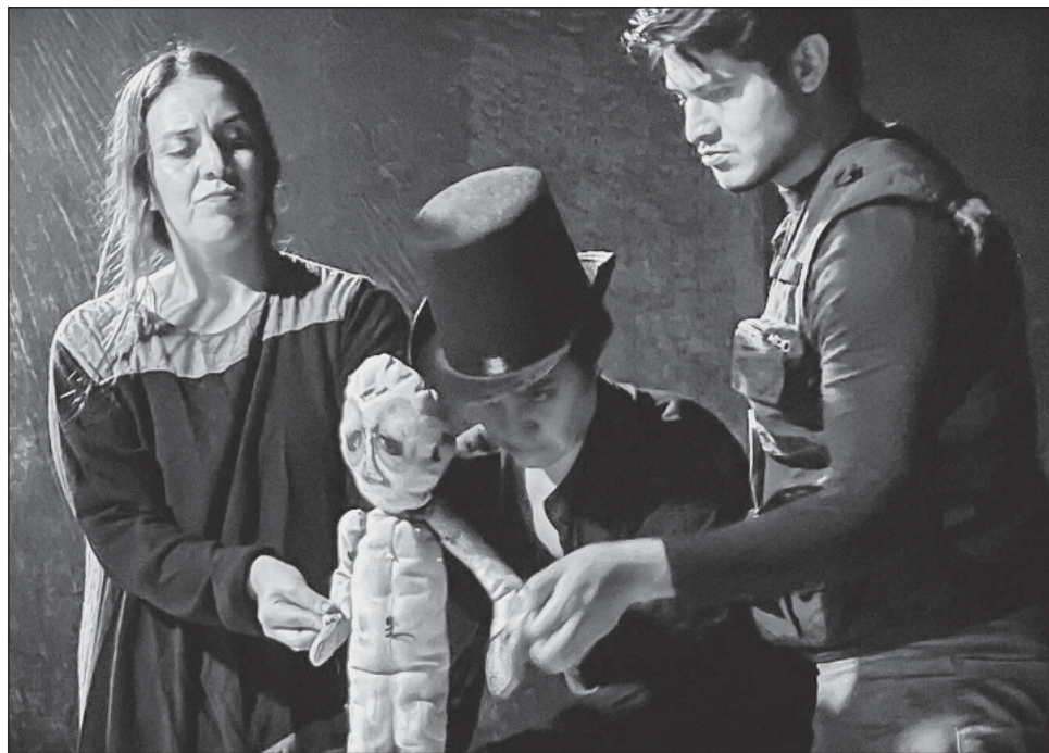
▲ La historia sigue a Creonte, un mago que falla en hacer desaparecer a un espectador frente a su audiencia, y es cuestionado por un periodista.

Es una coproducción entre Creares Escénicas y Explayarte Producciones, y reflexiona sobre temas actuales y universales como la justicia, la memoria y la resistencia. La gira cuenta con el Estímulo a Fomento a Proyectos y Coinversiones Culturales del Sis-