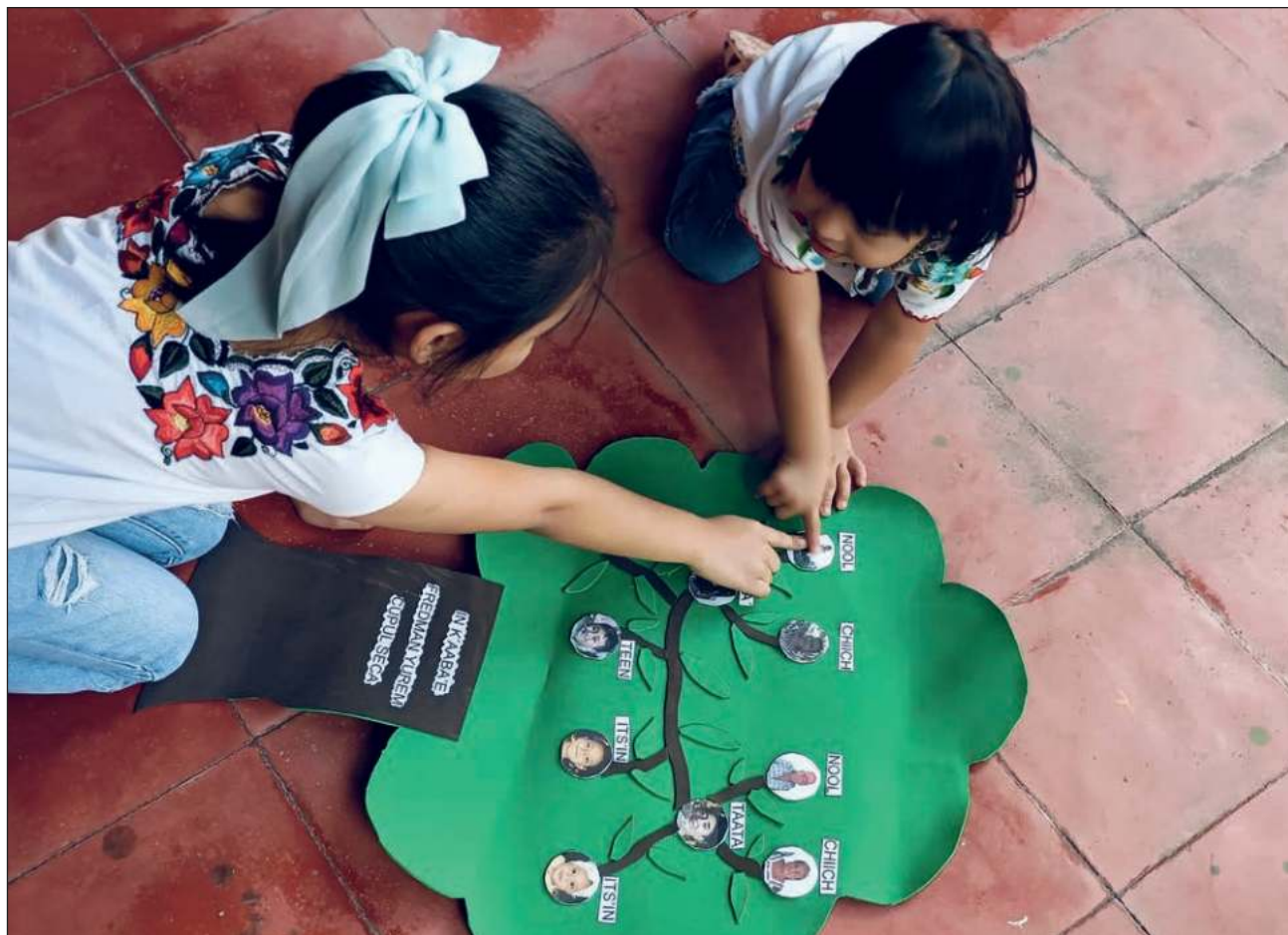
▲ La prioridad es que aprendan el lenguaje con cosas que utilizan en el día a día, como sus colores favoritos.

“Queríamos hacer algo diferente, novedoso, lúdico y llamativo para toda la población, nos habíamos enfocado en algunos contenidos en lengua maya porque a veces no contamos en las aulas para trabajar, a veces sí hay pero no llegan esos insumos a las escuelas donde realmente se necesitan, por eso decidimos trabajar estos contenidos, videos que sean llamativos, coloridos, con contenidos