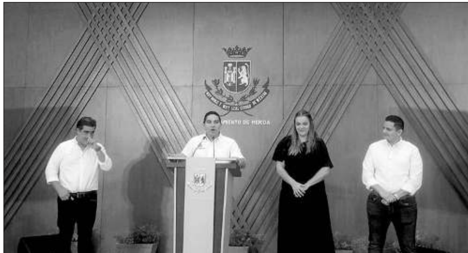
▲ El ayuntamiento de Mérida dio a conocer la iniciativa Mi primer crédito , que ofrece dos apoyos como el Micromer y Macromer, y se une a otros apoyos como el de Mujer a mujer .

Este 15 de enero se abre la convocatoria para registrar parques y áreas deportivas para los proyectos de remodelación y de creación de estos espacios públicos hechos