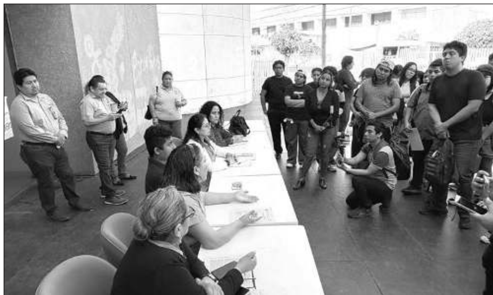
▲ Sostuvieron que los edificios universitarios cada vez están peor por la falta de mantenimiento, como sucede con los sanitarios, que se encuentran sucios y sin agua potable.

Los alumnos sostuvieron que el aumento que se regis-