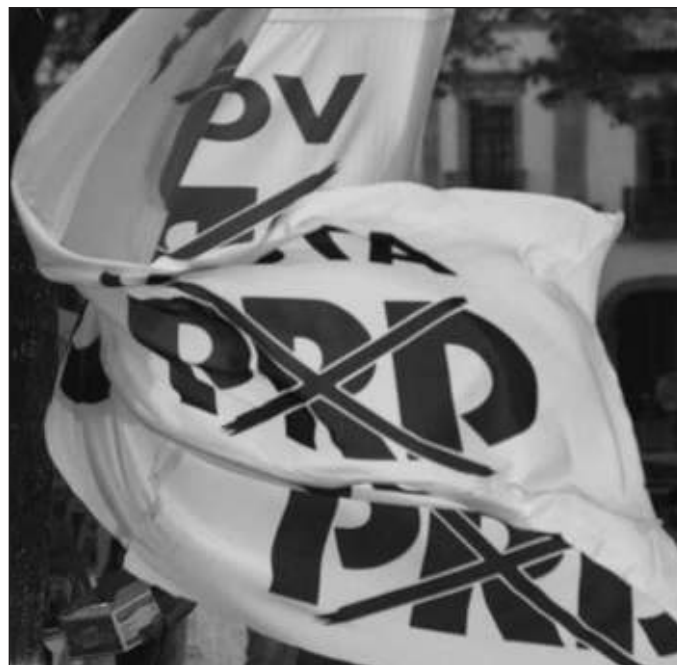
▲ La oposición se encuentra en la lona, desorganizada y en consecuencia ha obtenido menos puestos de representación y el tamaño de los partidos que la componen va a la baja; incluso el PRD fue declarado extinto.

El escenario de un partido prácticamente omnipotente, sin una oposición importante, tampoco es conveniente. México ha coqueteado en otros momentos con gobiernos sin críticos o en el que estos son tildados de locos. Particularmente en el Partido Revolucionario Institucional (PRI), la desbandada ha