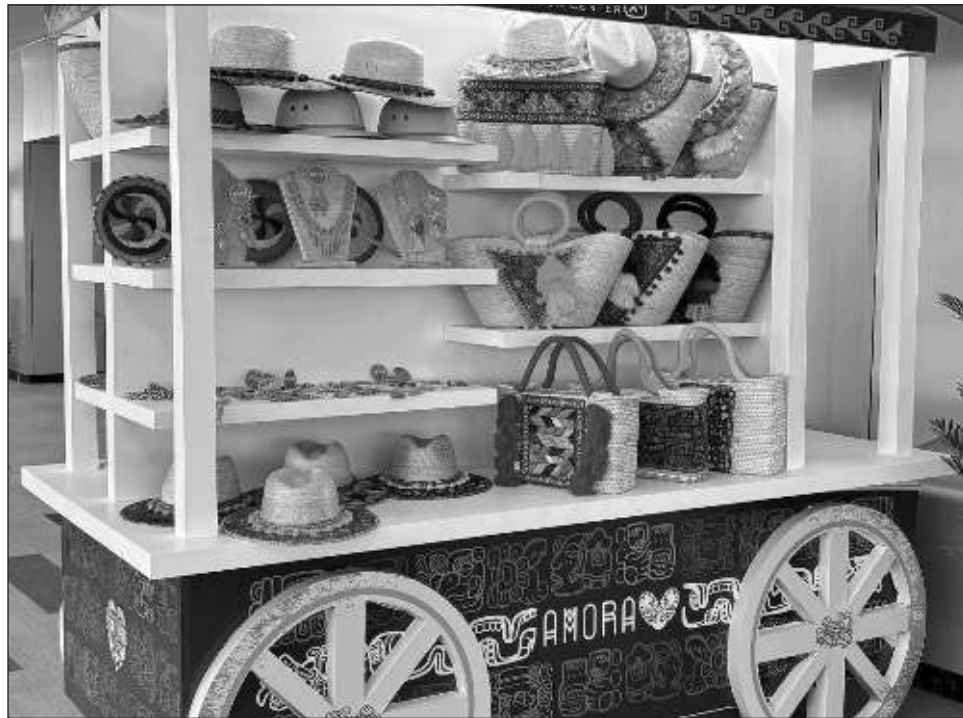
▲ La mayoría de los participantes son de la zona maya: de Bacalar y Felipe Carrillo Puerto, pero también hay productoras que viven en Cancún con facilidad de movilidad.

De manera anual se lanzan convocatorias para productores artesanos y artesanas interesados en participar en los congresos, la fundación pone estos pabellones siempre y cuando el evento lo permita y haya interés, algo que ocurre la mayoría de las