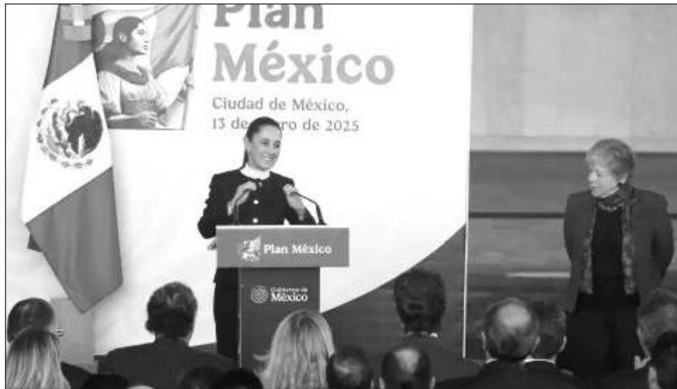
▲ La presidenta Claudia Sheinbaum apuntó que México está pasando de una visión de mercados regionales, cadenas de valor y planes nacionales.

En el Museo Nacional de Antropología e Historia, con