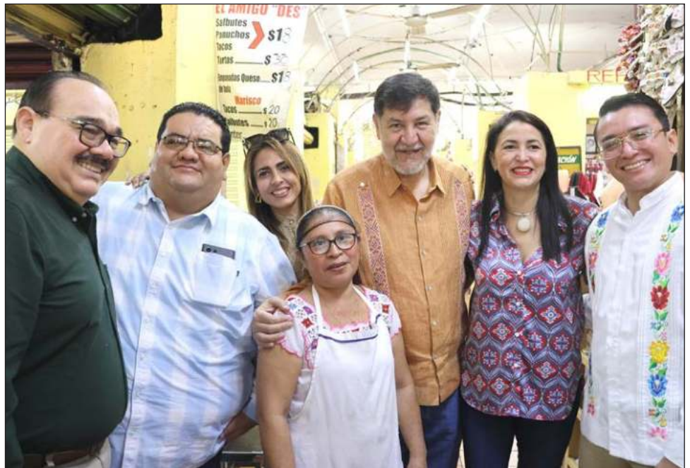
▲ Morena tiene como meta afiliar a más de 10 millones de personas este año, fortaleciendo la organización del movimiento en todo el país.

El senador comentó que la reunión entre la presidenta Claudia Sheinbaum y el Consejo Nacional del Instituto Nacional Electoral (INE), dio buenos resultados y se ha superado el tema del presupuesto para el proceso electoral. Sin embargo, advirtió que el Poder Judicial seguirá intentando sabotear la elección, aunque confía