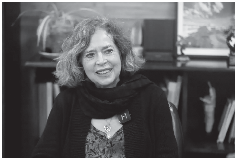
▲ Para la ex directora de la Facultad de Ciencias de la UNAM, quien encabeza la recién creada Secretaría de Ciencia, Humanidades, Tecnología e Innovación, es importante dar a esa disciplina un carácter político para el bienestar de la mayoría.

Con la dependencia que nace, asegura, por el interés de la presidenta Claudia Sheinbaum Pardo, quien “le da este nivel de secretaría de Estado, se busca promover que la ciencia tenga también un papel de carácter político, en particular de las políticas públicas” para el bienestar de las mayorías, por lo que colaborará con todas las secretarías de Estado, las univer-