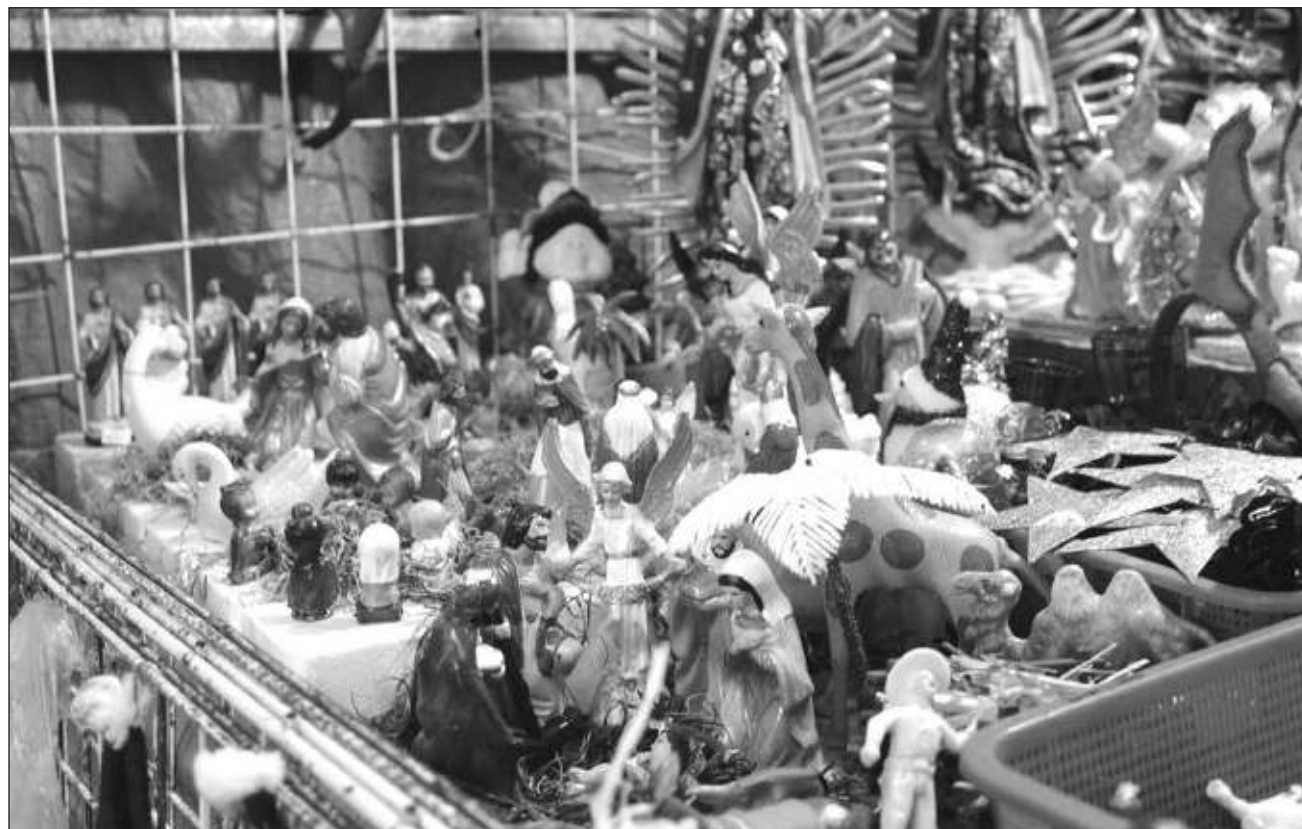
▲ Este operativo concluirá el 6 de enero del 2024 y en él participarán un total de 730 elementos, así como 178 unidades que implementarán medidas preventivas y disuasivas en los 13 municipios del estado, con el fin de tener saldo blanco este periodo.

Entre las acciones que se pondrán en marcha están los operativos Conduce sin alcohol , Tu vida en regla , y Seguridad Bancaria , este