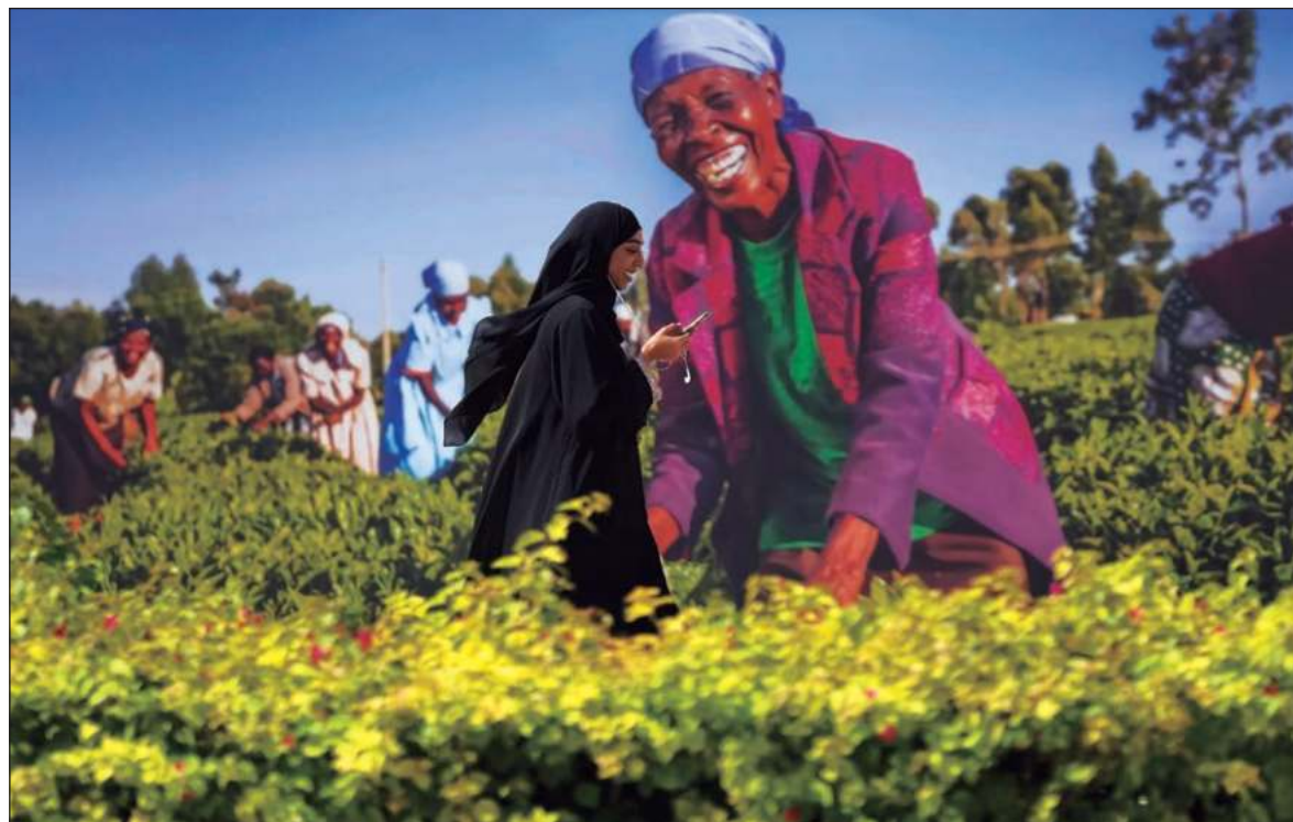
▲ “Merece aplauso la tozuda participación del GCF, organismo que se empeña en impulsar la conservación y el aprovechamiento sustentable de la masa forestal tropical del mundo”.

En este orden de cosas, no resulta sorprendente encontrarse con que en Dubái, a medida que se desarrolla la vigésimo octava Conferencia de las Partes en materia de cambio climático, la discusión más sonora es la que se refiere al financiamiento: ¿Quién debe cubrir los costos de la adaptación al cambio climático global? ¿Se debe esperar que las naciones menos desarrolladas sacrifiquen sus procesos de desarrollo (convencional), en aras de enfrentar los efectos de una nueva circunstancia climática, en la que han tenido una participación relativamente menor que la de los países desarrollados? Por otra parte, precisamente en Dubái, monumento a la generación de riqueza a partir de la extracción de petróleo del subsuelo, se discuten las vías que deberían seguirse