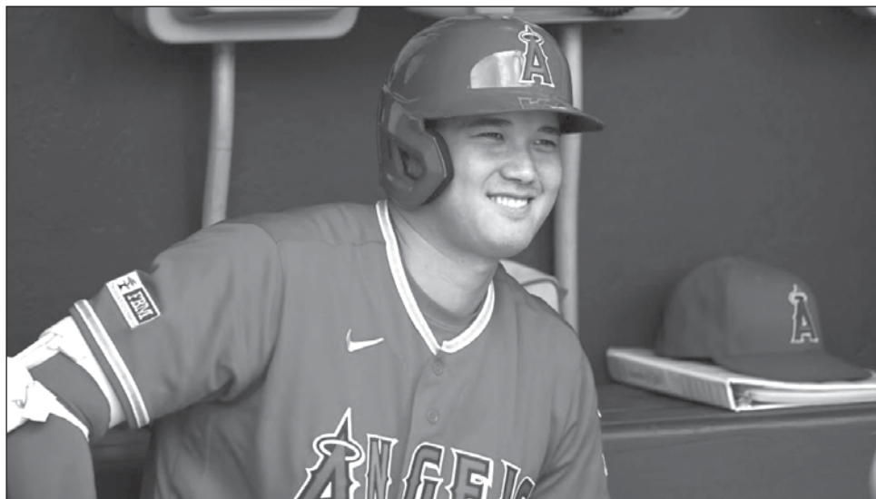
▲ El japonés Shohei Ohtani, nuevo bateador designado de los Dodgers de Los Ángeles.

-Los jugadores en la posición de Ohtani, que acaban de ganar un premio al "MVP", generalmente no se mudan a nuevos equipos. Él es apenas el cuarto Jugador Más Valioso reinante en cambiar de club esa temporada baja, uniéndose a Giancarlo Stanton en 2017 (cambiado de los Marlins a los Yanquis); Alex