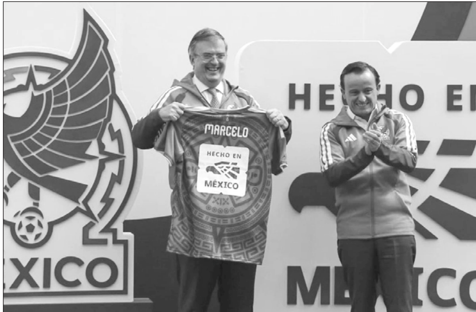
▲ Marcelo Ebrard, secretario de Economía, entregó a la selección nacional de fútbol y a la federación la certificación de Hecho en México rumbo a la Copa Mundial de 2026.