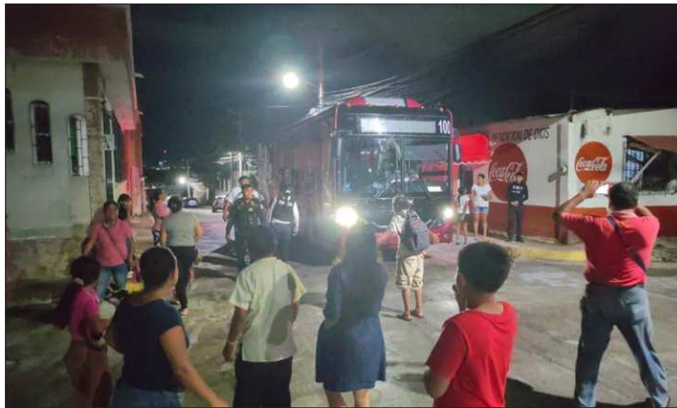
▲ La cooperativa José María Morelos y Pavón busca garantizar su continuidad en el servicio, ofreciendo una alternativa eficiente y moderna para los usuarios.

El líder de la cooperativa señaló que existe disposición por parte de la gobernadora del estado