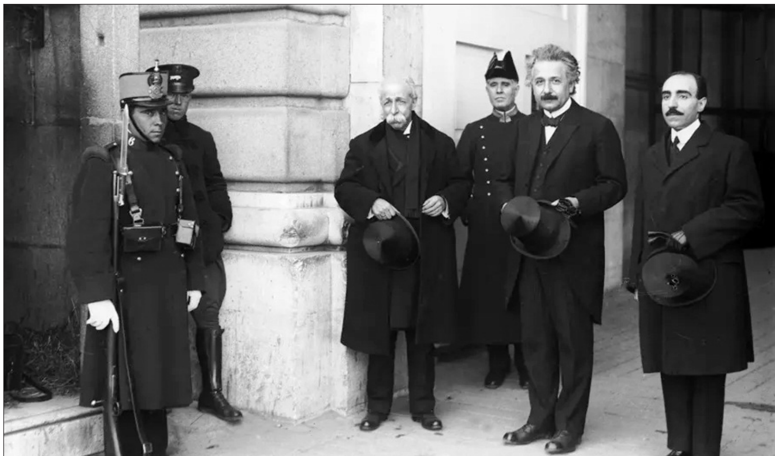
▲ “Drakulić cuenta en Teoría de la tristeza que, en esos años, Mileva colabora intelectualmente con Einstein de forma intensa, resolviendo problemas físico-matemáticos o publicando artículos en su nombre, con la idea desesperada de que Einstein consiga una cátedra, pudieran casarse y recuperar a su hija”.