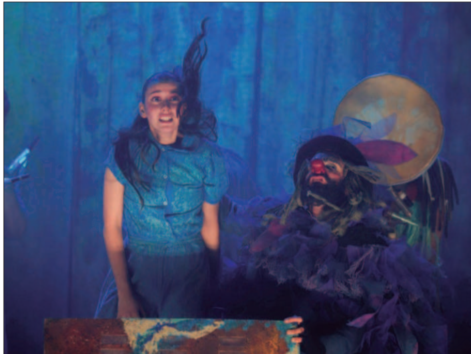
▲ La MNT incluye 29 montajes procedentes de varias regiones de México.