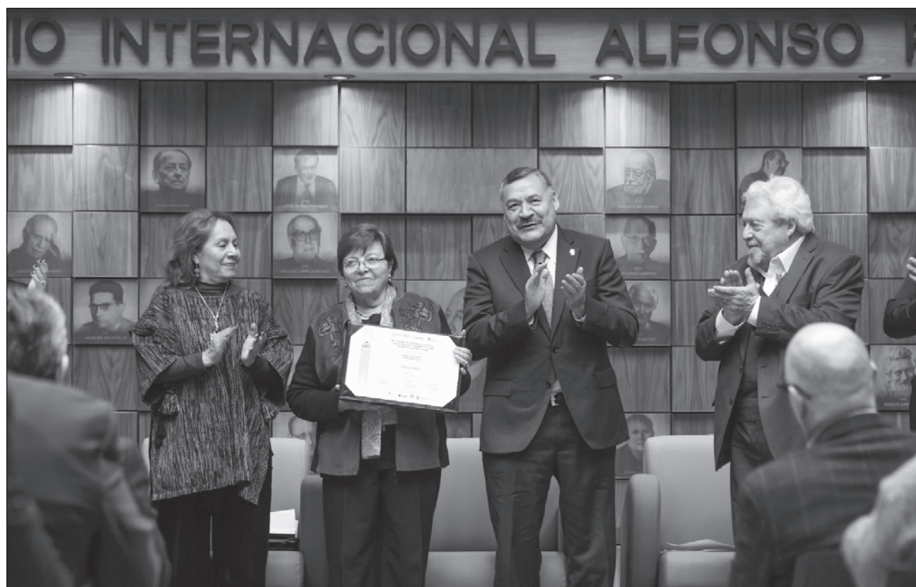
▲ La ganadora del Premio Xavier Villaurrutia pidió a los jóvenes “escuchar dentro de sí mismos y no a través de lo que digan grupos feministas o de afirmación masculina, que escuchen lo que les dicen sus propios cuerpos y mentes”.

En su más reciente título parte de una “voz femenina que no siente la necesidad de afirmarse frente a nada. Es una voz que está ya afirmada”.