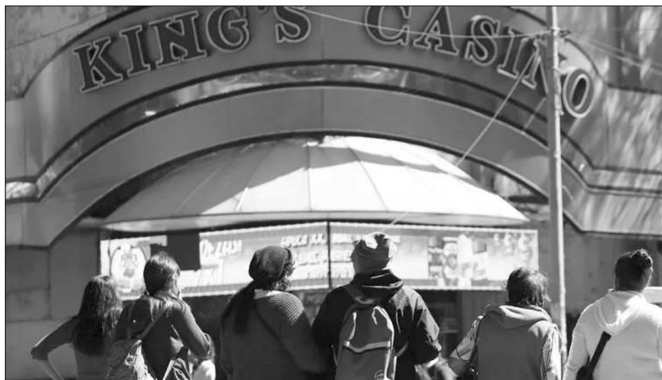
▲ Según la UIF, con el trabajo de análisis, “se identificaron 13 empresas con movimientos financieros irregulares y vínculos con redes del crimen organizado”.

Las empresas seguían tres tipos de patrones: uso