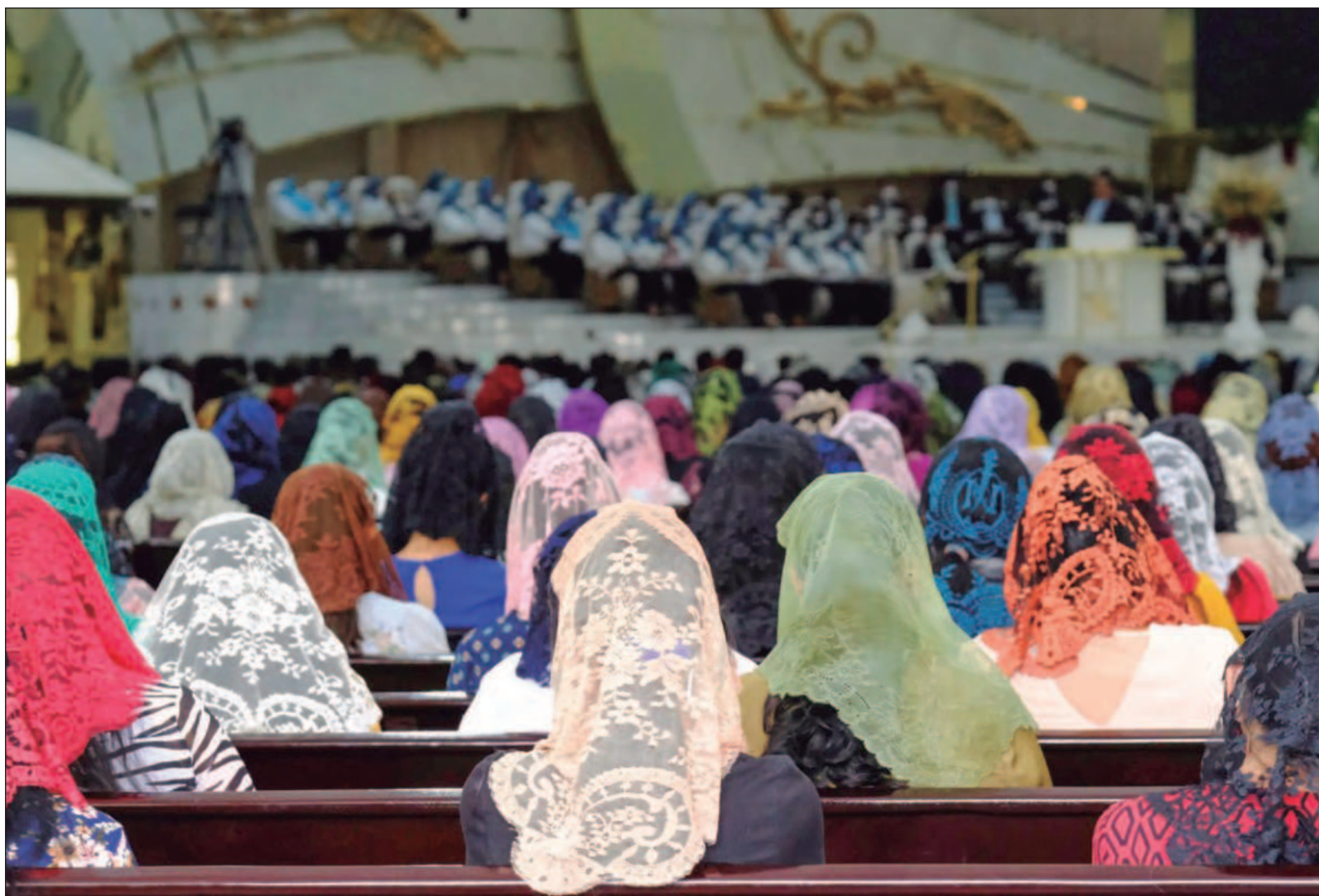
▲ “La fe no es creer en algo, sino descansar en algo; la fe no se impone, se reconoce, como quien encuentra un hogar donde siempre estuvo”.