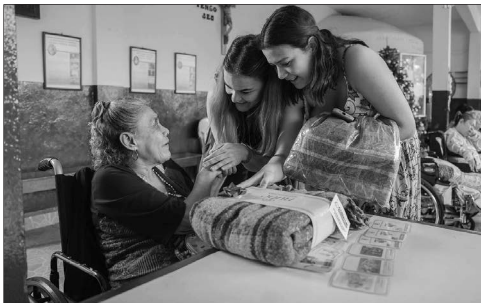
▲ Las cobijas serán destinadas a personas en situación de calle, quienes esperan fuera de los hospitales públicos, y para aquellos que habitan en albergues.

La colecta de cobijas comenzó el 10 de noviembre y concluirá el 15 de diciembre, dirigida a empresas, asocia-