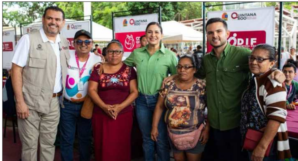
▲ La presidenta municipal Estefanía Mercado acompañó este miércoles al secretario del Bienestar de Quintana Roo, Pablo Bustamante Beltrán, durante la Caravana del Bienestar, realizada en el segundo parque de Villas del Sol.

“Estas jornadas representan el rostro humano de los gobiernos que escuchan, atienden y acompañan. Aquí estamos, hombro a hombro, con el gobierno del estado, acercando servicios y soluciones reales a nuestras familias playenses”, expresó Estefanía Mercado, quien destacó que su administración trabaja todos los días para fortalecer la justicia social y mejorar la calidad de vida de la población.