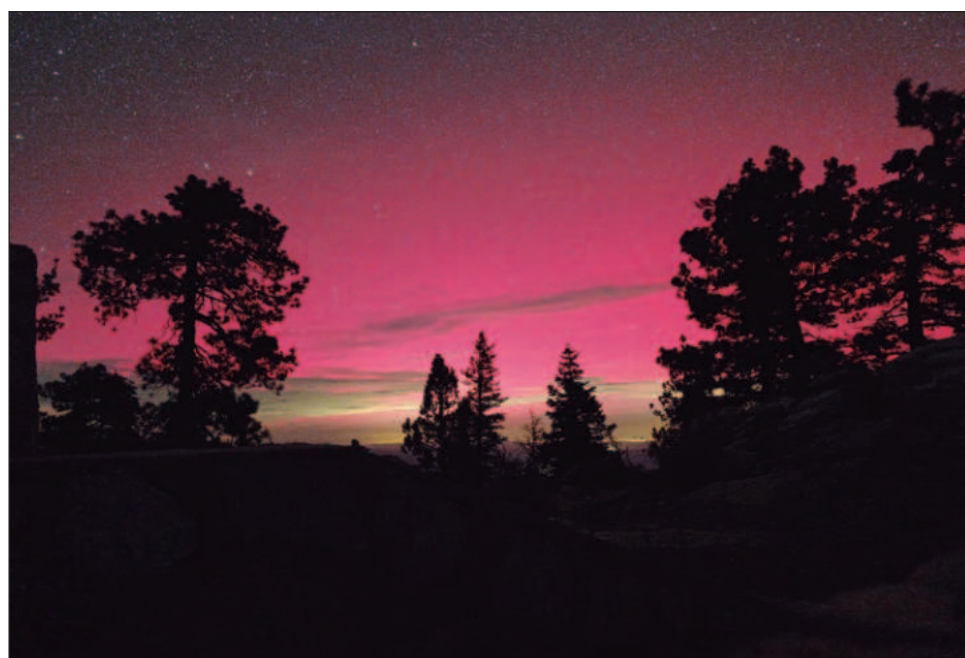
▲ De acuerdo con datos de la Red de Estaciones Geomagnéticas de México, la tormenta comenzó de forma impulsiva alrededor de las 18 horas, tiempo de la Ciudad de México, y mantuvo su máxima intensidad hasta las 21 horas.

Las llamadas luces del norte y del sur son comúnmente visibles cerca de los polos. Pero los observadores dicen que las luces están llegando más adentro de Estados Unidos y Europa