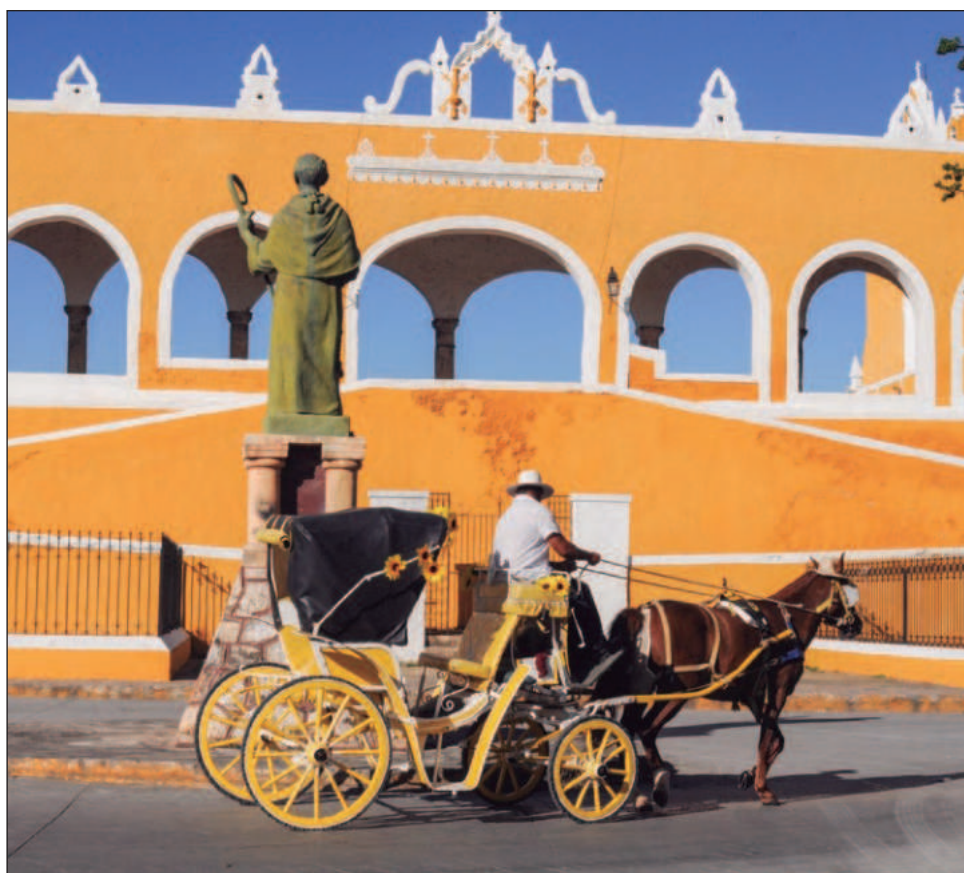
▲ La delegación yucateca estará integrada por artesanos y artesanas, exponentes de la medicina ancestral, prestadores de servicios turísticos y funcionarios municipales.

Como parte del programa, la Sefotur, a través de su área de Turismo Regional, realizará una presentación especial con medios nacionales, misma que se llevará a cabo el 15 de noviembre, donde se promoverán los atractivos del estado y sus Pueblos Mágicos, y se dará a conocer el catálogo “Yucatán, Mosaico de Experiencias”, que reúne 14 propuestas de turismo comunitario.