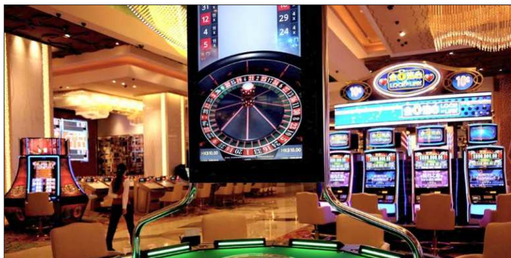
▲ ¿Cuántas historias ha escuchado de quienes pierden toda la compostura buscando prolongar su estancia en un casino cuando ya se les agotó el dinero? La ludopatía hace que muchos caigan en abusos.

Queda también pendiente que el Sistema de Administración Tributaria (SAT) proceda contra quienes están detrás de las empresas fachada y simulan servicios o donativos a fin de lavar el dinero de procedencia dudosa. Estos son los niveles que ya requieren un perfil mucho más compenetrado con las actividades ilícitas. Si ya se tiene el sustento legal y pruebas, lo siguiente es presentarlas ante la Fiscalía General de la República y que ésta consigne a los responsables de esas operaciones, y esperamos que se llegue incluso a quienes se sienten confiados en que siempre contarán con los más pobres para seguir operando sus máquinas de guerra contra el interés colectivo.