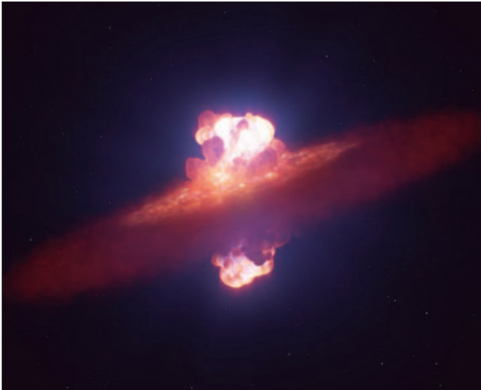
▲ Los investigadores observaron la explosión 26 horas después de la detección inicial.

La muerte explosiva de una estrella -una supernova- es uno de los acontecimientos cósmicos más violentos, pero el aspecto exacto de este cataclismo a medida que se desarrolla sigue siendo un misterio.