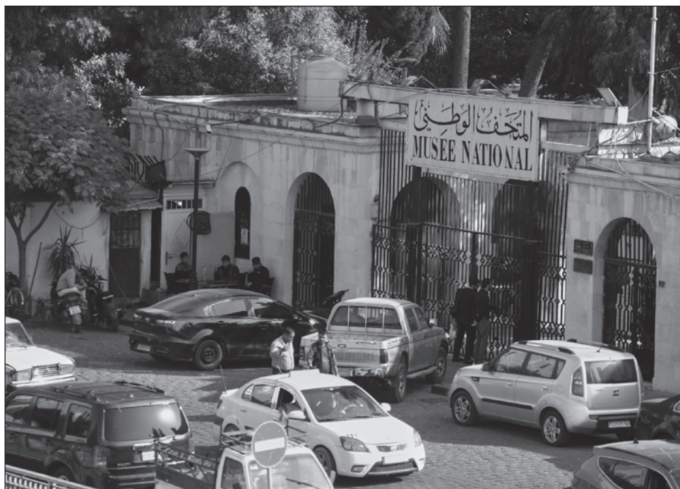
▲ El Ministerio de Cultura creará un comité especializado de juristas y arqueólogos para inspeccionar la situación y crear un inventario para determinar qué ha sido robado.

“Se colocaron piezas falsas en lugar de piezas origi-