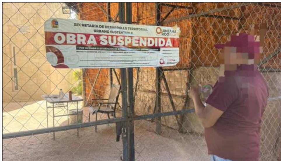
▲ La Sedetec ha iniciado 125 procedimientos administrativos por diversas irregularidades en obras y desarrollos, de los cuales 28 derivaron en clausuras preventiva.

Entrevistado durante su participación en la inauguración del foro inmobiliario de la AMPI en Cancún, el funcionario advirtió que tanto compradores como vendedores deben conocer los riesgos de invertir en terrenos o propiedades sin verificar