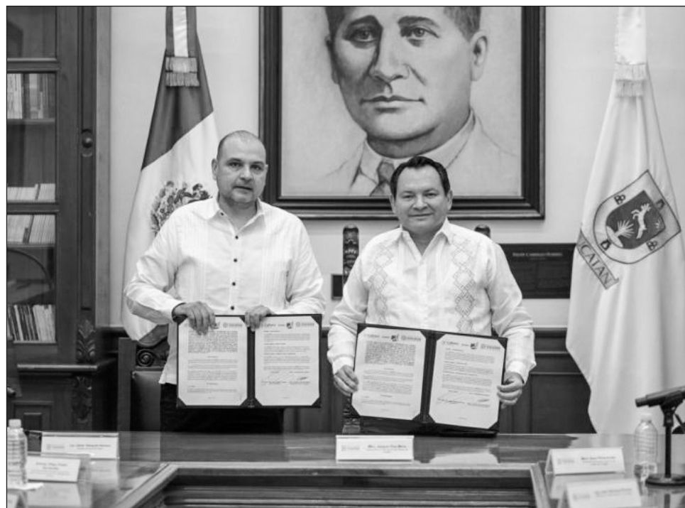
▲ “La colaboración que hoy se consolida abre la puerta para seguir avanzando en el proyecto del Centro de Atención a Visitantes de Chichén Itzá”, subrayó el gobernador.

Durante la firma, se destacó que este acuerdo representa un instrumento jurídico de largo alcance que servirá como base para pla-