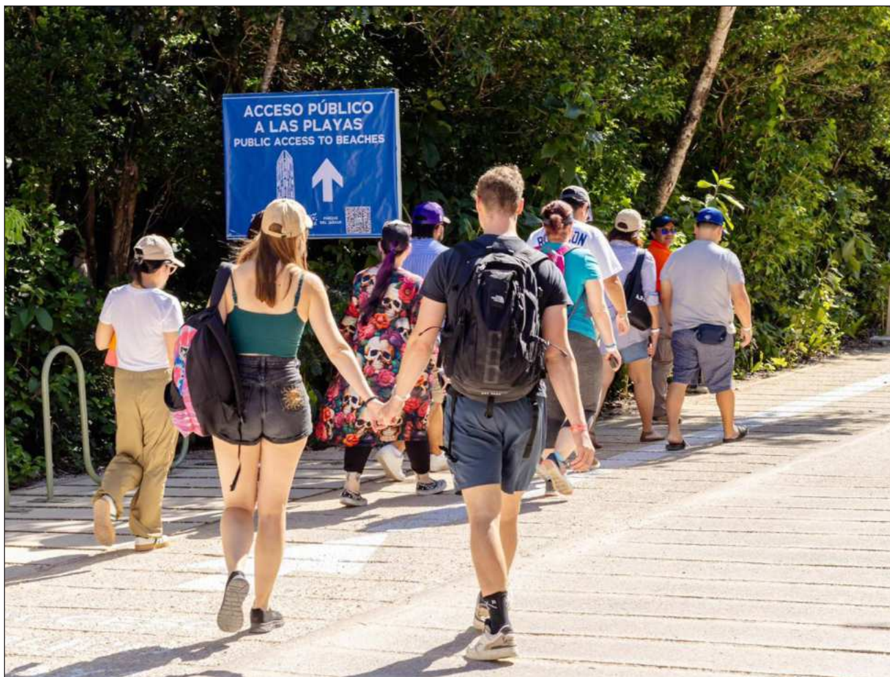
▲ El acceso tradicional, que es el que conoce todo el mundo, tendrá dos opciones: quien quiera ir a la playa se va directo, y quien desee ingresar al Parque del Jaguar pasará a la taquilla para disfrutar de una nueva experiencia.