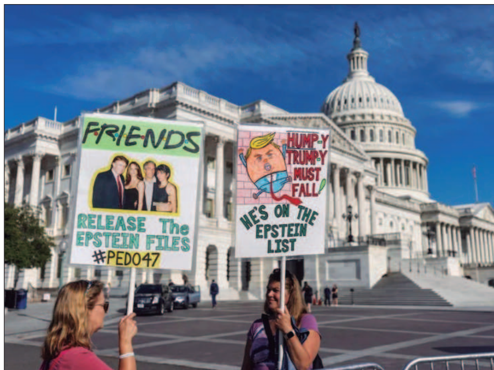
▲ Los correos dirigidos a la antigua asociada Ghislaine Maxwell, condenada por tráfico sexual tras la muerte de Epstein, Epstein afirma que Trump pasó tiempo significativo con una mujer que los demócratas del Comité de Supervisión describen como una víctima del tráfico.

Pero los demócratas del Comité de Supervisión de la Cámara de Representantes dijeron que los correos electrónicos “plantean serias preguntas sobre Donald Trump y su conocimiento de los crímenes horribles de Epstein”.