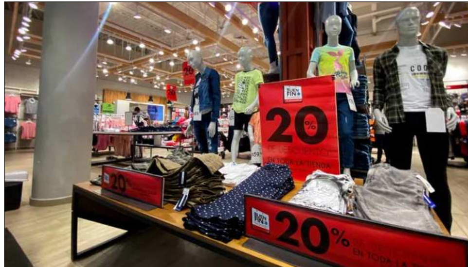
▲ Las tarjetas de crédito se perfilan como el principal instrumento que se usará para financiar las compras de usuarios que aprovechen las ofertas en establecimientos.

"Ha ido creciendo el crédito al consumo a lo largo