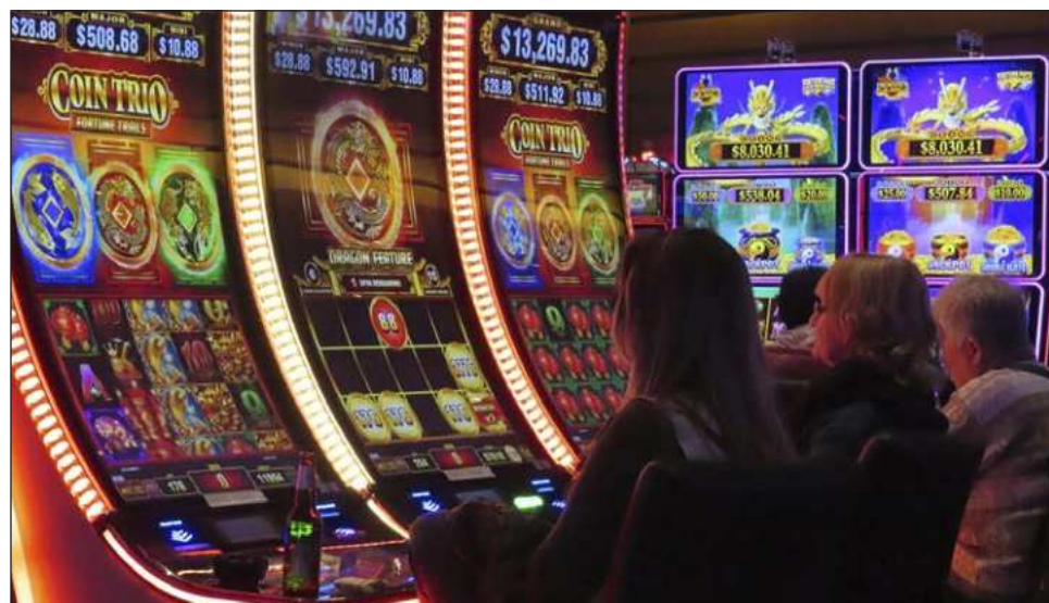
▲ El titular de SSPC subrayó que se detectaron “casinos con operaciones en efectivo y simulación fiscal, donde se registró dispersión de recursos entre filiales y declaraciones en ceros”.

Indicó que a partir de estos hallazgos “inicia una nueva etapa de prevención”;