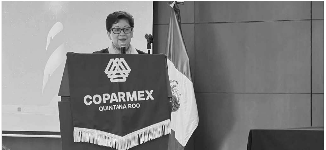
▲ Coparmex promoverá el uso de materiales reciclables y locales e implementará sistemas de gestión de residuos de obra; también integrará a Mipymes en la cadena de valor verde y formalizará un convenio de colaboración regional entre instancias.

"Nosotros como Coparmex Quintana Roo somos los anfitriones, participamos en una plenaria, una mesa de trabajo por día. Los objetivos de esta gira son socializar el enfoque nacional de la política de economía circular y la construcción de una estrategia nacional enfocada en esta economía