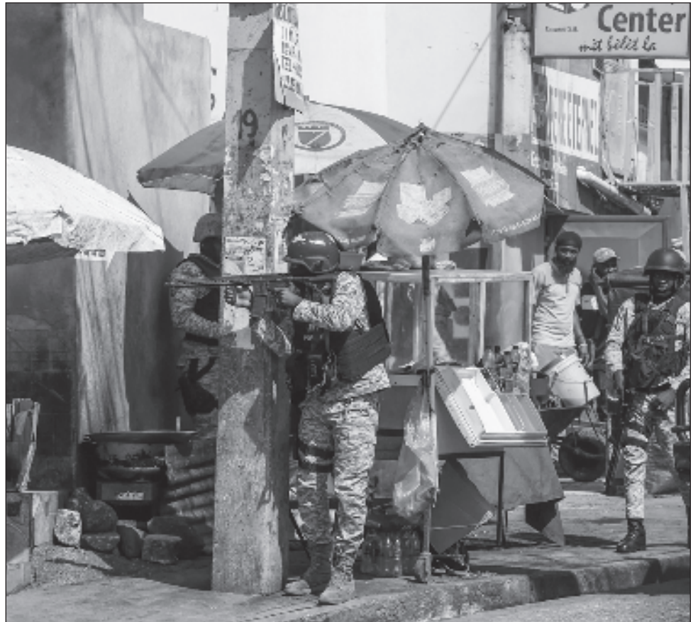
▲ Entre los meses de julio y septiembre de este año, en Haití al menos mil 223 personas murieron y 522 resultaron heridas por los hechos violentos entre pandillas.

La seguridad será uno de los grandes desafíos del nuevo Ejecutivo, en un país en el que solo entre julio y septiembre pasado al menos mil 223 personas murieron y 522 resultaron heridas como consecuencia de la violencia y la lucha contra las bandas.