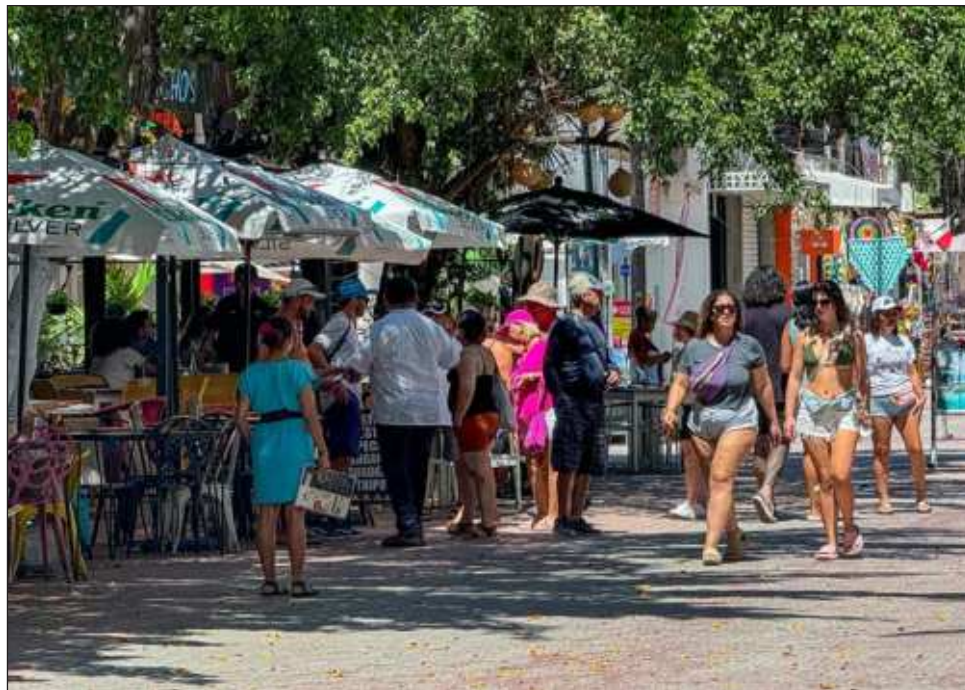
▲ Los empresarios no tienen ninguna posición específica, pero dijeron lo ideal sería reunirse con los legisladores y que pudieran platicar sobre el tema.

"El bajar las horas de atención de nuestro personal al turismo nos va a costar trabajo, ya olvídense del costo, que tendrá un impacto, lo tendremos medido y cada empresa encontrará