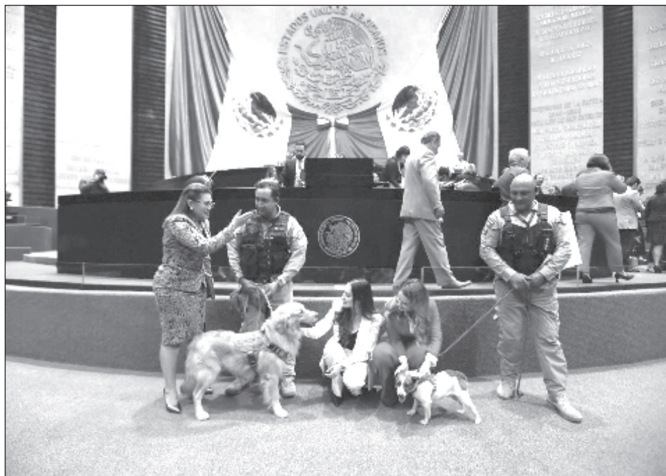
▲ Agregarán en el artículo 3º constitucional que, en los programas educativos de educación básica y media superior, se incluya la enseñanza de protección animal.

Se presentaron 30 reservas al dictamen, pero sólo fue aprobada una de ellas, de la diputada Martha Olivia García (Morena), mediante la cual se especificó que, además de que la Cámara de Diputados puede legislar en materia de protección de los animales, también debe hacerlo en cuanto a su "bienestar".