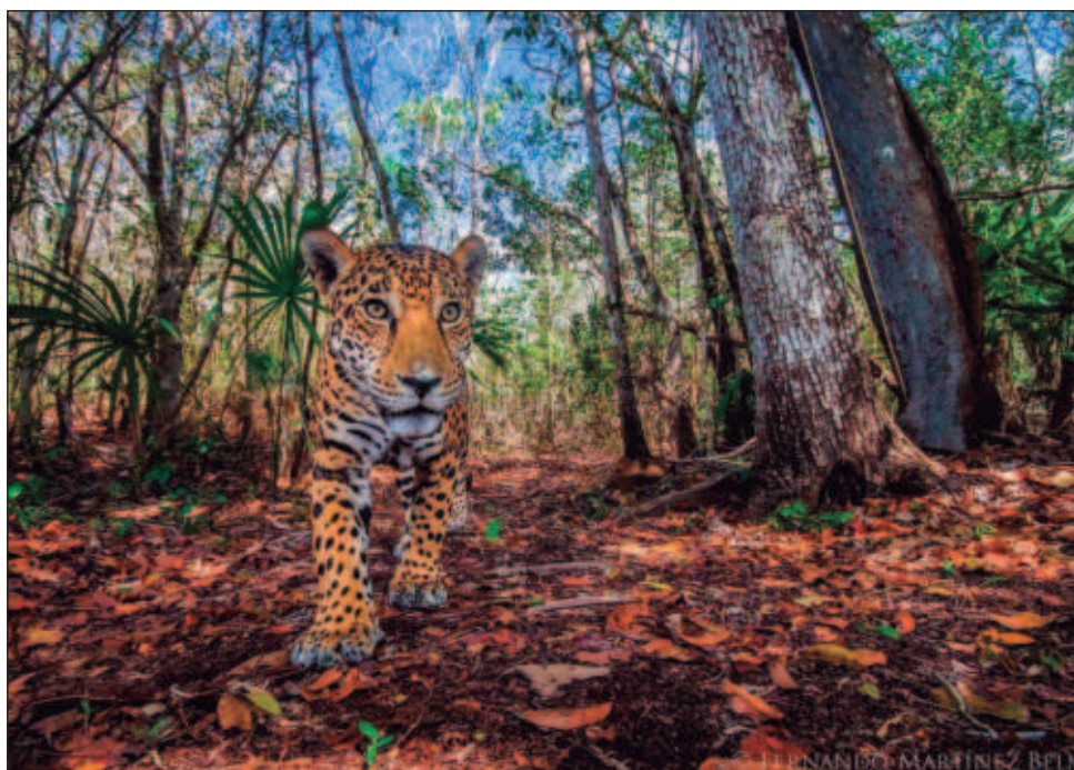
▲ Es la séptima edición de este encuentro que tiene la misión de acercar la ciencia a todas las personas interesadas bajo un concepto más relajado.

Beer O' Crock expondrá el material del ganador del Wildlife photographer of the year