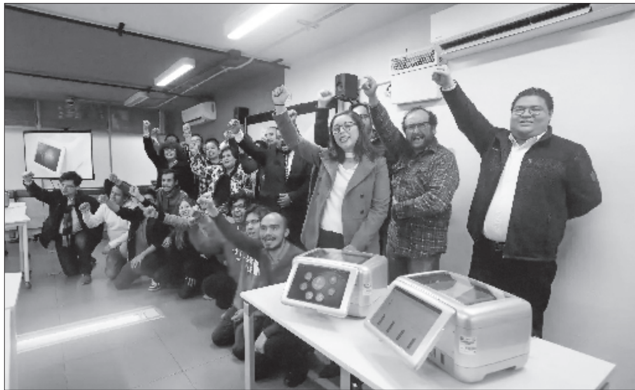
▲ Los científicos, galardonados por una institución de Montreal, trabajan con dos computadores cuánticos que llegaron a la Facultad de Ingeniería de la máxima casa de estudios del país hace dos años.

En entrevista, agregó que desde que esas máquinas llegaron a la Facultad de Ingeniería, una treintena de alumnos han interactuado con ellas y realizado prácticas. “Antes, implementaban sus algoritmos de forma simulada o los subían a la nube de IBM, donde tenían que hacer fila para ingresar sus datos y