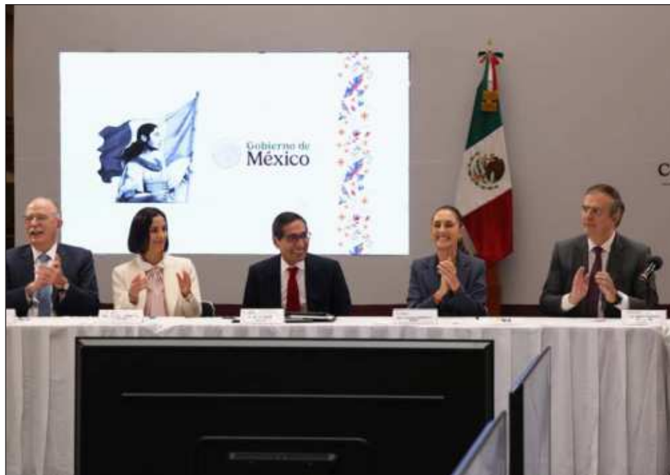
▲ El Pac busca evitar el alza de 24 productos en beneficio de los consumidores.

Durante una reunión en Palacio Nacional, Rogelio Ramírez de la O, titular de la dependencia federal, indicó que 19 empresas productoras de alimentos y once empresas comercializadoras aceptaron participar en el