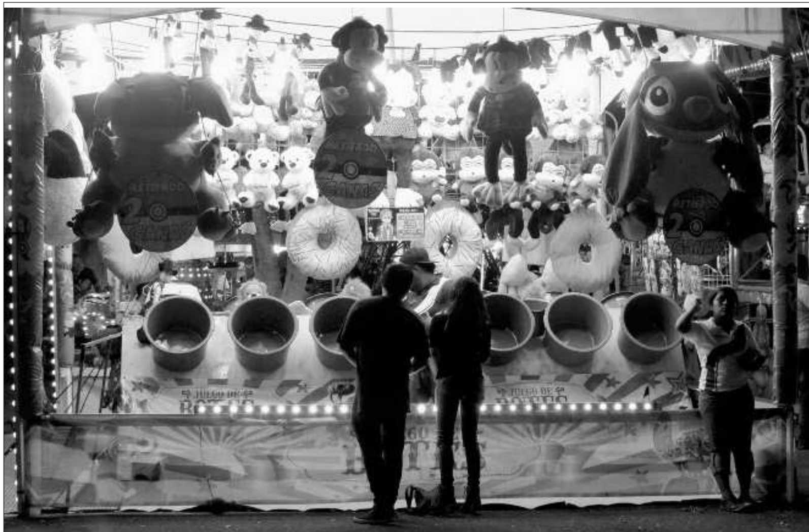
▲ "La feria de Xmatkuil nos remonta a ese pasado en que Mérida era tan reciente, que muchas cosas carecían de nombre".

P.S. El amor en los tiempos de cólera. La escritura en los tiempos del algoritmo. Suelo ir armar estas líneas en el duermevela del fin de semana, rumiando el tema y su enfoque. La idea de hoy, lo confieso, fue el resultado de una siembra de temas con forma de semillas, que florecieron en este híbrido. Ayer fue el Día del libro y, por razones que desconozco, fui bombardeado con noticias sobre el próximo estreno de la adaptación de Netflix de Cien años de soledad . Eso, y el riego constante de conversaciones que giran en torno a Xmatkuil, produjeron este extraño fruto.