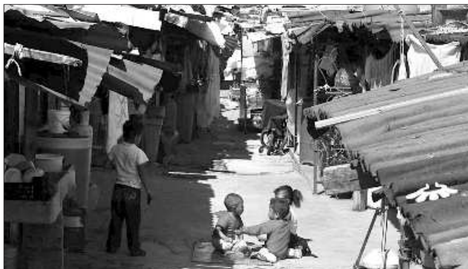
▲ Se debe garantizar la protección de los ingresos fortaleciendo instrumentos actuales, articulando prestaciones contributivas y no contributivas", subrayó la Cepal.

Según la Cepal, la disminución de la pobreza en 2023 está relacionada prin-