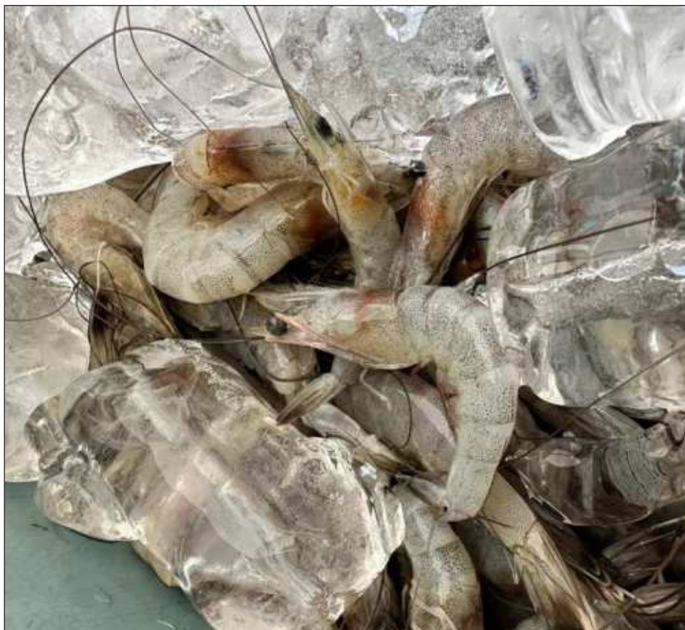
▲ En el marco del festival se llevará a cabo el tradicional concurso la Delicias del Camarón, donde los chef participantes mostrarán sus artes culinarios.

Indicó que de la misma manera, en el marco del Festival de Camarón se llevará a cabo el tradicional concurso la Delicias del Camarón, en donde los chef participantes mostrarán sus artes culinarios con este producto. “Serán siete los concursantes y el jurado será de reconocido renombre, buscando platillos que den identidad culinario a la Isla”.