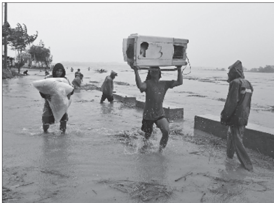
▲ Después de Usagi, el servicio meteorológico adelantó que la tormenta tropical Man-yi, actualmente cerca de las Islas Marianas del Norte, podría llegar a Filipinas la próxima semana.

No se reportaron inundaciones importantes ni