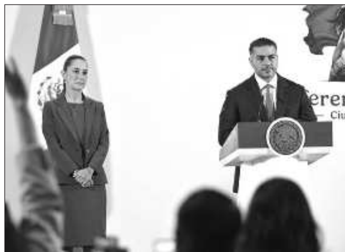
▲ Por lo pronto, García Harfuch se consolida como el máximo jefe policiaco, con pretensiones hasta ahora cumplidas de "coordinar" a los mandos de la Defensa Nacional y la Marina.

EL ACRECENTAMIENTO DE la violencia extrema tiene como marco de referencia los primeros cuarenta y tantos días de gobierno de la presidenta Sheinbaum y, ahora, la programada toma del poder estadounidense por Donald Trump, quien tiene una tripleta de temas con los que tratará de frenar o acotar la continuidad reformista de la llamada Cuarta Transformación: la revisión del