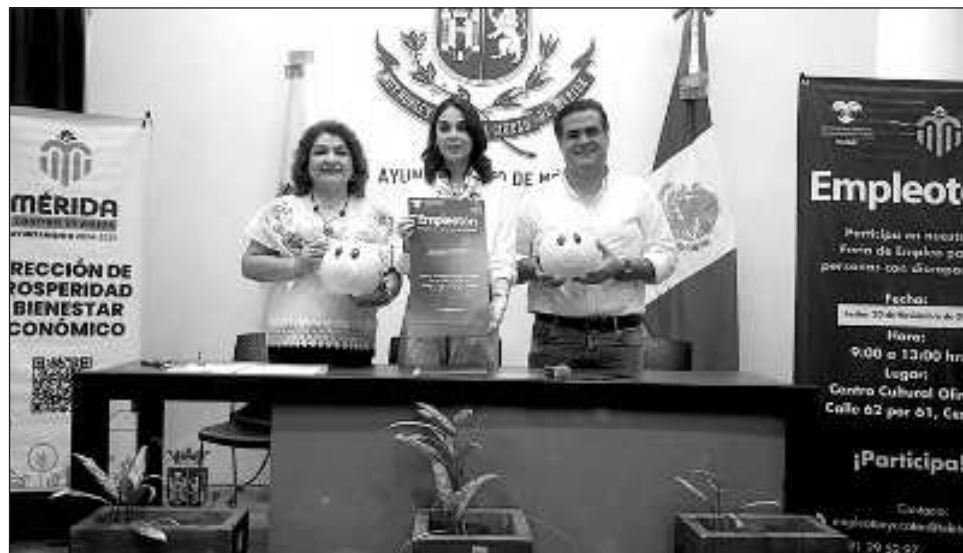
▲ Los organizadores del evento -autoridades del sector estatal y municipal- dieron a conocer que 13 empresas empleadoras participaran en la nueva edición del encuentro.

“Al personal que va a estar a cargo de estos proyectos se le facilitan talleres de sensibilización y capacitación. Hacemos visitas a las