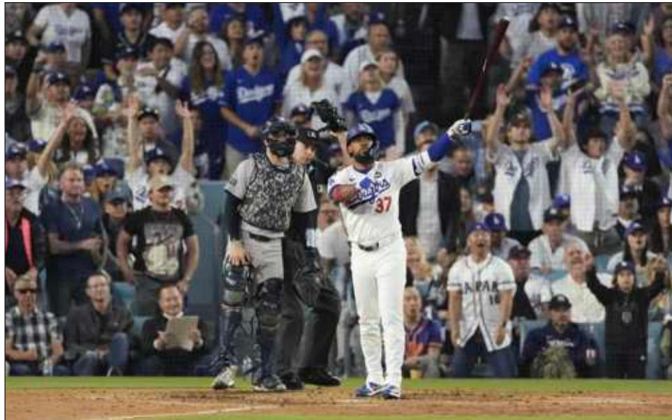
▲ El dominicano Teoscar Hernández, de los Dodgers de Los Ángeles, sigue el viaje de su jonrón de dos carreras en el segundo juego de la Serie Mundial contra los Yanquis de Nueva York.

Judge, quien obtuvo su cuarta distinción, produjo el