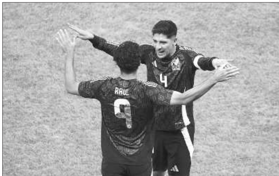
▲ El “Tri” chocará con Honduras por el boleto a las semifinales de la Liga de Naciones.

México se prepara para enfrentar a Honduras en los cuartos de final de la Liga de Naciones de la Concacaf. El partido de ida se jugará el viernes en San Pedro Sula y el de vuelta el martes en Toluca. Los seleccionados tuvieron el martes su segundo día de trabajo bajo las órdenes de Javier Aguirre.