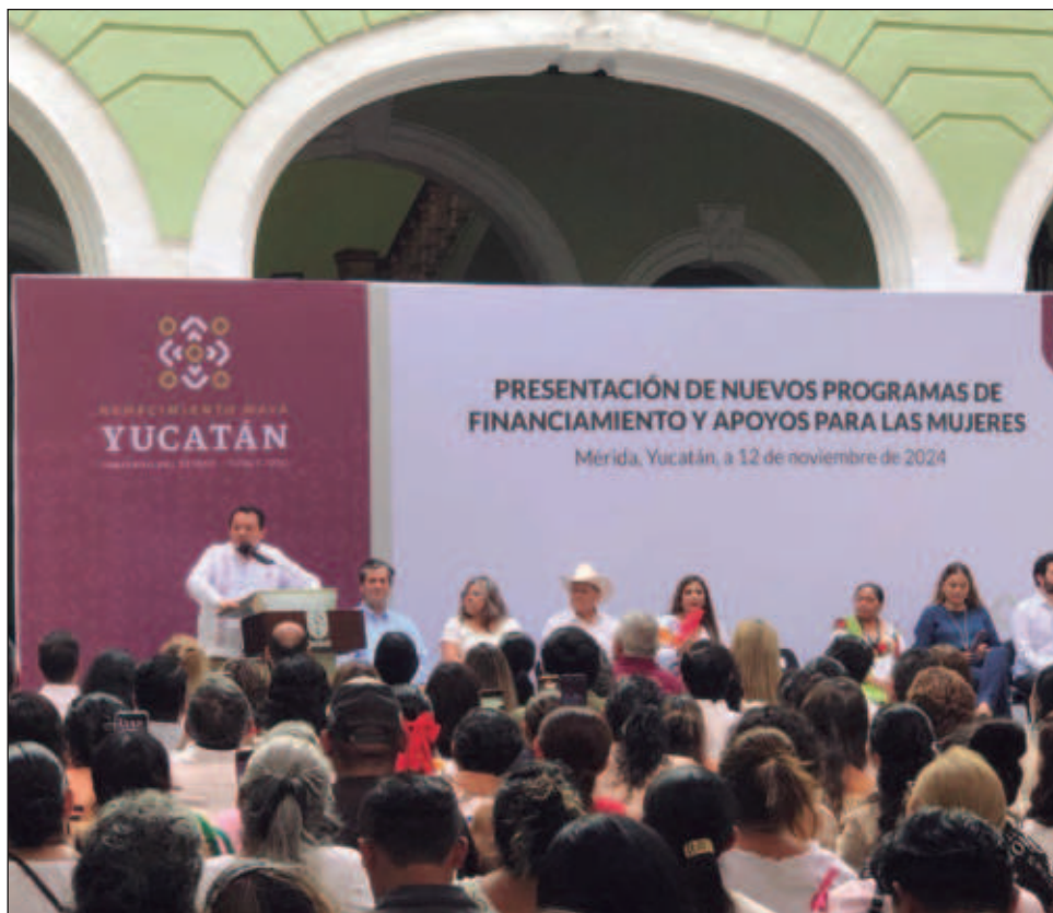
▲ El objetivo del programa es fomentar el “potencial que tienen las mujeres para transformar sus comunidades” a través de la economía, aseguró el gobernador yucateco.

El primero de ellos es un apoyo en especie para el autoempleo que consiste en brindar insumos, equipos