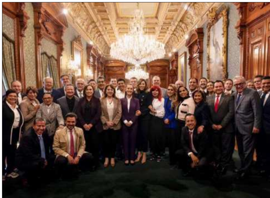
▲ La gobernadora y sus homólogos sostuvieron un encuentro con la presidenta Claudia Sheinbaum Pardo en Ciudad de México.

Se tocaron temas del IMSS-Bienestar, avances de los nuevos hospitales, de los asuntos laborales del personal de salud, mejora de