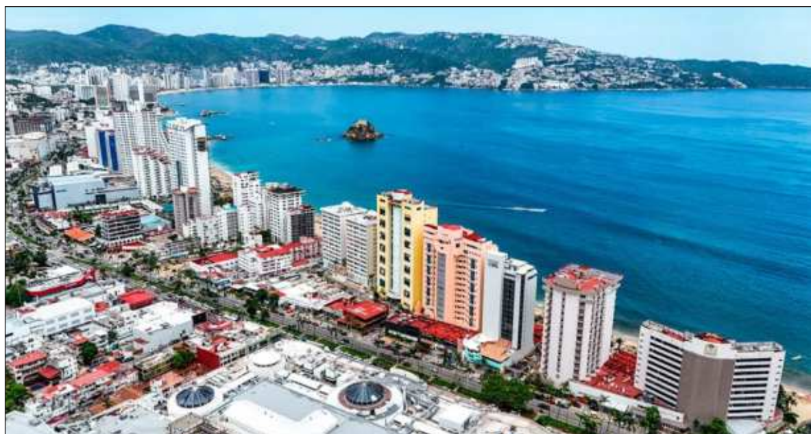
▲ "México se ha vuelto una potencia turística, a veces superando a países con tradición y vocación sectorial indiscutible".

EL PRIMERO, RESCATAR y recuperar Acapulco. Nada fácil; tarea titánica y muy costosa. La zona que en otro tiempo fue la joya del pacífico, una de las bahías más bellas del mundo, fué devorada por dos monstruos naturales que dejaron al descubierto lo que ya