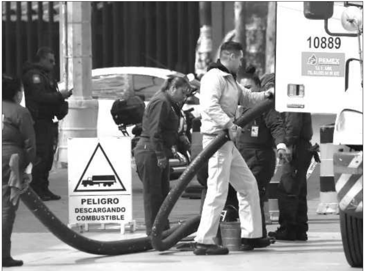
▲ La organización Jóvenes Empresarios A.C. expuso que es urgente que el Congreso del estado se pronuncie en respaldo y apoyo a los proveedores, que atraviesan por severos problemas financieros, "algunos de ellos al borde de la quiebra".

En la imagen difundida en redes sociales, se puede apreciar el logotipo del Consejo Coordinador Empresarial de Ciudad del Carmen, organismo que se deslindó de esta convocatoria, asegurando que llevan a cabo gestiones, dentro del marco legal a nivel local.