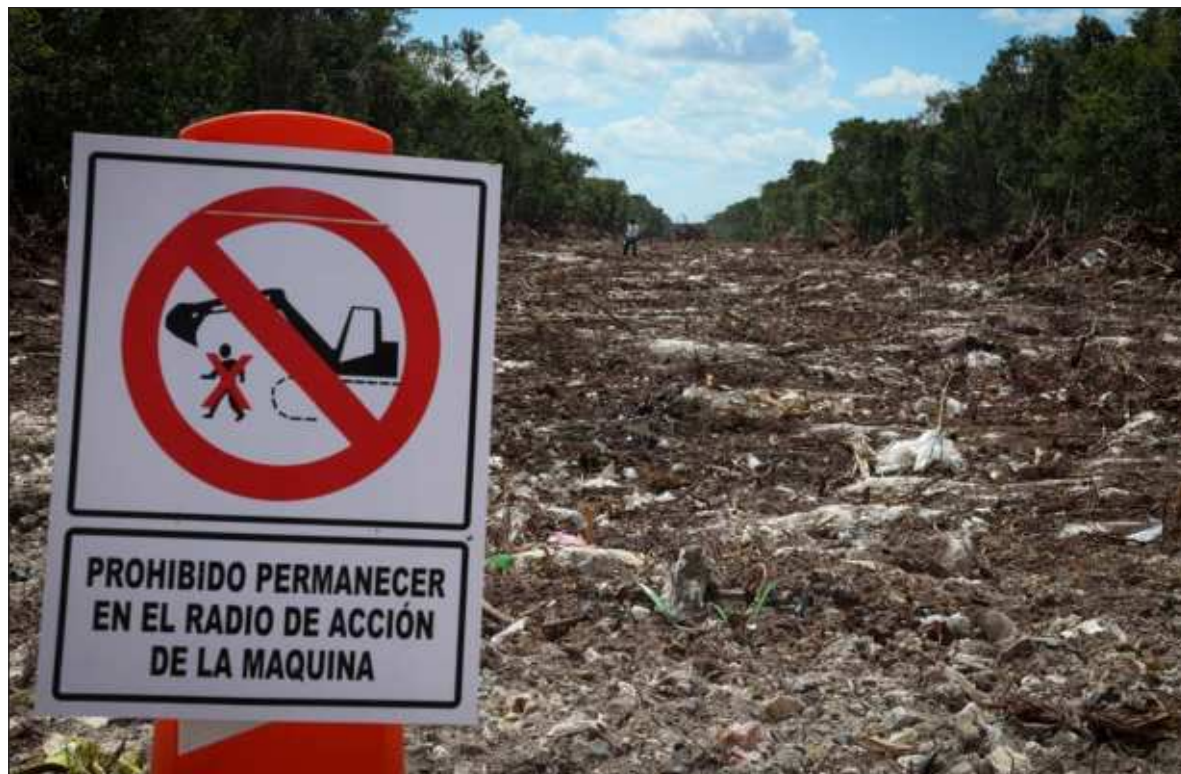
▲ "Quizá el peor daño resultante de estas obras, como el Tren Maya, sea precisamente el no poder evaluar los daños, y por tanto no estar en condiciones de evitarlos, abatirlos o compensarlos".

Resulta menos que imaginable imaginar un escenario en el que un recurso de amparo interpuesto en virtud de un daño ambiental