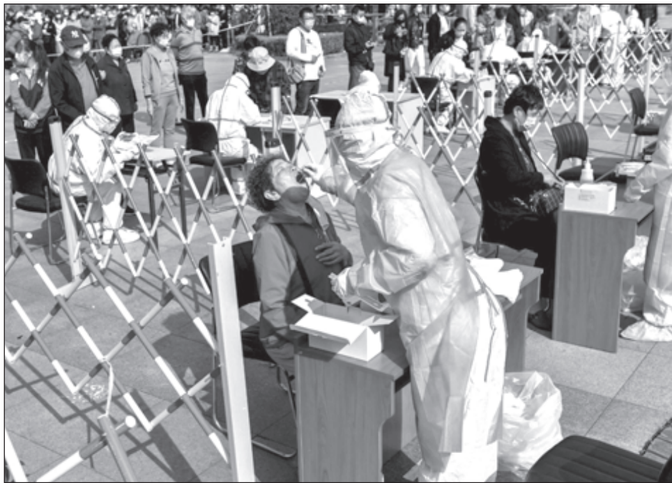
▲ De acuerdo a los reportes oficiales, de los casos positivos reportados de globalmente, al menos 25 millones 963 mil 400 se recuperaron.

China, sin tener en cuenta los territorios de Hong Kong y Macao, registró un total de 85 mil 578