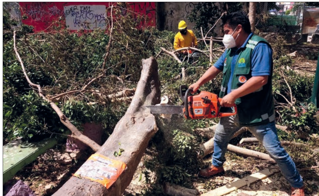
▲ El paso de los sistemas tropicales por el estado dejó afectaciones como árboles y postes de luz caídos, obstruyendo vialidades.