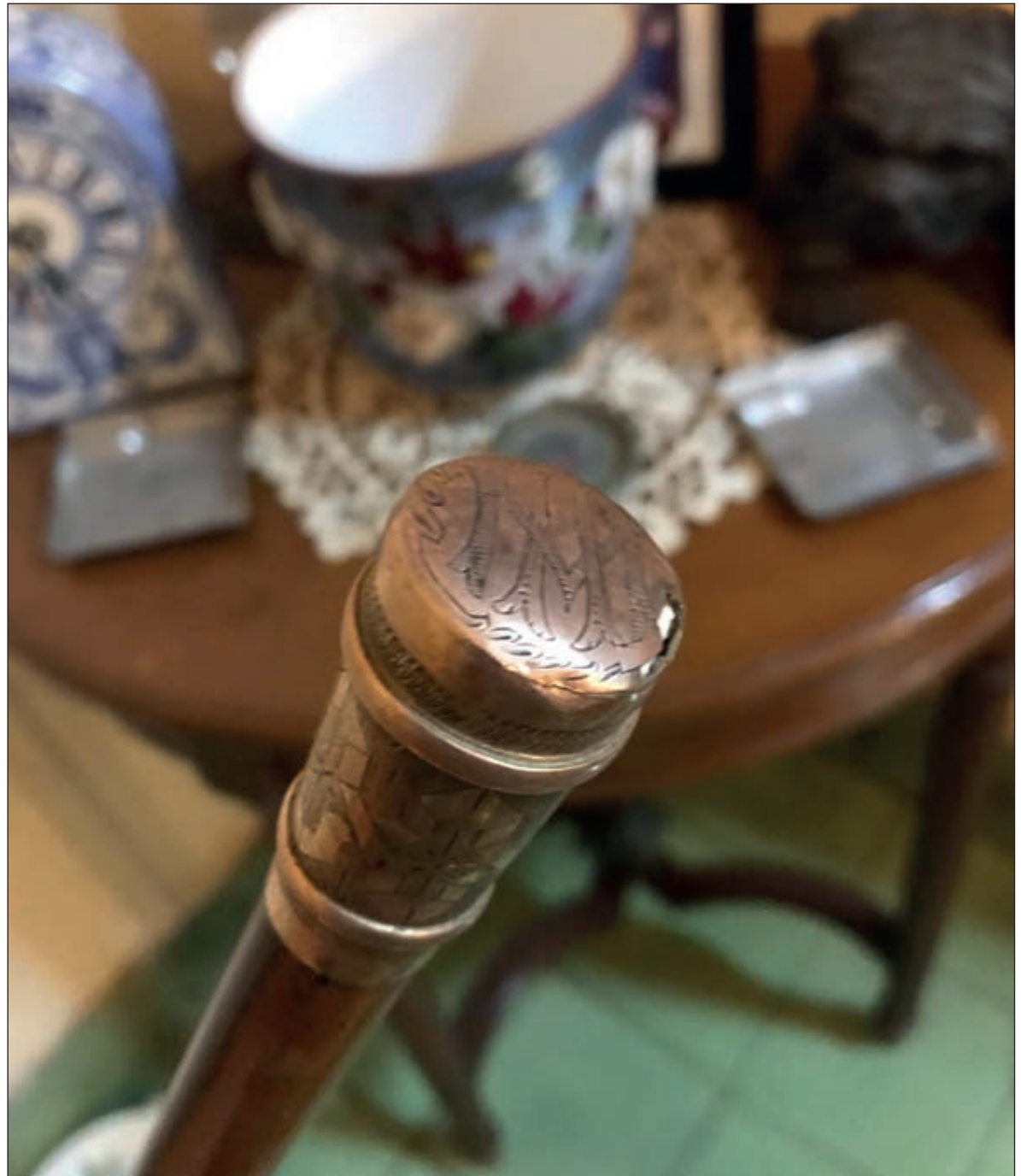
▲ Al regresar otra noche, ahí en las bastoneras, en medio de la hermosa colección de bastones del abuelo, estaban el romano y el del puño de oro, en Art Deco, con mi monograma.