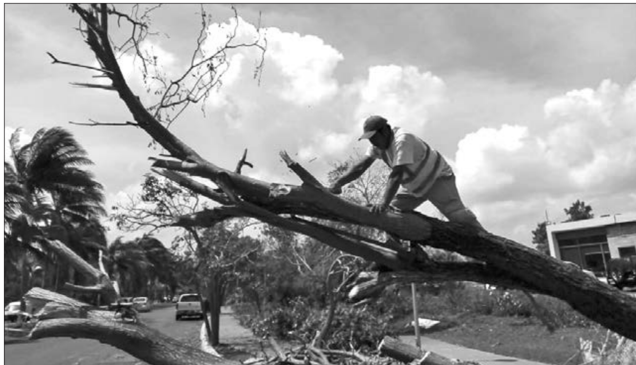
▲ En la zona hotelera de Cancún, cayeron 151 árboles monumentales.

En entrevista telefónica, Bermúdez Arreola destacó que las labores de limpieza y rehabilitación del bulevar Kukulcán llevan 70 por ciento de avance; la prioridad fue dar vialidad y apoyar las zonas inundadas y ahora trabajan en corte de árboles caídos y acopio de basura vegetal.