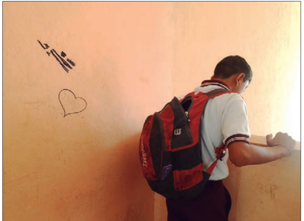
▲ Para la Cdhegroo, el veto parental lesiona el derecho a la educación y a la accesibilidad de la salud integral en sus dimensiones de información y no discriminación.

“Favorece a la obstaculización del derecho a la salud y desarrollo integral, incluida la sexual y reproductiva y la información para prevenir y atender la violencia de género en sus dimensiones de información y no discriminación; tendría un impacto negativo en algunas problemáticas como la detección oportuna del abuso sexual infantil y violencia de género”, precisó