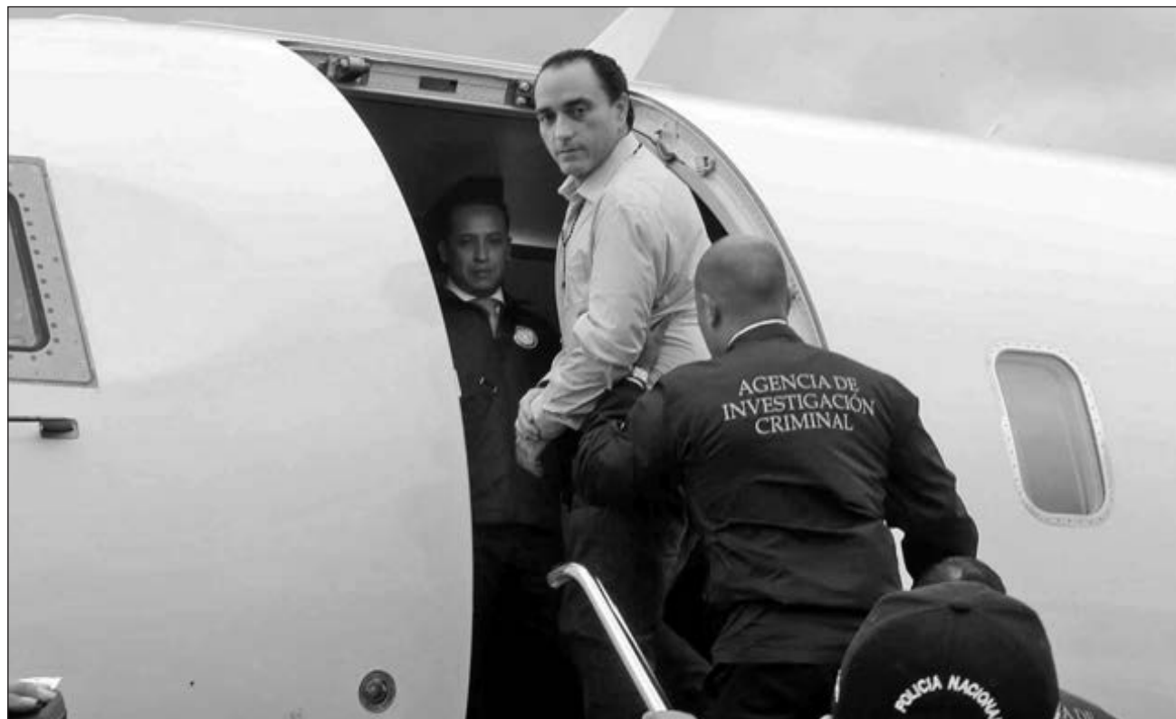
▲ El ex gobernador quintanarroense fue detenido el 4 de junio de 2017 en el Aeropuerto Internacional de Panamá.