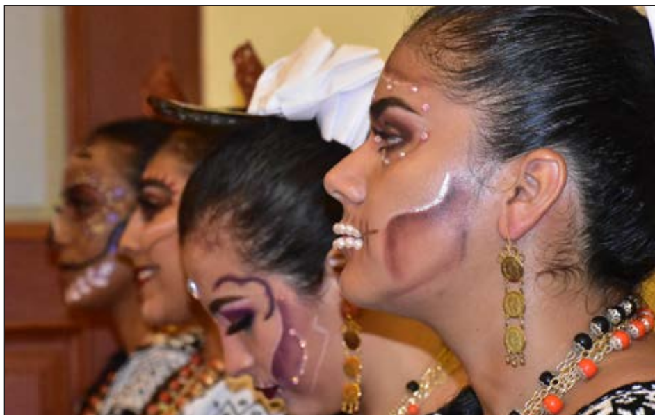
▲ Parte esencial del evento es formar parte de la escenografía, con las catrinas.

El motivo de la cancelación es la pandemia, que aún no está erradicada. El sector turismo dejará de percibir durante esos días al menos 35 millones de pesos, pues dicha eventualidad atrae a turismo nacional y extranjero.