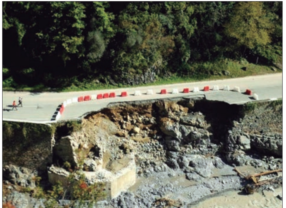
▲ Entre 2000 y 2019 se registraron siete mil 348 desastres naturales en el mundo.

Los costos de las catástrofes naturales son evaluados en al menos tres billones de dólares desde 2000 pero el monto real es más elevado porque muchos países, especialmente en África u Asia, no brindan informaciones sobre el impacto económico.