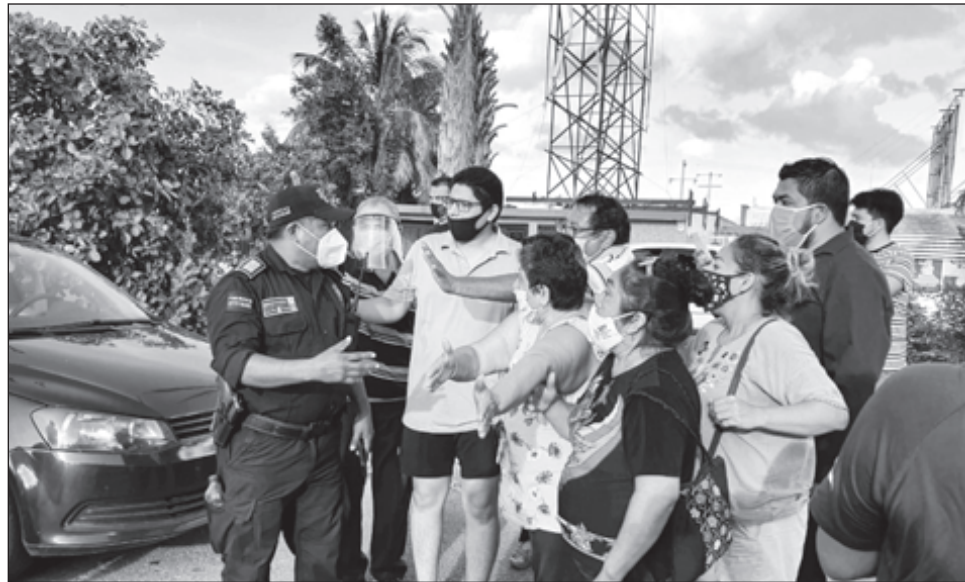
▲ A las puertas de la constructora, vecinos de Las Américas reclamaban acceso a la reunión con funcionarios municipales y Grupo Sadasi.

Agregó que habían acordado fumigar todo el fraccionamiento y sólo lo hicieron en algunas partes.