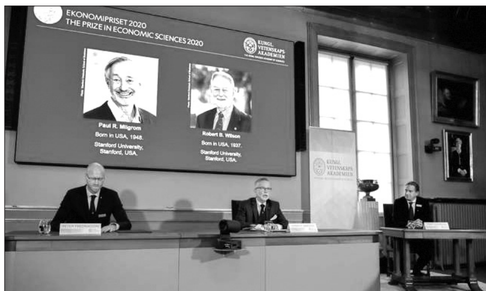
▲ Paul Milgrom y Robert Wilson idearon formatos para vender artículos interrelacionados simultáneamente, en beneficio de vendedores, compradores y contribuyentes.

Milgrom y Wilson idearon formatos para vender artículos interrelacionados