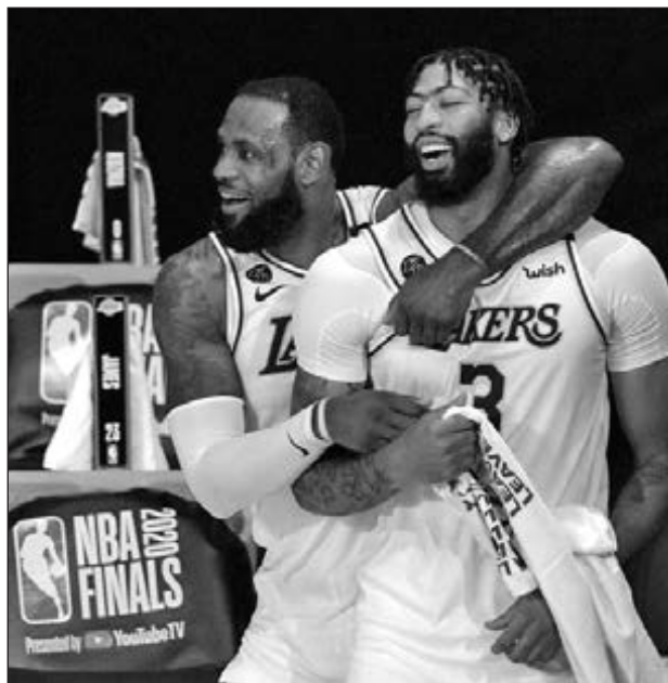
▲ LeBron James y Anthony Davis, artífices del título de los Lakers.

El domingo, tras una dominante victoria ante el Heat de Miami en el sexto partido de las finales, empataron a los Celtics de Boston como los máximos ganadores en la historia del