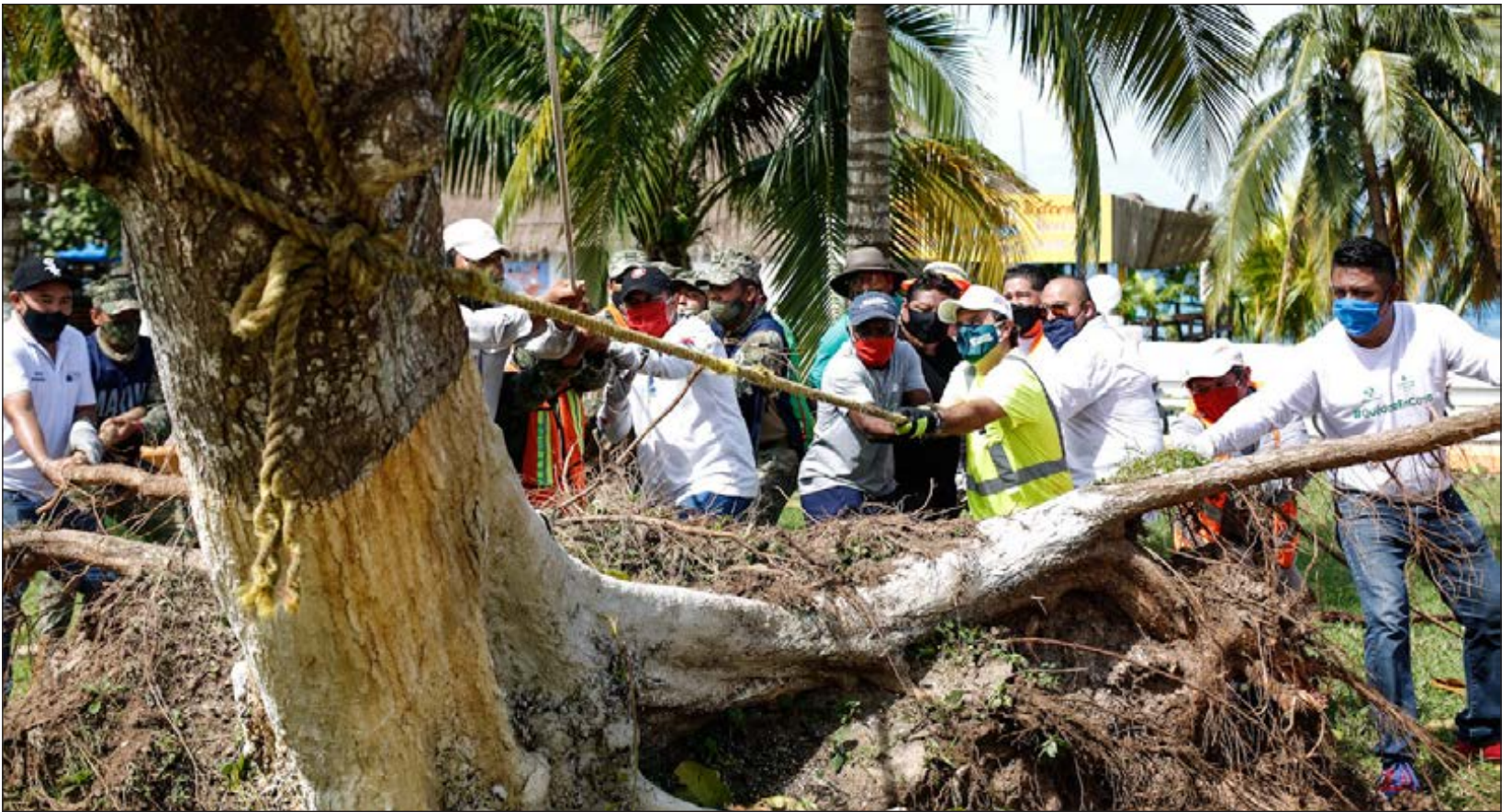
▲ La Coordinación Nacional de Protección Civil emitió este lunes Declaratoria de Emergencia para seis municipios del norte del estado: Cozumel, Puerto Morelos, Solidaridad, Benito Juárez, Isla Mujeres y Lázaro Cárdenas.