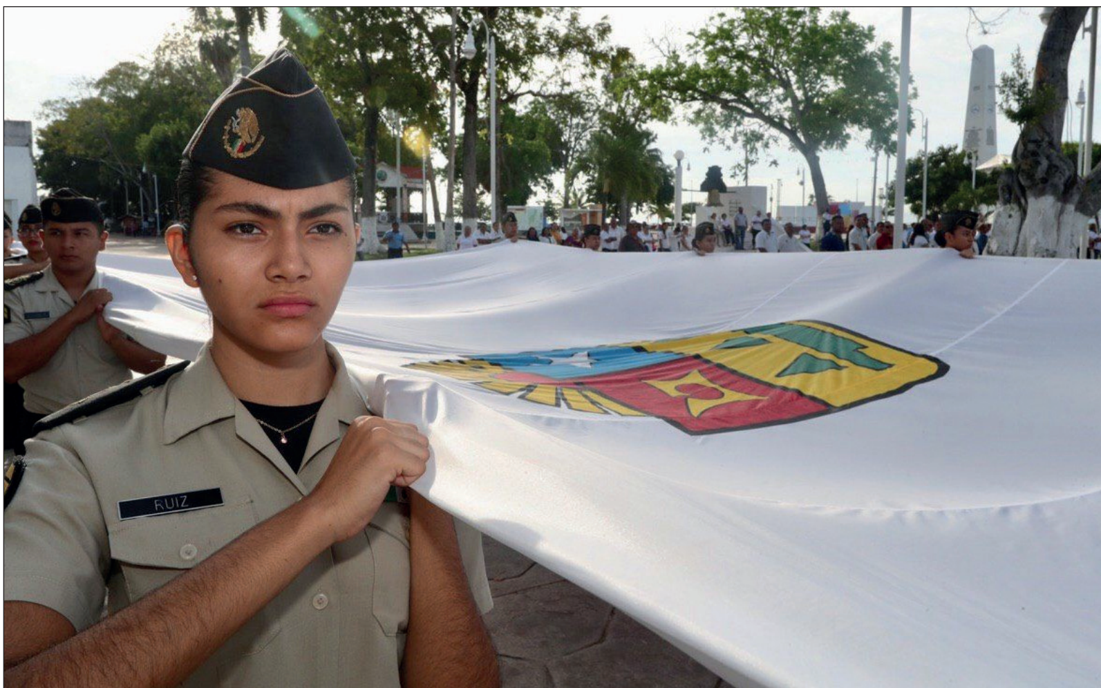
▲ Cuando el 8 de octubre de 1974 se decretó la creación de Quintana Roo como estado, la composición geográfica y poblacional era casi 180 grados diferente a la de hoy.