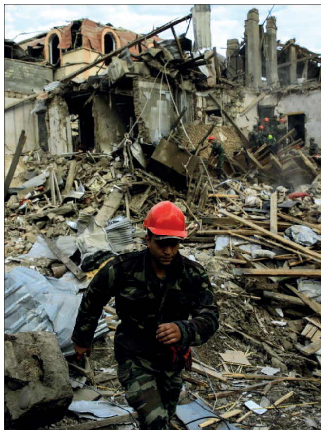
▲ Las viejas tensiones entre Azerbaiyán y la autoproclamada república de Artsaj, derivaron en un nuevo ciclo de episodios bélicos en los que han muerto ya cientos de civiles.

En Bielorrusia, en cambio, existe el riesgo de que la Unión Europea y la OTAN intenten explotar la crisis para expandirse hacia el oriente y ganar a un nuevo integrante fronterizo con Rusia. Cabe esperar que tal escenario no se concrete, pues conduciría a un nuevo y peligroso ciclo de tensiones Este-Oeste.