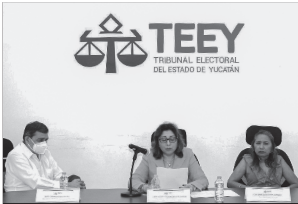
▲ En el proyecto de sentencia del magistrado Fernando Bolio Vales se planteó calificar como fundado el agravio de Morena, ya que quedó comprometido el traslado de los paquetes electorales del Consejo Municipal de Hunucmá al Consejo General del Instituto Electoral.

Por tal razón, al actualizarse un grave daño a la cadena de custodia, el cual tiene un impacto irreparable en la certeza y seguridad