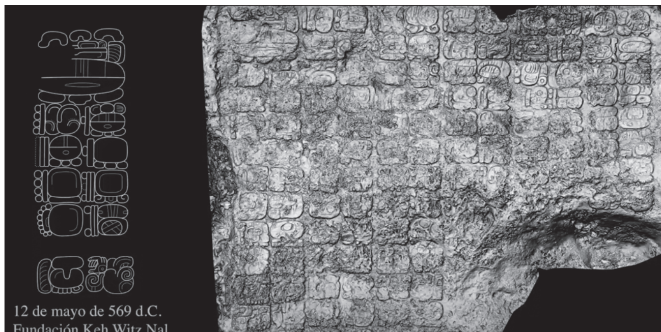
▲ A 160 metros de la pirámide Nohoch Muul, en la zona arqueológica de Cobá, durante las labores de salvamento arqueológico del proyecto Tren Maya, fue hallado un panel de 123 cartuchos jeroglíficos en una extensa inscripción en forma de L.

Esta zona tuvo al menos tres mujeres gobernantes, sobresaliendo el reinado de K'Awaiil Ajaw, que gobernó por más de cuatro décadas. Las labores del Programa de Mejoramiento de Zonas Arqueológicas (Promeza) permitieron identificar a 160 metros de la pirámide Nohoch Muul un pedraplén extraordinario con un panel de 123 cartuchos jeroglíficos en una extensa inscripción en forma de L de poco más de 11 metros cuadrados esculpados directamente sobre la roca que flanquea uno de