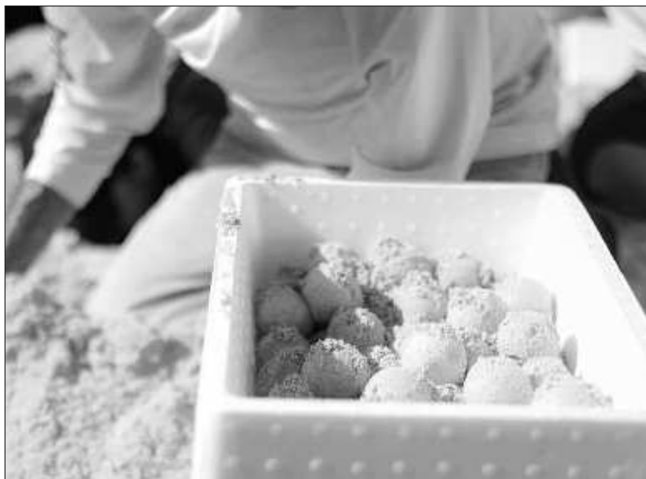
▲ La dirección de Ecología del ayuntamiento Benito Juárez cuenta actualmente con 2 mil 900 nidos protegidos, un aproximado de 480 mil huevos de tortugas.

"Necesitamos contar con la infraestructura necesaria para el tema del campamento tortuguero. Ya estamos preparándonos para el año que entra, que va a ser una época de anidación fuerte, para tener el mejor equipo y la mejor infraestructura para los corrales", concluyó la directora de Ecología.