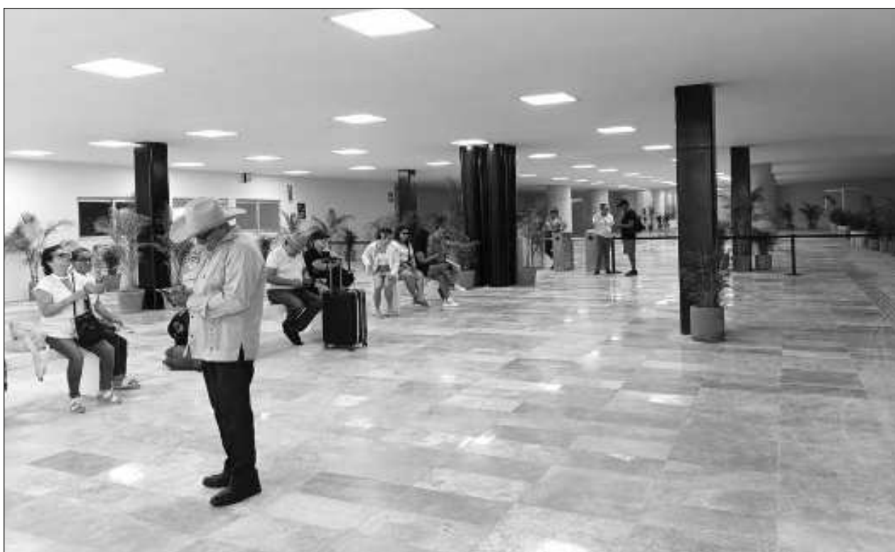
▲ La mayoría de los pasajeros que ha recorrido la ruta Cancún-Playa del Carmen desde su apertura en febrero son turistas nacionales; se espera que en septiembre quede concluido el tramo 5 Sur, que va de Playa a Tulum.

Agradeció al presidente Andrés Manuel López Obrador su gestión para concretar la regularización de la colonia Luis Donaldo Colosio de Playa del Carmen, que beneficiará a unas cuatro mil familias de ese asentamiento popular. “Durante décadas la gente vivió sin certeza jurídica sobre su patrimonio; se logra (la regularización gracias a un presidente que gobierna pensando primero en las demandas sociales de quienes menos tienen”, manifestó.