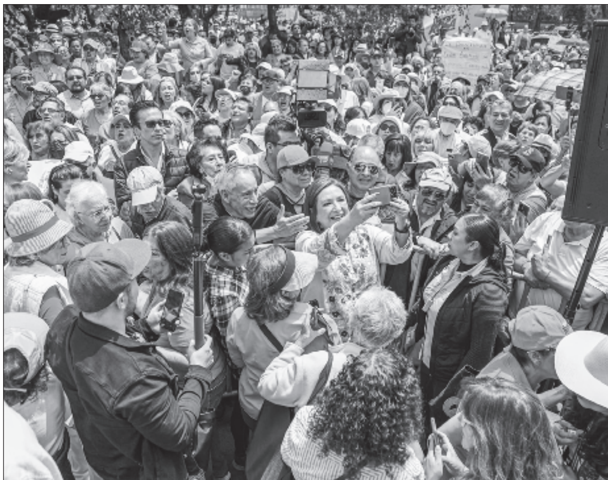
▲ “Con la encogida asistencia que tuvieron el domingo se confirmó su declinante peso político y social y, aún peor, que no prende (...) el antagonismo a lo que es denominado sobrerrepresentación ”. Foto Xóchitl Gálvez

LA PRESUNTA MAREA Rosa terminó convalidando a su contrario, el cuatroteísmo, pues con la encogida asistencia que tuvieron el domingo se confirmó su declinante peso político y social y, aún peor, que no prende, al menos en este ámbito cromático, el antagonismo a lo que es denominado sobrerrepresentación en la integración de las próximas cámaras legislativas.