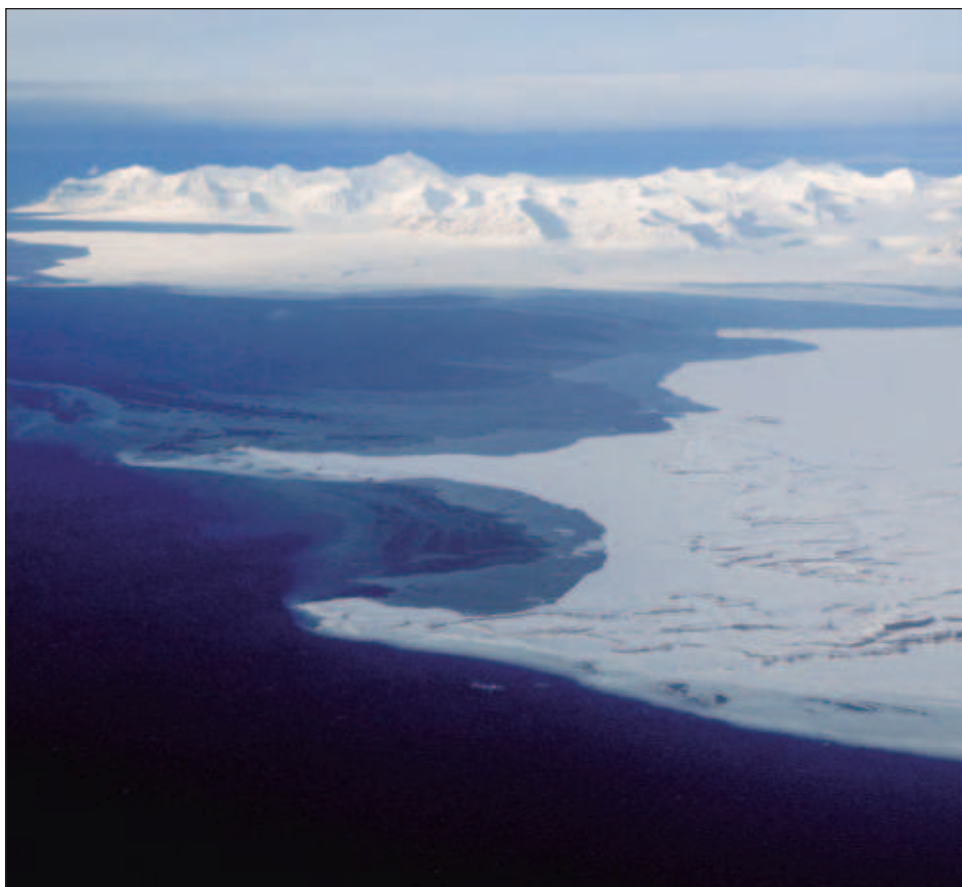
▲ La materia orgánica erosionada es metabolizada por bacterias que liberan CO2, aumentando la acidez de las aguas superficiales, de modo que disminuye la capacidad de absorción del océano Ártico.

Los investigadores advierten de que hasta ahora ningún estudio sobre la capacidad de absorción de CO2 del Ártico ha tenido en cuenta lo que se pierde debido a la erosión costera por el deshielo del permafrost.