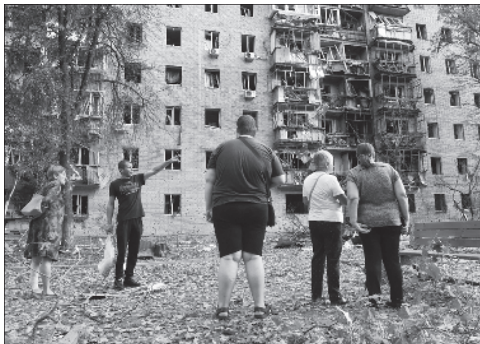
▲ El ejército ucraniano pretende "sembrar la discordia en nuestra sociedad", afirmó Putin, y acusó a Kiev de "cumplir la voluntad" de las potencias occidentales.

Este es el ataque más importante de un ejército extranjero en territorio ruso desde la Segunda Guerra Mundial.