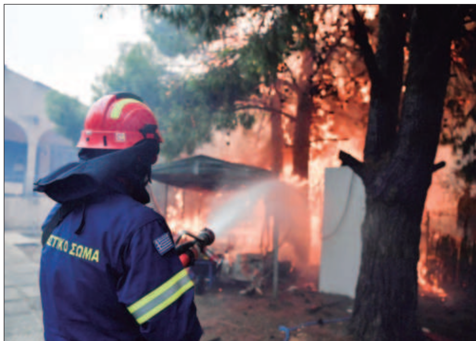
▲ Francia enviará un helicóptero, Italia aportará dos aviones de descarga de agua, y la República Checa asignará 75 bomberos y 25 vehículos, de acuerdo con autoridades

Las autoridades dijeron que 15 personas resultaron heridas, en su mayoría por