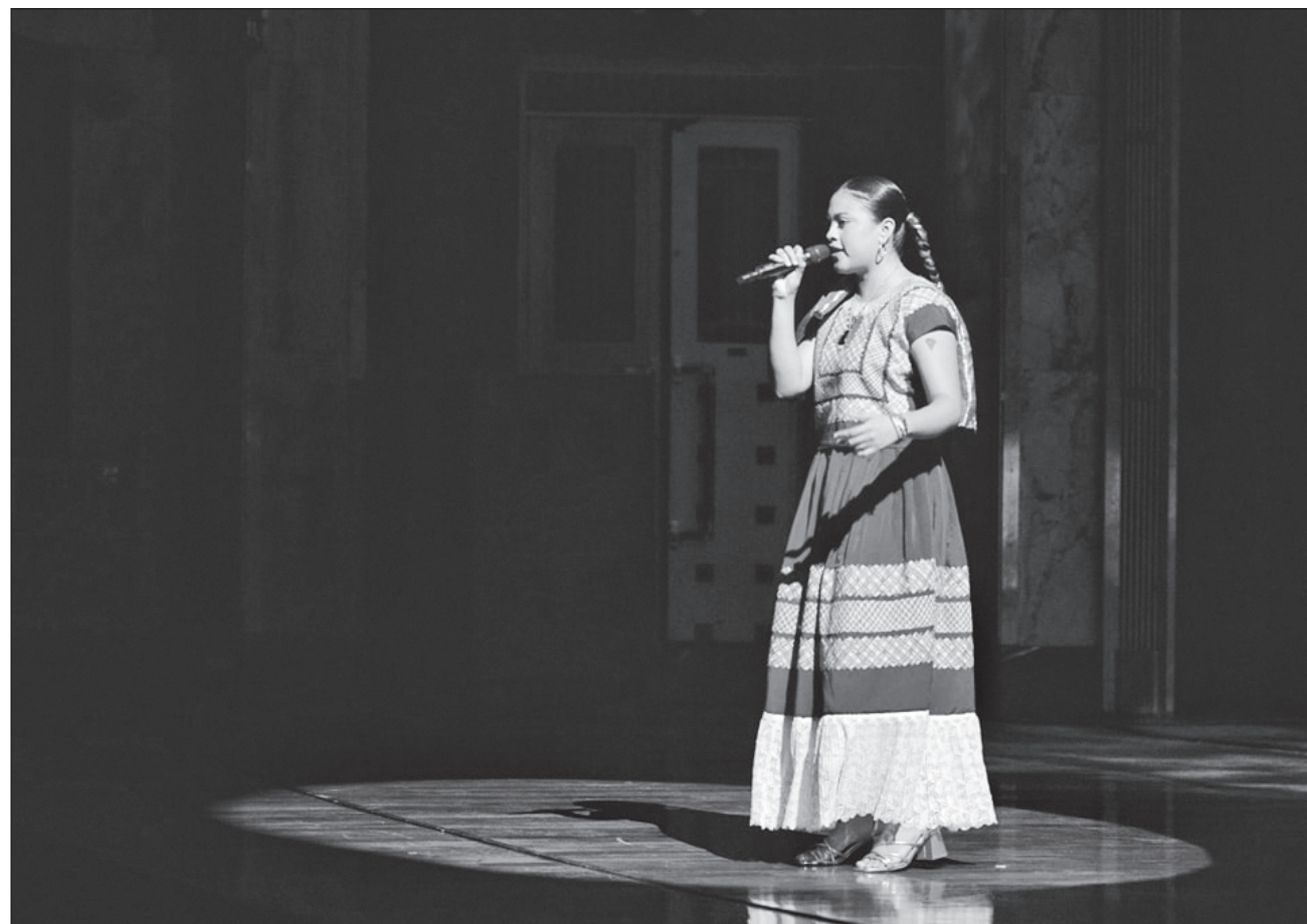
▲ El programa de Niman axkan consistió en 12 temas en los que la música tradicional convivió, y por momentos se maridó, con nuevas expresiones que tienen lugar en las comunidades originarias a lo largo del territorio mexicano.

Fue un programa de 12 temas en los que la música tradicional convivió, y por momentos se maridó, con nuevas expresiones que tienen lugar en las comunidades originarias, y a través de los cuales lenguas como