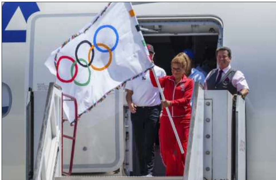
▲ La alcaldesa Karen Bass, con la bandera Olímpica, en su regreso a Los Ángeles.

¿Cómo conseguirá Los Ángeles competir con las imágenes de tarjeta postal