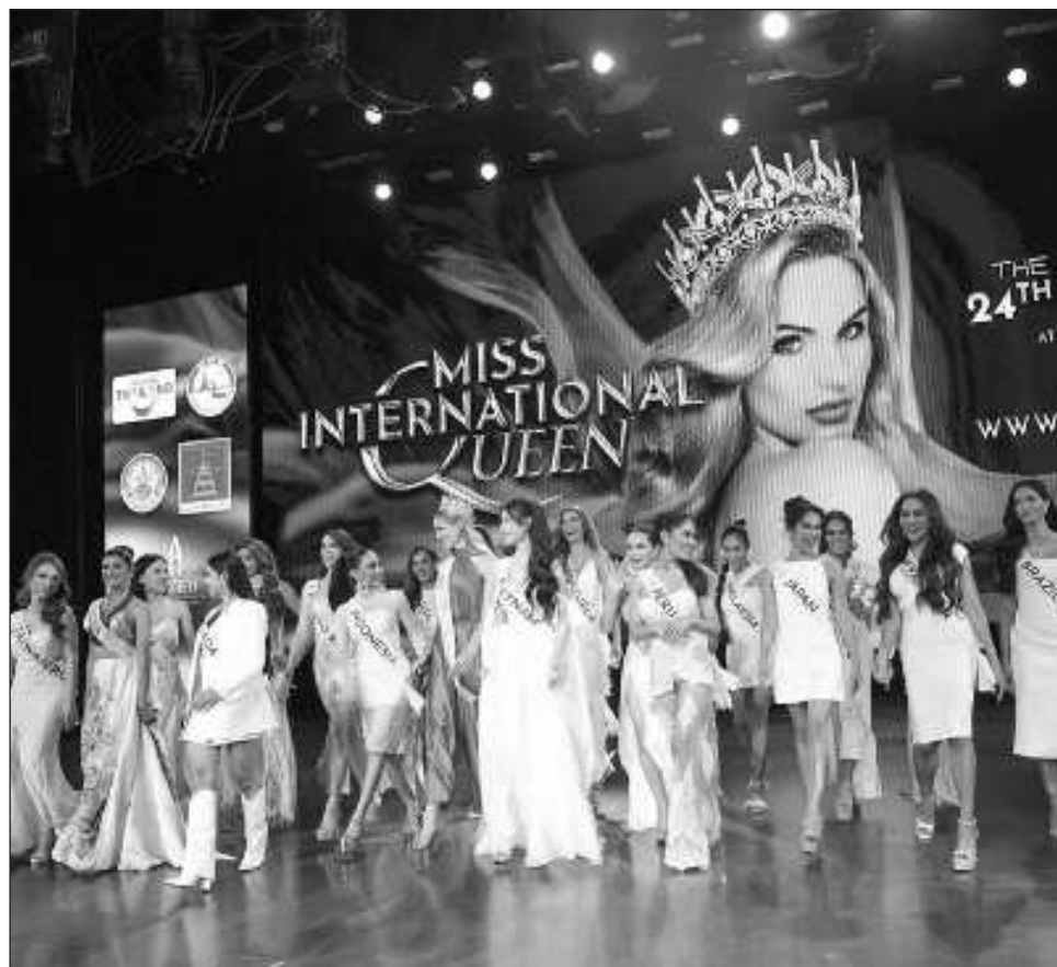
▲ La vencedora será remunerada con 11 mil 700 euros.

Bajo el título La Fuerza de la Transformación , las misses de varios lugares del mundo (entre ellas aspirantes de Bolivia, Brasil, Colombia, Ecuador, El Salvador, México, Perú, Puerto Rico y Venezuela, así como de varios países asiáticos y de Estados Unidos y Canadá) competi-