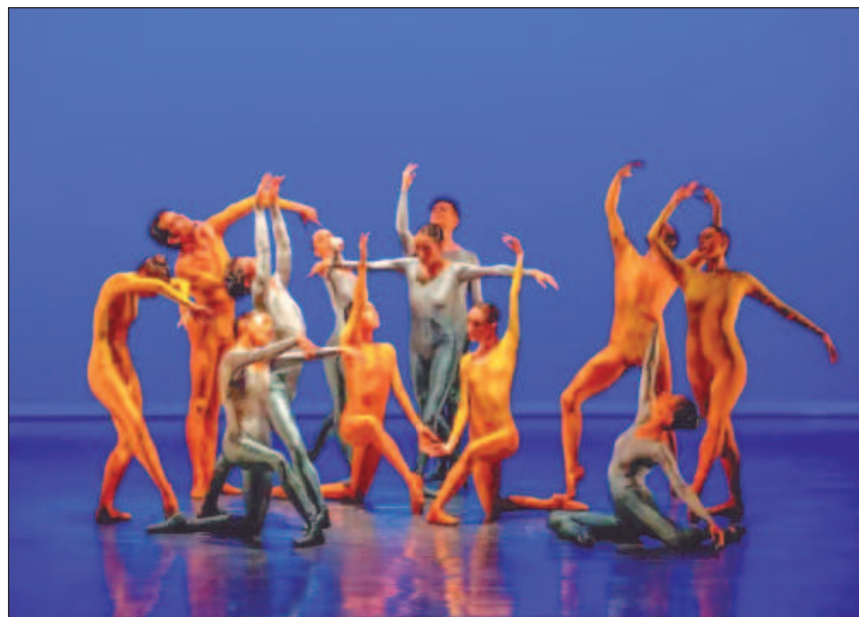
▲ “Queremos construir puentes y estar en diálogo con todos los tipos de baile”, dijo la directora de esa disciplina en la UNAM al dar a conocer el programa de actividades.

Con relación al programa presentado en el Salón de Danza, señaló que se contará con la participación de dos agrupaciones internacionales: la Compañía Cuerpo de Indias (Colombia) de Álvaro Restrepo y Luz