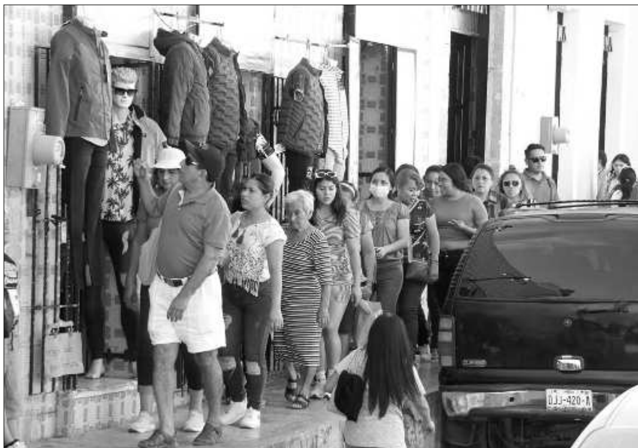
▲ El repunte de la inflación durante los primeros siete meses del año, principalmente por productos agrícolas, energéticos y servicios, como fondas, taquerías o turísticos han moderado el sentimiento de los consumidores.

Agregó que en el sexenio del presidente Andrés Manuel López Obrador, la empresa adquirió 18 nuevos equipos de perforación y modernizó 15 equipos existentes, además adoptó prácticas de producción temprana en pozos marinos y terrestres.