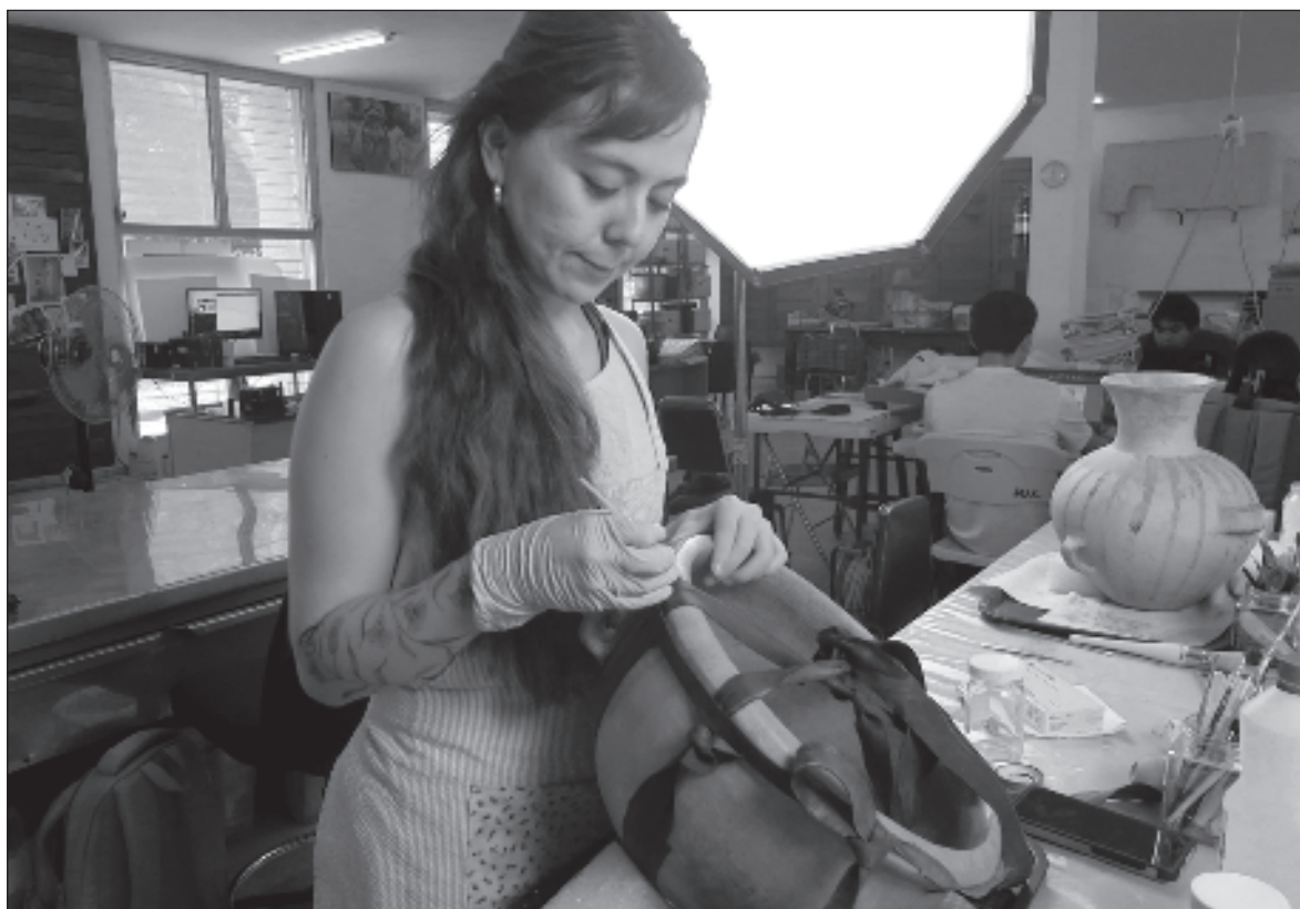
▲ “Durante la puesta en escena del trabajo de restauración, los especialistas utilizan una variedad de herramientas y equipos para tratar las piezas”.

PERO SE PREGUNTARÁN, ¿Qué es un restaurador de arte y por qué se dedican a limpiar vasijas? Conocer a qué se dedica un restaurador de arte es acercarse a entender su esencia y verdadera valía. Estos profesionales se dedican a preservar el patrimonio cultural y artístico del país, actuando como “médicos” de las obras de arte. Frente a un objeto para restaurar, los restauradores levantan un expediente clínico con los síntomas de deterioro a lo largo del tiempo, lo cual lleva al diagnóstico de la pieza determinando las causas del daño y el tratamiento necesario. Los restauradores también documentan cada etapa de su labor, tomando fotografías y elaborando informes detallados, lo cual es fundamental para futuras investigaciones y para asegurar la duración de cada intervención realizada. Además, supervisan las condiciones en que se mantienen las piezas, considerando factores como la luz, la temperatura y la humedad, para prevenir futuros daños y asegurar la conservación a largo plazo de estos objetos históricos.