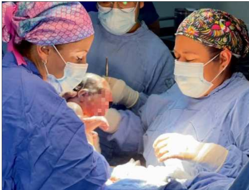
▲ El instituto recalca que las cesáreas pueden provocar riesgos en futuros embarazos.

"La interrupción del embarazo vía abdominal (...) genera a la larga en la vida reproductiva de la mujer más riesgos, entonces cuando a una paciente de primer embarazo se le indica una cesárea que no era necesaria se le condena a una cicatriz en la matriz que puede gene-