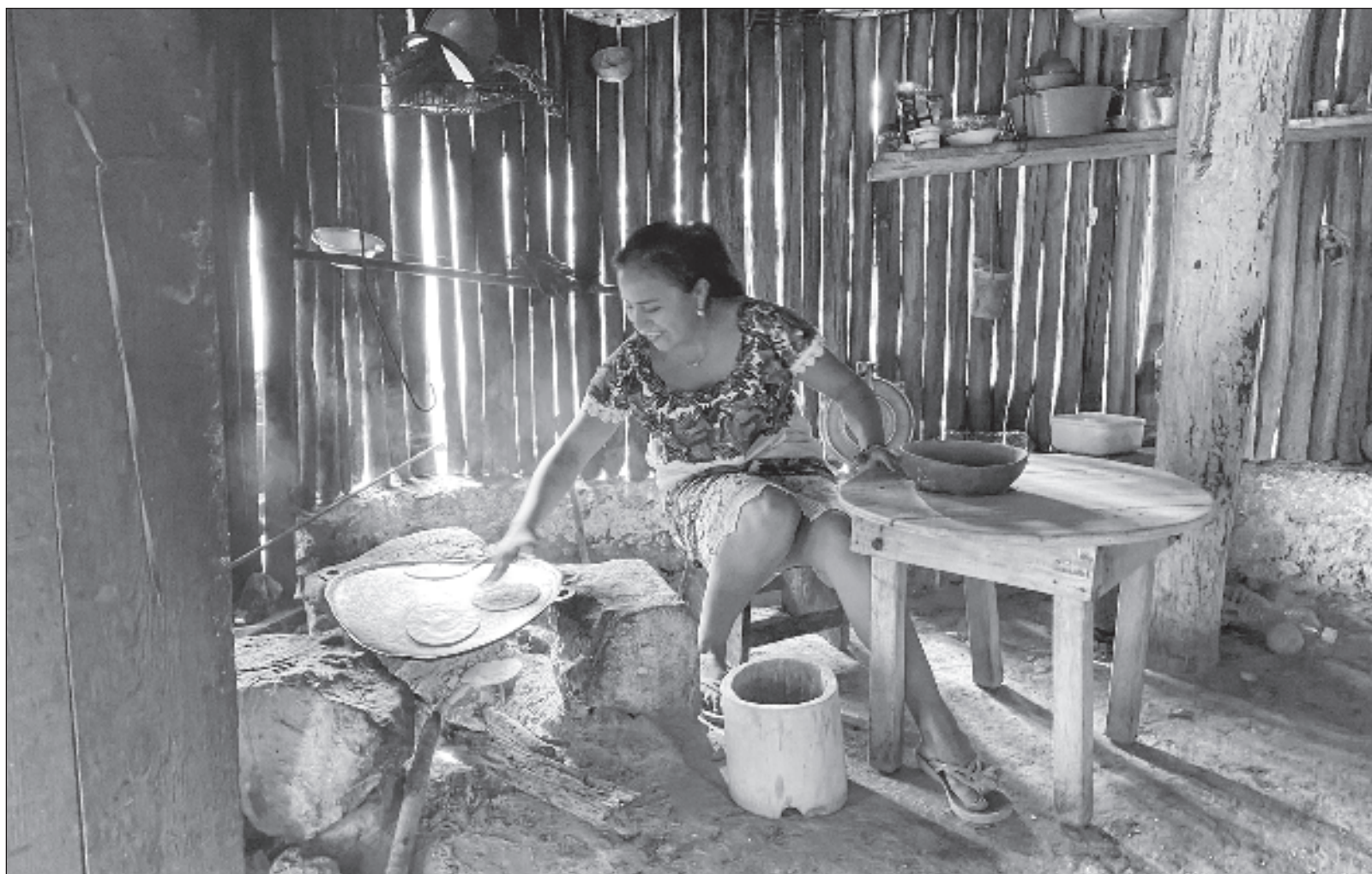
▲ "El censo reciente de Inegi señala que 23.2 millones de personas en México se identifican como indígenas, lo cual es casi el 20 por ciento de la población total, en la que se reconocen 68 etnias, como se decía anteriormente; hoy se conocen como pueblos. Quintana Roo ocupa el cuarto lugar".