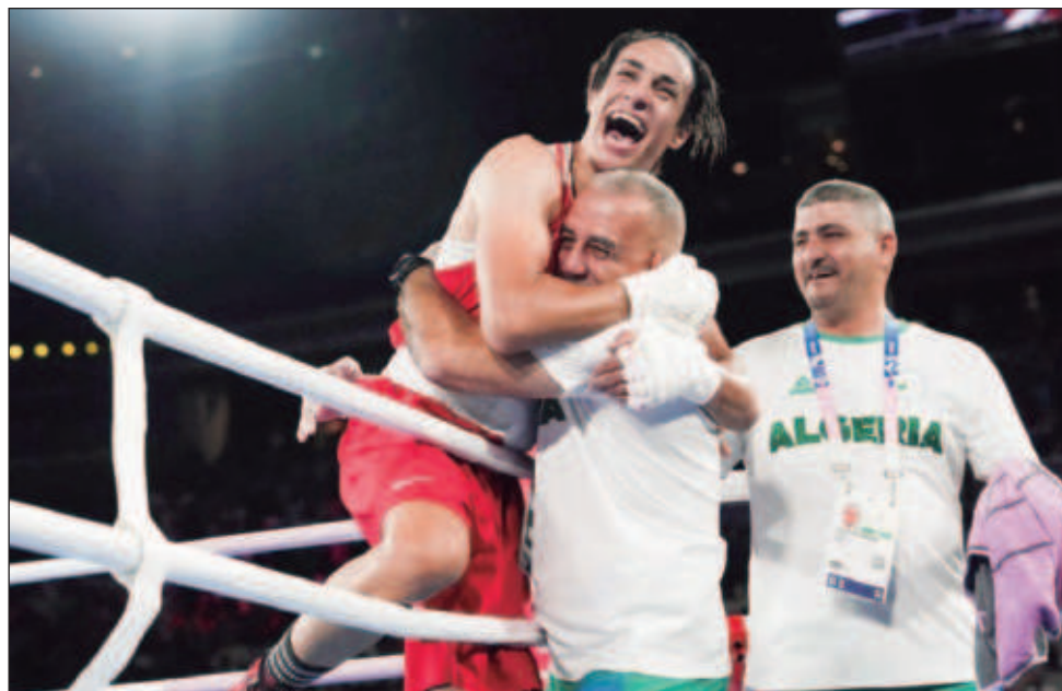
▲ Imane Khelif, boxeadora de Argelia, celebra tras vencer a la china Yang Liu en la pelea por el oro.

Marchand fue el atleta con más preseas doradas y