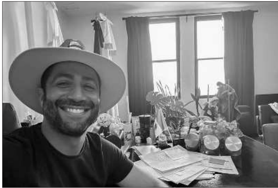
▲ De acuerdo a la Ley, el servidor público se expone al desafuero para enfrentar la justicia; "no se debe pensar que es solamente una falta administrativa", consideró Suárez Améndola, especialista en derecho electoral.

De acuerdo a la Ley, el servidor público se expone