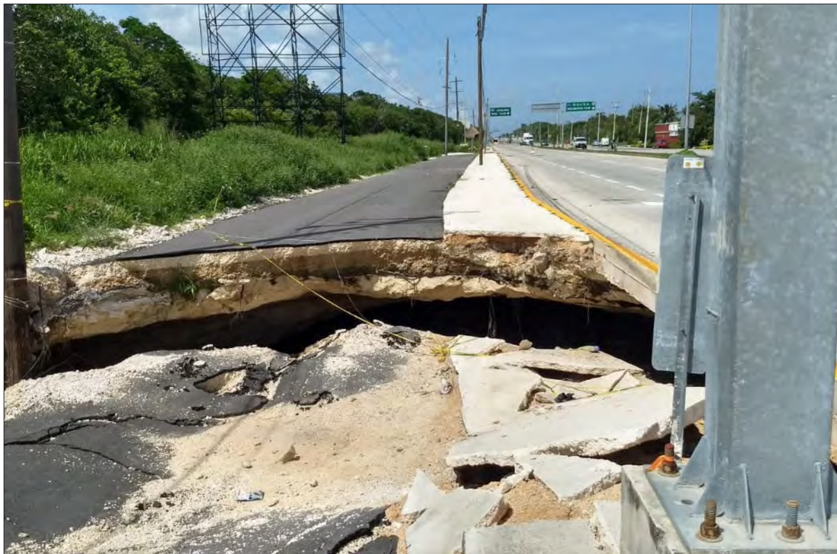
▲ Aún continúa el desvío carretero de aproximadamente 200 metros.

antes de la entrada del personal de la SCT. Mencionaron que “la principal recomendación es que no se tape este lugar como ha sido costumbre en muchas ocasiones en esta región, si se llega a tapar una cueva como esta es un ecocidio, porque se está aniquilando un ecosistema frágil y único; además, ésta es una vía natural del agua hacia el mar que lleva cientos de miles de años y probablemente millones de años y si tapamos este lugar el agua va a seguir fluyendo por el sitio, entonces eventualmente vamos a tener de nuevo estos problemas”.