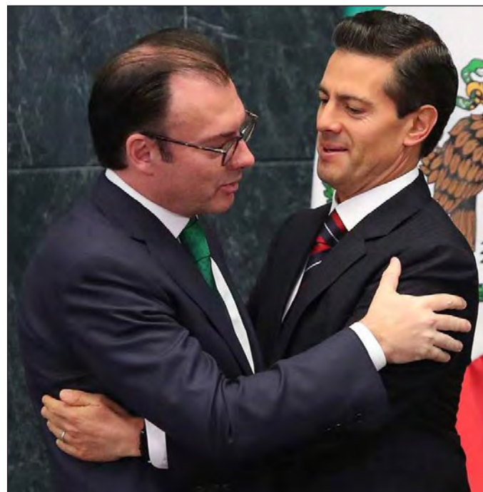
▲ Emilio L. denunció a Enrique Peña Nieto y Luis Videgaray por ordenarle recibir una serie de sobornos y repartir el dinero de esas operaciones.

De prosperar las investigaciones en curso, el mexiquense se convertiría en el segundo presidente de la historia moderna de México (después de Luis Echeverría Álvarez) en ser sometido a un proceso legal, lo cual marcaría un doble hito al