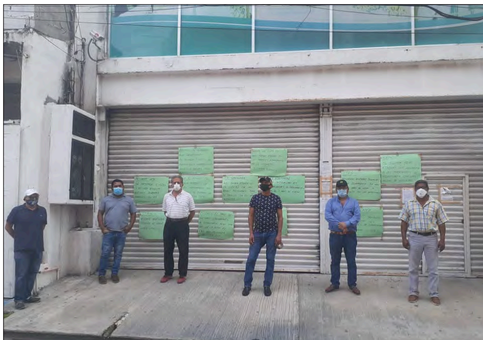
▲ Los ex trabajadores de Oceanografía cumplieron cinco días protestando a las puertas de la Junta Especial de la Local de Conciliación y Arbitraje de Carmen.