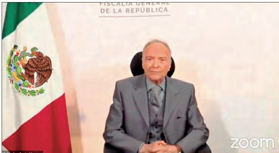
▲ El fiscal, Alejandro Gertz Manero, dijo que el tratamiento que el ex director de Pemex es diferente al que recibe la ex jefa del gobierno capitalino, Rosario Robles Berlanga, porque él ofreció cooperar.

Al responder a una pregunta directa, Gertz Manero dijo que el tratamiento que el ex director de Pemex, quien goza de libertad condicional, es diferente al que recibe la ex jefa del gobierno capitalino, Rosario Robles Berlanga, porque él ofreció cooperar, reparar el daño y denunciar a quienes or-