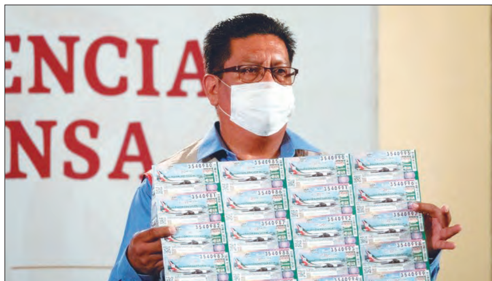
▲ Durante la conferencia matutina del Ejecutivo Federal se realizó una muestra de boletos para la rifa del avión presidencial.