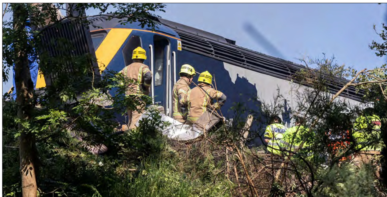
▲ Al menos tres muertos, entre ellos el maquinista, y seis heridos provocó el descarrilamiento el miércoles de un tren en el noreste de Escocia, informó en un comunicado la policía británica de transportes.

"Pese a los esfuerzos del personal sanitario, tres personas fueron declaradas muertas en el lugar", entre ellas el maquinista, señaló la institución y precisó que los heridos "felizmente, no revisten gravedad".