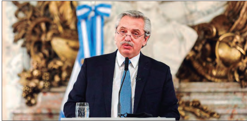
▲ Alberto Fernández, presidente de Argentina, dijo que la vacuna estará lista el primer semestre de 2021.

privado con la Universidad de Oxford que contó con el apoyo financiero de la Fundación Slim y lo convirtieron en un proyecto sin fines de lucro. Hay que celebrar la conducta de la empresa y de la universidad. No están buscando beneficios económicos con la vacuna y la