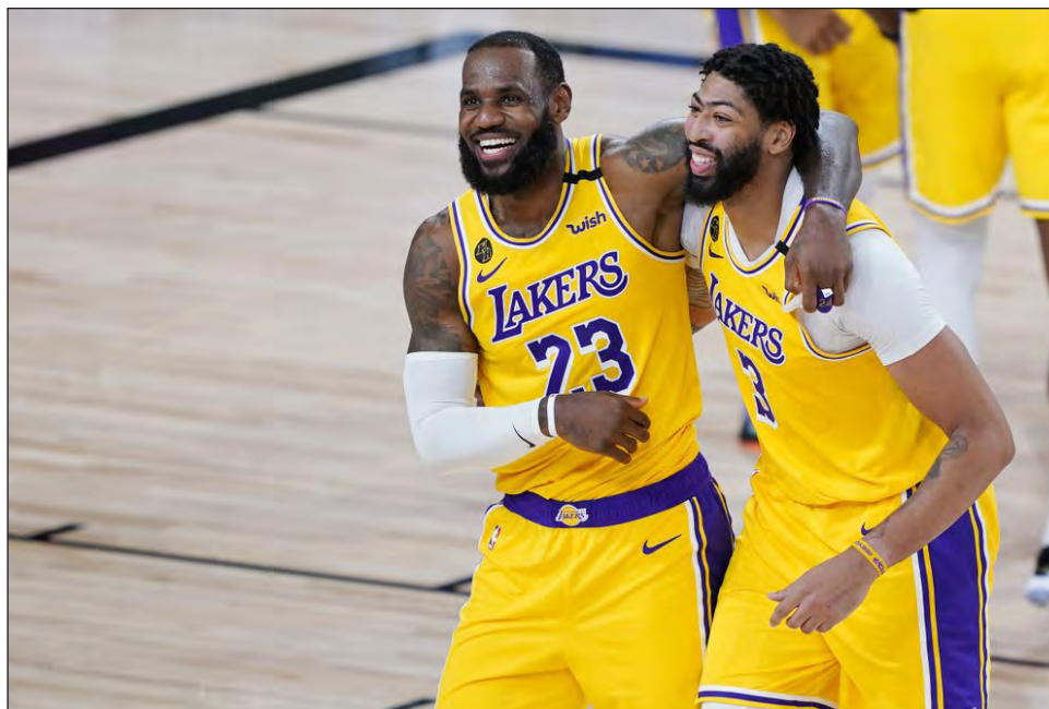
▲ LeBron James (23) y Anthony Davis, de los Lakers, celebran un triunfo frente a Denver, en Lake Buena Vista.

A quienes no se les permitirá entrar a la burbuja: "preparadores físicos, masajistas, chefs personales, pe-