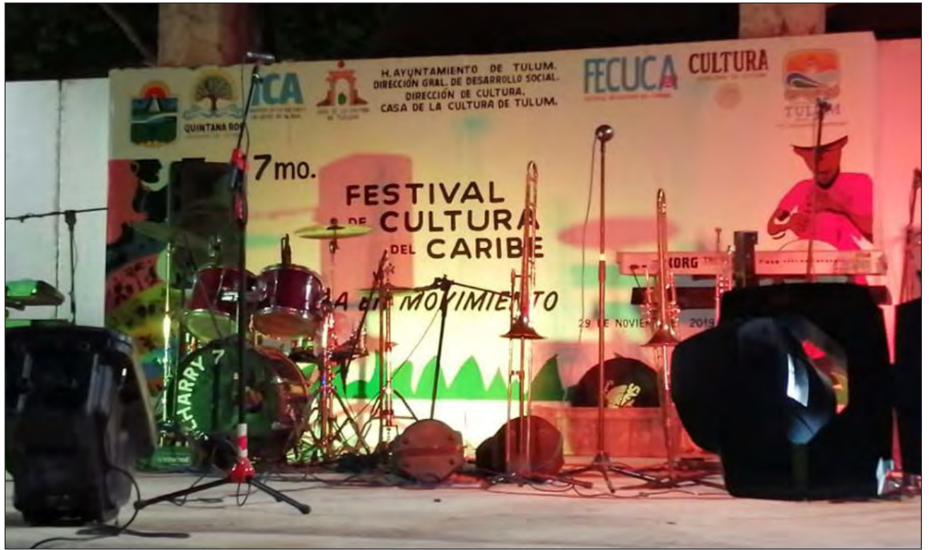
▲ Ante la cancelación del evento, los estados del sur-sureste organizan un festival regional en línea que incluya la participación de artistas locales.

El año pasado, el festival sólo contó con un presupuesto asignado por la federación de 998 mil pesos, pese a que el proyecto presentado fue de 19.5 millones.