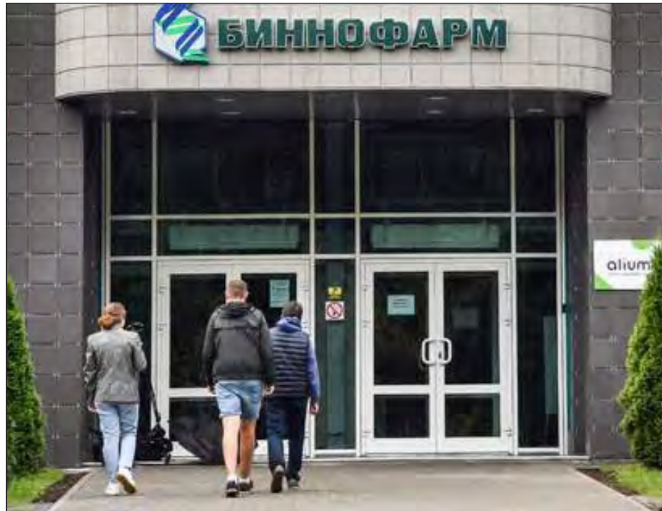
▲ El Instituto Gamaleya desarrolla el fármaco. En la imagen, vista de la farmacéutica Binnofarm, donde Rusia ya está produciendo su vacuna.

"Parece que nuestros colegas extranjeros están percibiendo las ventajas com-