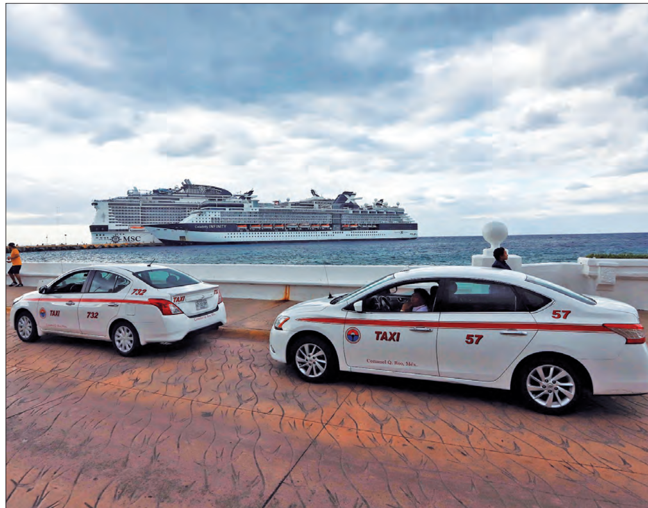
▲ En 2018, llegaron a Cozumel cuatro millones de visitantes y más de 1.5 millones de tripulantes vía crucero.

Pedro Joaquín destacó que en conjunto con Concanaco impulsarán el tu-