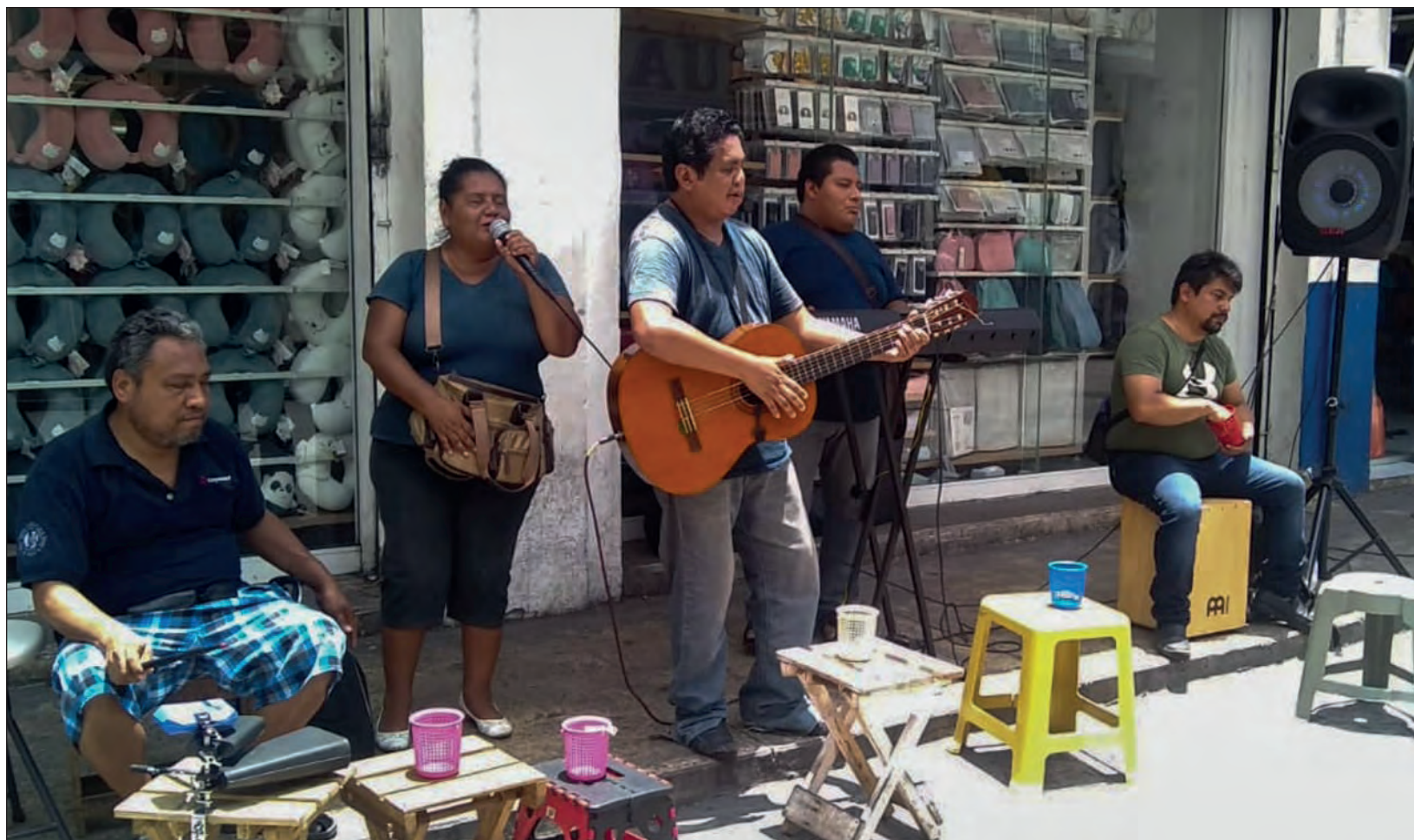
▲ Pese a sus limitaciones, el conjunto Brea logró posicionarse en el gusto de los transeúntes del Centro Histórico meridano.