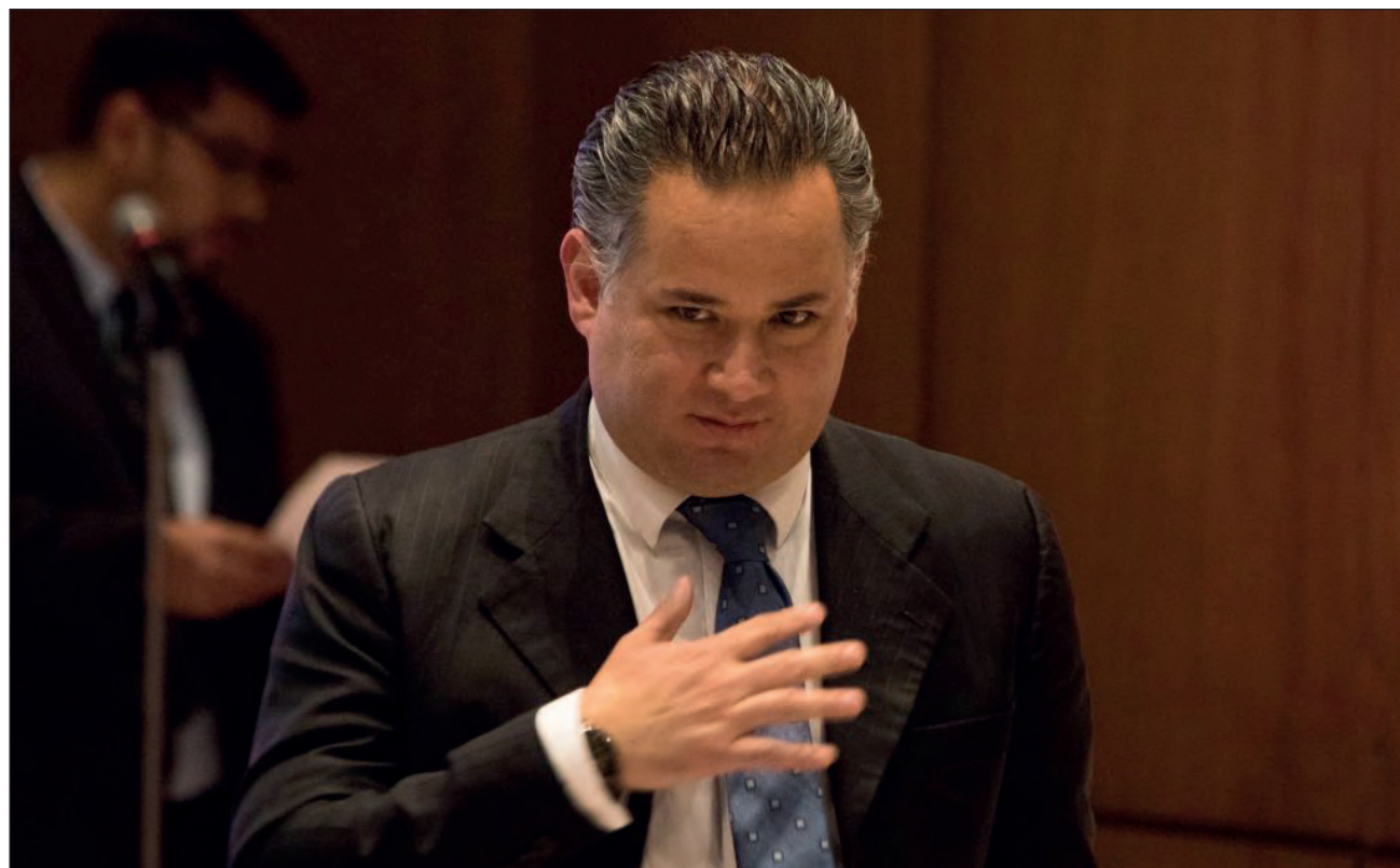
▲ La UIF, encabezada por Santiago Nieto refrenda su compromiso de llevar a cabo acciones que inhiban el uso del sistema financiero mexicano para utilizar recursos de procedencia ilícita.