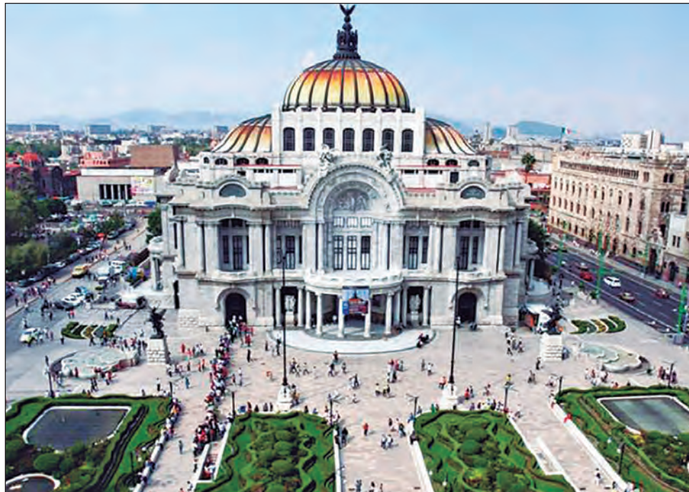
▲ En el Palacio de Bellas Artes está casi terminado el montaje de la exposición Modigliani .

Sin embargo, trabajadores del Instituto Nacional de Bellas Artes y Literatura (Inbal) aseguraron que no se ha montado nada en el museo de ese recinto porque, por disposiciones sanitarias, "la base trabajadora está en su casa y eso incluye a estibadores y pintores; además, no podemos ejercer un presupuesto ante el recorte. ¿O están pagando el montaje por fuera?"