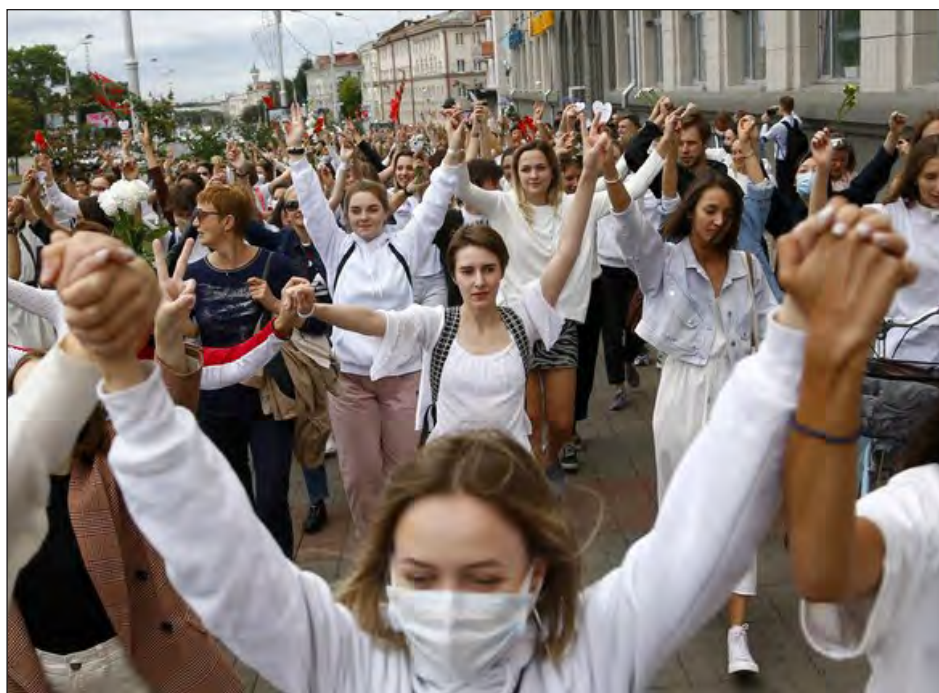
▲ Los manifestantes en Bielorrusia denuncian una fraudulenta reelección el domingo del autoritario presidente Alexandre Lukashenko, en el poder desde hace 26 años.

La policía bielorrusa dijo haber sido atacada el martes