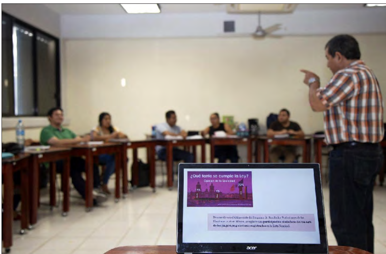
▲ Del 10 de agosto y hasta el 24 de septiembre estará abierto el periodo de inscripción para el posgrado.