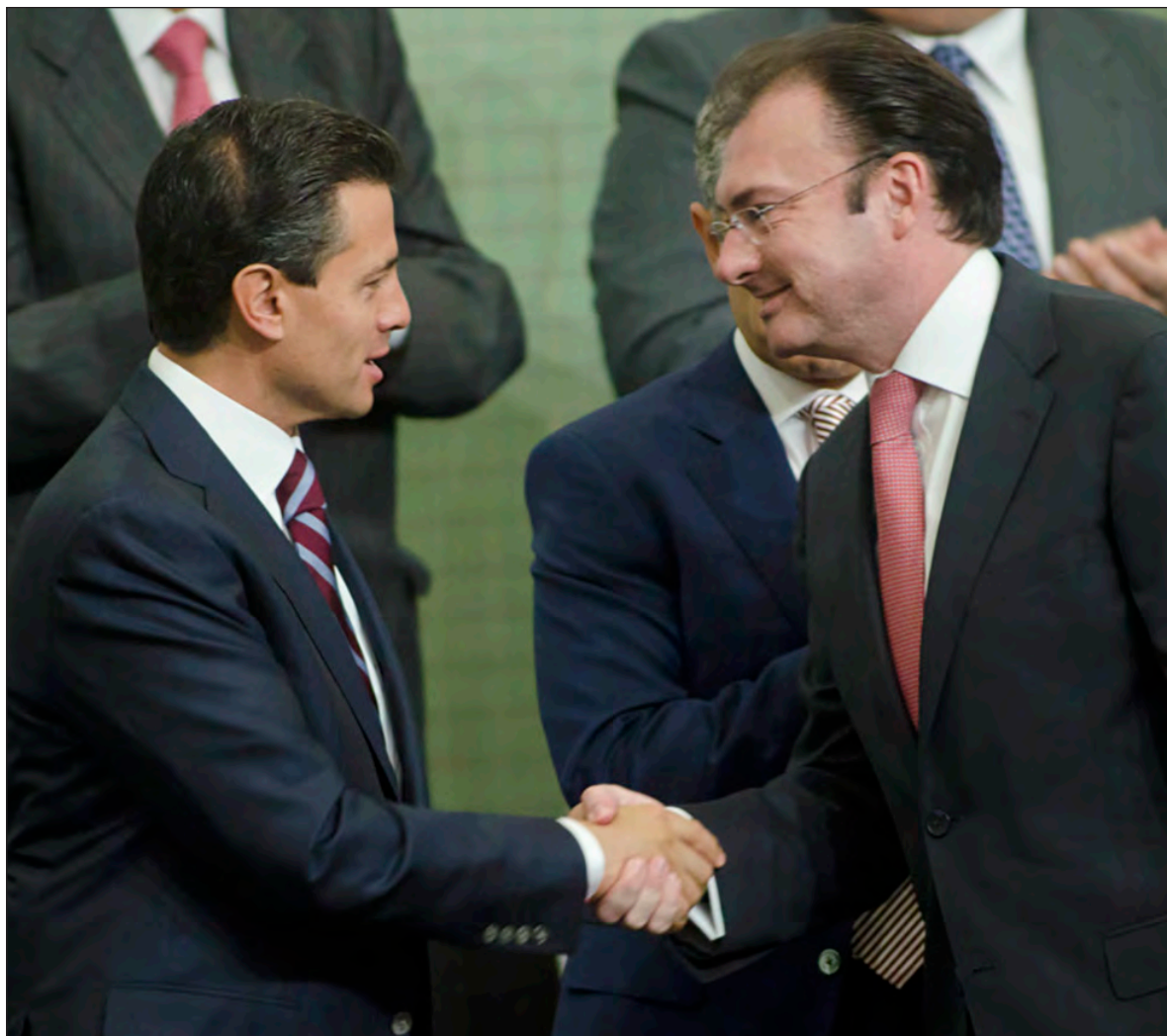
▲ La compra-venta de la voluntad y el voto de legisladores para aprobar las reformas estructurales de Peña Nieto muestra la sumisión contumaz del legislativo.

AHORA NO SÓLO los juzgarán los tribunales. También los juzgará la historia a través de una sociedad interconectada y con mayor acceso a la información.