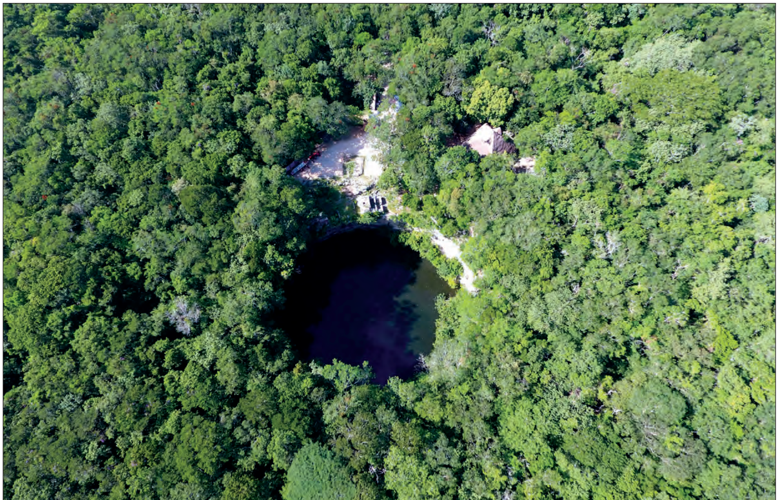
▲ Algunos cenotes fueron depósito ritual de ofrendas, como el que se encuentra en la ciudad maya de Chichén Itzá, del cual tomaría el nombre "en la boca del pozo de los brujos del agua".