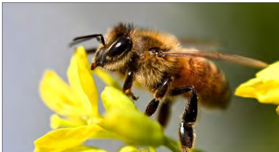
▲ Cerca del 75 por ciento de las especies de cultivos dependen en cierta medida de los animales para su producción, en particular de insectos.

Se estima que 75 por ciento de las especies de cultivos de-