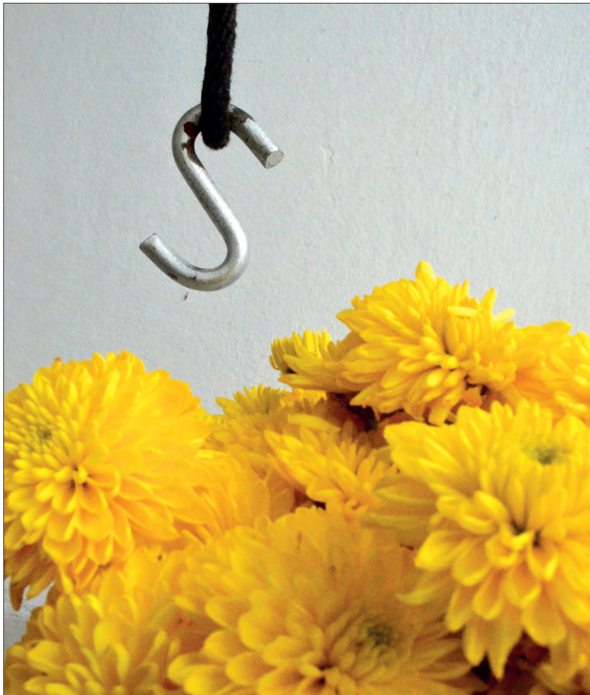
▲ Estos días aciagos del COVID-19 se habla de decenas de seres humanos, niños y adultos, que se suicidaron por el peso del sufrimiento que cargaban: ansiedad, depresión, pobreza y desempleo.

Quisiera como tantas otras veces poder viajar al pasado y curar ese dolor acallado arrastrado por años, mirarlo como miro ahora en los caminos rostros humanos buscando consuelo y encontrar esa fórmula perdida para evitar la desventura admitida que conduce al abismo, ¿cómo se cura el dolor de una ausencia tan presente?, si ni el viento a podido llevarse la memoria como acarrea las hojas caídas de los árboles en los atardeceres de la vida, ¿cómo devolverle a la noche el insomnio alentado por tantas voces que retornan al amanecer?, pareciera que la rueda de la vida dejó de girar para detenerse justo ahí donde se anida la pesadumbre de los días convertidos en años.