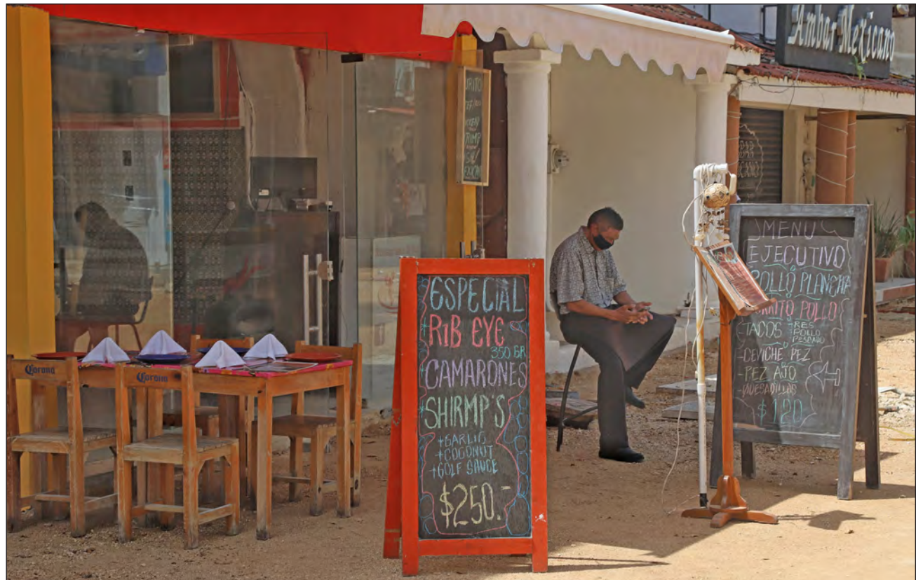
▲ Hasta el día de hoy, seis mil 802 empresas se han registrado para la certificación de higiene de la Sedetur.

Destacó que en el Aeropuerto Internacional de Cancún se llevan a cabo diversas medidas de mitigación para el COVID-19, como la limpieza de las áreas públicas, las terminales, los medios de transporte, las áreas comerciales y la indumentaria utilizada por pasa-