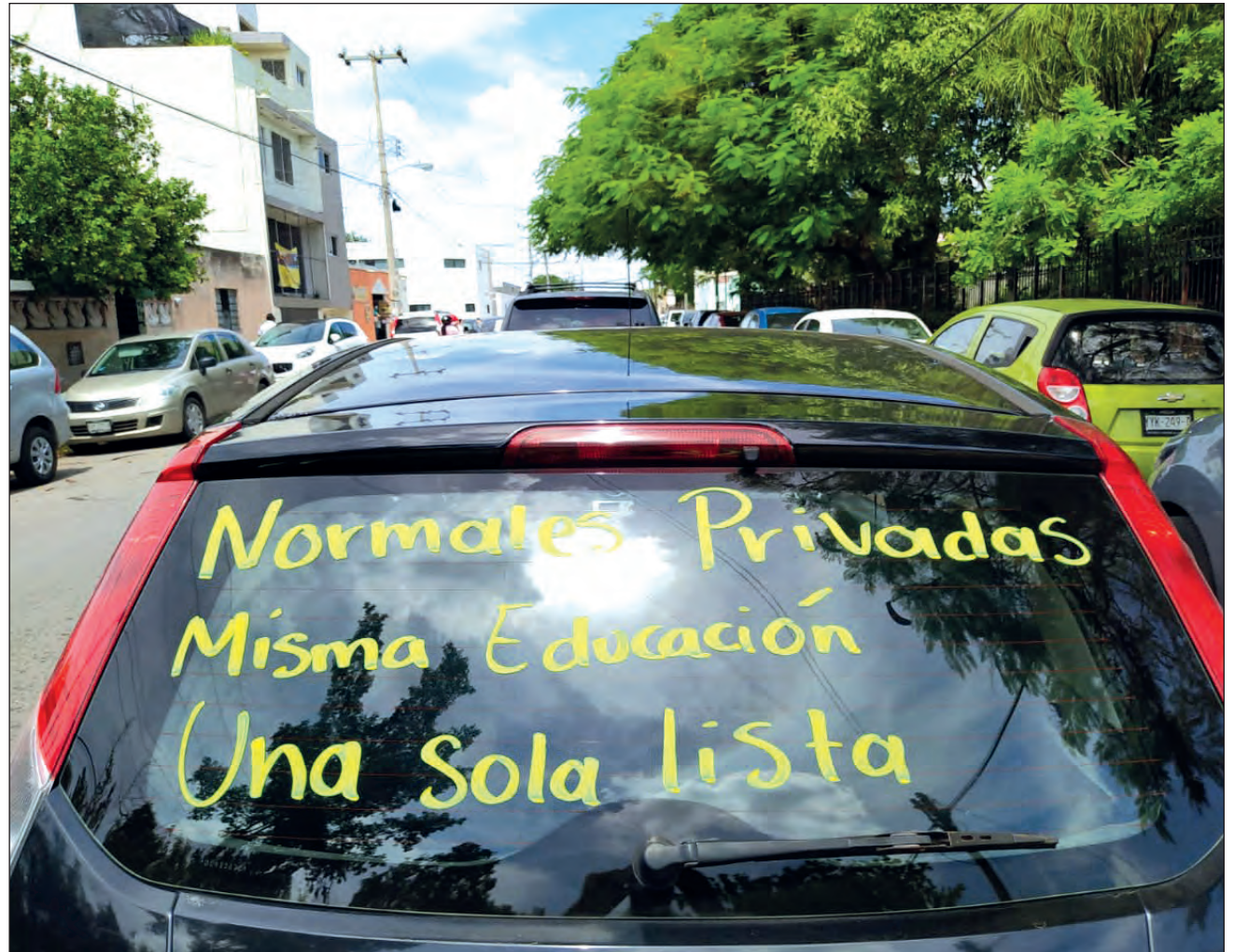
▲ Todos tenemos calificaciones aprobatorias y hemos peleado por nuestro lugar, reclaman los aspirantes a conseguir una plaza docente.

“Esperamos que se escuche la voz del magisterio y que deje de existir esta