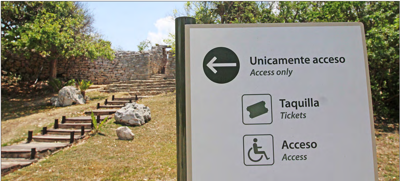
▲ Hasta febrero de este año, los sitios arqueológicos de Quintana Roo reportaron la visita de 255 mil 475 personas, 71% de ellas extranjeras.