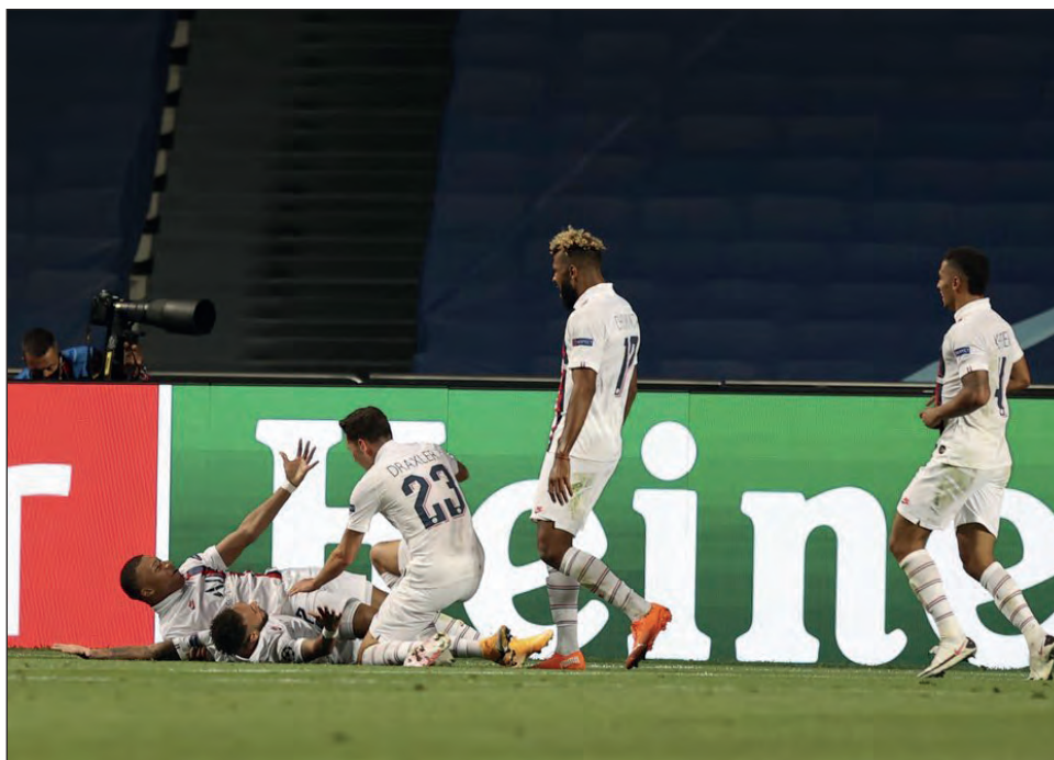
▲ Jugadores del PSG festejan el tanto de la victoria sobre el Atalanta, ayer en Lisboa.

No hubo público en el estadio, lo que no impidió que muchos seguidores del Ata-