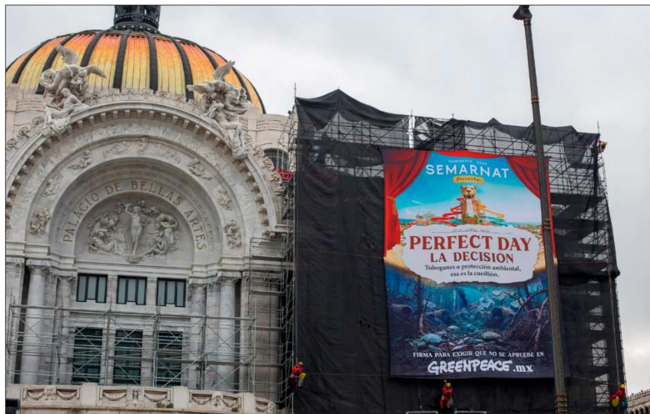
▲ La agrupación exigió que la institución federal haga efectivo el principio precautorio, rechace el mega proyecto de Royal Caribbean y trabaje en orientar iniciativas que prioricen la restauración y protección de la Selva Maya.

Poco antes de las 6 horas, seis activistas pertenecientes a la organización ambien-