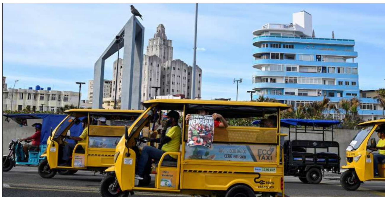
▲ “¡Cuba está pidiendo ayuda, y vamos a hablar!”, declaró Trump, aceptando por primera vez comunicación directa.

El líder republicano en el Senado, John Thune, declaró ayer lunes que ese conflicto con Irán debe ser la prioridad máxima. “Creo que en estos momentos estamos concentrados (...) en reabrir el estrecho de Ormuz”, declaró a periodistas que le preguntaron