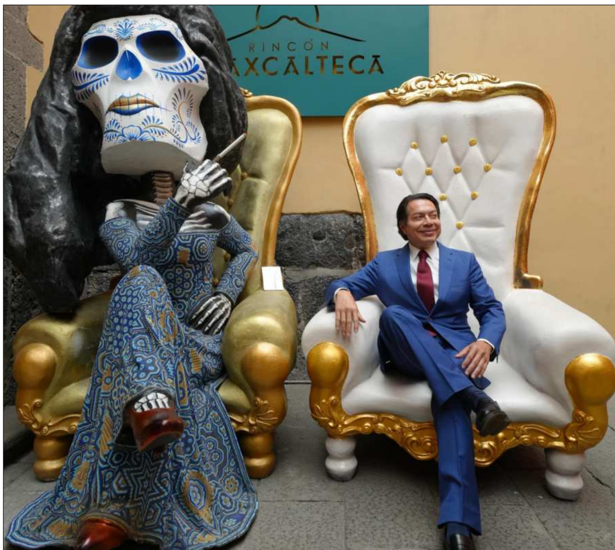
▲ El titular de la Secretaría de Educación Pública, Mario Delgado, quien reculó ayer del anuncio hecho el jueves de recortar el calendario escolar, es mencionado como posible aspirante a la candidatura de Morena al gobierno de Colima.