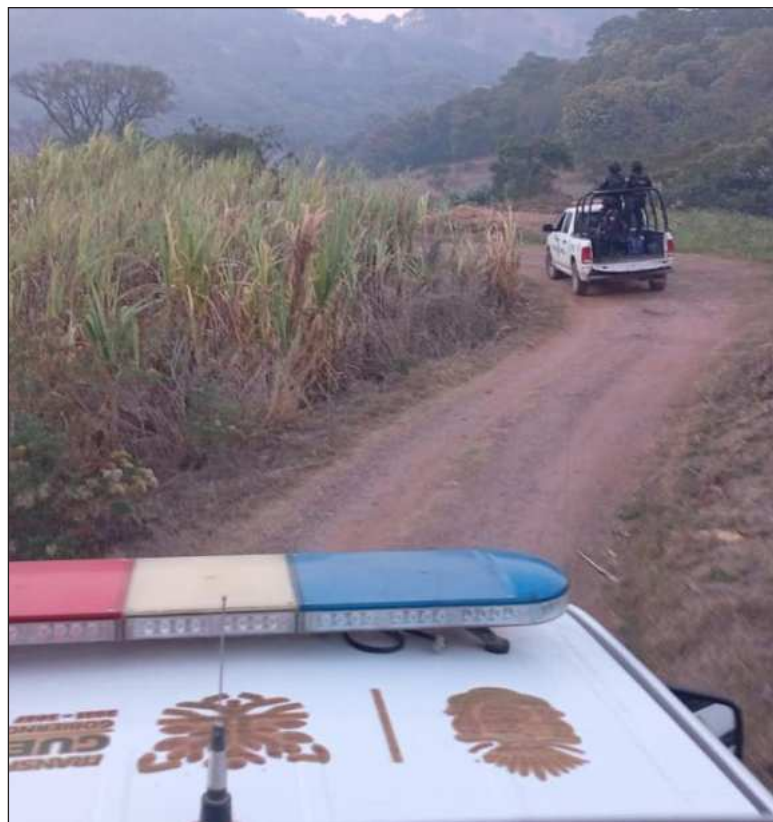
▲ “Los Ardillos tienen el control del Chilapa; antes lo dominaban Los Rojos. Fueron parte del cártel de los Beltrán Leyva”.