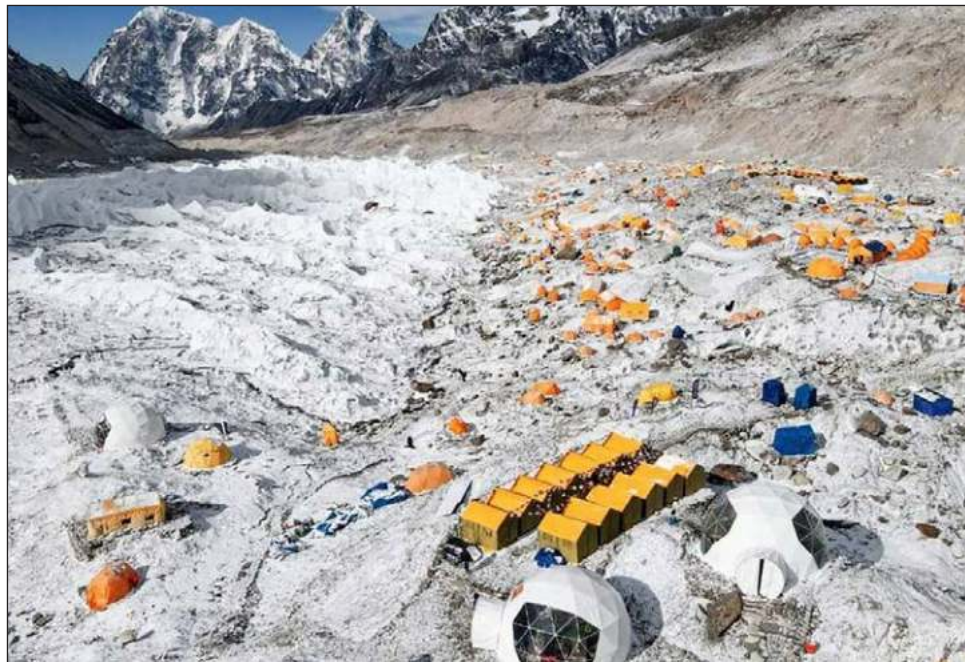
▲ Actualmente Nepal otorga permisos a todos los que solicitan y están dispuestos a pagar 11 mil dólares para escalar el Everest, el pico más alto del mundo a 8 mil 849 metros sobre el nivel del mar.

El resumen del veredicto precisa que la capacidad de las montañas "debe ser res-