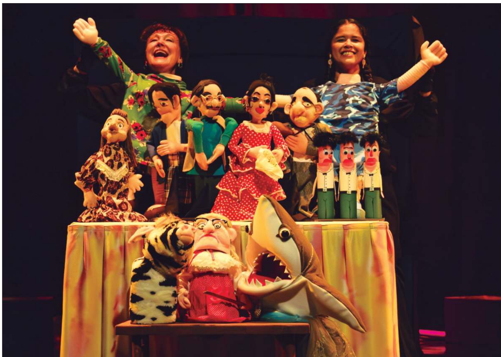
▲ "El montaje escénico ha sido seleccionado a representarnos en el Festitaller Internacional de Títeres de Matanzas, Cuba (...) que tendrá lugar del 14 al 19 de mayo y reunirá a diez compañías cubanas y a diez internacionales (...) Este año la dedicatoria será a las mujeres titiriteras".