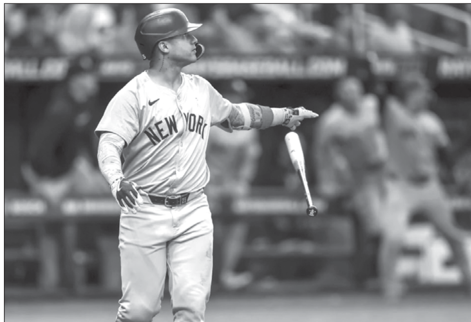
▲ Gleyber Torres observa su cuadrangular de tres carreras contra Tampa Bay en la octava entrada.

Gil (4-1), quien se mantuvo en el partido a pesar de que aparentemente recibió un golpe en una pierna en batazo de Yandy Díaz en la tercera, espació tres imparables y mejoró su efectividad de 2.92 a 2.51.