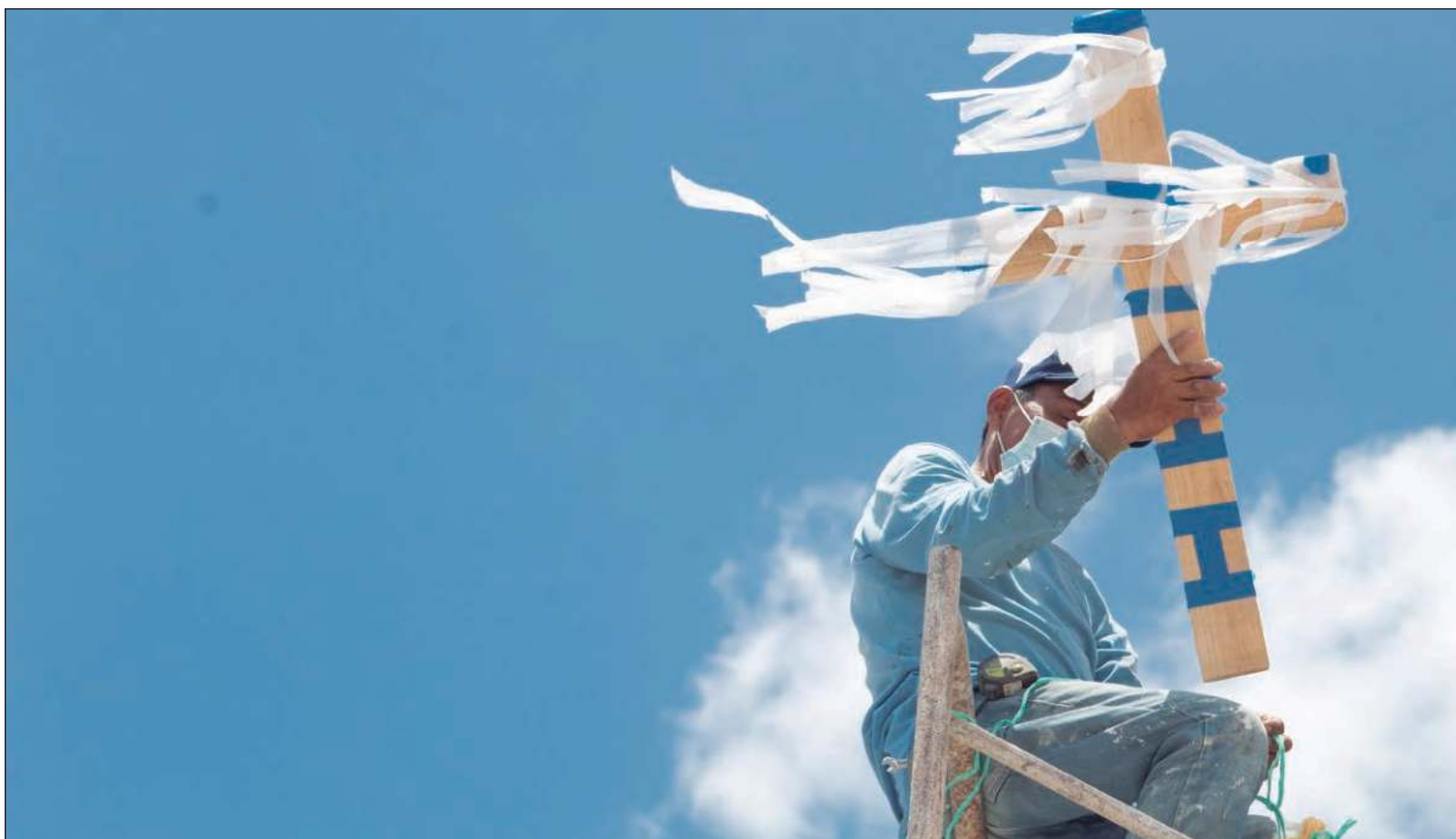
▲ "Es un día que favorece las narrativas que fabulan sobre los orígenes de la abundancia, pero también sobre el azar y lo endeble del tener".

SÍGANOS EN: http://orga.enesmerida.unam.mx/ Facebook @ORGACovid19 Instagram @orgacovid19 X @ORGA_COVID19