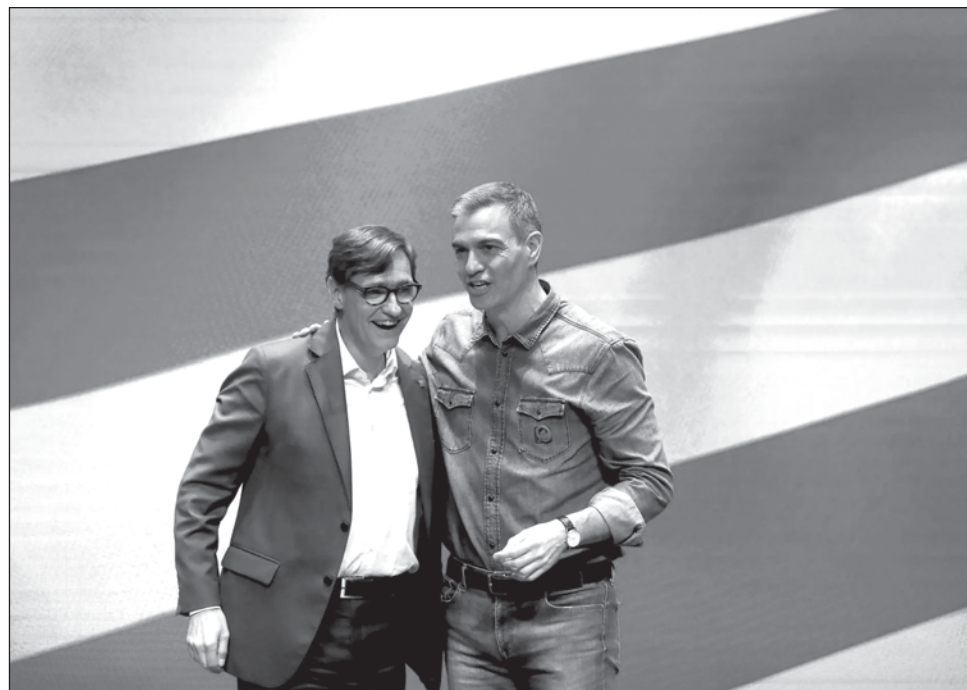
▲ El ascenso de los socialistas, que sumaron más de 200 mil votos respecto a las últimas elecciones, contribuyó a mermar la mayoría independentista que gobernó la región durante casi 10 años.

Los resultados en esta importante región de ocho millones de habitantes, y uno de los motores económicos del país, son una gran noticia para Sánchez, que pretendía demostrar que su política a favor del “reencuentro” era