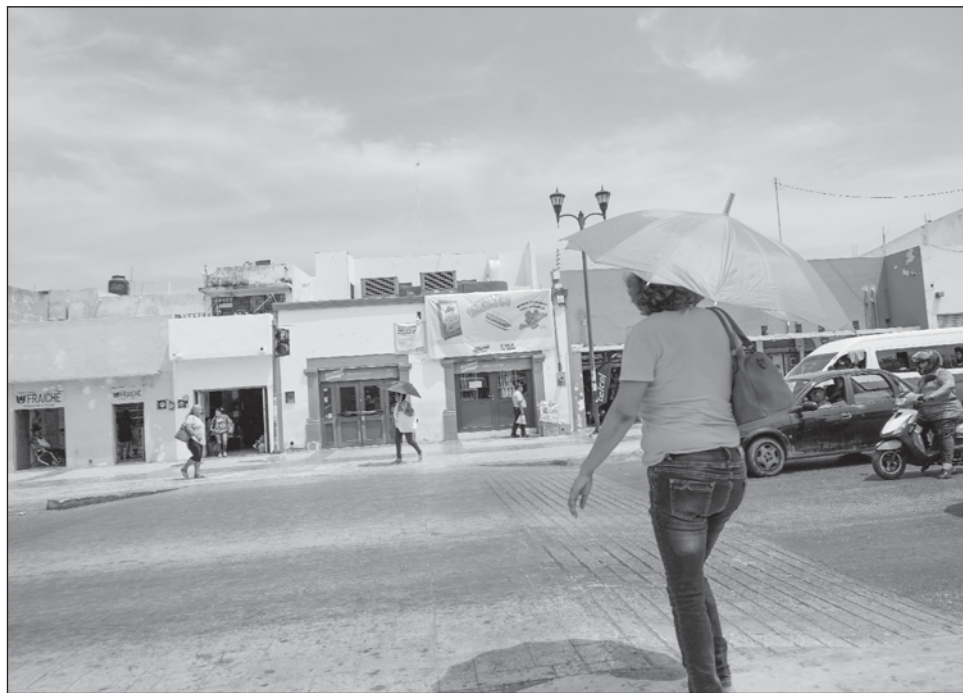
▲ Los efectos adversos de las altas temperaturas pueden incluir golpes de calor, deshidratación, agotamiento y otros problemas de salud graves.

Contar con la hidratación adecuada: Consuma abundante agua y evite bebidas que contengan alcohol o ca-