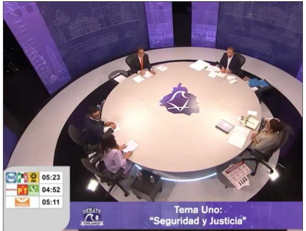
▲ El tercer y último debate incluyó por primera vez la intervención de preguntas de la ciudadanía, y se abordaron temas como la seguridad y el desarrollo urbano.

“La seguridad y toda la estabilidad política en nuestro país pasa por el Poder Judicial”, recordó y señaló que en el movimiento “también hemos luchado siempre por la democracia, porque cada voto que usamos en el periodo electoral sea un voto de a de veras”.