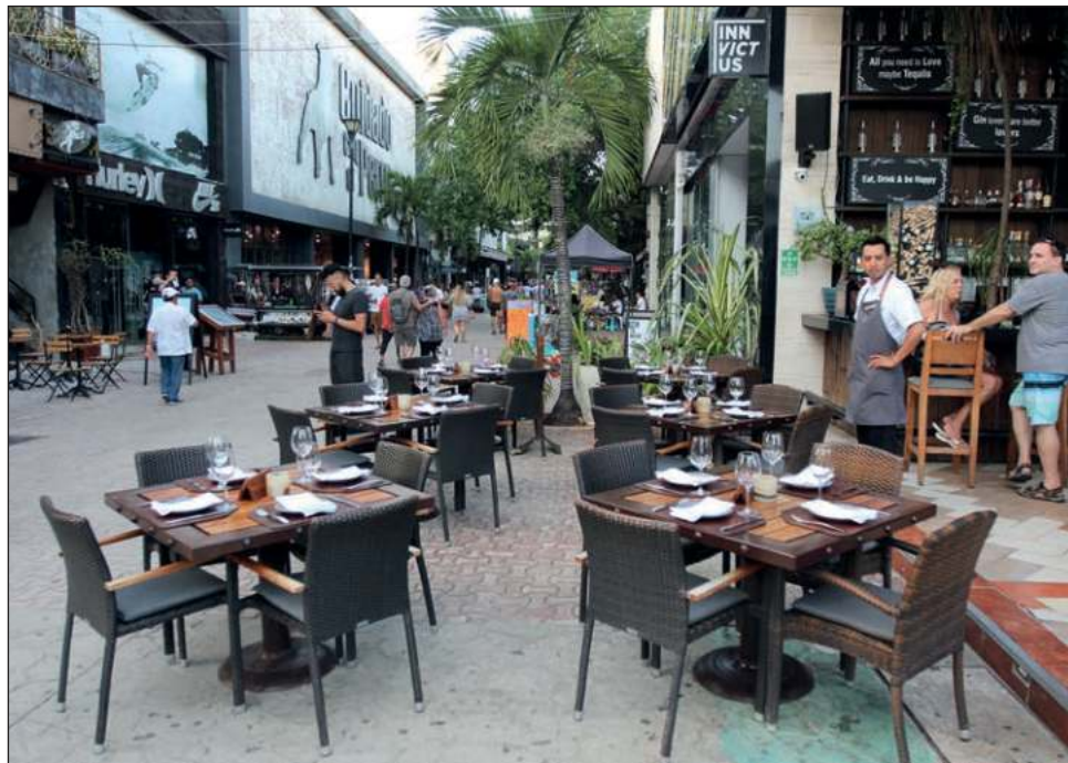
▲ Para los empresarios, los constantes apagones reflejan que el país está rebasado y la necesidad de invertir y eficientar a la Comisión Federal de Electricidad.

Es sumamente importante, dijo, que se voltee a ver que están muy justos ya con