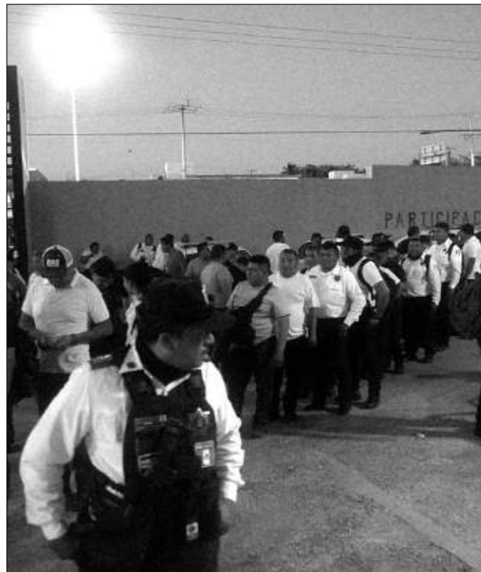
▲ Los policías cuentan con un amparo para que sus derechos laborales permanezcan intactos en lo que se resuelve el conflicto. Sin embargo, algunos elementos han sido dados de baja.

Por otro lado, resulta difícil de creer que un paro laboral de policías esté próximo a cumplirse dos meses y que cuente con el respaldo de la población, que al mismo tiempo es la principal