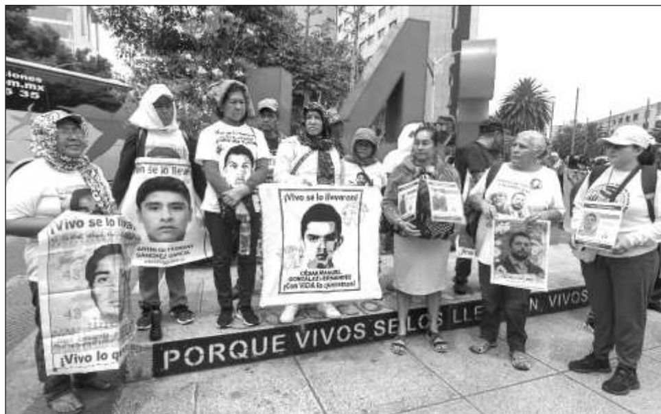
▲ El informe de la FGR destaca la apertura de nuevas líneas de investigación que han dado como resultado el encarcelamiento de 124 personas por la desaparición de los 43 normalistas.

Sin embargo, la FGR destaca que han encontrado limitantes para lograr que se les condene, entre ellas “la dispersión de los procesos a