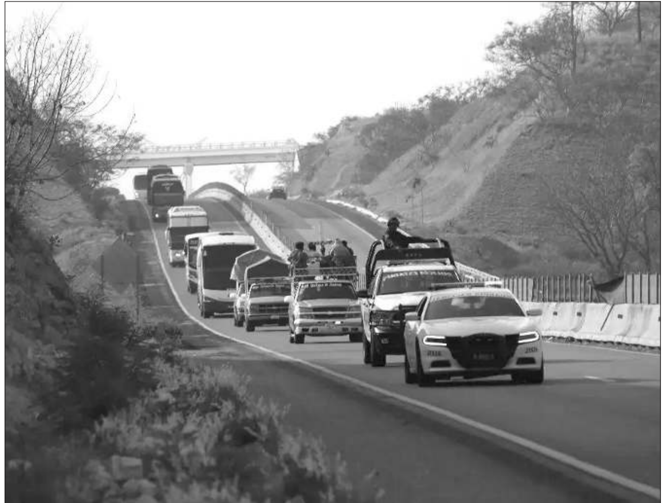
▲ Las personas en tránsito arribaron a la capital del estado el pasado viernes, luego de caminar más de 700 km desde la frontera con el estado de Chiapas; a su paso recibieron apoyo en muchas comunidades.

Ya en la ciudad de Oaxaca el gobierno estatal dispuso del Polideportivo para que los migrantes descansaran en dicho sitio desde el viernes por la tarde, donde se les brindaron servicios médicos y alimentos; el sábado decidieron descansar y continuar con su recorrido hasta este domingo.