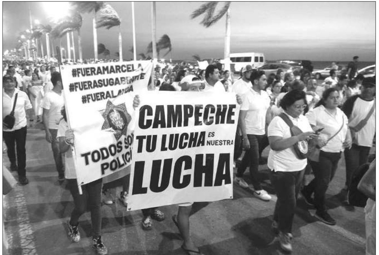
▲ Los elementos policiacos destacaron que se espera la participación de más de 20 mil personas para la manifestación.

De acuerdo con los policías, se espera la llegada de más de 20 mil personas siempre que el gobierno del estado no amenace a transportistas que presten servicio ese día, así como a quienes rentan sus unidades, pues aseguraron que en marchas anteriores pudo haber llegado aún más gente, pero el Instituto Estatal del Transporte