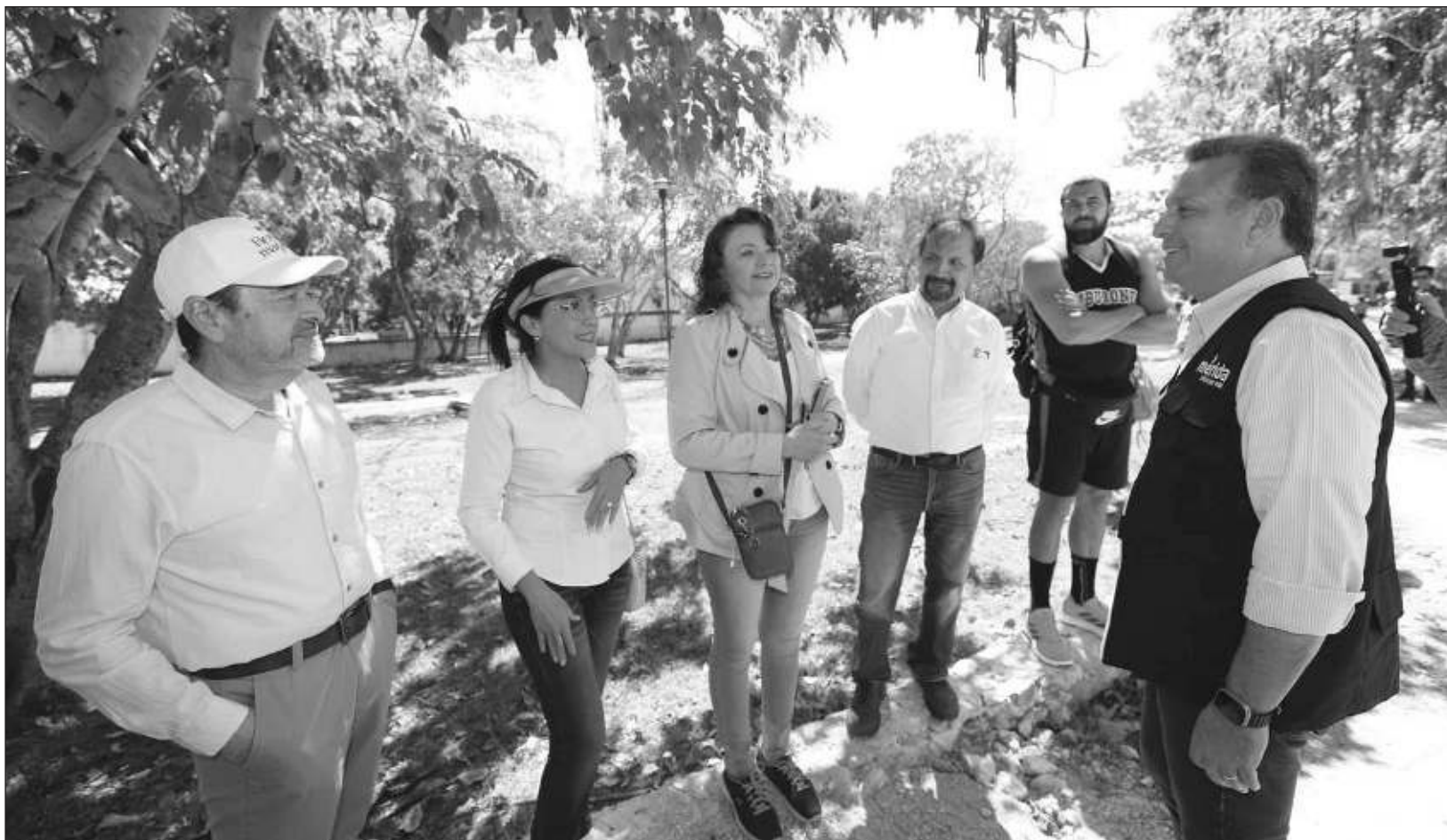
▲ El alcalde Alejandro Ruz subrayó que “ese interés, así como la voluntad de la ciudadanía de contribuir con el mejoramiento de su ciudad, hace posible que hoy en los cuatro puntos cardinales de Mérida y sus comisarías podamos tener espacios renovados y amables”.