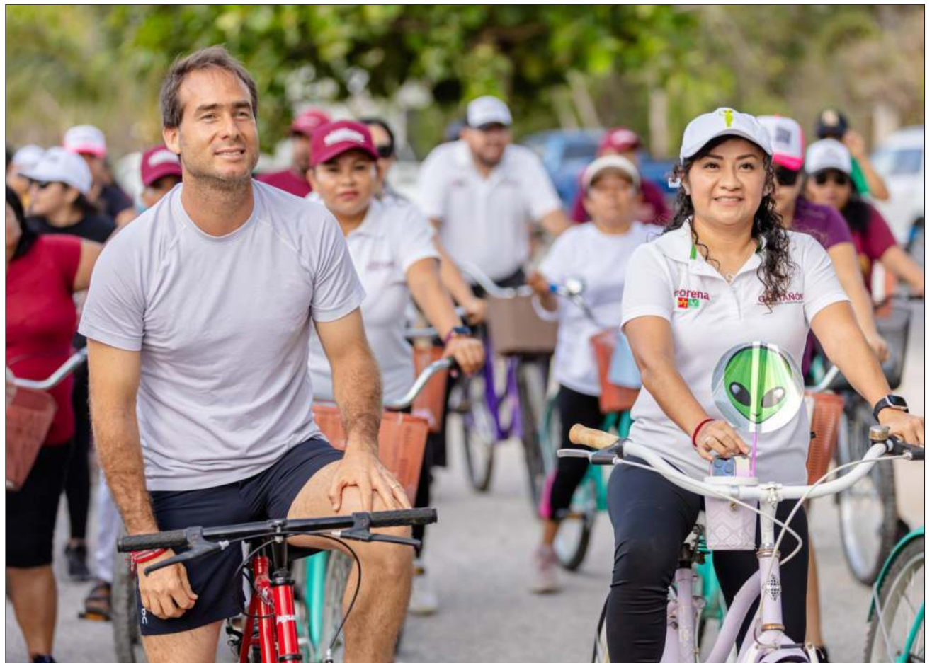
▲ El abanderado de la coalición Sigamos Haciendo Historia anunció que se construirán nuevos espacios deportivos y se rehabilitarán los existentes a fin de fomentar “vidas sanas y alejadas de los malos hábitos”.

Como fiel defensor y promotor del deporte como mo-