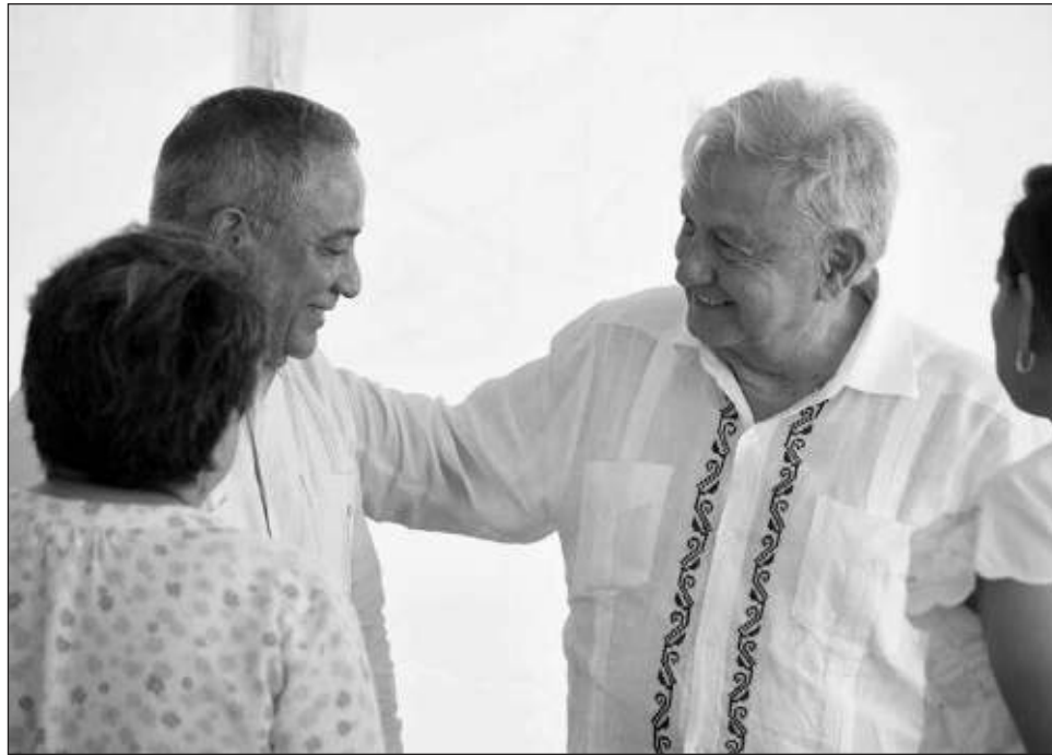
▲ El primer ministro beliceño se mostró interesado en proyectos como el Tren Maya y Sembrando Vida, así como temas de migración y seguridad regional.

"Aquí, en el aeropuerto de Tulum, concluimos un fin de semana de importantes avances en temas prioritarios para el bienestar y desarrollo de Quintana Roo, con nuestro presidente Andrés Manuel