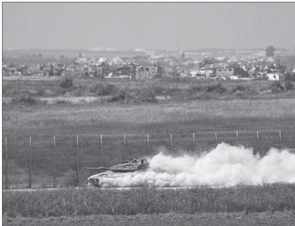
▲ Palestinos reportaron intensos bombardeos israelíes durante la noche en el campo de refugiados urbano de Jabaliya y otras zonas del norte de la Franja de Gaza.

El comisionado de derechos humanos de la ONU Volker Turk dijo que "una ofensiva total contra Rafah no puede ocurrir". Añadió que no concibe cómo tal ofensiva podría respetar el derecho internacional.