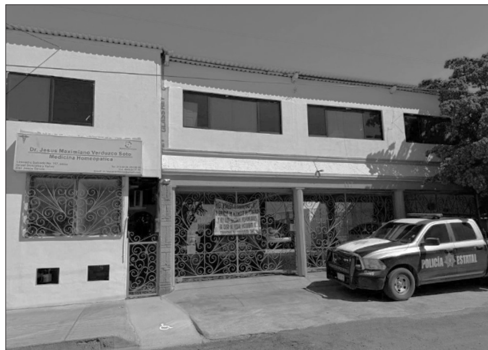
▲ El hermano de la víctima asegura que la reacción al suero fue inmediata.

“El doctor le suministró otro suero. Le inyectó una sustancia a éste para levantar la presión, aunque nunca nos dijo qué era. Pensamos que