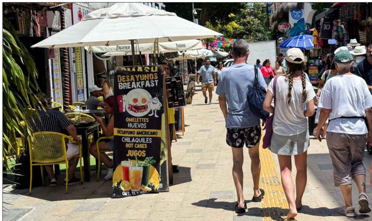
▲ A pesar de que la afluencia es positiva, el comportamiento y la derrama no dicen lo mismo: la disminución del gasto es especialmente notable en restaurantes y prestadores de actividades recreativas: ATEEF.

Sobre la reducción en la derrama, la empresaria dijo desconocer el dato, pero sí ha sido recurrente en diferentes sectores, lo que se puede percibir especialmente en res-