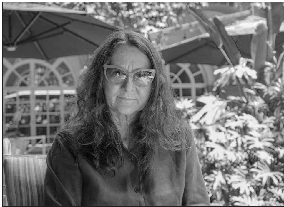
▲ En el evento también fue presentado el documental más reciente de la cineasta.

Además, porque Lucrecia Martel es “una de las voces más influyentes del llamado Nuevo Cine Argen-