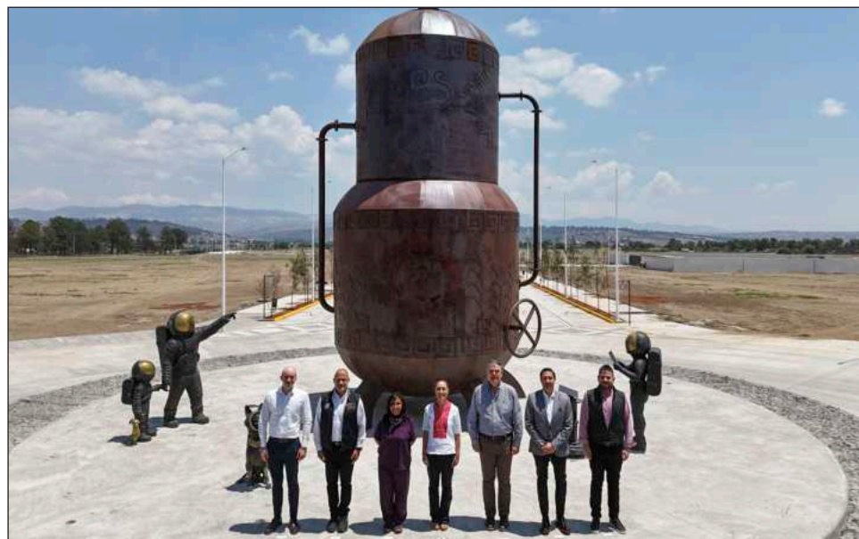
▲ El Polo del Bienestar contará con una inversión privada de 540 millones de dólares

También dijo que se está “impulsando el campo en el país”, por lo que “me siento muy confiada, muy optimista para 2026”. El gobierno federal proyecta 15 polos, con el objetivo de que no se concentre la inversión pri-