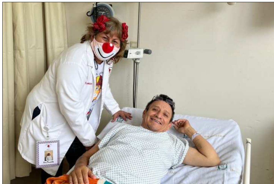
▲ Caracterizados de payasos doctores, los miembros de esta Institución de Asistencia Privada visitan hospitales y albergues con la misión de que los ejercicios de risaterapia puedan mejorar la calidad de vida de los pacientes.

Antes de ingresar al hospital, realizan una especie de ritual en el que dejan todas “las malas vibras” y lo que les aqueja para cargarse de energía positiva, misma que buscan transmitir a las personas con las que están