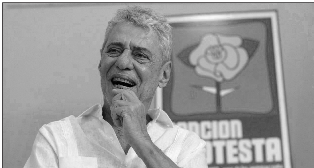
▲ La Casa de las Américas publicó en el 2013 Leche derramada , obra galardonada de Buarque.

Los presentes recordaron que en 1978, Buarque visitó Cuba como jurado del Premio Literario Casa de las Américas. Fue su labor de dramaturgo y narrador, y no la de músico, curiosamente,