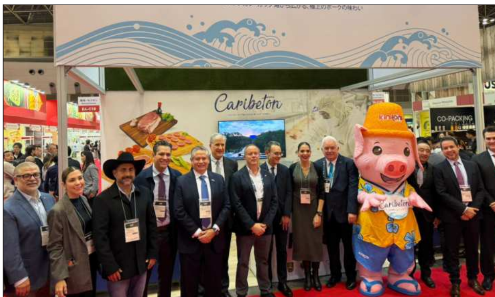
▲ Kekén estuvo representada en la feria de Japón por miembros del área comercial.

mación del Gobierno de México, el país ocupa el cuarto lugar en el ranking de naciones exportadoras de carne de cerdo hacia Japón, lo que refleja la confianza y preferencia del mercado japonés por el producto cárnico penin-