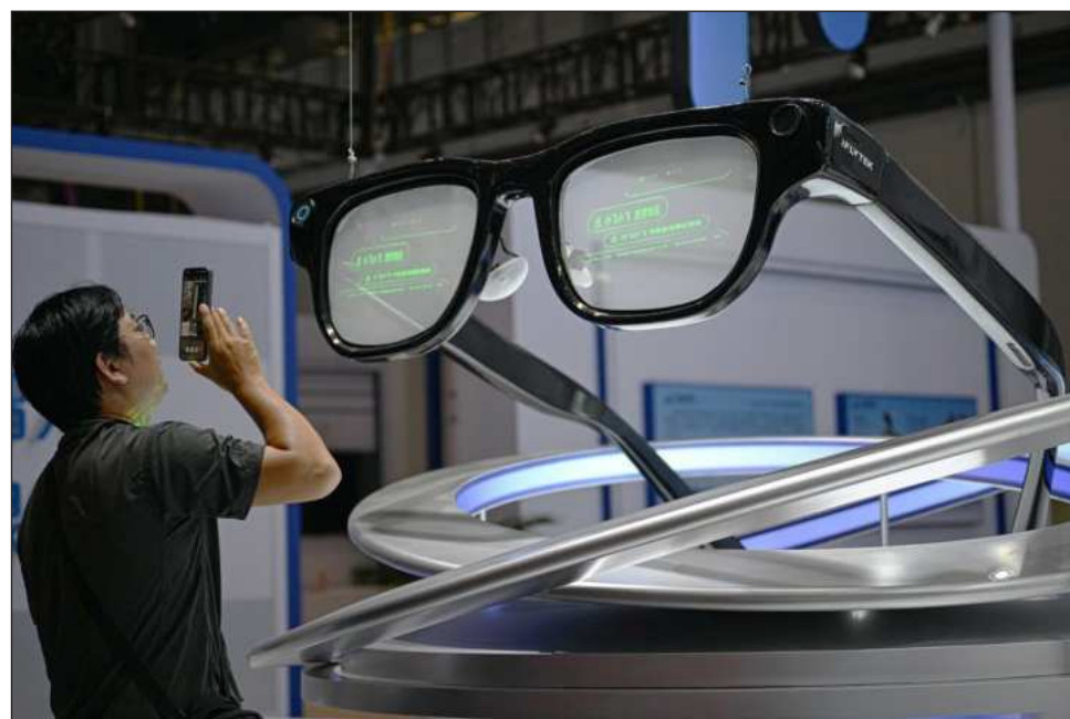
▲ Según Tollbit, la caída en el tráfico de las editoriales está muy ligado a la IA.

Buena parte de este tráfico no sólo busca entrenar a los modelos de IA para que sepan cómo responder a los usuarios, como ya se hace, sino para robar en tiempo real el contenido de los medios para dar una síntesis de las noticias de última hora mediante sus chatbots.