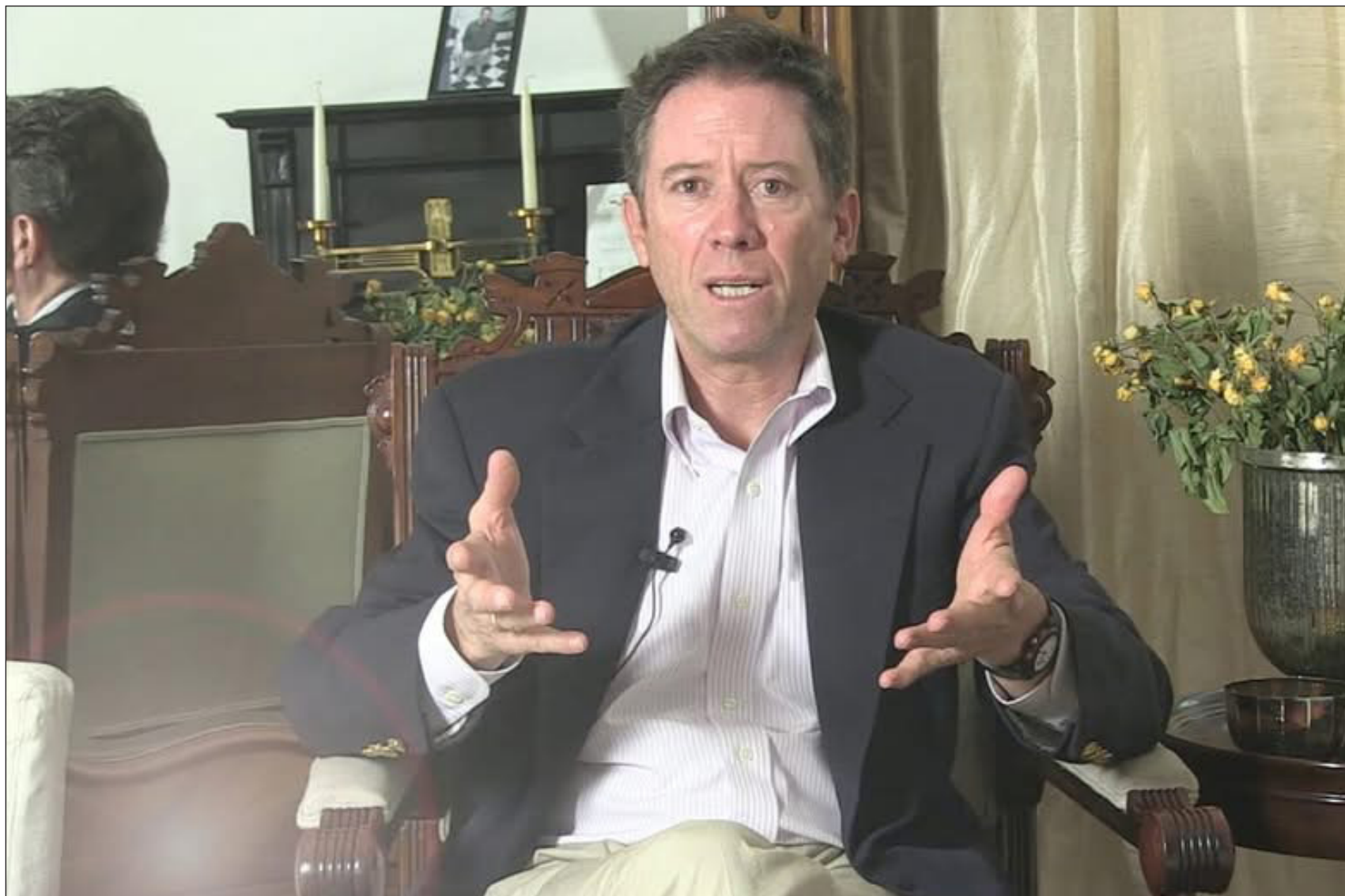
▲ “Creo que Porfirio Díaz, cuando se casó con Carmelita, no quería conservar la correspondencia amorosa con su antigua relación, pero tampoco destruirla, y entonces se la dio a su secretario particular”.