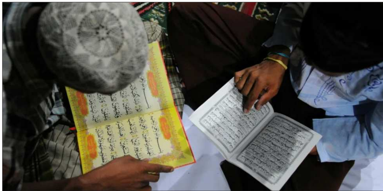
▲ La muchedumbre estaba furiosa por un video antiguo de Jahangir que volvió a circular en línea, donde afirma que quienes redactaron el Corán eran analfabetos.

La muchedumbre estaba furiosa por un video antiguo del hombre que volvió a circular en línea el viernes. Al parecer, en él afirma que quienes redactaron el Corán eran analfabetos y quienes lo leen, aún peor, declaró a