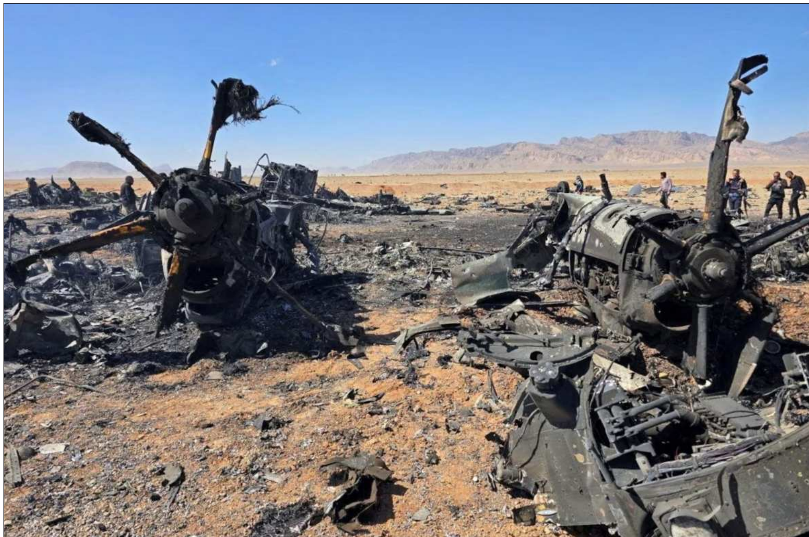
▲ “La derrota del ejército estadounidense en la Operación Isfahán seguramente golpeó el super ego del insano cerebro del inquilino de la Casa Blanca”.

Mientras Donald Trump se entretenía rescatando al piloto Ryan, los líderes republicanos y de MAGA se han estado preguntando: ¿Y dónde está el piloto?