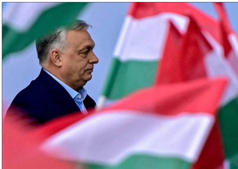
▲ El partido opositor Tisza obtuvo el 53 por ciento de los votos emitidos ayer.

El vencedor Péter Magyar, un antiguo aliado de Orbán que hizo campaña contra la corrupción y sobre asuntos cotidianos como la atención médica y el transporte público, se ha comprometido a recons-