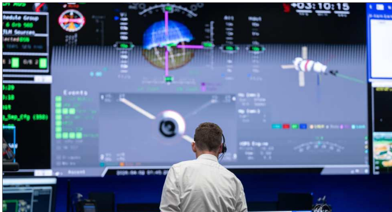
▲ La Starship de Musk y la Blue Moon de Bezos pugnan por el crucial alunizaje de Artemis IV en 2028.

En una misión añadida recientemente al calendario para el próximo año, los astronautas de Artemis III —cuyos nombres aún no se han anunciado— practicarán el acoplamiento de su cápsula Orion con uno