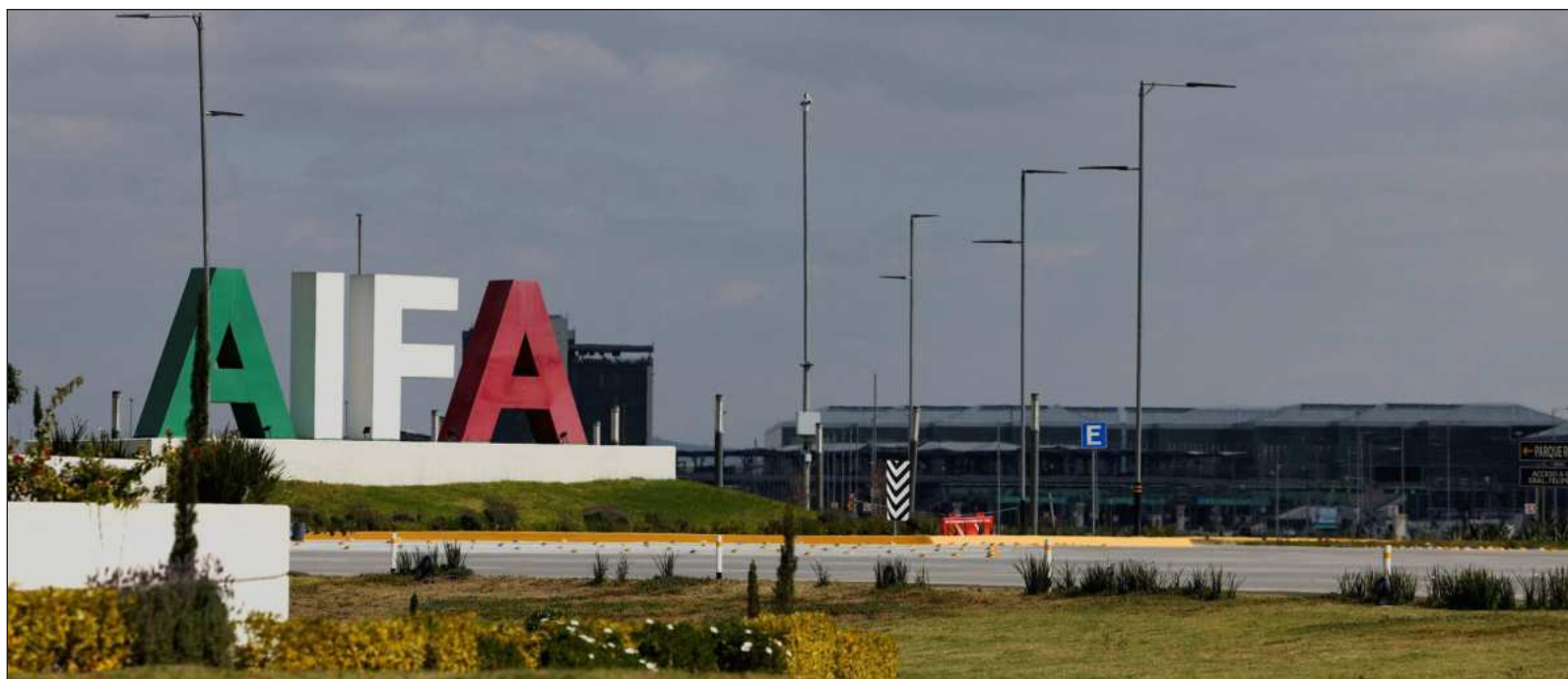
▲ “El AIFA no es el desastre que sus críticos anticipaban, pero tampoco el éxito rotundo que sus promotores proclamaron”.

Siga nuestras investigaciones en: orga.enesmerida.unam.mx/ Fb: facebook.com/ORGA.UNAM Ig: instagram.com/orgaunam/ X: @ORGA_UNAM_