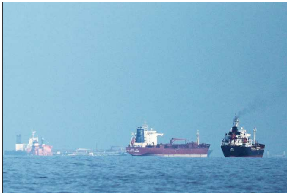
▲ Ninguna de las partes indicó qué ocurrirá cuando expire el alto al fuego en vigor.

Trump quiere debilitar la principal herramienta de presión de Irán durante el conflicto armado después de exigir la reapertura de la vía por la que antes de la guerra navegaba el 20% del petróleo comercializado a nivel mundial.