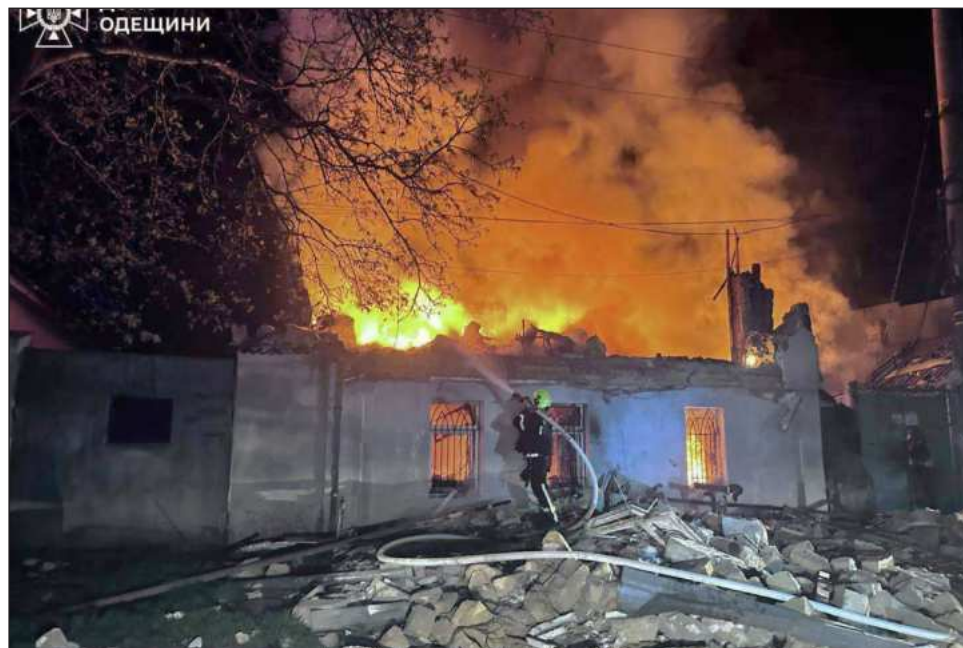
▲ El Estado Mayor de las Fuerzas Armadas de Ucrania indicó que había registrado 2 mil 299 violaciones del alto el fuego; Moscú dijo que contabilizó mil 971.

El Estado Mayor de las Fuerzas Armadas de Ucrania indicó en un comunicado el domingo que había registrado 2 mil 299 violaciones del alto el fuego hasta las 7 de la mañana, hora lo-