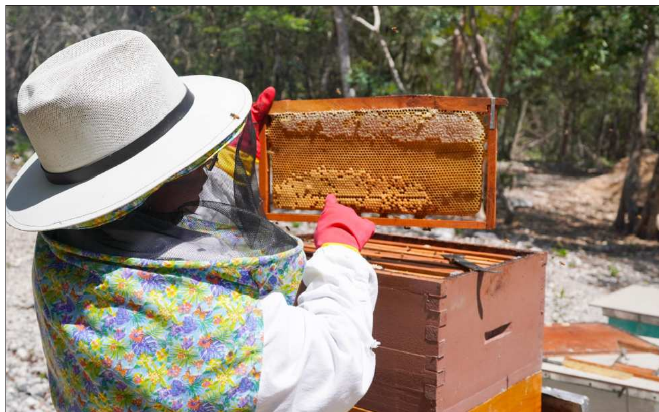
▲ Durante la actividad, los productores compartieron experiencias sobre el manejo de colmenas, el proceso de producción de miel y sus derivados, así como técnicas para la protección de las abejas.