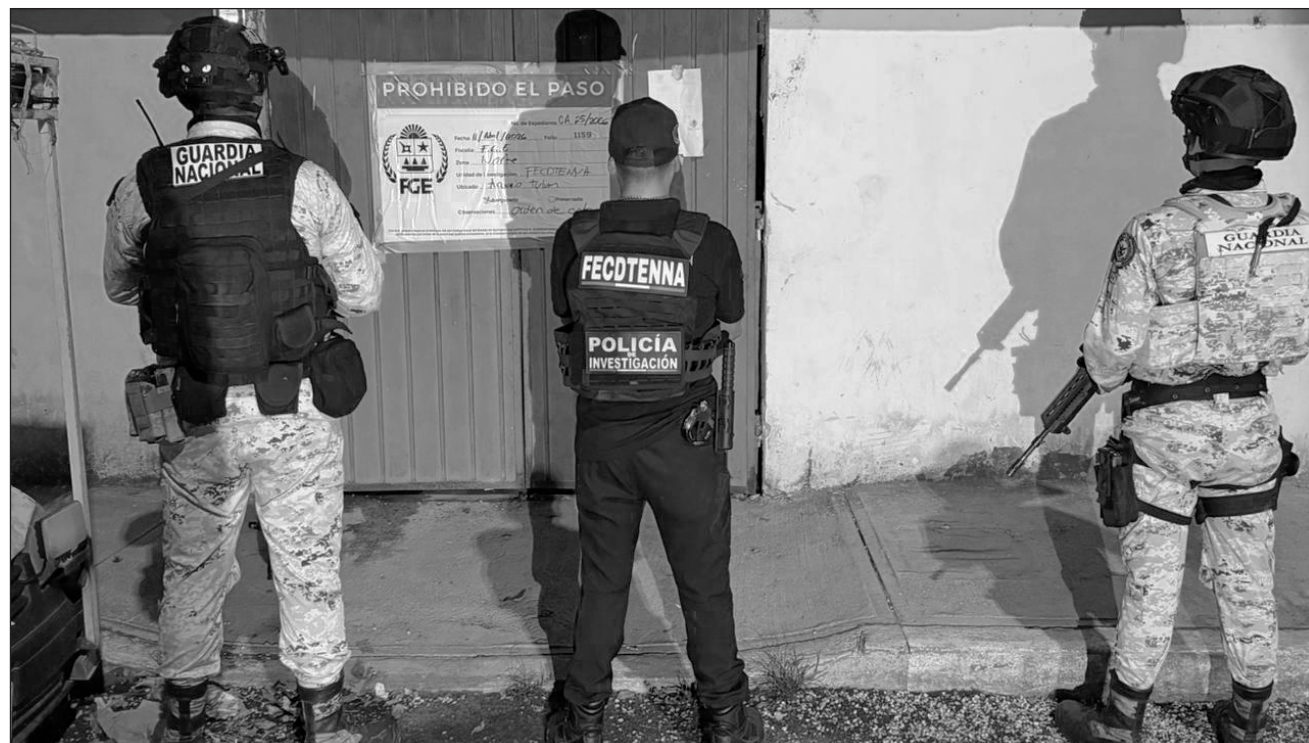
▲ Las víctimas rescatadas eran obligadas a distribuir y vender drogas en bares y restaurantes de la zona costera.

En esta intervención se logró el rescate de una víctima del sexo femenino, así como la detención de un masculino