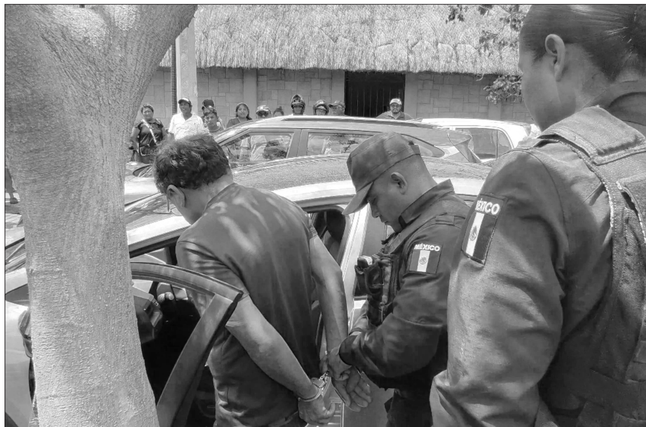
▲ La Vicefiscalía de Control Judicial obtuvo que un juez, mediante un acuerdo, ordenara a José “N” el pago de la reparación integral del daño a favor de la víctima identificada como S.A.P.P, por las lesiones.

La audiencia se reanudó el día 9, cuando, mediante un mecanismo alternativo, se resolvió el acuerdo reparatorio. Cabe destacar que, después de embestir al chofer, el imputado huyó,