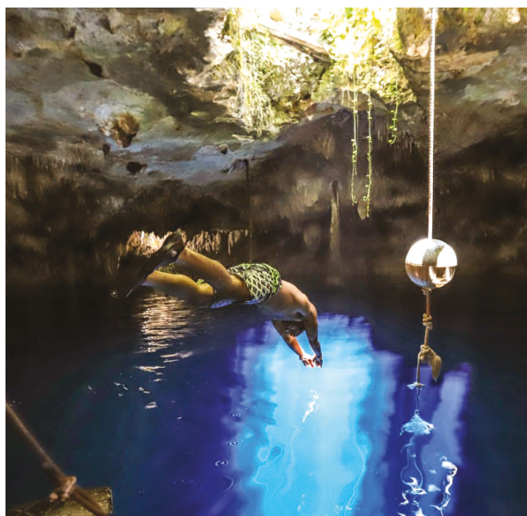
▲ Las autoridades invitaron a los portomorelenses y visitantes a subir sus fotos más emblemáticas del destino.

Por otro lado, Héctor Tamayo indicó que ante la situación de la pandemia, en la que el turismo ha sido una de las actividades más afectadas, todas las estrategias de promoción son bienvenidas para la recuperación económica y, al mismo tiempo, se incentive a los concursantes a viajar y seguir conociendo los destinos más hermosos del país, incluido Puerto Morelos.