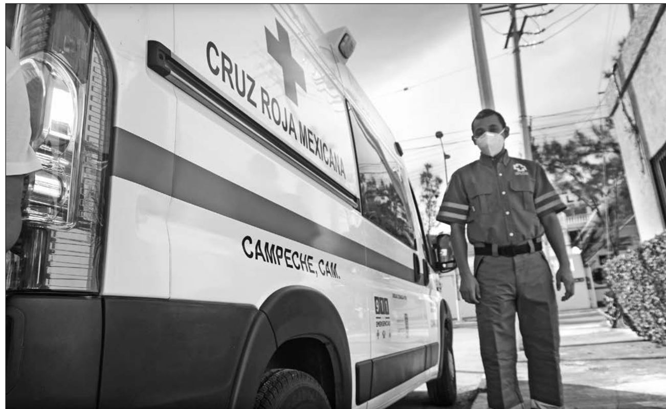
▲ Una llamada “de broma” pone en riesgo cientos de vidas, ya que dejan de atenderse emergencias reales.

Por ello refirió que esperan a que la población sea responsable con el uso de dichas líneas, pues “el costo no es monetario, pues no gastamos en recibir las llamadas y aunque el combustible sea escaso, lo más llamativo es