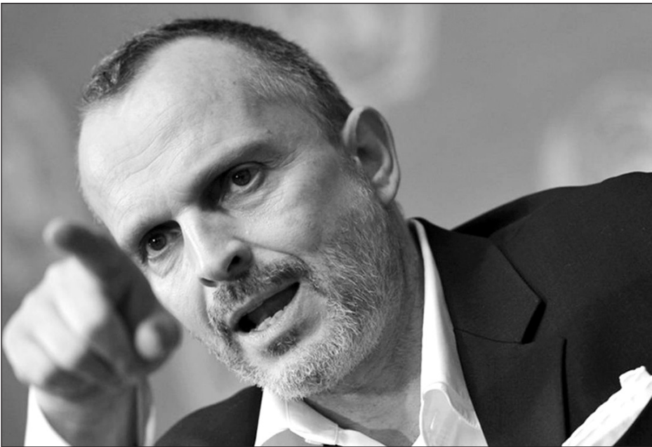
▲ El cantante español refrendó su postura negacionista en torno a la pandemia.