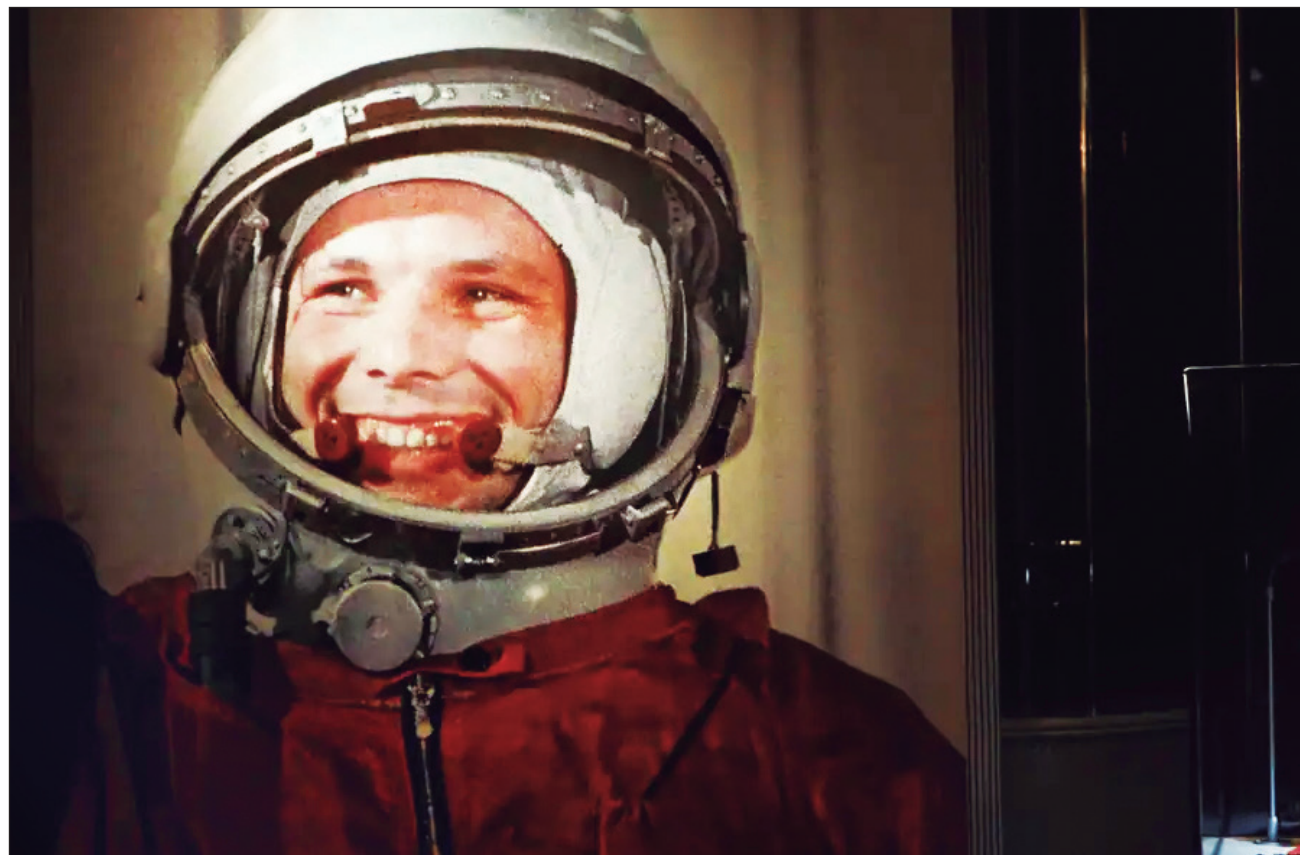
▲ La misión del 12 de abril de 1961 tuvo fallos técnicos y emergencias, desde una escotilla de la cápsula que no se había cerrado adecuadamente hasta problemas con el paracaídas en el último momento antes del aterrizaje.

Como Gagarin, los oficiales soviéticos estaban preparados para lo peor. No se instaló un sistema de seguridad para salvar al cosmonauta en caso de que hubiera otra explosión del cohete, ya fuera