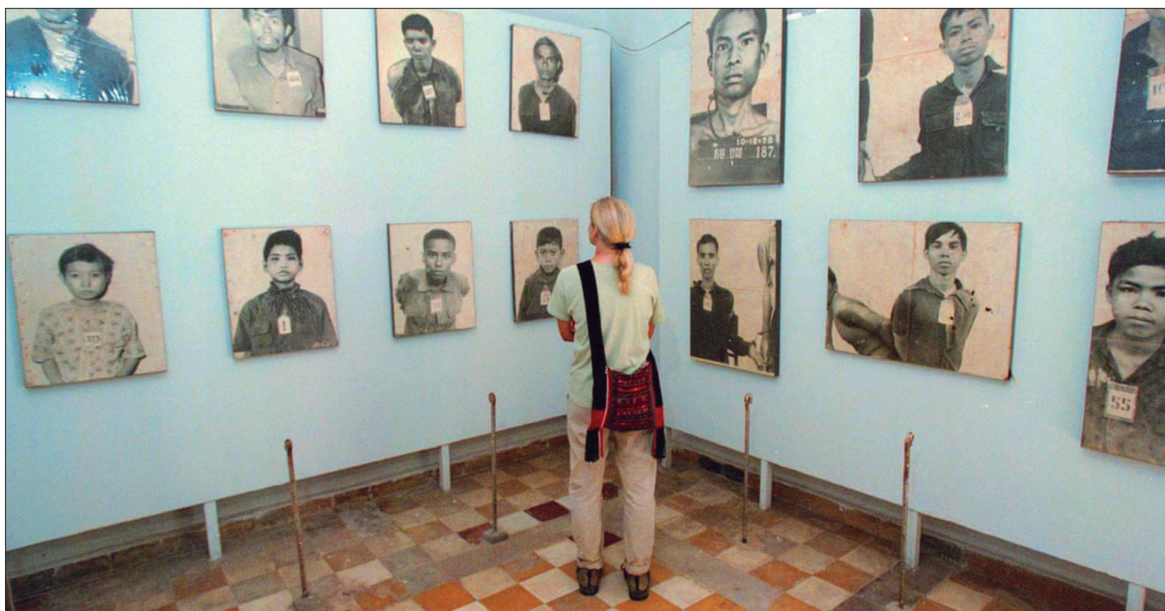
▲ A diferencia de los retratos publicados por Loughney, en las fotos originales las víctimas del Jemer Rojo tienen rostros serios.

En una publicación, Matyt Loughney intervino las imágenes con color y sonrisas