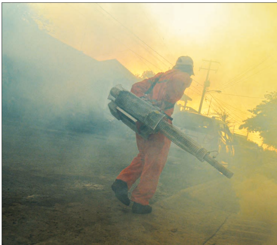
▲ El Sector Salud ya nebulizó mil 142 hectáreas en Campeche.

También llevan a cabo la vigilancia entomológica, a través de la colocación de ovitrampas, que actualmente son más de 3 mil localizadas en Campeche, Carmen y Escárcega, con monitoreo semanal por lo que las acciones encaminadas a la eliminación del vector, son permanentes todo el año mediante el control físico, eliminación de los recipientes que pueden ser considerados un hábitat del vector, y el seguimiento de los casos probables, activa las acciones de control específicas.