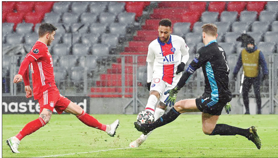
▲ Neymar, en acción contra el Bayern.

Los problemas físicos son la constante en varios de los encuentros de vuelta de cuartos de final de la Liga de Campeones.