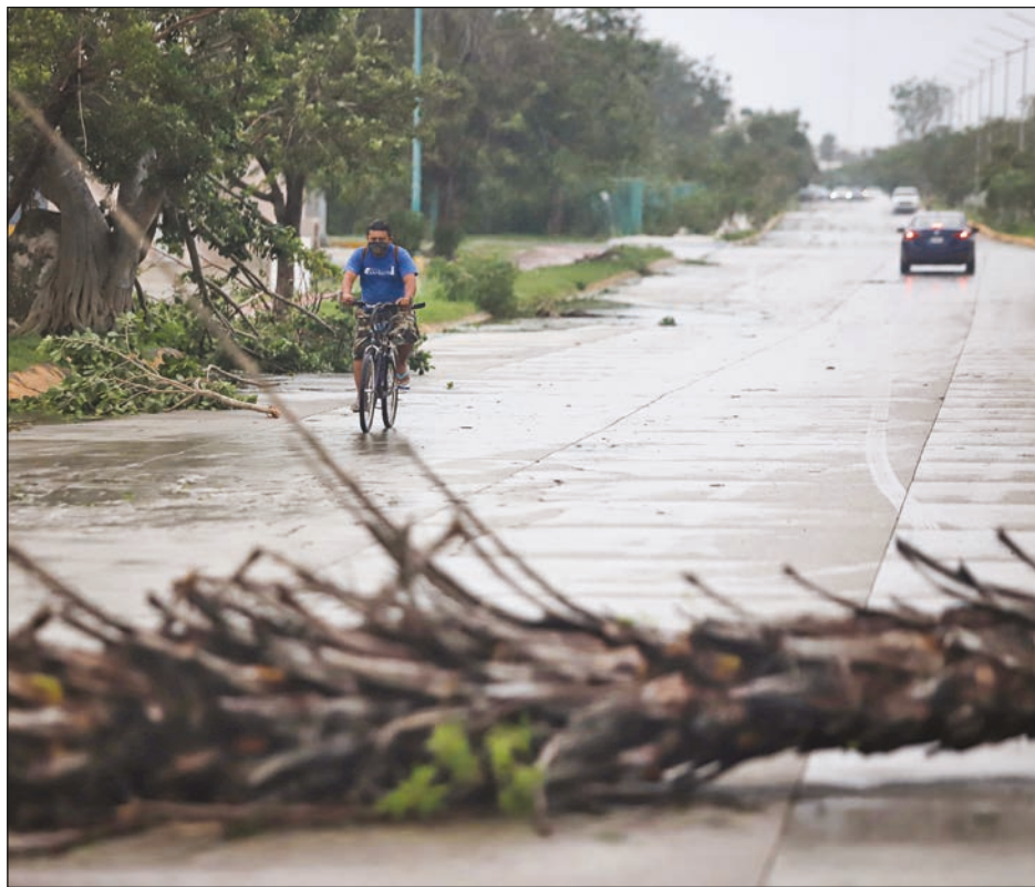
▲ Durante 2020 se registraron tres sistemas tropicales en el estado.