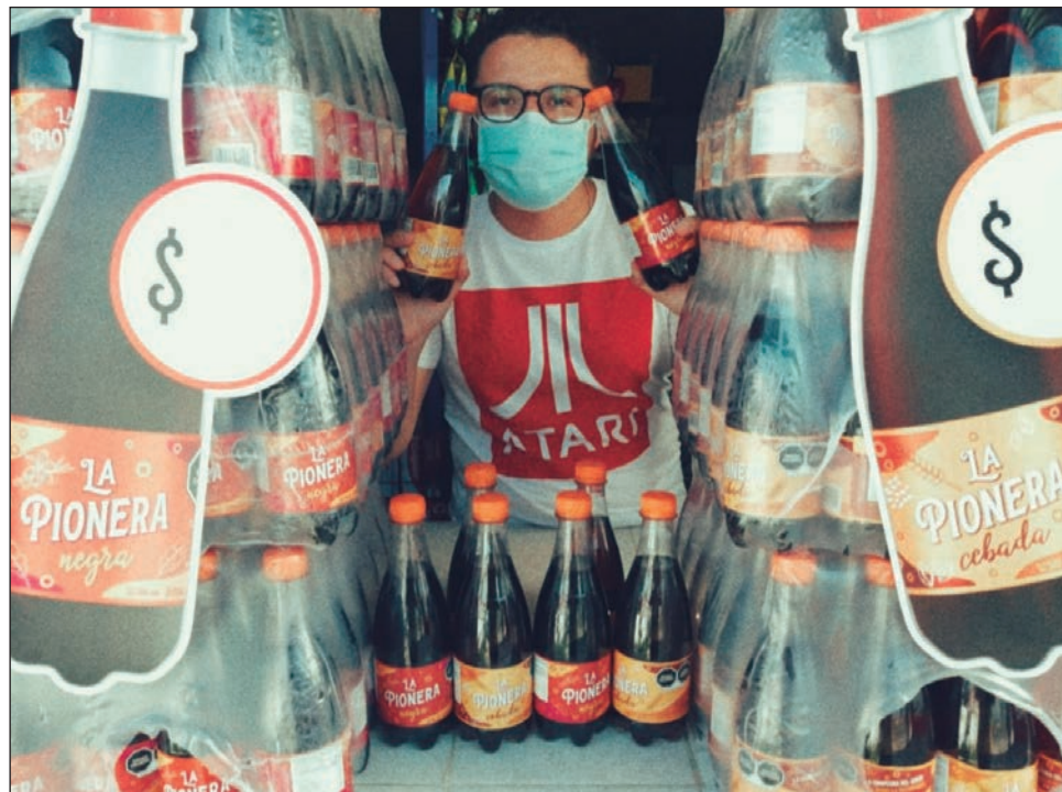
▲ La demanda para los refrescos de La Pionera ha sido alta.

Los emprendedores yucatecos crearon la fórmula recreando el sabor de la negra y la cebada que la gente tanto buscaba, indicó, aunque no ofreció más detalles sobre la empresa.