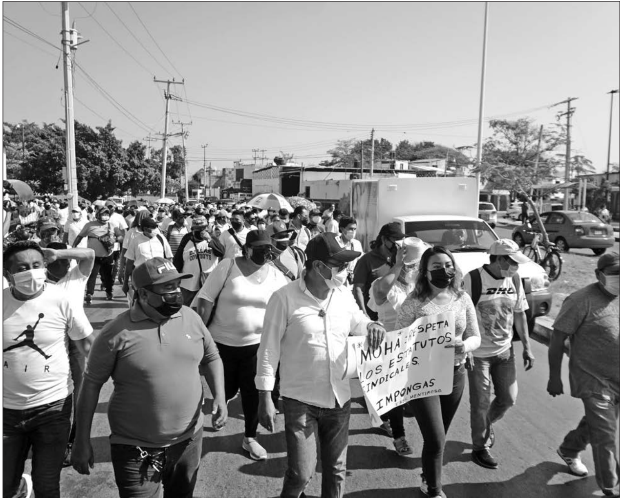
▲ Trabajadores del sindicato del ayuntamiento de Campeche caminaron hacia la sede de los Tres Poderes.

Puntualizó que ni en la primera aplicación de la vacuna, ni ahora, se han presentado casos de personas que hayan presentado reacciones grave al biológico.