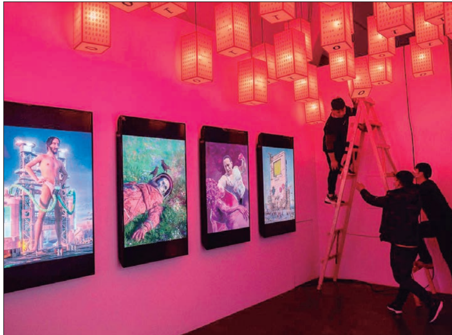
▲ El récord monetario que alcanzó la obra digital de Beeple desató una revolución mundial en el mercado del arte no físico.

¿Cómo respondes a las preocupaciones de que el comprador Metakovan, que adquirió 20 de tus otras obras NFT en una venta previa y creó un fondo de inversión NFT, estaba tra-