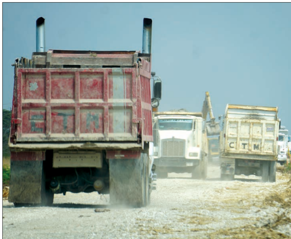
▲ Los amparos impiden realizar obras nuevas, no en las vías existentes.

Agregó que se platicó con los líderes y se demostró que los contratos no venían “alzados”; se estaba pagando el precio justo y real a través de mesas de diálogo y así te iniciaron los trabajos. No obstante, no precisó cuánto pagan a los camiones actualmente.