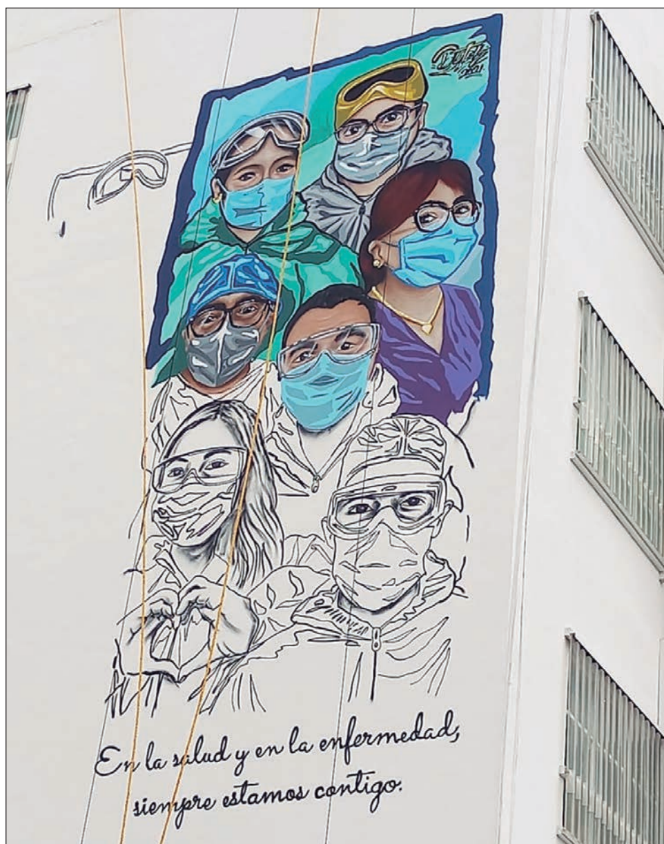
▲ La obra incluye rostros reales de quienes trabajan en el hospital Amerimed.