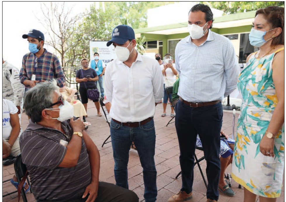
▲ En Yucatán, las personas tienen oportunidad de ser testigos de su propio proceso de vacunación contra el nuevo coronavirus.

Con estas cifras, el especialista indicó que este periodo está cerca de alcanzar la intensidad de abril de 2015, cuando se dieron ré-