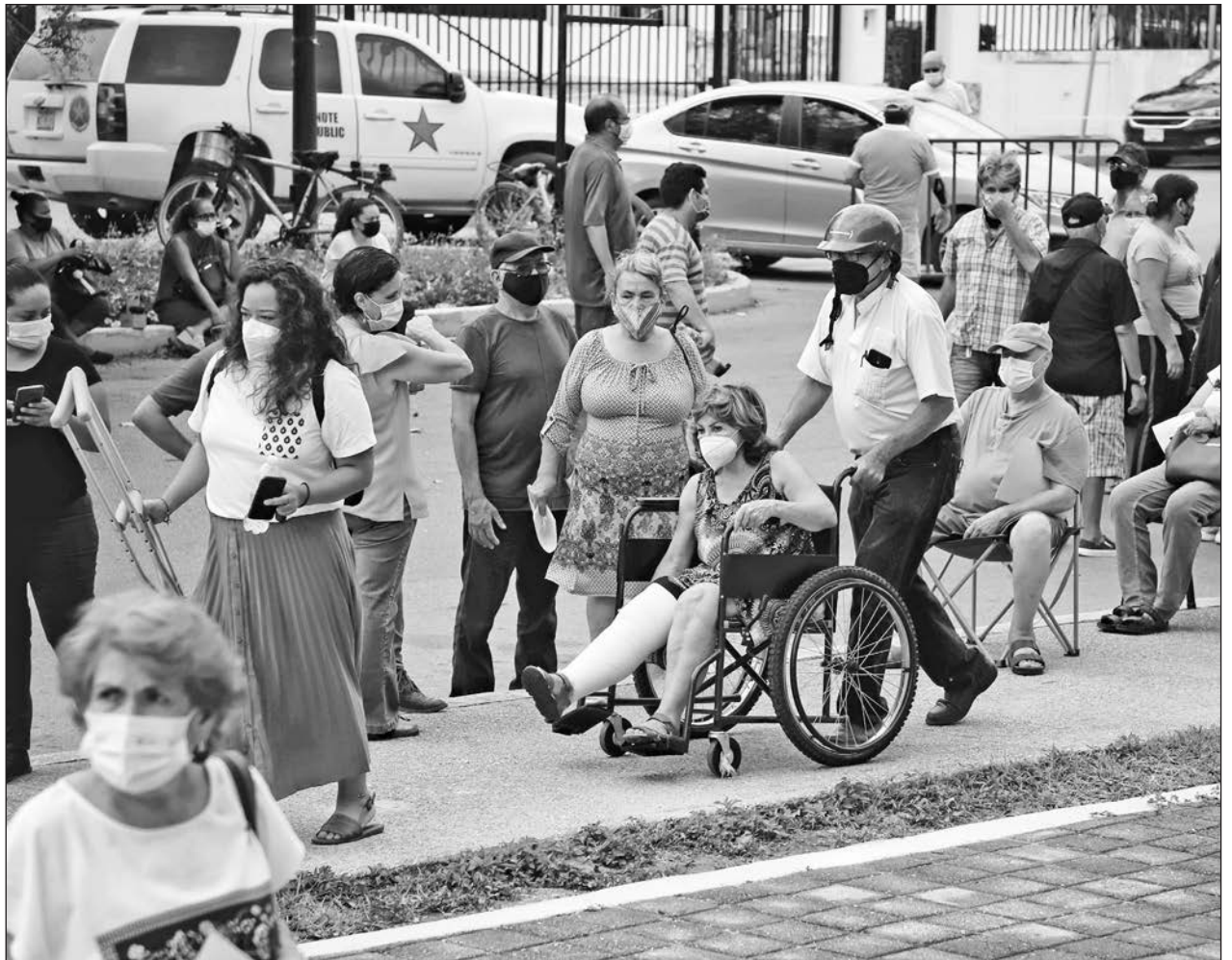
▲ La mayoría de los adultos mayores de 60 años acudieron acompañados por familiares.

Este lunes inició el periodo del 12 al 18 de abril, donde el Semáforo Epidemiológico Estatal se mantiene en amarillo en todo el estado, con las restricciones que marca el plan "Reactivemos Quintana Roo", en el que participan los gobiernos municipales, el sector empresarial y, principalmente, la ciudadanía en general.