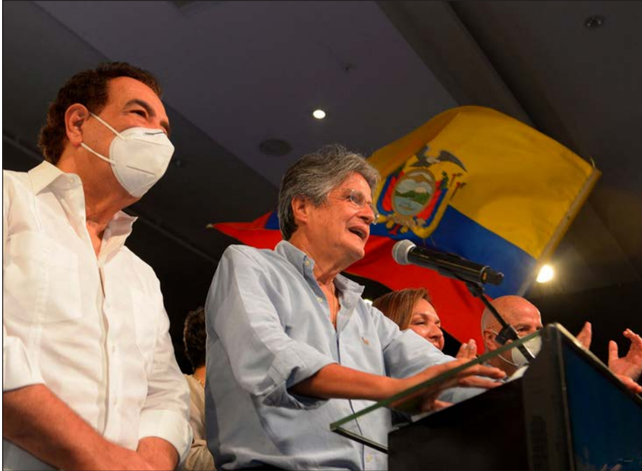
▲ La democracia ha triunfado y los ecuatorianos han optado por un nuevo rumbo, uno muy diferente al de los últimos 14 años, afirmó el ganador