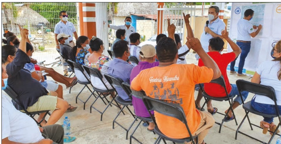
▲ El ejercicio participativo estuvo a cargo del Iapqroo.

En Hondzonot, destacaron el problema de la basura, al sólo tener recoja de basura una vez por semana; no hay buena señal de Internet y les resulta caro estar comprando fichas; ya no cuentan con seguro para pérdida de cosechas por eventos catastróficos; faltan medicamentos en el centro de salud y no hay ambulancia, por lo que también acuden mucho a Valladolid para temas médicos, lo que resulta costoso y además