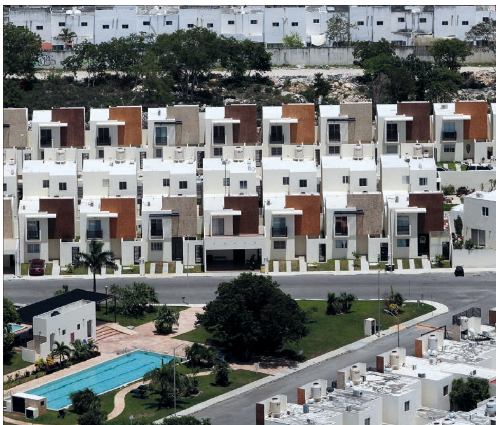
▲ El presidente, Andrés Manuel López Obrador, cuestionó la existencia de los aparatos burocráticos para el otorgamiento de créditos en casas de interés social.