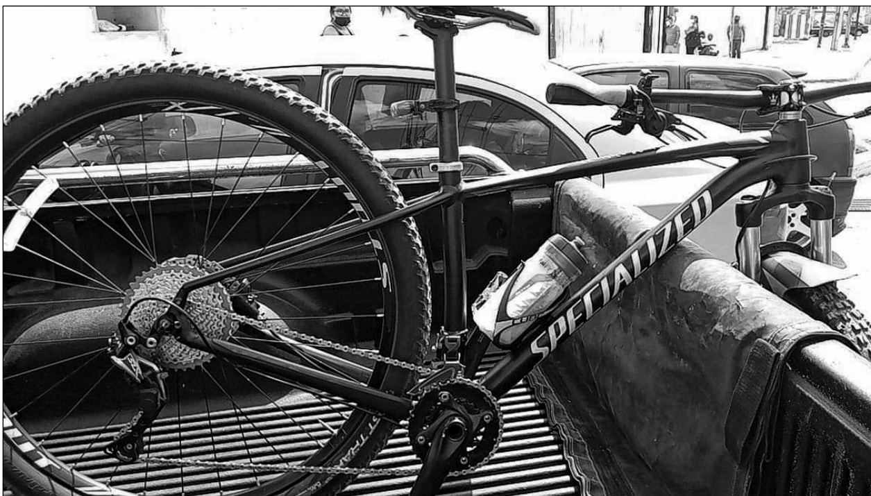
▲ Por solicitar la infracción a unos automóviles que estaban mal estacionados, elementos de la SSP esposaron y encarcelaron a Samuel, alegando "disturbios en la vía pública".

El rango de edad de los casos es de 1 mes a 99 años.