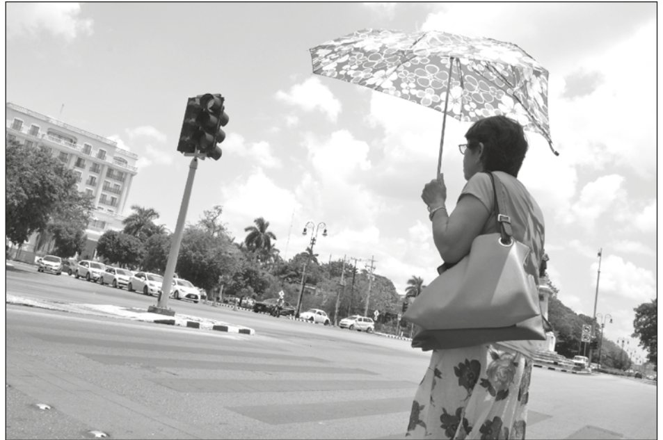
▲ Las temperaturas en la península de Yucatán rondarán entre 40 y 45 grados centígrados en esta temporada, advirtieron especialistas.