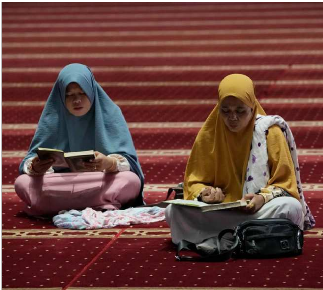
▲ El ayuno tiene el objetivo de acercar a los fieles a Dios y recordarles el sufrimiento de los pobres. Se espera que los musulmanes cumplan rigurosamente con las oraciones diarias y realicen meditaciones religiosas más profundas.

El ayuno pretende acercar a los fieles a Dios y recordarles el sufrimiento de los pobres. Se espera que los musulmanes cumplan rigurosamente con las oraciones diarias y realicen meditaciones religiosas más profundas. También se les insta a evitar los chismes, las riñas o el lenguaje malsonante durante el mes sagrado.