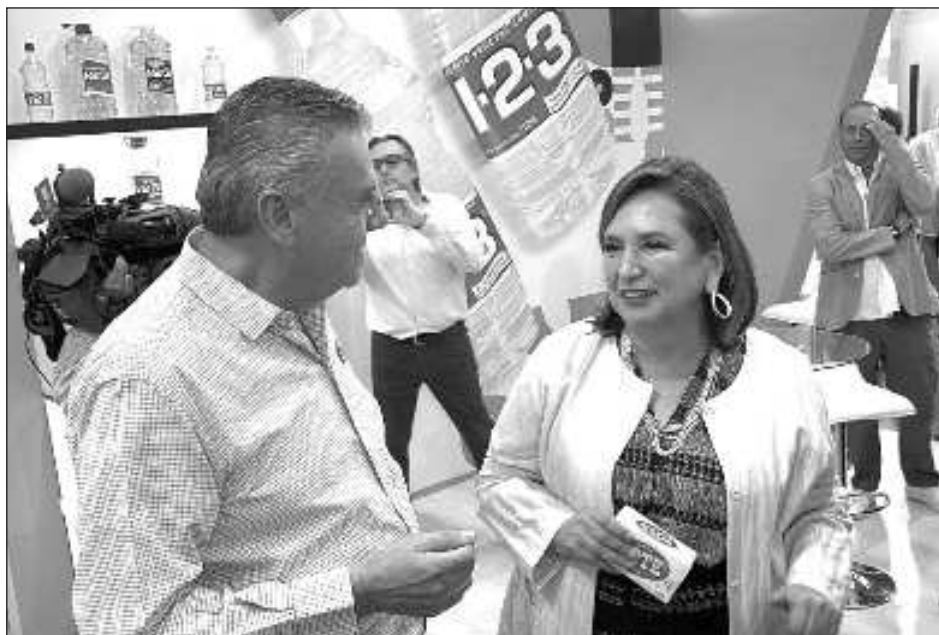
▲ La candidata de la coalición Fuerza y Corazón por México , subrayó que “el próximo 2 de junio la voluntad de las urnas determinará la vida o la muerte de la democracia mexicana”.

“Esta no es una elección normal en donde compiten dos proyectos políticos y dos candidatas a la Presidencia. Lo que está