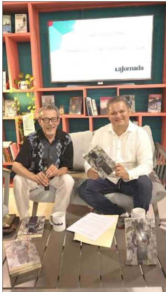
▲ Con tintes autobiográficos narrados con un estilo chilango, la novela Anónimo Hernández es un retrato de época de la Ciudad de México, lugar donde creció Mauricio.

La invitación es para el público en general, pero también para los nutriólogos en formación que quieran encontrar otros enfoques que se adapten a las realidades diversas.