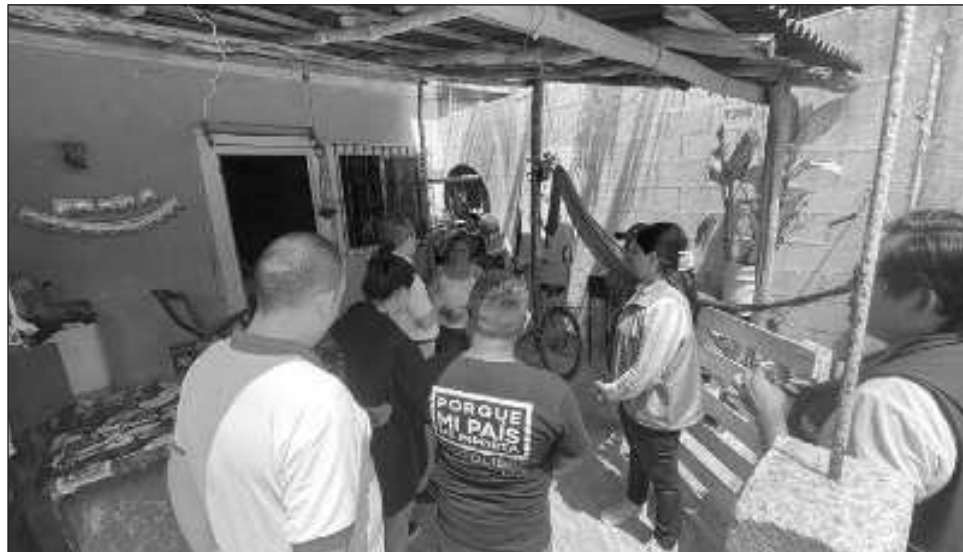
▲ Hay secciones donde tiene 80 insaculados y sólo han encontrado a cuatro personas que pueden y quieren ser funcionarios de casilla, cuando necesitan 13 mínimo.

Precisó que hay secciones donde tiene 80 insaculados y sólo han encontrado a cuatro personas que pueden