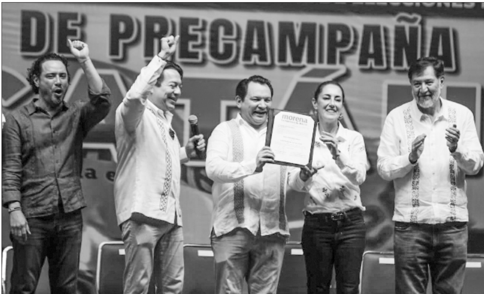
▲ "Sheinbaum visitará Tizimín, Progreso y Umán, donde Morena Yucatán se ha carcomido por dentro. En esos escenarios se percatará que, en efecto, aquí no es prioridad para su partido. Una de las evidencias de ese desamparo será cuando vea cómo el Huacho ha criticado el sistema de salud federal".