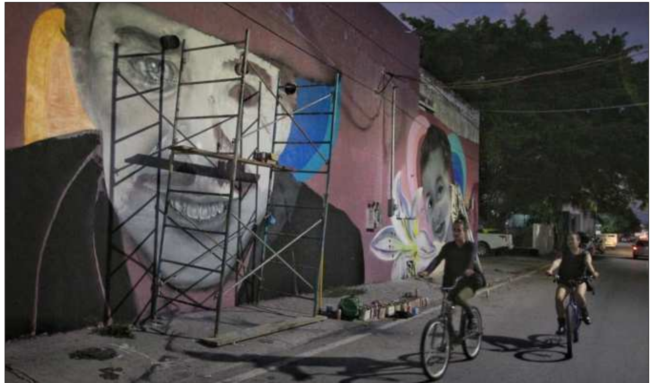
▲ La deuda subnacional incluye tanto las obligaciones financieras contraídas por los gobiernos estatales y municipales, así como aquellas contratadas por los entes públicos de ambos órdenes de gobierno.

El concepto de "deuda subnacional" incluye tanto las obligaciones financieras contraídas por los gobiernos estatales y municipales, así como aquellas contratadas por los entes públicos de ambos órdenes de gobierno y al final