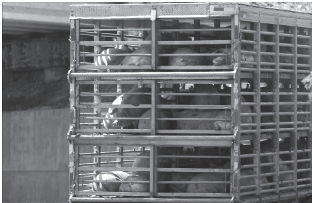
▲ El Senado de la República advirtió sobre presuntas irregularidades en las que incurrir grandes empresas que aprovechan la tradición del criadero de cerdos y operan de manera arbitraria.

Recientemente se publicó en el DOF el convenio de colaboración entre el estado y diversos entes estatales y federales que establece acciones para evitar más impactos negativos a causa de la operación de granjas de cerdos en el estado.