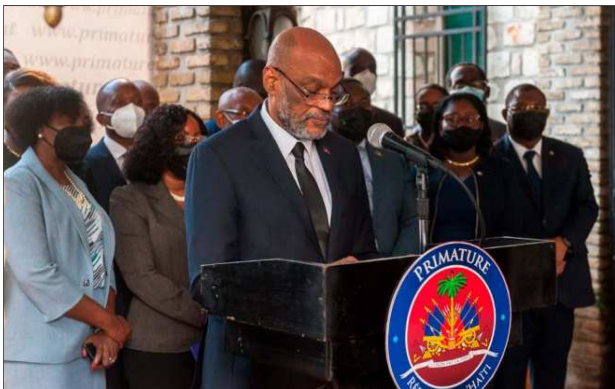
▲ La renuncia de Ariel Henry se produjo tras una reunión de emergencia sobre Haití, convocada en Kingston por la Comunidad del Caribe y a la que asistió el secretario de Estado de Estados Unidos, Antony Blinken.

"Esperamos una tregua, pero la situación en Puerto Príncipe es difícil desde hace tiempo, incluso antes de las dos últimas semanas", declaró a la prensa.