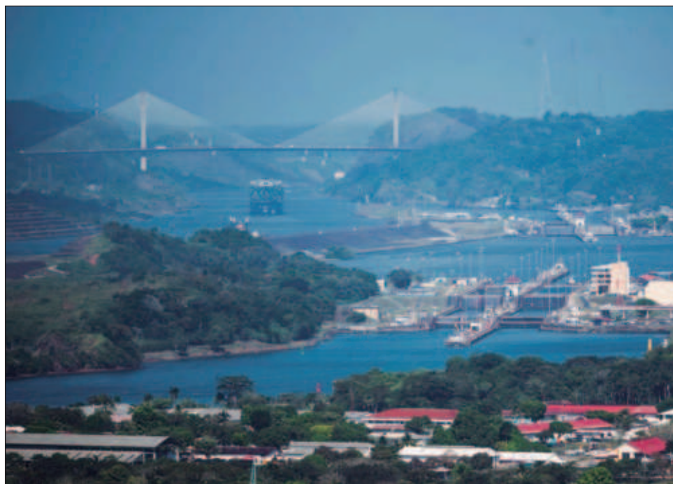
▲ Se ha reducido el calado de los barcos que pueden transitar, lo que ha provocado que lleven menos carga para poder usar esta vía; sin embargo, la situación de los lagos ha mejorado.

Pero los lagos se han visto mermados por la escasez de lluvias producto del fenómeno de El Niño, agra-