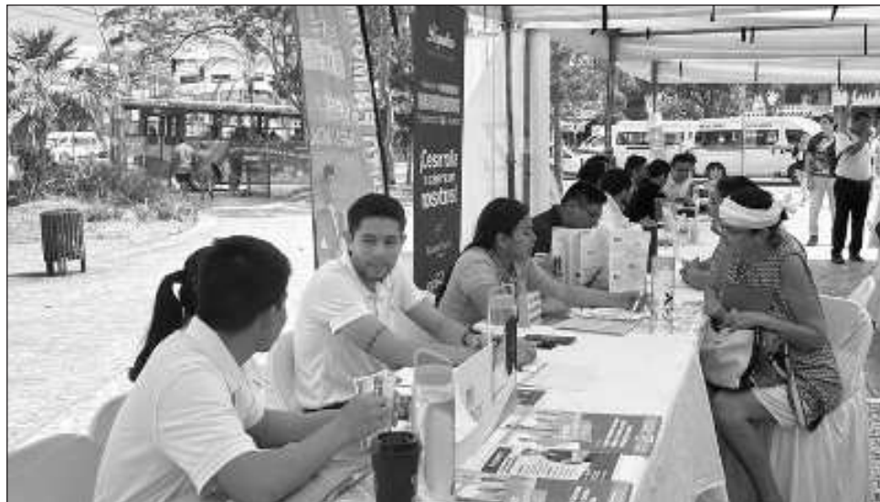
▲ En el parque El Crucero se dieron cita más de 20 empresas, la mayoría del sector turístico, en busca de cubrir sus vacantes, la mayoría enfocada al área operativa.

“Ahorita nosotros estamos enfocados en el área operativa, tenemos vacantes desde operador de transporte, cantinero, capitán de meseros, igual en la parte de supervisión, ahorita como estamos en pronta apertura de un nuevo hotel dentro del complejo estamos ya al