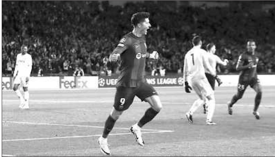
▲ Robert Lewandowski celebra tras anotar el tercer gol del Barcelona ante Napoli.

La Liga de Campeones asoma como la última oportu-