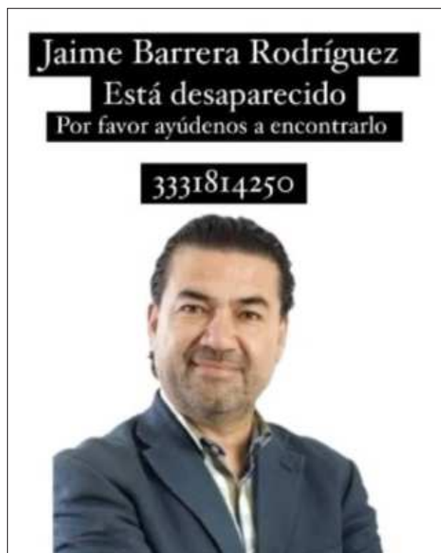
▲ La fiscalía estatal realiza las investigaciones sobre el presunto secuestro; bajo sospecha un grupo armado.