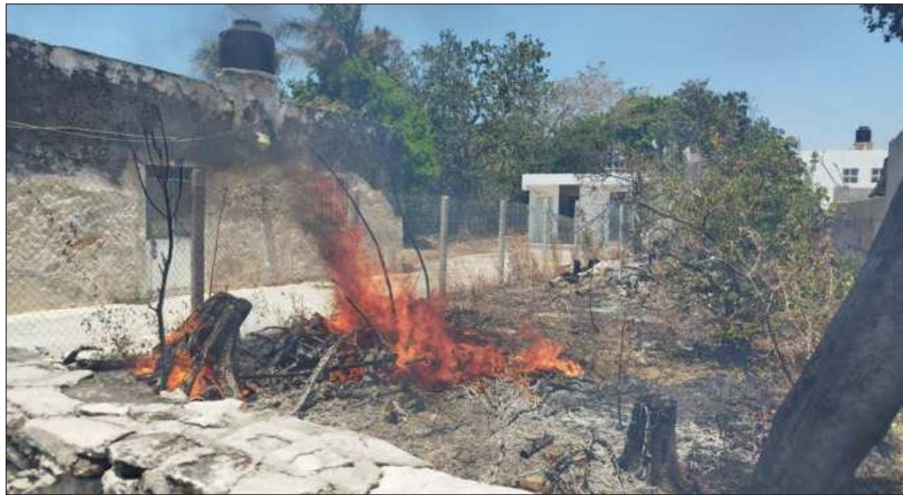
▲ Los terrenos baldíos son los puntos más sensibles. sobre todo los que ya son conocidos como parte de la propiedad de organismos federales, como el de la Semar, donde recientemente se construyó el nuevo hospital naval.

Los terrenos baldíos son los puntos más sensibles, sobre todo los ya conocidos que son propiedad de organismos federales como la Secretaría de Marina (Semar) en el norte de la ciudad y donde recientemente se construyó el nuevo hospital naval pero