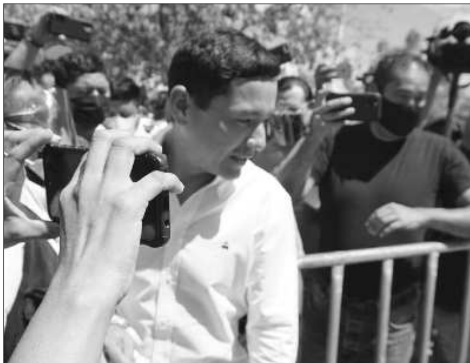
▲ En el caso del ex alcalde, las acusaciones no han perdido vigencia, las investigaciones continúan y tendrán su resultados hasta desahogar todo el proceso enmarcado en el Código Penal.

Pues en este entendido dijo que "la ley penal no se antepone a la ley electoral, aunque eso está actualmente en debate, y hoy es claro que los ciudadanos buscan respuesta a lo que se acusa, a la falta de trabajo, pues todos están más informados gracias a las herramientas a la mano, sin embargo la ley es la ley, y debe atenderse como tal". De todos modos, en el caso del ex alcalde, las acusaciones