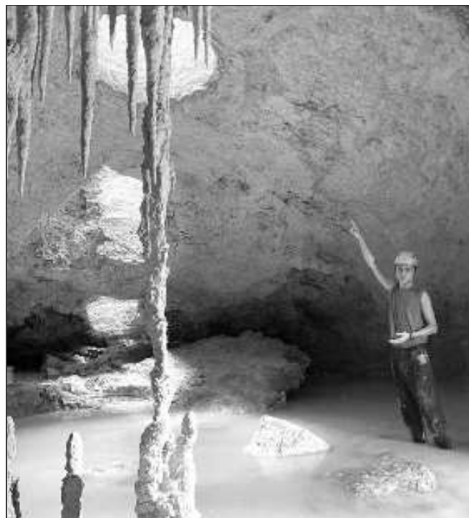
▲ Amparo únicamente podrá frenar las obras en tanto pueda demostrarse que éstas tienen un impacto ecológico mayor al previsto o que se ha incumplido la condición de no rellenar cavernas y cenotes.

En todo caso, lo mejor que pueden hacer es establecer medidas preventivas, aunque el riesgo de daño al ambiente siempre existirá. La resolución del Tribunal se funda precisamente en que "no obran en autos constancias de que hayan sido cumplidas a cabalidad tales condicionantes"; es decir, el juez