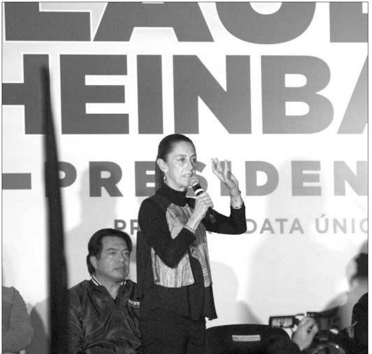
▲ La agenda de la candidata presidencial incluye eventos en Felipe Carrillo Puerto, Playa del Carmen y Cancún.

Ella estará presente en un foro sobre turismo que se llevará a cabo en la Universidad Anáhuac Cancún a partir de las 8 horas.