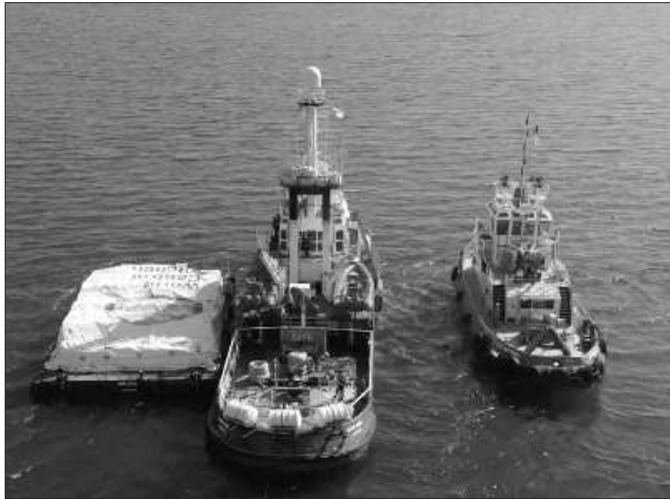
▲ Open Arms junto con otra organización World Central Kitchen, reunió más de 200 toneladas de comida y agua. Su "objetivo es abrir un corredor humanitario marítimo a Gaza, una nueva vía que permita la entrada continuada de alimentos y enseres de primera necesidad a la Franja".

Open Arms es una organización civil que lleva desde el año 2015 utilizando sus escasos recursos económicos y materiales para socorrer en alta mar a los migrantes que intentan llegar a suelo europeo a través de pequeñas embarcaciones de madera, con las que intentan llegar desde el continente africano hasta algún punto de Europa, sobre todo de los puntos más próximos de España -Islas Canarias, Cádiz o Málaga- o de Italia, sobre todo la isla de Lampedusa. El surgimiento de Open Arms fue a raíz de que en el año 2013 ocurrió uno de los hechos más trágicos de esta zona fronteriza: