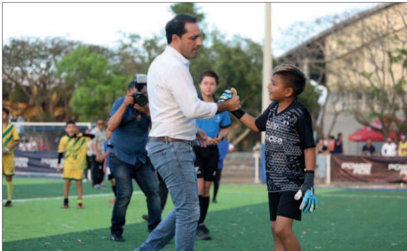
▲ Desde el campo 3 de fútbol, que es una de las canchas que entregó recientemente, Vila Dosal dio la patada inicial de este torneo que se llevará a cabo del 5 de marzo al 13 de junio, en el que el talento yucateco podrá ser captado.

“Con la Super Liga Gobernador 2024, ya se tiene