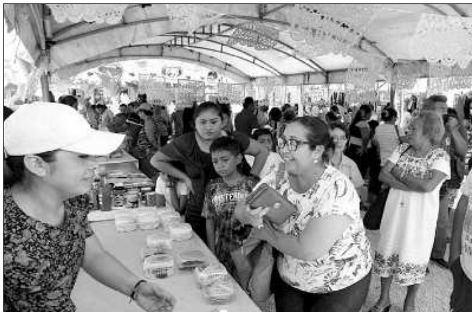
▲ Destacan el bazar de artesanías, funciones de teatrino, juegos de serpientes y escaleras, lotería y la actuación de la banda de marcha Muuk' Báalam.

De acuerdo con lo programado, este fin de semana, tocó en los puertos de Chuburná, Chelem, Chicxulub y Progreso; el próximo 18 y 19 de marzo, estará en El Cuyo, y cerrará en Sisal el 25 y 26 del mes en curso.