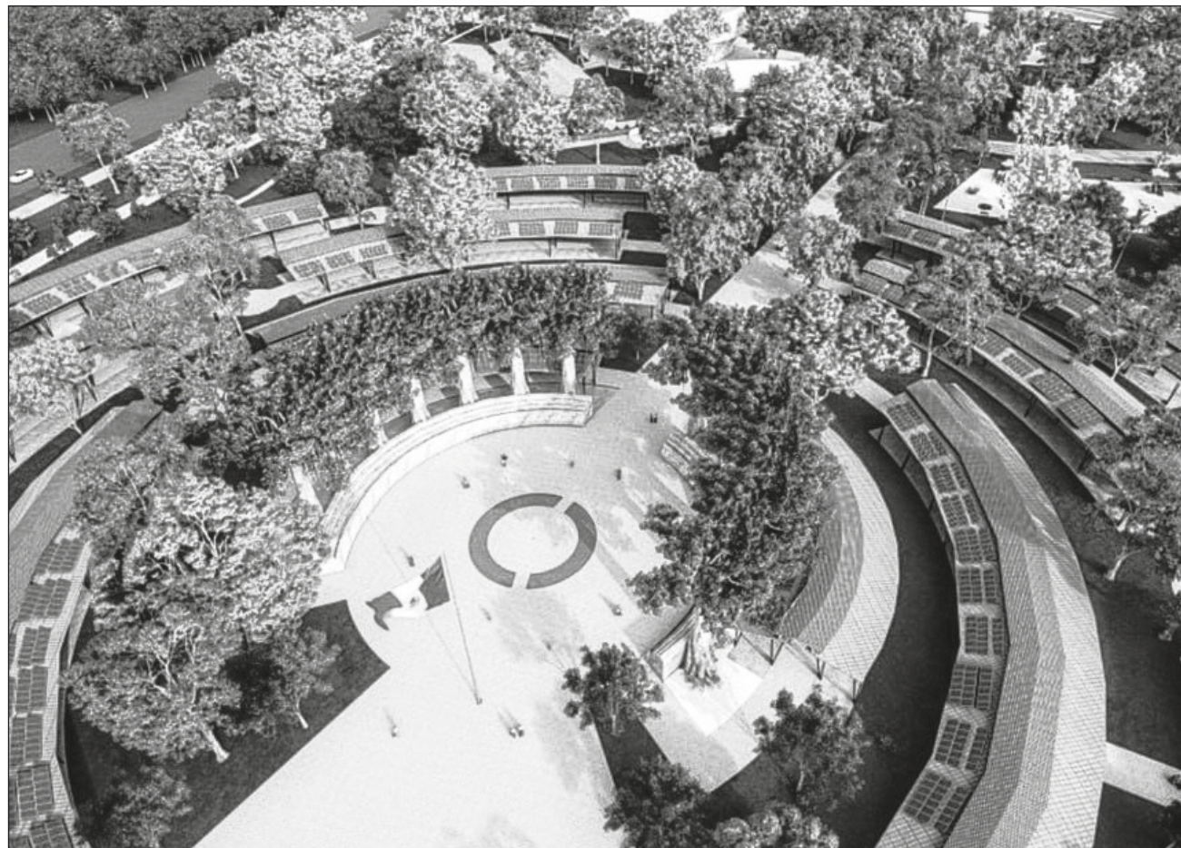
▲ El gobierno estatal presentó las maquetas del Parque Quintana Roo, que incluye instalaciones para la nueva Expofer Chetumal; será un espacio de esparcimiento para los habitantes de la capital, celebró Mara Lezama.