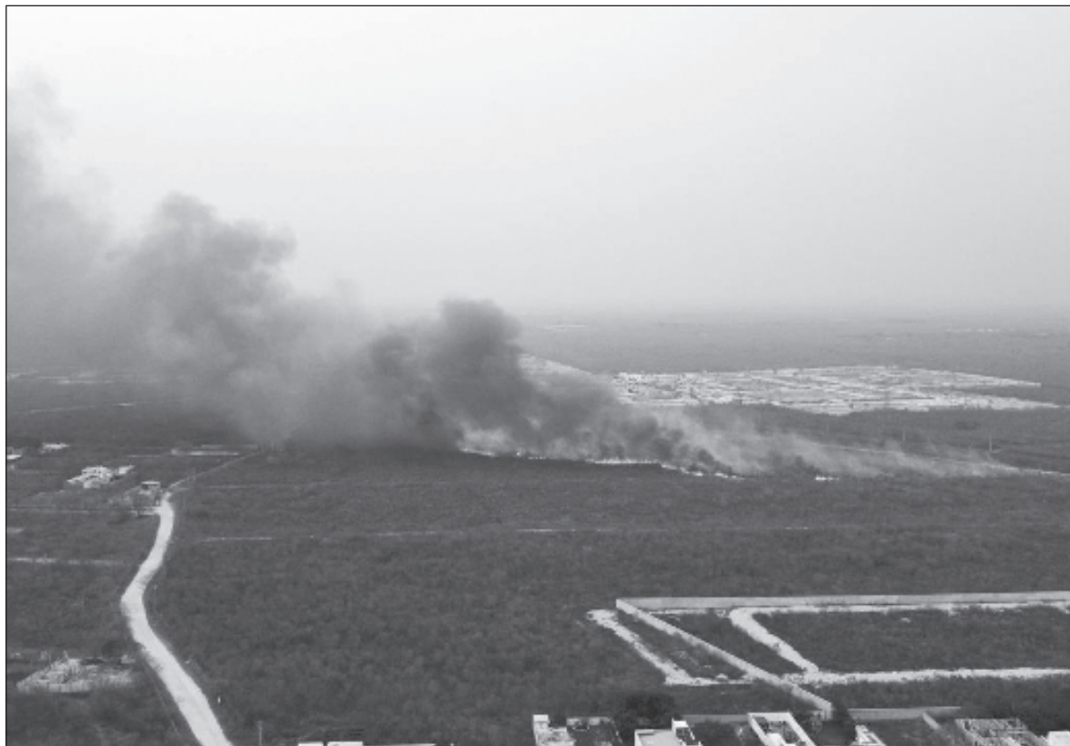
▲ “Con la espera de que se acabe el incendio, se disipe el humo, también espero que el ayuntamiento de Mérida no ignore los impactos (...) y que no ignore a la población que ha enfermado debido a esta contingencia sanitaria”.

DESDE MI EXPERIENCIA personal, como estudiante que cursó las clases en línea a lo largo del confinamiento por la pandemia de Covid-19, la vuelta a clases de manera presencial fue una experiencia agradable que compartí con compañeros y profesores. La vuelta a clase por vía remota me resulta