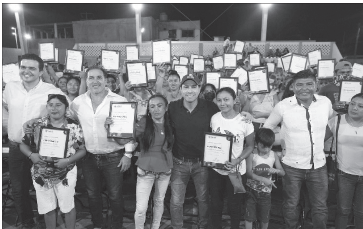
▲ "A las 6 de la tarde de ese jueves, decenas de familias recibieron las constancias de propiedad de los terrenos en los que habitan; tuvieron en sus manos esa abstracción que se llama certeza jurídica."