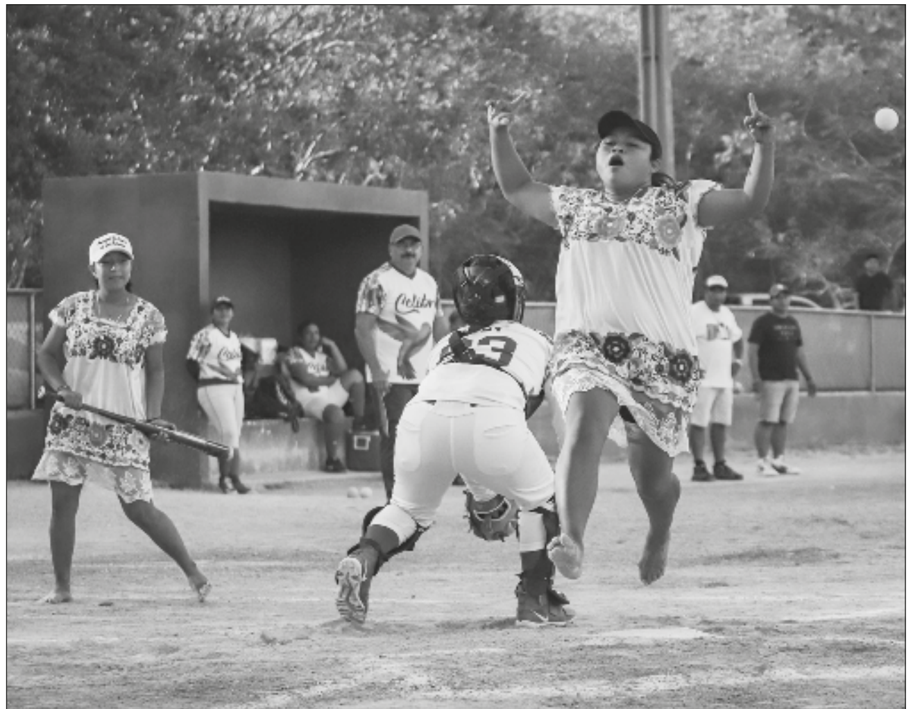
▲ El campo de la Unidad Deportiva Riviera Maya fue testigo del partido amistoso de softbol entre las Amazonas de Yaxunah y las Colibríes de Playa del Carmen. Con un marcador de 23

carreras a 17, el equipo femenino de la comunidad yucateca se impuso llevándose el aplauso y el reconocimiento de los playenses que se dieron cita al encuentro.