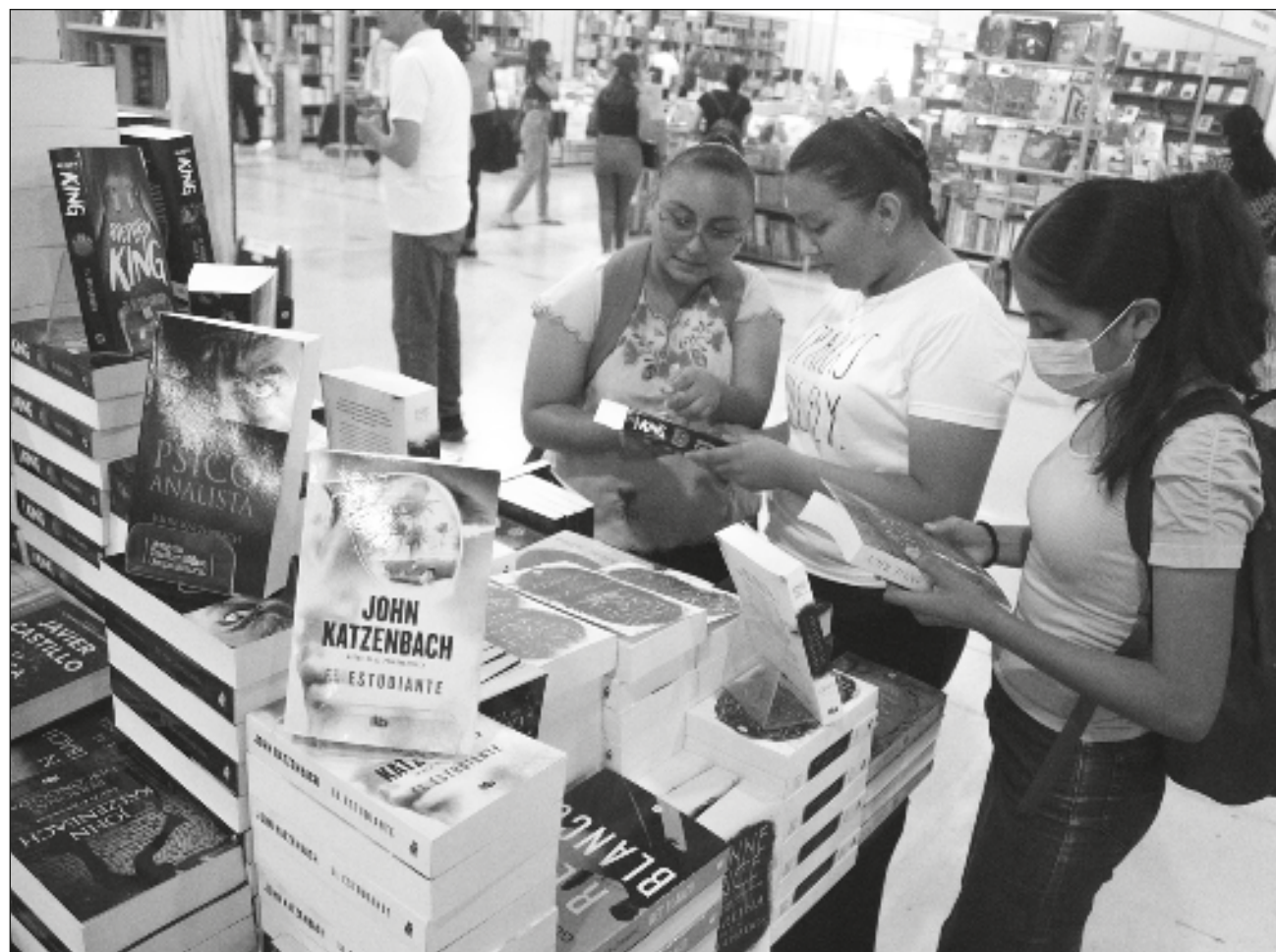
▲ El sábado comenzó la Feria Internacional de la Lectura Yucatán (Filey) 2023, considerada el evento cultural más importante de la península. Serán siete días de fiesta, con actividades que incluyen

presentaciones musicales, conferencias y conversatorios, así como dinámicas para niños. El evento continuará hasta el 19 de marzo, en Centro de Convenciones Siglo XXI.