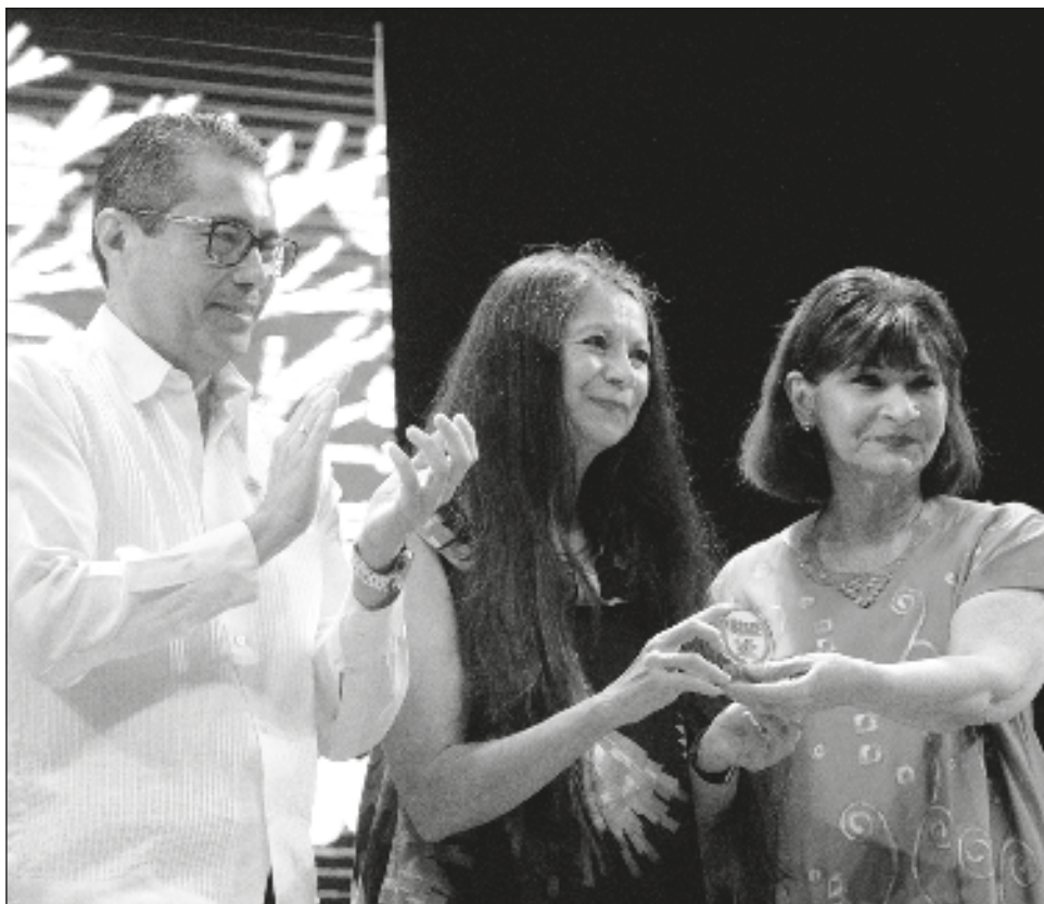
▲ Al recibir el galardón a la excelencia en las letras, Carmen Boullosa destacó que la “nueva ola” que arropa a la literatura lo hace sin orillar o desplazar.

Tras agradecer la condecoración y manifestar su dicha por encontrarse en Mérida, la escritora Carmen Boullosa dedicó el galardón “a la