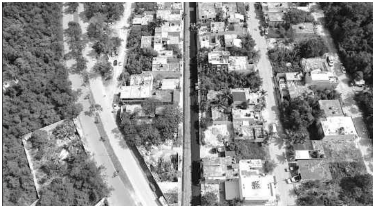
▲ La Segunda Sala de la Suprema Corte de Justicia de la Nación declaró la invalidez de las unidades de gestión territorial sustentable correspondientes al Corredor Yalkú-Akumal, Corredor Akumal-Xel Há, Xel Há-Punta Cadena, Zona Suburbana Sur del Centro de Población Tulum, Pino Suárez y Manglares de Pino Suárez.

Dijo que el PMOTEDEUS tiene muchos errores y emana de una Ley de Asentamientos Urbanos Estatal que fue creada de una idea híbrida entre la Ley de Asentamientos Urbanos y la Ley General de Equilibrio