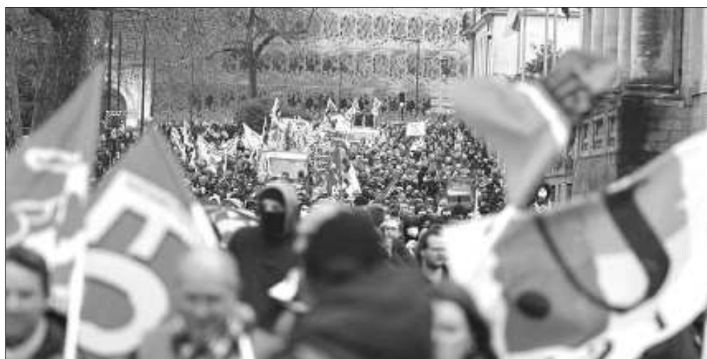
▲ El Ejecutivo ha respondido a este malestar generalizado haciendo oídos sordos.

Si la reforma impulsada por Emmanuel Macron prospera ignorando deliberadamente la voluntad popular y sin proponer caminos alternativos para hacer viable el sistema de pensiones, no sólo su administración quedará marcada por el autoritarismo, sino que el carácter democrático del Estado francés quedará entredicho, pues ningún sistema político que tome decisiones a contrapelo de los deseos de las mayorías puede merecer el nombre de democracia.