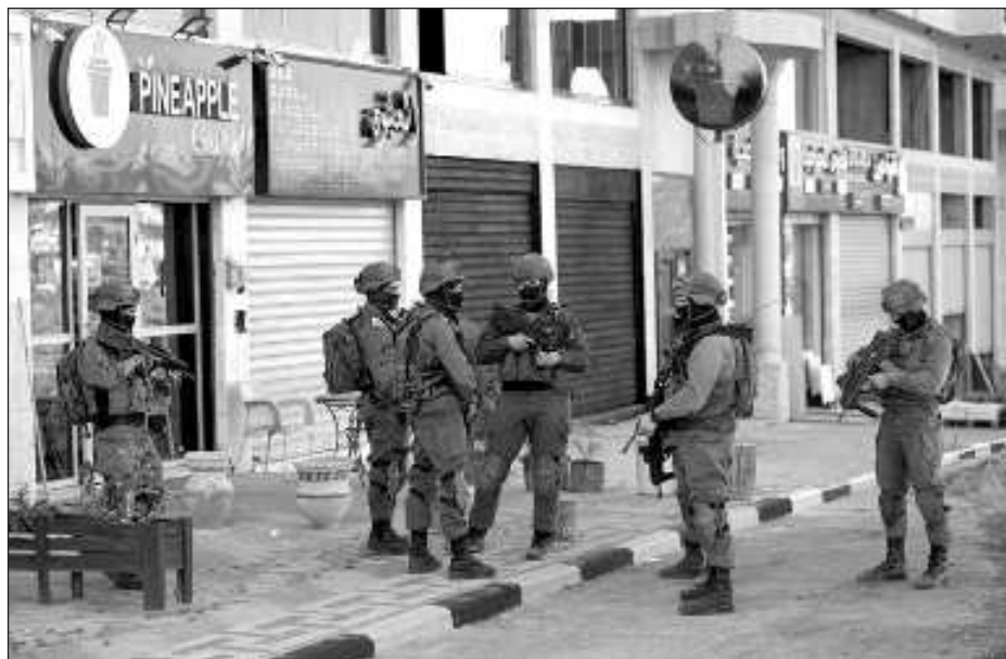
▲ El jefe del consejo local de colonos elogió al ejército por "apartar a ese escuadrón terrorista".

"Imploro a quienes dirigen este país que salgan de esta forma de negación del movimiento social", insistió su homólogo de la CFDT, Laurent Berger.