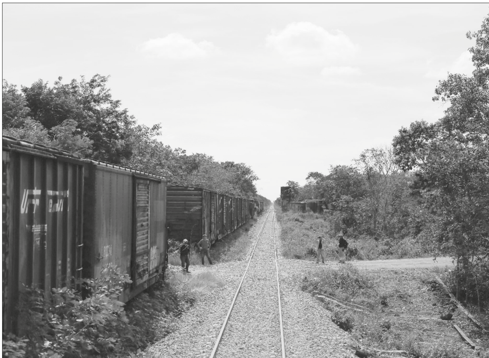
▲ Dado que Yucatán no cuenta con vegetación primaria, no se puede hablar de tala forestal, sino de conflictos entre ejidos vecinos.

Acerca de la deforestación en Yucatán, señaló que vive una situación particular, dado que no cuenta con vegetación primaria -como lo fue el henequén-, sino secundaria y únicamente hay zonas en el sur con selva, por lo que no puede hablar de tala forestal, sino de conflictos entre ejidos vecinos, dijo.