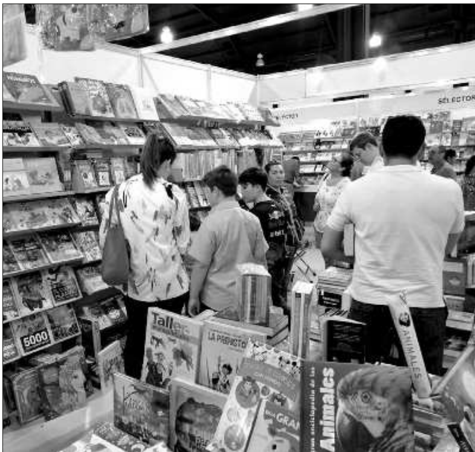
▲ El recinto presenció la visita de personas adultas, jóvenes e infantiles que asistieron a interactuar con los libros e interesarse por la lectura gracias a las actividades.

"Vemos que al público le gusta estar juntos, comentar; han estado llegando los escritores a su límite de tiempo".