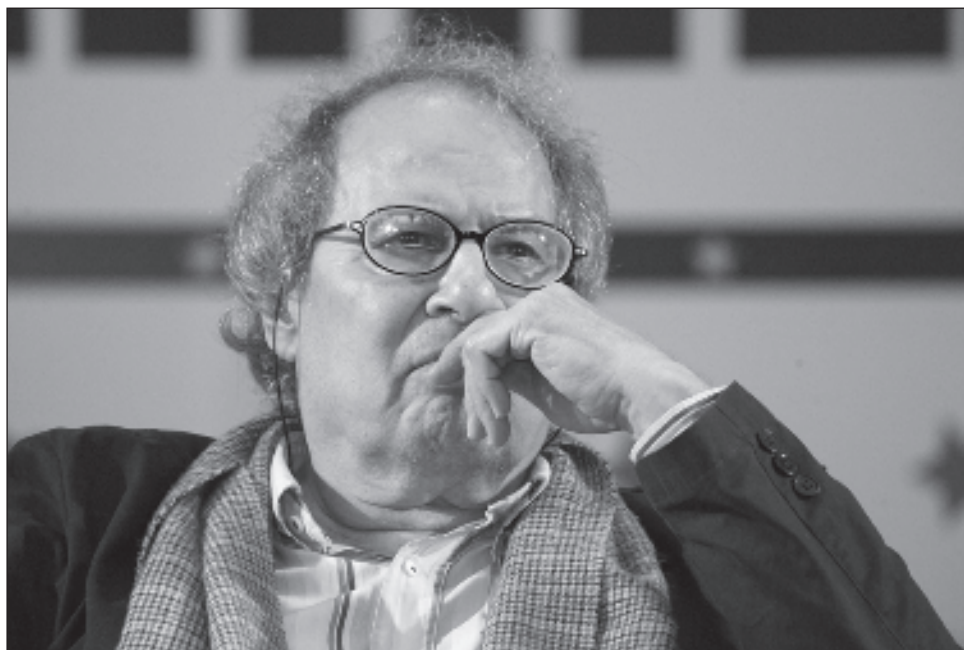
▲ Manjarrez empezó a escribir el texto en la cárcel, en 1970, labor que continuó durante muchos años hasta que lo terminó en 2019.