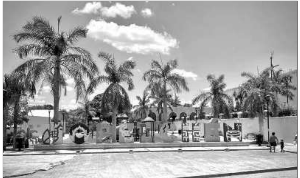
▲ Las localidades deben poseer "leyendas, historia, hechos trascendentales, cotidianidad, magia que emana en sus diversas manifestaciones socio-culturales".

El titular de la Secretaría de Turismo de Campeche, Mauricio Arceo Piña, destacó que la entidad debería tener al menos ocho espacios considerados Pueblo Mágico, esto considerando a Palizada e Isla Aguada, los dos ya considerados en el estado, siendo el primero Palizada