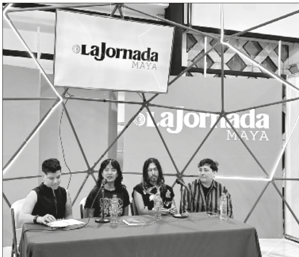
▲ La cúpula de La Jornada Maya en la Feria Internacional de la Lectura Yucatán recibió los testimonios de tres personas que eligieron ser de género neutro o género fluido.

Durante una hora, los músicos deleitaron al público con su versatilidad que navega entre el rock, el punk y un poco de sicodelia.