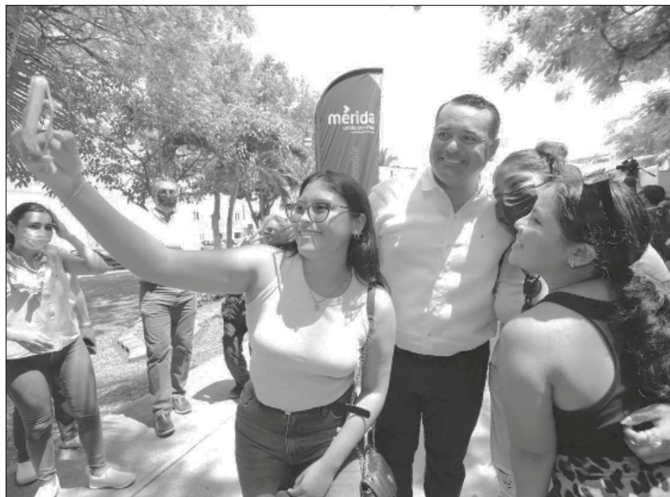
▲ La clausura y entrega de constancias a los egresados de la quinta generación del programa Soy parte de los 100 se realizó en el Centro Municipal de Emprendedores.

Recordó que la creación del Centro Municipal de Emprendedores (CME) ha contri-