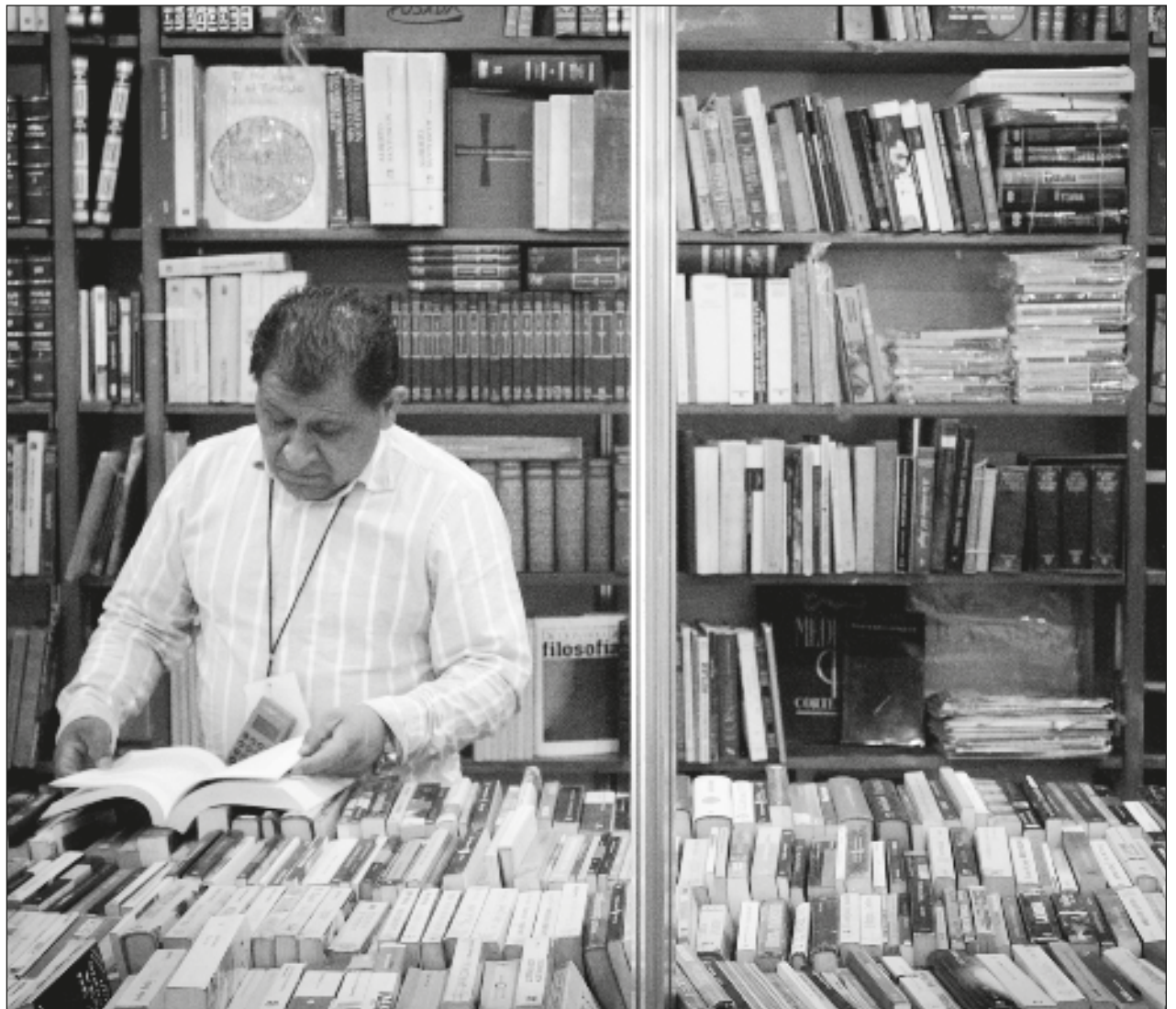
▲ Te'e ka'ap'éeel k'iino'ob máano'oba' ch'úunsa'ab Feria Internacional de Lectura Yucatán, tu kúuchil Centro de Convenciones Siglo XXI, chochobkil úuchik u cha'anta'al.