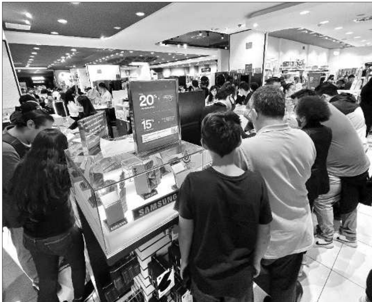
▲ Todo indica que el alza de tasas de interés no ha mermado la demanda de nuevo financiamiento de los consumidores.

De acuerdo con cifras oficiales del BdeM, al cierre del primer mes del año el portafolio de los créditos al consumo alcanzó un saldo de un billón 214 mil 471 millones de pesos, un incremento a tasa anual de 17.6 por ciento en términos nominales, es decir, sin contar la inflación del periodo. Lo anterior supone el nivel más alto desde que el banco central tiene registros (1995).