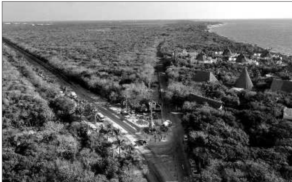
▲ “Buscamos distribuir todo en dos accesos principales: el sur (que tiene un avance de 10 por ciento en proceso de cimentación) y el acceso centro o central (ubicado en la avenida Cobá) que va a ser otro acceso principal”, destacó Román Meyer Falcón.

Sobre el tercer acceso, indicó que consistirá en construir un puente que va a cumplir con todos los lineamientos de la Secretaría de Infraestructura, Comunicaciones y Transportes (SCT), pero va a ser una infraestructura que solamente servirá