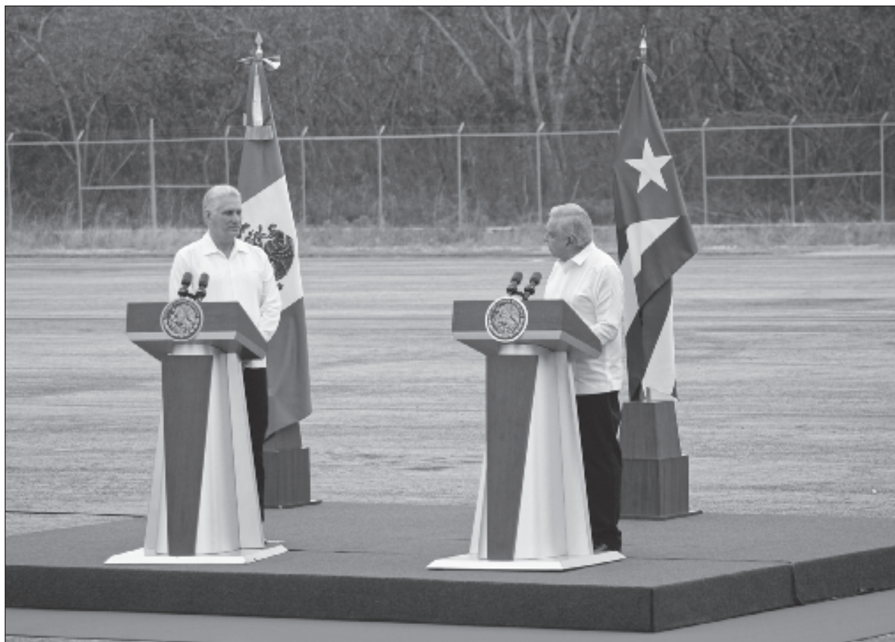
▲ Minutos antes, alrededor de las 9 horas, Andrés Manuel López Obrador llegó también al Aeropuerto de Campeche, donde abordó una aeronave de la Fuerza Aérea Mexicana para dirigirse a Villahermosa, Tabasco.

Minutos antes, López Obrador llegó también al Aeropuerto de Campeche, donde abordó una aeronave para dirigirse a Tabasco.