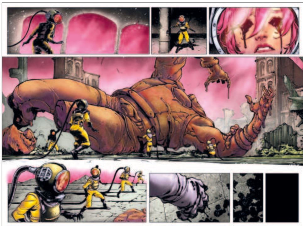
▲ A Darker God ( Un dios más oscuro) es una serie de ciencia ficción que se relanzará en Estados Unidos, a través de la clásica Heavy Metal Magazine.