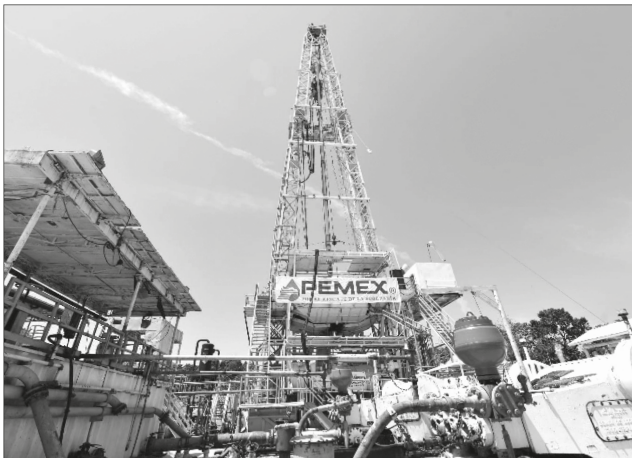
▲ La petrolera presentó dos avalúos donde cotiza hectáreas como agrarios y comerciales.