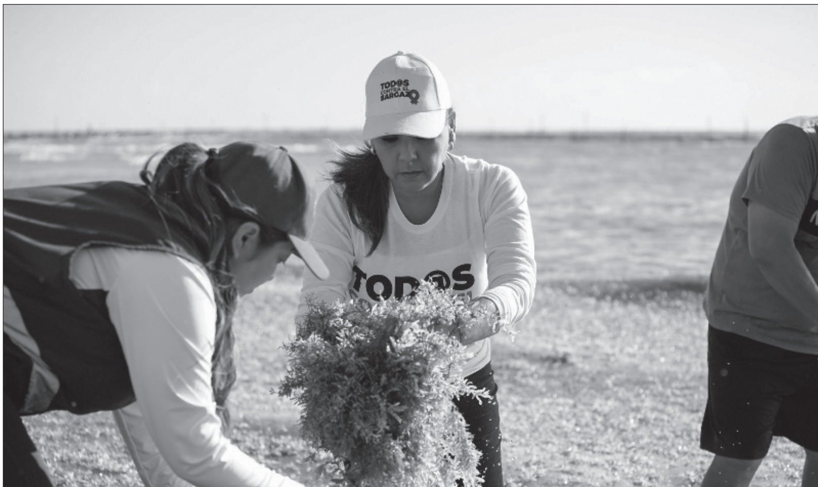
▲ De las 80 playas que monitorea la red de sargazo, 40 presentan arribo excesivo, desde playa Coral, en Cancún, hasta el arco de Sian Ka'an.

Este año, al iniciar la temporada, se tienen reportes de que en los últimos tres días más de 190 toneladas han llegado a la zona sur, incluyendo Xcalak, Mahahual y el sur de Punta Herrero. “No podemos impedir la llegada de sargazo, es un fenómeno natural debido al cambio climático. Lo que sí podemos hacer es ponernos las pilas y tomar la iniciativa”, exhortó la mandataria.