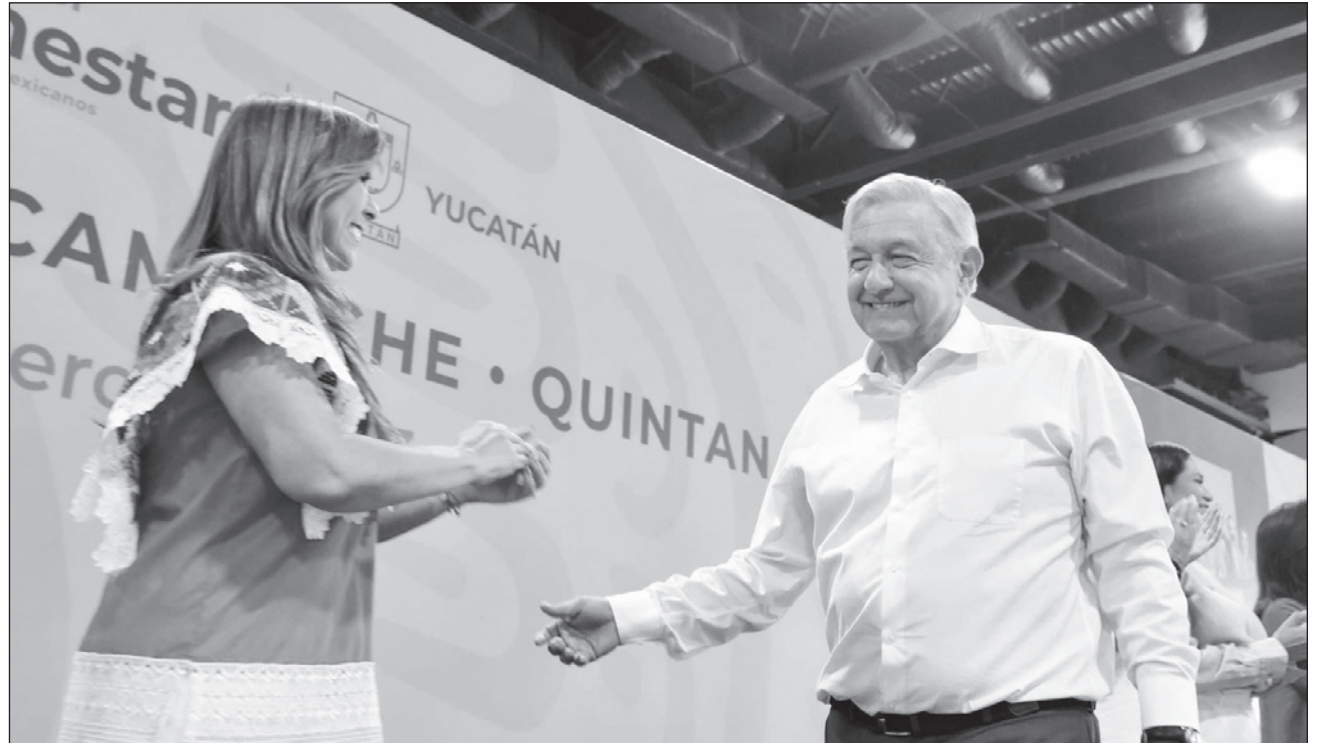
▲ El presidente Andrés Manuel López Obrador y la gobernadora Mara Lezama participaron en la Reunión Estatal Conjunta del Banco del Bienestar, celebrada este viernes en Mérida, la capital de Yucatán.

“Con los Bancos del Bienestar garantizaremos que las beneficiarias y los beneficiarios no se vean obligados a gastar dinero en traslado a otro municipio para recibir los apoyos con los que cuentan”, explicó la gobernadora de Quintana Roo en la reunión en la que también asistieron Mauricio Vila, gobernador de Yucatán y Layda Sansores, de Campeche.