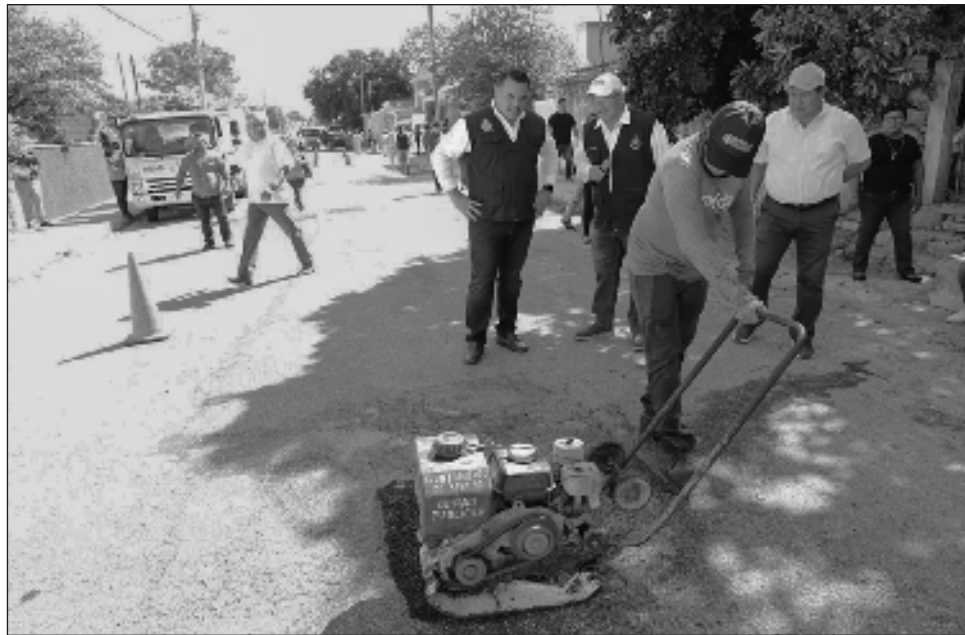
▲ El alcalde Renán Barrera señaló que trabaja para brindar a las familias un carnaval seguro y con servicios públicos de primera calidad.

Señaló que la Dirección de Servicios Públicos Municipales también realizó la limpieza de las calles por donde transitarán los carros alegóricos, que in-