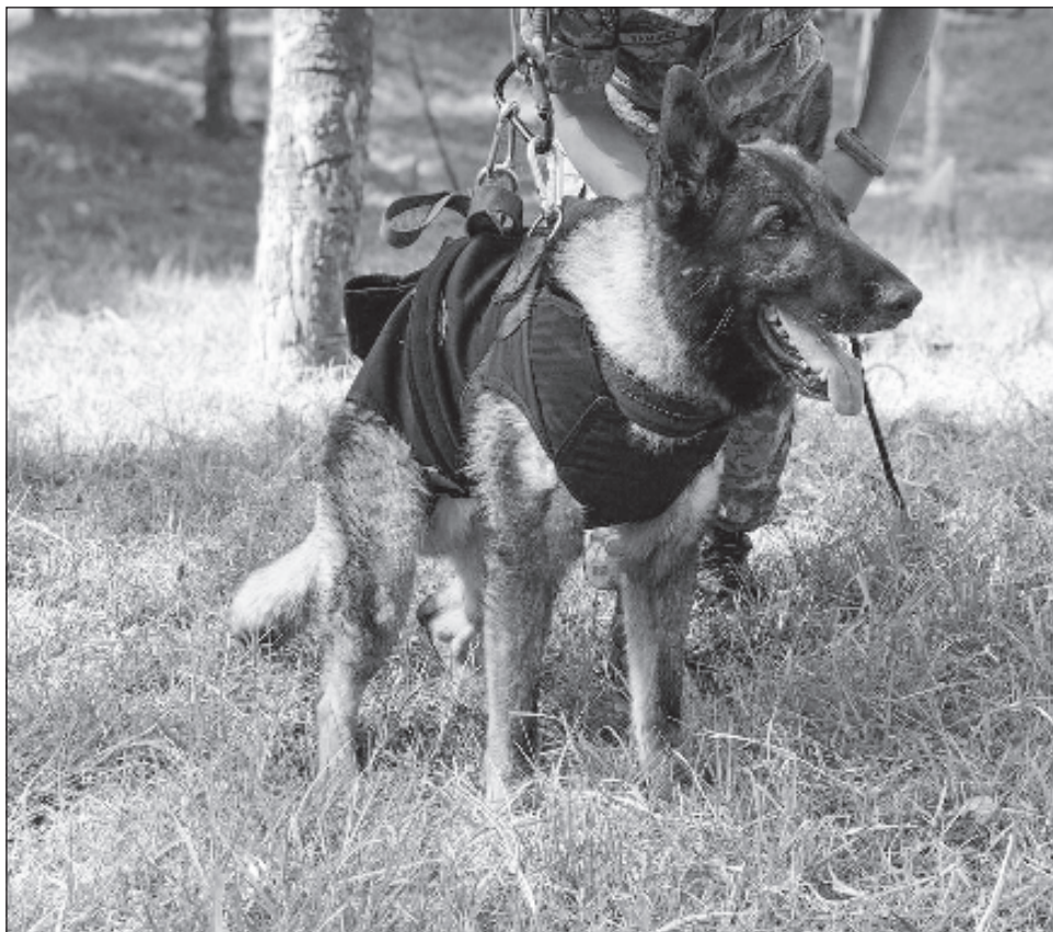
▲ La Sedena lamentó el deceso de su “gran compañero, el can Proteo”: “Cumpliste tu misión. ¡Gracias por tu heroica labor!”, escribió la dependencia en su cuenta de Twitter.

Balam, Orly, Rex, July, Timba y Ecko son otros perros mexicanos que también laboran en actividades de rescate en el país asiático. Pertenecen a la Secretaría de Marina (Semar) y a la Cruz Roja Mexicana de Puebla y Querétaro.