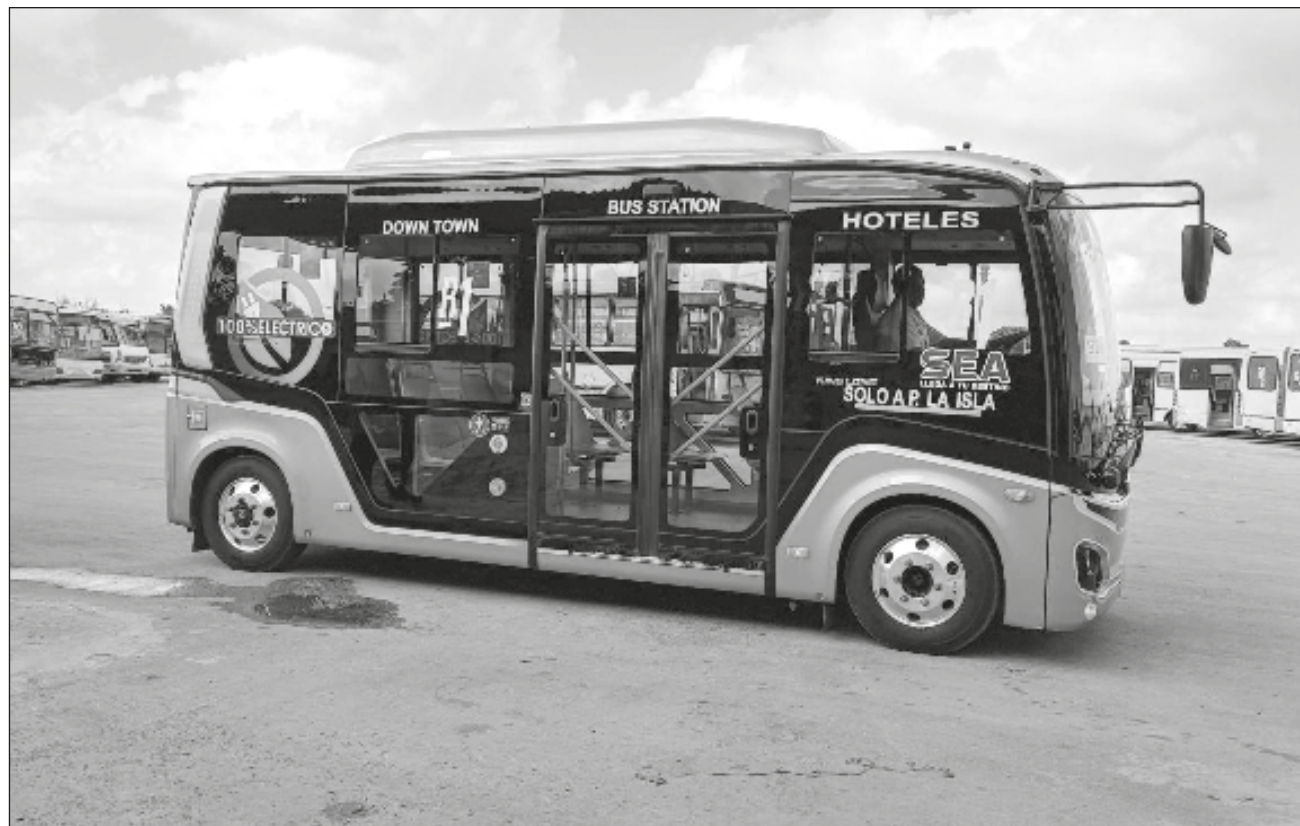
▲ El vehículo es de una marca china, con capacidad para 24 pasajeros. Actualmente circula de la zona centro hasta plaza La Isla, en la Ruta 1, haciendo tres vueltas por la mañana y tres por la tarde. El servicio es gratuito.

“Depende de los resultados de la prueba, sería muy pre-