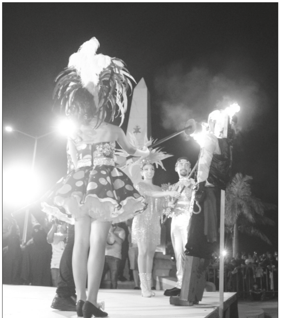
▲ Ciudadanos participaron en la quema del pirata que representa el mal humor, con lo que dieron inicio a las actividades de la festividad regional.

Y para cerrar la velada se contó con la presencia musical de Son de Mar, grupo de la dirección de Cultura de la Alcaldía de Campeche, bajo la dirección del maestro Gustavo Lerma.