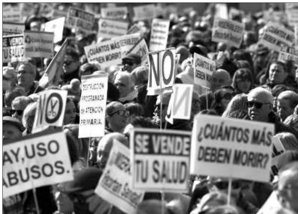
▲ La protesta congregó a 250 mil personas según las autoridades y cerca de medio millón según los organizadores, que pidieron "más recursos" al gobierno autonómico de Madrid.

La protesta congregó a 250 mil personas según las autoridades y cerca de medio millón según los organizadores, que pidieron "más recursos" al gobierno autonómico de Madrid, que está acusado de favorecer a los prestadores privados en detrimento del sistema público de salud.