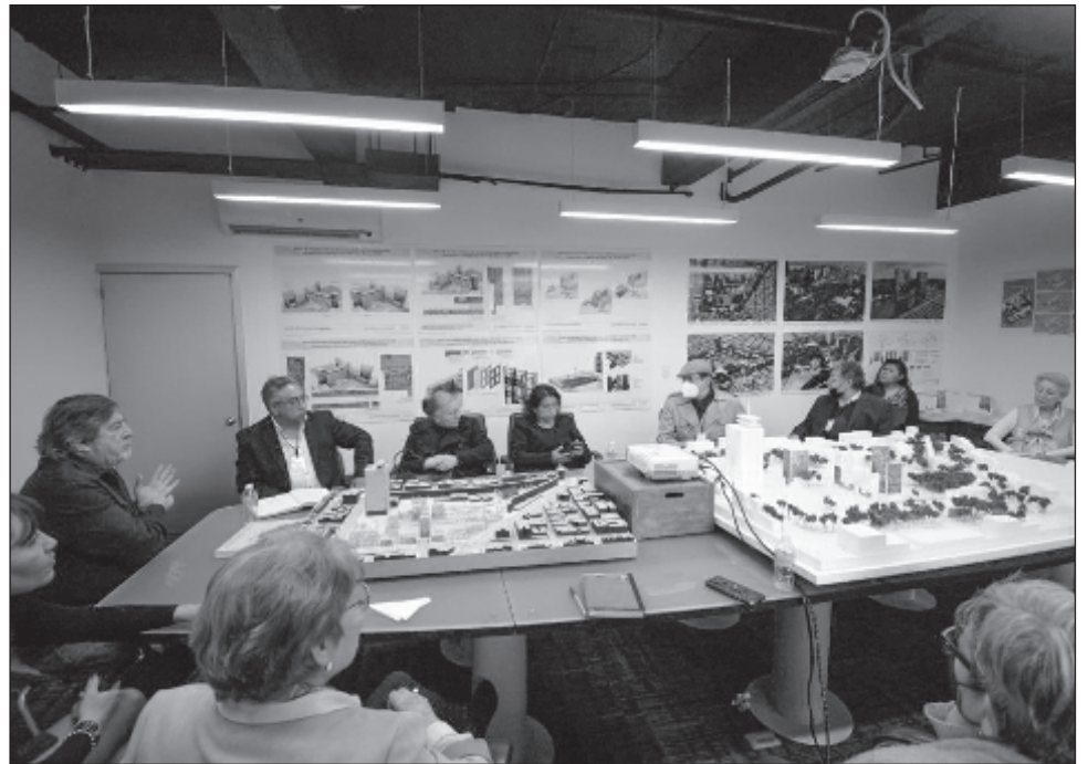
▲ El primer anteproyecto para convertir el Centro SCOP en un parque cultural al aire libre fue presentado a autoridades de la SCT y Bellas Artes.