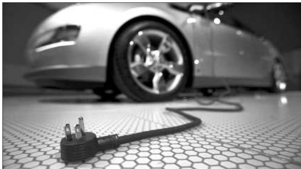
▲ La opción eléctrica se vislumbra como una opción muy atractiva para el comprador final, especialmente cuando la reducción en el costo de gasolina y mantenimiento es significativa.

Queda entonces que estamos viviendo un momento en el cual el cambio de paradigma de movilidad contempla necesariamente el cuidado al medio ambiente, pero también que todavía no hay una claridad absoluta en cuanto a los costos que la transformación del transporte tendrá en la infraestructura urbana y si nuestras autoridades están preparadas para responder al reto. Aún es tiempo de pruebas y resultará sensato que los resultados se difundan entre la ciudadanía.