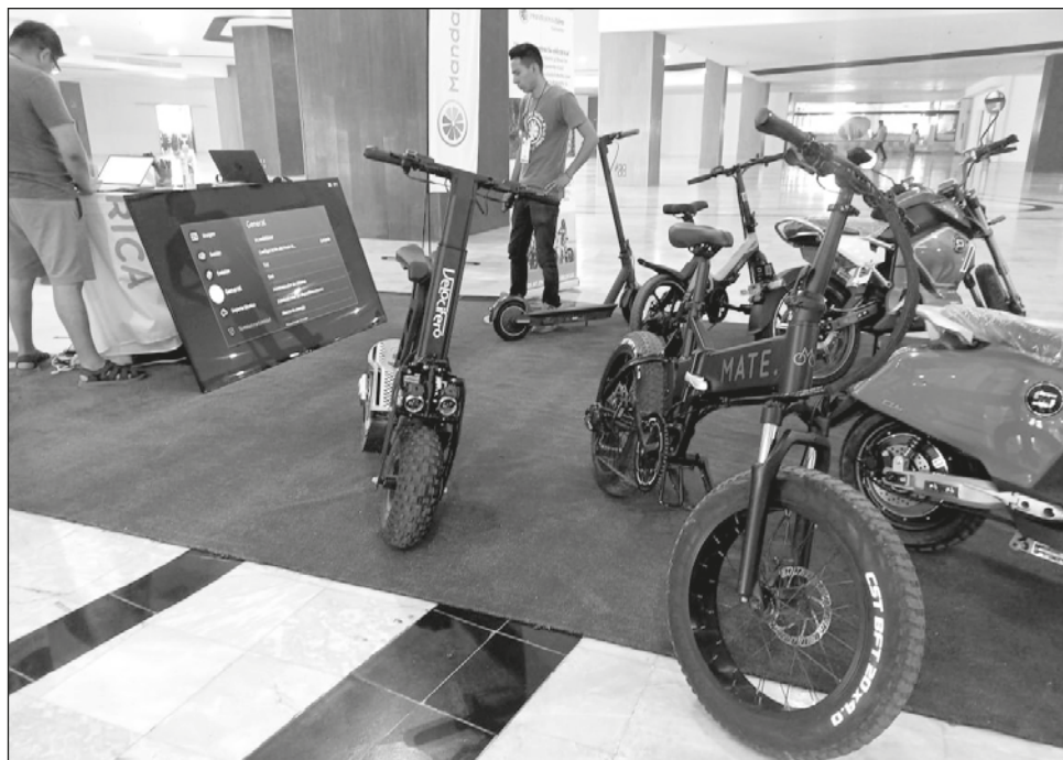
▲ Las personas buscan mejores alternativas de movilidad, que sean económicas y amigables con el medio ambiente, desde automóviles hasta scooters y bicicletas.

Esta revolución, consideró, ya se estaba identificando antes de la pandemia