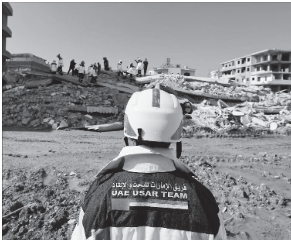
▲ La ayuda humanitaria internacional ha llegado a cuentagotas en Siria, cuyo sistema de salud e infraestructuras han sido lastrados por más de una década de guerra.

“Hasta ahora le hemos fallado a la gente del noroeste de Siria. Tienen derecho a sentirse abandonados, esperando