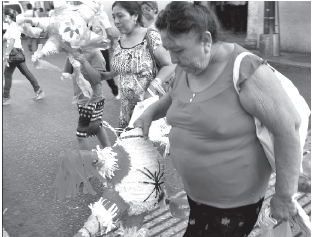
▲ "Las mujeres de comunidades rurales y países en desarrollo destinan hasta 14 horas diarias a trabajos de cuidado esenciales. Desafortunadamente, en el imaginario social aún no son valorados estos trabajos".

CUANDO HABLAMOS DE condiciones, es preciso referir no sólo a las cuestiones materiales, sino también a que los ambientes sean propicios para que las capacidades