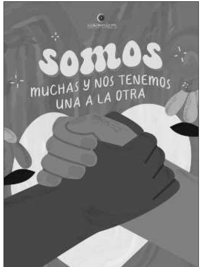
▲ Uno de los objetivos es fortalecer y brindar herramientas de análisis político y acción colectiva local.

La Escuela Feminista es gratuita, dará inicio el próximo 10 de marzo y se tiene programado concluir el 13 de mayo de 2023; las interesadas sólo tienen que registrarse antes del 1 de marzo en el link: http://ibit.ly/q4vq .