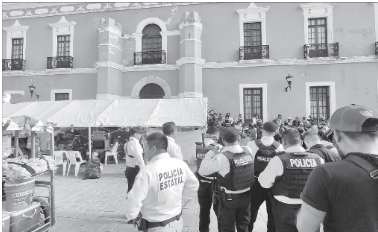
▲ Autoridades permitirán que continúe la manifestación, siempre y cuando no causen afectaciones. Los quejosos reprochan que sigue el despido de elementos policiacos, así como la falta de pago a los que ya se dieron de baja.

En medio de la gresca, diputados locales de Movimiento Regeneración Nacional (Morena) salieron de la sala de sesiones para supuestamente dialogar con los trabajadores, representantes de la comuna, así como trabajadores que querían ingresar a la fuerza al Palacio Municipal, pero solo empeoraron las cosas.