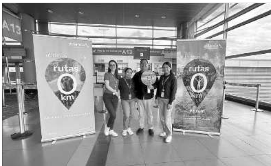
▲ El vuelo de la aerolínea Avianca con el número 94 proveniente de Bogotá, Colombia, llegó con 160 pasajeros a bordo.

Declaró que junto a él viajó de cortesía un grupo de fam trip , con la finalidad