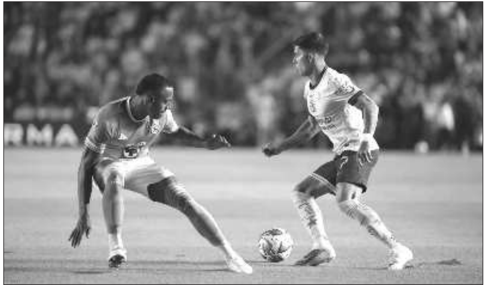
▲ El bicampeón América dejó en el camino a los dos mejores equipos de la fase regular.

"Viviremos una noche mágica con estadio lleno, no es nuestro estadio, pero nos sentimos mucho en casa", dijo Jardine. "Veamos si ha-