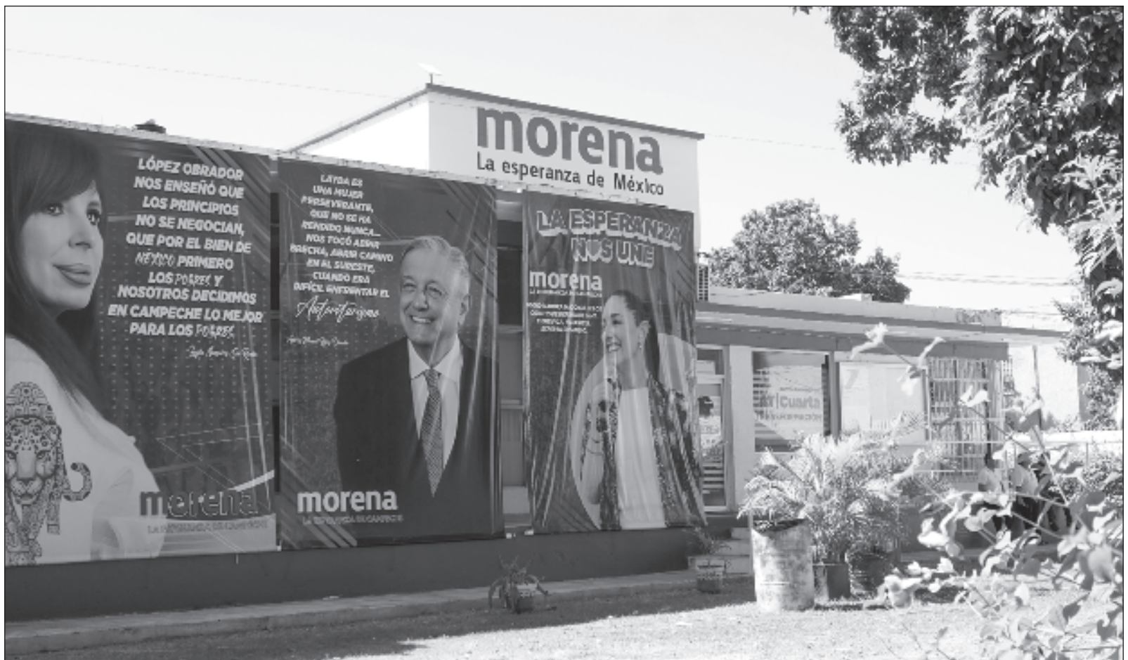
▲ "Lo tajante de sus afirmaciones se perdieron en su pragmatismo político, cuando se convirtió de facto en el rasero para medir el bien y el mal, sin importar las acciones de las personas. Así 'perdonó' y 'limpió' a muchos personajes de partidos de oposición que se sumaron a su movimiento".