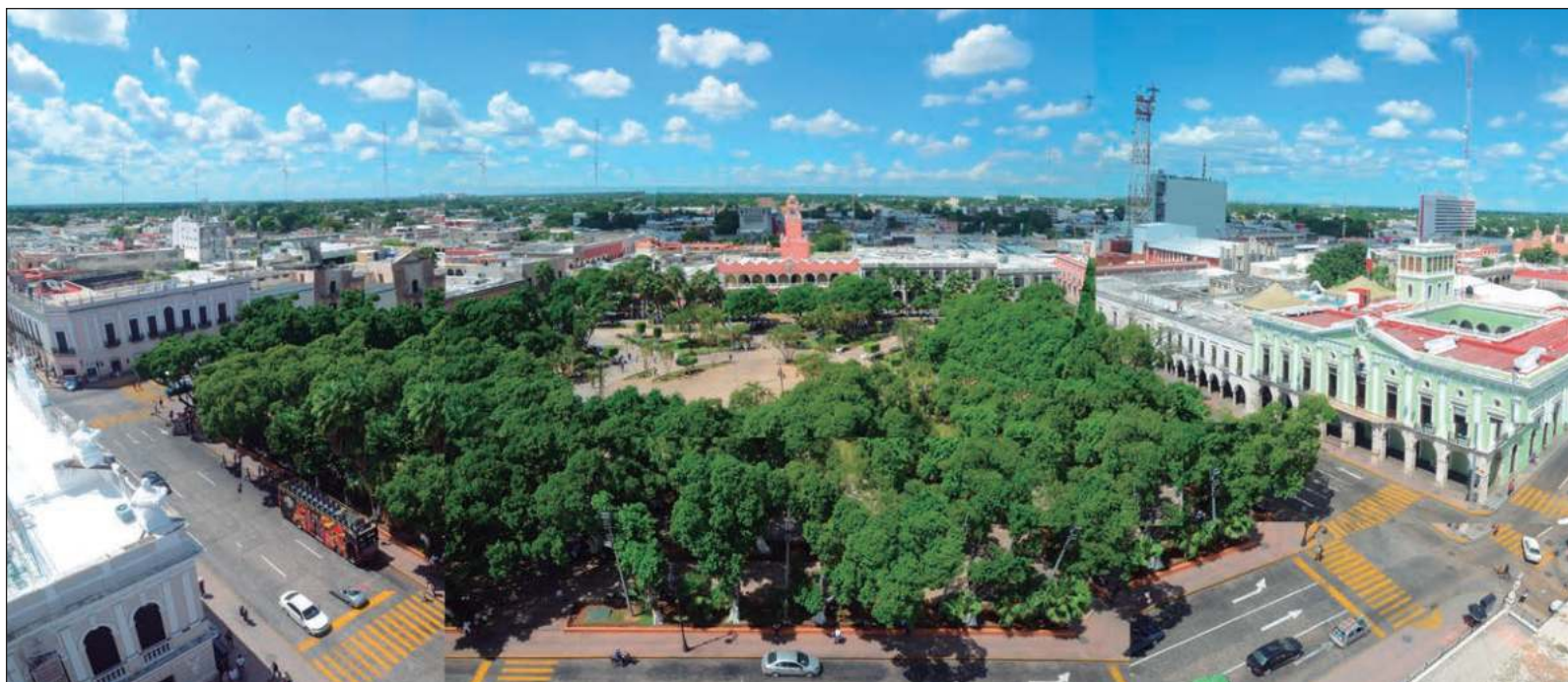
▲ “La principal incógnita radica en cómo Díaz Mena conciliará las diversas tribus que lo apoyaron para que alcanzara la victoria el pasado 2 de junio. Esta tarea se imagina en extremo complicada, toda vez que —y eso no es ni secreto ni crítica— esos grupos tienen marcadas diferencias y orígenes”.