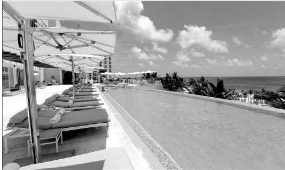
▲ La intención en esta temporada y específicamente en fechas especiales como las fiestas patrias es maximizar el incremento de la ocupación hotelera, con esfuerzos desde todo el sector.

Además, dijo, los asientos de avión que sí están disponibles son caros, por lo que se debe ponerlos a trabajar con promoción, con mercadeo y aunque el Consejo de Promoción Turística de Quintana Roo (CPTQ) está haciendo lo que puede, se requiere presencia con promoción a nivel país.