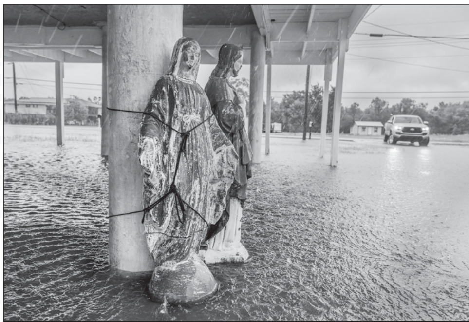
▲ Las alertas emitidas por el Centro Nacional de Huracanes para la costa de Luisiana van de Vermilion-Cameron Line hacia el este de Grand Isle; igualmente para los lagos Maurepas y lago Pontchartrain, incluida la zona metropolitana de Nueva Orleans.