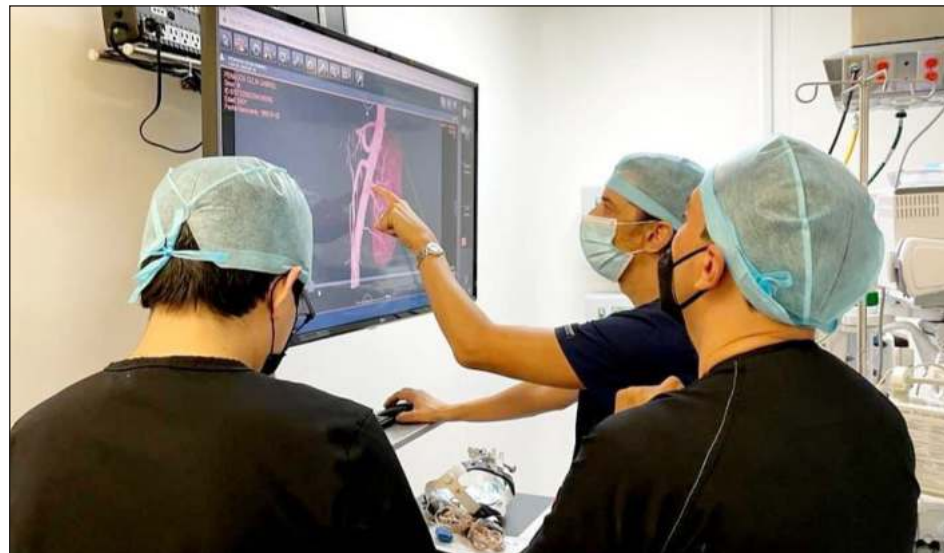
▲ De acuerdo con el jefe de Departamento Clínico de la Unidad de Trasplantes de la UMAE en Mérida, los procedimientos se realizan bajo los protocolos institucionales de traslado.

Además de los dos riñones, personal multidisciplinario del Instituto en Campeche obtuvo dos córneas que fueron enviadas a la UMAE Hospital de Especialidades Dr. Bernardo Sepúlveda Gu-