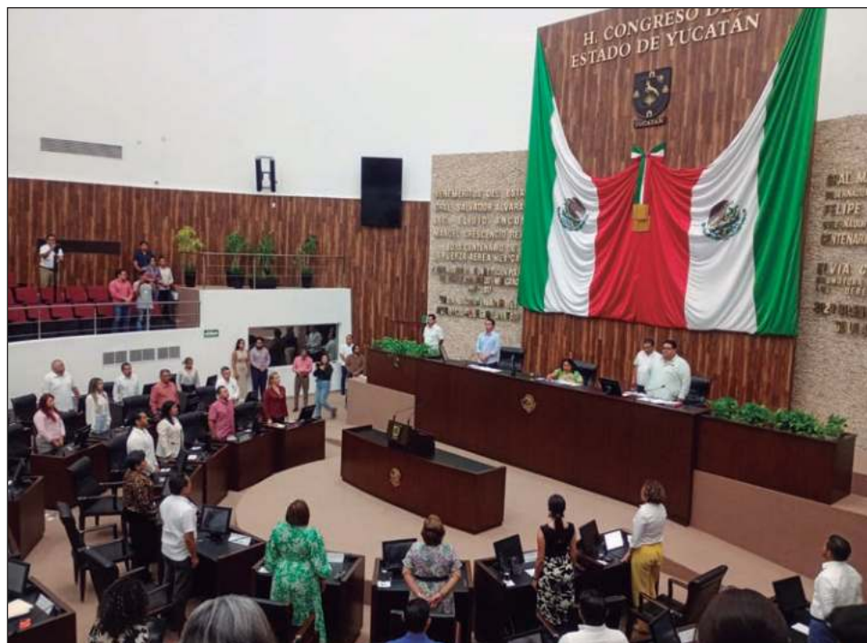
▲ Estuvieron presentes los 35 diputados, quienes votaron 19 a favor y 16 en contra.

“Hace menos de 11 días, juramos en este recinto respetar la constitución y las leyes que de ellas emanan en beneficio de la patria y la sociedad. Hoy vemos violentado este juramento ante la actitud que la mayoría ha asumido. Qué poco duró el compromiso. La amnesia se apoderó de la mayoría y hoy la pregunta es: ¿es esta la manera en la que pensamos defender a la sociedad