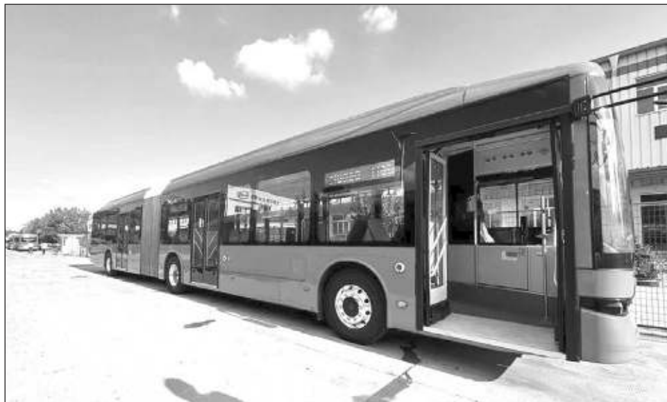
▲ Actualmente el sistema de transporte atiende a más de 23 mil usuarios al día.

La Agencia de Transporte de Yucatán (ATY) informó que cuatro nuevas unidades articuladas 100 por ciento eléctricas se encuentran trasladándose desde Qingdao, China, al puerto de Lázaro Cárdenas, Michoacán, para llegar a territorio yucateco a mediados del próximo mes de octubre y, posteriormente, realizar las acciones correspondientes para su integración a la Ruta Periférico del Va y Ven.