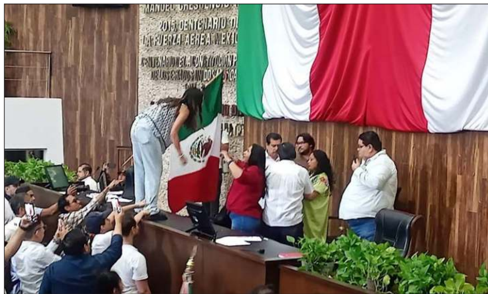
▲ Los inconformes exigen que no se aprueben las modificaciones en lo local.

Para que la reforma judicial sea un hecho es necesario que los congresos locales de al menos 17 de las 32 entidades del país aprueben el decreto. Con esto, el presidente Andrés Manuel