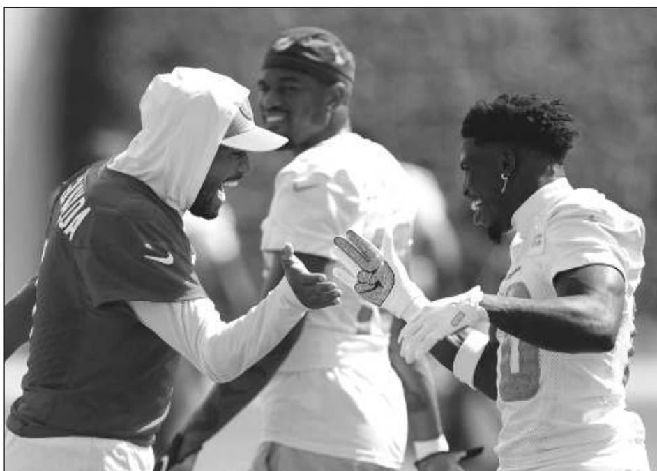
▲ Tyreek Hill (derecha) saluda al quarterback Tua Tagovailoa en un entrenamiento de los Delfines.

Además, Pittsburgh 3, Miami 1; Cleveland 6, Medias Blancas 4; Detroit 7, Colorado 4.