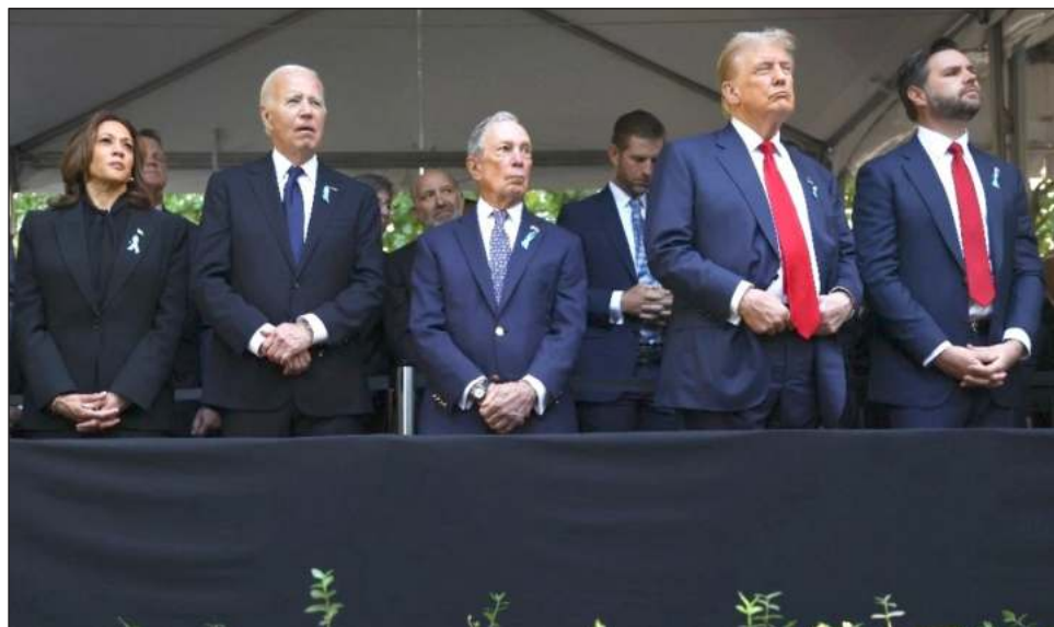
▲ Estados Unidos recordó las vidas perdidas y transformadas por los ataques del 11 de septiembre el miércoles, en un aniversario rodeado por la política de la campaña presidencial.

El 11 de septiembre —la fecha en el que los ataques con dos aviones secuestrados provocaron la muerte de cerca de 3 mil personas en 2001— cae en medio de la temporada electoral cada cuatro años, y esta vez se produce en un momento especialmente agudo. La ceremonia de aniversario en el World Trade Center reunió a Harris y Trump, los nominados demócrata y republi-