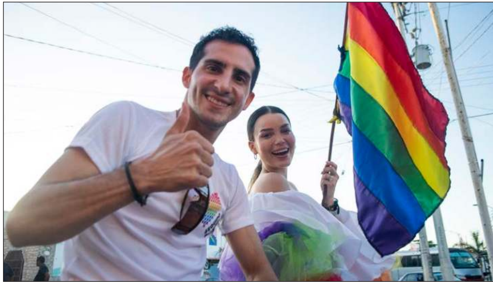
▲ El ex clavadista, que fue diputado federal, será el nuevo titular de la Conade.

Guevara, quien fue medallista de plata en los 400 metros planos de Atenas