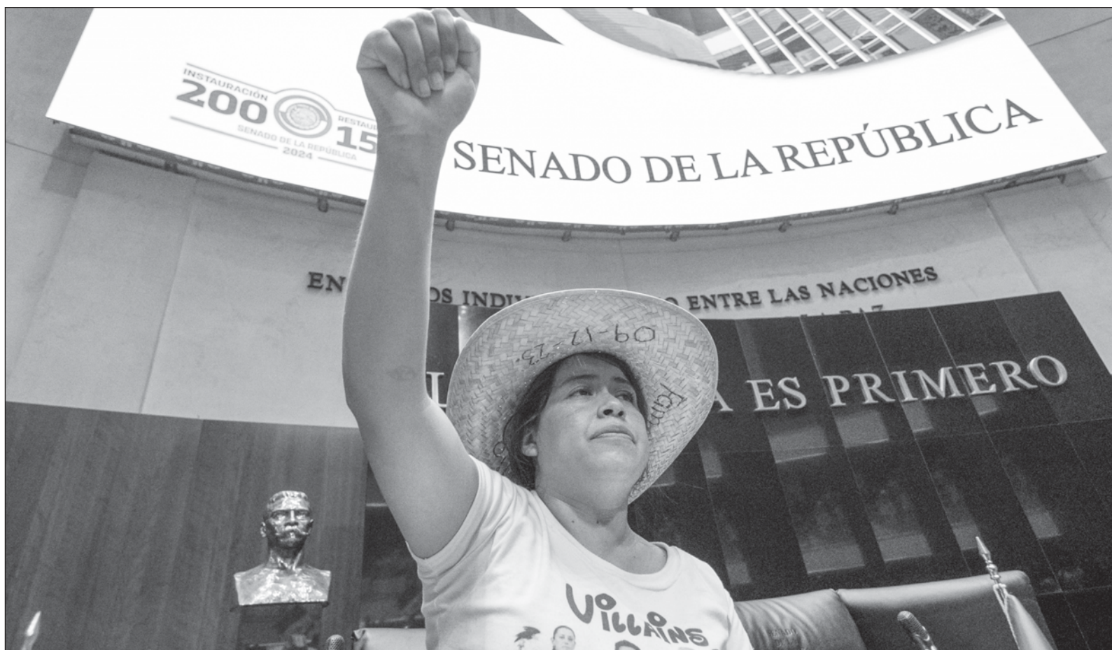
▲ "El problema de la oposición mexicana al gobierno de la 4T comienza por sus dirigencias, Es muy difícil que el PRI de Alito Moreno, el PAN de Marko Cortés y MC de Dante Delgado apuesten a las propuestas y no al choque, , sobre todo cuando la corrupción e ineptitud han sido evidenciadas".