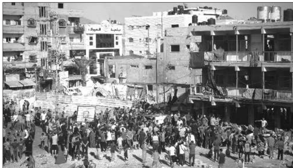
▲ Los ataques de Israel contra la Franja de Gaza han matado a por lo menos 41 mil 84 palestinos y ha dejado heridos a otros 95 mil 29, según el Ministerio de Salud del territorio.

Por lo menos 14 muertos de ese ataque, incluyendo dos menores de edad y una mujer, fueron llevados al Hospital Awda y al Hospital de los Mártires al-Aqsa, dijeron funcionarios de esas dos instalaciones.