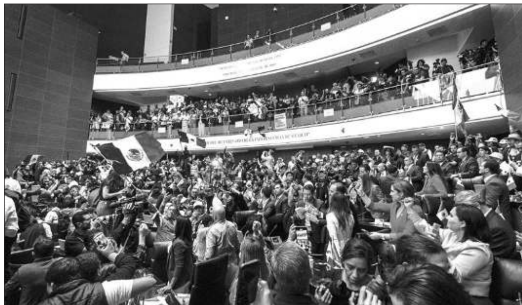
▲ Este será el desafío que quede para estos últimos días de Andrés Manuel López Obrador como presidente, pero también como reto inicial del gobierno de Claudia Sheinbaum Pardo.

Por otro lado, el proceso de reforma ha producido cierto pánico en los mercados de valores y fluctuación en el tipo de cambio del peso frente al dólar estadounidense. Este será el desafío que quede para estos últimos días de Andrés Manuel López Obrador como presidente, pero también como reto inicial del gobierno de Claudia Sheinbaum Pardo; lo realmente interesante será ver si los mercados ceden ante gestiones políticas y no por el ambiente económico per sé, como enseña la ortodoxia.