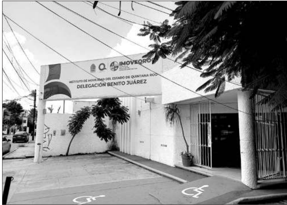
▲ Los inconformes y autoridades del Imoveqroo acordaron reunirse hoy para abordar temas que, de acuerdo a los conductores, “limita” su “derecho a tener un negocio”.

“Llegamos a un acuerdo de una cita para hablar del tema del permiso que se está emitiendo y el cual no estábamos enterados, es un permiso para circular para plataformas digitales y nos está limitando; sólo puedes