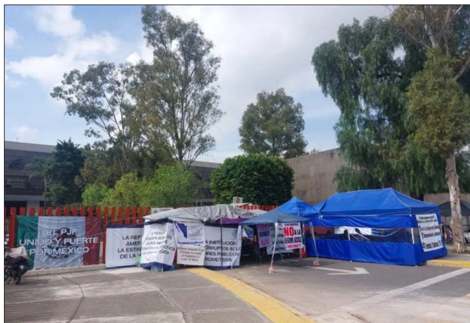
▲ Muchos manifestantes están retirándose del plantón del Senado para trasladarse al de San Lázaro; podrían tomar “medidas legales”, pero cuando concluya el trámite.

Como se informó antes, comerciantes y vecinos de la colonia 10 de Mayo, aledaña a la Cámara de Diputados, exigieron que se levante ya el plantón que realizan trabajadores del PJF desde