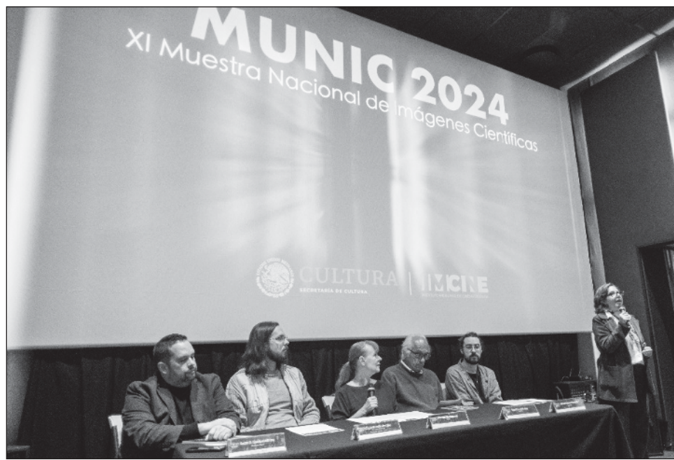
▲ La undécima Muestra Nacional de Imágenes Científicas (Munic) se desarrollará del 18 al 22 de septiembre en las salas del CCU y otros 11 centros y espacios públicos.

En la presentación del festival en las instalaciones del Instituto Mexicano de Cinematografía (Imine), Eisenman informó que la programación