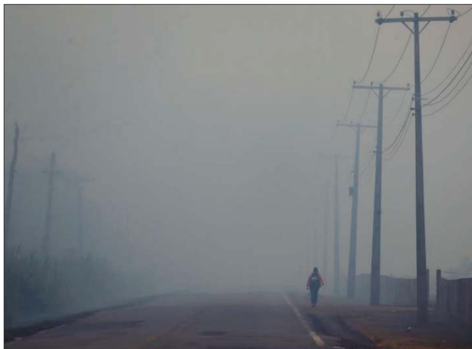
▲ Un permiso para el tramo más largo fue emitido bajo la presidencia del predecesor de Lula, Jair Bolsonaro, un derechista que debilitó las protecciones ambientales.

“Estamos al tanto de que, cuando el río era navegable