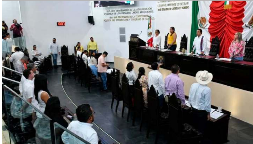
▲ "Muy pronto" todos los congresos locales avalarán las modificaciones constitucionales, afirma el dirigente nacional morenista Mario Delgado.

Delgado aseguró que "muy pronto" todos los congresos locales avalarán las modificaciones constitucionales, porque Morena obtuvo -en las elecciones del 2 de junio- la mayoría en 27 congresos locales.