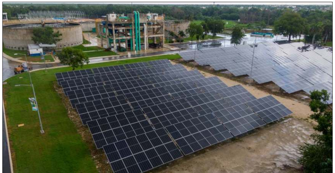
▲ La Planta de Tratamiento de Aguas Residuales Norponiente II en el municipio de Benito Juárez es única en la península, pues toda su maquinaria tecnológica es 100 por ciento sostenible con el medio ambiente.

Además, con esta nueva Planta de Tratamiento de Aguas Residuales se mejoran la calidad de vida de más de 250 mil habitantes de Benito Juárez, siendo