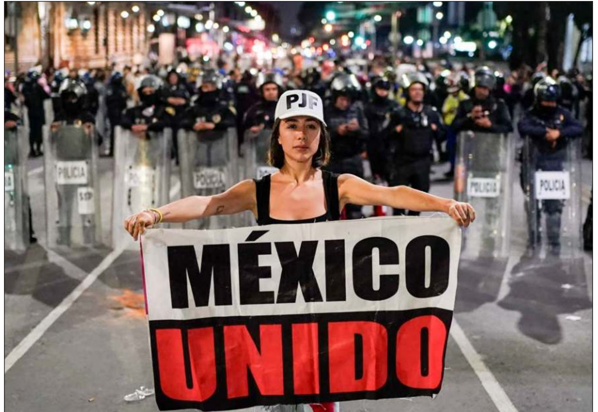
▲ "El punto de confluencia de los afanes opositores es conservar, tal cual han sido expuestas durante décadas, las determinaciones del Judicial. Saben que ello los auxilia de manera definitiva en conservar y prolongar sus intereses".

El campo en que se dirime el resultado es nada menos que el nuevo Congreso de la Unión. Ahí, una mayoría de legisladores, con un mandato popular masivo y consciente llega armado con su modelo justiciero. Enfrenta a una oposición, minoritaria, de corte clasista, con su ya tradicional, y casi derrotado, modelo acumulador. Se trata de dirimir quién ha de prevalecer en este duro enfrentamiento fi-