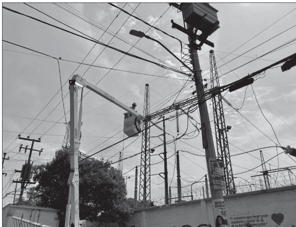
▲ La empresa estatal señaló que en junio de este año, se presentó mayor demanda de energía respecto a la observada en el quinto mes de 2024.

Destacó que este aumento de temperatura, conocido como onda de calor, provocó picos imprevistos