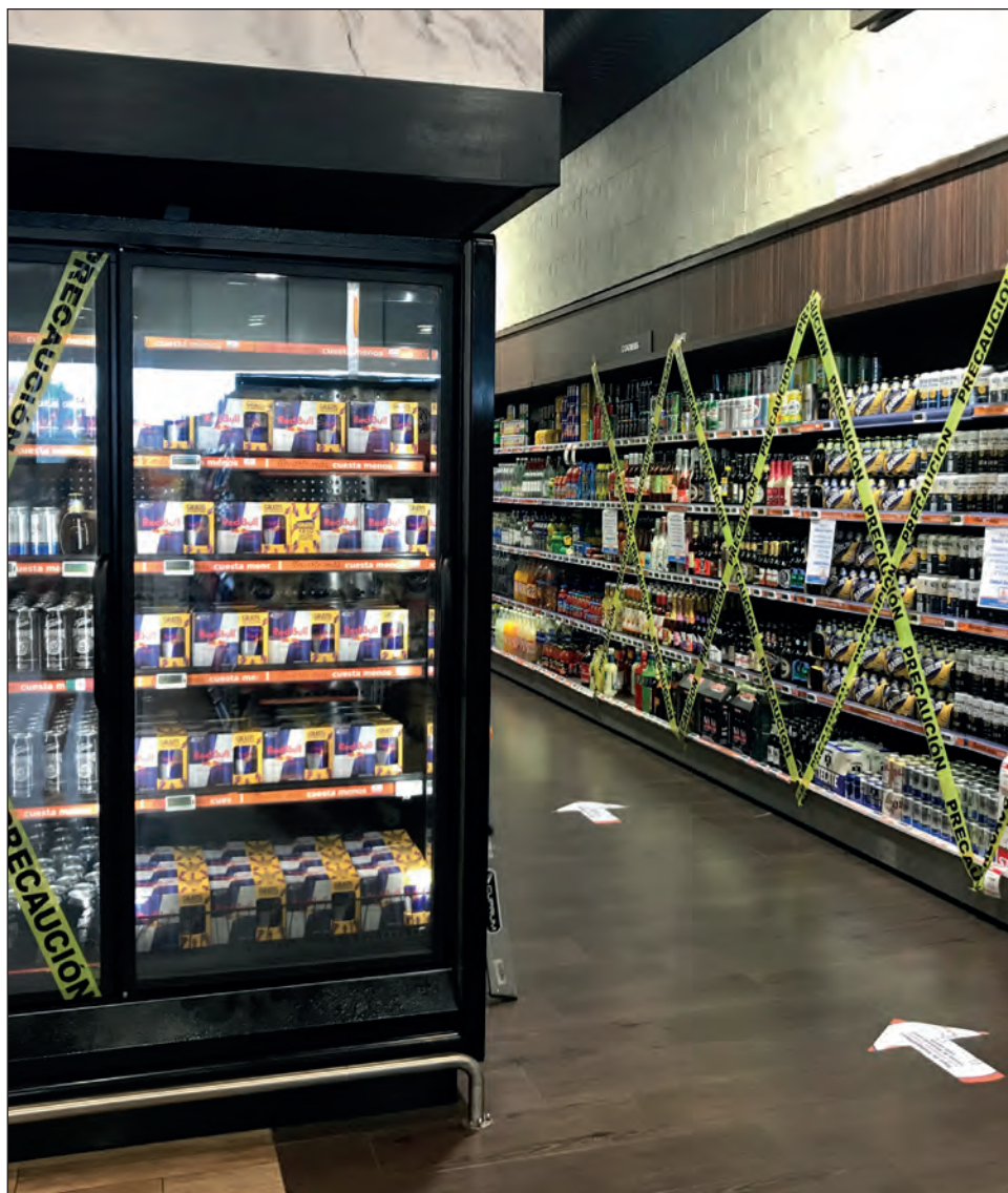
▲ La disposición estatal incluye la venta de bebidas alcohólicas en bares y restaurantes, así como en tiendas y supermercados.

El Gobierno del estado reitera que todas las sociedades en el mundo tenemos el enorme reto de continuar luchando contra la propagación del nuevo coronavirus.