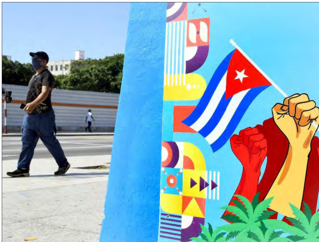
▲ En los últimos días se dispararon los contagios de COVID-19 en la isla de Cuba.

El último brote de coronavirus en la ciudad de Dalian comenzó a finales de julio, siendo el primer caso un trabajador en una empresa de procesamiento de marisco. Al día 9 de agosto, Dalian ha registrado un total de 92 casos.