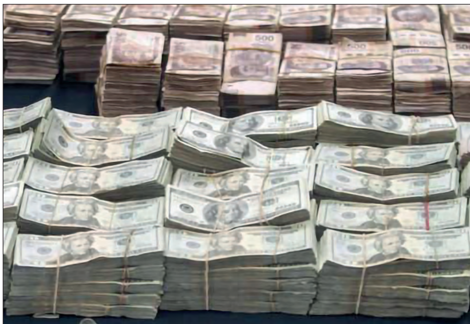
▲ La filial en México de la Corporación de Aceptación Mundial entregó cuatro millones de dólares a líderes sindicales y funcionarios durante los sexenios de Felipe Calderón y Enrique Peña Nieto, aseguró el presidente López Obrador.

Subrayó que se va a sancionar a WAC México. "Todo. Cero corrupción y cero impunidad. Vamos a limpiar y se está limpiando, y ese va a ser el legado, pero con la participación de toda la gente, de todo el pueblo que está harto de la corrupción. Eso que se coreaba: el pueblo se cansa de tanta pinche transa".