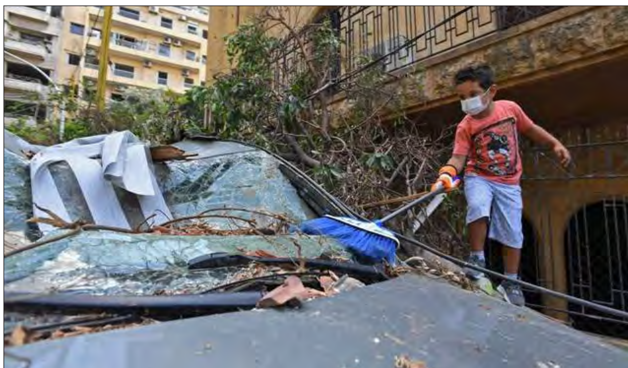
▲ La enorme explosión que destruyó hace una semana el puerto y varios barrios de Beirut ha causado al menos 171 muertos y más de 6 mil heridos, según un nuevo balance del ministerio de Salud divulgado este martes.

El balance precedente elevaba el número de fallecidos a 160. La deflagración en el puerto de Beirut fue provocada por un incendio en un almacén que contenía 2 mil 750 toneladas de nitrato de amonio.