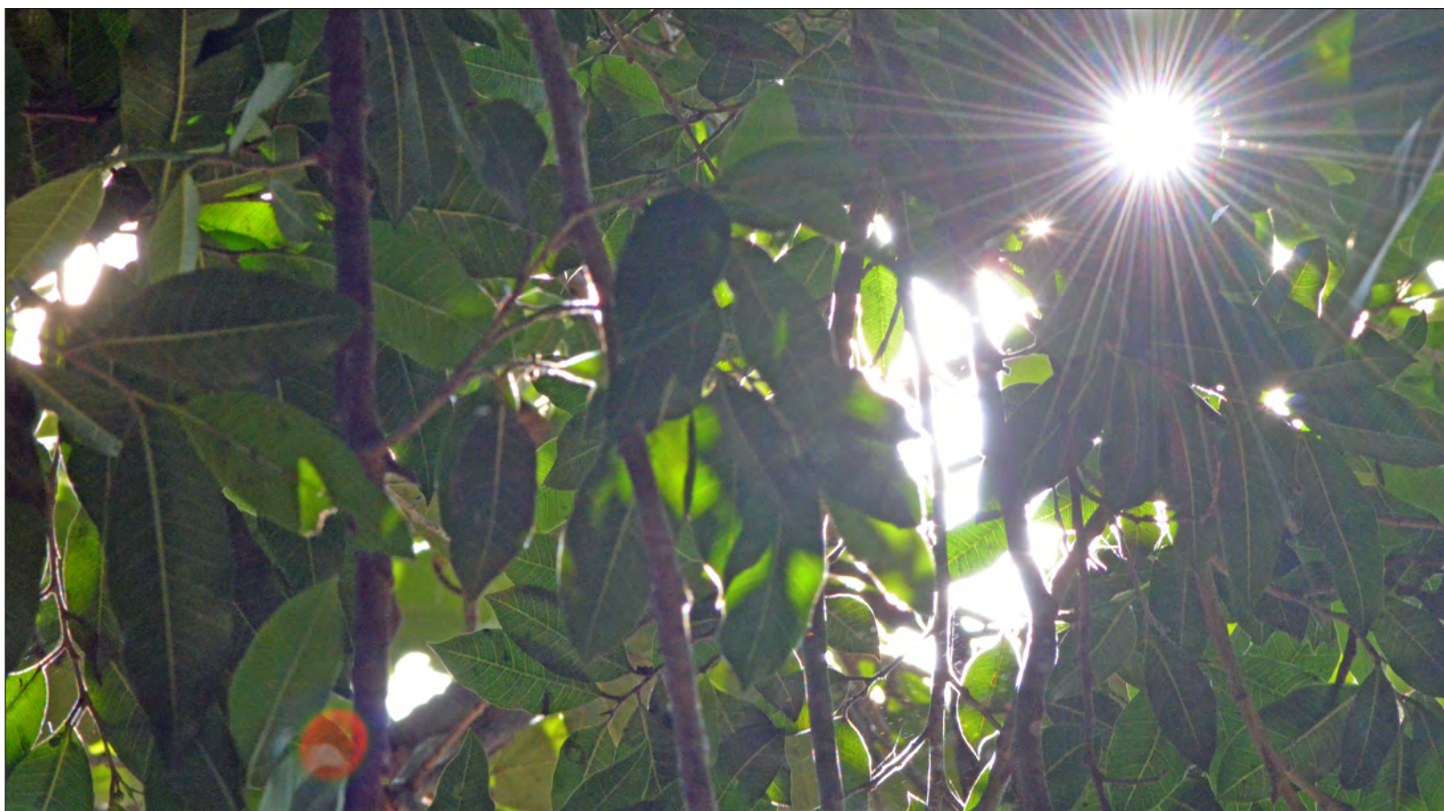
▲ La luz y el dióxido de carbono son indispensables para que las plantas realicen el proceso llamado fotosíntesis.

El primer hallazgo de RIPE, publicado en Science , ayudó a las plantas a adaptarse a las cambiantes condiciones de luz para aumentar los rendimientos hasta en 20 por ciento. El segundo avance del proyecto, también aparecido en esa revista, creó un atajo sobre cómo las plantas lidian con una falla en la fotosíntesis para aumentar la productividad entre 20 y 40 por ciento.