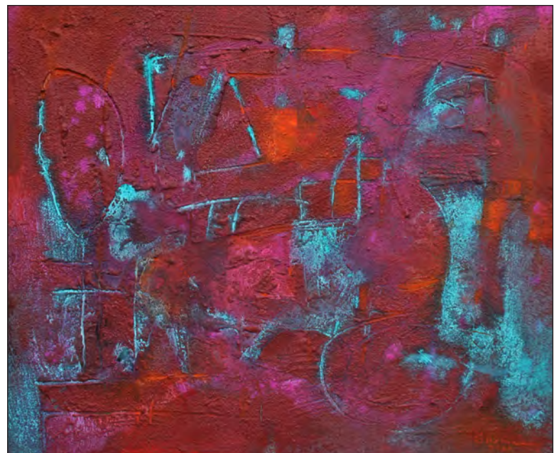
▲ Soliloquio proyecta un encierro de sí mismo, donde el ensimismado habla de sí para sí. Obras de Ariel Guzmán

Así, entre la luminosidad del escenario del monólogo y la oscuridad del aislamiento del soliloquio, Ariel Guzmán ha creado dos imágenes que denotan diálogo, ya sea