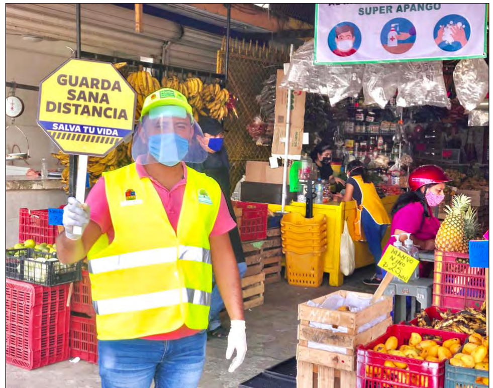
▲ Los jóvenes que participan en el programa Enlaces de Participación Social fomentan la concientización sobre la pandemia y los riesgos de la enfermedad.

El programa de Enlaces de Participación Social se efectúa desde hace dos meses en el municipio de Benito Juárez, desde hace unas semanas en los municipios de Othón P. Blanco, Cozumel e Isla Mujeres y está en el proceso inicial en Tulum; se ha demostrado que el uso de cubrebocas y distanciamiento social se ha incrementado en 30 puntos porcentuales y en las zonas de alto riesgo de contagio, en donde se han concen-