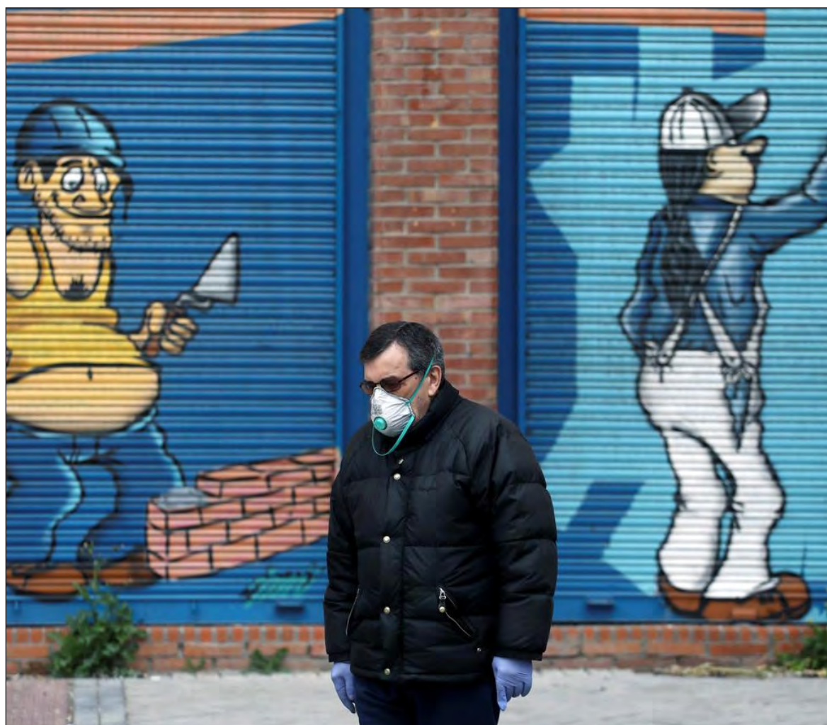
▲ This year has seen COVID-19 and its short term massive economic and social impact as well as longer term implications for our economies and societies.

IN THE EIGHTIES we went from the "we" generation to the "me" generation, inspired by commercialism. We also came together with We Are The World, the birth of CNN and 24/7 news coverage (soon emulated by other global cable news networks), the assassination of Anwar Sadat, SOLIDARNOCZ, Pope John Paul II, the death of Mao, the USSR in Afghanistan, AIDS, the Iran-Iraq war, and civil wars in Lebanon and Central America.