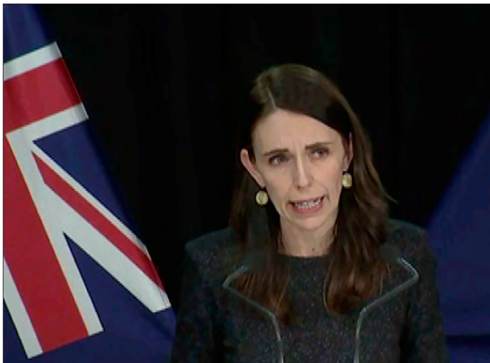
▲ El país documentó 22 muertes en una población de 5 millones de habitantes y no había registrado transmisiones locales desde el 1º de mayo.

Auckland estará confinada por al menos tres días y se reimpondrán algunas medidas de distancia física en el resto del país.