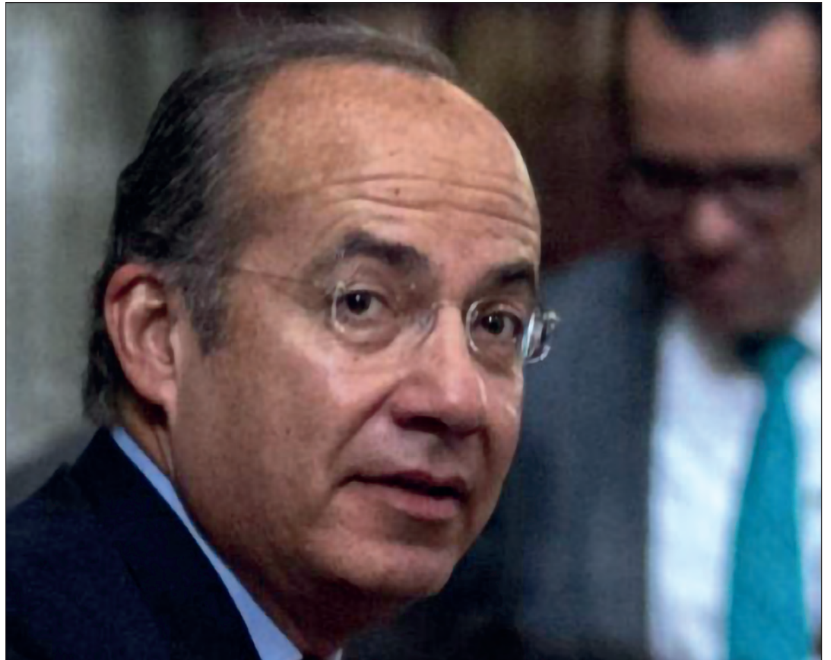
▲ Felipe Calderón trató de diluir en el foxismo su responsabilidad en el diseño de planes energéticos fallidos o corruptos.

PERO CALDERÓN HINOJOSA sí reacciona colocándose la casaca militar de talla no apropiada, al responder, incluso con fanfarronería, no sólo a las filtraciones sobre eventuales cargos en su contra (Etileno XXI y los astilleros gallegos, entre otros temas calientes) sino incluso a la realidad documentada y en proceso judicial