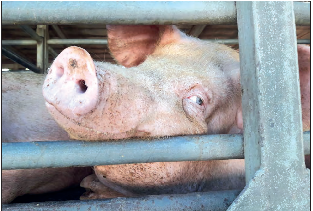
▲ En el reporte El Enemigo del Planeta, Igualdad Animal documentó las condiciones en que viven los cerdos en dos granjas porcícolas de Jalisco.