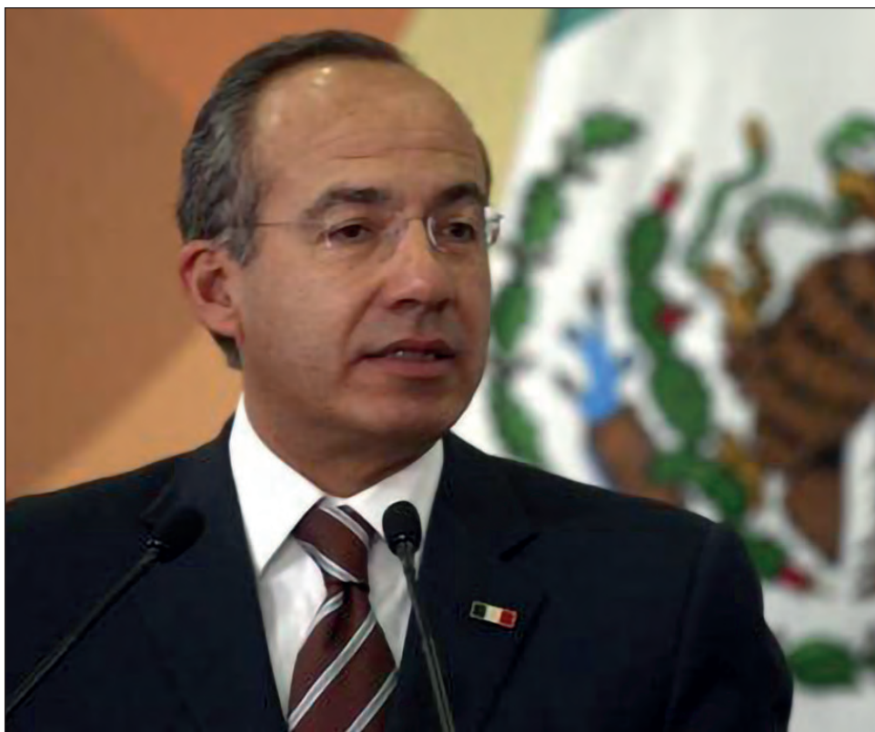
▲ El ex mandatario Felipe Calderón sostuvo que los señalamientos del presidente Andrés Manuel López Obrador obedecen al proceso electoral de 2021.

Esto es de cara al proceso electoral de 2021 y la organización México Libre recoge una gran inconformidad entre la ciudadanía, vamos a quitar la mayoría al partido del Presidente, esto le preocupa y hace lo posible por calumniar, dijo para luego rechazar que busque ser diputado.