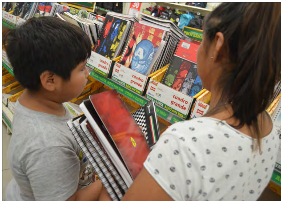
▲ Algunos padres de familia fueron comprando poco a poco, y aprovechando ofertas, lápices, plumas y cuadernos.

Algunos padres de familia expusieron que la "nueva normalidad" tiene sus ventajas, ya que al haber concluido las actividades presenciales a la mitad del ciclo escolar anterior y que éste inicie de forma virtual, momentáneamente ahorrarán en mochilas, uniformes y zapatos escolares.