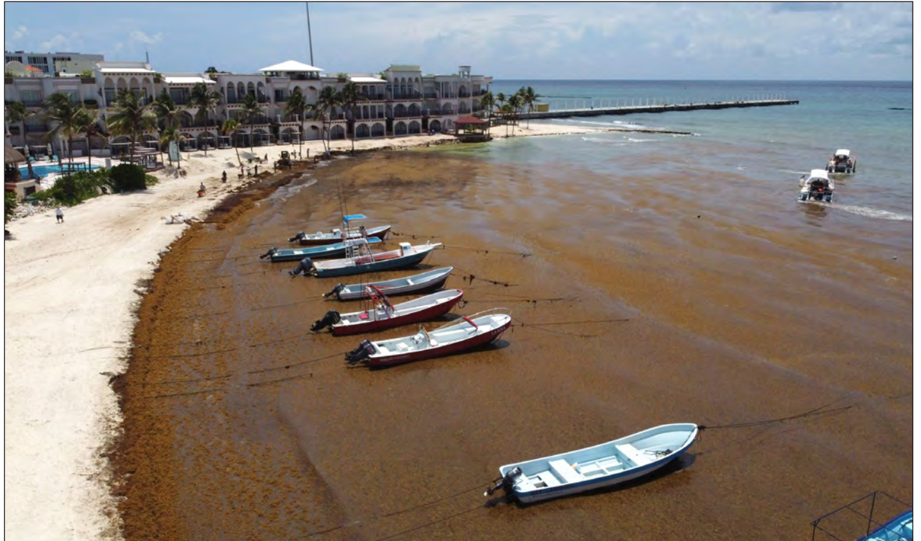
▲ Un centro biólogo químico de Morelia ha sido el asesor del movimiento Biomaya, instruyéndolos en cómo eliminar los metales pesados y dejar las partes buenas de la talofita.

El movimiento igualará el concepto cíclico que los mayas tenían del mundo