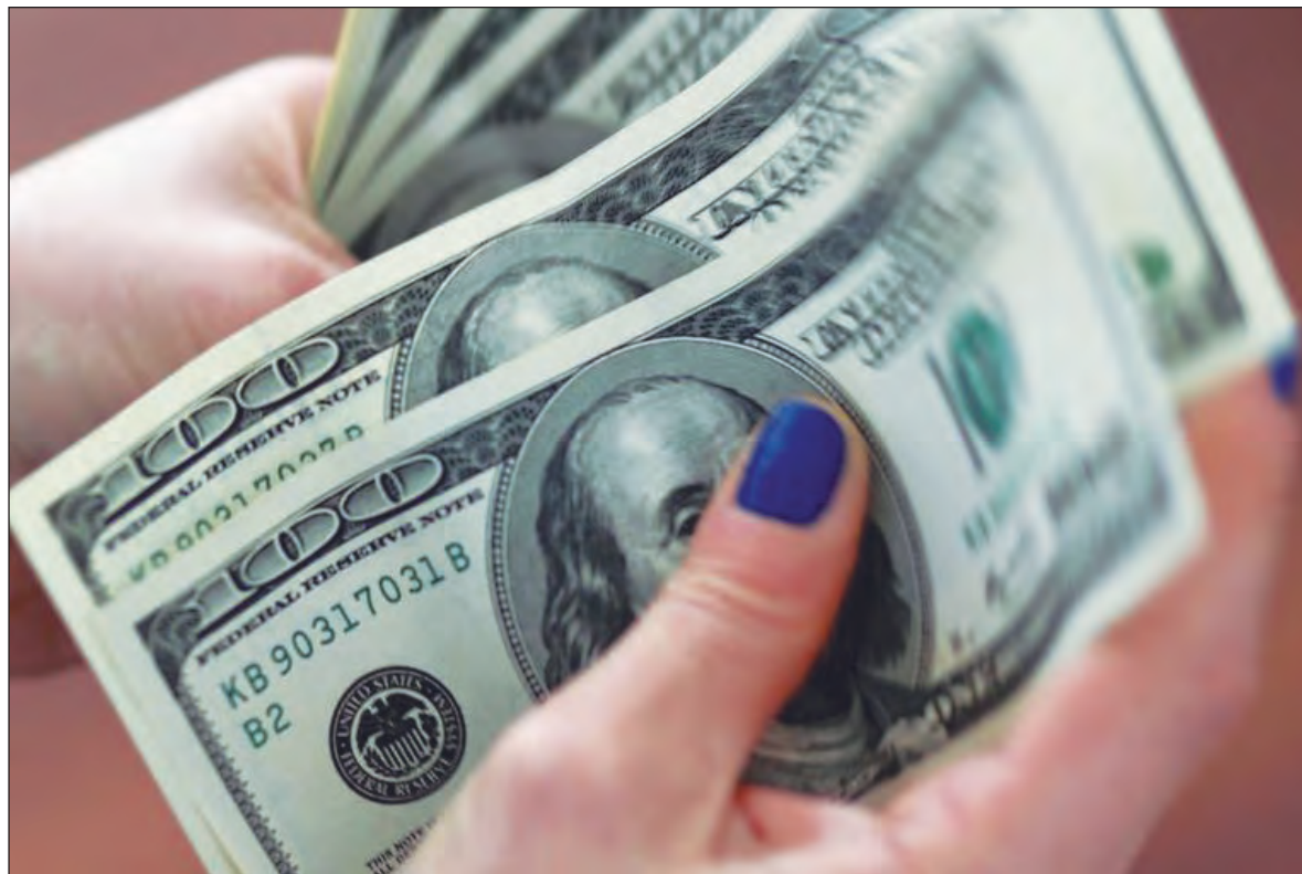
▲ Las nuevas normas contables han llevado a los bancos a aumentar las provisiones, particularmente en Estados Unidos, donde ahora prevén pérdidas basadas en las últimas perspectivas económicas.

CUANDO ESCUCHAMOS HISTORIAS como la que sigue es inevitable admitir que el código moral del Consejo Coordinador Empresarial vale menos que