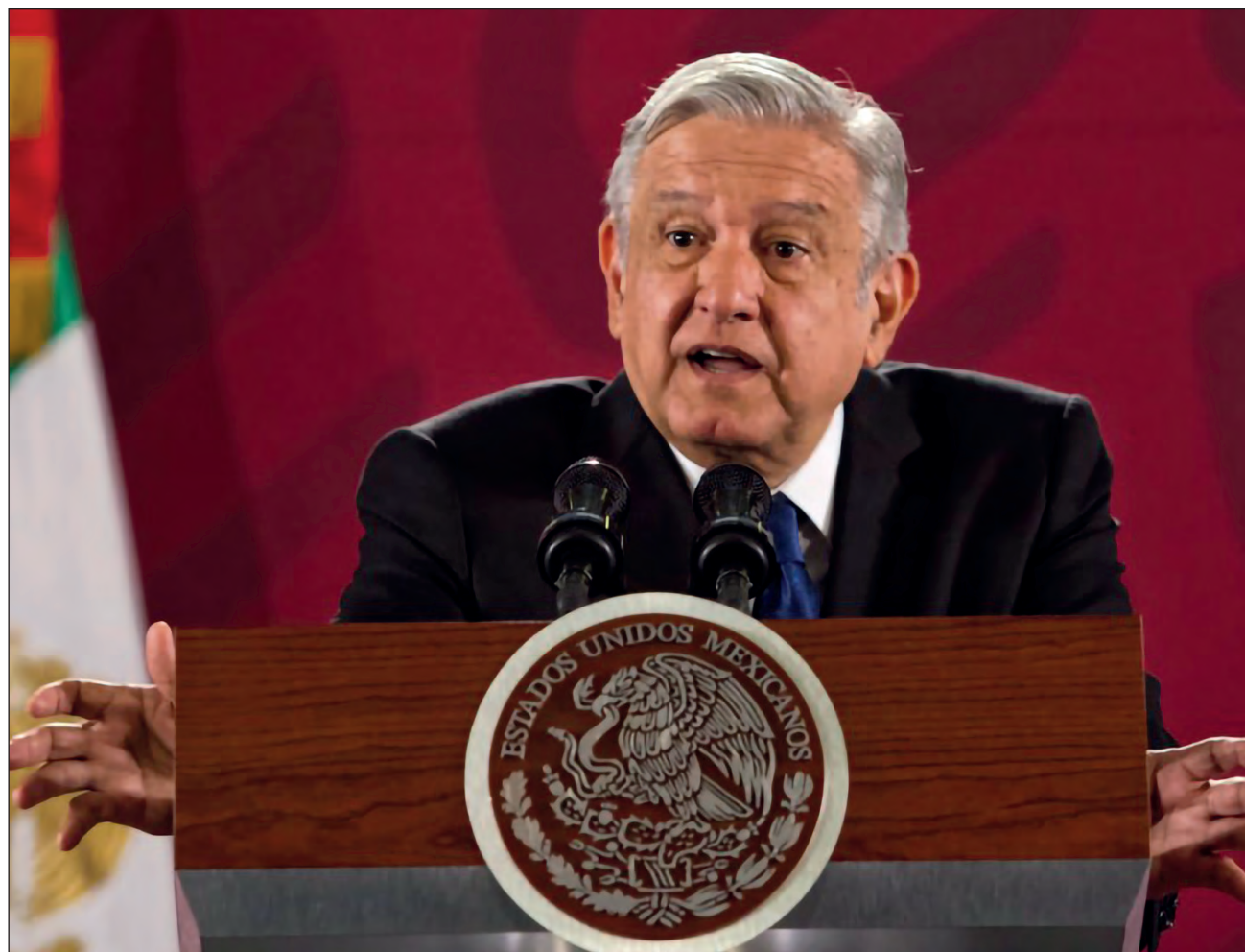
▲ En el sexenio de Felipe Calderón, la autoridad estaba al servicio del narco , apuntó López Obrador durante la conferencia matutina, en Palacio Nacional.

Durante la conferencia matutina, López Obrador retomó sus señalamientos sobre lo que consideró que era un narco Estado en el sexenio de Calderón: “Ayer se enojó el presidente Calderón conmigo. ¿Yo qué culpa tengo?, no es conmigo, es con el juez de Estados Unidos; García Luna fue su secretario de Seguridad Pública, y todos los que están siendo señalados, Palomino, Pequeño, hasta los premiaba”.