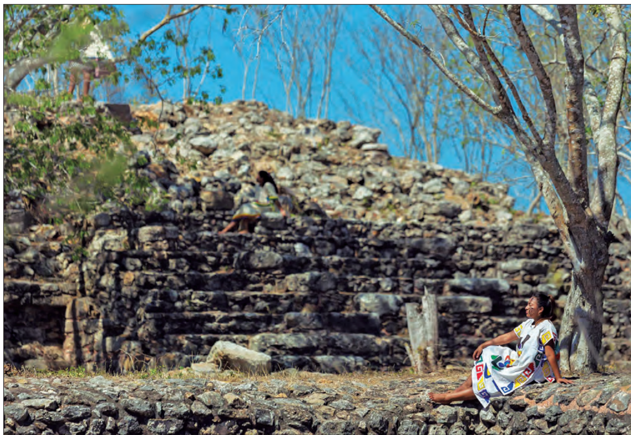
▲ El personal para custodiar los sitios arqueológicos es insuficiente para garantizar la protección del patrimonio cultural. En la imagen, zona arqueológica de Chaltún Ha en Izamal, Yucatán.