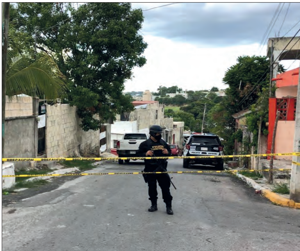
▲ Ciudad del Carmen, Campeche y Calkiní son los municipios con más denuncias por clandestinaje.

Asimismo, han habido 13 clausuras preventivas más en la ciudad a negocios que no han respetado la sana distancia y que no figuran en establecimientos de nivel esencial. Estas no conllevan sanción o multa, pero Rodríguez Adam hizo énfasis en que deben operar de la mejor manera posible, poner los filtros sanitarios a las puertas de los comercios y estar al pendiente de las alertas en el Semáforo Nacional de Reactivación, en el que Campeche se mantiene en color naranja.