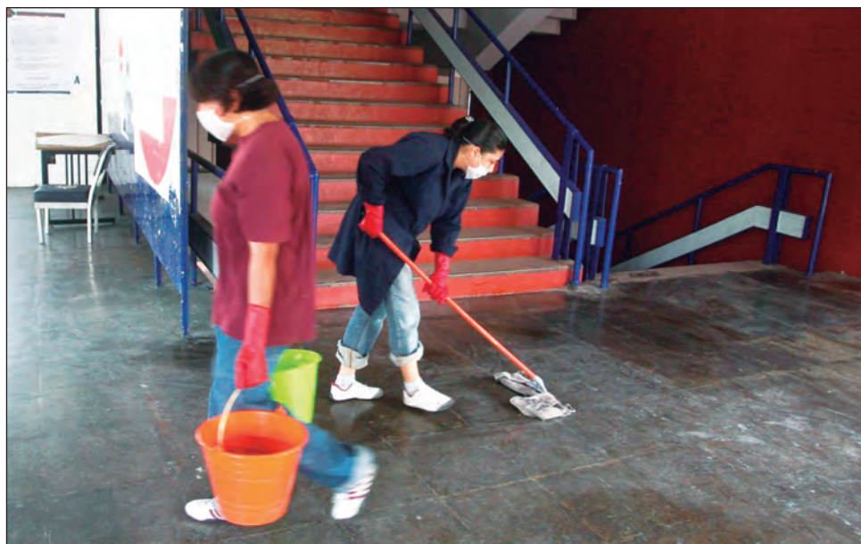
▲ Docentes e intendentes participaron en la limpieza de escuelas preescolares, primarias y secundarias, según dio a conocer la Segey.

Aseguró que muchos trabajadores se reportaron con la dirigencia porque los han convocado, pese a que son personas vulnerables. Dijo que hay gente que, aparen-