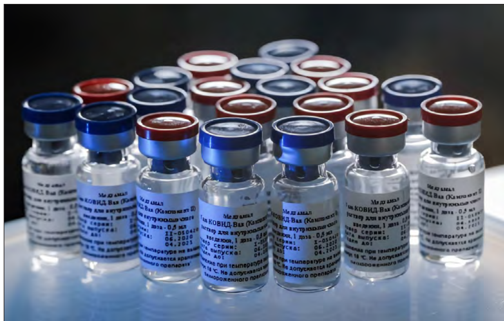
▲ La vacuna Sputnik V es un instrumento más valioso que el dinero o las armas para demostrar dónde está el futuro de la humanidad.

El 4 de octubre de 1957 ocurrió el famoso “momento Sputnik”; la Unión Soviética puso en órbita el primer satélite artificial, dando con ello inicio a la carrera espacial, tomando por sorpresa a Estados Unidos y Europa. La victoria ideológica e internacional del momento era avasalladora para la fenecida URSS.