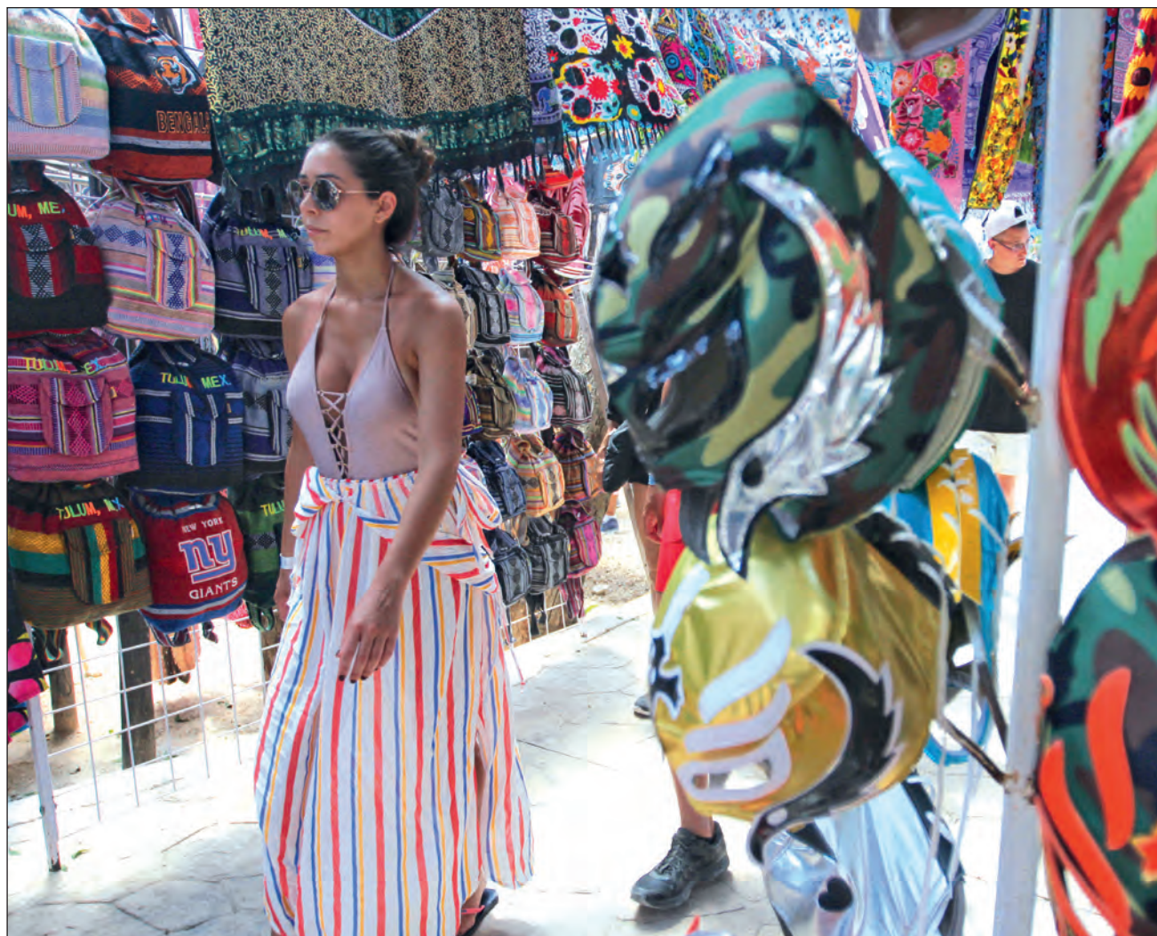
▲ El convenio de colaboración para la integración de la región Mundo Maya contempla unir esfuerzos para el desarrollo y consolidación de productos. En la imagen, comercio en la zona arqueológica de Tulum.

La intención de esta importante alianza es impulsar la grandeza del territorio donde se extendió la civilización maya