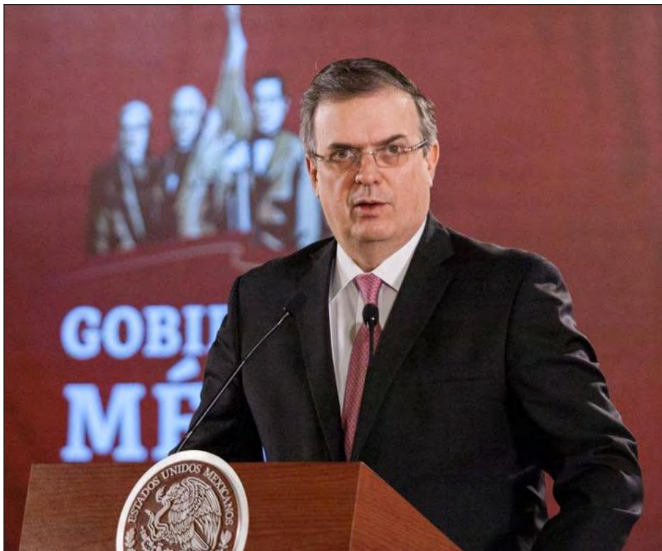
▲ Los nuevos memorandos de entendimiento son con Janssen Pharmaceuticals, CanSino Biologics y Walvax Biotechnology, anunció Marcelo Ebrard.

Dijo que la epidemia continúa, pero con avance lento, ya que el nivel de crecimiento se ha ubicado en 0.8 por ciento a nivel nacional, sin embargo, reconoció que el porcentaje de crecimiento de muertes es aún del uno por ciento con respecto a la semana anterior.