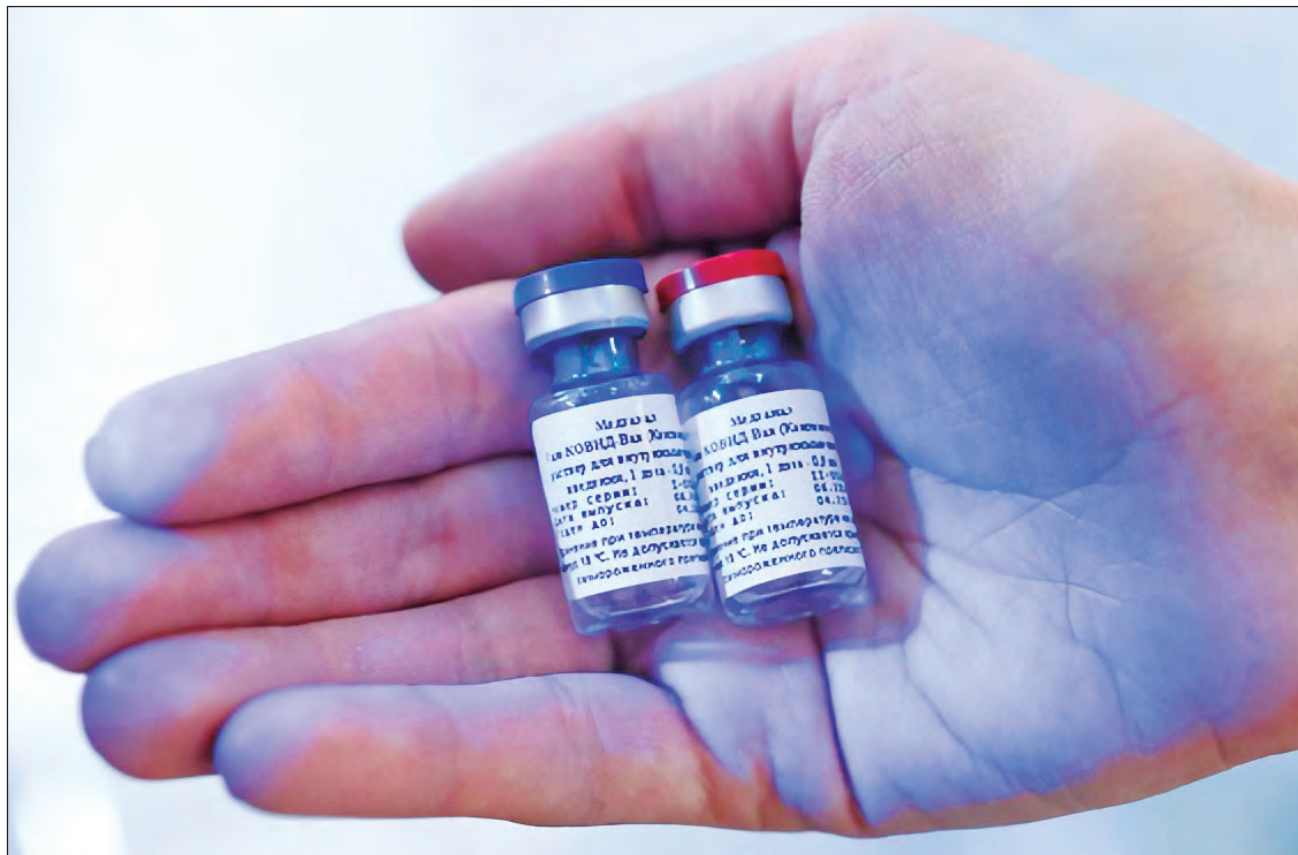
▲ El Instituto Gamalei, financiado por el Fondo Ruso de Inversión Directa, estima que puede producir 200 millones de dosis al año.

La Organización Mundial de la Salud modera la euforia y considera que la eficacia de esta vacuna rusa, que no figuraba entre las seis que hace poco mencionó como más avanzadas, aún debe ser revisada, por lo cual sugiere hablar más bien de una preclasificación y recuerda que, para homologar una vacuna, tiene que pasar “procedimientos rigurosos”.