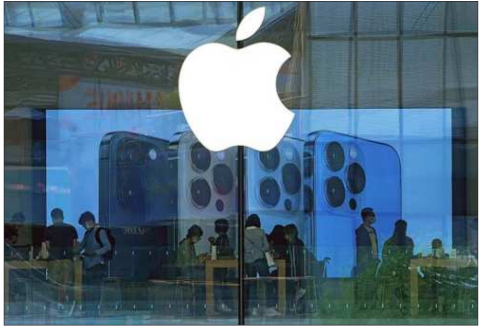
▲ La demanda original se presentó en marzo de 2024 y 15 estados, así como el Distrito de Columbia se unieron a la demanda en ese momento, ahora se suman cuatro más.

Los funcionarios también dijeron que Apple impone cargos ocultos a varios socios comerciales, desde desarrolladores de software a compañías de tarjetas de crédito e incluso rivales como Google de Alphabet GOOGL.O.