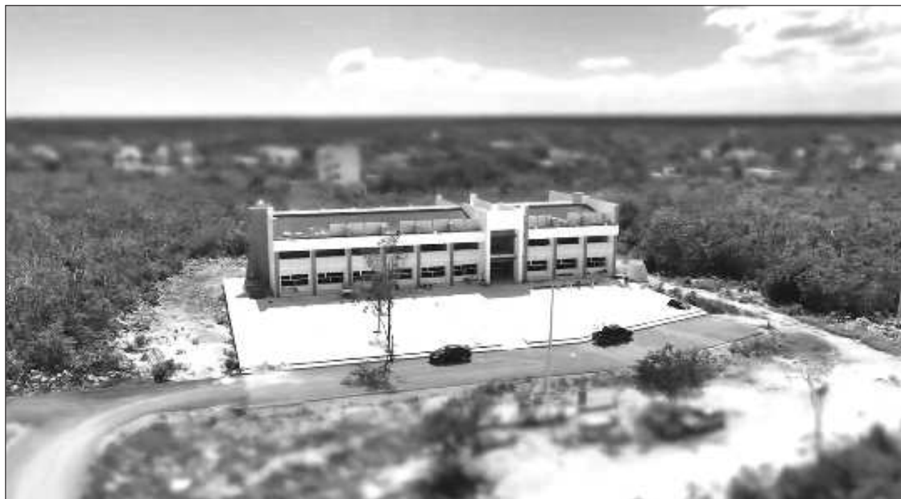
▲ El nuevo plantel educativo consta de 12 salones para poder atender los turnos matutino y vespertino. Tiene auditorio, laboratorios de cómputo e idiomas y una cocina; además, ya cuenta con el mobiliario y equipamiento correspondiente de todas las áreas.

El encargado de la Rectoría indicó que actualmente cuentan con una matrícula de 120 alumnos y están esperando recibir en el nuevo ciclo escolar 120 más, pero podrían recibir más estudiantes debido a que Tulum es un municipio con mucho crecimiento demográfico y por ende auguró que el crecimiento