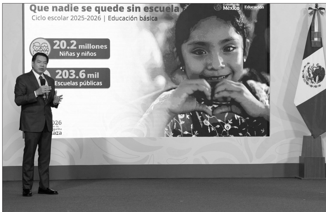
▲ Según Mario Delgado, esta decisión privilegia el derecho superior de las niñas a una educación integral.

El gobierno también acordó que ante circunstancias extraordinarias o condiciones particulares de las entidades federativas, de conformidad con el artículo 87 de la Ley General de Educación, podrán ajustarse al calendario escolar.