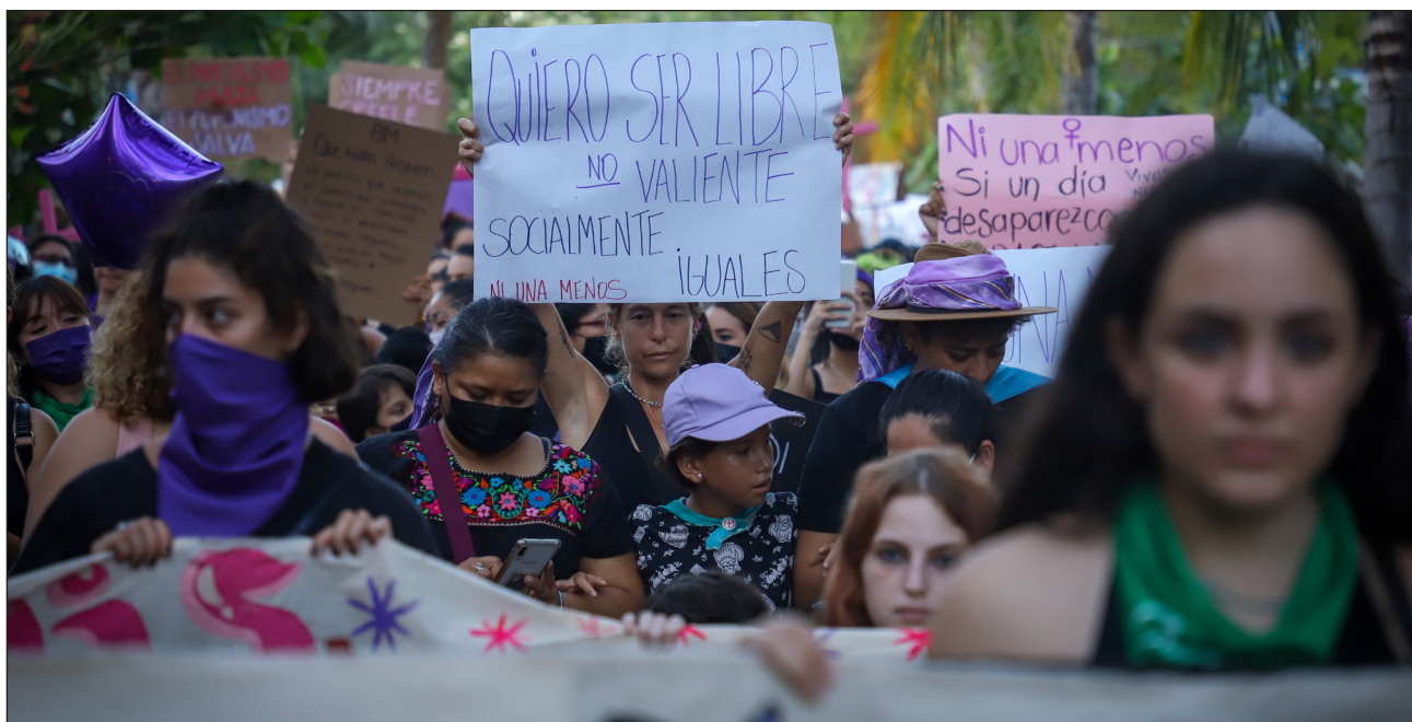
▲ Yucatán es una de las 27 entidades que aprobó la reforma para emitir una ley general a fin de prevenir, investigar y sancionar el delito de feminicidio, con la cual se podrá establecer un protocolo y sanciones únicas para todo el país.