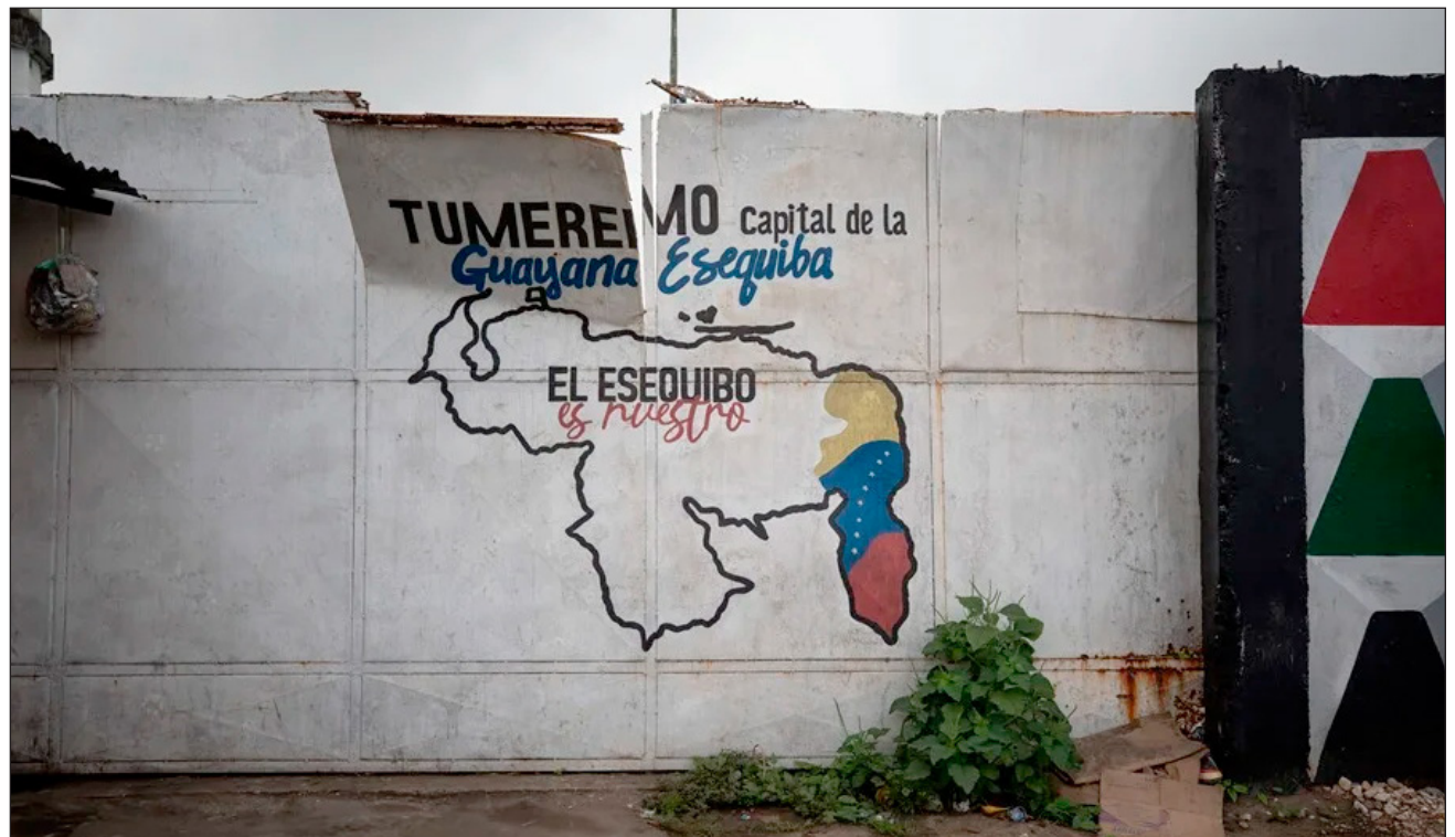
▲ Venezuela reclama el territorio de El Esequibo, que abarca unos 160 mil kilómetros cuadrados.

La alta funcionaria aseguró que Venezuela desea “resolver la controversia territorial sobre la Guayana Esequiba mediante la negociación política, pacífica”. Se trata del primer viaje de