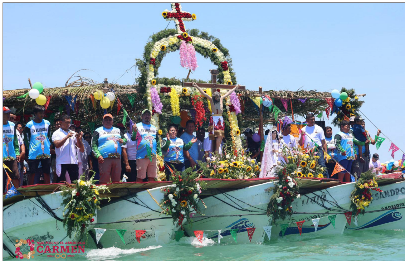
▲ La imagen fue subida a una estructura armada por cinco embarcaciones ribereñas con motor fuera de borda de los pescadores de la localidad, y así cruzar los dos puentes posteriormente.

Al paseo se sumaron hombres del mar y sus familias, con los barcos adornados