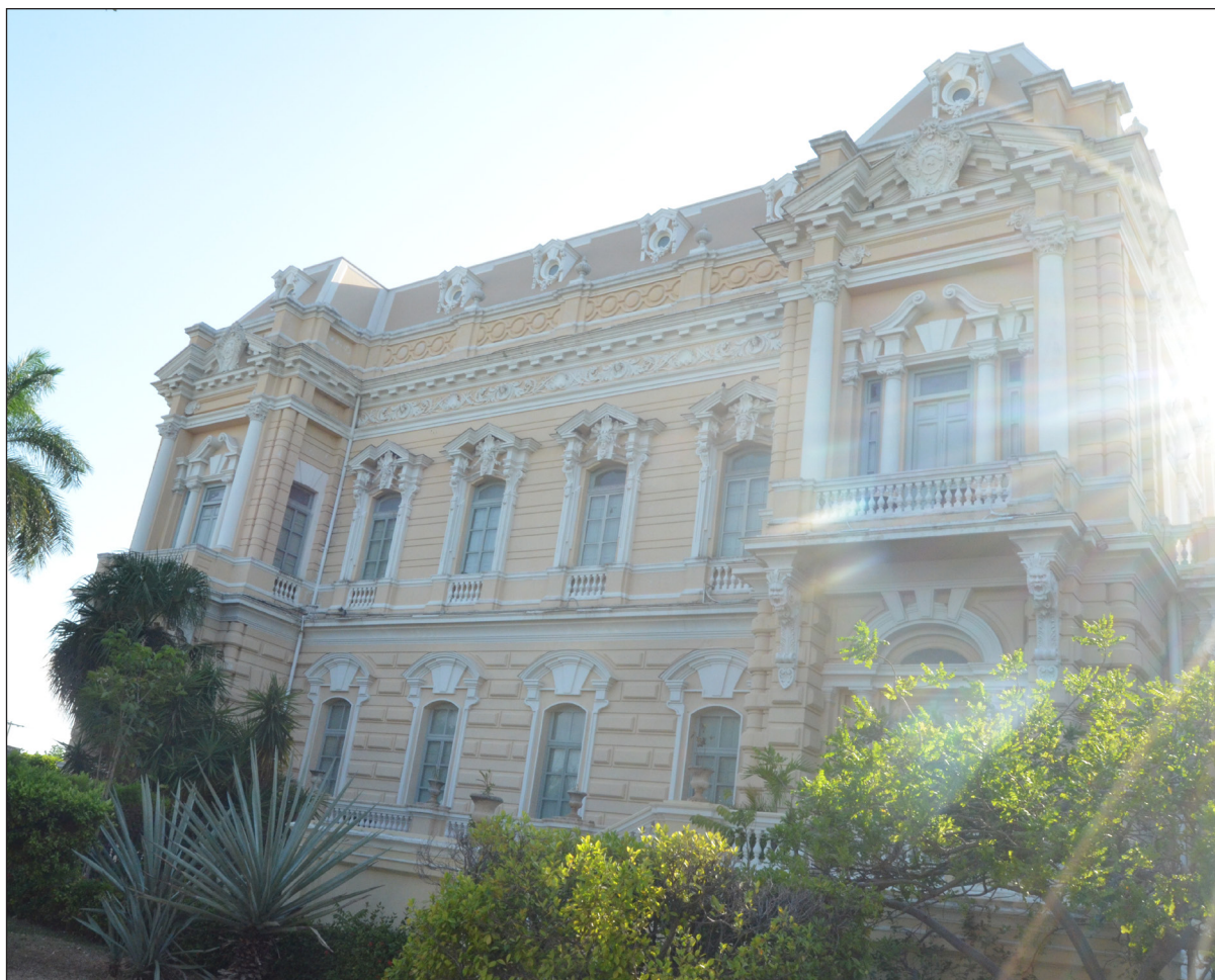
▲ "No sólo construir o intervenir, sino cuidar, interpretar y transmitir. Es una forma de arquitectura que exige sensibilidad, responsabilidad y compromiso, pero que también ofrece una enorme riqueza en términos de aprendizaje y significado".