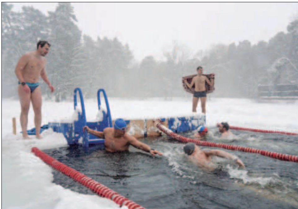
▲ Este descubrimiento podría ayudar a desentrañar cómo se perciben y sufren las bajas temperaturas en invierno, y por qué algunas personas experimentan el frío de forma diferente.

Para comprobarlo, los investigadores pusieron a prueba su hipótesis en ratones a los que les faltaba el gen necesario para producir la proteína GluK2.