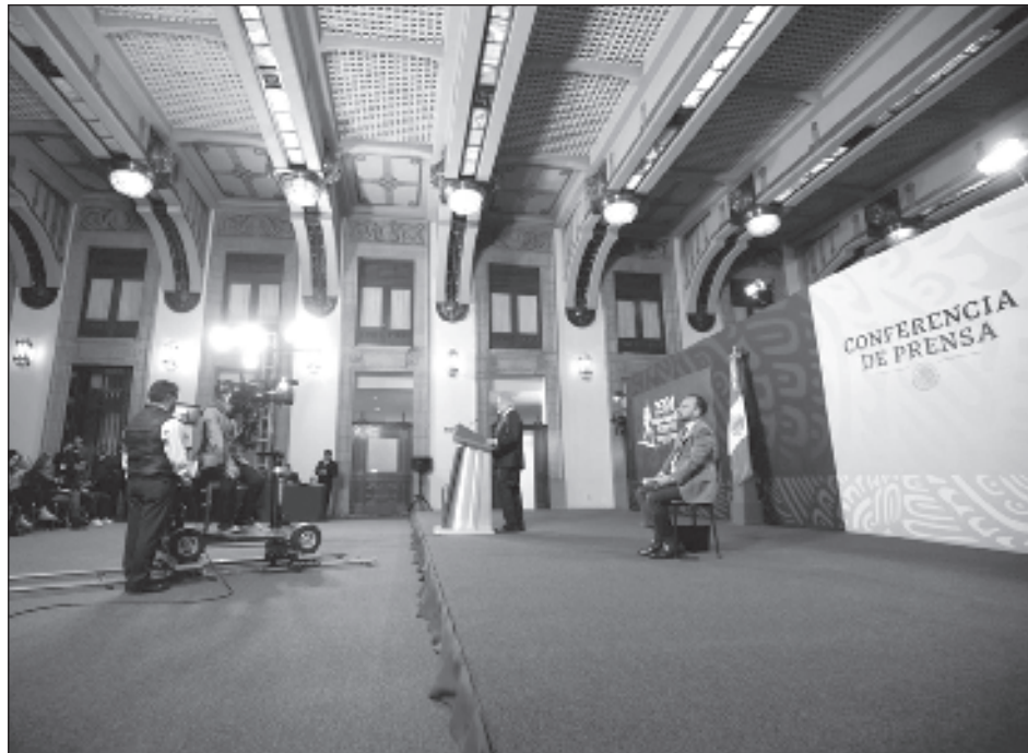
▲ El presidente Andrés Manuel López Obrador demandó a las autoridades electorales que le notifiquen de lo que puede o no expresarse: “ya casi no quieren que hable de nada”.

“Acaban de traer a una señora, de una asociación que hay en México, diputada española, le dieron una gran difusión los conservadores, vino a hablar mal de mí. La verdad es un timbre de orgullo, porque esta joven señora pertenece a la ultraderecha”, aseveró el tabasqueño.