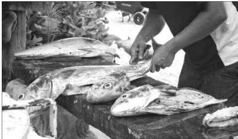
▲ Las especies con más demanda son la tilapia, rubia y boquinete. Actualmente se encuentra en vigor la veda del mero y langosta.

Las especies que más demanda tienen son la tilapia o mojarra, rubia, boquinete y prácticamente todos los productos inventariados muestran movimiento, ya que hay gran variedad de platillos para preparar. Estimó que sus ganancias incrementarán 80 por ciento.