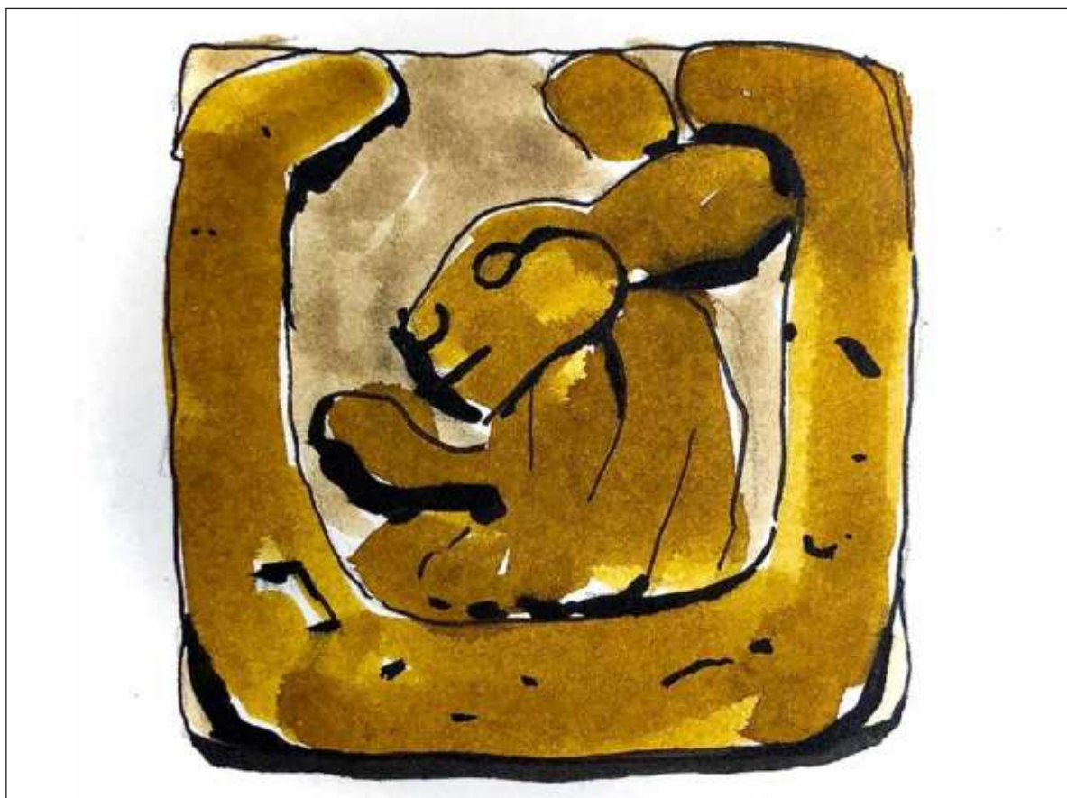
▲ "El conejo, representado en la posición humana de cuclillas, parece sostener algo en su pata derecha, como si estuviera escribiendo. Esto cobra sentido dado que hay varias representaciones en vasijas y códices mayas". Ilustración: Luis Resines @pelopanton

OTRA ESTRUCTURA DESTACADA es La Casa de la Luna, con