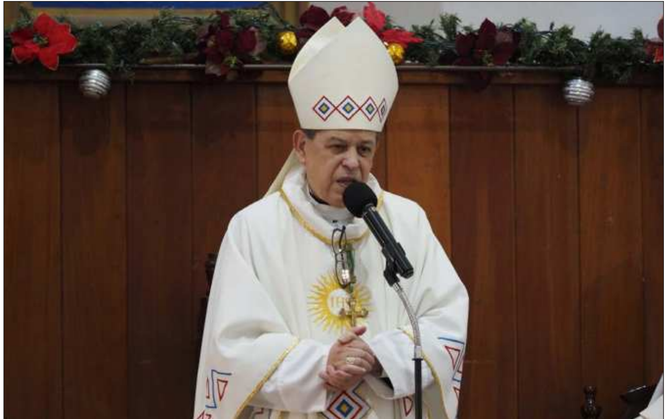
▲ “No hubo más personas afectadas e involucradas (...) pedimos paciencia en lo que respecta a los próximos compromisos del Arzobispo, quien se irá incorporando paulatinamente a sus actividades”, detalló un comunicado.

“No hubo más personas afectadas e involucradas. Por este motivo, pedimos paciencia en lo que respecta a los próximos compromisos del señor Arzobispo, quien se irá incorporando paulatinamente a sus actividades ordinarias”.