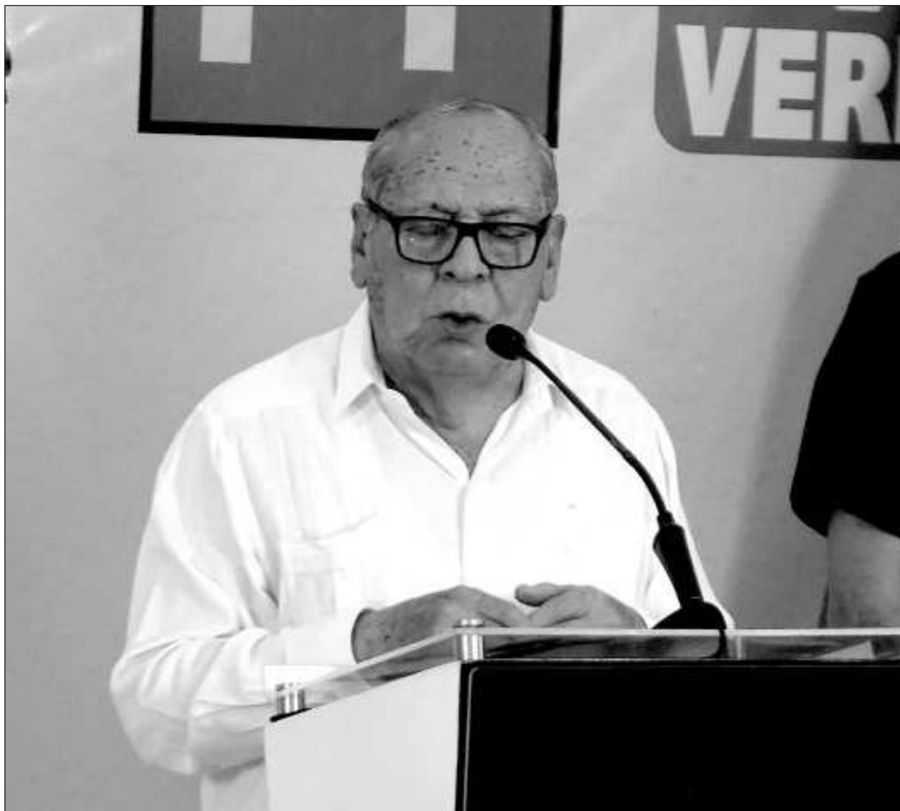
▲ El candidato a senador por la coalición Sigamos Haciendo Historia , destacó que el estado de Campeche es una de las entidades en donde hay mayor índice de esclarecimientos de los delitos que se han cometido.

Dijo que llegará procedente de Yucatán para encabezar reuniones en Calkiní, Campeche y Ciudad del Carmen.