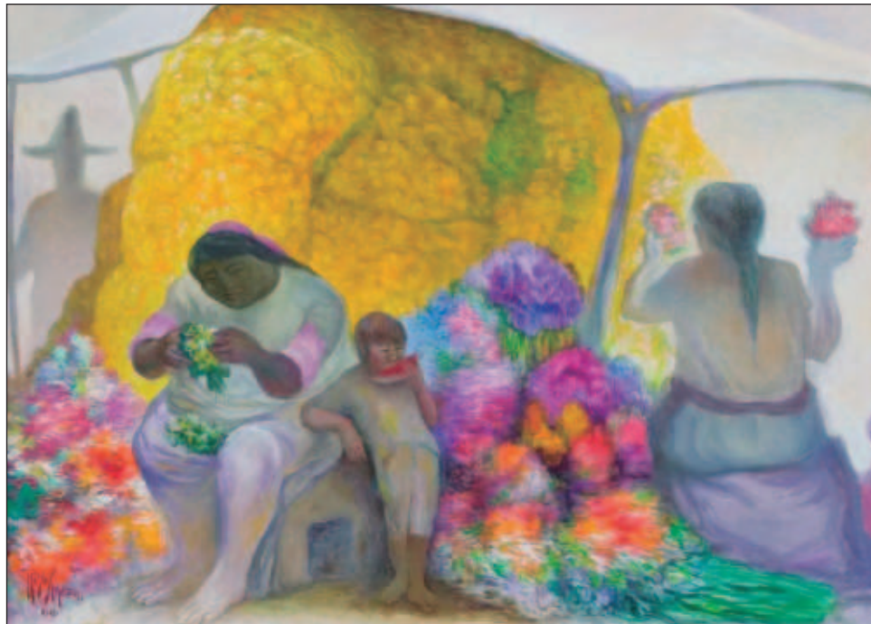
▲ Fue miembro fundador del Salón de la Plástica Mexicana, y desde edad muy temprana exhibió su obra en museos y galerías de México y del extranjero.

En el Instituto Nacional de Bellas Artes y Literatura trabajó de escenógrafo y fue integrante del Consejo Técnico y Artístico de la Danza. En 1957, obtuvo el Premio de la Agrupación de Críticos