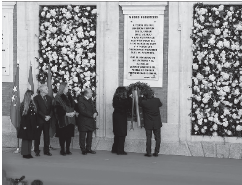
▲ En 2004, 10 bombas explotaron en cuatro trenes en plena hora pico de Madrid.

Los ataques se produjeron tres días antes de unas elecciones generales en las que los españoles derrotaron al conservador Partido Popular, que respaldó la guerra encabezada por Estados Unidos en Irak.