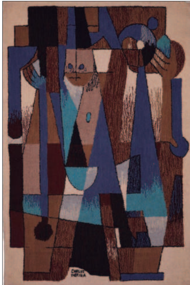
▲ Las obras presentadas abarcan un inmenso espacio geográfico y temporal desde el siglo XIX hasta nuestros días, pensado como un diálogo vivo entre el pasado y el presente.

Cada una de las cuatro secciones de la muestra destacó tendencias relacionadas con el manejo de ese encuentro. En el siglo XIX, cuando se ini-