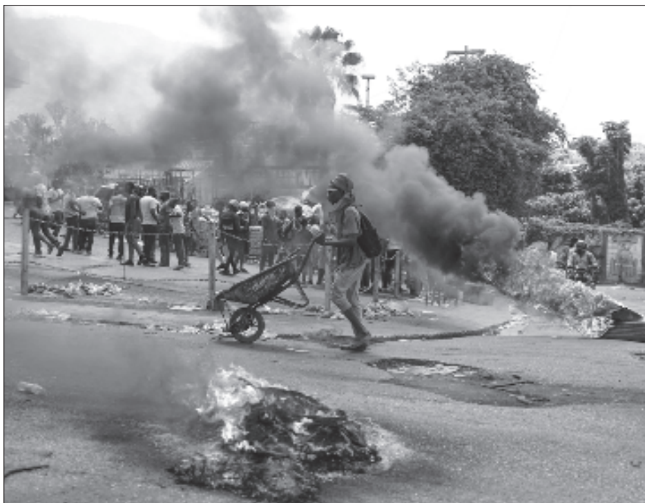
▲ Puerto Príncipe es escenario de enfrentamientos armados entre las fuerzas de seguridad y las pandillas, que atacan lugares estratégicos como las comisarías o las prisiones.

Paralelamente, un buque militar estadounidense partió el sábado desde Estados Unidos con el equipamiento necesario para construir un embarcadero para descargar la ayuda, lo que podría tardar hasta 60 días.