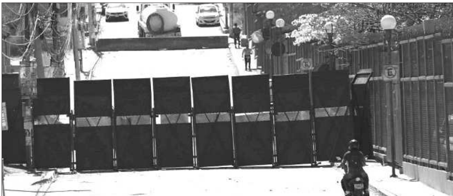
▲ "Gómez Peralta fue asesinado de un tiro en la cabeza, presuntamente por los mismos policías de Guerrero que, según testimonios, habrían alterado la escena del crimen".