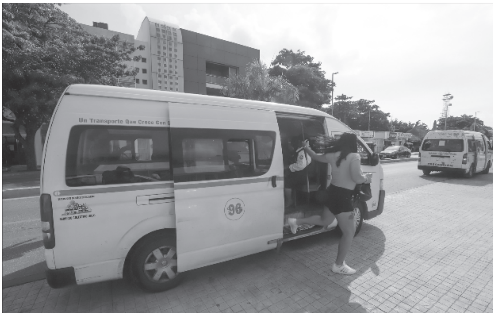
▲ "Hay preguntas obligadas: ¿la organización detrás de la van está cubriendo en tiempo y forma expedita el seguro para las personas afectadas? ¿Cómo respondió la organización del transporte pesado que, de acuerdo con las narraciones, tiene alta responsabilidad en el accidente?".