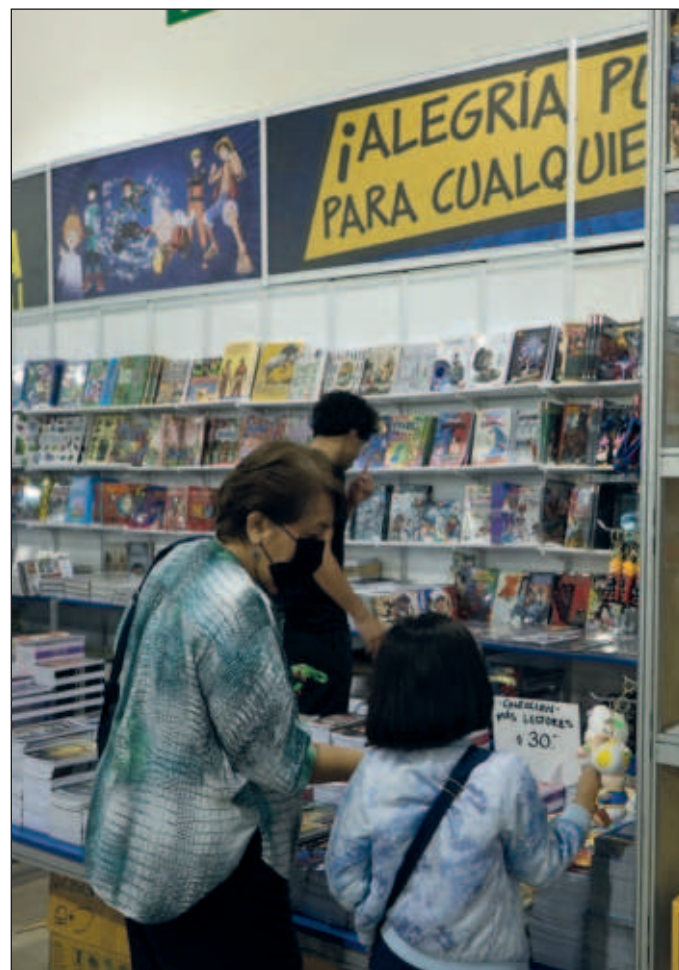
▲ Entre los debates que se dan (...) se puede llegar a una síntesis: los yucatecos han hecho suya la Filey porque el fondo de las actividades es la cultura y su relación con el tejido social.

Entre los debates que se dan durante la Filey -porque más que encuentros académi-