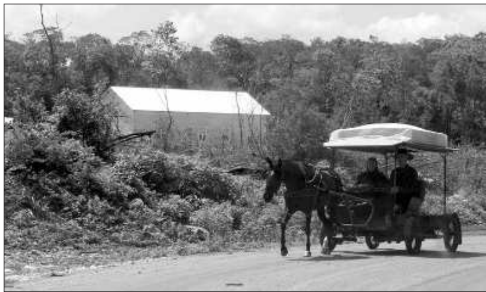
▲ A través de un proceso encausado por ex empleados de organismos agrarios que pudieron acceder a mapas y procesos de desajenación de tierras para comercializar, se dio la venta del ejido.

Destaca que ya hay conocimiento por parte de la Secretaría de Medio Ambiente y Recursos Naturales (Semarnat), Procuraduría Federal de Protección al Ambiente (Profepa), e incluso la Guardia Nacional que acompañará las diligencias de investigación para dar con los responsables, pero llama la atención la presencia de zonas con vesti-