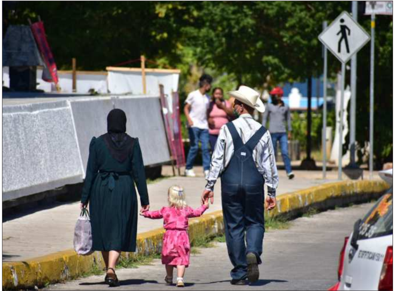
▲ Ichil ba'ax jts'a'ab k'ajóoltbil tumen u múuch'kabil Global Forest Watch, tu ja'abil 2002 tak 2022, k'aschaj tu lu'umil Kaanpeche', kex 6.25 mil ektaareasil k'áax, ts'o'oke' lelo' ku chíikbesik kex 16 por sientoil ti' tuláakal k'áax kuxa'an ka'ach láayli' te'e jaats k'iino'obo'.

Ichil ba'ax a'alab tumen Pérez Ríos, ka'ap'eeel