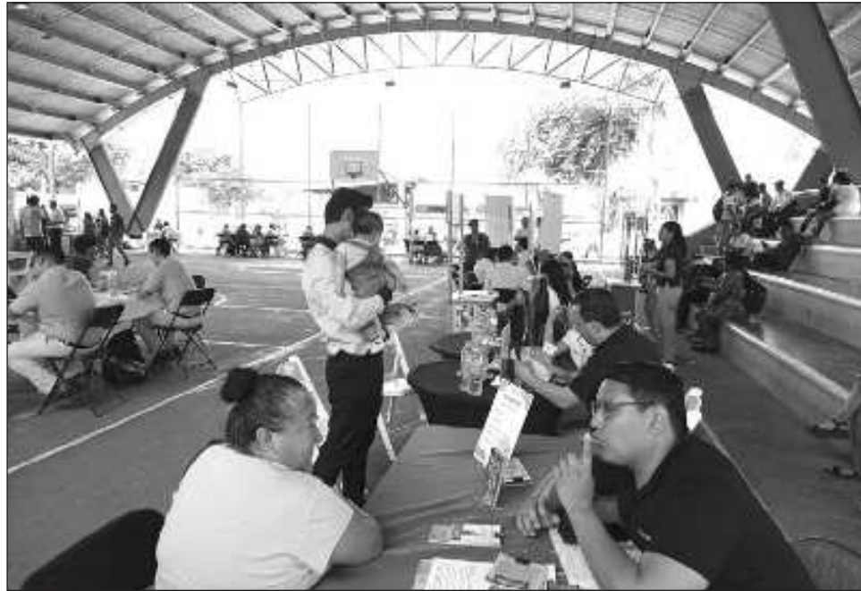
▲ El lunes se llevó a cabo una feria laboral que contó con 32 empresas de diversos sectores y más de 2 mil vacantes, incluyendo puestos para el Tren Maya.

Este lunes 11 de marzo se realizó una feria laboral que contó con 32 empresas de diversos sectores y más