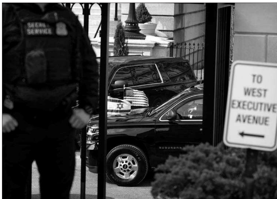
▲ De acuerdo con un comunicado oficial, Netanyahu reiteró las necesidades de seguridad de Israel en el marco de las negociaciones entre Washington y Teherán.

El líder israelí, que visita por sexta vez Estados Unidos en este segundo mandato del republicano, reclama que las negociaciones incluyan también