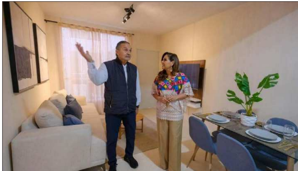
▲ Mara Lezama Espinosa reiteró que en Quintana Roo el programa ya está construyendo 31 mil viviendas con una inversión estimada de 37 mil millones de pesos.

En la conferencia también se realizó un enlace con el gobernador de Sonora, Alfonso Durazo, quien acompañado de la secretaria de Desarrollo