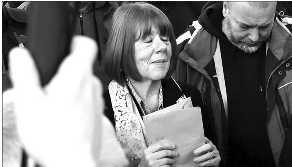
▲ Los extractos de Un himno a la vida. La vergüenza tiene que cambiar de lado publicados el martes por el periódico francés Le Monde , se remontan al día en que el mundo de Gisèle se vino abajo.

Su entonces esposo, Dominique Pelicot, había sido citado por la policía para ser interrogado después de que un guardia de seguridad de un supermercado lo sorprendiera grabando en secreto videos bajo las faldas de mujeres.