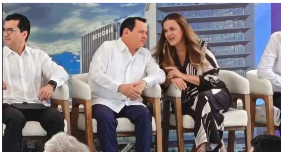
▲ El jefe del Ejecutivo estatal señaló que elegir a la entidad como sede corporativa representa una inversión y una presencia permanente, pero también demuestra confianza en la estabilidad.

“Gracias por confiar en Yucatán como sede de largo