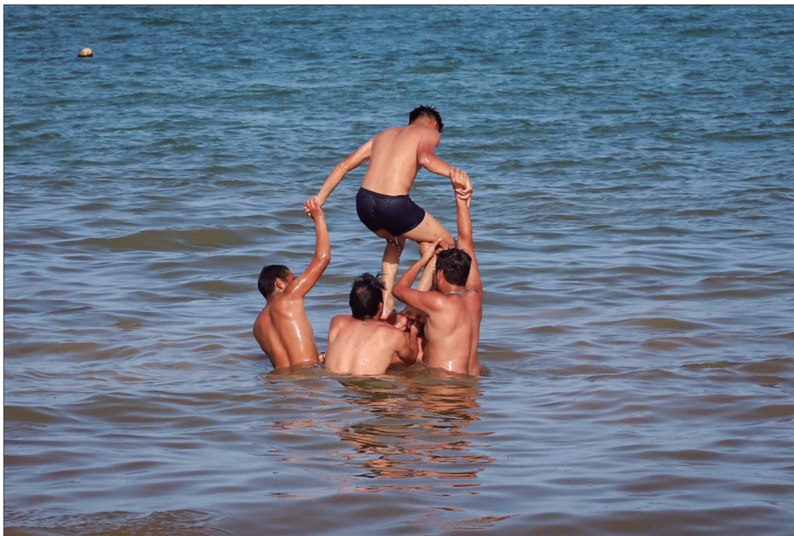
▲ "La amistad ha sido considerada, a lo largo de la historia, una de las experiencias más valiosas de la convivencia humana. No nace de la obligación ni de la costumbre, sino del reconocimiento libre entre personas distintas. Por eso suele percibirse como un vínculo casi sagrado".